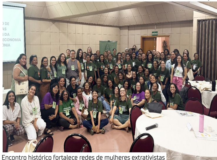
Encontro histórico fortalece redes de mulheres extrativistas

Nos dias 17 e 18 de outubro de 2025, Manaus sediou o Encontro de Lideranças Femininas da Sociobioeconomia na Amazônia, um evento inédito que reuniu cerca de 60 mulheres extrativistas de diferentes regiões do bioma. Durante dois dias intensos, elas participaram de rodas de diálogo, oficinas, debates e atividades culturais.