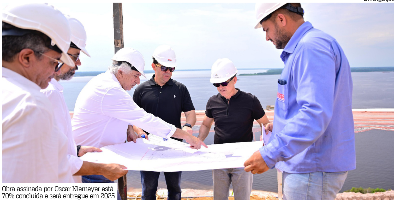
Obra assinada por Oscar Niemeyer está 70% concluída e será entregue em 2025

Águas Rosa Almeida contempla uma ampla infraestrutura voltada ao lazer, turismo e convivência. Além do mirante panorâmico, o projeto inclui restaurante, área gourmet, museu, playground, academia ao ar livre, área pet, estacionamento acessível e o pavilhão cultural conhecido como “Oca Niemeyer”, concebido com base em estudos originais do arquiteto.