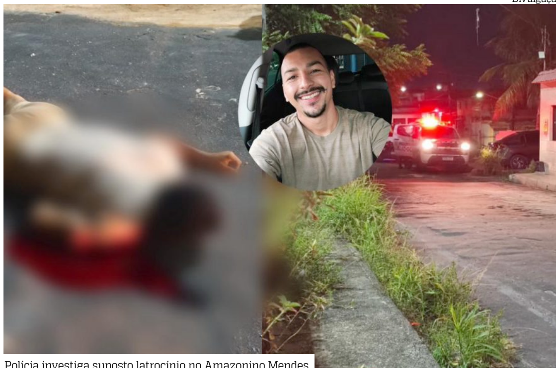
Polícia investiga suposto latrocínio no Amazonino Mendes

Moradores que encontraram o corpo relataram que a vítima trabalhava como motorista de aplicativo. Eles suspeitam que o crime tenha ocorrido durante uma