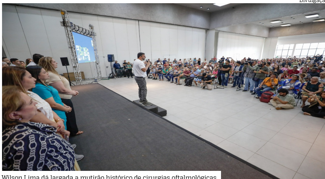
Wilson Lima dá largada a mutirão histórico de cirurgias oftalmológicas

ram no Centro de Convenções Vasco Vasques, onde os pacientes passam por triagem, consulta e exame pré-operatório, antes de seguirem para as unidades em que os procedimentos serão realizados. A ação foi lançada em setembro pelo governador.