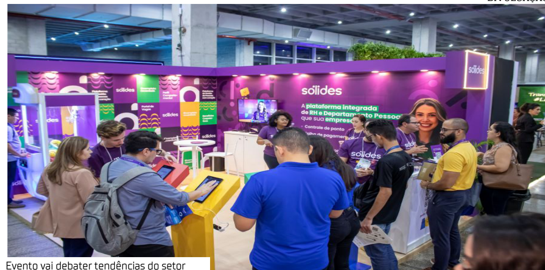
Evento vai debater tendências do setor

Manaus sediará, nos dias 27 e 28 de novembro, a 22ª edição do Congresso Amazônico de Recursos Humanos (CONAMARH). Promovido pela Associação Brasileira de Recursos Humanos Seccional Amazonas (ABRH-AM), o evento acontecerá no Centro de Convenções Vasco Vasques e reunirá líderes empresariais, especialistas e profissionais de RH para discutir estratégias inovadoras, práticas de gestão progressivas e insights valiosos que capacitam os líderes a enfrentarem