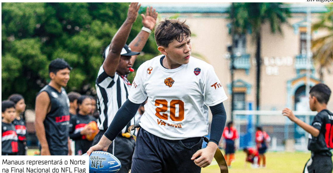
Manaus representará o Norte na Final Nacional do NFL Flag

E o título ficou com o Recanto AEVA, que venceu por 13 a 6 a forte equipe do AEVA Jarlece, em uma partida eletrizante do início ao fim. O destaque ofensivo foi