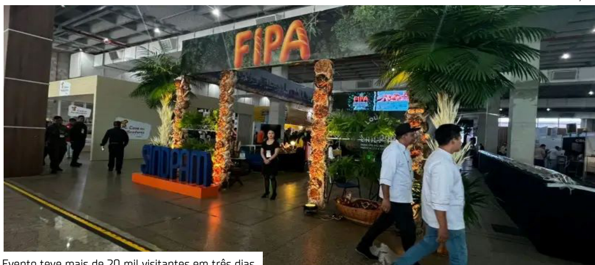
Evento teve mais de 20 mil visitantes em três dias

O deputado Adjuto Afonso (União Brasil), vice-presidente da Assembleia Legislativa do Amazonas (Aleam), destacou, na tribuna do plenário Ruy Araújo, os resultados da primeira edição da Feira Internacional de Panificação da Amazônia (Fipa), realizada de 16 a 18 de outubro, no Centro de Convenções Vasco Vasques, em Manaus.