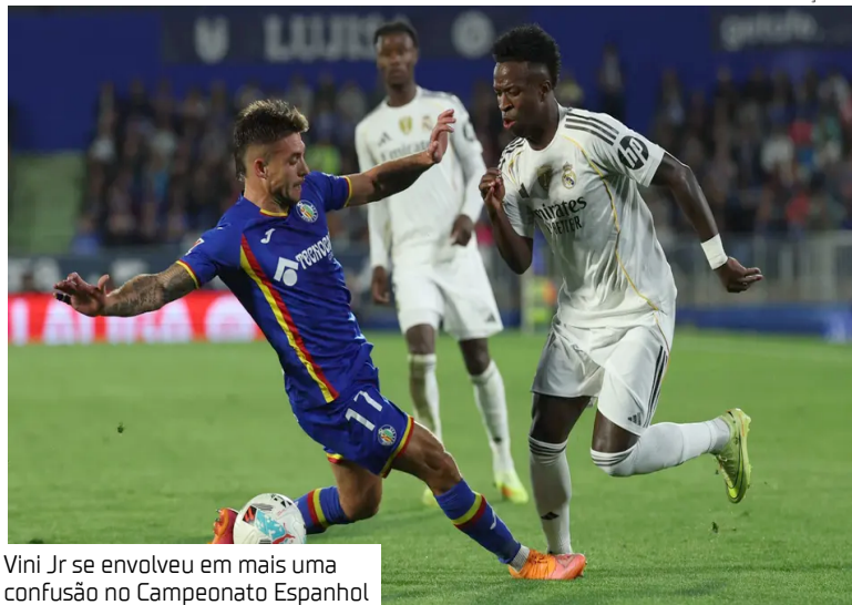
Vini Jr se envolveu em mais uma confusão no Campeonato Espanhol

A partida entre Getafe e Real Madrid, apesar de ter terminado com apenas um gol, foi marcada por diversos acontecimentos. Vini Jr, que iniciou no banco de reservas, teve papel central no desenrolar do confronto ao entrar no segundo tempo, provocar duas expulsões e intensificar o clima de tensão entre os anfitriões. O brasileiro ainda foi acusado de ironizar o técnico adversário e tornou-se alvo da revolta do zagueiro Juan Iglesias, em