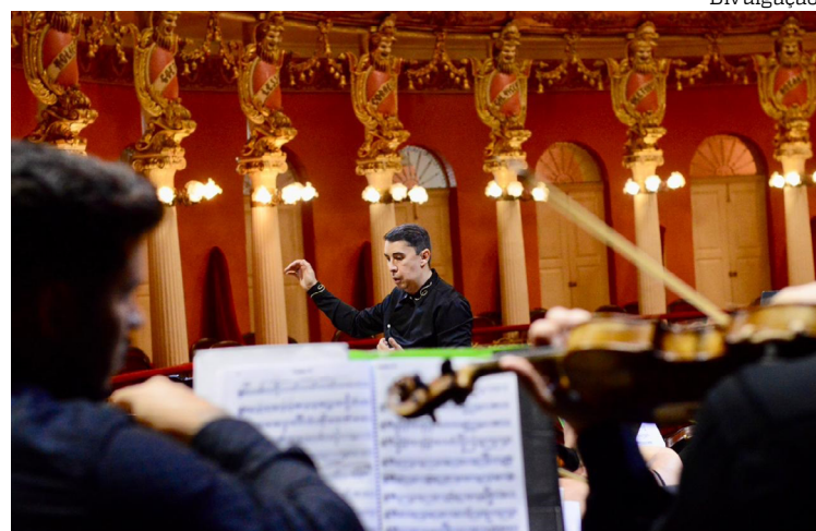
Concerto no Teatro Amazonas celebra Pärt e Shostakovich

Em um concerto que une delicadeza e força política, a Orquestra de Câmara do Amazonas (OCA) apresenta hoje (21), às 20h, no Teatro Amazonas, o programa “Pärt / Shostakovich”, uma homenagem a dois compositores que desafiaram os limites impostos pela repressão política na antiga União Soviética e do nazismo. As reservas para o espetáculo já estão disponíveis no site shoppingresos.com.br .