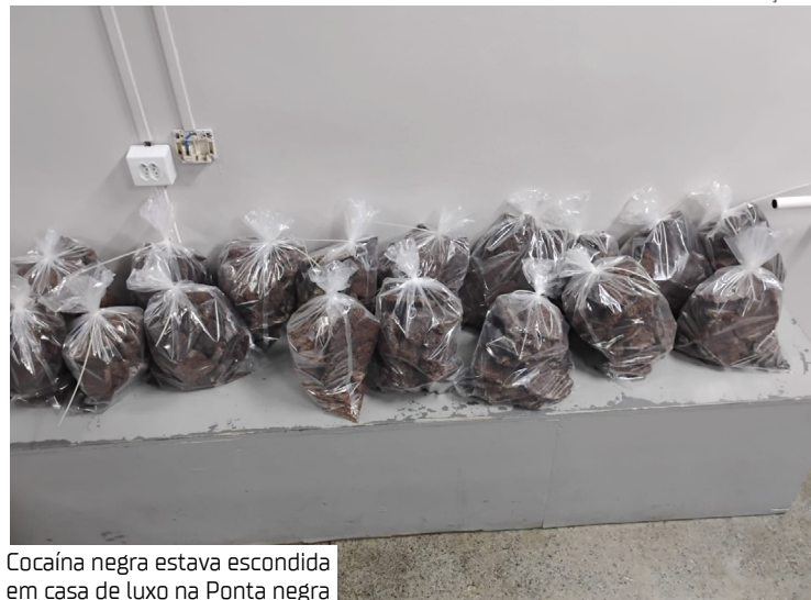
Cocaína negra estava escondida em casa de luxo na Ponta negra

Um casal foi preso com mais de 50 quilos de drogas escondidos em uma mansão no bairro Ponta Negra, Zona Oeste de Manaus. A ação foi realizada pelo Departamento de Investigação sobre Narcóticos (Denarc). Parte da droga era cocaína negra.