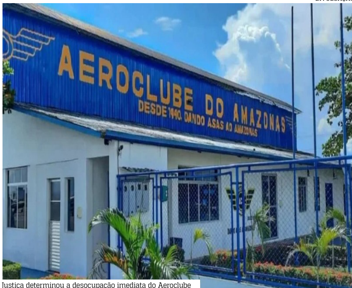
Justiça determinou a desocupação imediata do Aeroclube

A Justiça Federal do Amazonas determinou, em caráter imediato, a desocupação do Aeroclube. A medida atende a um pedido da Infraero.