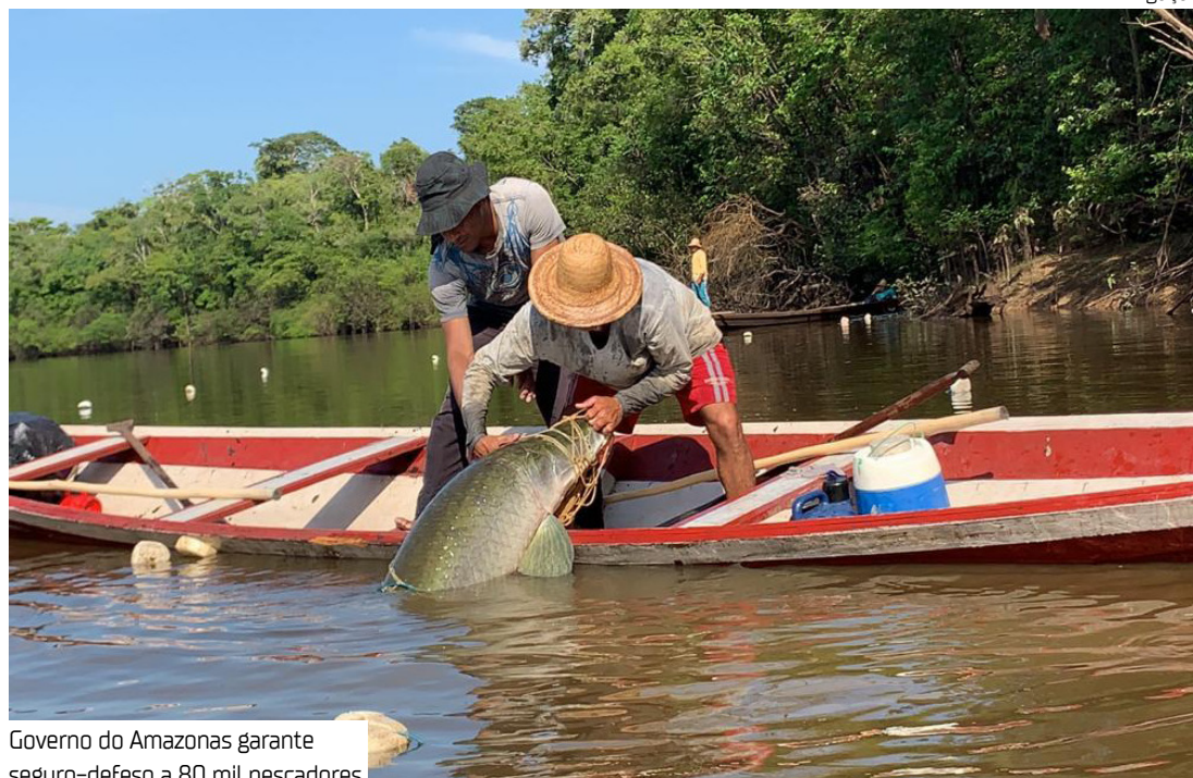
Governo do Amazonas garante seguro-defeso a 80 mil pescadores

De acordo com as novas regras do Governo Federal, a concessão do benefício passará por mudanças a partir deste mês. Os pescadores cadastrados deverão fornecer comprovante de residência, comprovante de contribuição