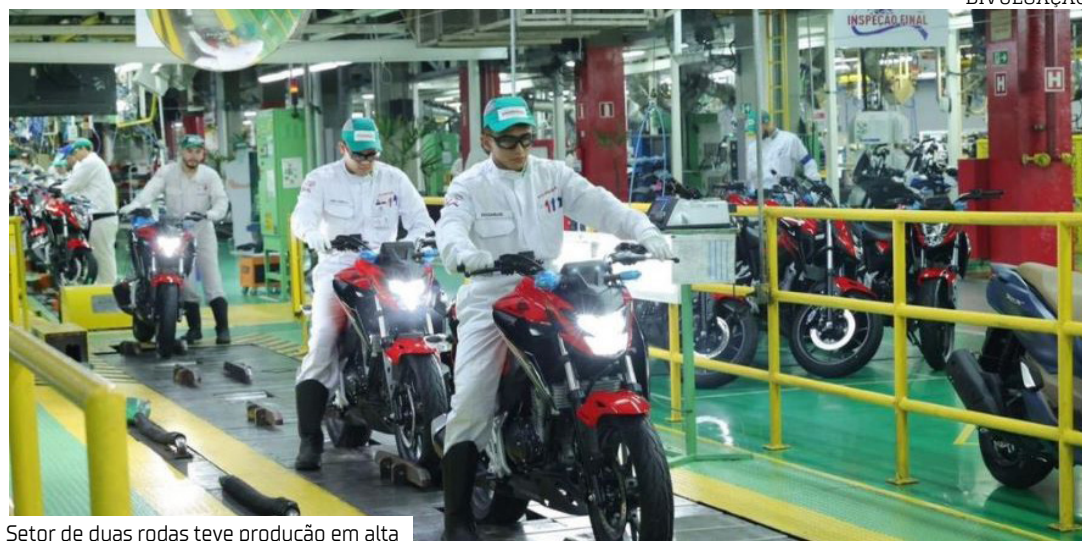
Setor de duas rodas teve produção em alta