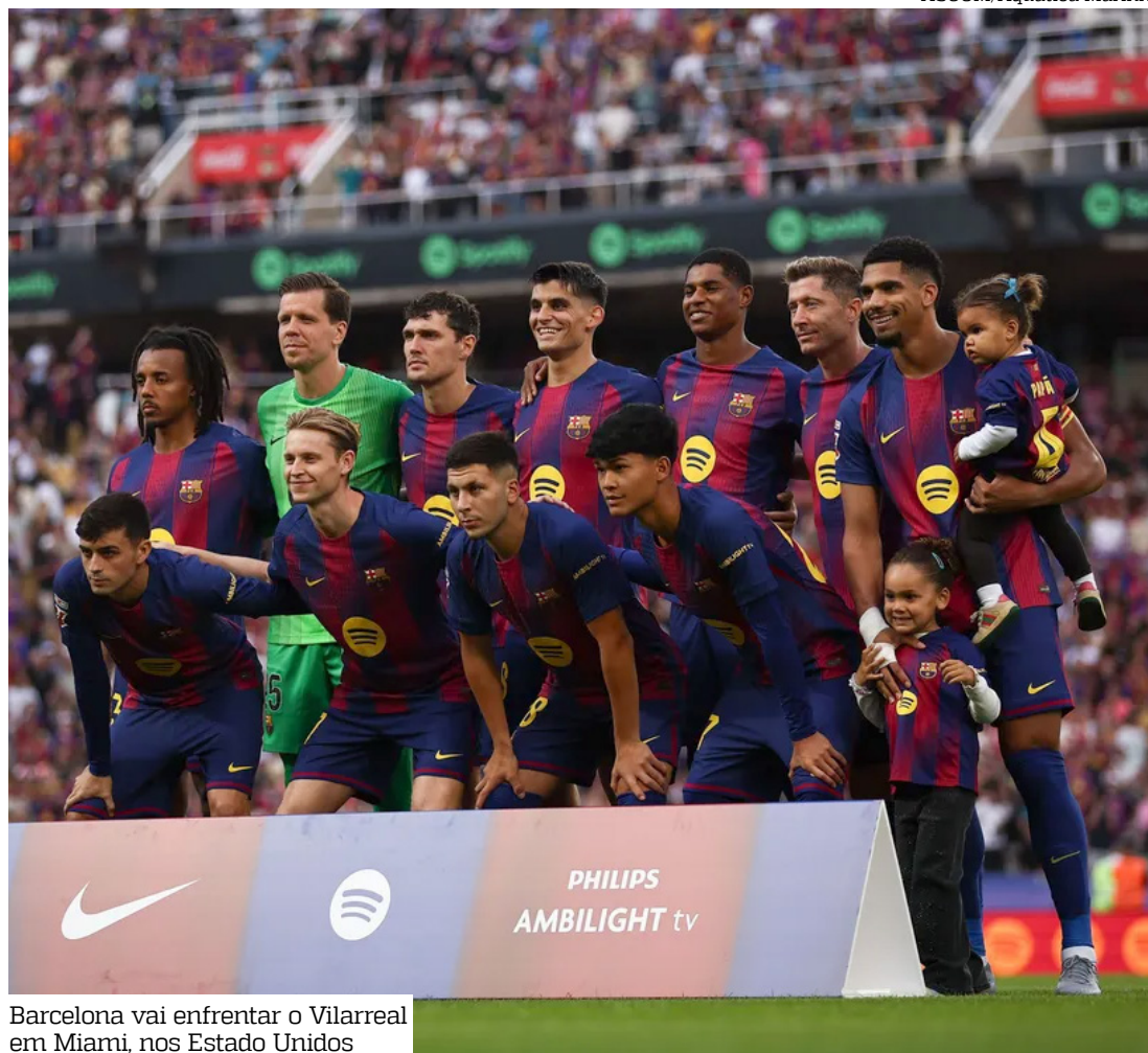
Barcelona vai enfrentar o Villarreal em Miami, nos Estados Unidos

O sinal verde dado pela Uefa não é uma surpresa. Seu presidente, Aleksander Ceferin, admitiu no início de