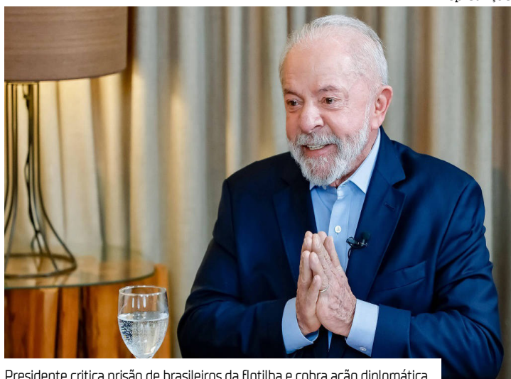
Presidente critica prisão de brasileiros da flotilha e cobra ação diplomática

O presidente Luiz Inácio Lula da Silva (PT) afirmou ontem (6) que Israel violou leis internacionais ao interceptar a flotilha Global Sumud, deter seus integrantes — incluindo brasileiros — e mantê-los presos.