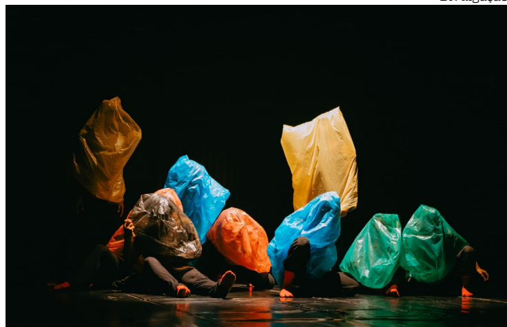
Espectáculo leva ao palco coreografias que transformam experiências

A Entrecorpus Companhia de Dança apresenta na quinta-feira (9) e sexta-feira (10), no Teatro da Instalação, os espetáculos ‘Sob o Sol’, ‘Luz Ilusão’ e ‘Hysteria’. Todas as apresentações têm início às 19h, com entrada franca.