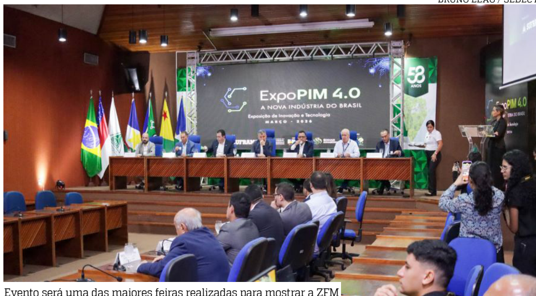
Evento será uma das maiores feiras realizadas para mostrar a ZFM.

O lançamento contou com a presença de representantes da Secretaria de Estado de Desenvolvimento Econômico, Ci-