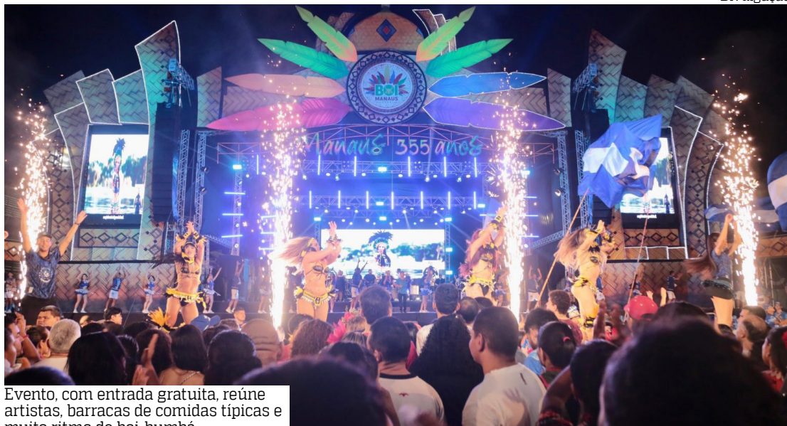
Evento, com entrada gratuita, reúne artistas, barracas de comidas típicas e muito ritmo de boi-bumbá

Com entrada gratuita, o espaço promete movimentar o coração da cidade com uma atmosfera de alegria, tradição e identidade amazônica. O evento abre o circuito de celebrações que antecedem o Boi Manaus, consolidando-se como ponto de encontro entre artistas, brincantes e o público apaixonado pela cultura popular.