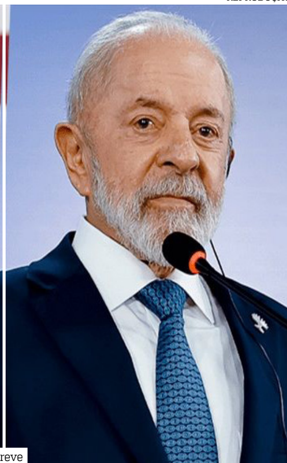
Presidentes devem se encontrar pessoalmente em breve