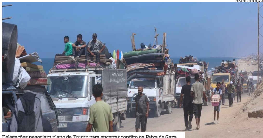
Delegações negociam plano de Trump para encerrar conflito na Faixa de Gaza

A delegação do Hammas conta com Khalil Al-Hayya,