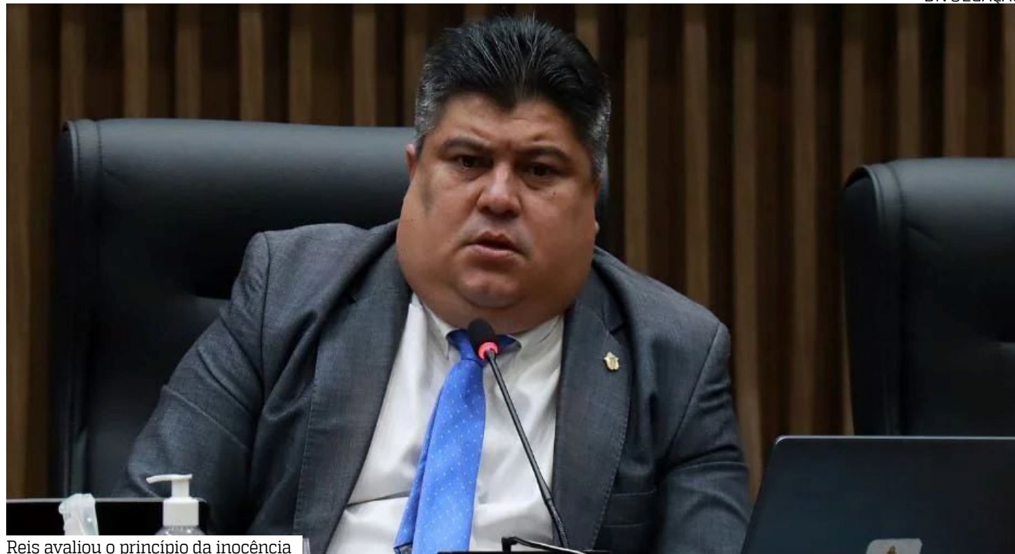
Reis avaliou o princípio da inocência