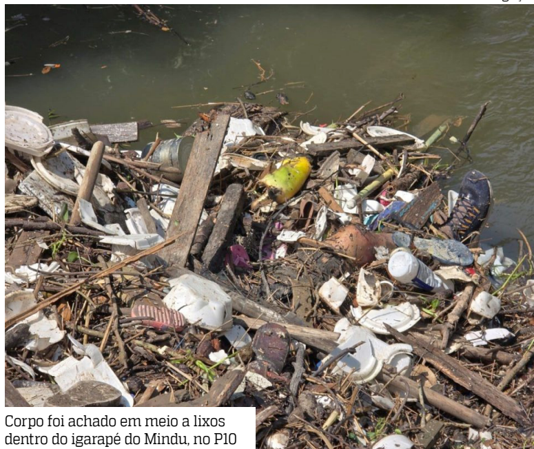
Corpo foi achado em meio a lixos dentro do igarapé do Mindu, no P10

Um corpo ainda não identificado foi encontrado, na manhã desta segunda-feira (6), dentro de um igarapé no Passeio do Mindu, no bairro Parque 10, Zona Centro-Sul de Manaus.