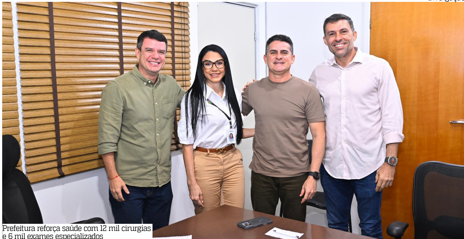
Prefeitura reforça saúde com 12 mil cirurgias e 6 mil exames especializados

Com os novos aportes, a prefeitura vai realizar 12 mil cirurgias oftalmológicas, incluindo procedimentos de catarata, e 6 mil exames de endoscopia e colonoscopia, além de ampliar a oferta de ecocardiogramas, testes ergométricos e exames histopatológicos. Parte desses procedimentos já está em fase de licitação e será iniciada nos próximos meses.