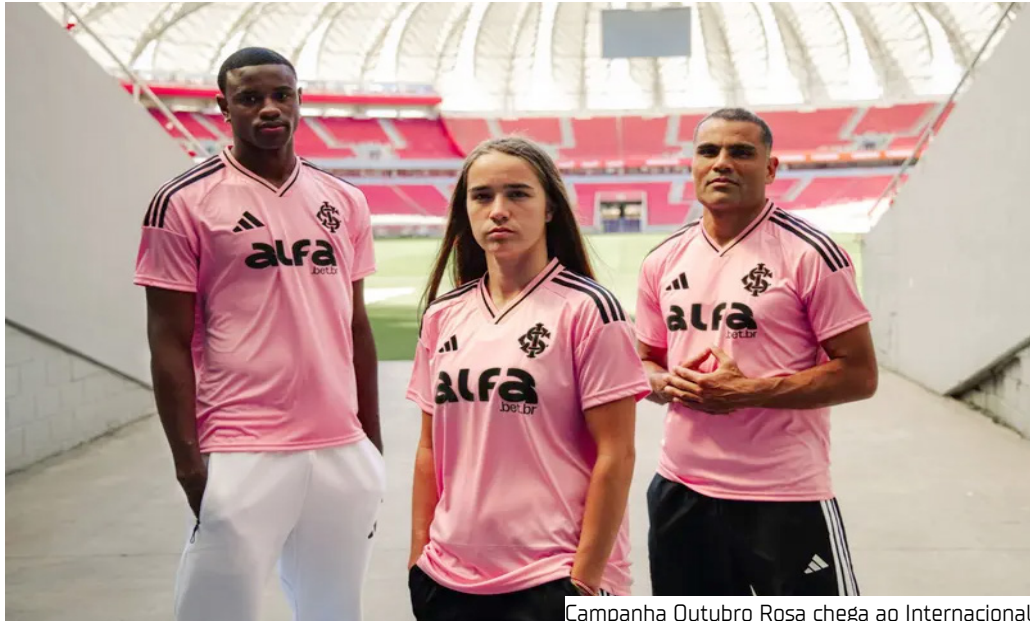
Campanha Outubro Rosa chega ao Internacional