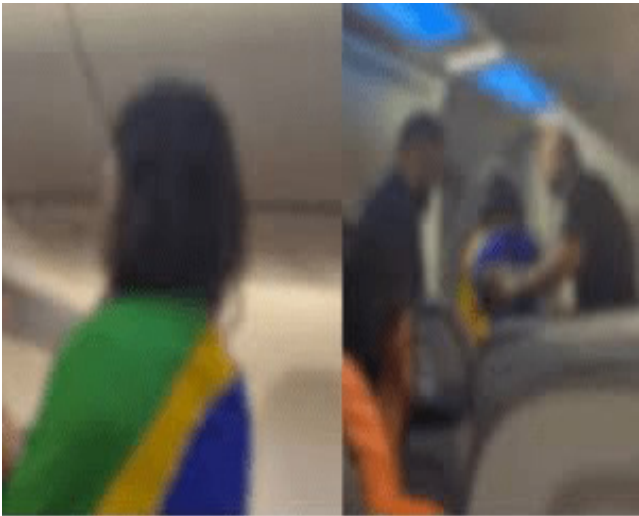
Enrolada em uma bandeira disparou xingamentos contra passageiros

Uma mulher foi retirada de um avião da GOL Linhas Aéreas na terça-feira (30), no Aeroporto do Galeão, no Rio de Janeiro, após xingar passageiros antes da decolagem. O voo G3 2075 tinha como destino Brasília. Vídeos mostram a mulher enrolada em uma bandeira do Brasil, proferindo insultos como: “estuprador, abusador, aliciador, assediador”. Segundo relatos de uma passageira, ela se identificava como bolsonarista e dizia estar cercada por “petistas”, acusando-os de serem abusadores. A mulher chegou a deitar no chão e se recusava a permitir a decolagem, o que levou à intervenção da Polícia Federal. A passageira ouvida pela reportagem afirmou que não havia ninguém usando símbolos do Partido dos Trabalhadores (PT) no voo. Ela contou ainda que a situação gerou constrangi-