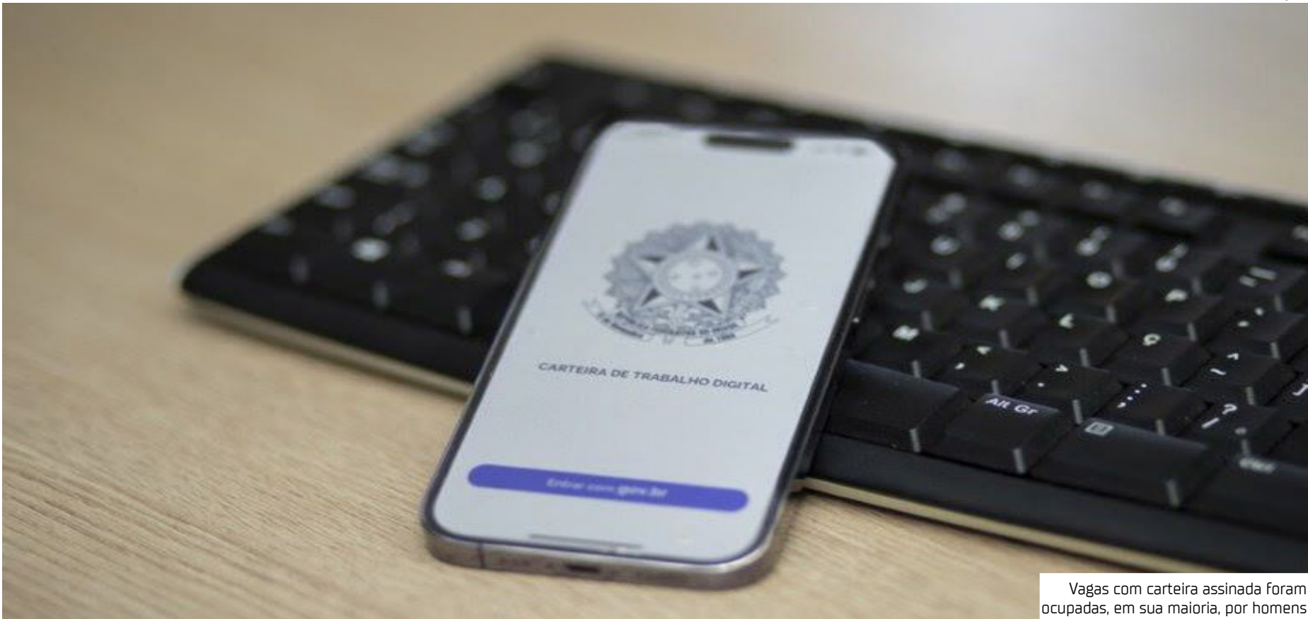
Vagas com carteira assinada foram ocupadas, em sua maioria, por homens

As novas vagas com carteira assinada geradas em agosto no Amazonas foram ocupadas, em sua maioria, por pessoas do sexo masculino, responsáveis pelo ingresso em 1.501 postos, contra 1.136 vagas ocupadas pelas mulhe-