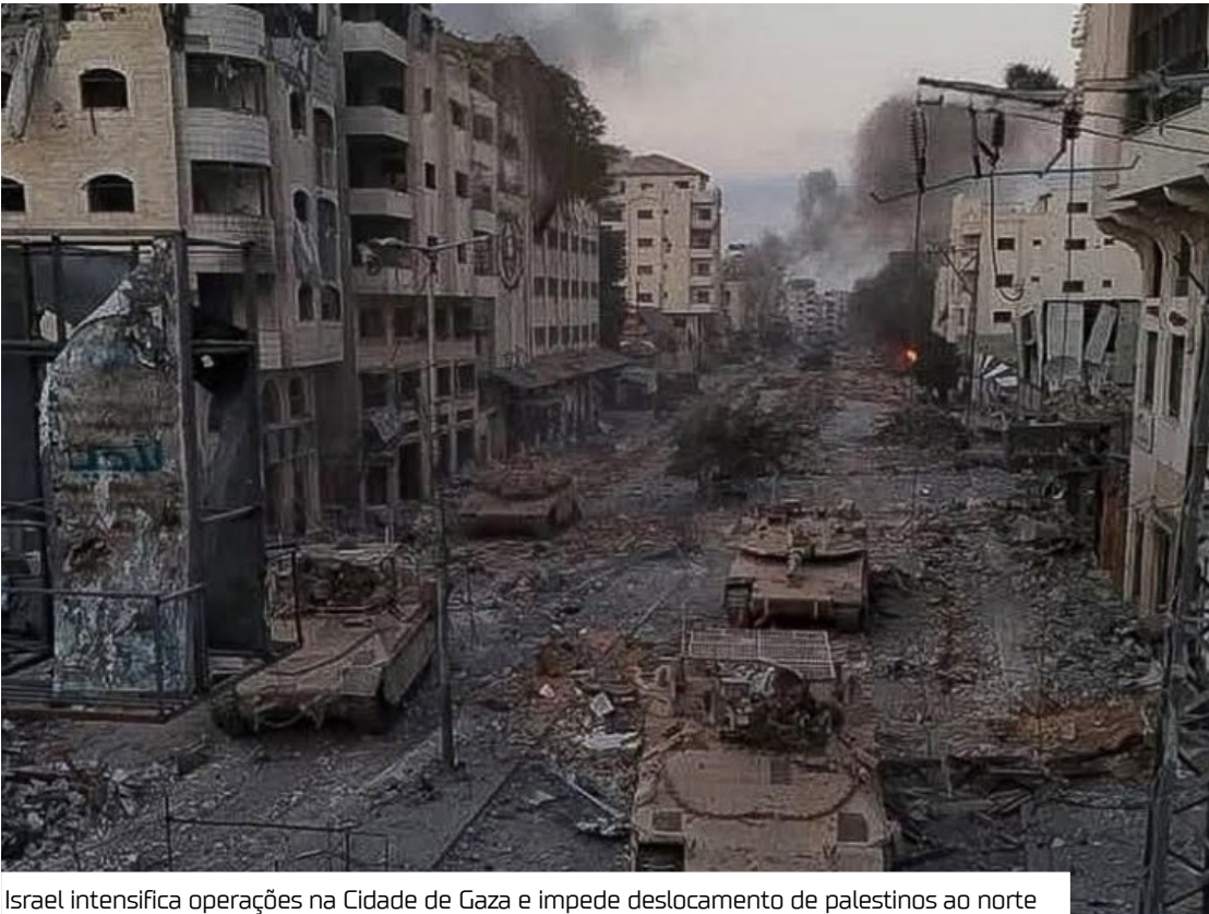
Israel intensifica operações na Cidade de Gaza e impede deslocamento de palestinos ao norte

As Forças de Defesa de Israel seguem com bombardeios e operações terrestres na Cidade de Gaza, ontem (1º), e agora impedem que palestinos que vivem ou se deslocaram ao sul da Faixa de Gaza retornem ao norte do território. A nova diretriz amplia o cerco militar em torno da região, enquanto o grupo Hamas avalia o plano de paz proposto pelo presidente americano Donald Trump para encerrar o conflito. O Ministro da Defesa de Israel, Israel Katz, justificou a medida como parte da estratégia para derrotar o Hamas. “Esta é a última oportunidade para os residentes de Gaza que desejam se deslocar para o sul e deixar os membros do Hamas isolados na própria Cidade de Gaza diante das operações em grande escala contínuas das Forças de Defesa de Israel”, disse Katz. Ele afirmou que qualquer pessoa que tente se deslocar para o sul passará por triagem do Exército israelense. Acesso suspenso As forças israelenses também bloquearam o uso da estrada costeira para deslocamentos do sul para o norte. Segundo o Exército, o traje-