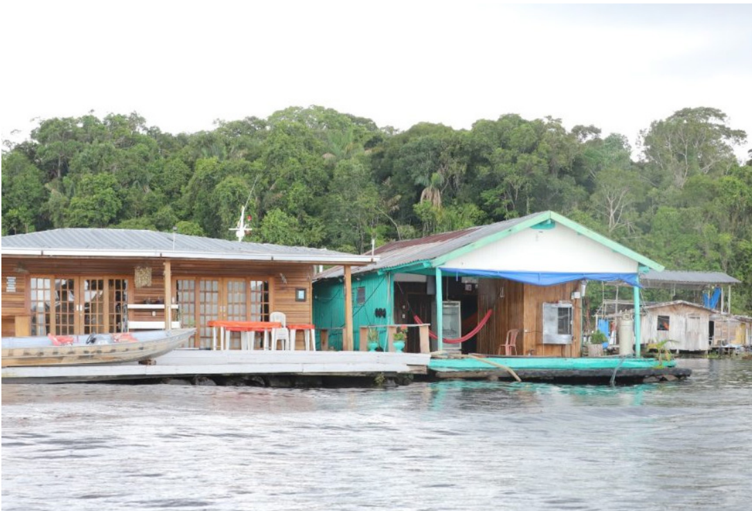
DPE e MP pedem à Justiça remoção de flutuantes para preservar meio ambiente

As instituições alertam que a simples remoção, sem análise social prévia e sem alternativas ou compensações, pode ferir princípios como a proporcionalidade, razoabilidade e a dignidade da pessoa humana.