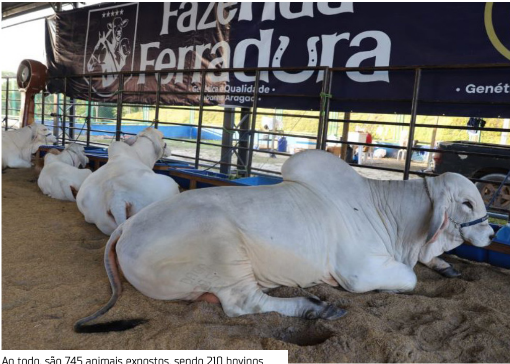
Ao todo, são 745 animais expostos, sendo 210 bovinos

O avanço genético da pecuária amazonense é uma das grandes novidades da 47ª Exposição Agropecuária do Amazonas (Expoagro), promovida pelo Governo do Amazonas, por meio da Secretaria de Estado de Produção Rural (Sepror), que registra mais de 100% do número de animais expostos comparado a edição de 2024.