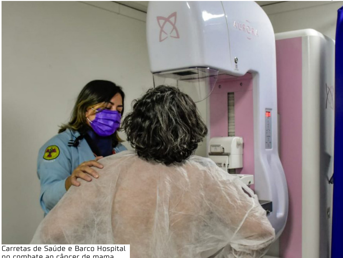
Carretas de Saúde e Barco Hospital no combate ao câncer de mama