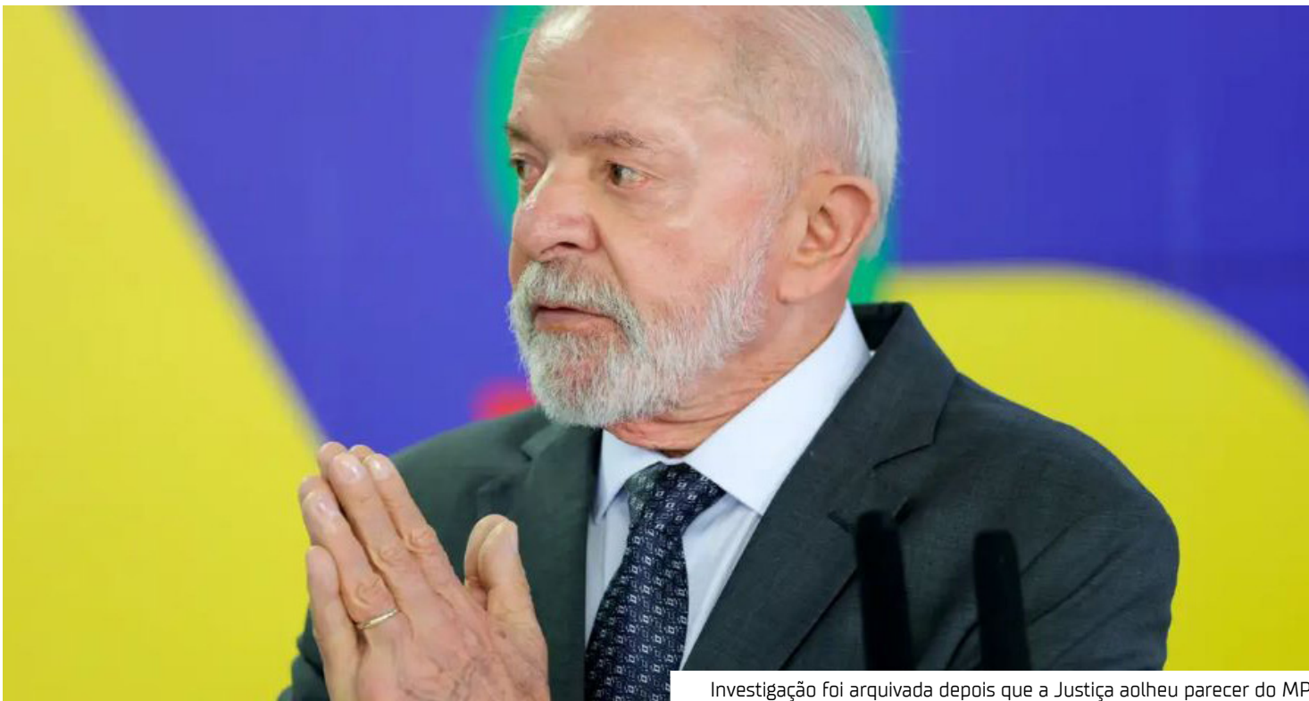
Investigação foi arquivada depois que a Justiça acolheu parecer do MP

da depois que a Justiça acolheu parecer do Ministério Público, que entendeu não ter sido provada a autoria do suposto golpe.