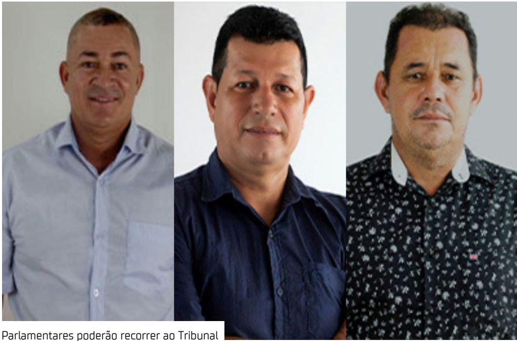
Parlamentares poderão recorrer ao Tribunal