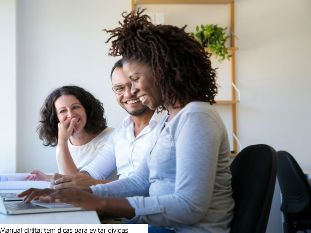
Manual digital tem dicas para evitar dívidas

Já disponível no blog da empresa, o conteúdo explica de forma didática o que configura o endividamento no CPNJ, consequências das dívidas e informa os canais para se livrar dessas pendências.