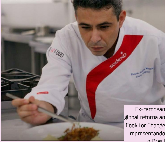
Ex-campeão global retorna ao Cook for Change representando o Brasil