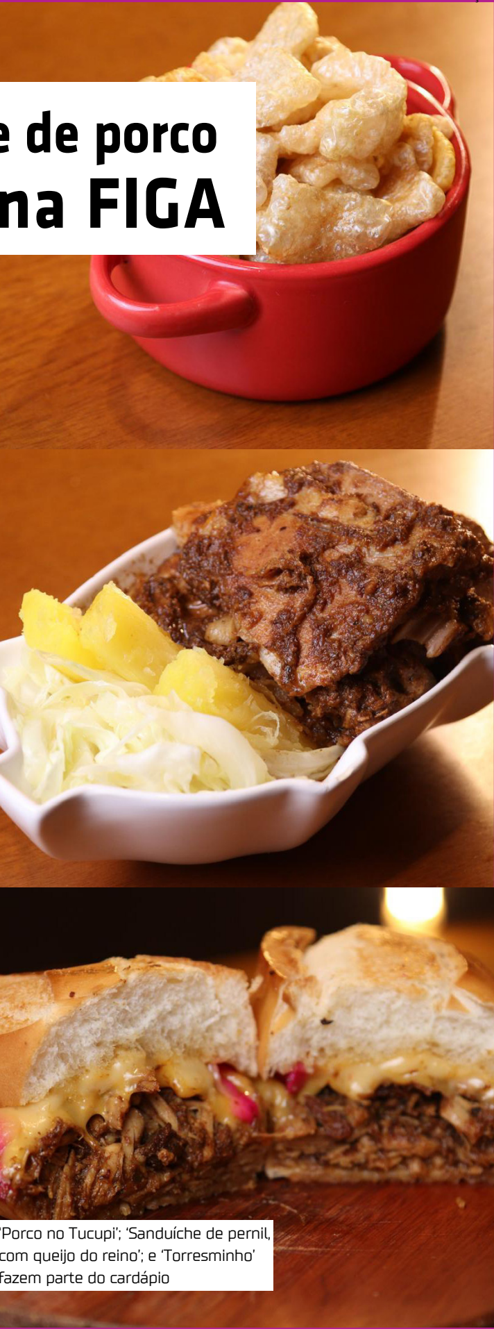
'Porco no Tucupi', 'Sanduíche de pernil, com queijo do reino'; e 'Torresminho' fazem parte do cardápio

De acordo com dados da Associação Brasileira de Criadores de Suínos (ABCS), o volume de consumo de carne de porco tem superado seu crescimento em relação ao das proteínas concorrentes nos últimos anos. Segundo a associação, entre 2015 e 2025, o consumo per capita de carne suína cresceu 33,4%, atingindo 19,3 quilos. Paralelamente a esse crescimento, o consumo per capita de carne bovina caiu 6,6%, e o de carne de frango, 2,9%, para 29,7 quilos e 43,9 quilos, respectivamente, o que representa um indicativo de que a carne suína tem potencial para crescer ainda mais no país.