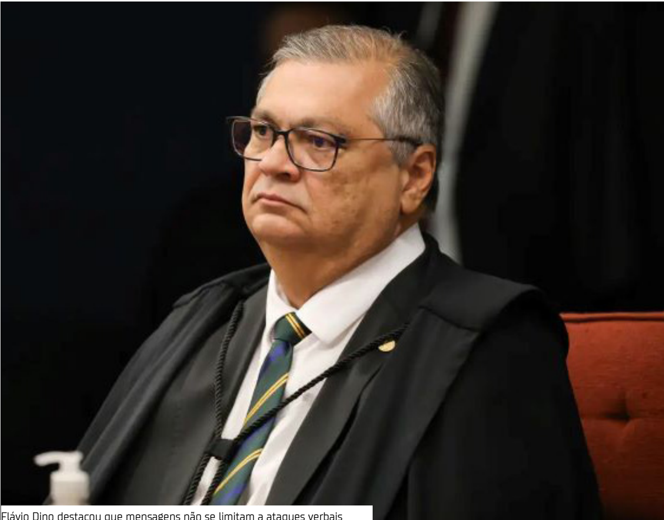
Flávio Dino destacou que mensagens não se limitam a ataques verbais

A Polícia Federal (PF) abriu investigação para apurar as ameaças recebidas pelo ministro do Supremo Tribunal Federal (STF) Flávio Dino logo após seu voto no julgamento da Ação Penal nº 2.668, que resultou na condenação do ex-presidente Jair Bolsonaro (PL).