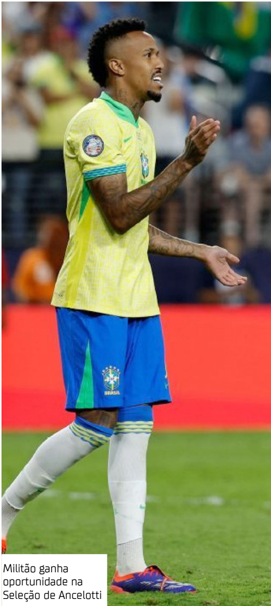
Militão ganha oportunidade na Seleção de Ancelotti

Ancelotti convoca 26 jogadores para amistosos contra Coreia do Sul e Japão