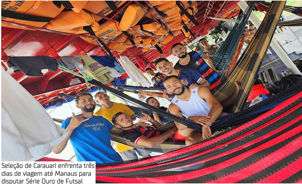
Seleção de Carauari enfrenta três dias de viagem até Manaus para disputar Série Ouro de Futsal