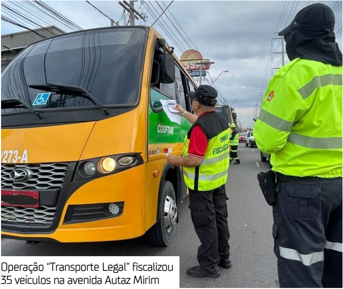
Operação “Transporte Legal” fiscalizou 35 veículos na avenida Autaz Mirim

Para a execução da fiscalização, o IMMU mobilizou uma equipe de 11 agentes. A operação contou ainda com apoio da Polícia Militar do Amazonas (PM-AM) para garantir a segurança na operação.