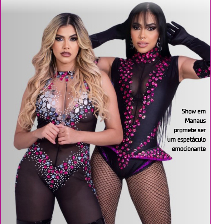
Show em Manaus promete ser um espetáculo emocionante

YouTube: https://www.youtube.com/companhiadocalypso