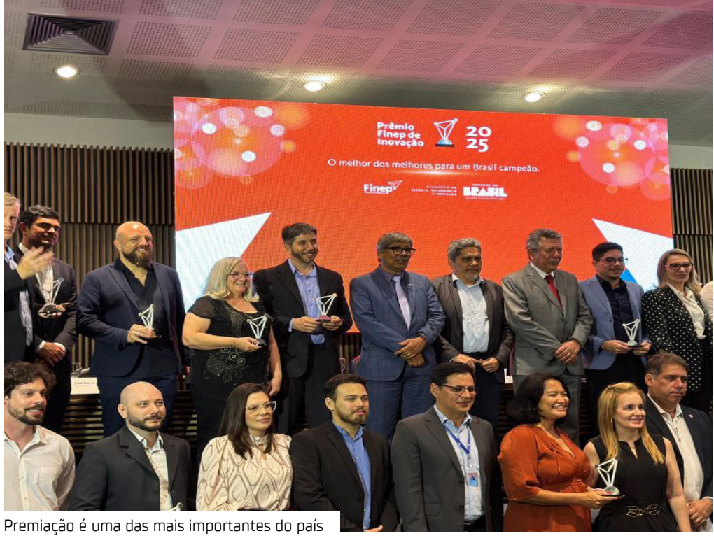
Premiação é uma das mais importantes do país

Antônio Elias, nome de peso no Ministério da Ciência, Tecnologia e Inovação, que veio a Manaus reforçar a importância estratégica da Amazônia no mapa da inovação nacional. A escolha da cidade como sede da etapa regional simboliza o reconhecimento do avanço tecnológico que tem acontecido por aqui, com soluções criadas no chão da fábrica, nas universidades, nas startups e nas comunidades.