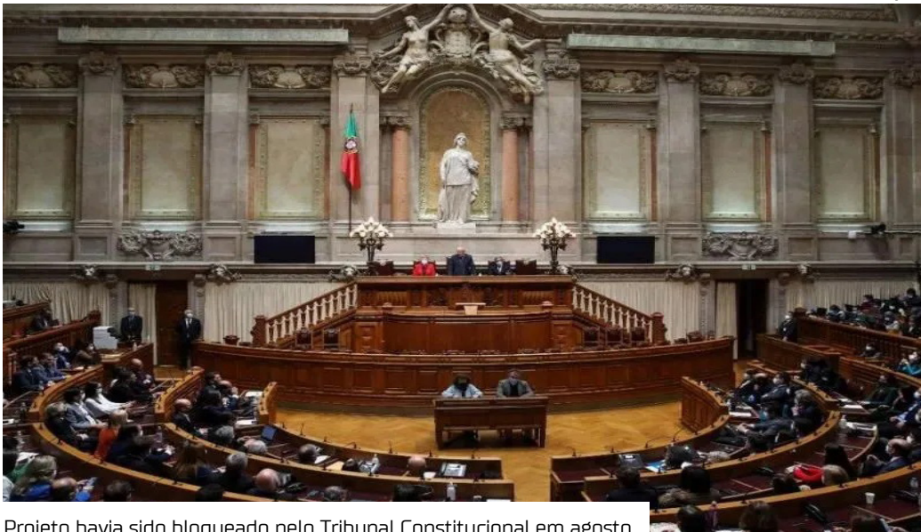
Projeto havia sido bloqueado pelo Tribunal Constitucional em agosto

O Parlamento de Portugal aprovou ontem (30) a nova Lei dos Estrangeiros, uma legislação anti-imigração que havia sido bloqueada pelo Tribunal Constitucional do país.