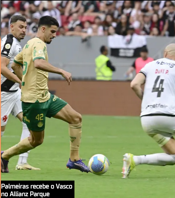
Palmeiras recebe o Vasco no Allianz Parque