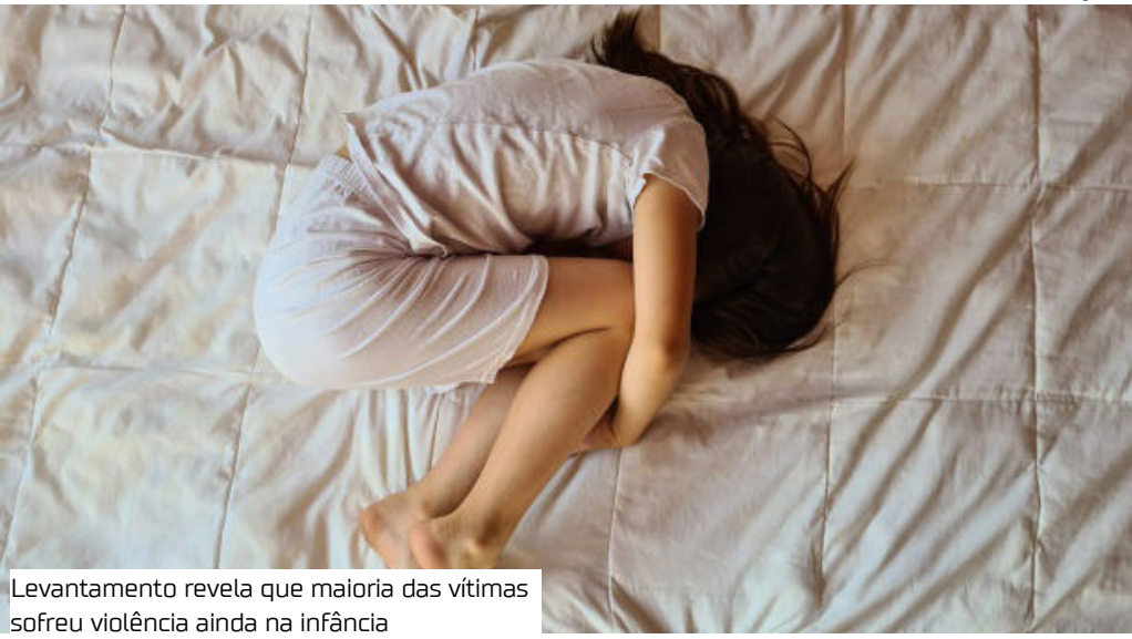
Levantamento revela que maioria das vítimas sofreu violência ainda na infância