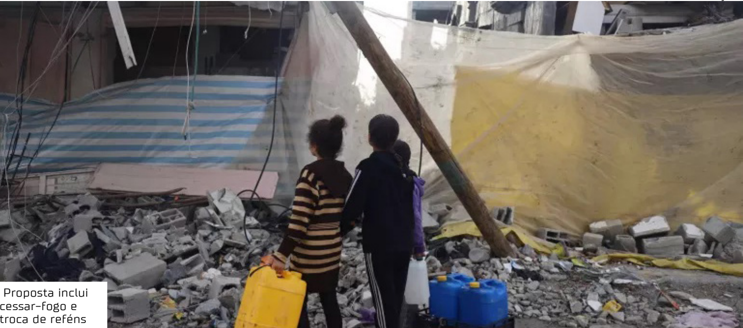
Proposta inclui cessar-fogo e troca de reféns