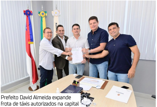
Prefeito David Almeida expande frota de táxis autorizados na capital