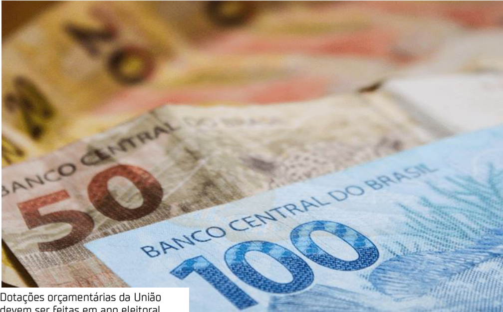
Dotações orçamentárias da União devem ser feitas em ano eleitoral

A Comissão Mista de Orçamento do Congresso Nacional elevou de R$ 1 bilhão para R$ 4,9 bilhões o valor reservado no Orçamento de 2026 (PLN 15/25) para as eleições do ano que vem.