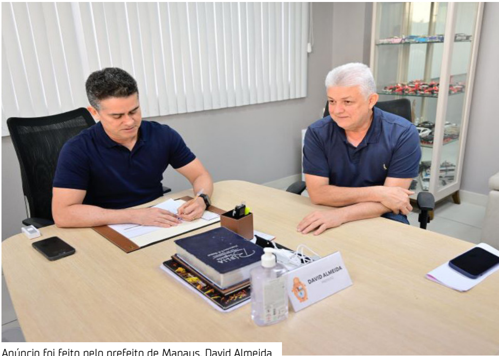
Anúncio foi feito pelo prefeito de Manaus, David Almeida

A Prefeitura de Manaus, por meio da Secretaria Municipal do Trabalho, Empreendedorismo e Inovação (Semtepi), vai realizar no dia 10 de outubro, no shopping Philippe Daou, zona Norte, a 2ª edição do Megafeirão de Empregabilidade, em celebração aos 50 anos do Sistema Nacional de Emprego (Sine). O anúncio foi feito ontem (30) pelo prefeito David Almeida, no Centro de Cooperação da Cidade (CCC). O prefeito destacou a importância da iniciativa como parte das políticas de inclusão