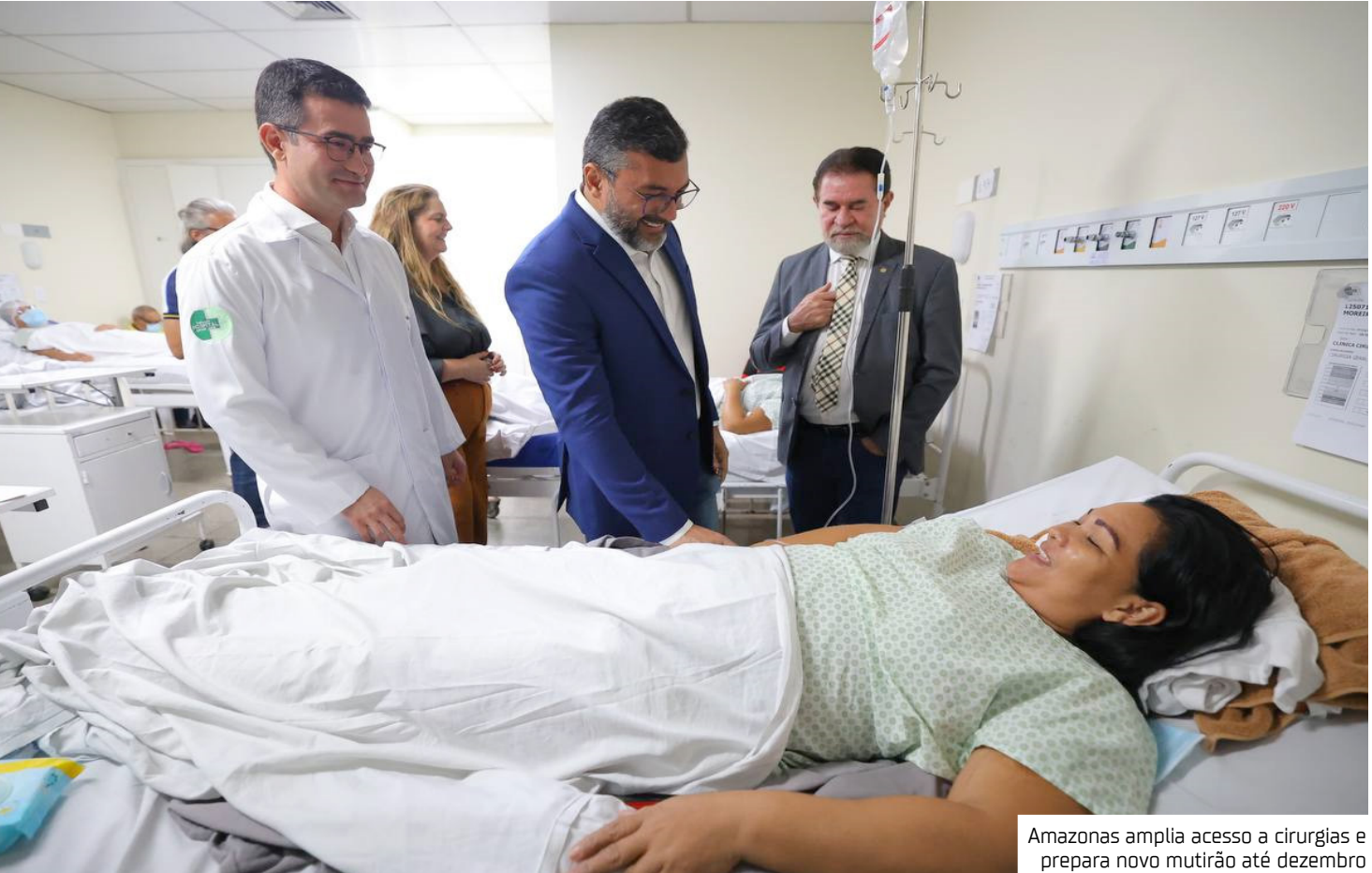
Amazonas amplia acesso a cirurgias e prepara novo mutirão até dezembro

As filas em especialidades como ortopedia, ci-