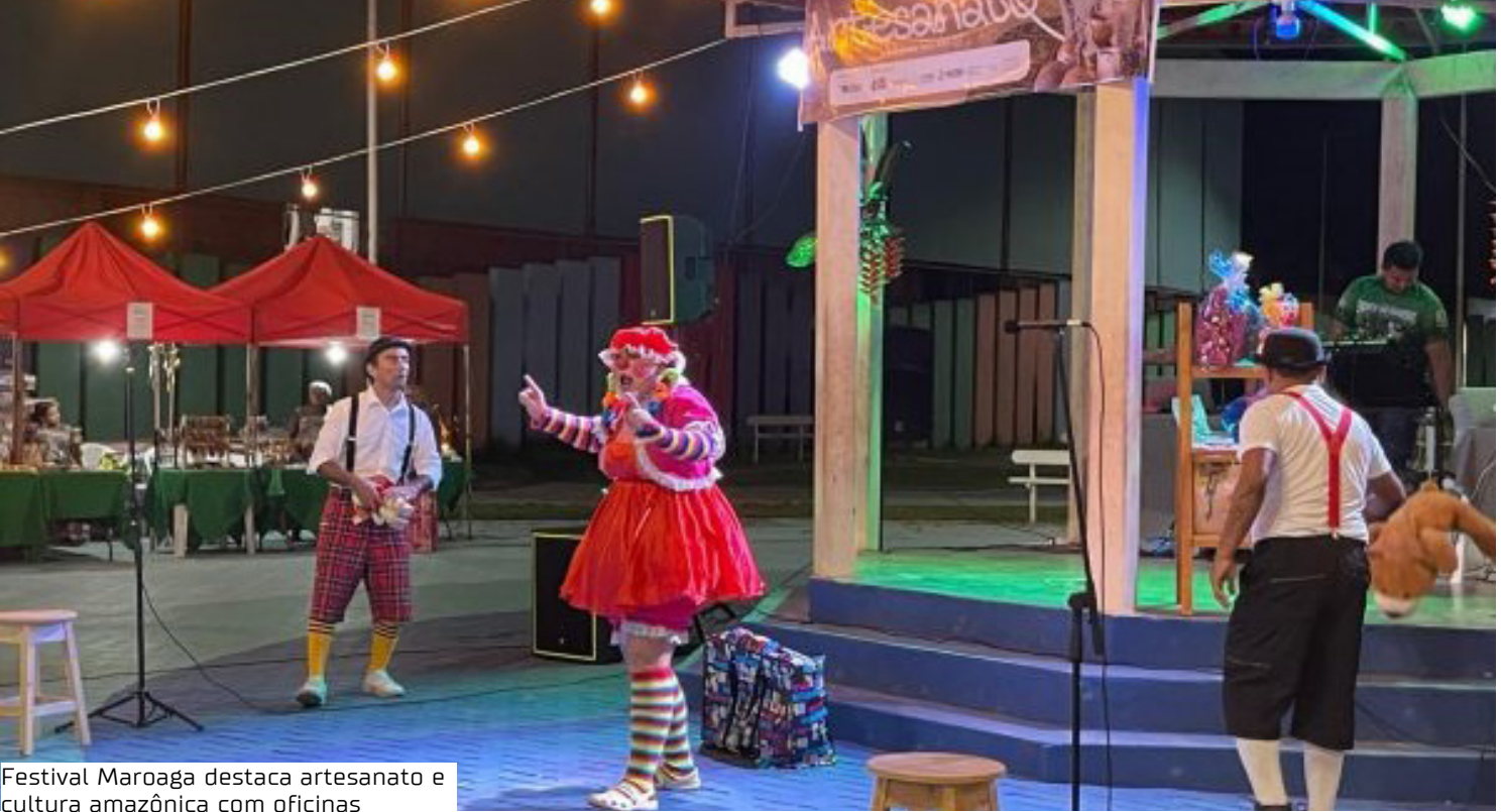
Festival Maroaga destaca artesanato e cultura amazônica com oficinas