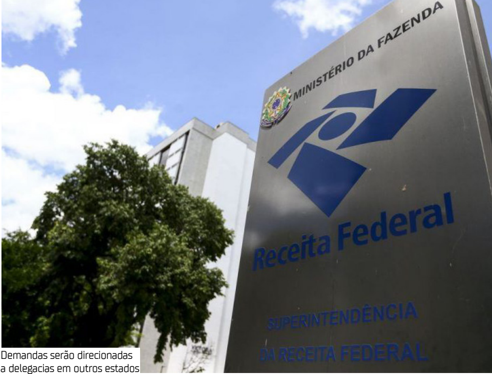
Demandas serão direcionadas a delegacias em outros estados