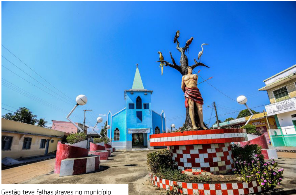
Gestão teve falhas graves no município