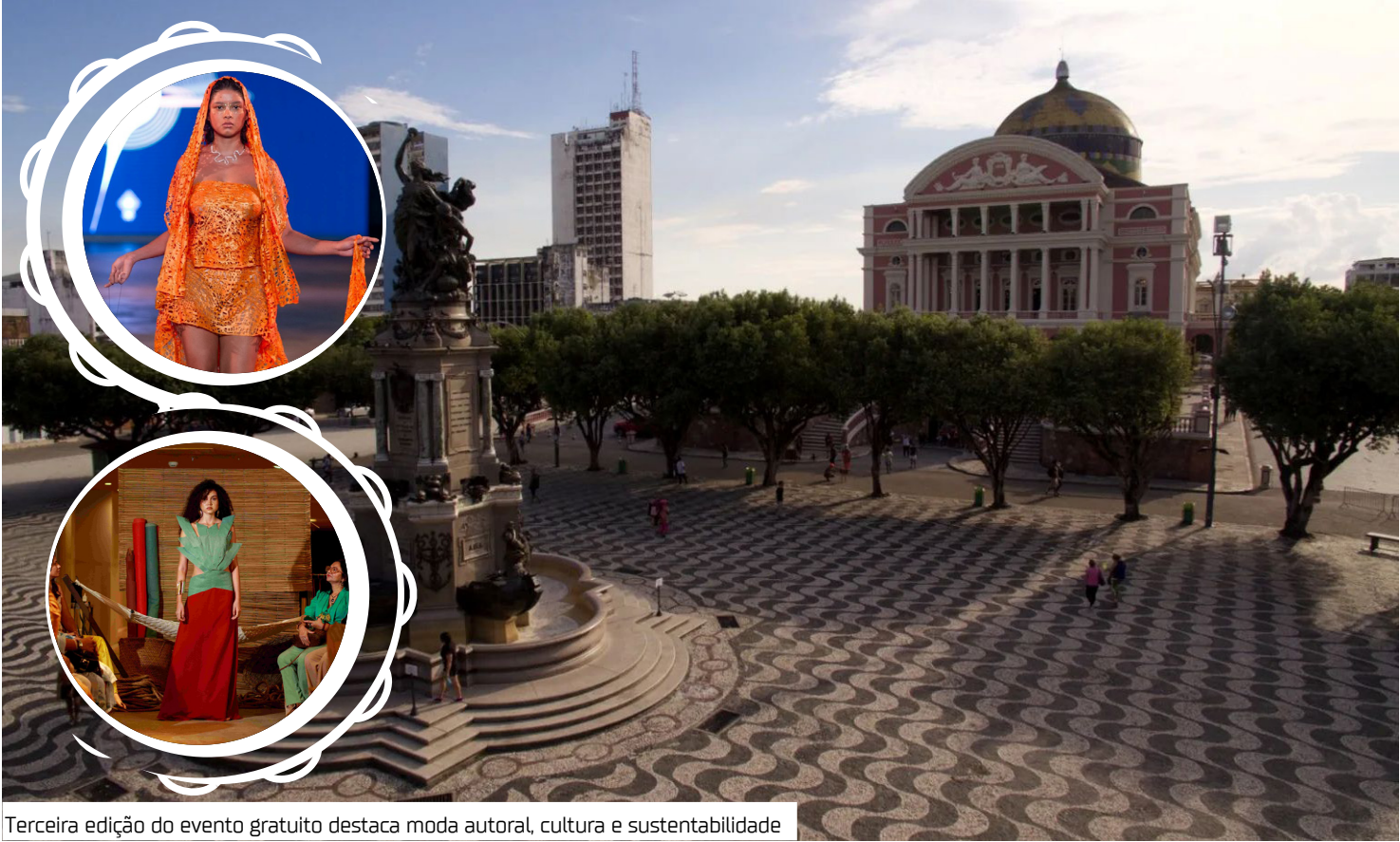
Terceira edição do evento gratuito destaca moda autoral, cultura e sustentabilidade