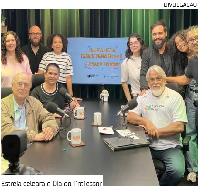
Estreia celebra o Dia do Professor

ALFA-EJA Brasil é realizado pelo Instituto Paulo Freire, em parceria com a Petrobras.