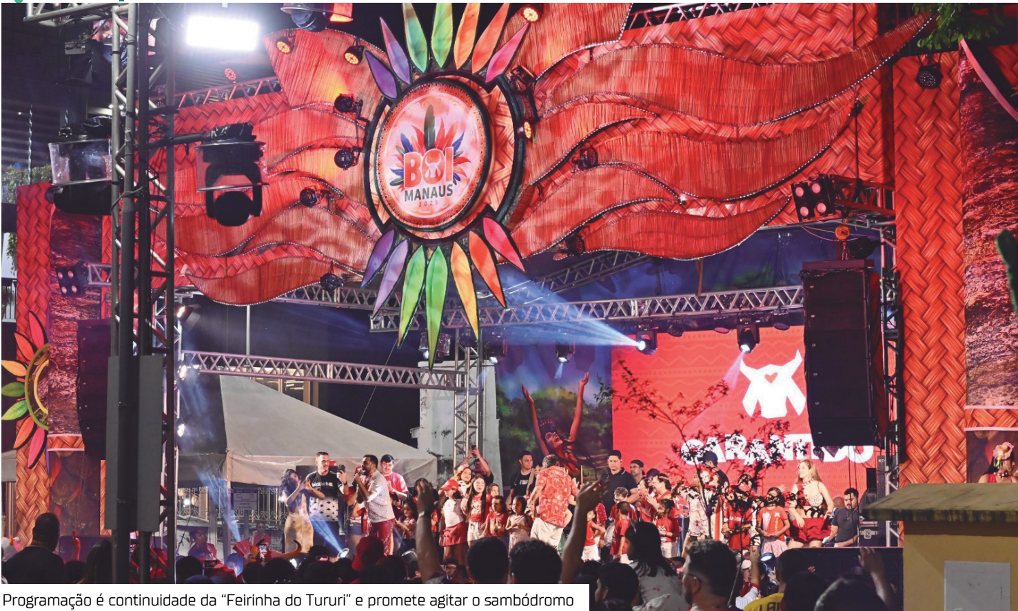
Programação é continuidade da "Feirinha do Tururi" e promete agitar o sambódromo