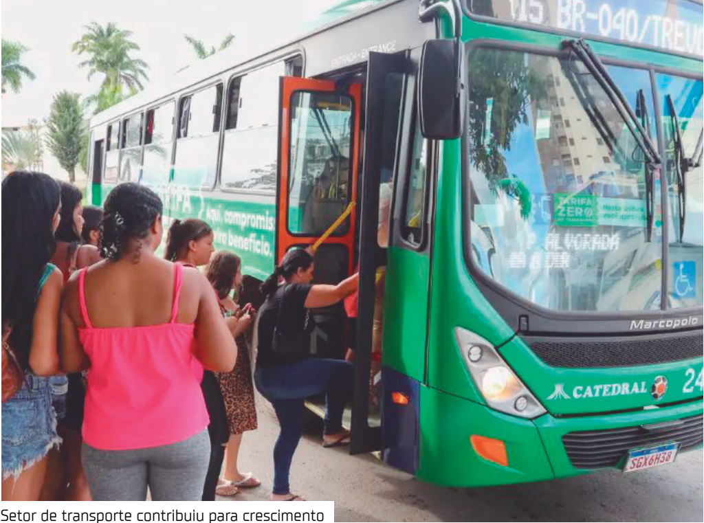
Setor de transporte contribuiu para crescimento