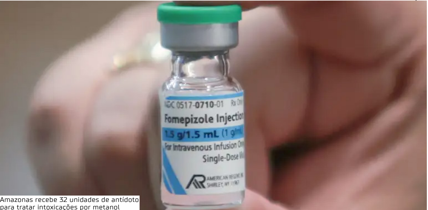
Amazonas recebe 32 unidades de antídoto para tratar intoxicações por metanol

Eficácia e segurança O fomepizol é mais uma