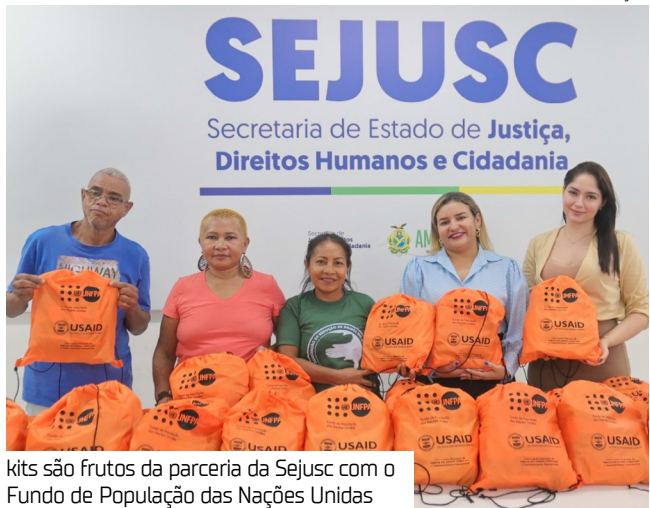
kits são frutos da parceria da Sejusc com o Fundo de População das Nações Unidas

com os direitos e dignidade das mulheres. “Nós trabalhamos com a população em situação de rua, trabalhadoras sexuais, mulheres em vulnerabilidade, falando da redução de danos, do cuidado com o seu corpo e também a questão da prevenção de infecções sexualmente transmissíveis. Vimos aqui fazer uma parceria para podermos levar mais esse cuidado”, enfatiza.