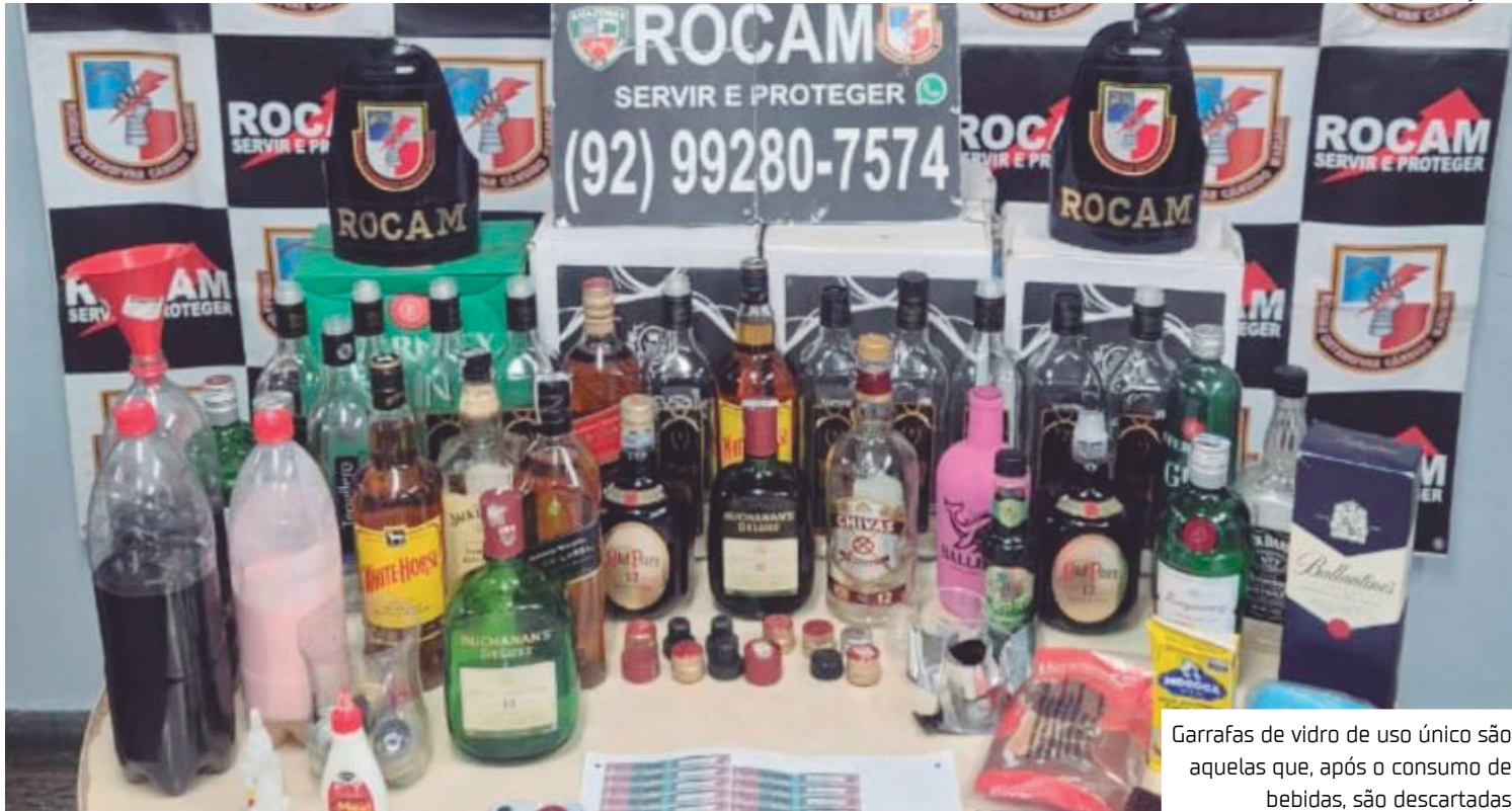
Garrafas de vidro de uso único são aquelas que, após o consumo de bebidas, são descartadas