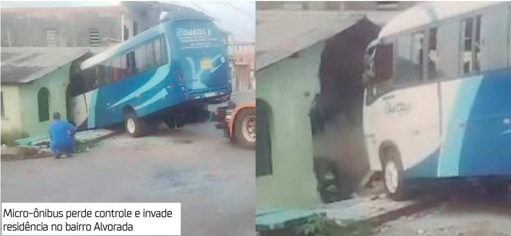
Micro-ônibus perde controle e invade residência no bairro Alvorada

Um micro-ônibus que transportava trabalhadores para o Distrito Industrial colidiu e invadiu uma residência na manhã de ontem (14), no bairro Alvorada 2, Zona Centro-Oeste de Manaus.