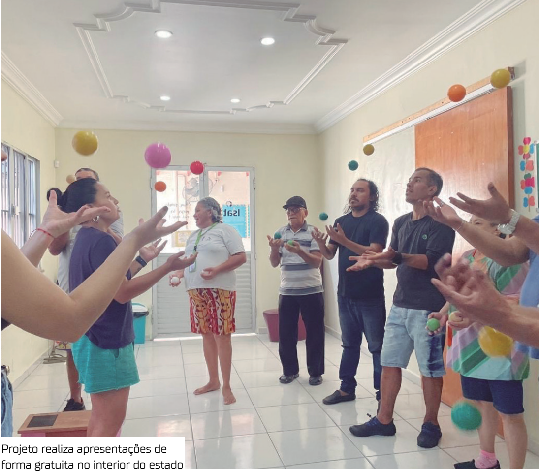
Projeto realiza apresentações de forma gratuita no interior do estado