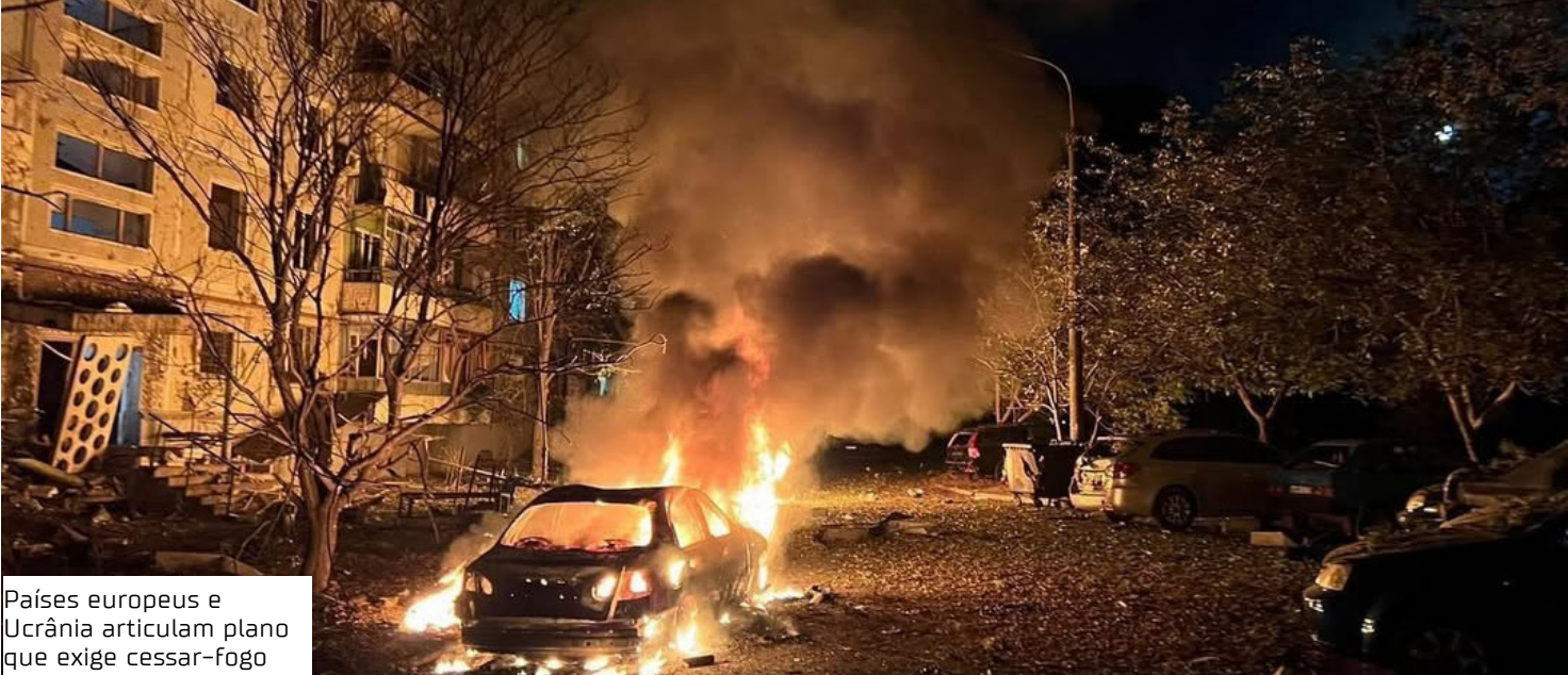
Países europeus e Ucrânia articulam plano que exige cessar-fogo

Moscou e Kiev entrariam em negociações sobre a governança dos territórios ocupados, mas nem a Europa nem a Ucrânia reconheceriam legalmente qualquer terra ocupada como russa, disseram as mesmas pessoas. Até agora, porém, a Rússia rejeitou apelos para encerrar combates ao longo das linhas