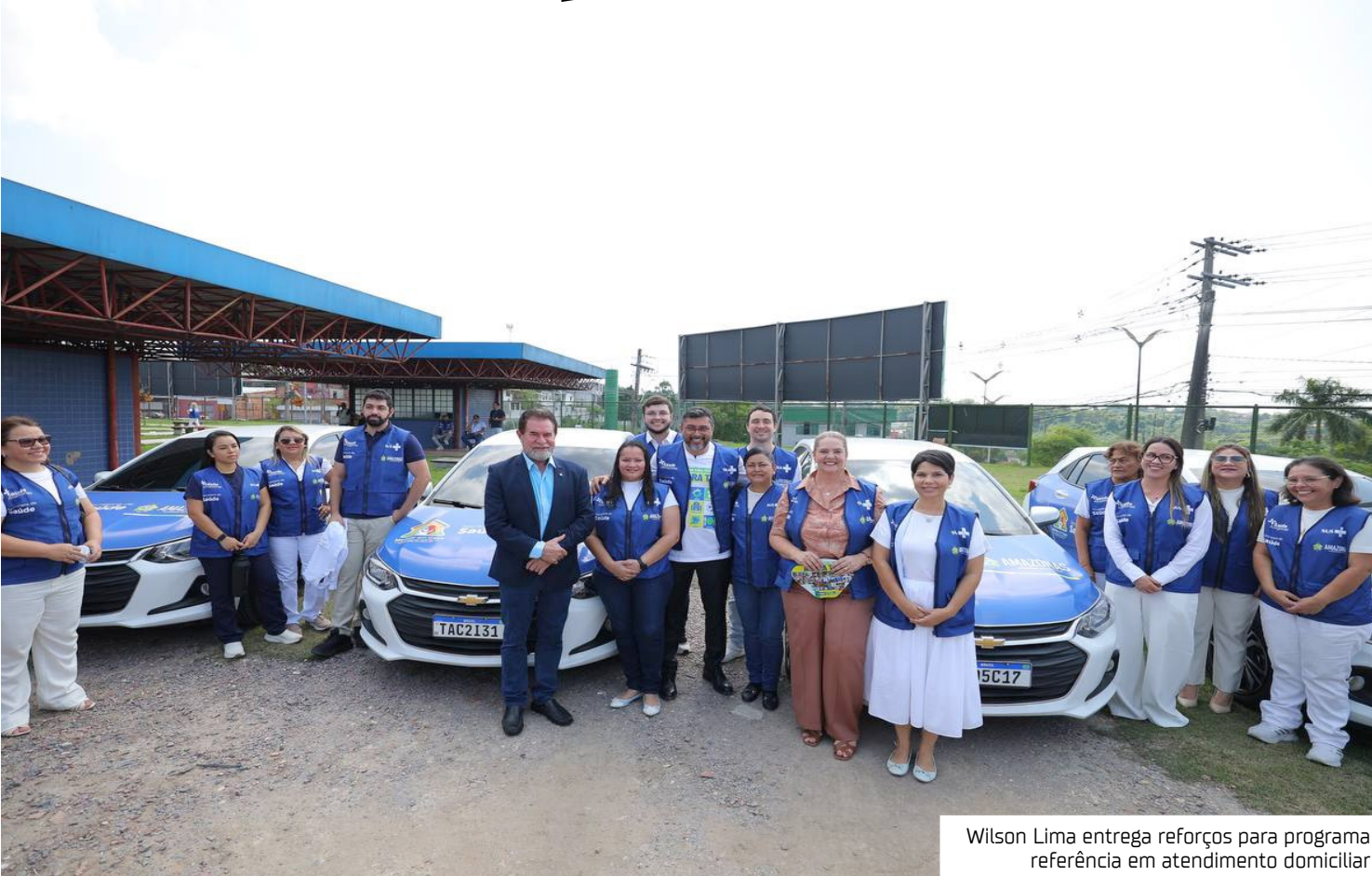
Wilson Lima entrega reforços para programa referência em atendimento domiciliar

melhor estar em casa, no seio familiar, recebendo o atendimento e toda a nossa estrutura especializada”, afirmou Wilson Lima. O programa oferece assistência contínua e personalizada e, atualmente, cerca de 800 pacientes são acompanhados pelos profissionais. Os pacientes atendidos normalmente necessitam de cuidados de longo prazo, em muitos casos dependendo de aparelhos respiratórios, traqueostomia ou ostomia. O fortalecimento da estrutura inclui a entrega de 22 novos veículos, que modernizam o deslocamento das equipes e reduzem o tempo de resposta nas visitas. Os carros estão distribuídos entre as nove bases do programa em Manaus, localizadas em unidades como a Fundação de Medicina Tropical, FCEcon, Complexos Hospitalares Norte, Sul e Leste, Hospital Francisca Mendes, HPS Platão Araújo, Hospital da Criança da Zona Sul e SPA Zona Sul. Atualmente, o Melhor em Casa conta com 24 equipes multiprofissionais, totalizando cerca de 300 profissionais entre médicos, enfermeiros, técnicos de enfermagem, fisioterapeutas, nutricionistas, assistentes sociais, dentistas e pessoal de apoio. As equipes atuam de forma contínua, sete dias por semana, garantindo atendimento ininterrupto aos pacientes. São investidos anualmente