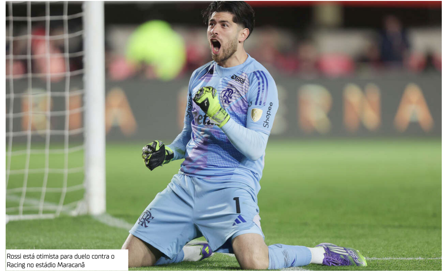
Rossi está otimista para duelo contra o Racing no estádio Maracanã

Em meio aos problemas de Filipe Luís para escalar o time, o goleiro Agustín Rossi projetou a partida e lembrou bons mo-