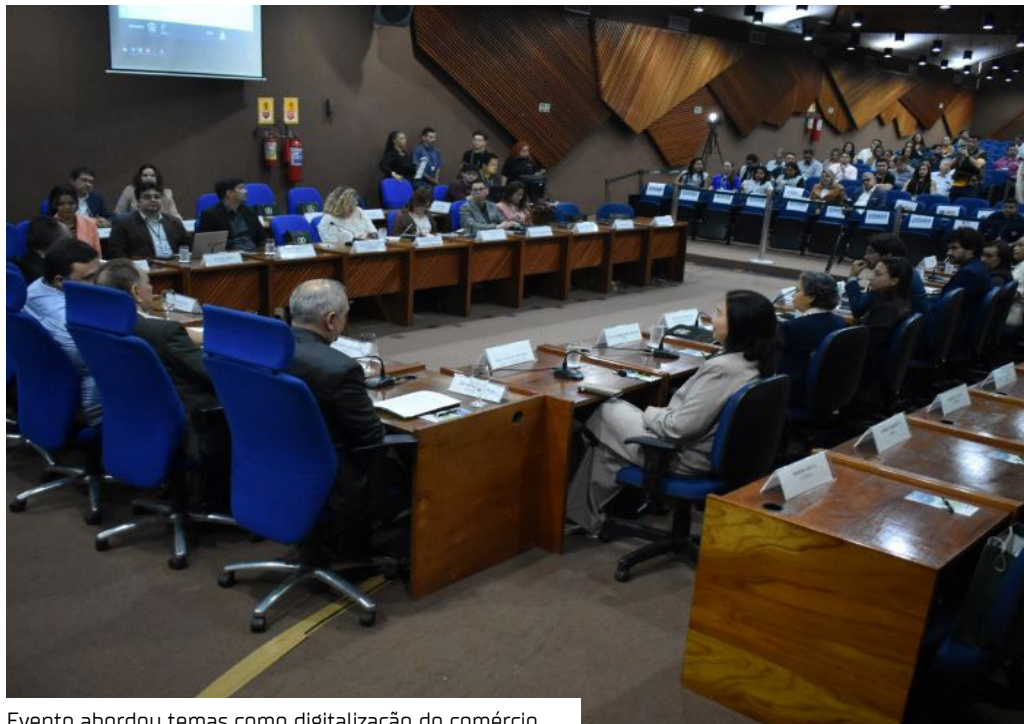
Evento abordou temas como digitalização do comércio

A Superintendência da Zona Franca de Manaus (Suframa) sediou, ontem (21), o 1º Fórum de Comércio Exterior na Amazônia, evento promovido pelo Centro da Indústria do Estado do Amazonas (Cieam). O encontro reuniu diretores de empresas do Polo Industrial de Manaus (PIM), autoridades e especialistas para discutir os impactos da Indústria 5.0 na competitividade, inovação e sustentabilidade da região.