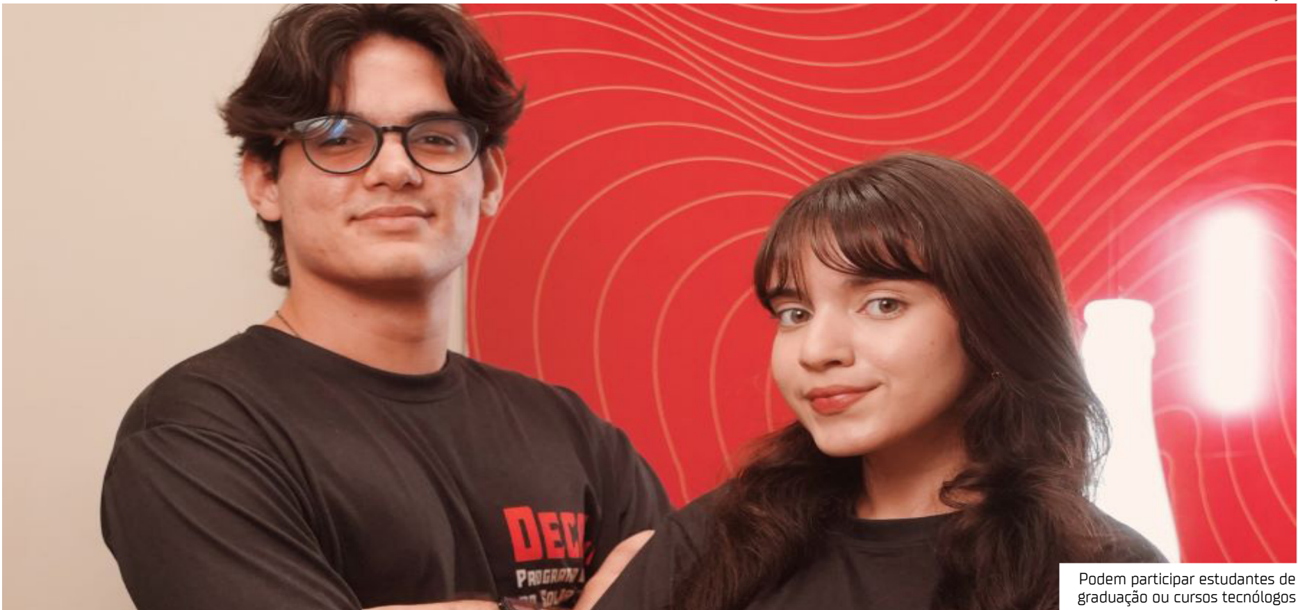
Podem participar estudantes de graduação ou cursos tecnológicos