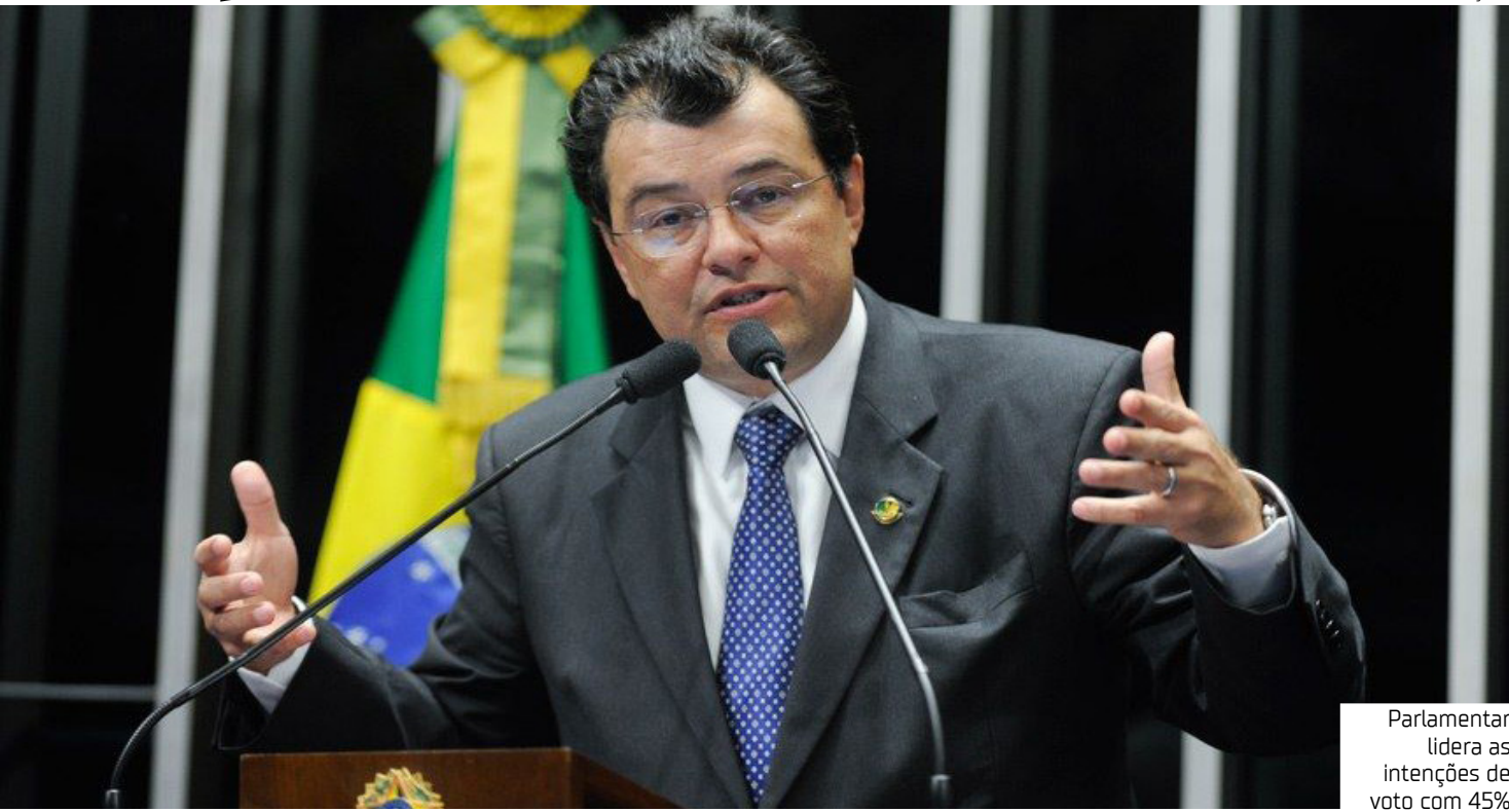
Parlamentar lidera as intenções de voto com 45%

Outros 26% preferem dois senadores alinhados à direita, 12% optariam por um senador de direita e outro de esquerda, 7% preferem dois senadores alinhados à esquerda, e 13% não souberam ou não quiseram responder.