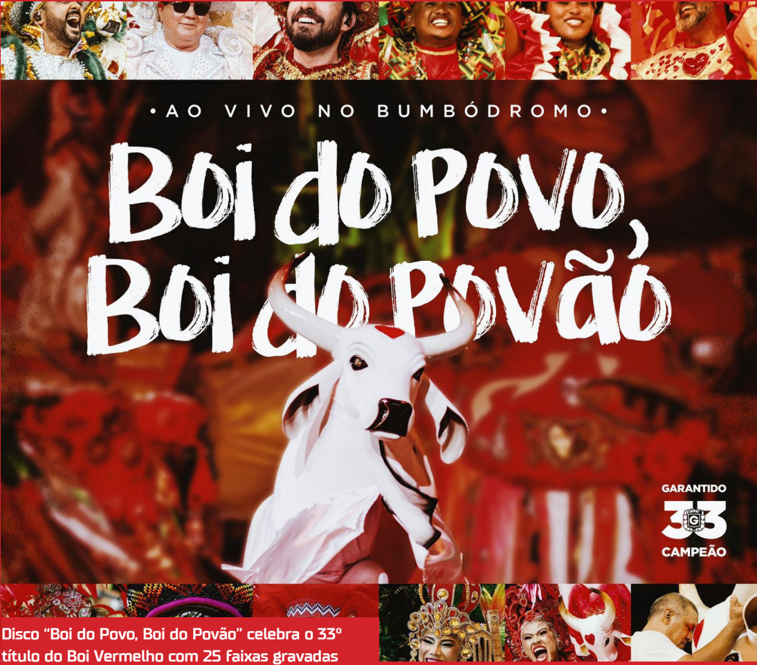
Disco “Boi do Povo, Boi do Povão” celebra o 33º título do Boi Vermelho com 25 faixas gravadas