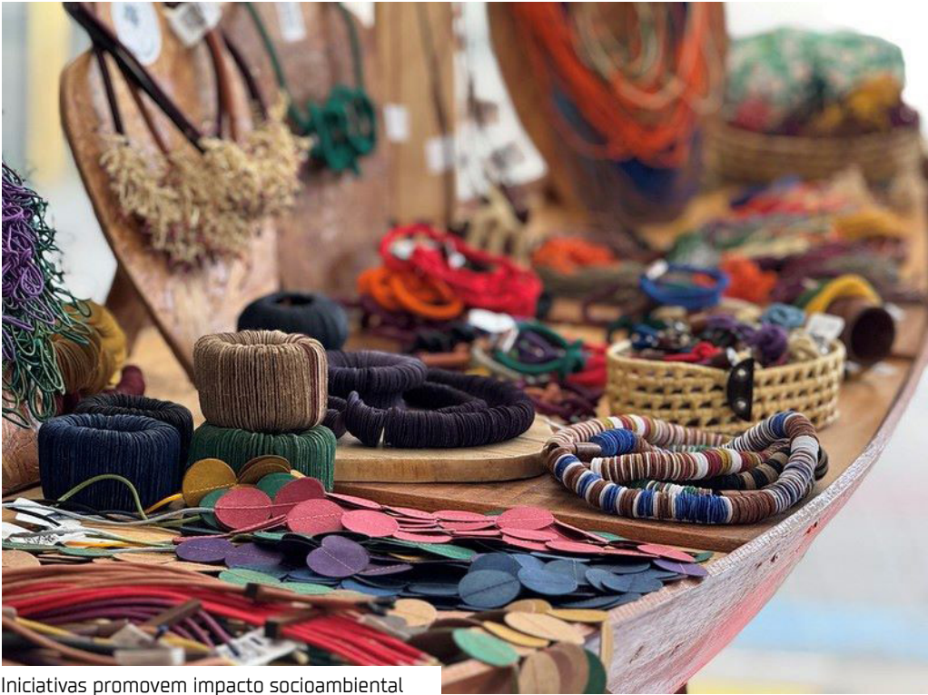
Iniciativas promovem impacto socioambiental