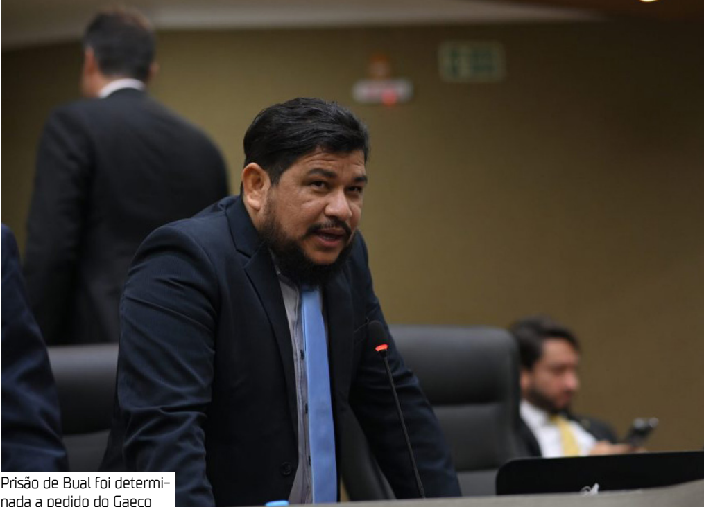
Prisão de Bual foi determinada a pedido do Gaeco

A prisão de Bual foi determinada a pedido do Grupo de Atuação Especial de Combate ao Crime Organizado (Gaeco).