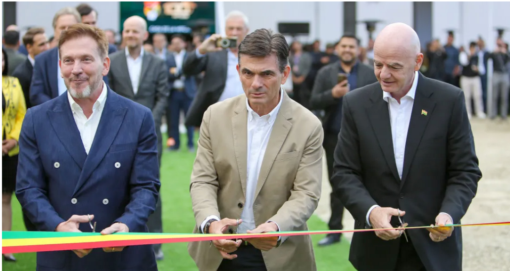
Presidente da Fifa não soube informar qual competição será sediada na Bolívia