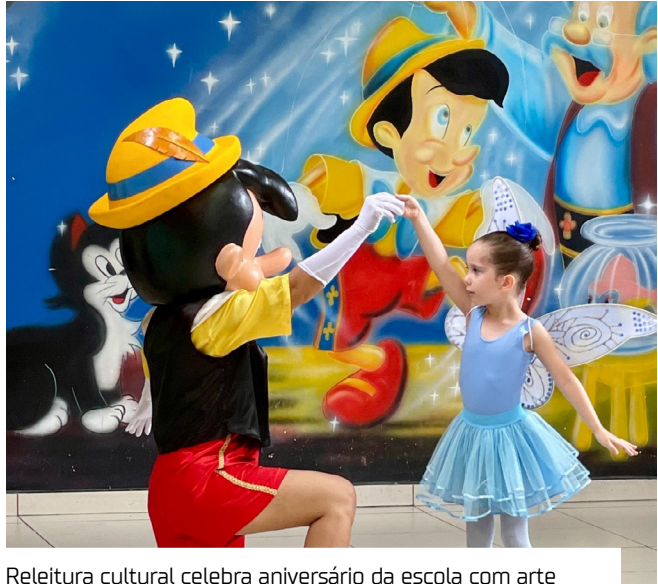
Releitura cultural celebra aniversário da escola com arte