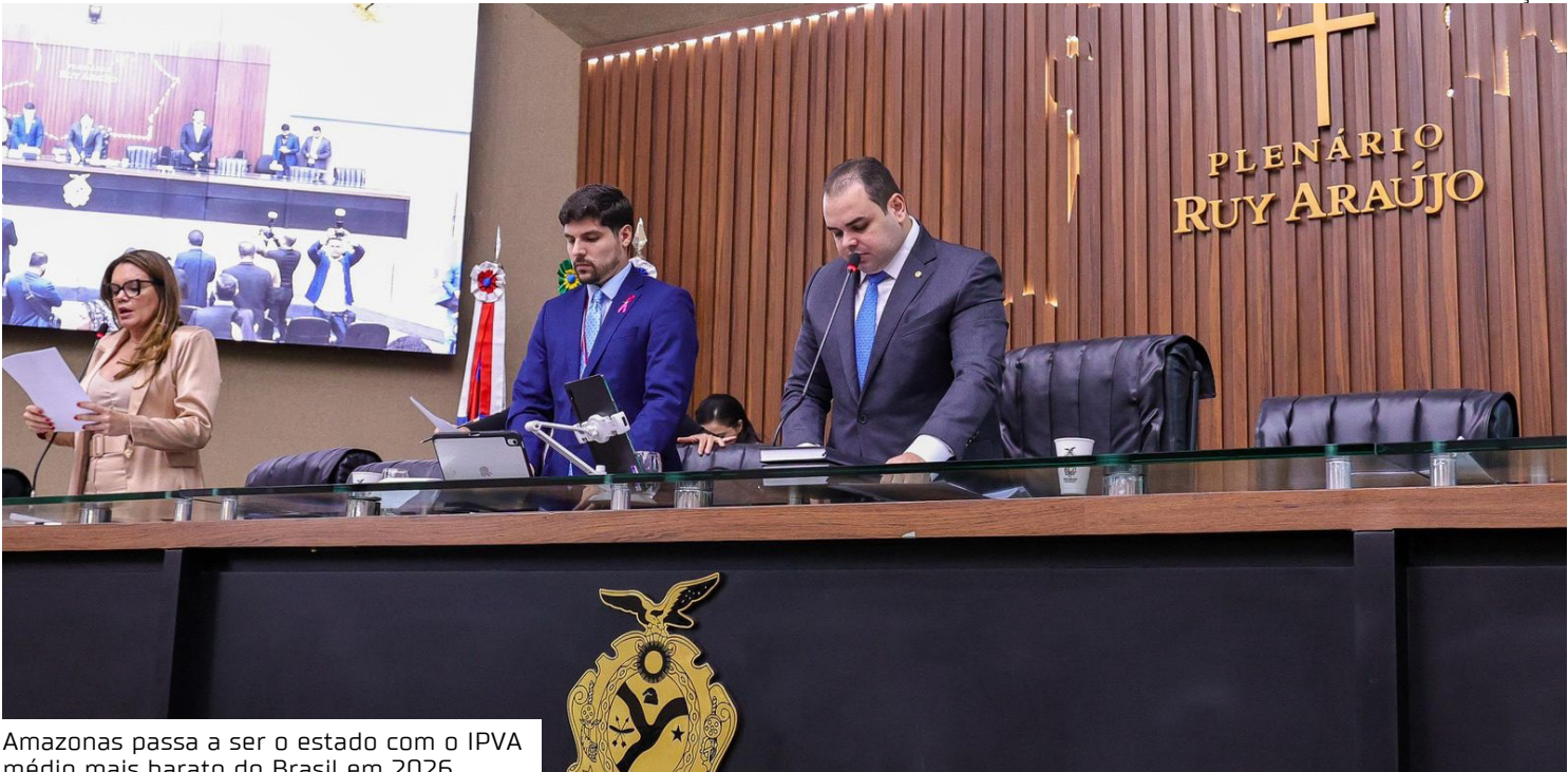
Amazonas passa a ser o estado com o IPVA médio mais barato do Brasil em 2026

Além da redução do IPVA, foram aprovadas alterações no Imposto sobre Transmissão Causa Mortis e Doação