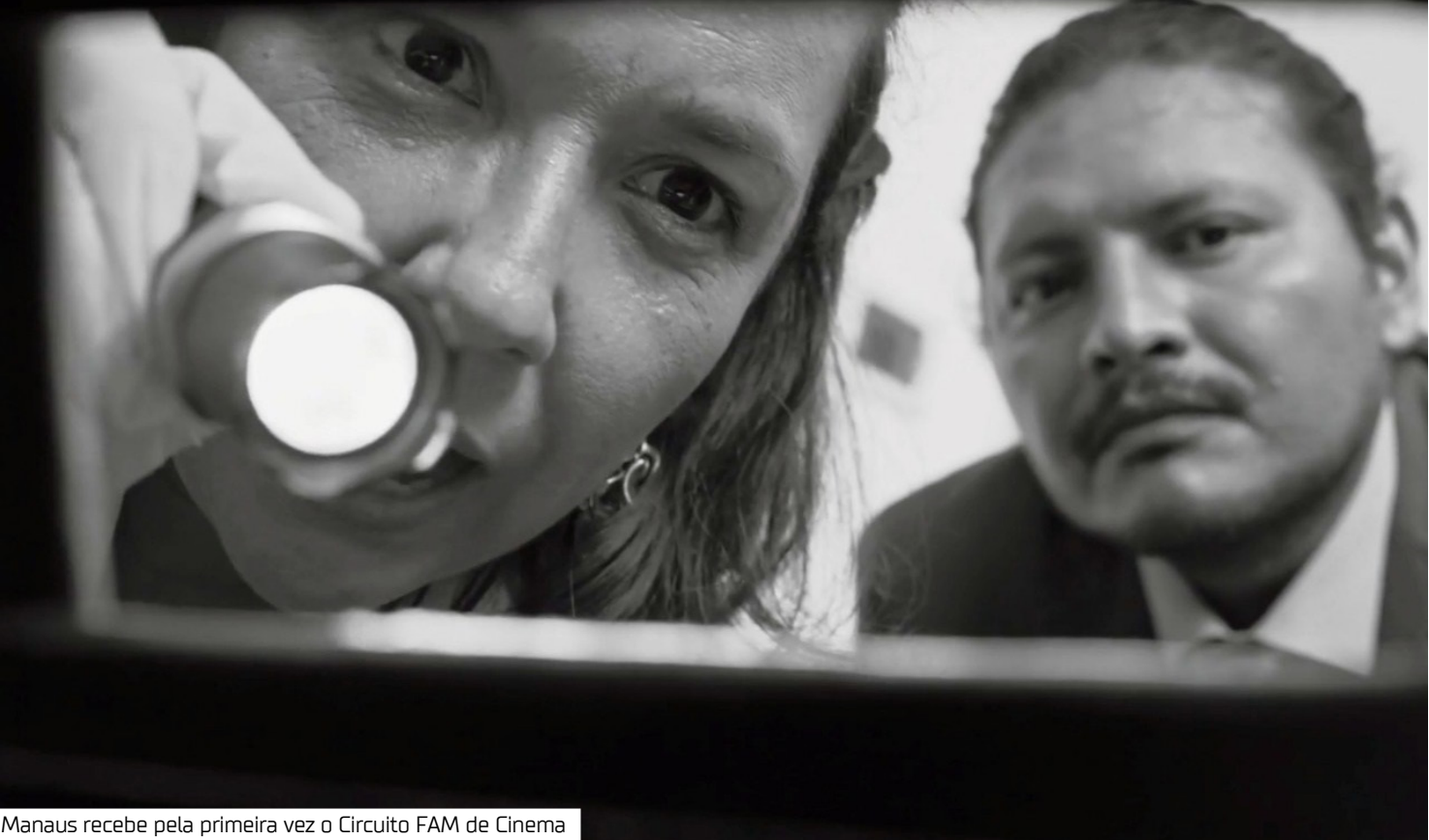
Manaus recebe pela primeira vez o Circuito FAM de Cinema