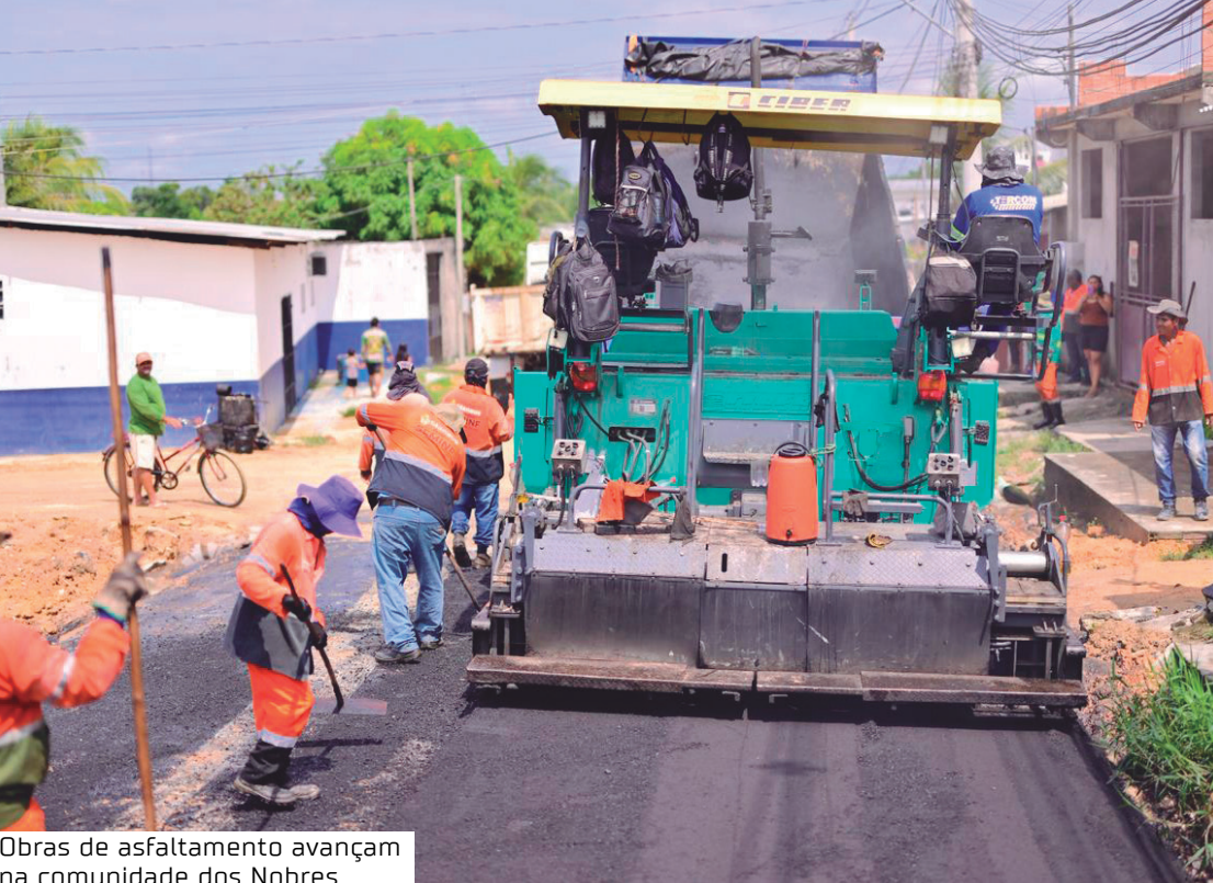
Obras de asfaltamento avançam na comunidade dos Nobres