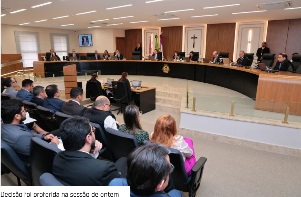
Decisão foi proferida na sessão de ontem