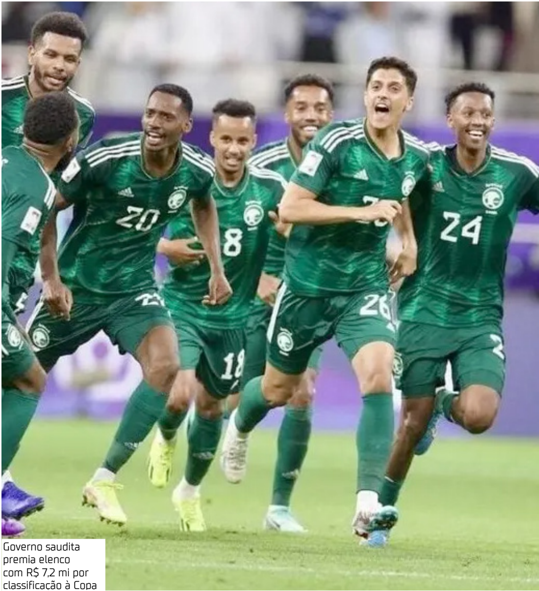
Governo saudita premia elenco com R$ 7,2 mi por classificação à Copa