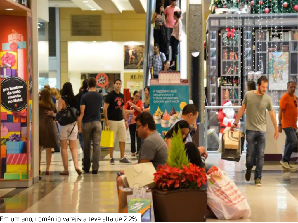
Em um ano, comércio varejista teve alta de 2,2%