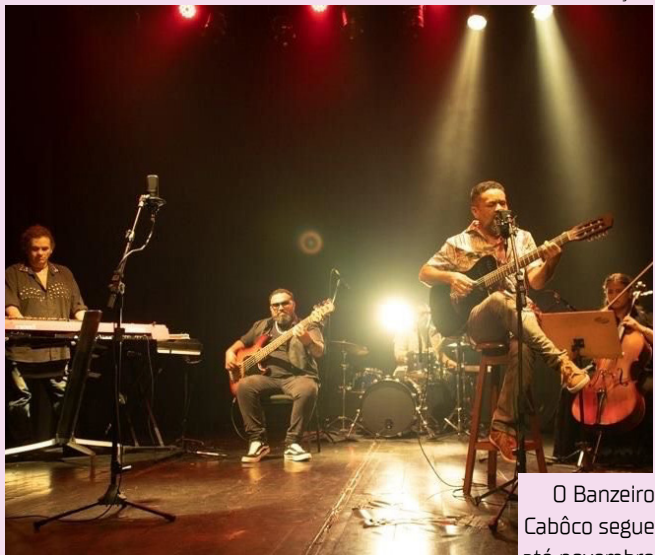
O Banzeiro Cabôco segue até novembro