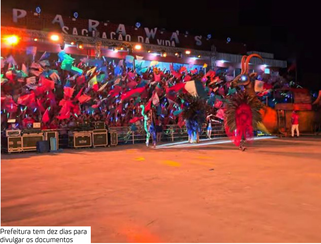
Prefeitura tem dez dias para divulgar os documentos