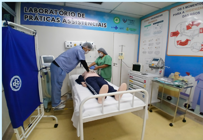
CST visa ao aperfeiçoamento prático e contínuo das equipes técnicas

O Centro de Simulação do HPS Platão Araújo faz parte do Núcleo de Educação Permanente (NEP) da unidade. O NEP promove treinamentos mensais, visando ao aprimoramento de médicos, enfermeiros, técnicos de enfermagem, fisioterapeutas, entre outros profissionais.