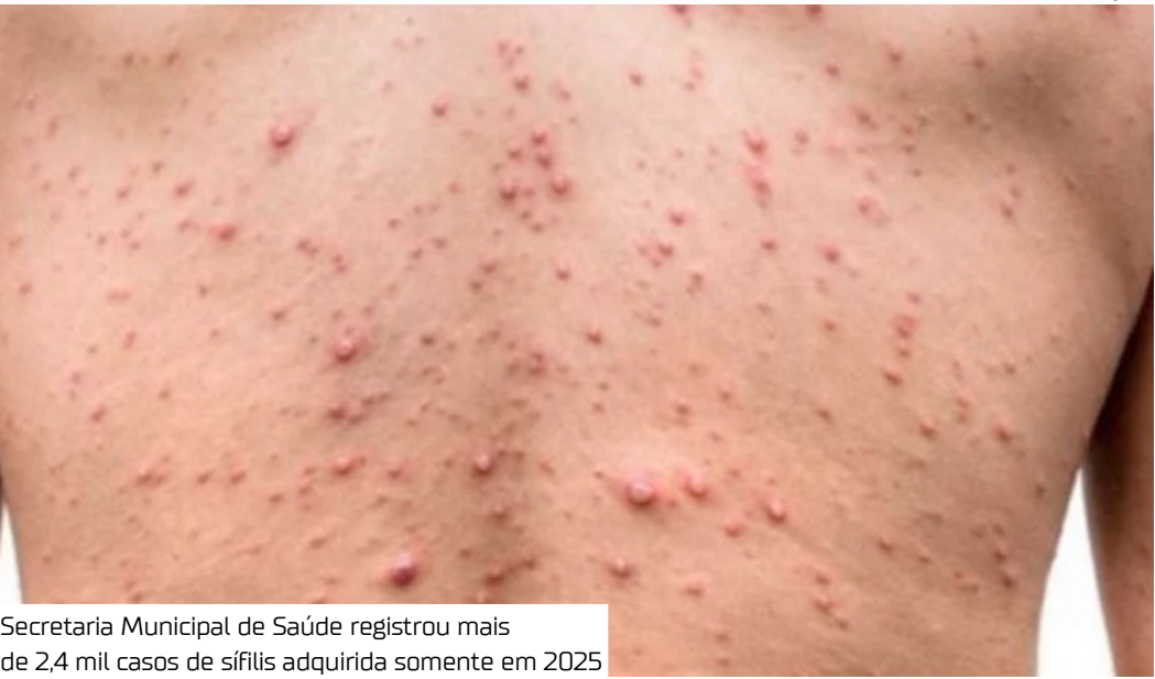
Secretaria Municipal de Saúde registrou mais de 2,4 mil casos de sífilis adquirida somente em 2025

Manaus registrou 2.479 casos de sífilis adquirida em 2025, segundo dados da Secretaria Municipal de Saúde (Semsu). A maior parte dos casos (63,7%) ocorre entre pessoas de 20 a 39 anos, seguida pelos grupos de 40 a 59 anos (22,4%), 10 a 19 anos (8,6%) e acima de 60 anos (5,2%).