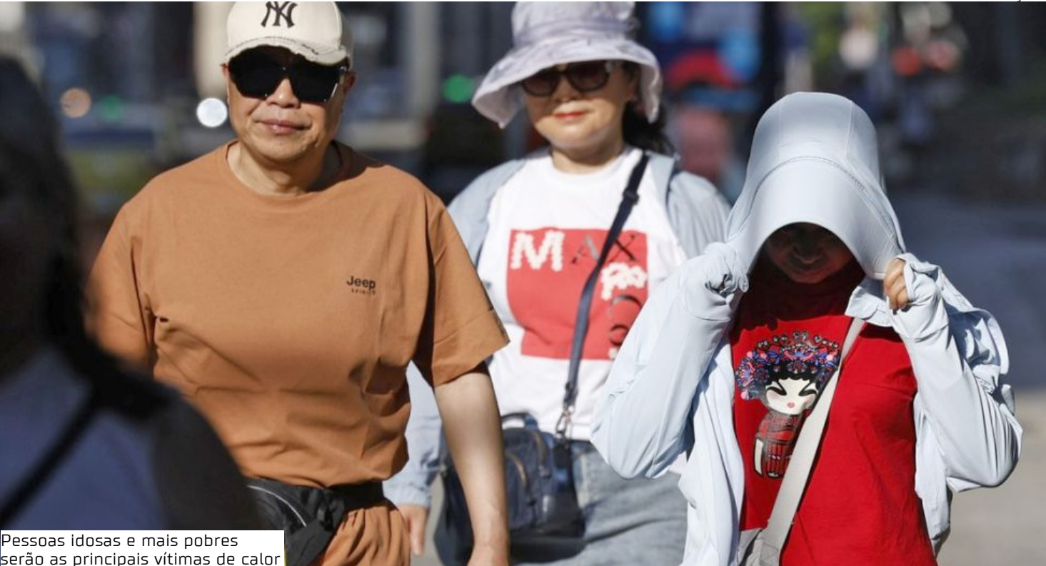
Pessoas idosas e mais pobres serão as principais vítimas de calor

Impactos da desigualdade social No Brasil, foram utilizados dados do Sistema de Informações sobre Mortalidade (SIM), do DataSUS, e do Censo Demográfico, do Instituto Brasileiro de Geografia e Estatística (IBGE). Embora o estudo não forneça recortes por cidade ou grupo popu-