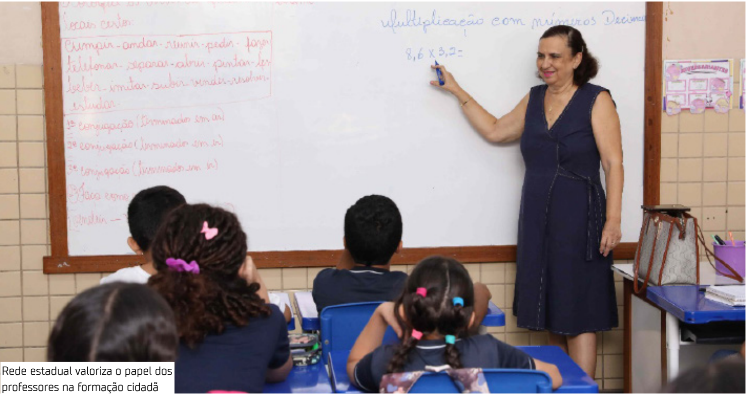
Rede estadual valoriza o papel dos professores na formação cidadã

“Eu era criança e escrevia poemas sobre o verde, sobre a vitória-régia, sobre coisas que eu nunca tinha visto, apenas lido. Quando tive a oportunidade de vivenciar, não pensei duas vezes. Ser professora em Presidente Figueiredo é estar completa. É a junção de duas paixões, de