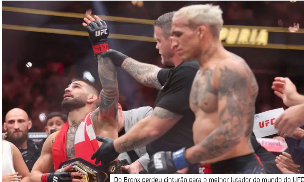
Do Bronx perdeu cinturão para o melhor lutador do mundo do UFC