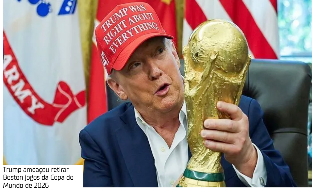
Trump ameaçou retirar Boston jogos da Copa do Mundo de 2026

A prefeita de Boston, Michelle Wu, reagiu à declaração do ex-presidente Donald Trump, que afirmou poder ordenar à Fifa a retirada dos jogos da Copa do Mundo de 2026 programados para o Gillette Stadium, em Foxborough.