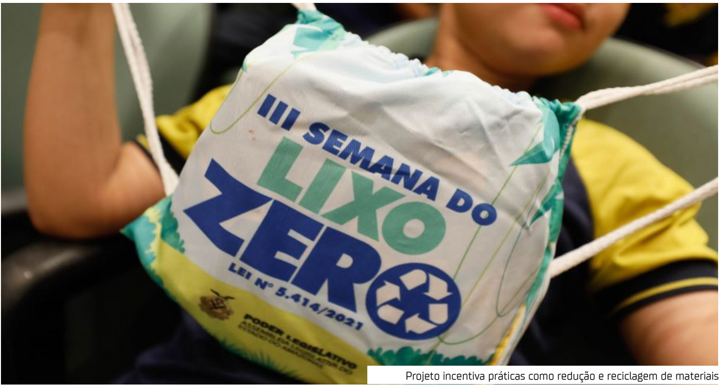
Projeto incentiva práticas como redução e reciclagem de materiais

tado para estudantes do ensino médio de quatro escolas estaduais, que já desenvolvem projetos relacionados à temática ambiental. “A escolha dessas unidades de ensino se deu porque elas já realizam atividades voltadas para a questão ambiental, educando as novas gerações sobre a urgência em preservar”, destacou Lasmar. Durante o evento, os jovens participarão de uma manhã de aprendizado lúdico, com destaque para a apresentação teatral da Cia de Teatro Metamorfose, que abordará de forma criativa e reflexiva a importância da preservação ambiental. Ao final da programação, os estudantes receberão simbolicamente um termo de compromisso como “Guardião do Meio Ambiente”, reforçando o papel ativo da juventude na construção de um futuro mais sustentável. O programa “Lixo Zero” incentiva práticas como redução, reutilização e reciclagem de materiais, além do reaproveitamento de plásticos e da destinação correta de eletrônicos e óleos vegetais. A proposta foi regulamentada