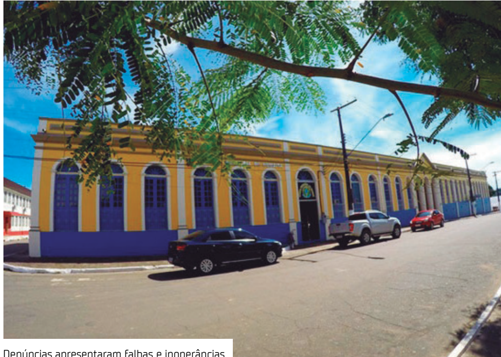
Denúncias apresentaram falhas e inoperâncias

Diante da falta de informações atualizadas que garantam a fiscalização e o controle social dos gastos públicos, o Ministério Público do Estado do Amazonas (MPAM), por meio da 2ª Promotoria de Justiça de Humaitá, ajuizou Ação Civil Pública (ACP).