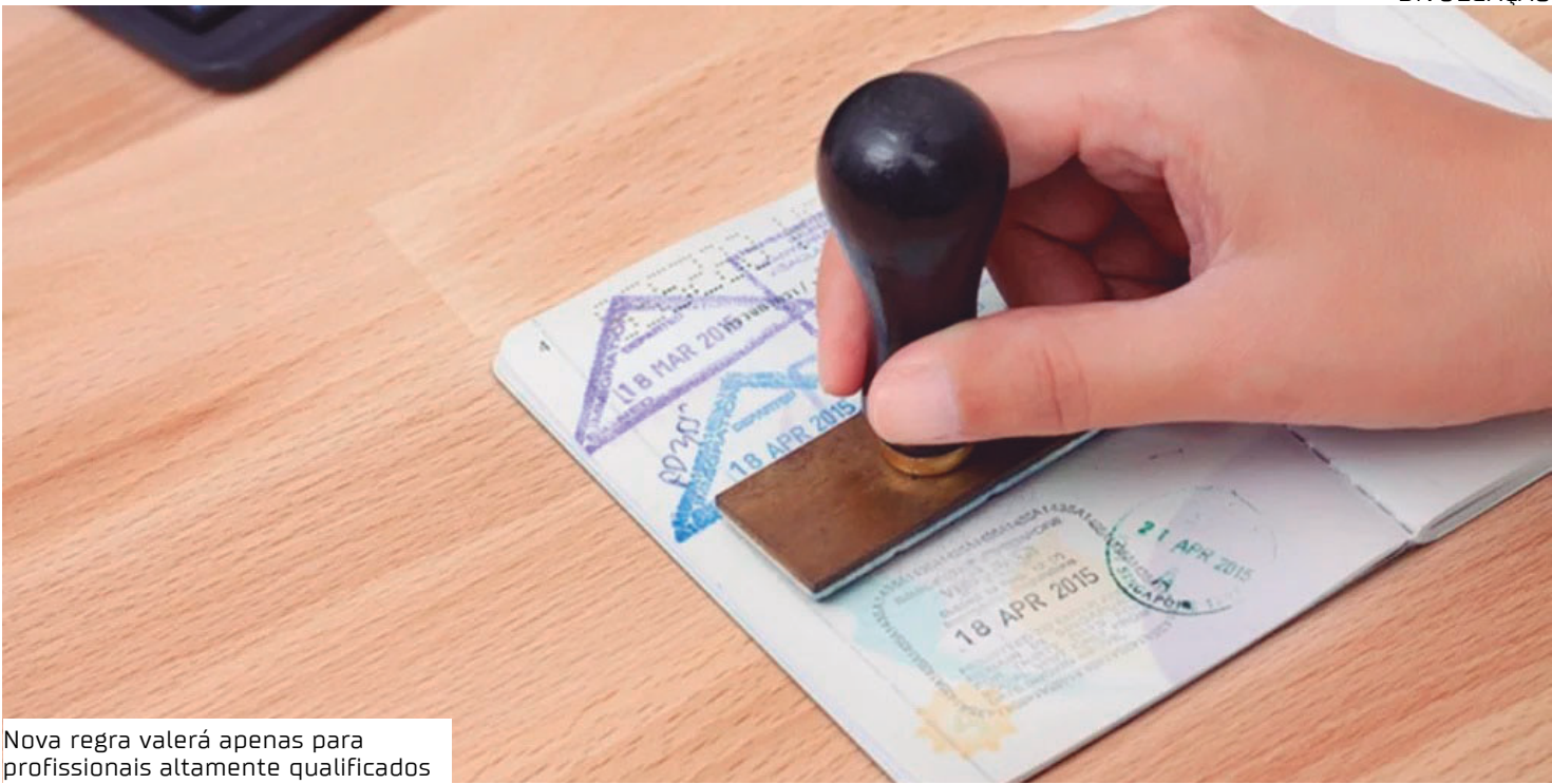
Nova regra valerá apenas para profissionais altamente qualificados

Pacote anti-imigração A suspensão faz parte do pacote anti-imigração aprovado pela Assembleia e sancionado no dia 16 de outubro pelo presidente Marcelo Rebelo de Sousa. Entre outras mudanças, o pacote altera as regras para o