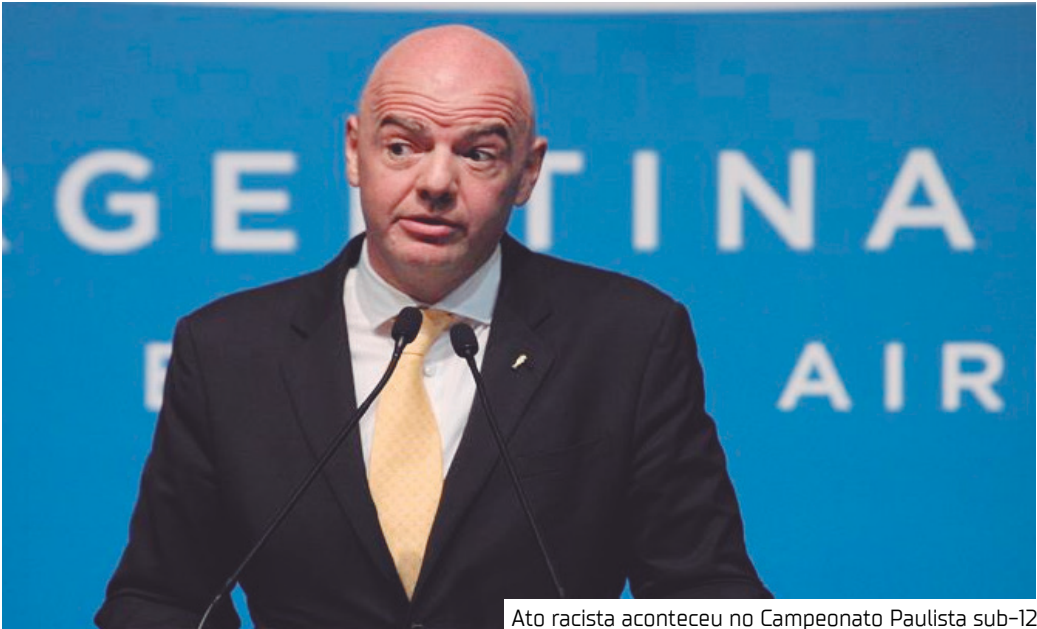
Ato racista aconteceu no Campeonato Paulista sub-12