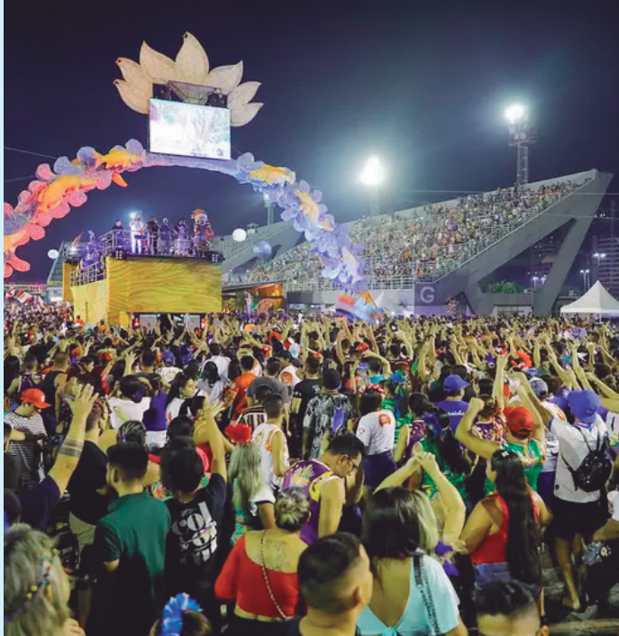
IMMU monta esquema especial de trânsito para o Boi Manaus

Com um planejamento técnico detalhado e a presença constante dos agentes nas ruas, o IMMU reforça seu compromisso com uma Manaus mais organizada, segura e acessível para todos, durante as celebrações que exaltam a cultura e a história da cidade.