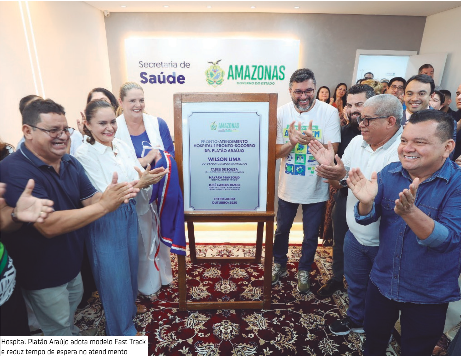
Hospital Platão Araújo adota modelo Fast Track e reduz tempo de espera no atendimento

O novo pronto atendimento também faz parte de um processo mais amplo de modernização do HPS Platão Araújo, que está sob nova gestão