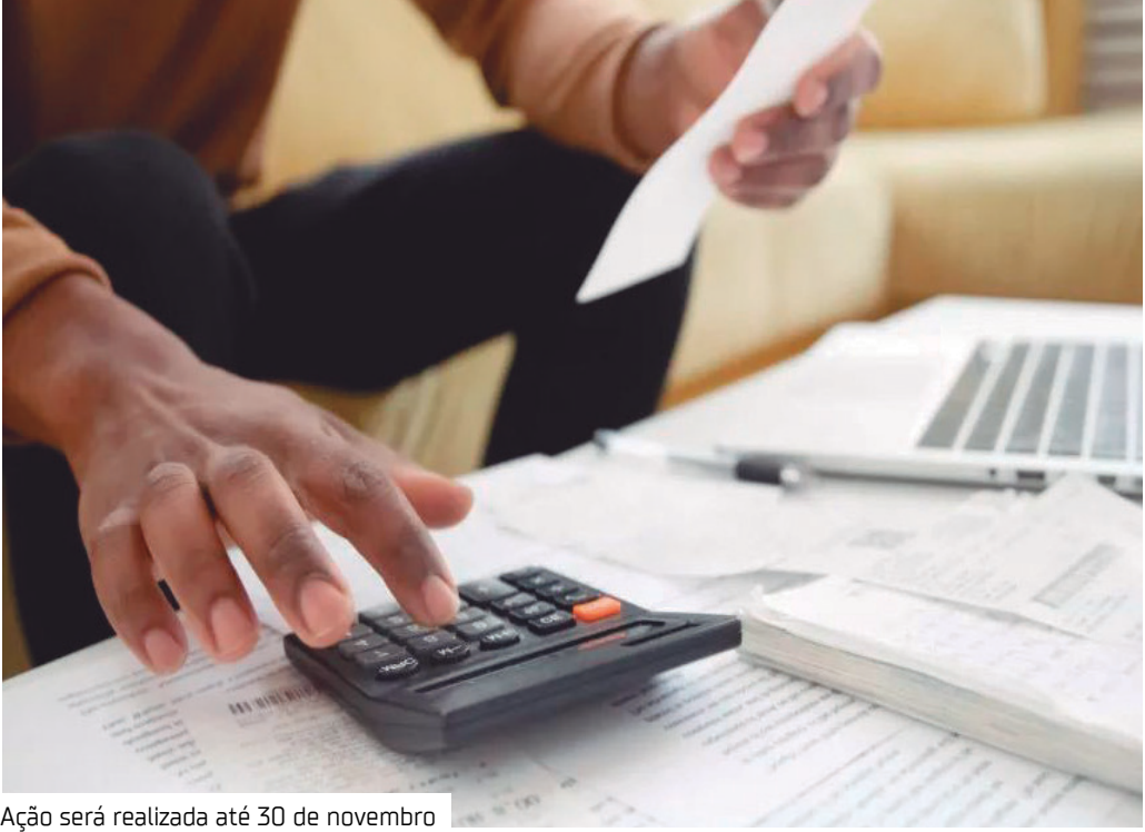
Ação será realizada até 30 de novembro