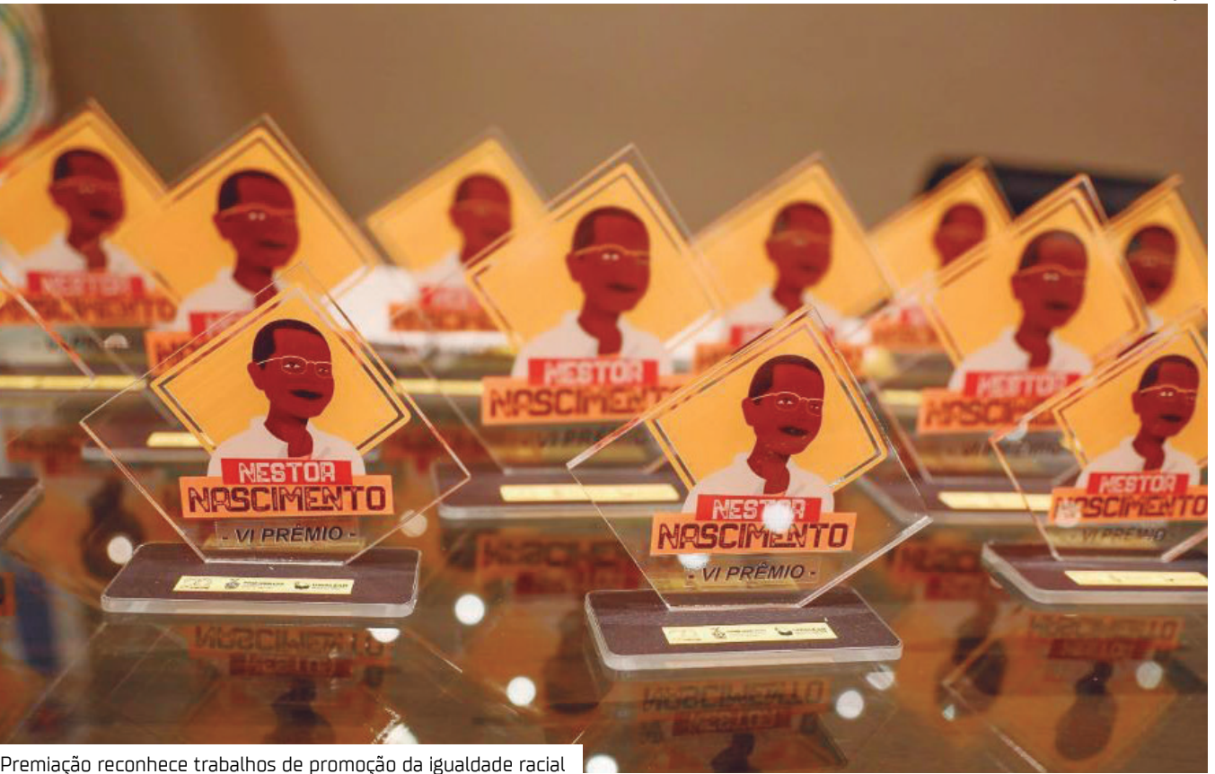
Premiação reconhece trabalhos de promoção da igualdade racial

A sétima edição do Prêmio Nestor Nascimento, promovida pela Assembleia Legislativa do Amazonas (Aleam) por meio da Escola do Legislativo, recebeu 31 inscrições para concorrer às sete categorias previstas em edital.