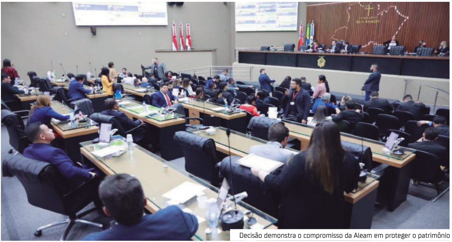
Decisão demonstra o compromisso da Aleam em proteger o patrimônio

De acordo com a Mensagem Governamental nº 98/2025, a ampliação dos limites de isenção e a consequente redução da carga tributária contribuem