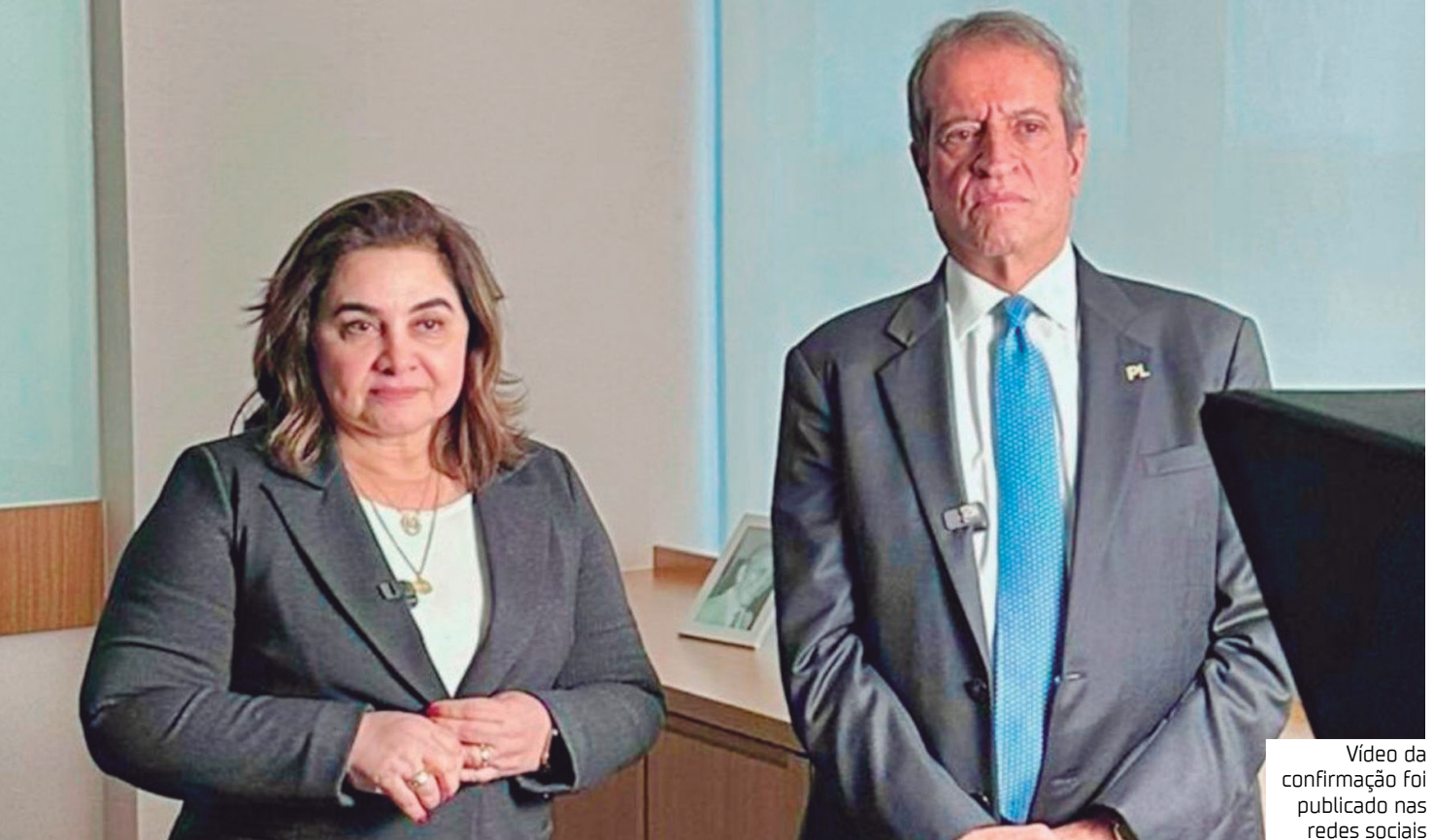
Vídeo da confirmação foi publicado nas redes sociais