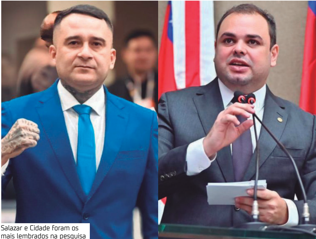
Salazar e Cidade foram os mais lembrados na pesquisa

A sondagem é considerada um importante termômetro inicial, já que revela quem possui uma presença consolidada na mente do eleitor.