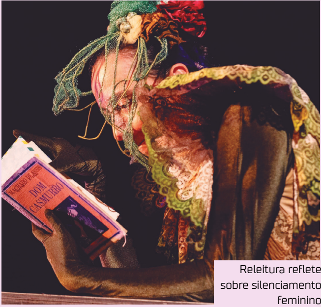
Releitura reflete sobre silenciamento feminino

Obrigada a estudar Dom Casmurro para uma prova decisiva, Ana encontra no romance pontos de contato com sua realidade. É nesse cruzamento entre ficção e vida que surge em cena Capitu, figura icônica da literatura brasileira, agora livre para falar em primeira pessoa.