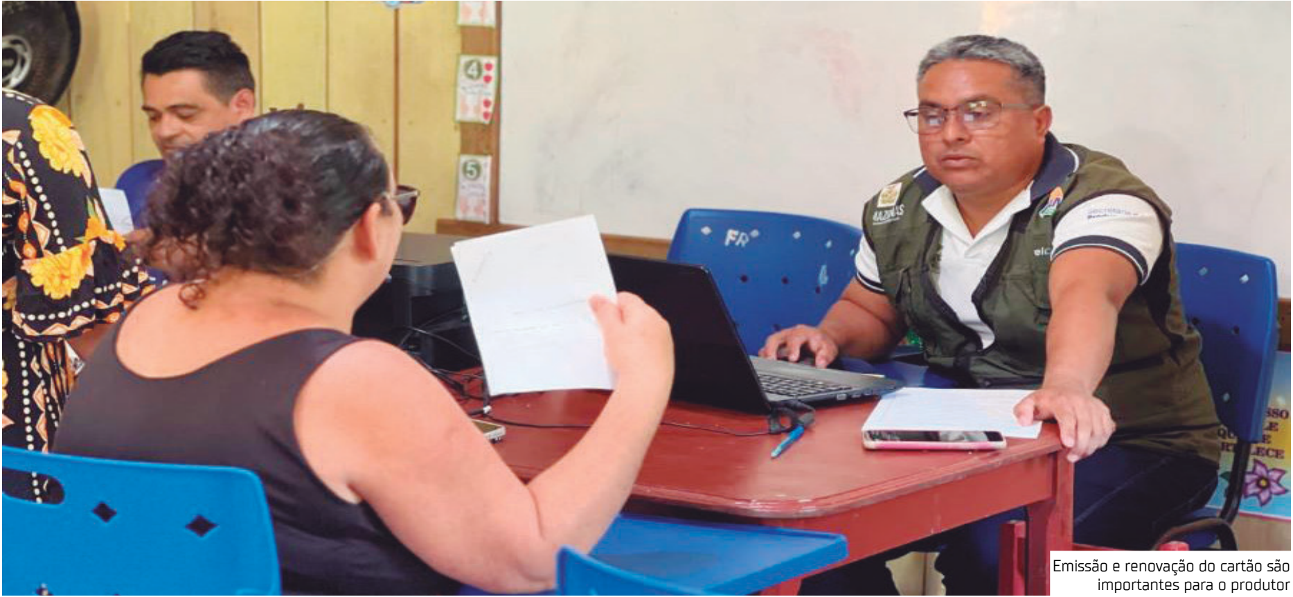
Emissão e renovação do cartão são importantes para o produtor

“O cartão concede isenção de ICMS (Imposto de Circulação de Mercadorias e Serviços) na aquisição de insumos, máquinas e equipamentos para o uso na produção de atividades rurais, permite a dispensa da cobrança de ICMS antecipado nas aquisições de insumos em outros estados e possibilita o desconto de