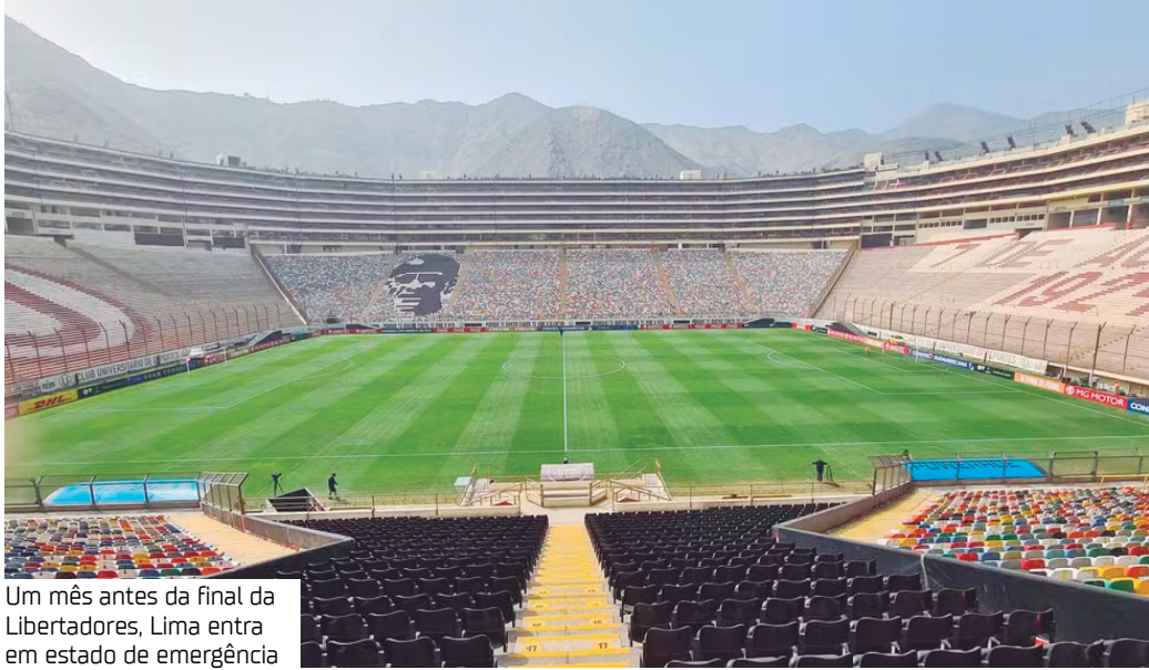
Um mês antes da final da Libertadores, Lima entra em estado de emergência

A cidade de Lima, capital do Peru, entrou em estado de emergência ontem (22). O anúncio foi feito pelo presidente do país, José Jerí, para conter a onda de criminalidade na cidade. A medida serve como resposta aos protestos que pedem por ações contra a violência na capital. O ato tem efeito de 30 dias e termina dias antes da final da Copa Libertadores, marcada para ser disputada em 29 de novembro, no estádio Monumental de Lima.