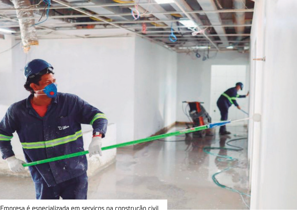
Empresa é especializada em serviços na construção civil