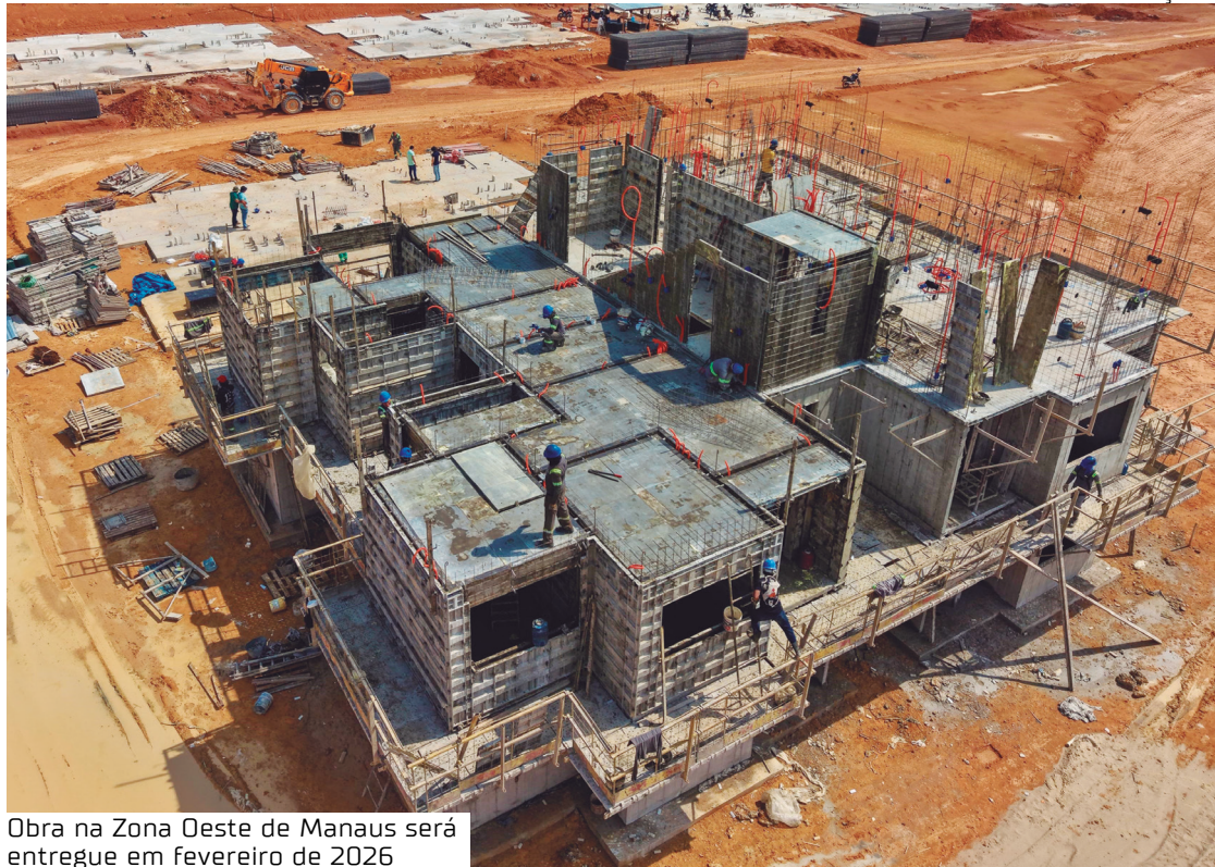
Obra na Zona Oeste de Manaus será entregue em fevereiro de 2026