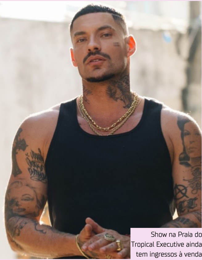
Show na Praia do Tropical Executive ainda tem ingressos à venda

– Front (meia): R$ 140 – Front (duplo): R$ 220 – Backstage (meia, com open bar): R$ 350 – Camarote fechado (15 pessoas): R$ 5.000 A turnê “Nume” já passou por 22 cidades brasileiras desde agosto e traz o repertório dos álbuns “Nume” (2024) e “Nume Epílogo” (2025). Mais conceitual e pessoal, a nova fase encerra a trilogia iniciada com “Imaterial” (2021) e “Lume” (2022), consolidando um dos momentos mais criativos da carreira do artista.