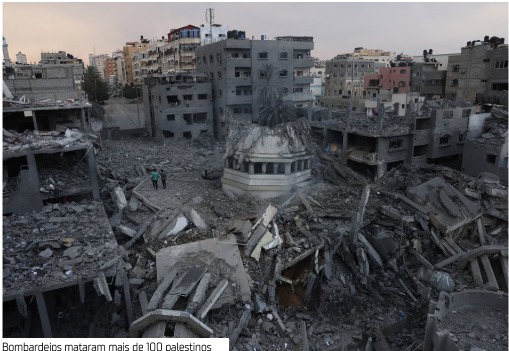
Bombardeios mataram mais de 100 palestinos

O Exército de Israel afirmou ter retomado o cessar-fogo na Faixa de Gaza ontem (29), um dia depois de o governo do primeiro-ministro Binyamin Netanyahu ordenar novos ataques aéreos contra alvos no território. As ofensivas escancararam a fragilidade da trégua estabelecida no último dia 10. Os bombardeios mataram 104 pessoas, segundo autoridades palestinas, e representaram o episódio mais grave desde o início do acordo entre Israel e Hamas. A Defesa Civil de Gaza, controlada pelo grupo terrorista,