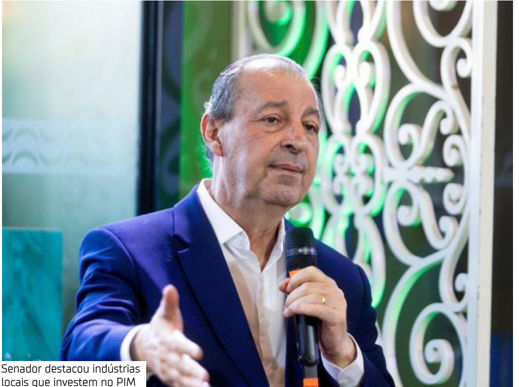
Senador destacou indústrias locais que investem no PIM