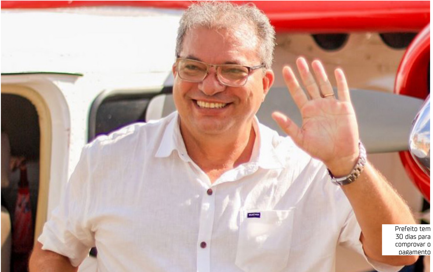
Prefeito tem 30 dias para comprovar o pagamento

O Tribunal manteve a decisão de que o prefeito deve ressarcir os recursos pelos prejuízos causados e pagar