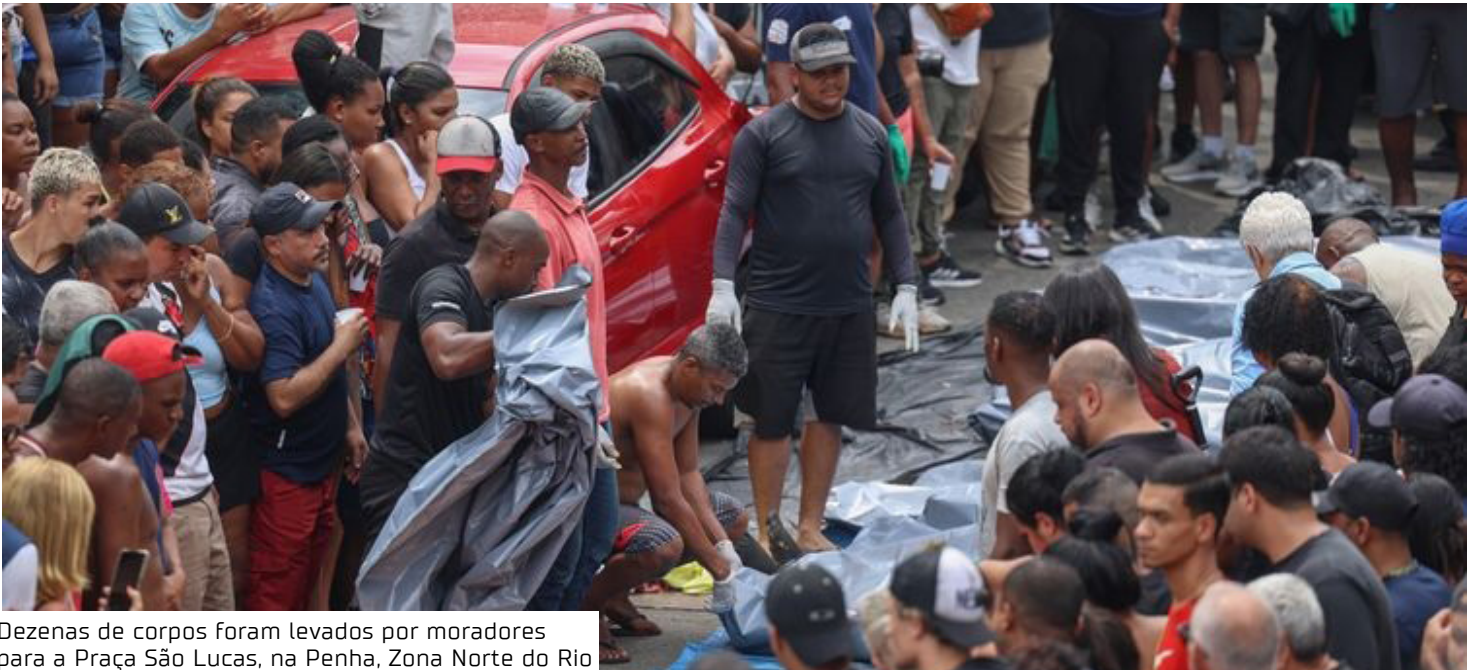
Dezenas de corpos foram levados por moradores para a Praça São Lucas, na Penha, Zona Norte do Rio

Moradores do Complexo da Penha, na Zona Norte do Rio, afirmaram ter encontrado pelo menos 74 corpos na Praça São Lucas, na Estrada José Rucas — uma das principais vias da região — ao longo da madrugada desta quarta-feira (29), um dia após a operação mais letal da história do Rio de Janeiro. O governo havia informado na terça-feira (28) um balanço inicial de 64 mortos, sendo quatro policiais civis e militares. Já na manhã desta quarta, o governador Cláudio