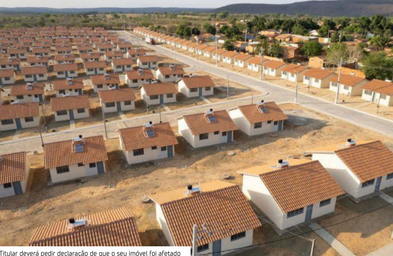
Titular deverá pedir declaração de que o seu imóvel foi afetado

A Comissão de Integração Nacional e Desenvolvimento Regional da Câmara dos Deputados aprovou projeto de lei que suspende o pagamento de financiamentos do programa Minha Casa, Minha Vida para afetados por calamidades públicas.