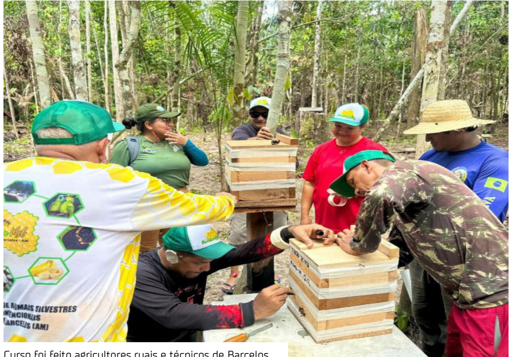
Curso foi feito agricultores ruais e técnicos de Barcelos

Para capacitar agricultores rurais e técnicos para atuarem na meliponicultura, o Instituto de Desenvolvimento Agropecuário e Florestal Sustentável do Estado do Amazonas (Idam) realizou o curso "Boas Práticas na Meliponicultura", no município de Barcelos (a 399 quilômetros de Manaus). A capacitação contou com 20 participantes e teve foco na multiplicação de colônias e regularização da atividade junto aos órgãos ambientais.