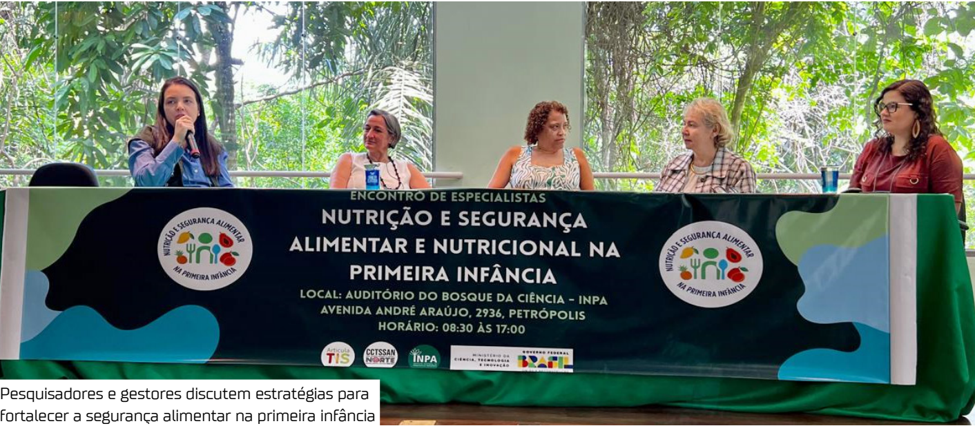
Pesquisadores e gestores discutem estratégias para fortalecer a segurança alimentar na primeira infância

Com foco na redução da mortalidade infantil por desnutrição, a Fundação de Vigilância em Saúde do Amazonas – Dra. Rosemary Costa Pinto (FVS-RCP) participou, ontem (29), do “Encontro de Especialistas: Nutrição e Segurança Alimentar na Primeira Infância”, realizado no Instituto Nacional de Pesquisas da Amazônia (INPA), em Manaus.