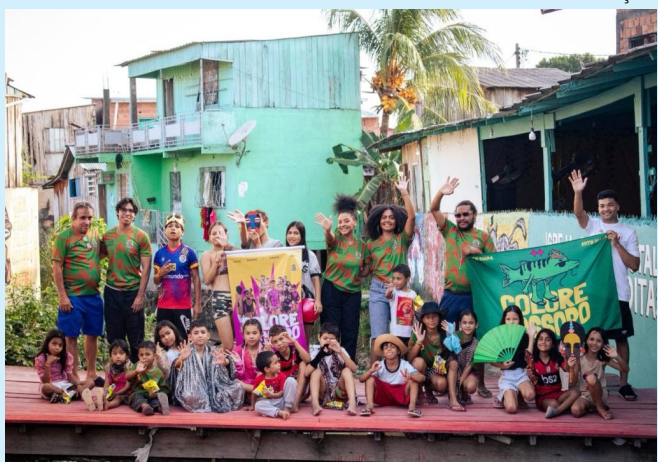
Campanha ‘É Hora de Taxar os Playboys’ acontece em Manaus