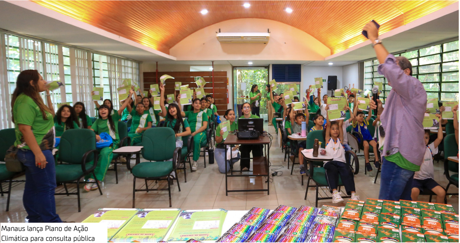
Manaus lança Plano de Ação Climática para consulta pública

Na ocasião, o Instituto Sauim-de-coleira entregou à gestão da cidade um estudo sobre as áreas prioritárias