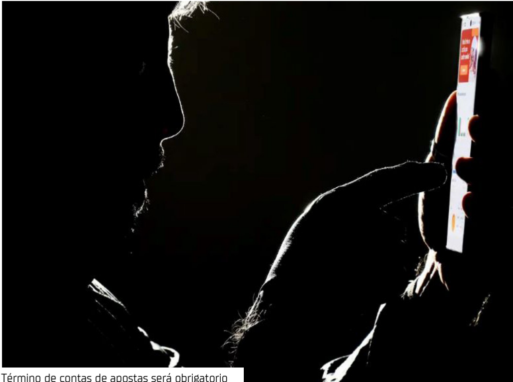
Término de contas de apostas será obrigatório