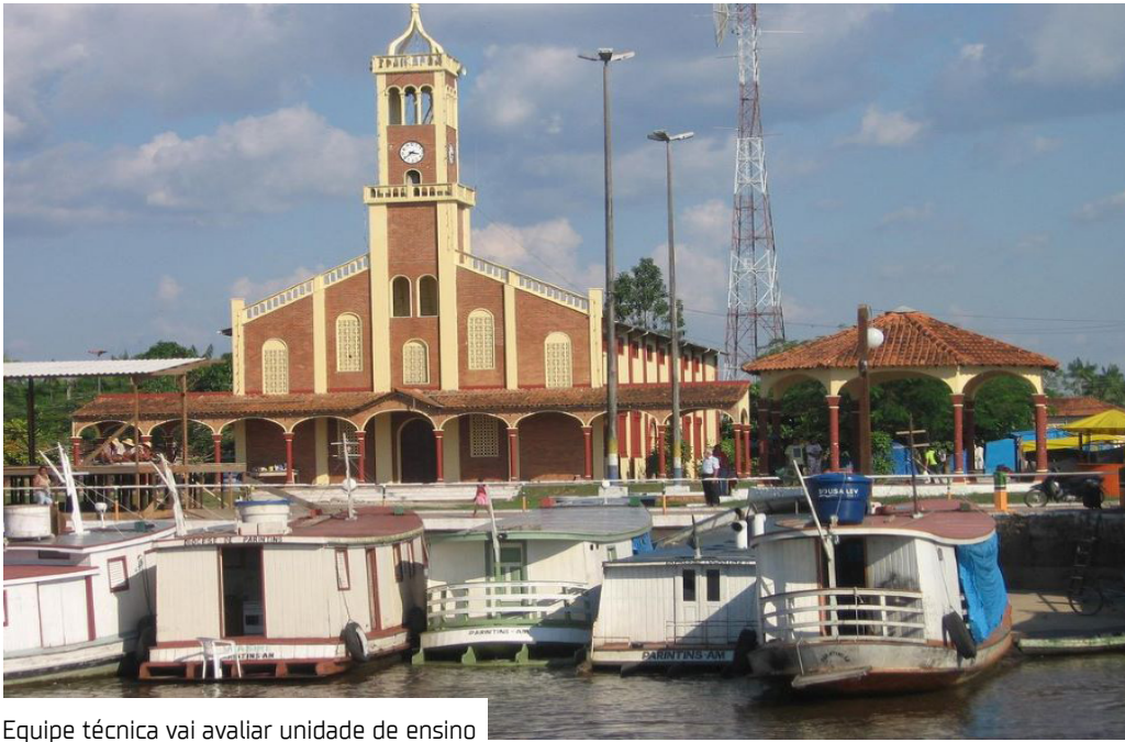
Equipe técnica vai avaliar unidade de ensino

Com o dever de promover e defender os direitos humanos à educação e ao patrimônio público, o Ministério Público do Estado do Amazonas (MPAM), por meio da Promotoria de Justiça da Comarca de Barreirinha (a 328 quilômetros de Manaus) instaurou um inquérito civil com a finalidade de acompanhar as adequações estruturais emergenciais e a construção de novas instalações da Escola Municipal Santo Antônio, situada na comunidade indígena Aldeia Terra Preta. O procedimento tem como base a Notícia de Fato nº 268.2025.000063, assinada pela promotora