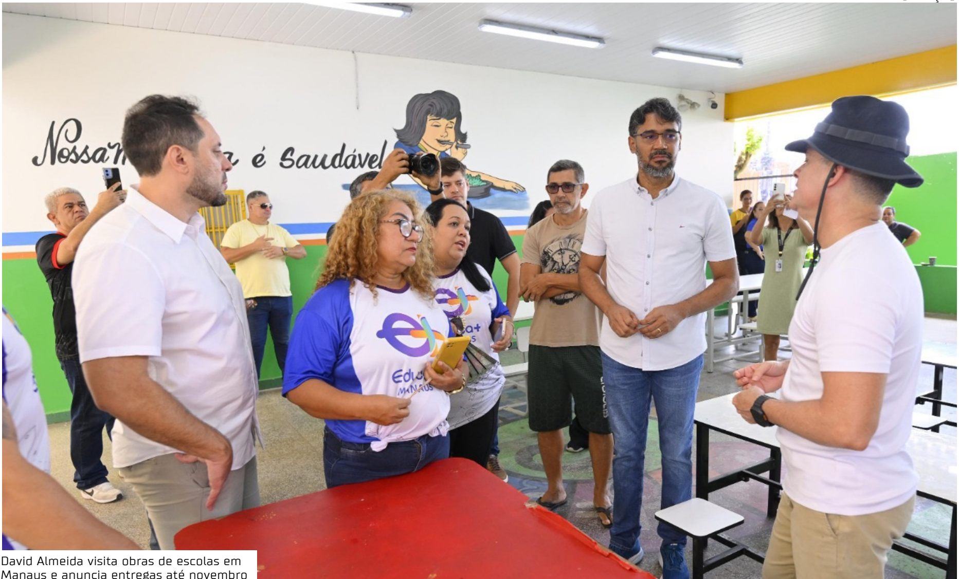
David Almeida visita obras de escolas em Manaus e anuncia entregas até novembro

“Nós fizemos, na manhã de hoje, quatro visitas em zonas diferentes da cidade, em escolas que já estão na fase final de acabamento. Eu vou entregar em 15, 20, 30 dias, até o final do mês de novembro, todas