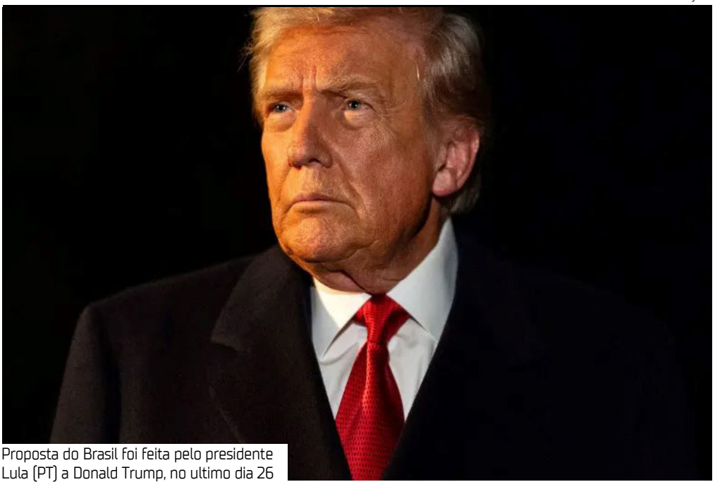
Proposta do Brasil foi feita pelo presidente Lula (PT) a Donald Trump, no último dia 26

torizando a CIA a realizar operações com essa finalidade. Antes de iniciar o encontro com Lula, o americano expressou surpresa com a possibilidade de o assunto ser tratado na conversa. “Eu não acho que vamos discutir Venezuela. Eles [o Brasil] não estão envolvidos em Venezuela. Se eles quiserem, vamos discutir, mas não acho que vamos”, disse Trump. Lula, no entanto, já havia indicado ao americano que trataria do assunto. Em ligação telefônica de cerca de 30 minutos neste mês, o brasileiro mencionou o tema.