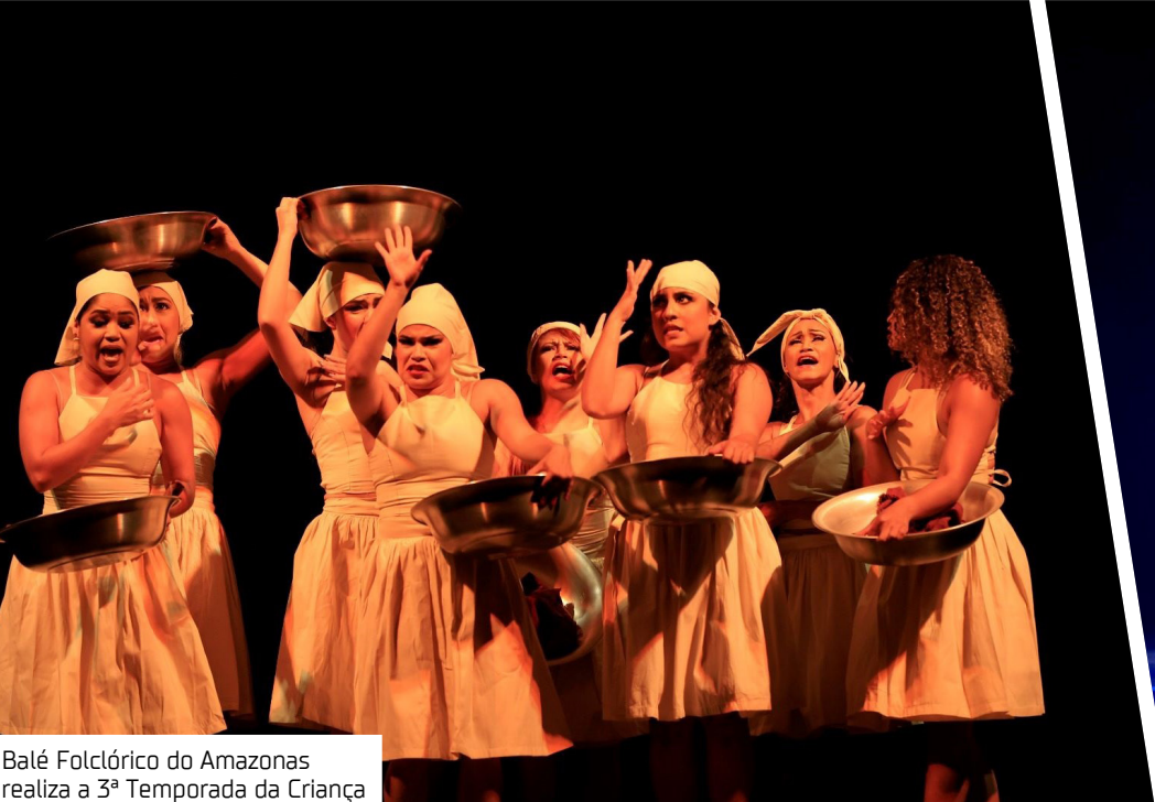
Balé Folclórico do Amazonas realiza a 3ª Temporada da Criança

A partir ontem (29), acontece a 3ª Edição da Temporada da Criança, ação anual do Balé Folclórico do Amazonas (BFA) que busca ampliar o acesso à arte e à cultura entre alunos da rede pública, fortalecendo o vínculo entre educação, criatividade e identidade amazônica. A programação, que segue até sexta-feira (31), apoiada pelo Governo do Amazonas, por meio da Secretaria de Cultura e Economia Criativa, une aprendizado prático e valorização das tradições regionais, oferecendo experiências artísticas formativas desde a infância. A Temporada da Criança é uma ação anual do BFA e integra oficinas de música e dança em escolas públicas, além de apresentações no Teatro da Instalação. O objetivo é levar a arte até os alunos e aproximá-los dos espaços culturais da cidade, despertando o interesse pela expressão artística e pelo patrimônio cultural amazônico.