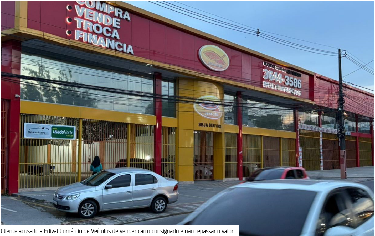
Cliente acusa loja Edival Comércio de Veículos de vender carro consignado e não repassar o valor

Entre as atividades secundárias, constam: - Comércio de automóveis novos; - Serviços de lanternagem e pintura de veículos automotores; - Atuação como corretora e agente de seguros e planos de saúde; - Serviços administrativos