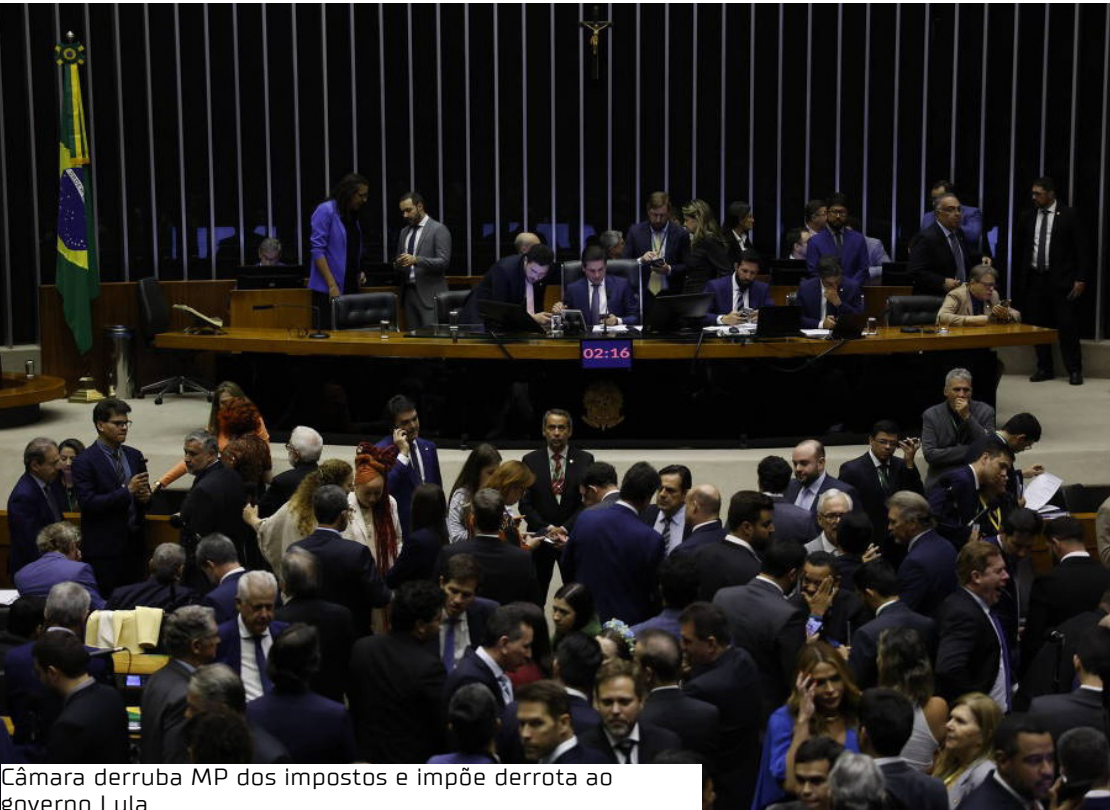
Câmara derruba MP dos impostos e impõe derrota ao governo Lula

Medida provisória previa aumento de arrecadação e corte de gastos