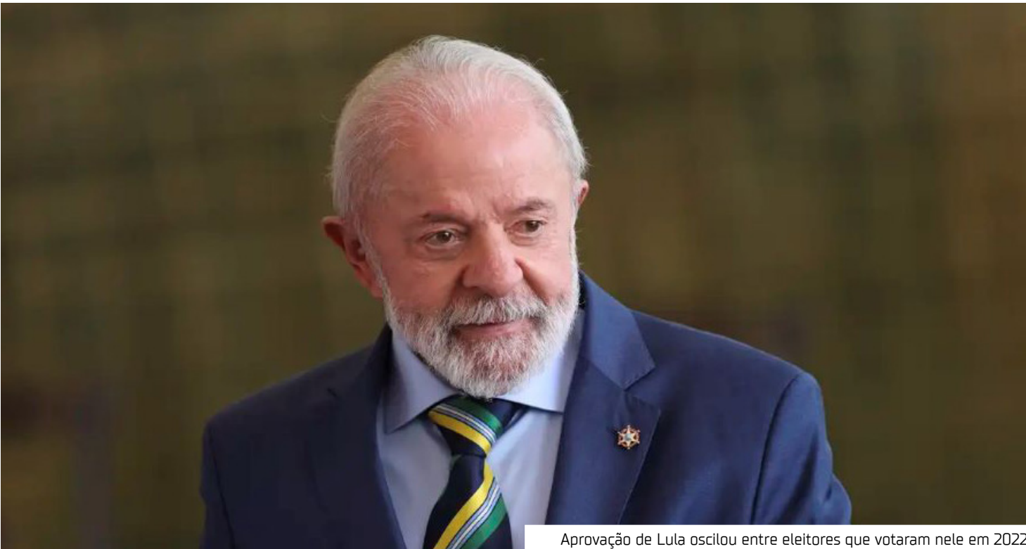
Aprovação de Lula oscilou entre eleitores que votaram nele em 2022

deste ano, quando 17 pontos separavam a avaliação negativa (57%) da positiva (40%). A pesquisa foi encomendada pela Genial Investimentos e ouviu 2.004 pessoas com 16 anos ou mais entre os dias 2 e 5 de outubro. A margem de erro é de 2 pontos para mais ou para menos. O nível de confiança é de 95%. O levantamento aponta que as mulheres voltaram a aprovar mais Lula do que desaprovar: 52% a 45%, indicadores que estavam empatados em 48% no levantamento anterior; Os católicos também voltaram a aprovar mais o governo petista, após empate registrado em setembro: 54% aprovam, e 44%, desaprovam. A margem é de 3 pontos para mais ou menos; Os mais ricos (renda familiar de cinco salários mínimos ou mais) apresentam empate entre os indicadores: 52% desaprova e 45%, aprovam. O público mais desaprovava o governo até setembro. A margem de erro é de quatro pontos. Há empate entre o público de 35 a 59 anos, mas com aprovação e reprovação inver-