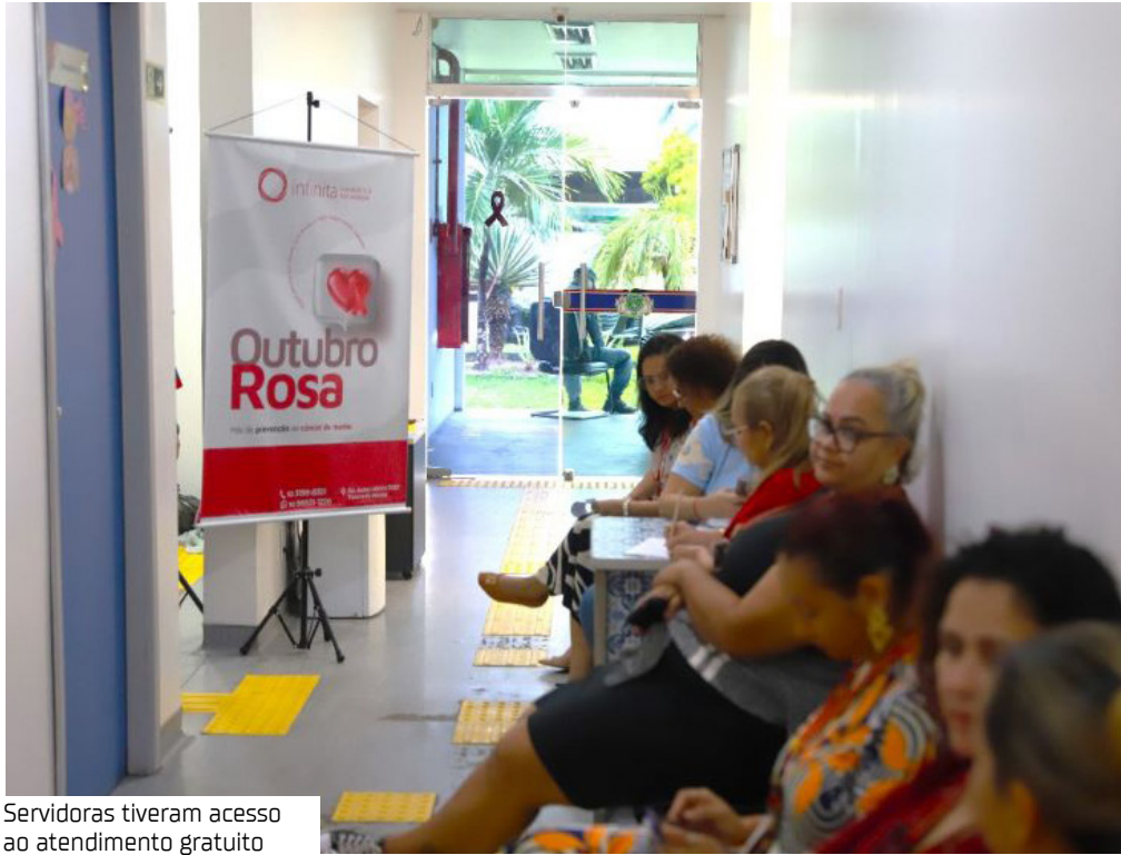
Servidoras tiveram acesso ao atendimento gratuito