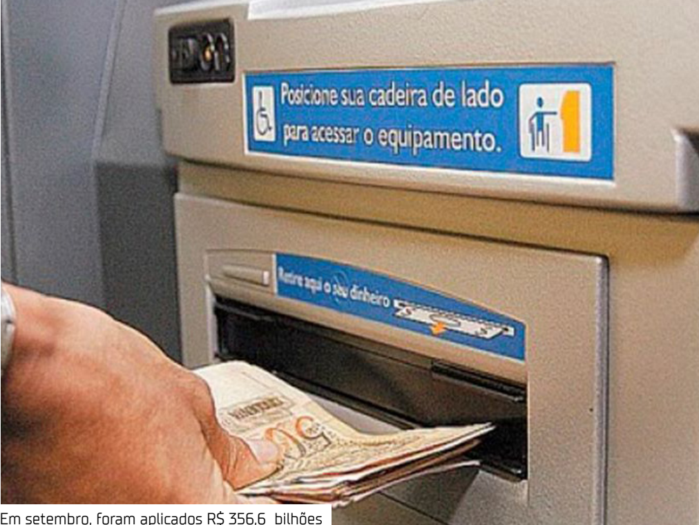
Em setembro, foram aplicados R$ 356,6 bilhões