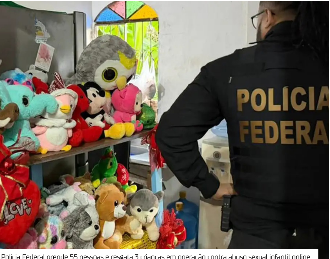
Polícia Federal prende 55 pessoas e resgata 3 crianças em operação contra abuso sexual infantil online

Crianças resgatadas de abusadores As crianças resgatadas estavam em poder dos abusadores e foram localizadas durante o cumprimento dos mandados. Imagens de cunho sexual com as vítimas foram encontradas nas residências