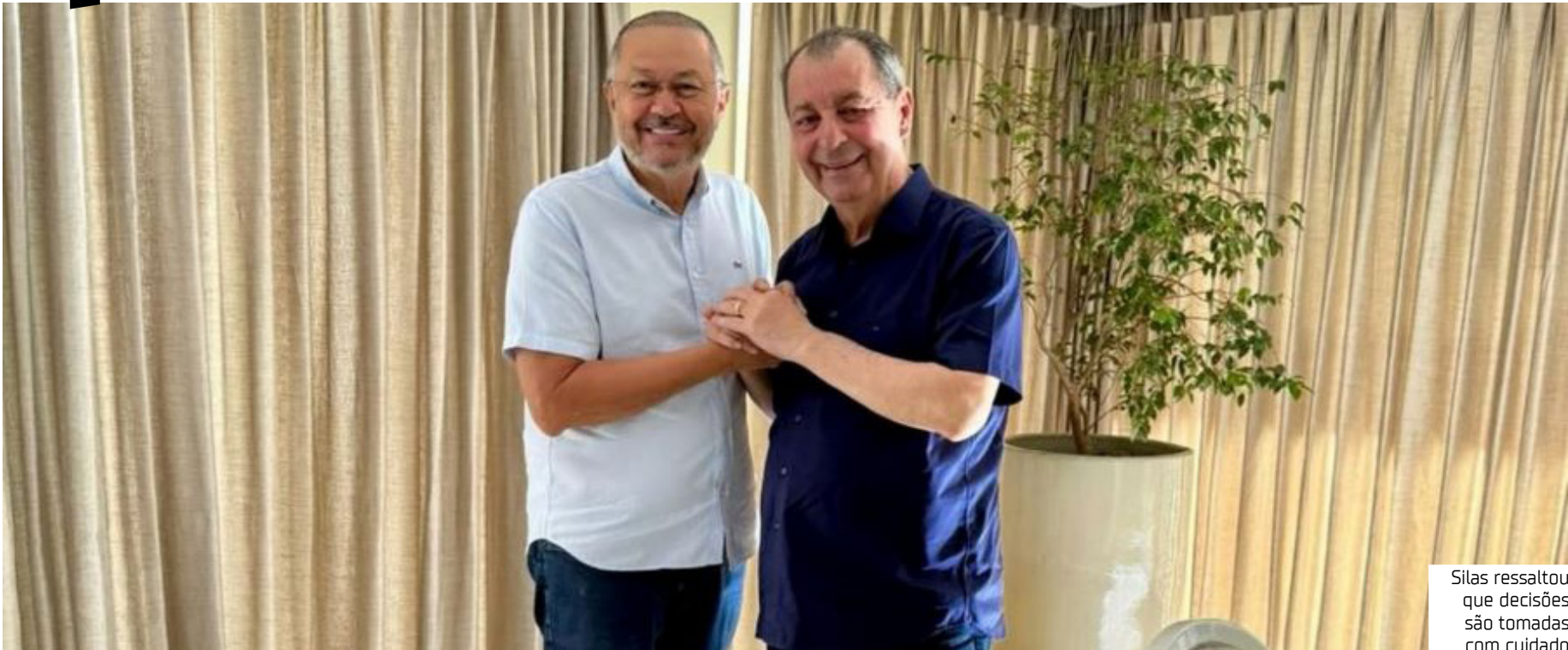
Silas ressaltou que decisões são tomadas com cuidado

“É importante reafirmar que não há, até o presente momento, decisão formal ou comunicação à imprensa sobre afastamento do meu mandato, tampouco houve convite ou diálogo envolvendo coordenação de campanha de qualquer liderança política,