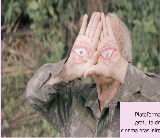
Plataforma gratuita de cinema brasileiro