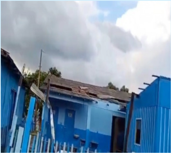
Tempestade causa estrago em comunidade de Parintins

Segundo os moradores, o temporal chegou de forma repentina e pegou todos de surpresa. Felizmente, até o fechamento desta edição, não há relatos de feridos, apesar dos danos generalizados ao patrimônio. O Centro Nacional de Monitoramento e Alertas de Desastres Naturais (CEMADEN) informou que, às 7h20 de ontem (8), a estação São José, em Parintins, registrou 77,2 mm de chuva, enquanto a estação do Centro marcou 67,6 mm.