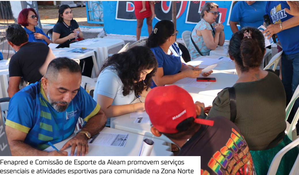
Fenapred e Comissão de Esporte da Aleam promovem serviços essenciais e atividades esportivas para comunidade na Zona Norte

A Frente Parlamentar de Cuidados e Prevenção à Depressão, Suicídio e Drogas (Fenapred) e a Comissão de Esporte, Lazer e Relações Internacionais da Assembleia Legislativa do Estado do Amazonas (Aleam) realizam uma ação social e de recreação esportiva na Escola Estadual Socorro Pacheco Braga, localizada na rua Maicuru, s/nº, conjunto habitacional Viver Melhor 2, bairro Lago Azul, na Zona Norte de Manaus. A 7ª edição do projeto Fenapred + Cidadania Aleam vai oferecer diversos serviços à