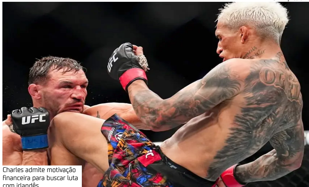
Charles admite motivação financeira para buscar luta com irlandês

O brasileiro Charles Do Bronx está na fase final de preparação para lutar no UFC Rio, em seu retorno ao Brasil após quase seis anos fora. O peso leve enfrenta Mateusz Gamrot na luta principal deste sábado (11), mas admite que está fazendo planos para os próximos meses, independente do resultado do duelo com o polonês. E um deles inclui uma eventual luta no UFC da Casa Branca contra Conor McGregor.