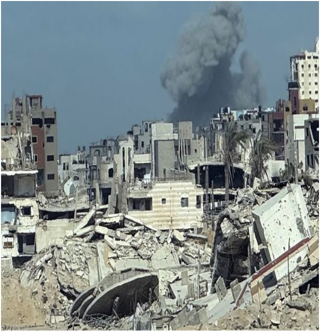
Grupo envia proposta de troca de prisioneiros e discute cessar-fogo

Em mais um sinal de avanço nas negociações para encerrar a guerra na Faixa de Gaza, o Hamas entregou, ontem (8), uma lista com nomes de reféns israelenses e prisioneiros palestinos que poderiam ser incluídos em uma permuta. A facção afirmou estar otimista com as conversas em Sharm el-Sheikh, no Egito, e que o foco atual das negociações está nos mecanismos para interromper o conflito e garantir a retirada das forças israelenses de Gaza. O grupo avalia positivamente o plano de 20 pontos apresentado por Donald Trump, que representa o avanço diplomático mais significativo até o momento. Apesar do otimismo, questões-chave ainda blo-