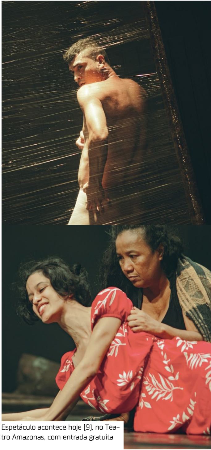
Espectáculo acontece hoje (9), no Teatro Amazonas, com entrada gratuita