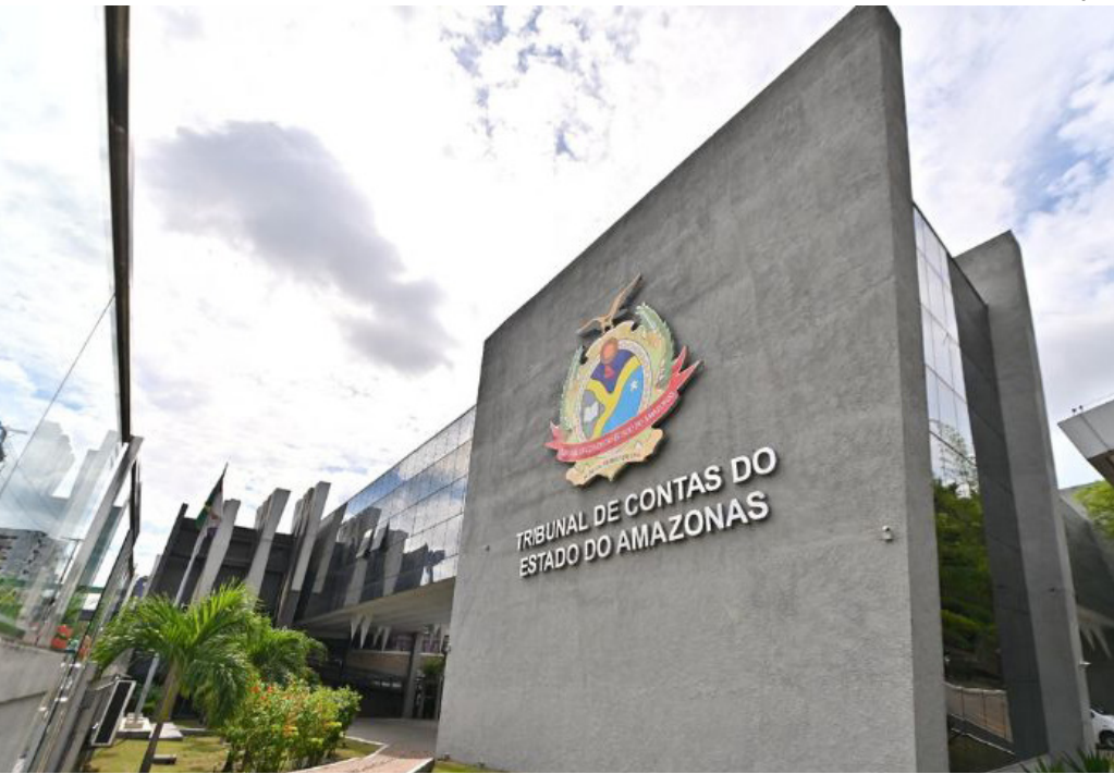
Evento será realizado no auditório da Corte de Contas, localizado na sede do Tribunal, na Zona Centro-Sul

Reforçando sua posição de referência nacional em tecnologia e inovação, o Tribunal de Contas do Estado do Amazonas (TCE-AM) promoverá, no próximo dia 30, o evento “TCE 75+ – Transformação Digital e Inteligência Artificial no Controle Público”, voltado à discussão sobre o uso da tecnologia e da Inteligência Artificial (IA) na administração pública.