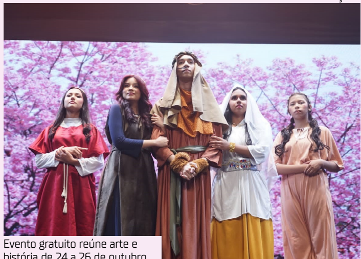
Evento gratuito reúne arte e história de 24 a 26 de outubro

O encerramento acontece no domingo (26), com duas sessões, às 8h30 e às 17h—sobre o tema “Prepare o caminho do Senhor”.