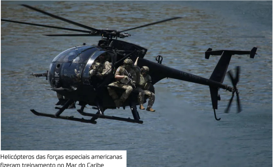
Helicópteros das forças especiais americanas fizeram treinamento no Mar do Caribe

Helicópteros do batalhão de Operações Especiais da aviação dos Estados Unidos, conhecidos como “Night Stalkers”, foram vistos sobrevoando a região do Caribe, perto da costa da Venezuela.