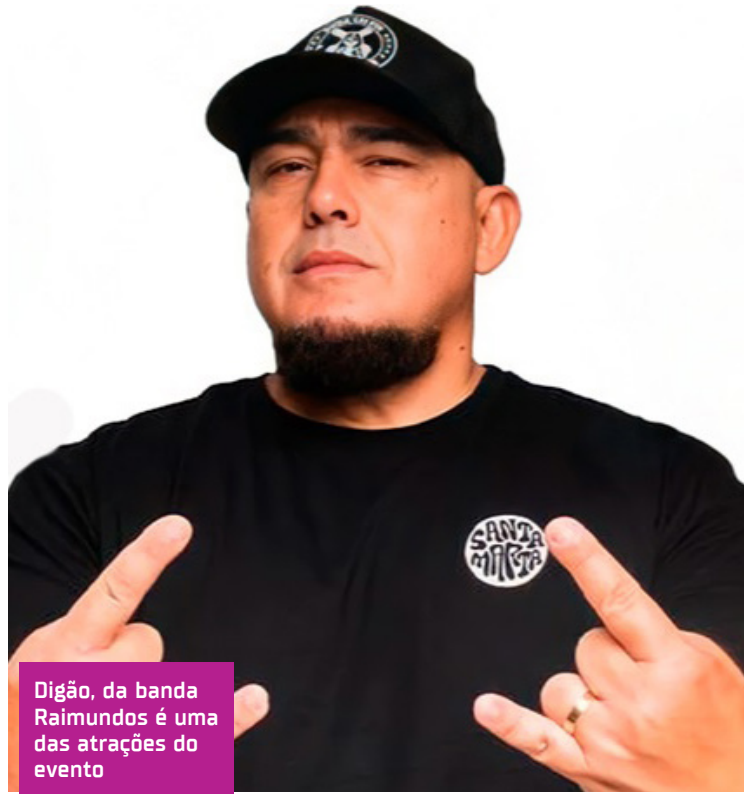
Digão, da banda Raimundos é uma das atrações do evento

Venda: Os ingressos já estão à venda no site e os preços variam de R$ 30 a R$ 150, por pessoa.