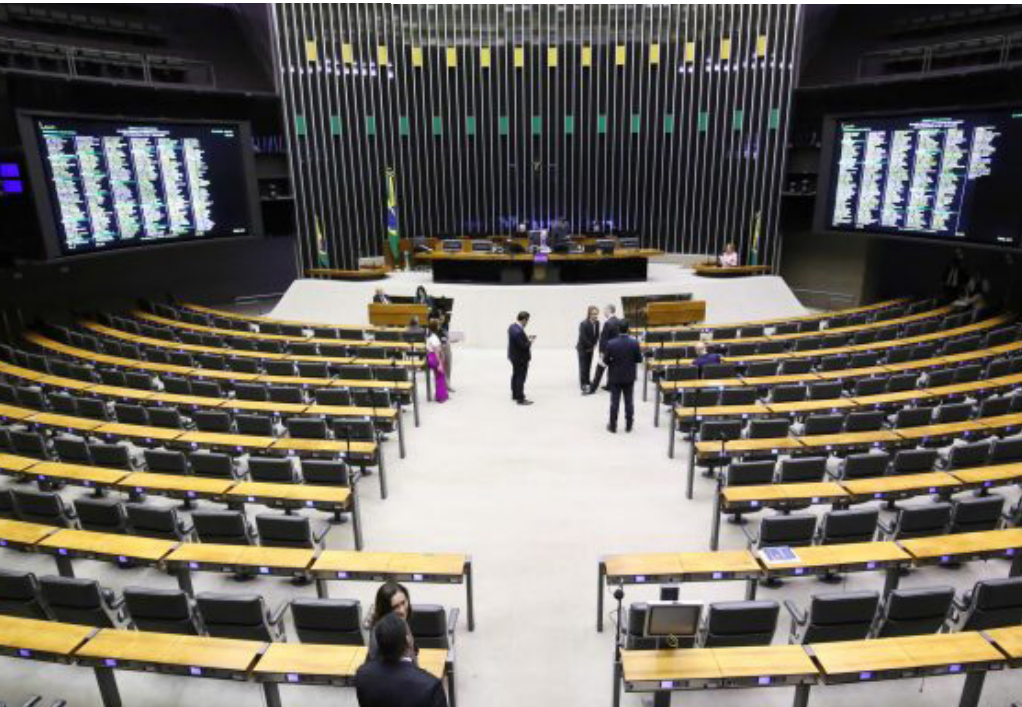
Matéria segue, agora, para análise do Senado após ser aprovada pelos parlamentares na Câmara

Com o PDL 359/24, o Brasil poderá retomar o direito de participar das decisões do BIE e de se candidatar a novas exposições.