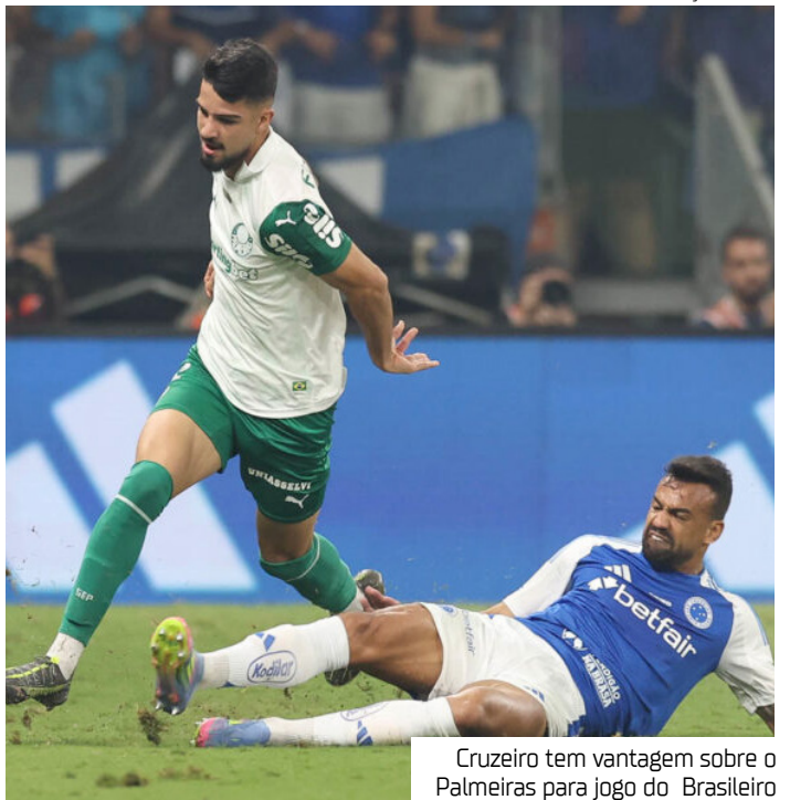
Cruzeiro tem vantagem sobre o Palmeiras para jogo do Brasileiro

É justamente por conta do excesso de jogos do Porco que o Cruzeiro pode tirar vantagem pensando no duelo direto pelo Brasileiro. O Palmeiras vive um momento de atenções divididas e terá pouquíssimo tempo para se recuperar e se preparar para o embate do domingo.