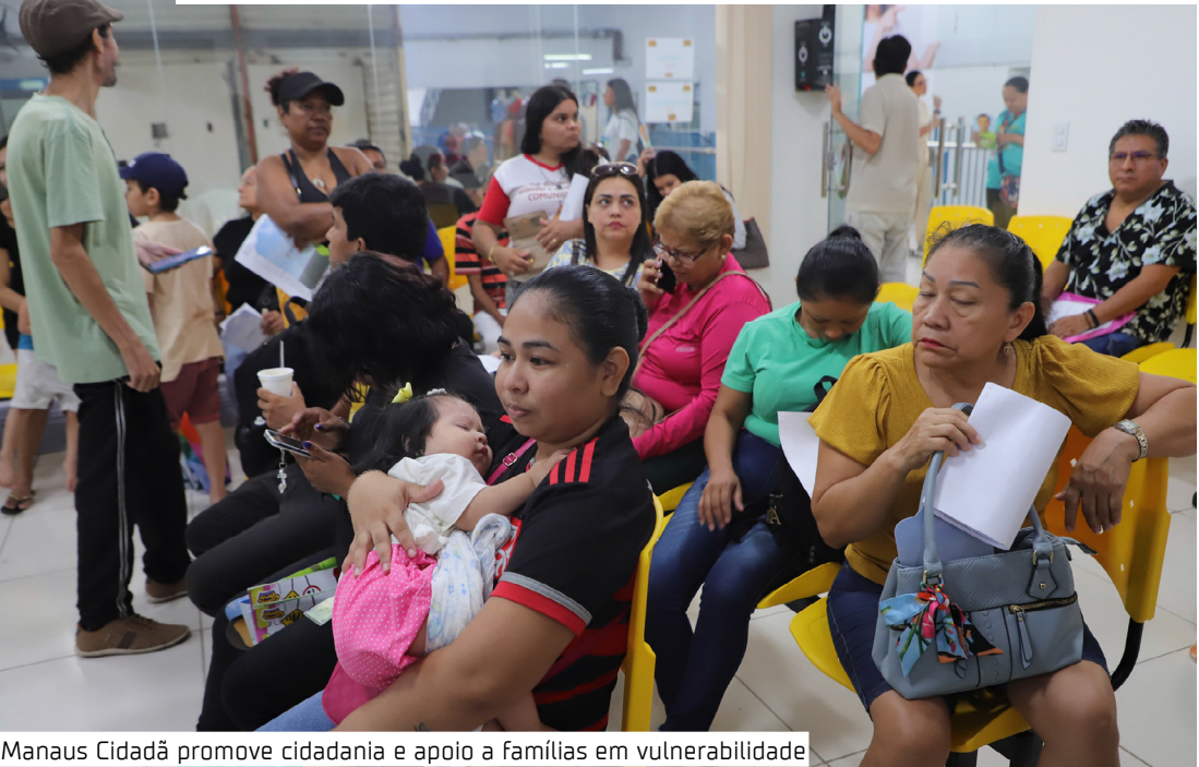
Manaus Cidadã promove cidadania e apoio a famílias em vulnerabilidade