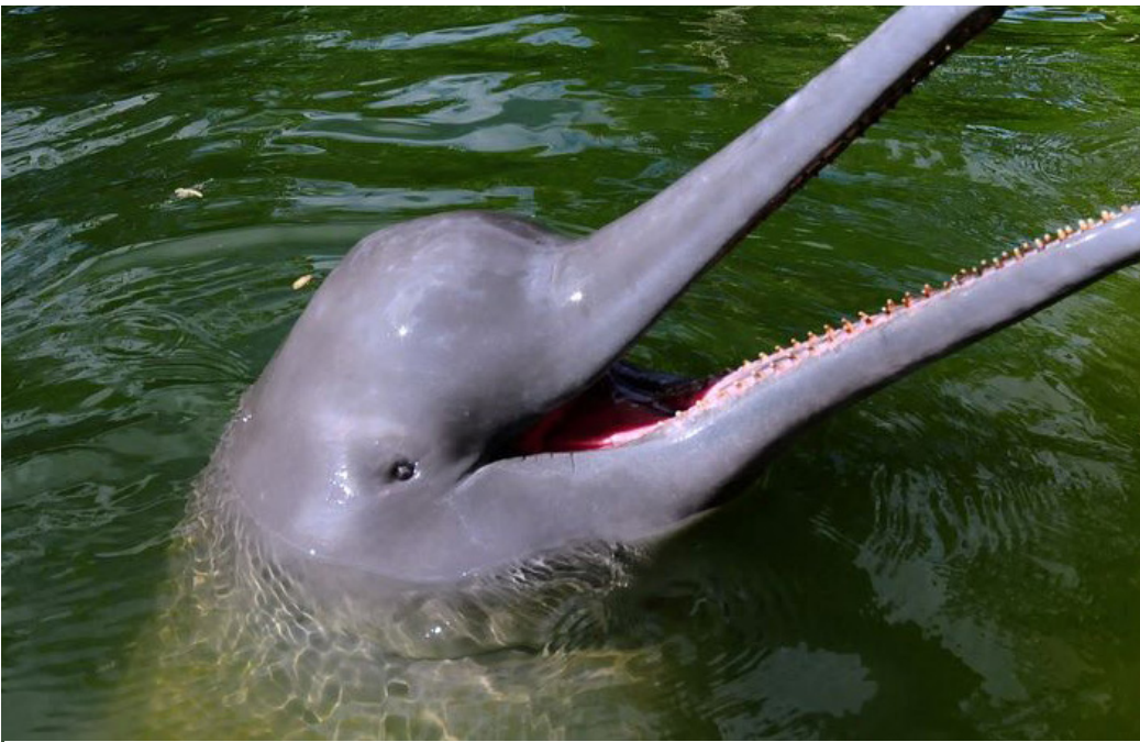
Brasil abriga, atualmente, três espécies de botos: o boto-cor-de-rosa, o tucuxi e o boto-do-Araguaia