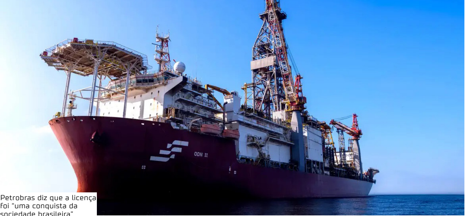
Petrobras diz que a licença foi “uma conquista da sociedade brasileira”

Na avaliação das entidades, o licenciamento “atropelou povos indígenas e comunidades tradicionais”. Segundo as organizações, não foram realizados os Estudos de Componente Indígena e Quilombola, nem houve consulta livre, prévia e informada, como prevê a Convenção 169 da Organização Internacional do Trabalho (OIT). As entidades destacam que a região do empreendimento abriga terras indígenas e quilombolas, colônias de pescadores,