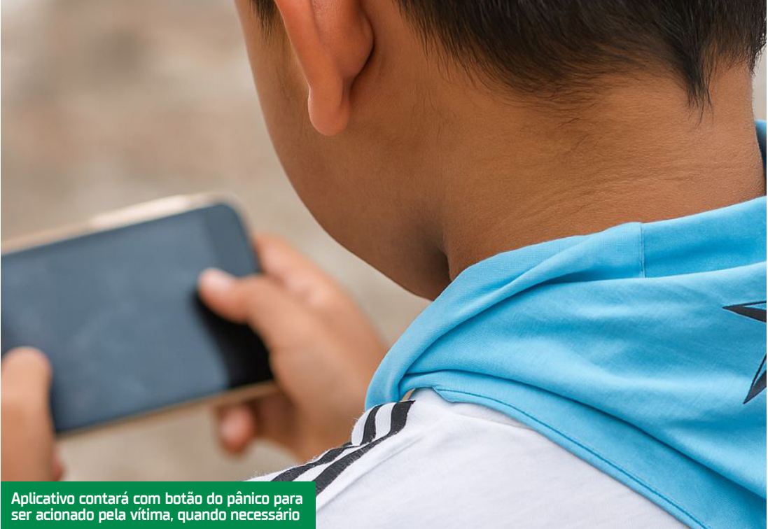
Aplicativo contará com botão do pânico para ser acionado pela vítima, quando necessário

“Os pais precisam ficar atentos às mudanças de comportamento dos filhos. Antes, tínhamos medo de que nossas crianças fossem aliciadas nas ruas, mas hoje o perigo está dentro de casa, pois não sabemos em que momento um