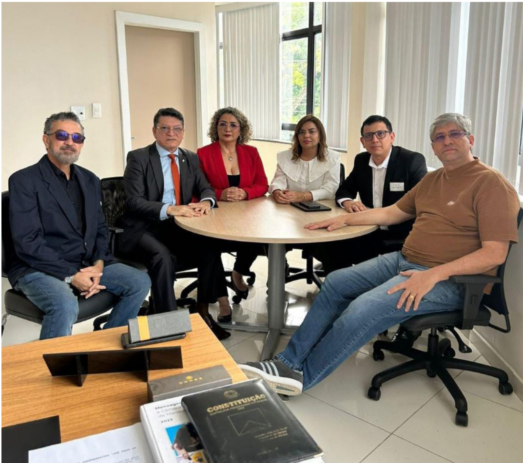
Para o Comitê há indícios robustos de materialidade e autoria dos crimes