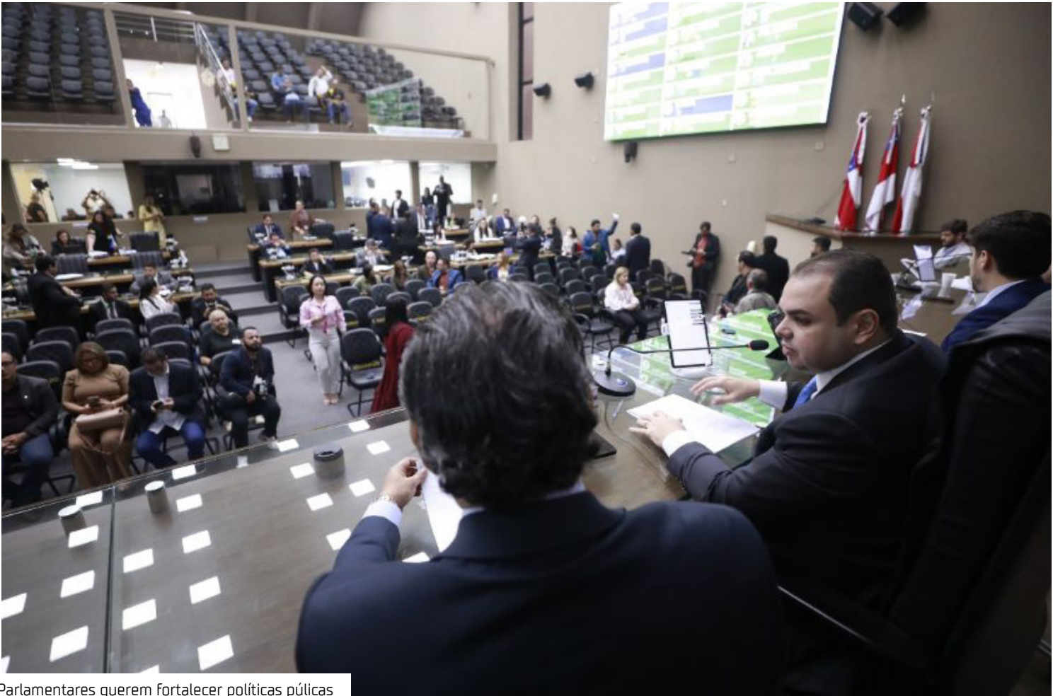
Parlamentares querem fortalecer políticas públicas

lativa (PRL) nº 66/2025, de autoria do presidente da Aleam, deputado Roberto Cidade (União Brasil), que institui o programa Aleam Educa. A iniciativa oferece curso preparatório gratuito para o Exame Nacional do Ensino Médio (Enem), com aulas presenciais de Língua Portuguesa e Redação, além de acesso a uma plataforma digital com conteúdos das demais disciplinas e curso de inglês online. “O Aleam Educa reafirma o compromisso da Assembleia com a formação cidadã e o acesso à educação de qualidade. Estamos abrindo portas e oportunidades para os jovens da rede pública”, afirmou o presidente Roberto Cidade. O programa, desenvolvido pela Escola do Legislativo Senador José Lindoso, pretende atender este ano 1,5 mil estudantes de 30 escolas públicas de Manaus, consolidando o papel da Aleam como polo gratuito de capacitação e inclusão educacional.