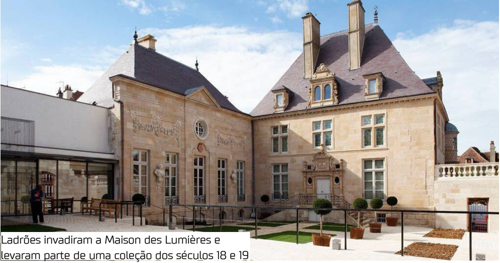
Ladões invadiram a Maison des Lumières e levaram parte de uma coleção dos séculos 18 e 19