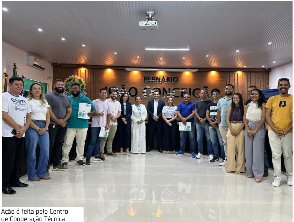
Ação é feita pelo Centro de Cooperação Técnica