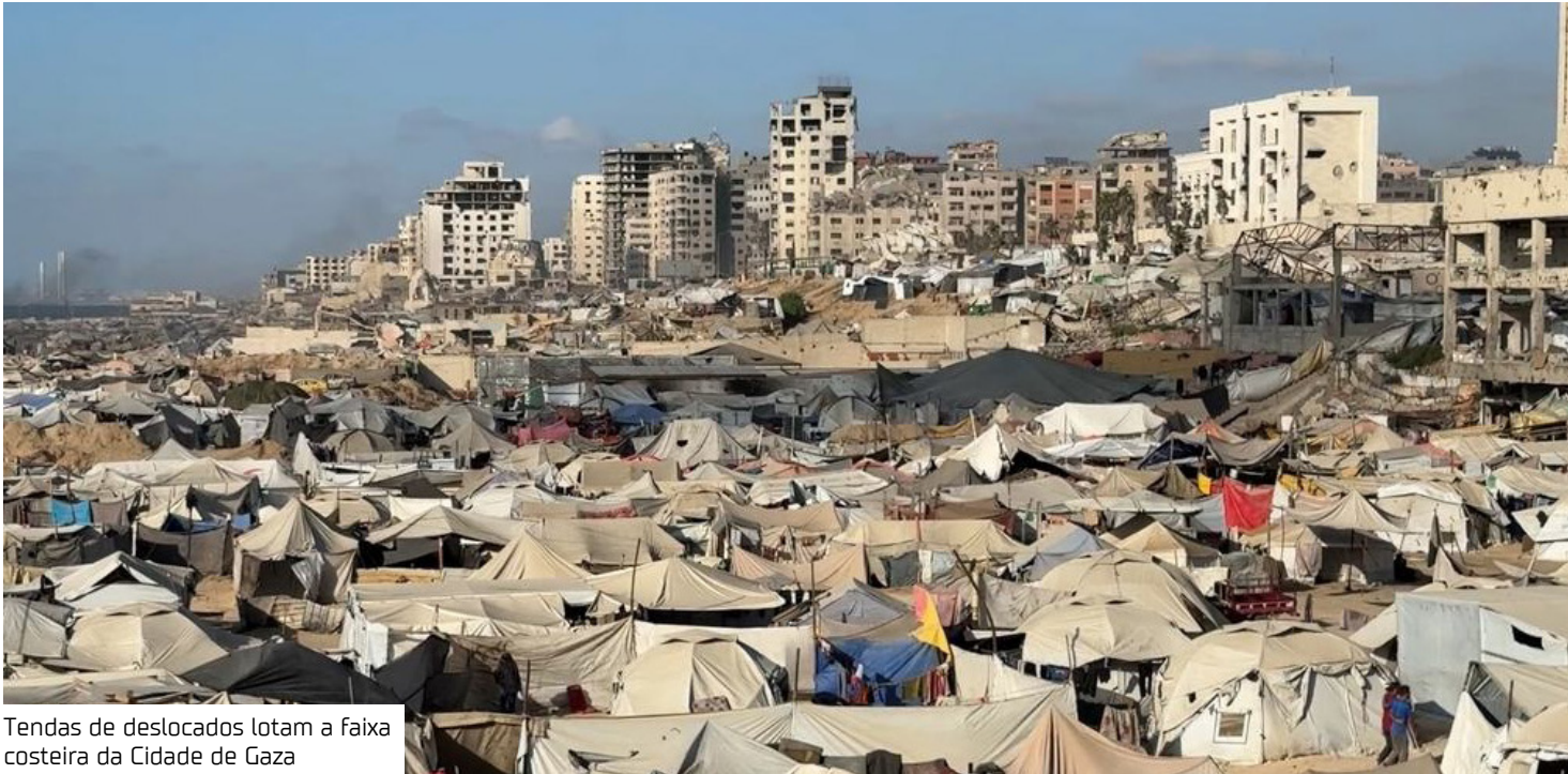
Tendas de deslocados lotam a faixa costeira da Cidade de Gaza

“O povo da Faixa de Gaza travou uma guerra como nenhuma outra que o mundo já viu, confrontando a tirania do inimigo, a brutalidade de seu exército e seus massacres”, acrescentou al-Hayya.