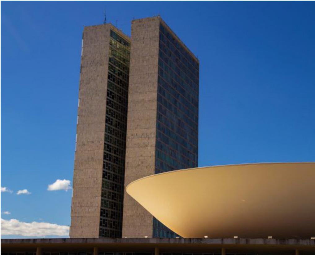
Parlamentares irão discutir efeitos da reforma sobre o funcionalismo e a prestação de serviços públicos