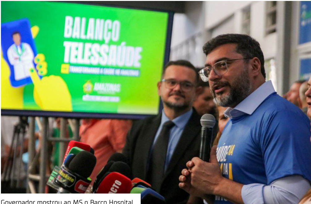
Governador mostrou ao MS o Barco Hospital