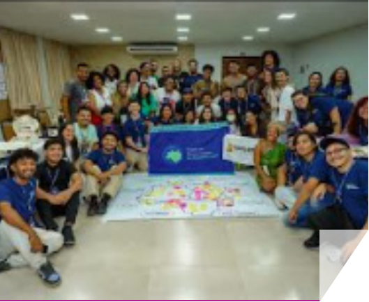
Lideranças Jovens Jovens Líderes da Amazônia elaboram documentos estratégicos, para a Cop30. O objetivo é assegurar aos jovens da Amazônia, um papel de protagonista nas propostas públicas, para a região.