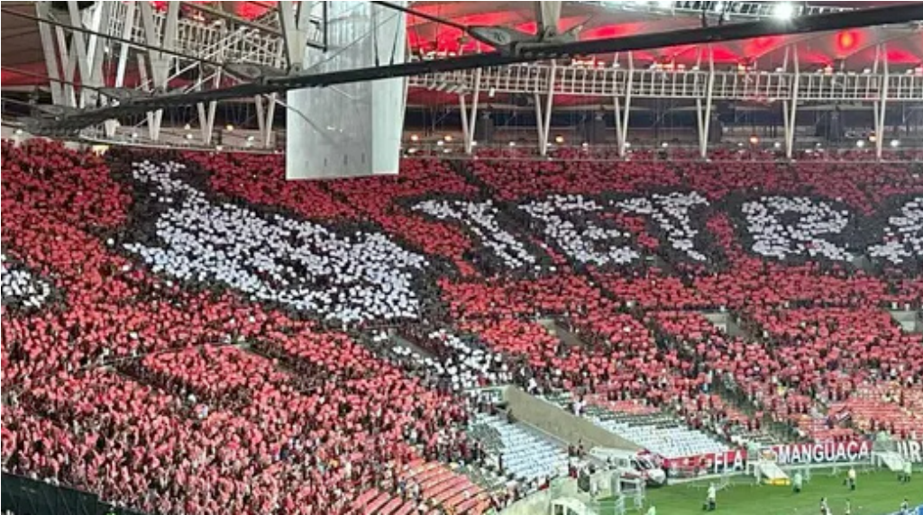
Justiça frustra torcida e reafirma Sport como único campeão brasileiro de 1987

bradar que o Autor é (ou seria) campeão brasileiro de 1987; no entanto, por decisão transitada em julgado do STF, o campeão é o Sport Clube do Recife. Simples assim”, informou o juiz na sentença. O Flamengo ainda pode apresentar recurso ao Tribunal de Justiça do Rio de Janeiro (TJ-RJ), por meio de apelação. No entanto, a sentença reforça que o tema já foi objeto de decisão definitiva em tribunais superiores, incluindo o Supremo Tribunal Federal (STF). Diante disso, as chances de reversão do resultado são consideradas remotas.