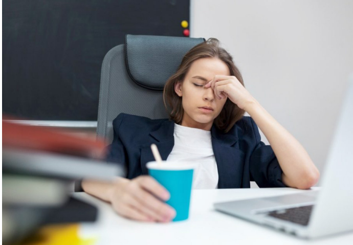
Existem técnicas eficazes para aliviar o estresse no ambiente profissional