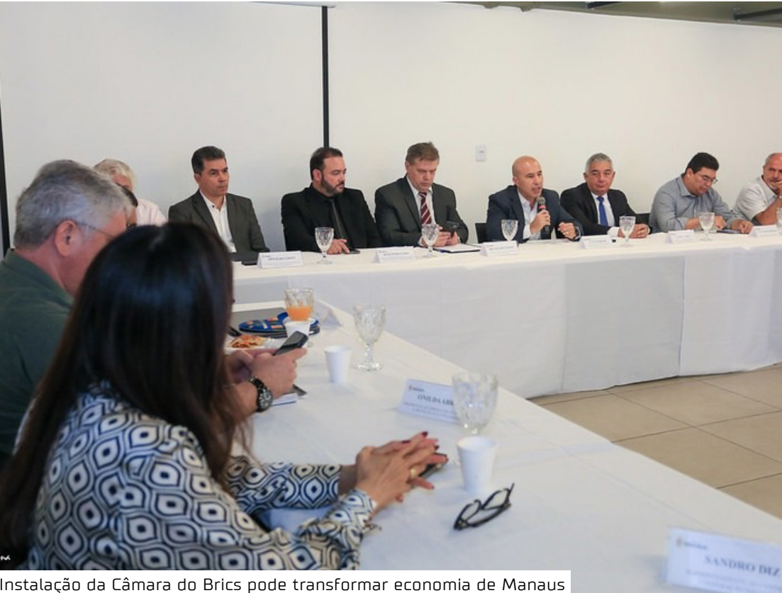
Instalação da Câmara do Brics pode transformar economia de Manaus

Proposta da Câmara do Brics pode transformar Manaus em polo estratégico de negócios