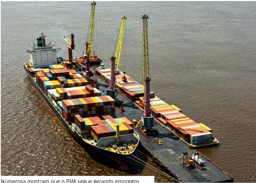
Númerosa mostram que o PIM segue gerando empregos

Os números da Balança Comercial de setembro deste ano mostram a força da economia amazonense e Polo Industrial de Manaus (PIM) como motor do desenvolvimento regional e nacional. No mês, o Amazonas registrou US$ 1,53 bilhão na Corrente de Comércio, resultado da soma de US$ 66,9 milhões em exportações e US$ 1,46 bilhão em importações.