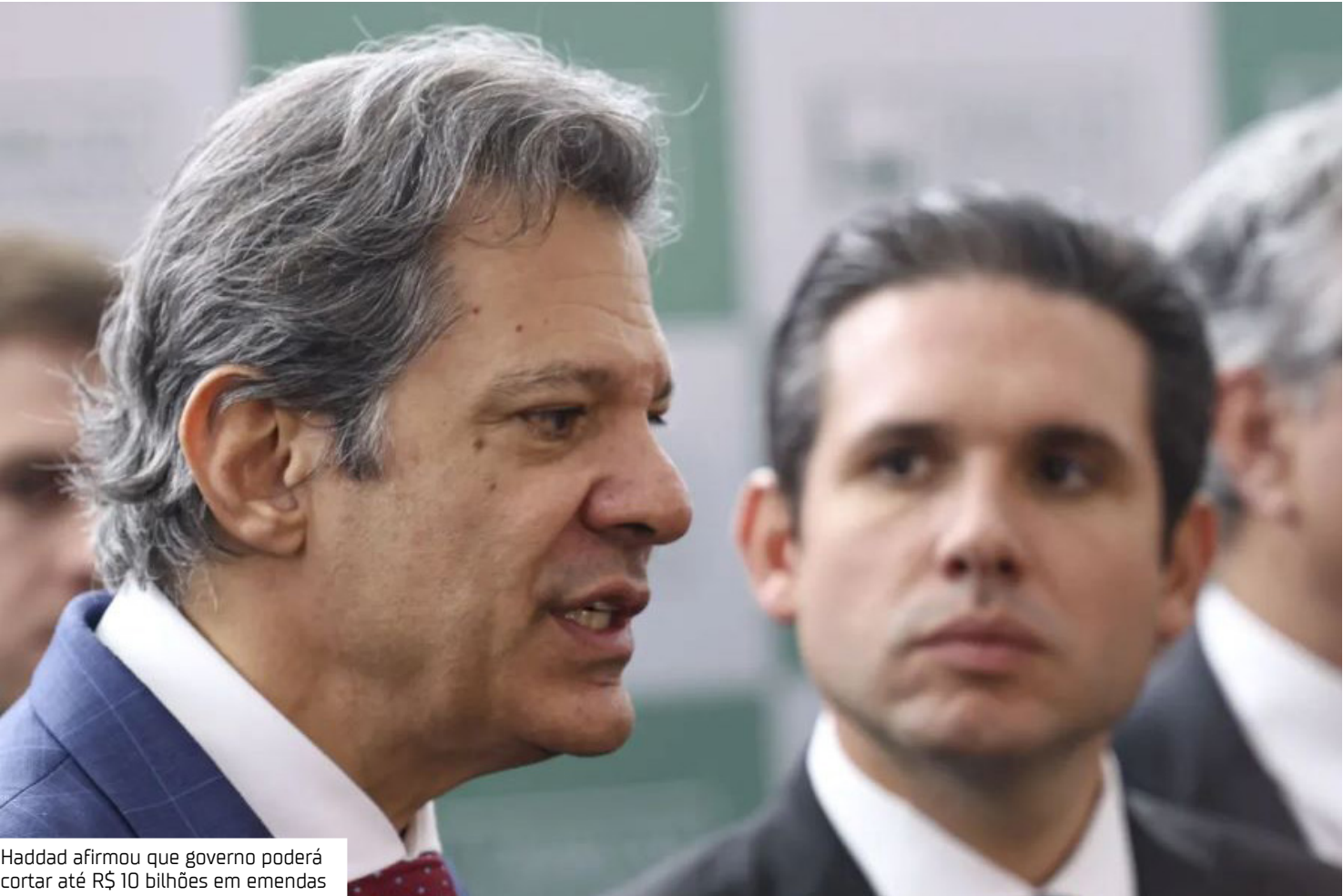
Haddad afirmou que governo poderá cortar até R$ 10 bilhões em emendas

fortalece a saúde pública, o SUS, a educação, a assistência social, e cortar pagamentos de emendas é