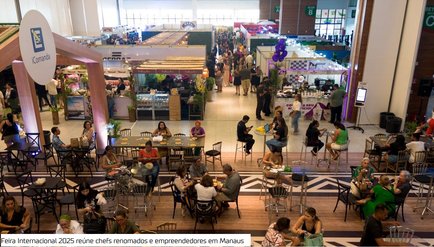
Feira Internacional 2025 reúne chefs renomados e empreendedores em Manaus