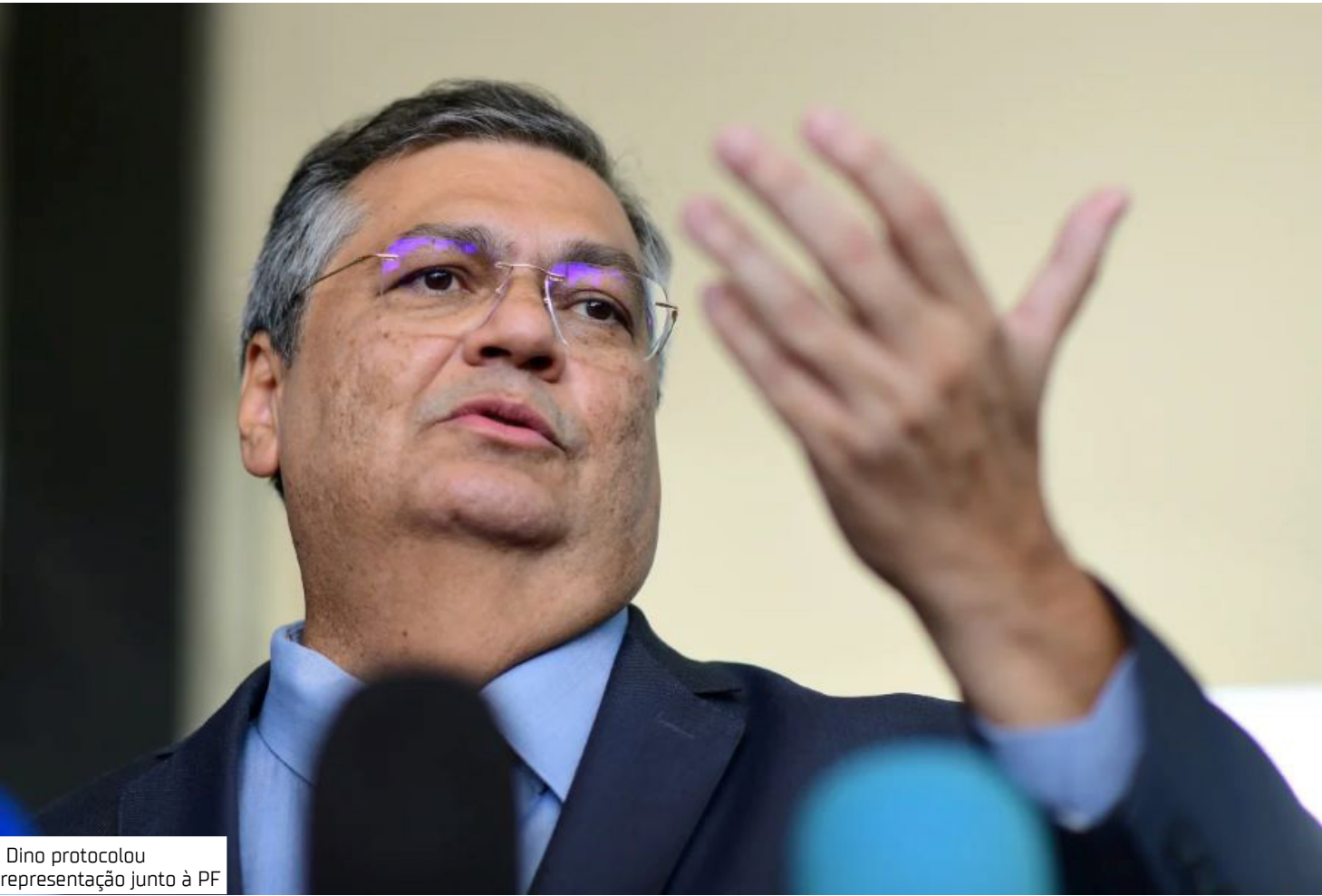
Dino protocolou representação junto à PF

vio Dino protocolou representação junto à PF em razão das ameaças recebidas após seu voto no julgamento que