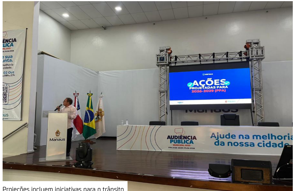
Projeções incluem iniciativas para o trânsito

A Prefeitura de Manaus, por meio do Instituto Municipal de Mobilidade Urbana (IMMU), apresentou o Plano Plurianual 2026/2029 e a Lei Orçamentária Anual (LOA) de 2026, voltados para a mobilidade urbana na cidade, em audiência no auditório Isabel Victoria de Mattos Pereira do Carmo Ribeiro, na sede do Executivo municipal, na avenida Brasil, bairro Compensa, zona Oeste.