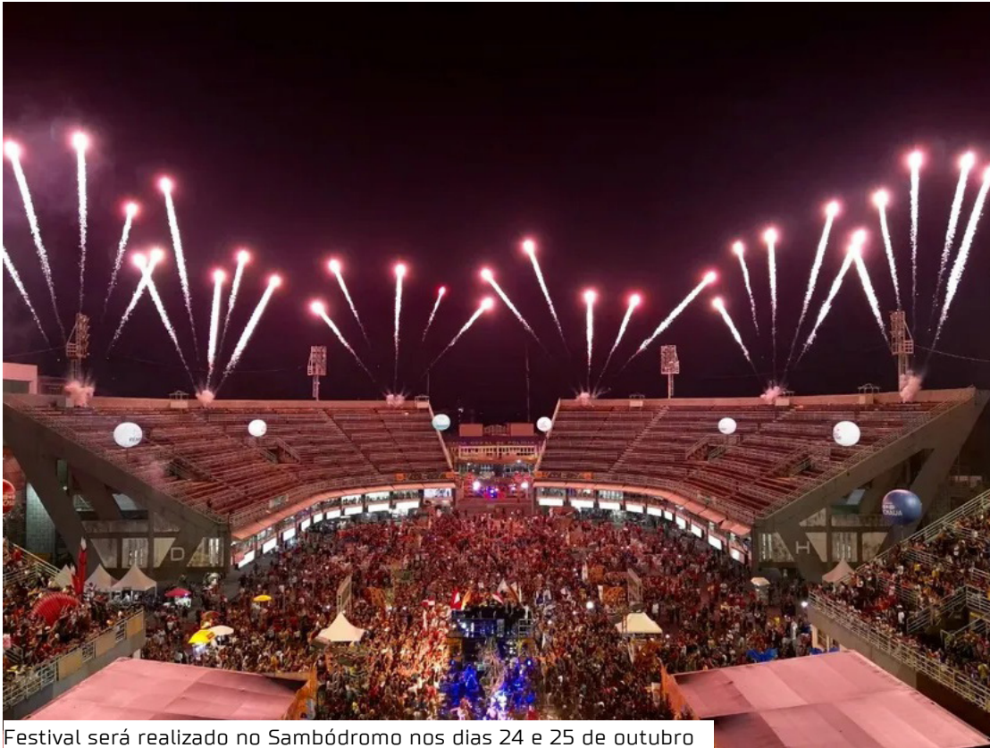
Festival será realizado no Sambódromo nos dias 24 e 25 de outubro

Evento no Sambódromo celebra os 356 anos de Manaus com bois locais e de Parintins