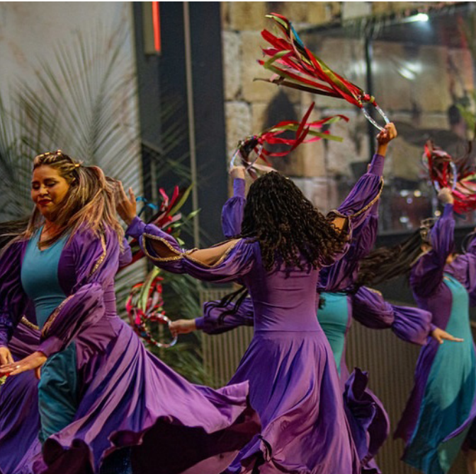
Evento no dia 18 de outubro, às 19h, no anfiteatro da Ponta Negra

Um espetáculo a céu aberto que vai narrar, por meio das danças e artes, a tradicional festa bíblica dos Tabernáculos, que faz menção ao tempo em que o povo morou em cabanas na época do exílio do Egito a caminho da Terra Prometida. Essa é a proposta do Festival Cultural de Tabernáculos 2025, que será promovido pela igreja Ministério Internacional da Restauração (MIR), no dia