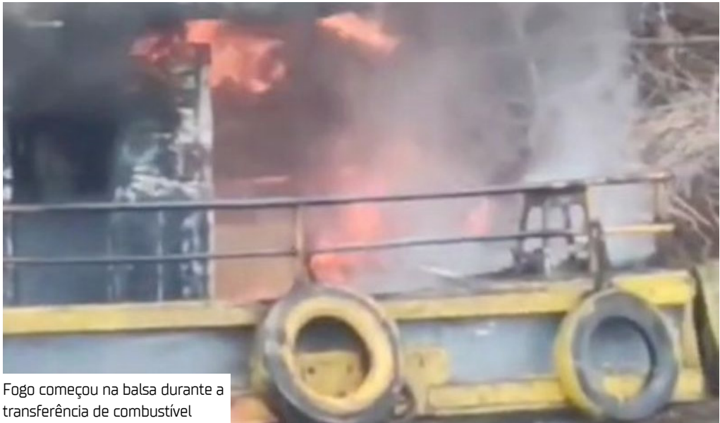
Fogo começou na balsa durante a transferência de combustível

Não há informações sobre feridos e nem como as chamas iniciaram. As circunstâncias do princípio de incêndio serão investigadas pelas autoridades.