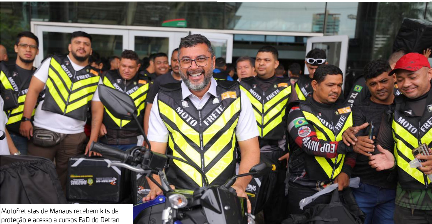
Motofretistas de Manaus recebem kits de proteção e acesso a cursos EaD do Detran

As entregas aconteceram no Centro de Convenções Vasco Vasques 2, no bairro Flores, zona centro-sul de Manaus. Durante o evento, o governador ressaltou o caráter inovador da iniciativa e o compromisso do Estado com a valorização da categoria de entregadores, que desempenha um papel fundamental na vida da população. Ele destacou que a pandemia deixou ainda mais claro como esse