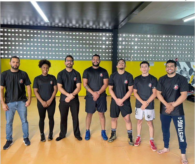
Seleção de wrestling do Amazonas embarca para Brasileiro Interclubes 2025

Equipe amazonense no Campeonato Brasileiro Interclubes Adulto Masculino e Feminino de Wrestling – CBI Aline Silva 2025.