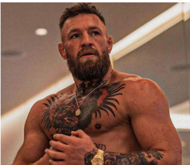
Irlandês já tem data para voltar ao octógono após anos fora

McGregor ainda declarou que pretende começar a treinar forte a partir do início do ano e que fará uma “operação de seis meses”. O UFC na Casa Branca deve ocorrer em junho, como parte dos festejos pelos 250 anos da Inde-