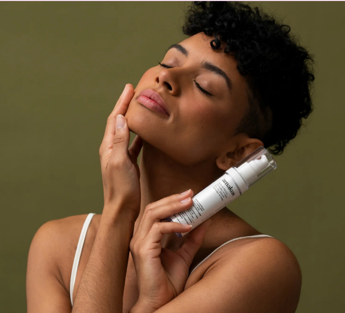
Startup amazonense destaca inovação da floresta com cosmético natural

Nos dias 3 e 4 de outubro, o Largo de São Sebastião, em Manaus (AM), se transforma em palco da moda, cultura e economia criativa com a realização da terceira edição do Amazon Poranga Fashion (APF). E, neste ano, a Amakos da Amazônia estará presente em press kits especiais para jornalistas e convidados com o Sérum de Copaíba, da linha Copaíba Hydra. Com DNA amazônico e propósito sustentável, a Amakos da Amazônia aposta no poder da copaíba, árvore nativa conhecida