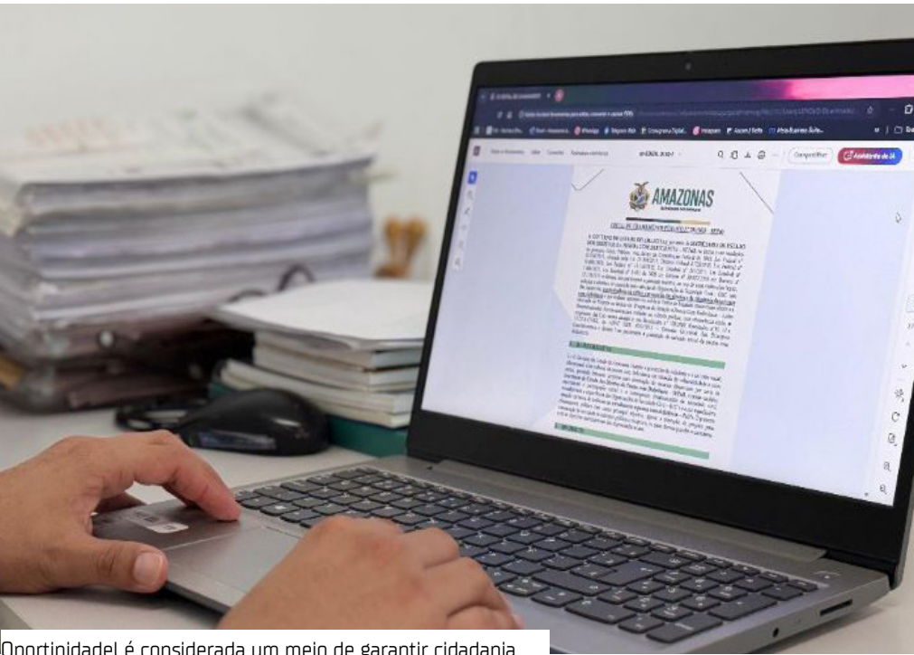
Oportunidade é considerada um meio de garantir cidadania

O Governo do Amazonas irá investir R$ 5 milhões em Organizações da Sociedade Civil (OSCs), que trabalham na defesa e promoção dos direitos e da cidadania das pessoas com deficiência (PcD). Lançado na quarta-feira (1º), o Edital de Chamamento nº 01/2025 visa executar projetos socioassistenciais e socioeducativos, que auxiliem na implementação da Política Estadual de Atenção à Pessoa com Deficiência.