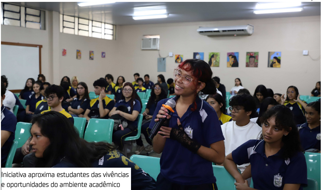
Iniciativa aproxima estudantes das vivências e oportunidades do ambiente acadêmico

logo propôs com que a atividade integrasse o calendário letivo da escola. "Nosso propósito é aproximar os alunos das perspectivas que a universidade pode oferecer. É mostrar que o ensino superior é um caminho possível e transformador, especialmente para quem está concluindo o Ensino Médio. Dentre os convidados, há pessoas que foram minhas professoras. Também temos profissionais que já foram meus alunos. Em um discurso que nasce da nossa realidade de vida, e buscamos passar isso aos estudantes", destacou o docente.