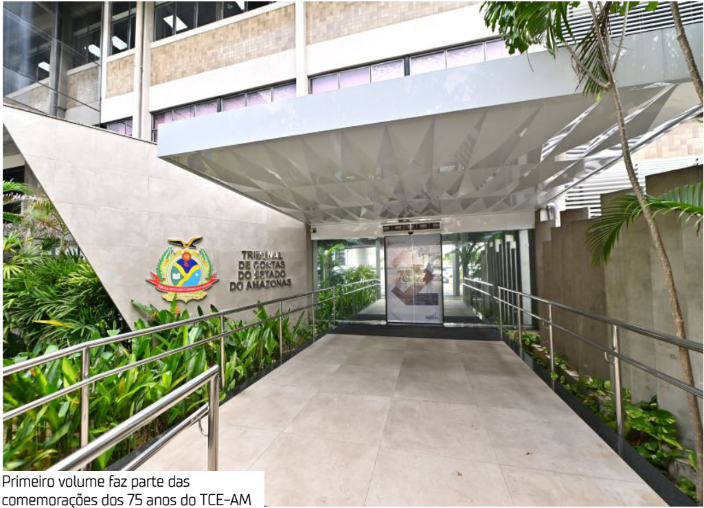
Primeiro volume faz parte das comemorações dos 75 anos do TCE-AM