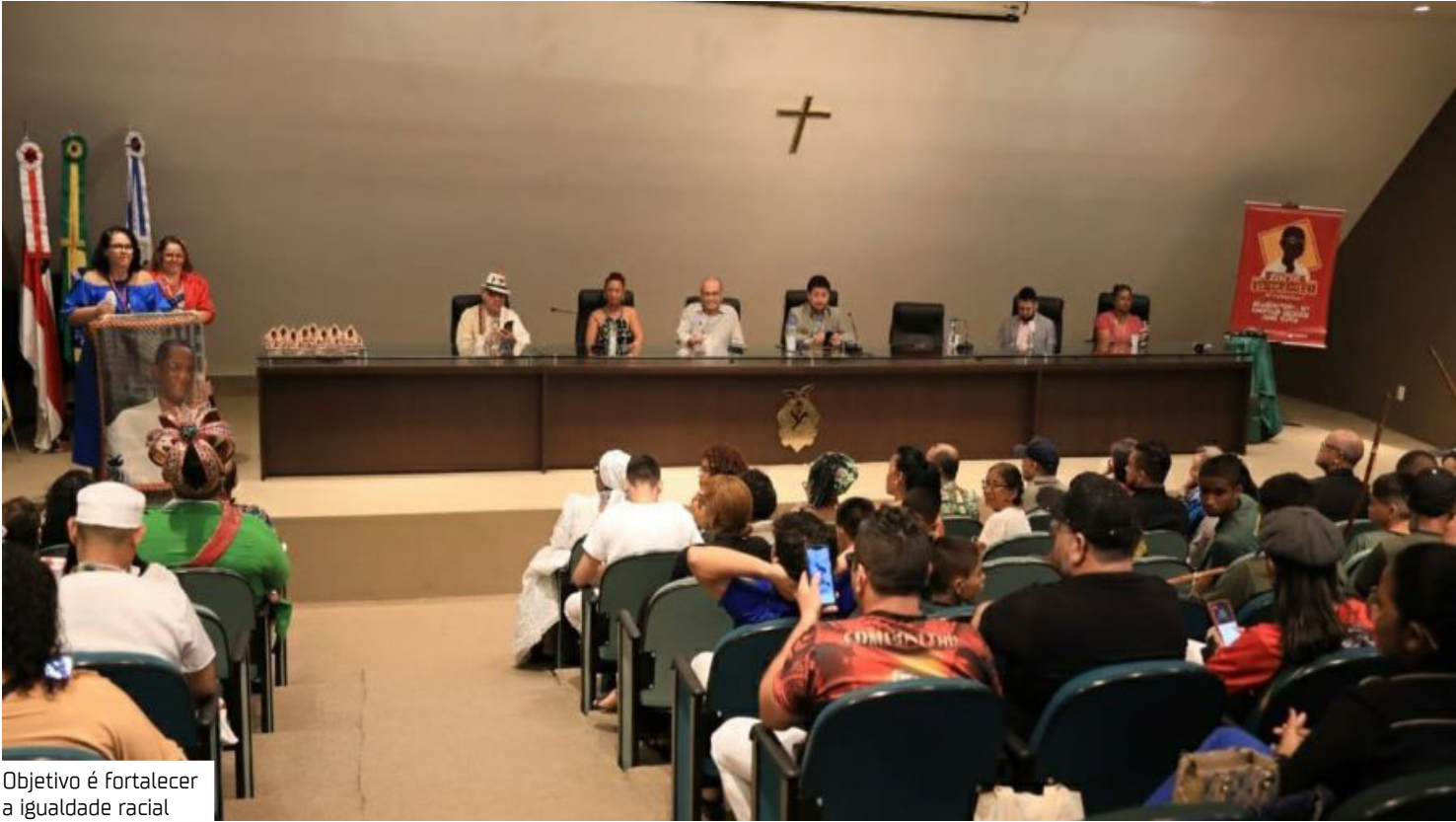
Objetivo é fortalecer a igualdade racial

Ação é promovida pela Escola do Legislativo, por meio do programa Educando pela