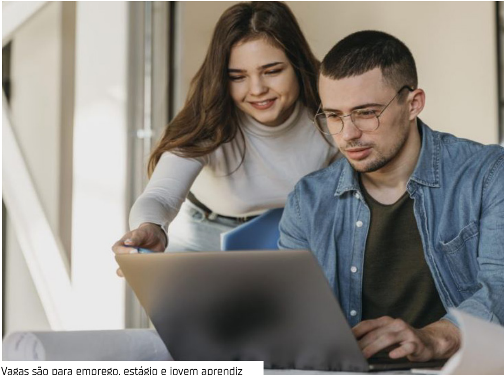
Vagas são para emprego, estágio e jovem aprendiz