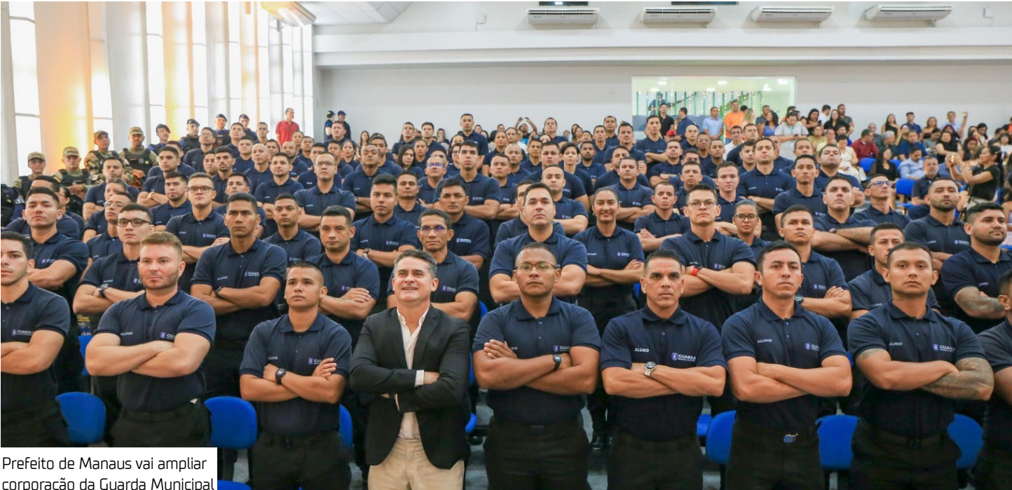
Prefeito de Manaus vai ampliar corporação da Guarda Municipal

O prefeito de Manaus, David Almeida (Avante), anunciou ontem (30), a abertura de um novo concurso público, com 590 vagas para a Guarda Municipal. De acordo com a prefeitura, o concurso está previsto para ser lançado em março de 2026, o que ampliará o efetivo total da corporação para mil guardas armados. O anúncio foi feito durante a cerimônia de formatura da segunda turma do Curso de Formação da Guarda Municipal, realizada no auditório da Prefeitura de Manaus, no bairro Compensa, Zona Oeste. Em seu discurso, o prefeito destacou o fortalecimento da corporação e anunciou novos investimentos para a segurança pública. "Com a formatura de hoje, Manaus passa a contar com 410 homens e mulheres armados, treinados, preparados e equipados para servir a população", afirmou. Ele ainda anunciou,