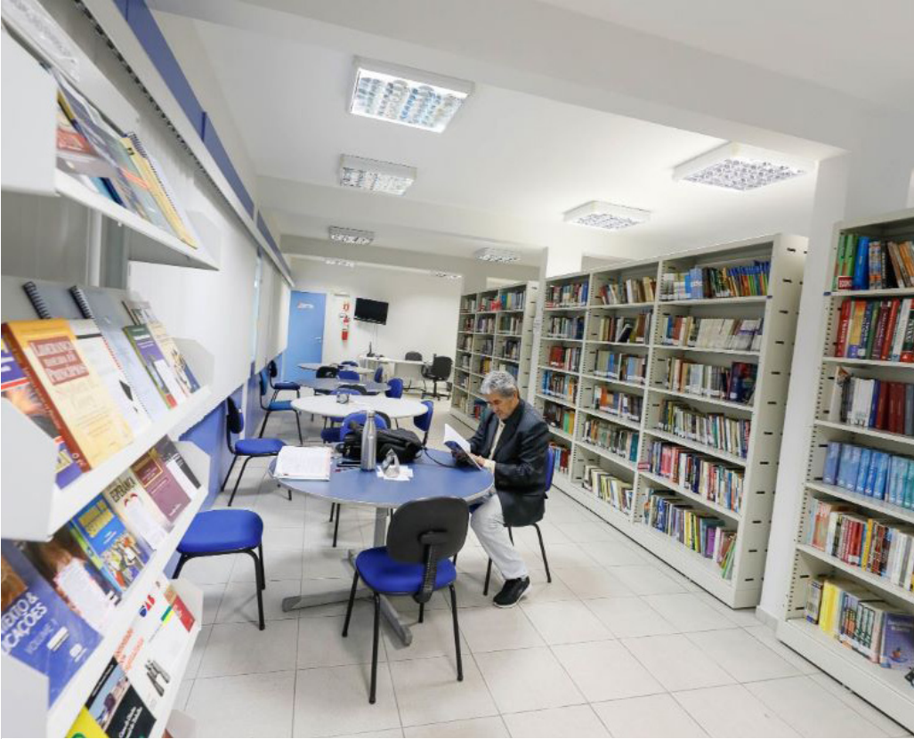
Local é aberto à população para consultas presenciais, mas empréstimo é exclusivo para os servidores