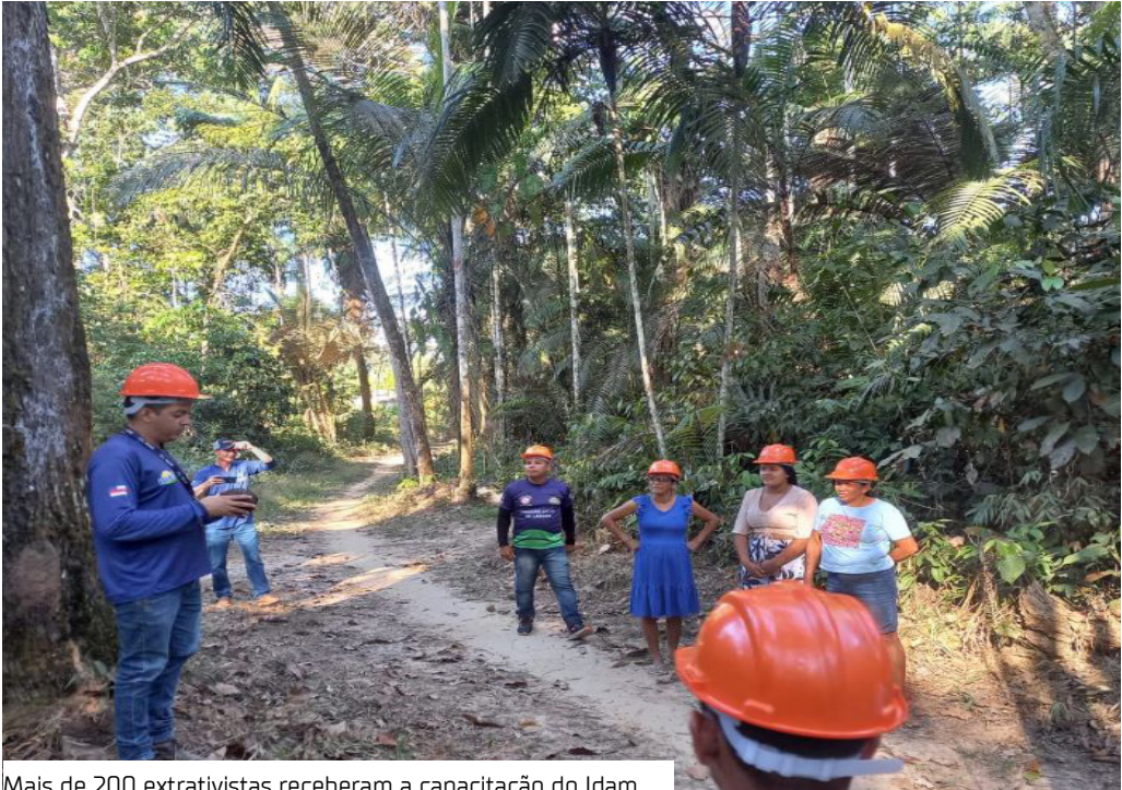
Mais de 200 extrativistas receberam a capacitação do Idam

Neste ano, o Instituto de Desenvolvimento Agropecuário e Florestal Sustentável do Estado do Amazonas (Idam), por meio do projeto Paisagens Sustentáveis da Amazônia (ASL Brasil), que faz parte da Conservação Internacional Brasil (CI-Brasil), capacitou 272 extrativistas que atuam nas cadeias produtivas da borracha, castanha da Amazônia e óleos vegetais.