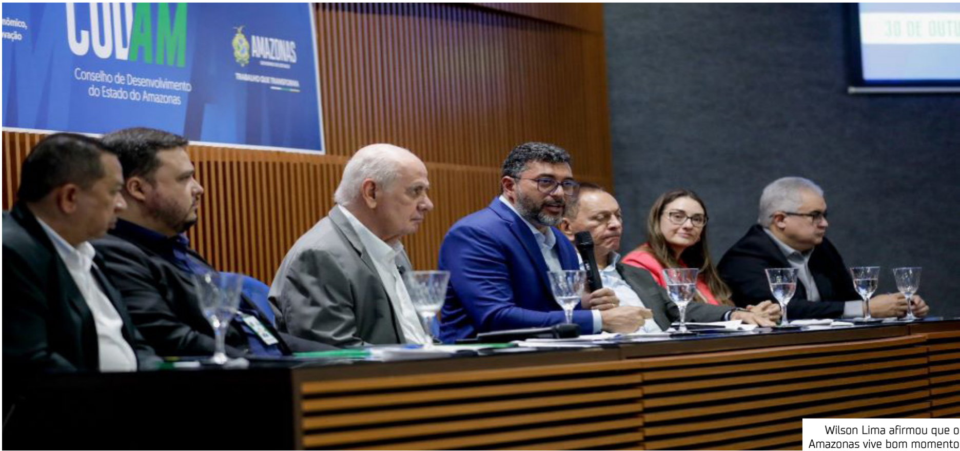
Wilson Lima afirmou que o Amazonas vive bom momento

"O bom momento que o Amazonas vive do ponto de vista econômico é resultado da confiança dos investidores. Mesmo com as dificul-