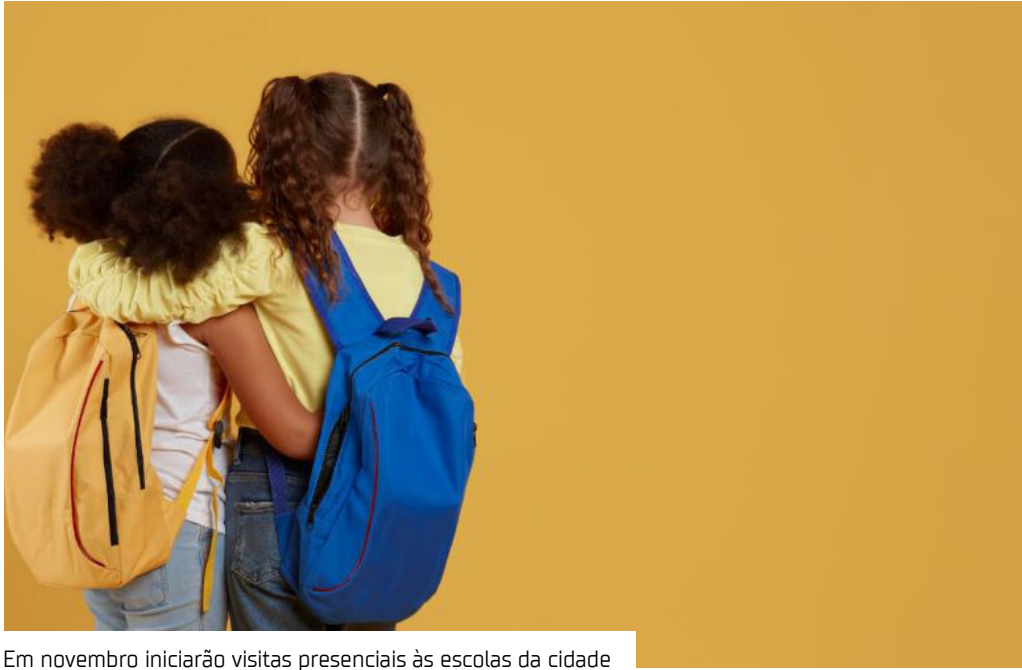
Em novembro iniciarão visitas presenciais às escolas da cidade