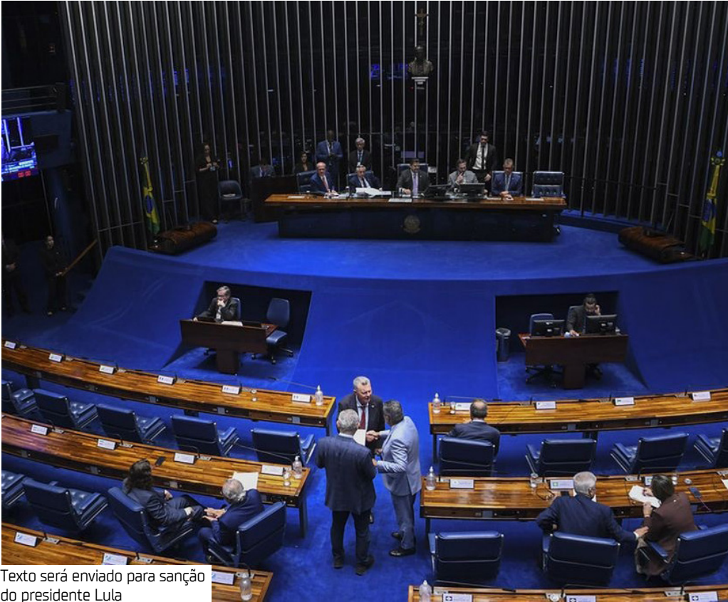
Texto será enviado para sanção do presidente Lula