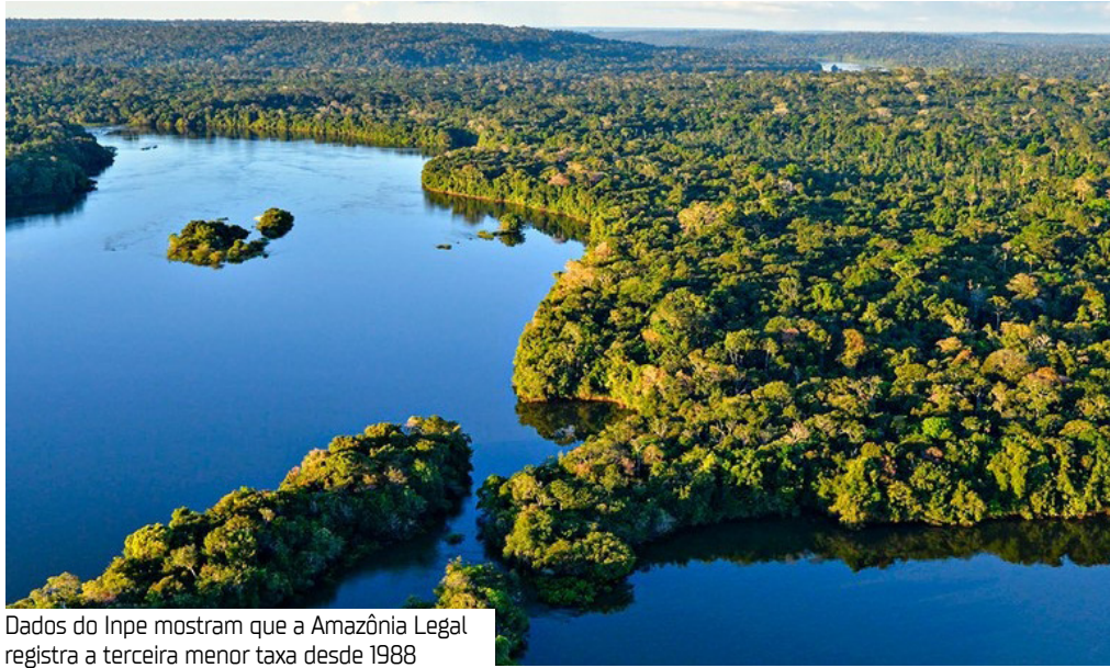
Dados do Inpe mostram que a Amazônia Legal registra a terceira menor taxa desde 1988