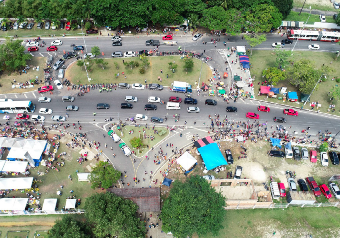
Cemitérios de Manaus vão ter fiscalização do IMMU

O cemitério Nossa Senhora Aparecida (Tarumã) será o principal ponto de atenção, contando com um reforço de 15 veículos extras. No dia 2 de novembro, duas linhas extras irão operar: 500 - Novo Israel / Cemitério Tarumã e 901 - T4-T5 / Av. Cel. Teixeira / Cemitério Tarumã/T. Tapajós. As linhas 542 e 678 terão parte de seus itinerários desviados: após a rotatória do complexo turístico Ponta Negra, seguirão pela avenida do Turismo, farão retorno após o cemitério Tarumã e, na sequência, retomarão o itinerário normal pelas avenidas do Turismo e Coronel Teixeira. Além disso, o terminal de bairro das linhas 120, 450 e 542 será transferido temporariamente para a avenida do