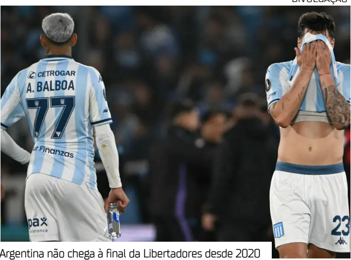
Argentina não chega à final da Libertadores desde 2020

Brasil Argentina Ao todo, os clubes argen-