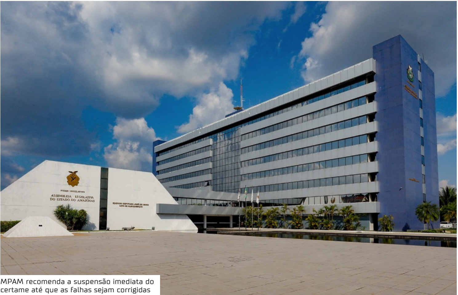
MPAM recomenda a suspensão imediata do certame até que as falhas sejam corrigidas

O Ministério Público determina que a Aleam constitua uma comissão específica e qualificada para a avaliação das autodeclarações raciais, com a participação de membros com notório conhecimento sobre diversidade racial e representatividade étnica.