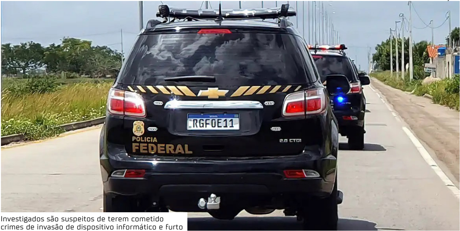
Investigados são suspeitos de terem cometido crimes de invasão de dispositivo informático e furto

Na ocasião, foram cumpridos mandados de prisão tempo-