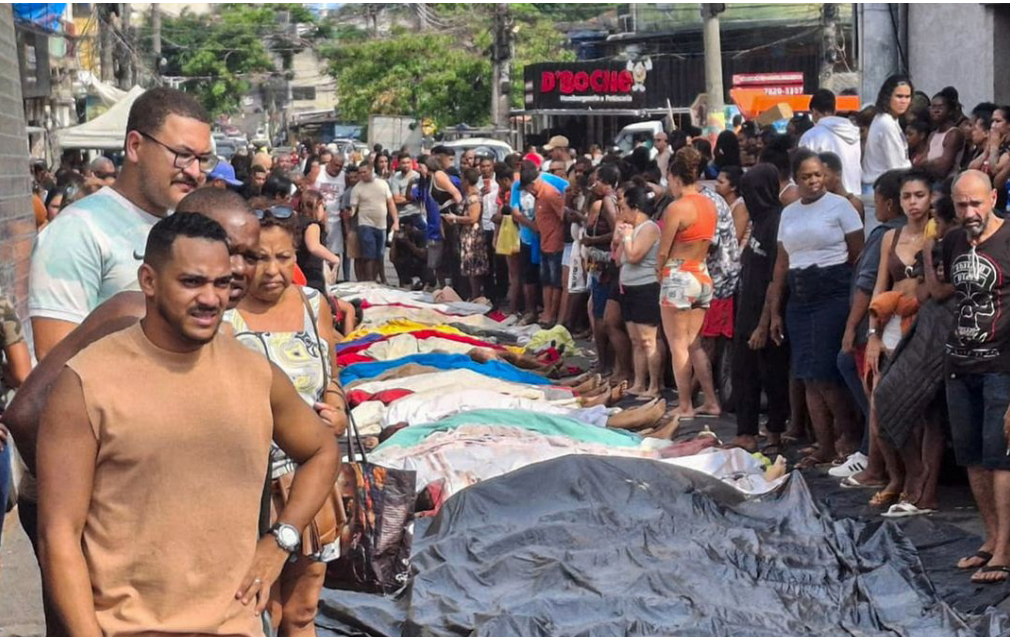
Após Argentina, governo de Santiago Peña aumentará controles contra entrada de criminosos brasileiros

O governo do Paraguai anunciou ontem (30) que vai classificar o Comando Vermelho (CV) e o Primeiro Comando da Capital (PCC) como organizações terroristas. O país também colocou toda a fronteira com o Brasil em alerta máximo.