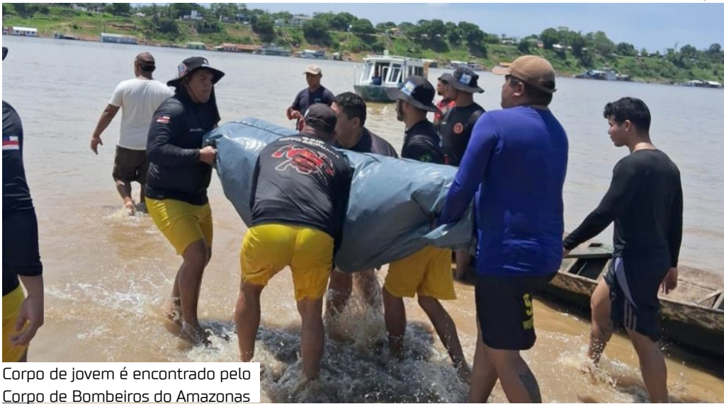
Corpo de jovem é encontrado pelo Corpo de Bombeiros do Amazonas

Mergulhadores dos Bombeiros encontraram, na manhã desta segunda-feira (13), o corpo do segundo jovem que estava desaparecido após um afogamento no rio Madeira, em frente à cidade de Novo Aripuanã, a 227 quilômetros de Manaus.