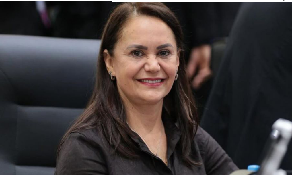
Parlamentar ficou 12 anos na Câmara Municipal de Manaus e atuou em defesa de mulheres e professores