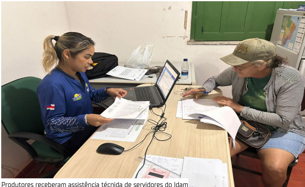
Produtores receberam assistência técnica de servidores do Idam

O Instituto de Desenvolvimento Agropecuário e Florestal Sustentável do Estado do Amazonas (Idam) concluiu ontem (13) um mutirão de elaboração de projetos de crédito rural em Uruará (a 261 quilômetros de Manaus).