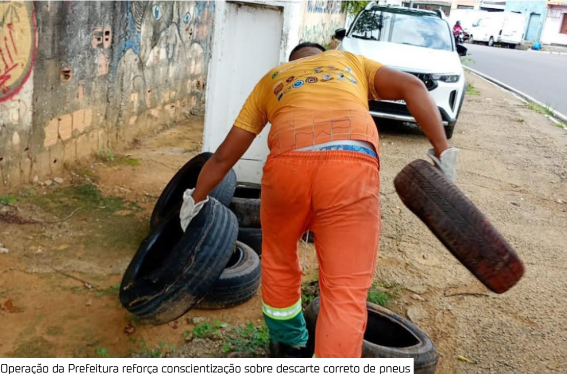
Operação da Prefeitura reforça conscientização sobre descarte correto de pneus

Ação reforça combate ao descarte irregular e aos focos do mosquito Aedes aegypti