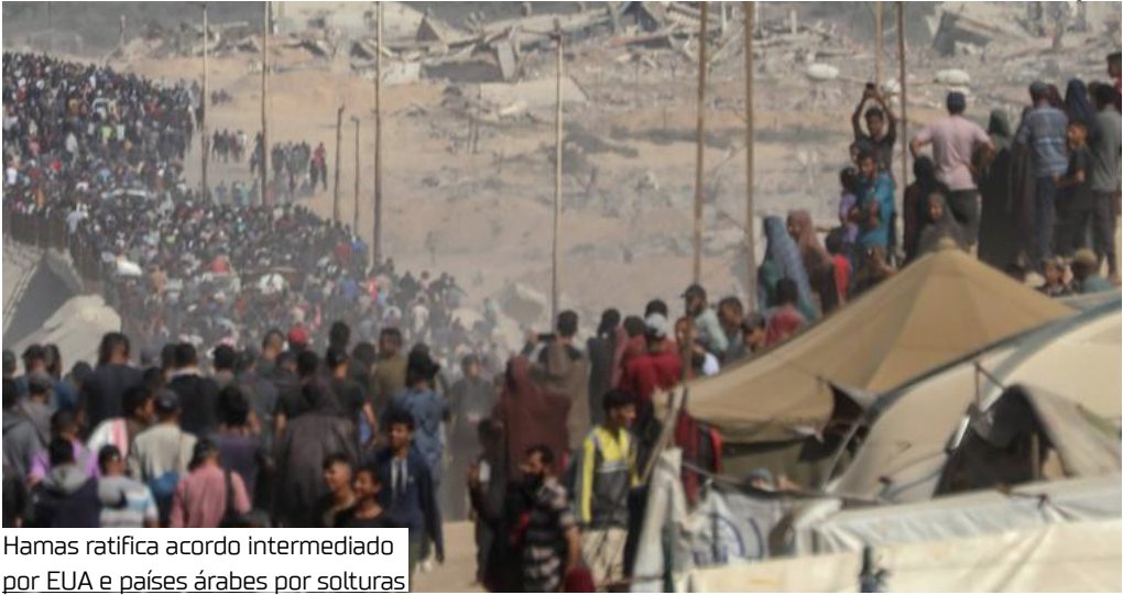
Hamas ratifica acordo intermediado por EUA e países árabes por solturas