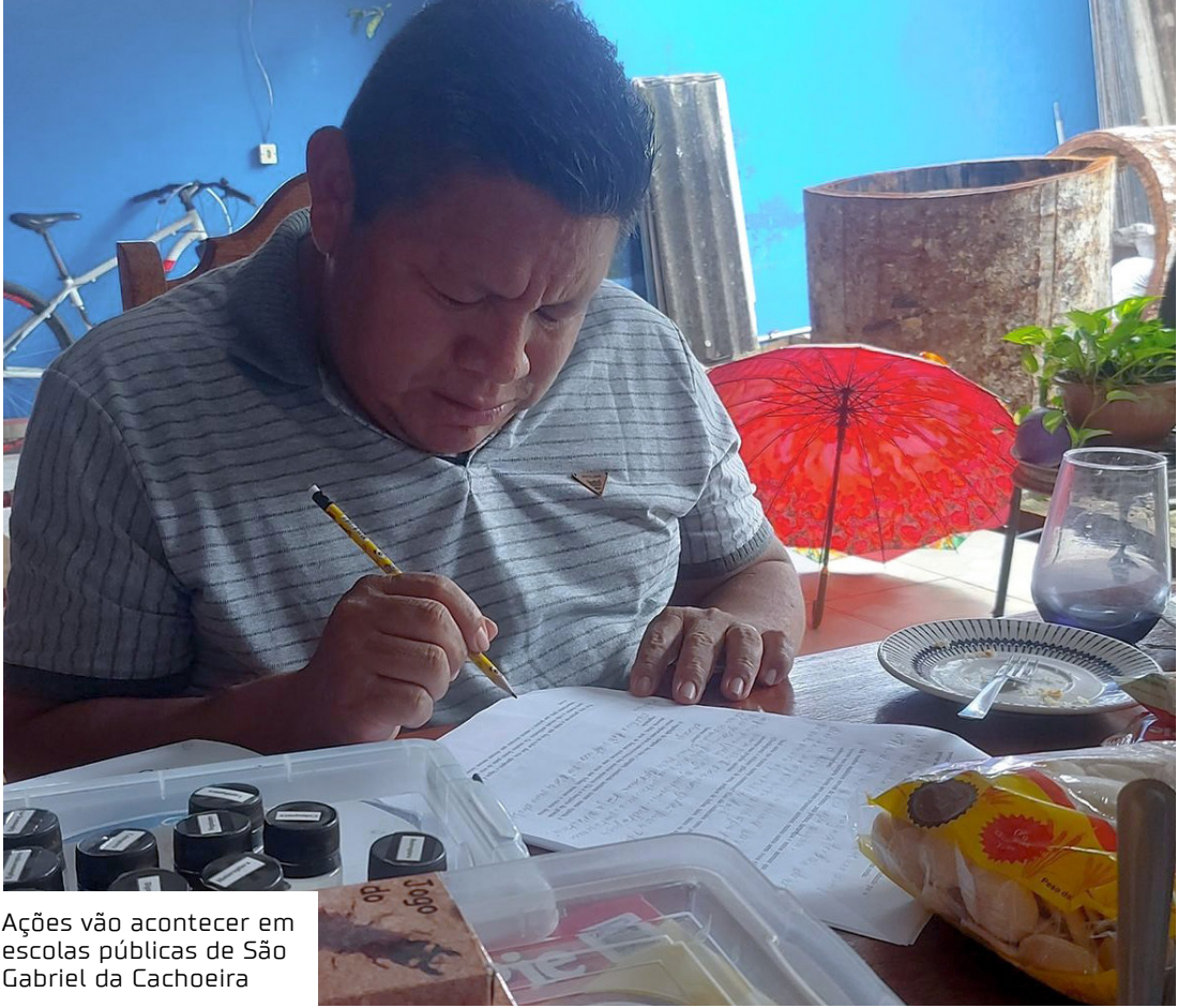
Ações vão acontecer em escolas públicas de São Gabriel da Cachoeira

“Interiorizar a informação é reconhecer que o conhecimento não deve ficar restrito aos grandes centros, mas precisa dialogar com as pessoas que vivem e cuidam