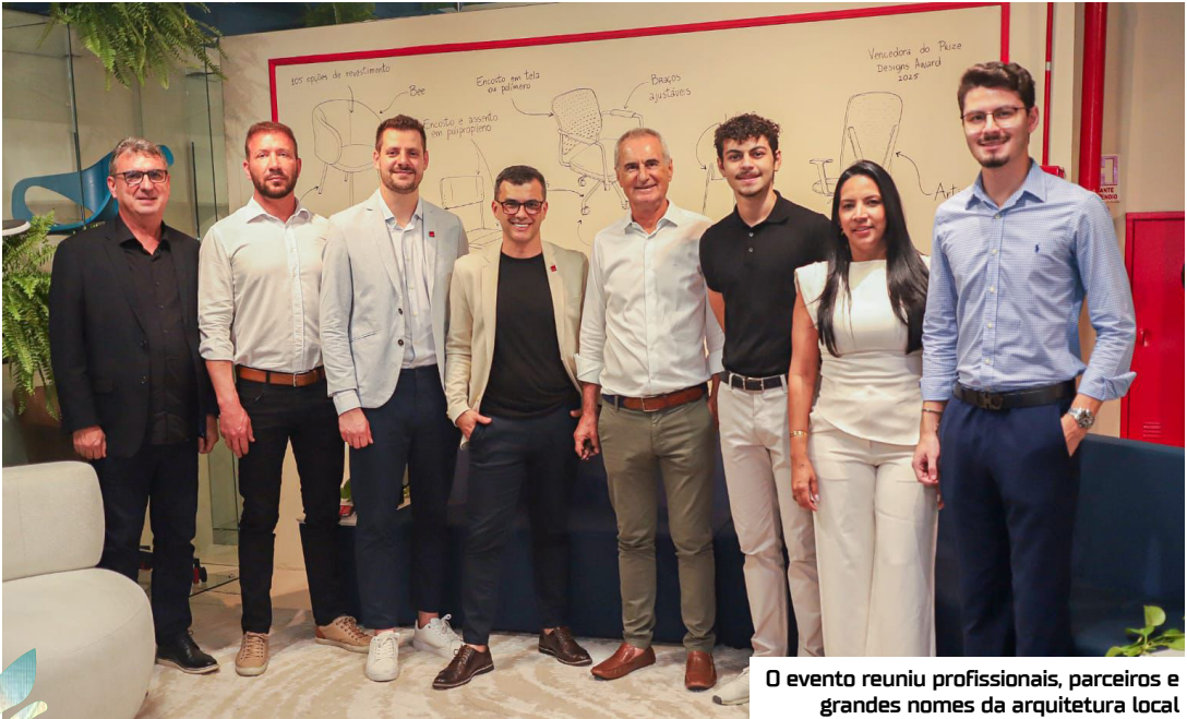
O evento reuniu profissionais, parceiros e grandes nomes da arquitetura local