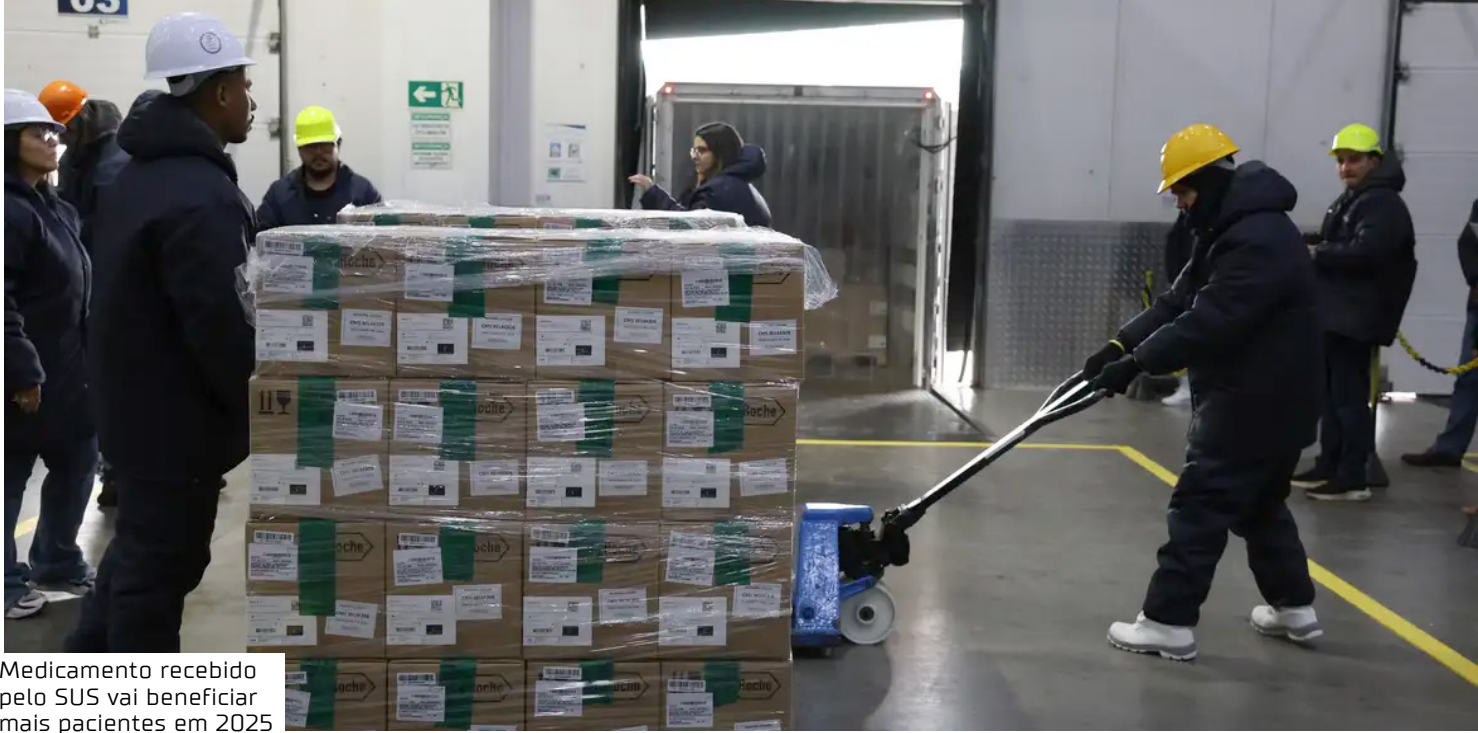
Medicamento recebido pelo SUS vai beneficiar mais pacientes em 2025

Segundo Carvalheira, a previsão é que o medicamento chegue aos pacientes já a partir deste mês, até o começo de novembro.