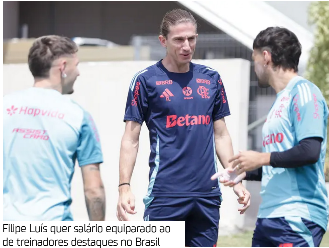
Filipe Luís quer salário equiparado ao de treinadores destaques no Brasil