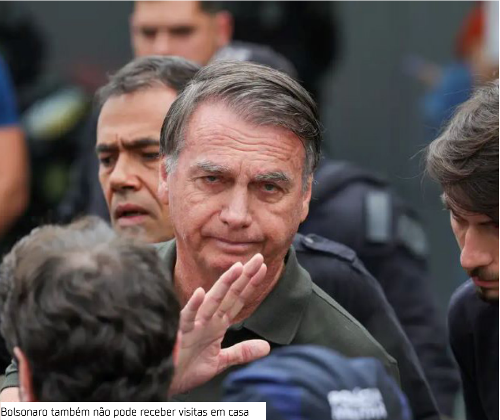
Bolsonaro também não pode receber visitas em casa

O ministro Alexandre de Moraes, do Supremo Tribunal Federal (STF), negou ontem (13) pedido da defesa do ex-presidente Jair Bolsonaro para que fossem revogadas a prisão domiciliar e outras medidas cautelares às quais o político está submetido. Moraes citou o “fundado receio de fuga do réu” e o “reiterado descumprimento das cautelas” para manter Bolsonaro preso em casa, medida que visa “a garantia da ordem pública e a necessidade de assegurar a integral aplicação da lei penal”, escreveu o ministro. No momento, pesa contra Bolsonaro um mandado de