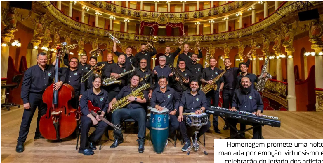
Homenagem promete uma noite marcada por emoção, virtuosismo e celebração do legado dos artistas