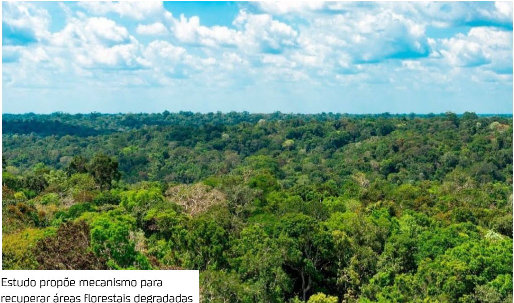
Estudo propõe mecanismo para recuperar áreas florestais degradadas

Transformar as florestas tropicais em ativos econômicos e climáticos: essa é a proposta do estudo divulgado nesta segunda-feira (13) pelo Climate Policy Initiative, ligado à Pontifícia Universidade Católica do Rio de Janeiro (CPI/PUC-Rio).