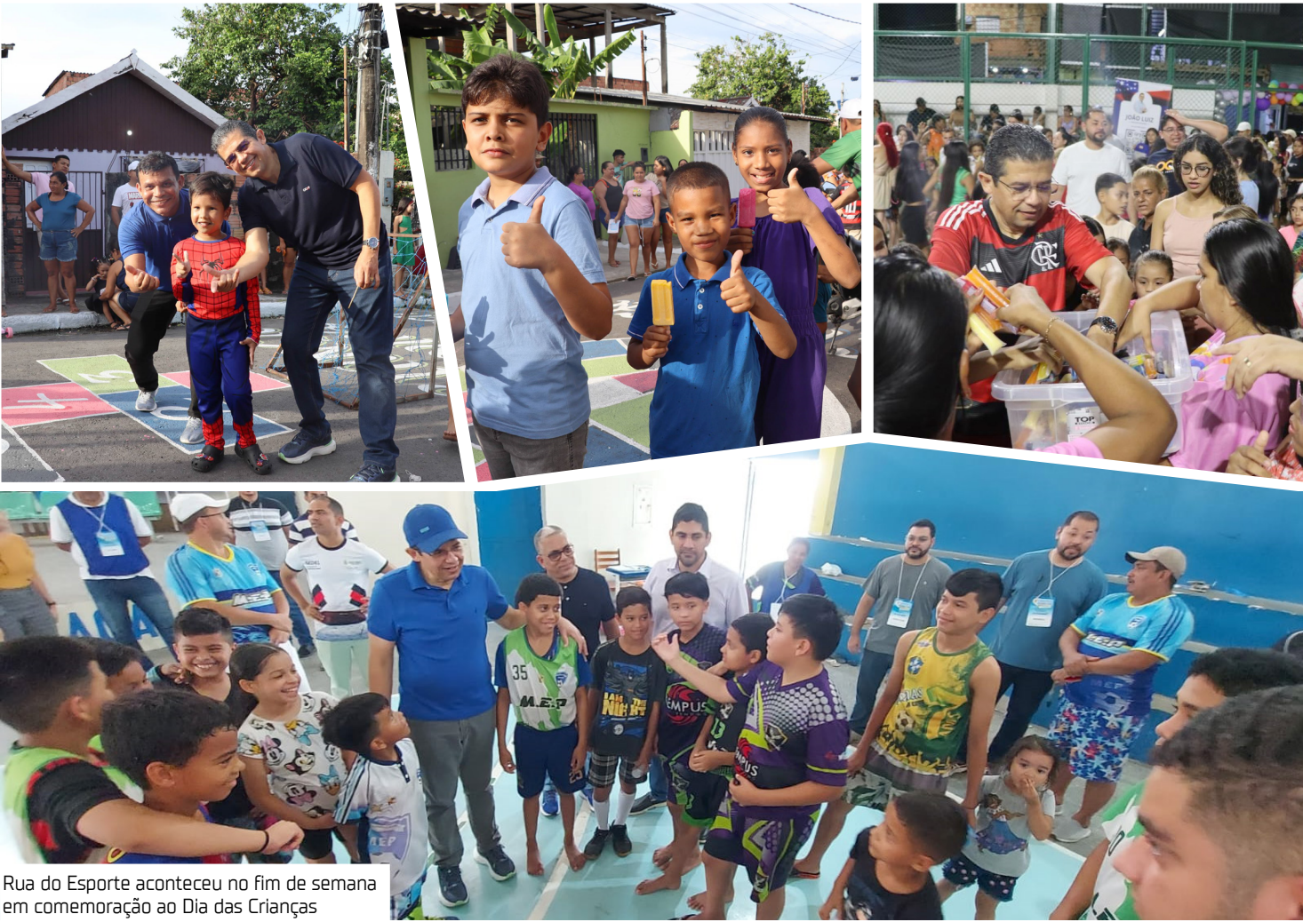
Rua do Esporte aconteceu no fim de semana em comemoração ao Dia das Crianças

Programação especial A programação contou com atividades esportivas e recreativas gratuitas, como vôlei, futebol de travinha, futebol de sabão, zumba, queimada, espaço kids com pular-pula, além de atendimento fisioterapêutico voltado a adultos e idosos.