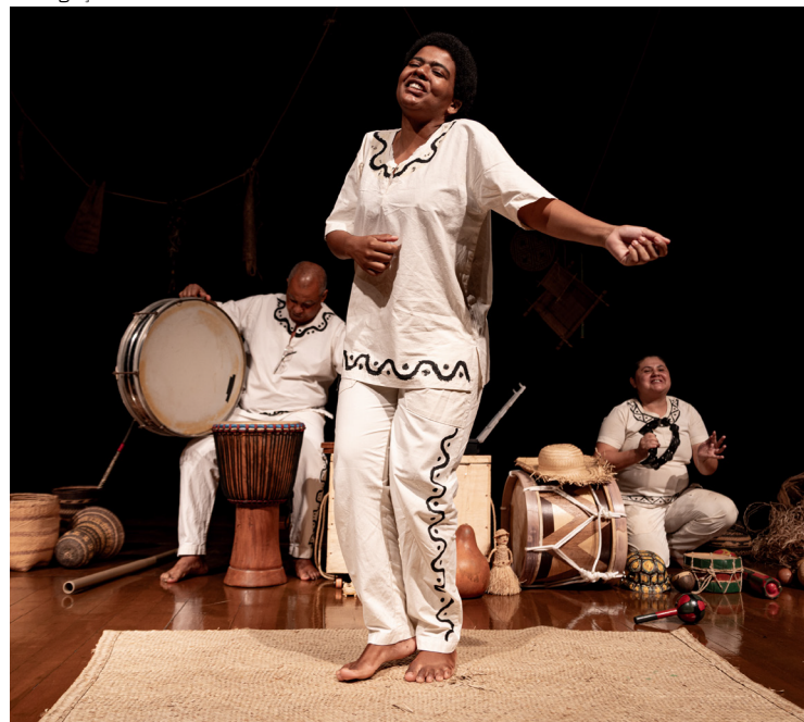
Cia Arteatro, de Roraima leva o premiado "Gotas de Saberes" às comunidades