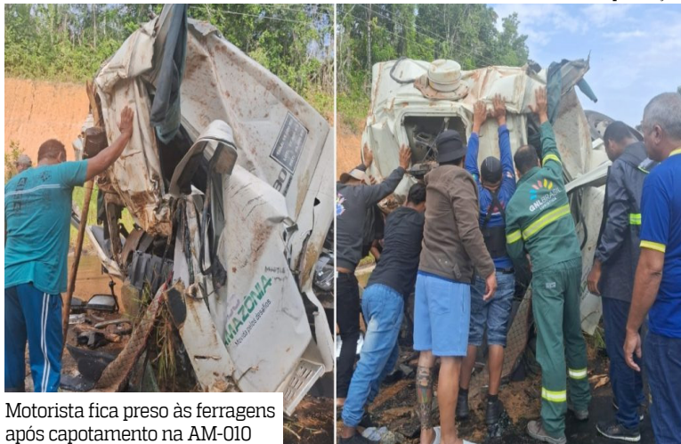
Motorista fica preso às ferragens após capotamento na AM-010

Um grave acidente envolvendo um caminhão-tanque foi registrado na manhã desta terça-feira (18) no quilômetro 130 da rodovia AM-010, que liga Manaus a Itacoatiara, a Deputado Vital de Mendonça. O motorista ficou preso às ferragens após o veículo capotar no acostamento.