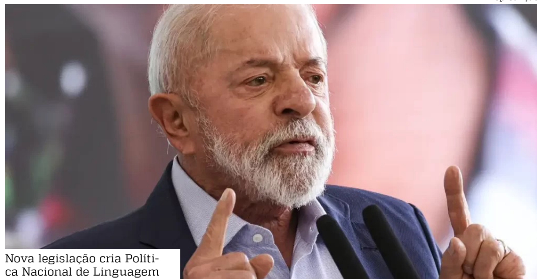
Nova legislação cria Política Nacional de Linguagem

No início do atual mandato de Lula, a palavra “todes” chegou a ser usada pela primeira-dama Rosângela da Silva, a Janja, pelo então ministro da Secretaria de Relações Institucionais, Alexandre Padilha, e por cerimonialistas em