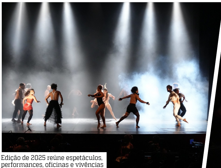
Edição de 2025 reúne espetáculos, performances, oficinas e vivências

O Festival tem apoio do Fórum Permanente de Dança, Idoa, Impact Hub, Casa-rão de Ideias, Icebu, Escola Superior de Artes e Turismo ESAT/UEA e Concultura. Criado para fomentar e difundir a dança em múltiplas linguagens, o FAD