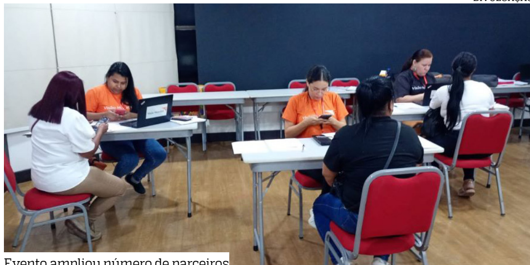
Evento ampliou número de parceiros

A ONG Visão Mundial realizou a 2ª Feira de Empregabilidade do projeto “Ven, Tú Puedes!”, oferecendo mais de 100 oportunidades de trabalho para refugiados, migrantes — sobretudo venezuelanos — e brasileiros em Manaus. O evento ocorreu das 8h às 15h, na Câmara de Dirigentes Lojistas (CDL), no Parque 10 de Novembro.