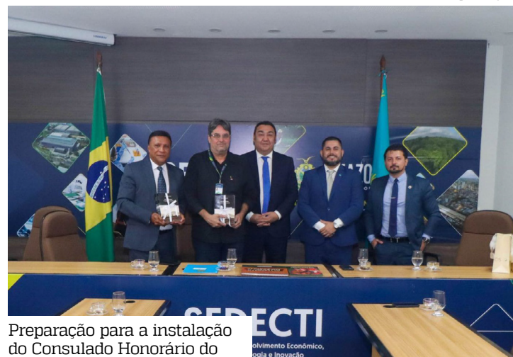
Preparação para a instalação do Consulado Honorário do

A visita também avançou na preparação para a instalação do Consulado Honorário do Cazaquistão em Manaus, prevista para o próximo ano.