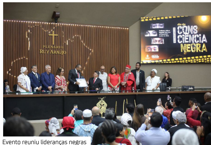
Evento reuniu lideranças negras

A Assembleia Legislativa do Amazonas (Aleam) realizou Sessão Especial em homenagem ao Dia Nacional da Consciência Negra, celebrando a memória de Zumbi dos Palmares e reforçando o compromisso institucional no enfrentamento ao racismo e na promoção da igualdade racial.