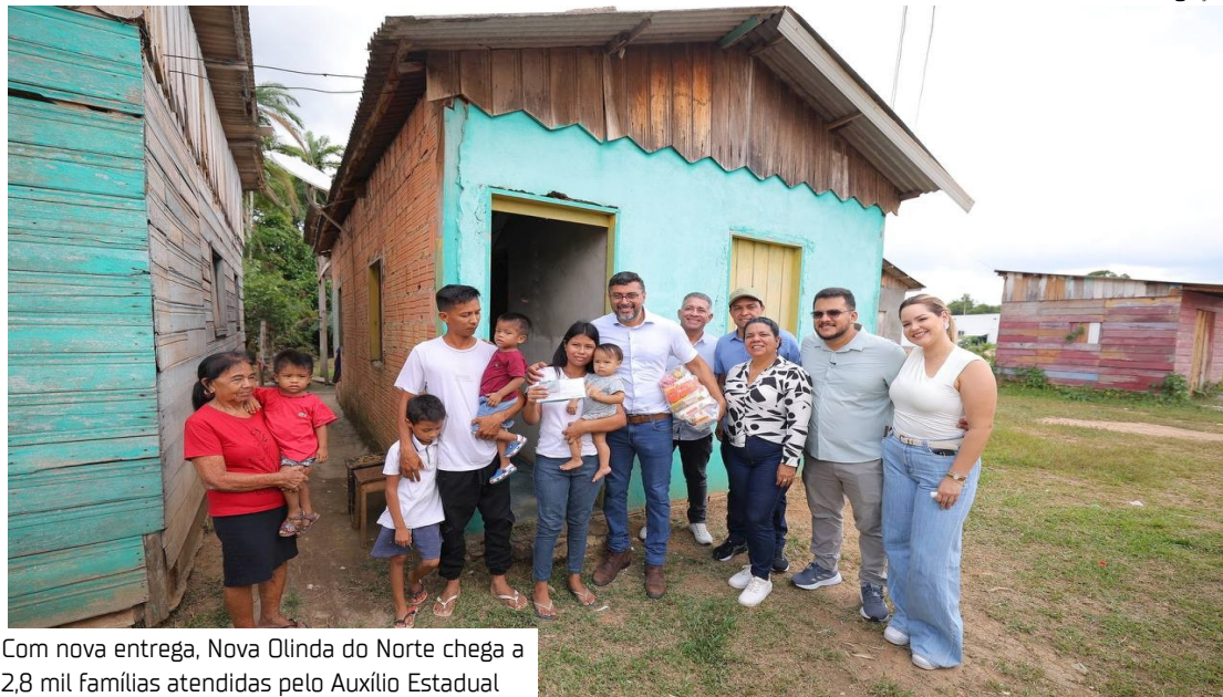
Com nova entrega, Nova Olinda do Norte chega a 2,8 mil famílias atendidas pelo Auxílio Estadual

“Nós estamos fazendo uma rodada por aqueles municípios e aquelas famílias em que há uma carência maior, são famílias em condição de vulnerabilidade social. Nós estamos comple-