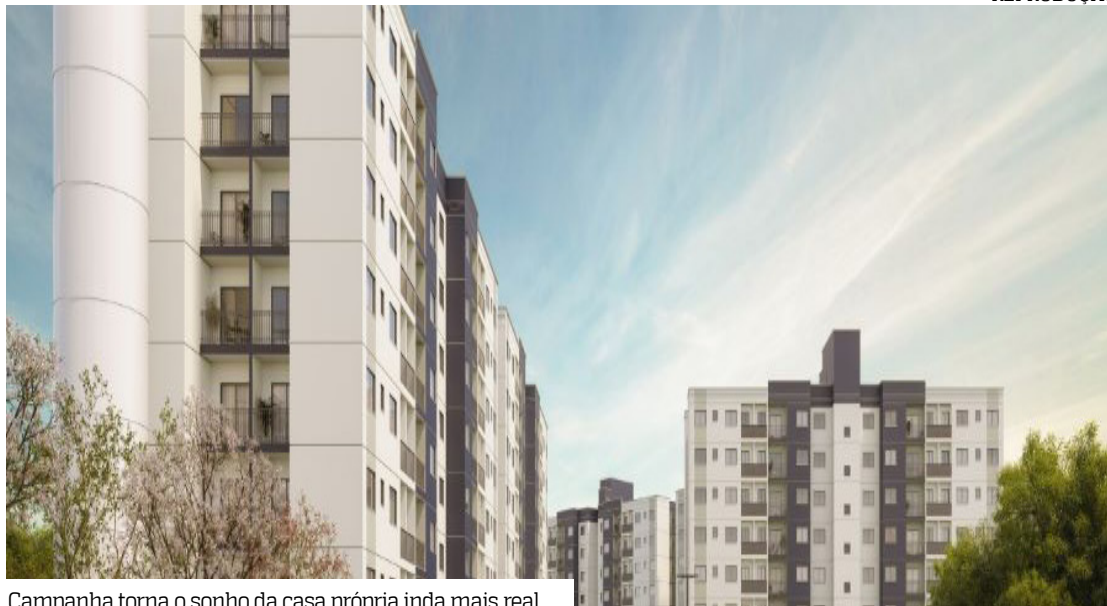
Campanha torna o sonho da casa própria inda mais real

Além de fortalecer a confiança do consumidor, a iniciativa busca favorecer o planejamento financeiro de quem deseja investir em um imóvel, aproveitando um momento tradi-