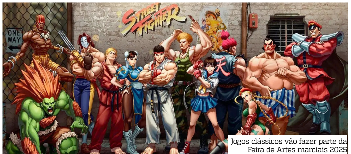
Jogos clássicos vão fazer parte da Feira de Artes marciais 2025