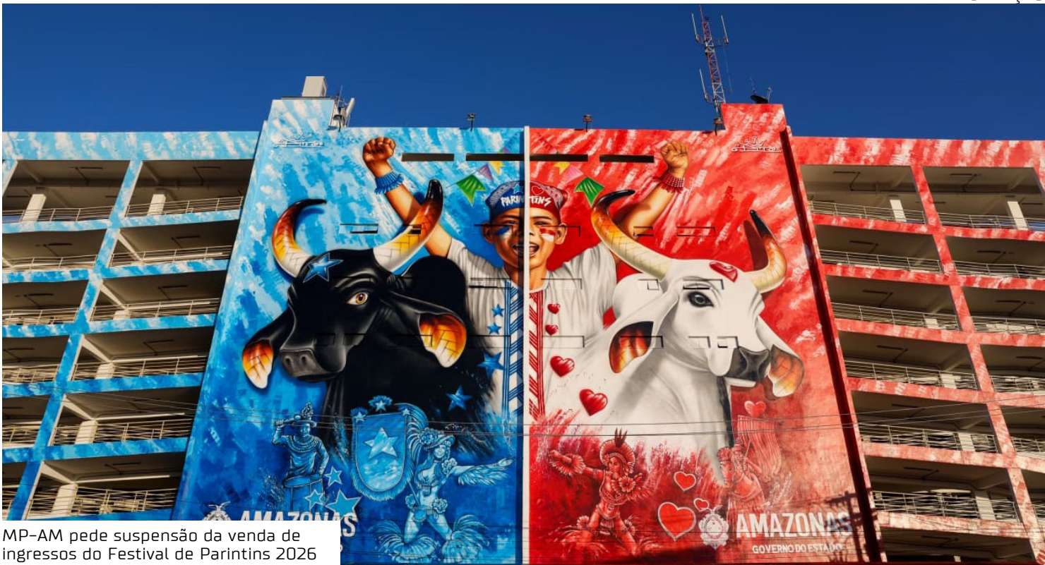
MP-AM pede suspensão da venda de ingressos do Festival de Parintins 2026

cial), com o ingresso diário sofrendo um acréscimo de 82,9% por noite. Ao todo, as três noites de espetáculo totalizariam um aumento injustificado de 248,70%. A iminência do início das vendas, marcado para as 10h da próxima sexta-feira (7), justifica a urgência da medida. De acordo com a tabela de comparação de valores de 2025 e 2026, enquanto, neste ano, o ingresso avulso (um dia) mais barato custava R$ 500 e o passaporte para três dias de evento custava R$ 1.440, na próxima edição, o ingresso avulso custará R$1 mil e o passaporte R$ 3 mil — respectivamente, aumentos de 81,8% e 108,3%. A ausência de qualquer tipo de divulgação de justificativas sobre os reajustes caracteriza, em tese, prática abusiva segundo o art. 39 do Código de Defesa do Consumidor. A promotora de Justiça Sheyla Andrade dos Santos, titular da 81ª Prodecon, ressaltou a necessidade de transparência por parte da empresa, sendo essencial que forneça esclarecimen-