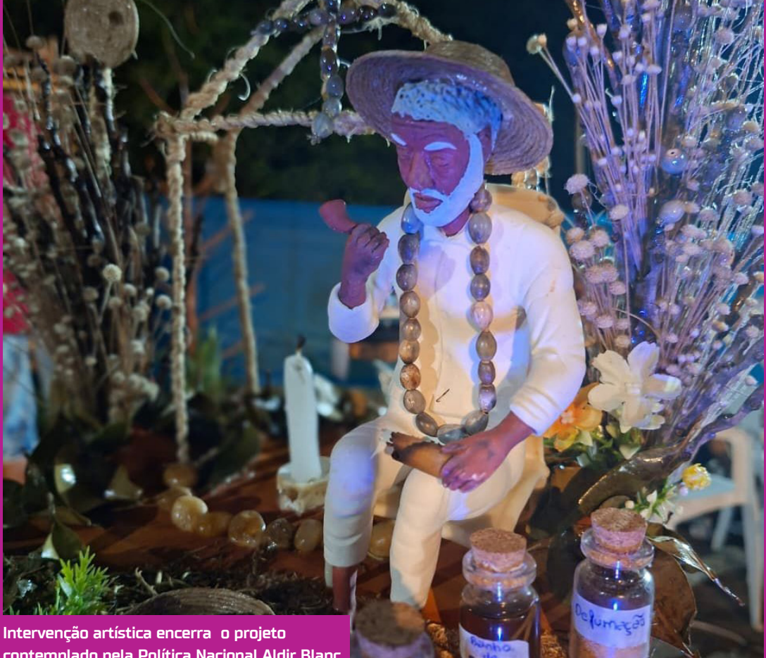
Intervenção artística encerra o projeto contemplado pela Política Nacional Aldir Blanc