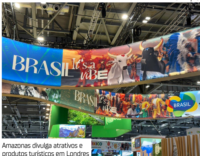
Amazonas divulga atrativos e produtos turísticos em Londres

dia, o embaixador do Brasil no Reino Unido, Antonio Patriota, participou da cerimônia de abertura dos trabalhos da Embratur na feira, na área reservada do Brasil. Durante a WTM Londres 2025, agentes de viagens, influenciadores e profissionais do setor de turismo terão acesso aos principais roteiros e atrativos do Amazonas. A expectativa é de que mais de 46 mil visitantes, de 180 países, passem pelo evento.