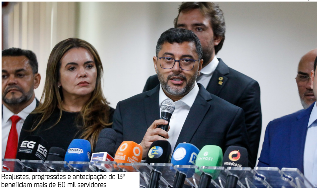
Reajustes, progressões e antecipação do 13º beneficiam mais de 60 mil servidores