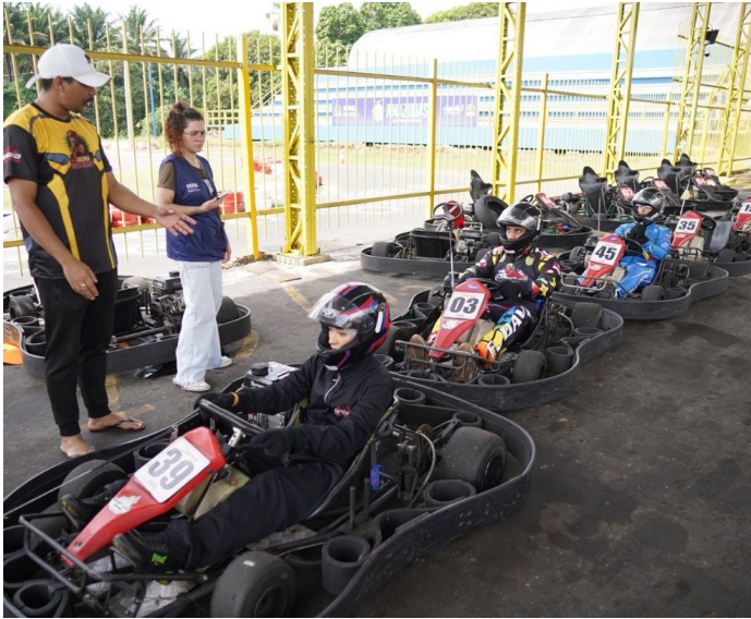
Nova modalidade do Pelci marca avanço na formação esportiva

O Governo do Amazonas, por meio da Secretaria de Estado do Desporto e Lazer (Sedel), realizou, na manhã de ontem, terça-feira (4), a primeira aula de kart do Programa Esporte e Lazer na Capital e Interior (Pelci), na Vila Olímpica de Manaus. A nova modalidade amplia as oportunidades oferecidas pelo programa e representa um passo importante na formação esportiva de crianças e adolescentes amazonenses.