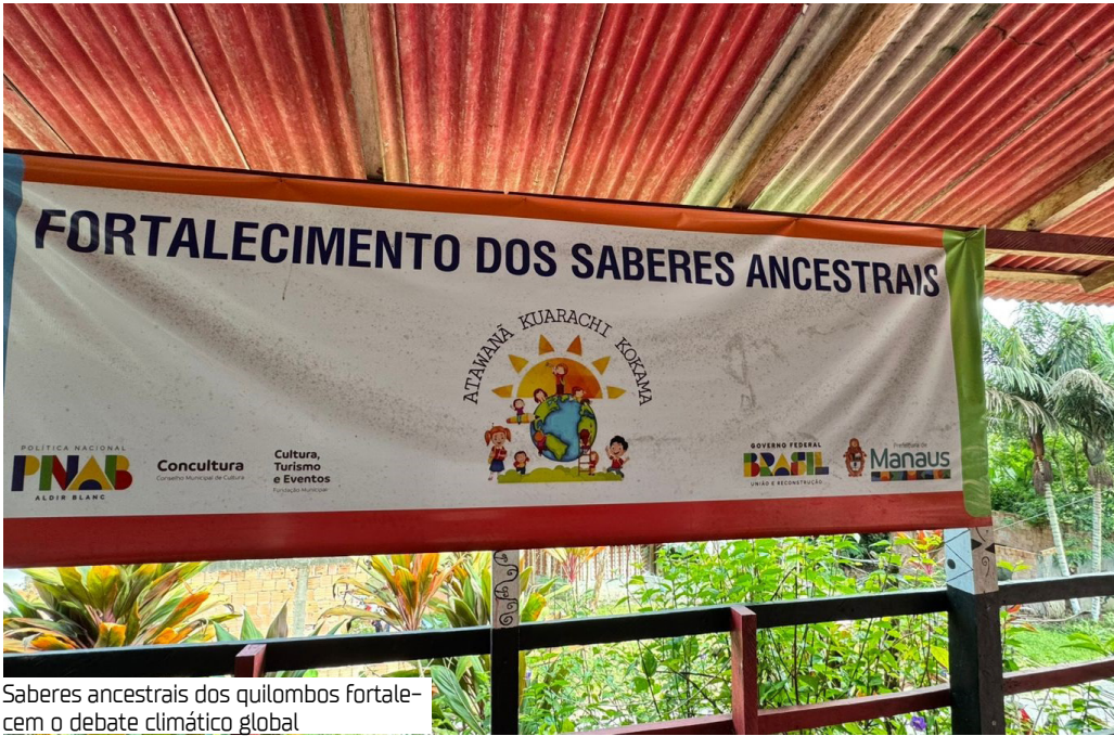
Saberes ancestrais dos quilombos fortalecem o debate climático global

Entre os dias 11 e 21 de novembro, Belém, a capital paraense, sediará a 30ª Conferência da ONU sobre Mudanças Climáticas (COP30). O Evento receberá líderes mundiais, cientistas e a sociedade civil para discutir e negociar ações de combate à crise climática. Saberes ancestrais contribuem ativamente para a preservação de biomas e de recursos naturais Com os holofotes jogados para essa discussão, os saberes ancestrais, sobretudo das comunidades quilombolas, ganham força no debate climático global, visto que a população detém de práticas sustentáveis há