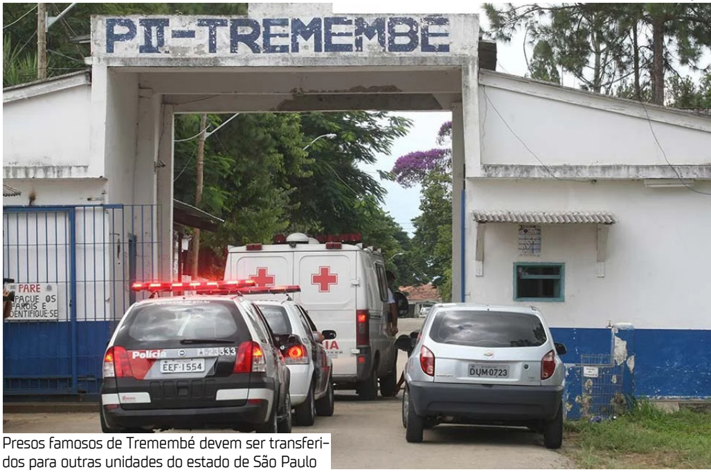
Presos famosos de Tremembé devem ser transferidos para outras unidades do estado de São Paulo