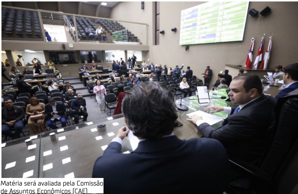
Matéria será avaliada pela Comissão de Assuntos Econômicos (CAE)

Está em tramitação na Assembleia Legislativa do Amazonas (Aleam) a Mensagem Governamental nº 125/2025, que encaminha o Projeto de Lei de Diretrizes Orçamentárias (LDO) para o exercício de 2026, com estimativa orçamentária de mais de R$ 38 bilhões. Em relação ao ano anterior, o orçamento de 2026 apresenta um crescimento de R$ 6,6 bilhões, o que equivale a 21% de aumento. Agora, a matéria será avaliada pela Comissão de Assuntos Econômicos (CAE), antes de passar pelas demais comissões, para então ser votada pelos deputados no plenário Ruy Araújo. O presidente da Aleam, deputado Roberto Cidade (União Brasil), afirmou que a aprovação da LDO é um passo essencial para garantir que o orçamento do Estado atenda às reais necessidades da população.