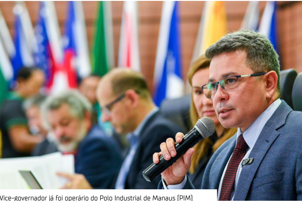
Vice-governador já foi operário do Polo Industrial de Manaus (PIM)

O vice-governador do Amazonas, Tadeu de Souza, afirmou que o modelo Zona Franca de Manaus (ZFM) é solução para os desafios da economia brasileira. Por meio de suas redes sociais, ontem (4), o vice-governador enfatizou a importância da consolidação de um dos maiores parques fabris do país diante dos números positivos de faturamento e geração de empregos.