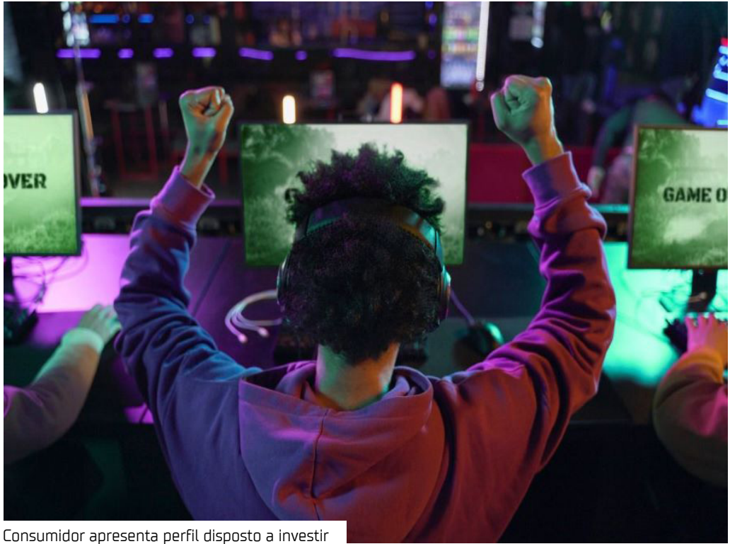
Consumidor apresenta perfil disposto a investir

público, com a inauguração da sua maior unidade, com mais de 1,2 mil metros quadrados, na avenida Torquato Tapajós, bairro Flores, zona centro-sul. O local conta com espaços personalizados para o consumidor gamer. A nova loja dispõe de área exclusiva para montagem personalizada de PCs, consultoria técnica especializada e ambientes voltados à imersão nas novas tecnologias.