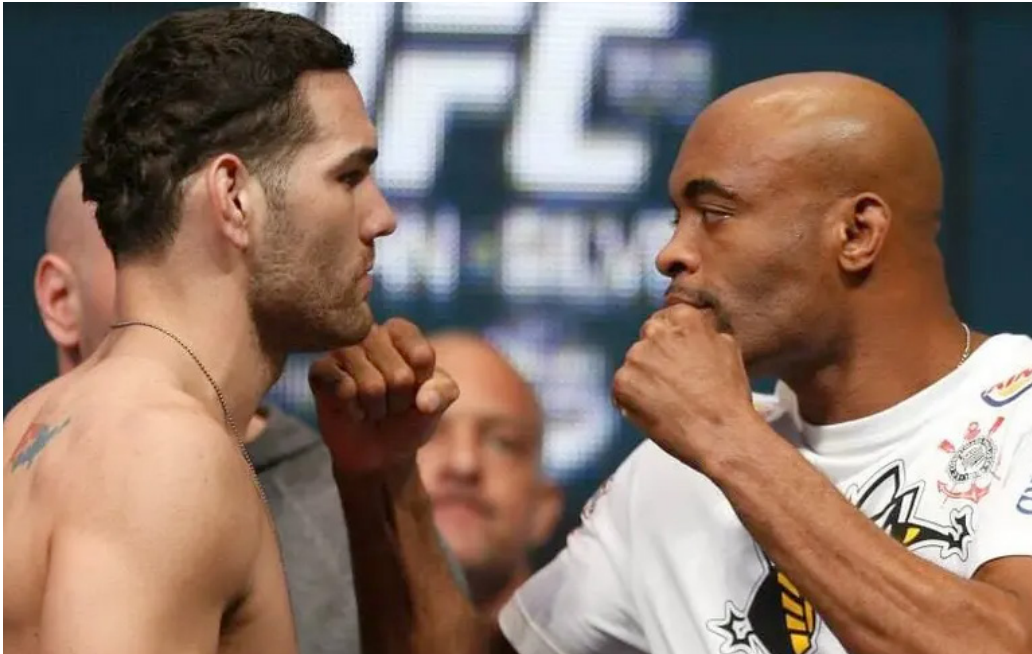
Silva e Weidman e outros cards são cancelados