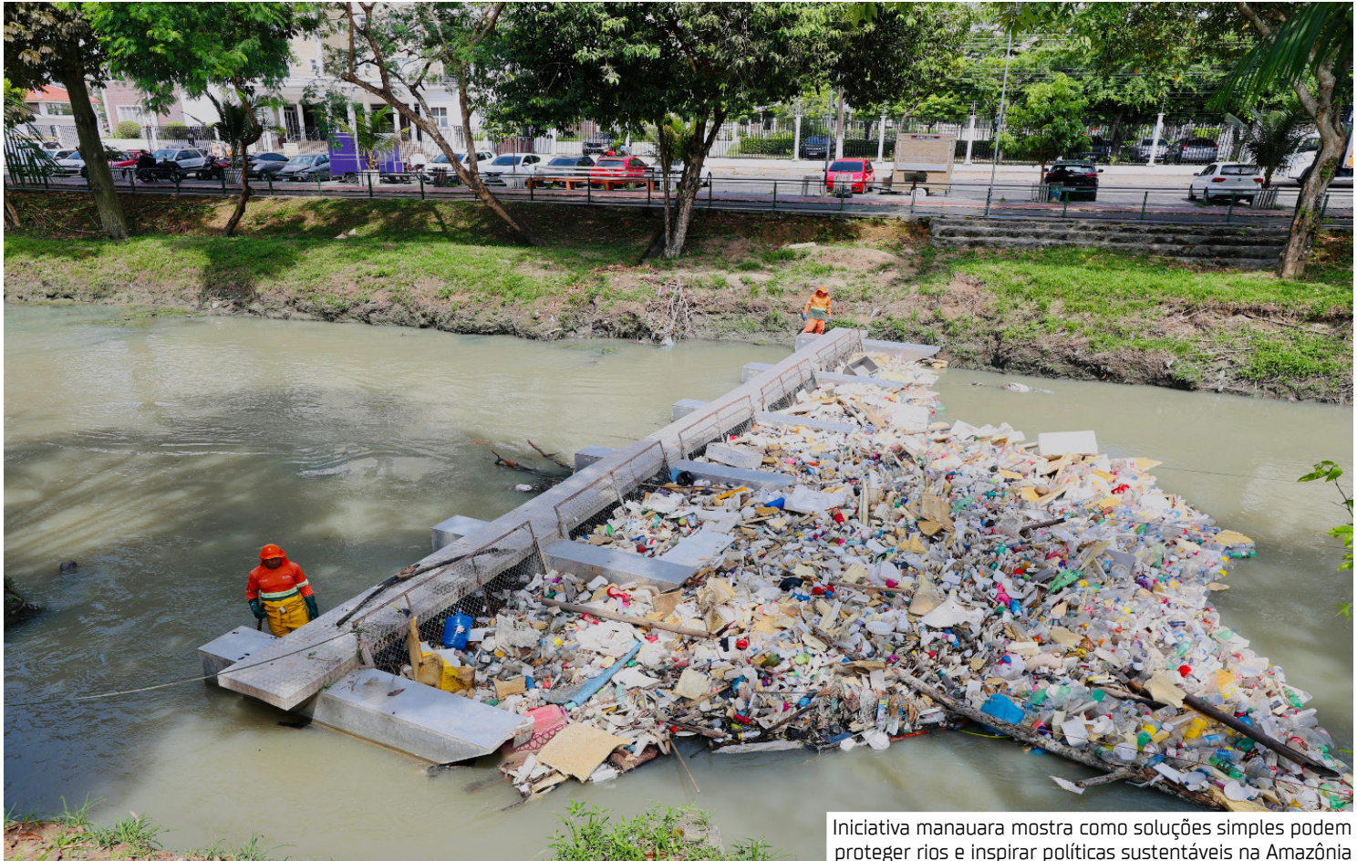
Iniciativa manauara mostra como soluções simples podem proteger rios e inspirar políticas sustentáveis na Amazônia

ambiente. Somente no ano passado, foram retiradas 2,8 mil toneladas de lixo por meio das estruturas. Neste ano, de janeiro a junho, as ecobarreiras já resultaram no recolhimento de 1,6 mil toneladas de resíduos. “Na próxima semana, nós vamos ter na cidade de Belém/PA a COP30. Dentre outros projetos, nós vamos apresentar o projeto das ecobarreiras, que ajudam a preservar o meio ambiente. Agente consegue, por mês, segurar nas 12 ecobarreiras, que nós temos, aproximadamente 300 toneladas de lixo. Lixo esse que iria descer os igarapés, chegar até o grande rio Negro e, posteriormente, chegar até o oceano. Com isso, a gente contribui para o meio ambiente, preservando os nossos mananciais, e é essa a nossa ideia: buscar soluções para que nós possamos melhorar o meio ambiente”, destacou o prefeito David Almeida. O titular da Secretaria Municipal de Limpeza Urbana (Semulsp), Sabá Reis, disse que as ecobarreiras impedem que, por exemplo, uma carcaça de geladeira, descartada de maneira inadequada, chegue a obstruir a rede de esgoto na capital, algo que pode causar alagamentos, mas é necessário que a população continue se conscientizando para evitar trans-