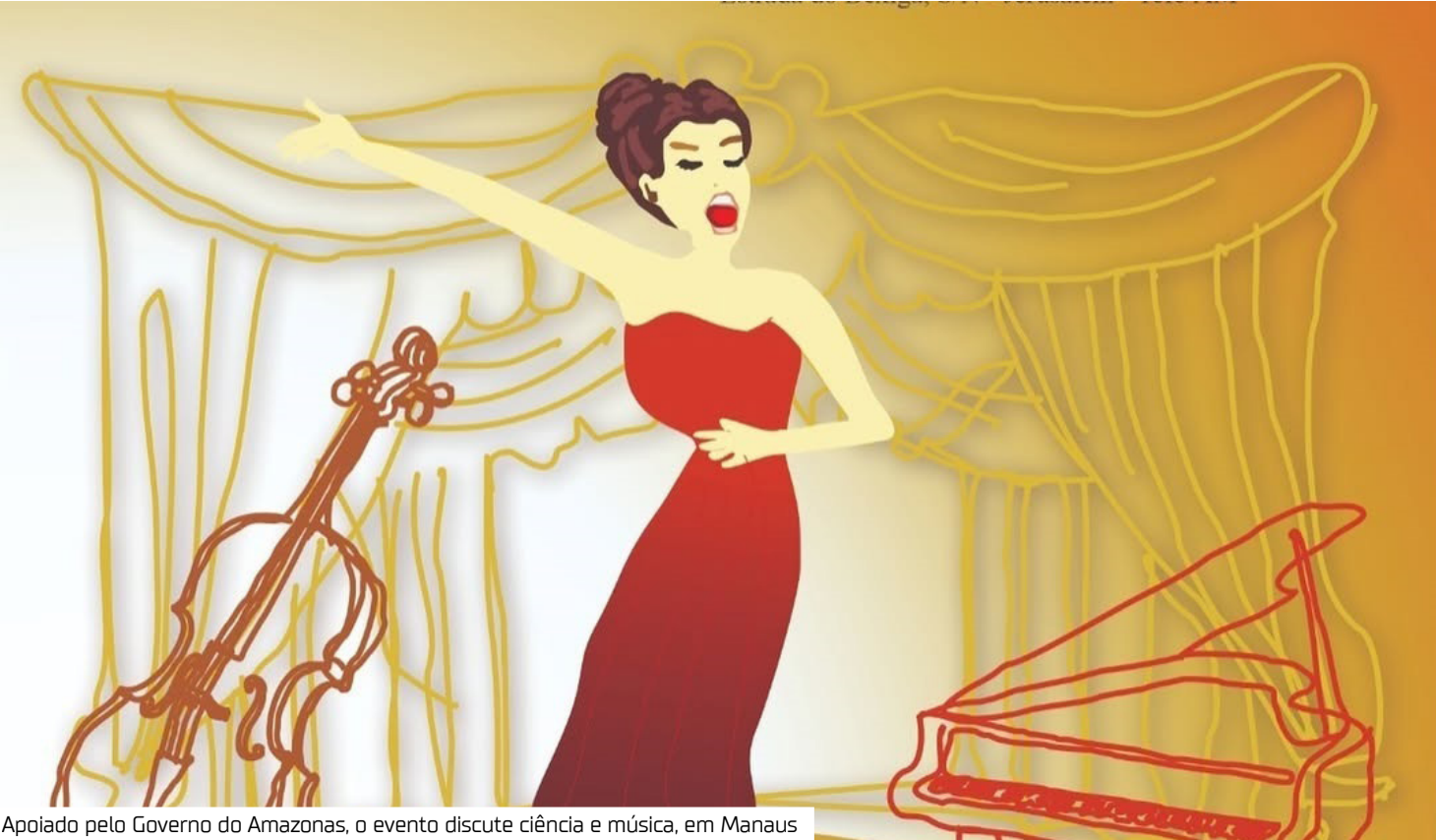
Apoiado pelo Governo do Amazonas, o evento discute ciência e música, em Manaus