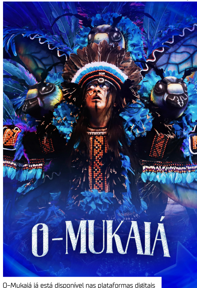
O-Mukaiá já está disponível nas plataformas digitais