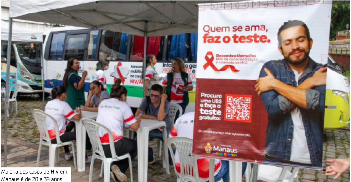
Maioria dos casos de HIV em Manaus é de 20 a 39 anos

“O tratamento em tempo oportuno vai reduzir as complicações pela doença e o risco de mortalidade. Além disso, é