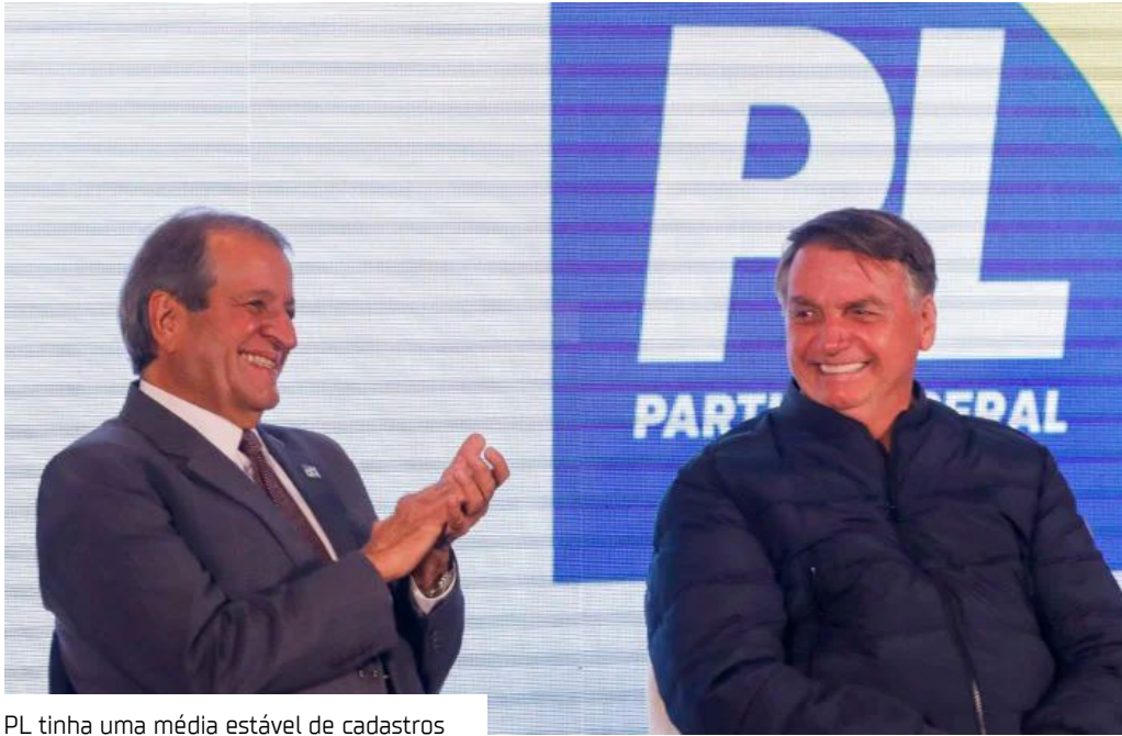
PL tinha uma média estável de cadastros

A prisão do ex-presidente Jair Bolsonaro, ocorrida no sábado (22), provocou uma movimentação imediata no cenário partidário nacional. Nas 48 horas seguintes, o Partido Liberal (PL) registrou um volume extraordinário de novas filiações, ultrapassando a marca de 20 mil inscrições — um crescimento que destoou completamente do ritmo usual da legenda.