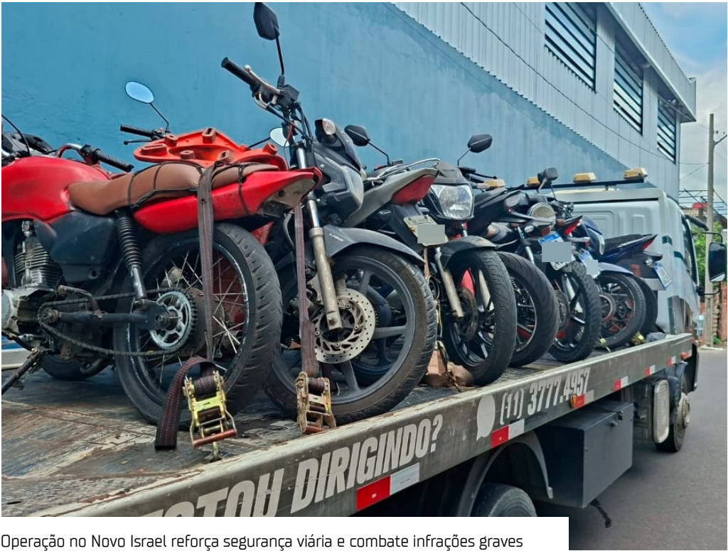
Operação no Novo Israel reforça segurança viária e combate infrações graves