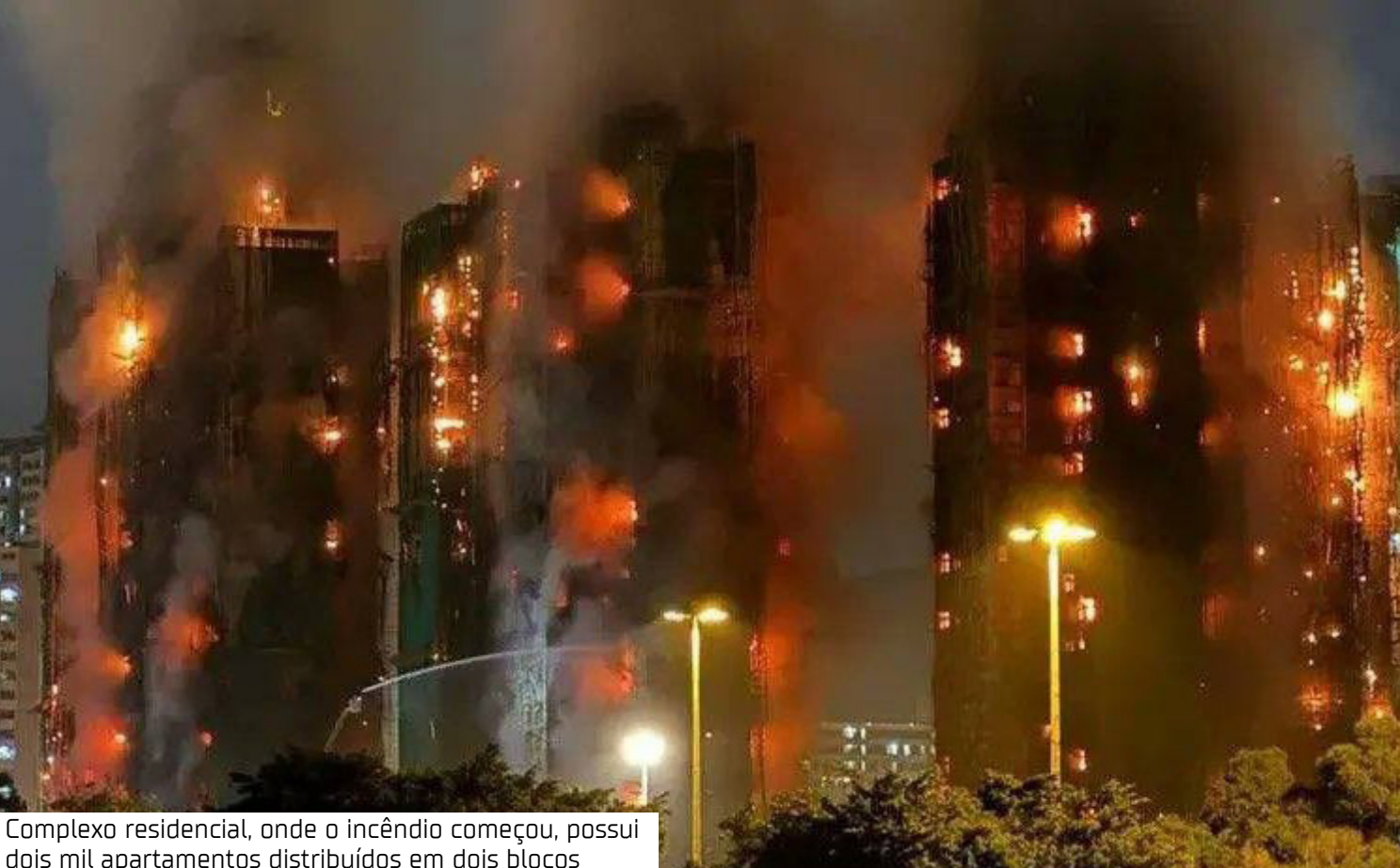
Complexo residencial, onde o incêndio começou, possui dois mil apartamentos distribuídos em dois blocos

Mais tarde, às 18h22, o incêndio foi classificado como nível 5, o mais alto da cidade. Hong Kong é um dos últimos lugares do mundo onde o bambu ainda é amplamente usado como andaime na construção civil. O Departamento de Transportes de Hong Kong infor-