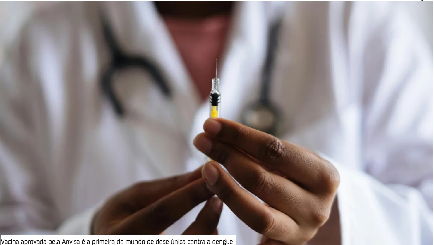
Vacina aprovada pela Anvisa é a primeira do mundo de dose única contra a dengue

publicados nas revistas científicas New England Journal of Medicine e The Lancet Infectious Diseases. O imunizante se mostrou seguro e eficaz tanto em pessoas com infecção prévia como naquelas que nunca tiveram contato com o patógeno. Também demonstrou ser eficaz contra os quatro sorotipos da dengue. Como funciona? A Butantan-DV será administrada em dose única, diferente de outros imunizantes disponíveis no mercado, que necessitam de duas a três doses. Segundo o Butantan, esse esquema pode facilitar a adesão e a logística de vacinação. “É a primeira vacina brasileira para a dengue, de uma dose apenas, melhor do que as que possuímos hoje”, explica Alexandre Padilha, ministro da Saúde, no Live CNN. “Estudos também apontam proteção mais ampla do que as disponíveis no mercado”. O Ministério da Saúde planeja realizar uma reu-