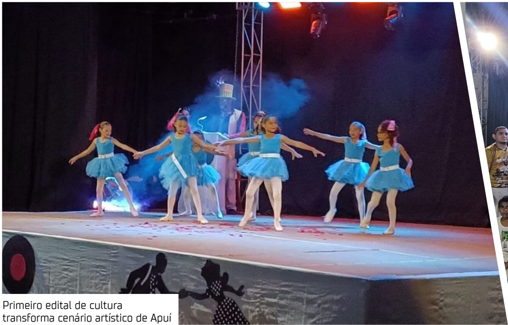
Primeiro edital de cultura transforma cenário artístico de Apuí