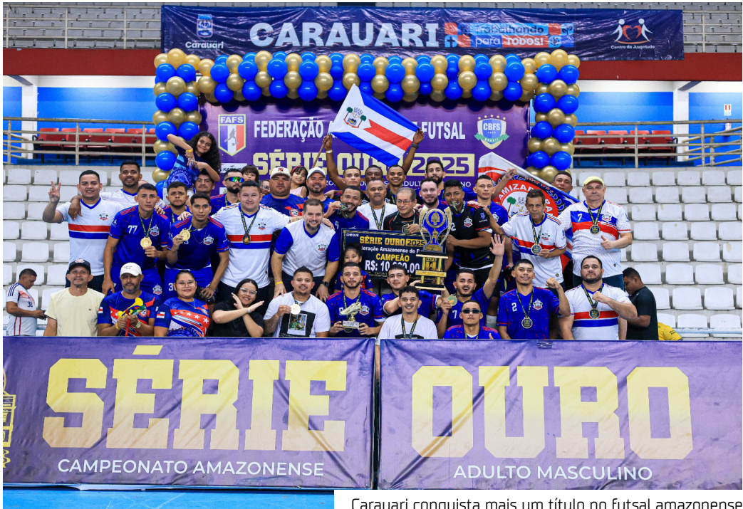
Carauari conquista mais um título no futsal amazonense