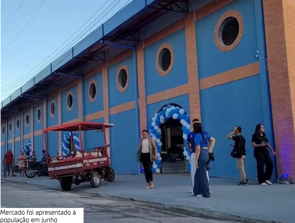
Mercado foi apresentado à população em junho