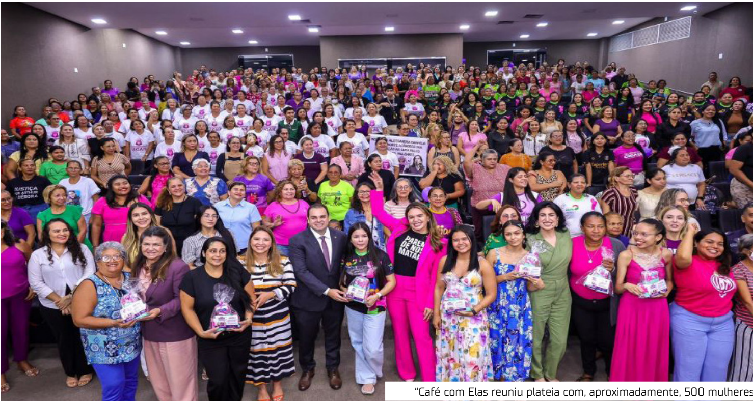
“Café com Elas reuniu plateia com, aproximadamente, 500 mulheres

“É importante ressaltar que, embora nós sejamos, como mulheres, minoria aqui no plenário, a gente tem o apoio maciço do presidente Roberto e dos deputados para a realização do trabalho da Procuradoria. A Assembleia Legislativa do Amazonas, entre todas as procuradorias da mulher do Brasil, é a que mais faz atendimentos diretos e a que tem uma participação mais ativa junto à rede de proteção às mulheres. Agradeço aos