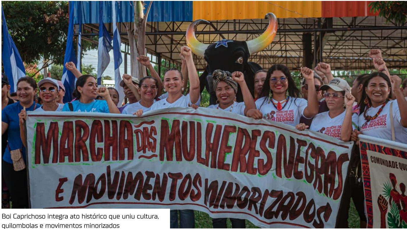
Boi Caprichoso integra ato histórico que uniu cultura, quilombolas e movimentos minorizados

O Boi Caprichoso participou, na terça-feira (25), da 1ª Marcha das Mulheres Negras e Movimentos Sociais Minorizados de Parintins, que reuniu mulheres, lideranças quilombolas e representantes culturais em um ato integrado à Marcha Nacional das Mulheres Negras, realizada simultaneamente em Brasília. Com o tema central “Racismo Ambiental”, o evento ressaltou a importância de combater desigualdades, violências e assegurar direitos às mulheres negras e comunidades minoriza-