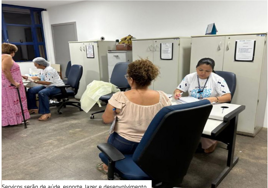
Serviços serão de saúde, esporte, lazer e desenvolvimento

O Serviço Social do Transporte e Serviço Nacional de Aprendizagem do Transporte (SEST SENAT) informa que, nesta sexta-feira (28), realiza o evento Portas Abertas, das 9h às 17h, na sede da instituição, localizada na avenida Autaz Mirim, bairro Jorge Teixeira, Zona Leste de Manaus. Com participação totalmente gratuita, a iniciativa oferece uma programação intensa de atividades e serviços voltados à população, reunindo saúde, lazer e desen-