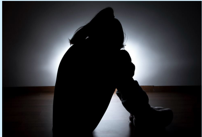
Adolescentes indígenas são suspeitos de cometer o crime e filmar