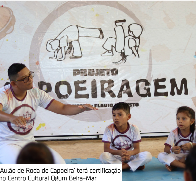
'Aulão de Roda de Capoeira' terá certificação no Centro Cultural Ogum Beira-Mar

O projeto Capoeiragem é um desdobramento da iniciativa 'Benção', contemplada pela Lei Paulo Gustavo em 2023. A ação atende crianças, adolescentes e jovens das periferias de Parintins, proporcionando oficinas de capoeira com foco em desenvolvimento artístico-criativo, formação cidadã e fortalecimento de identidade e ancestralidade.