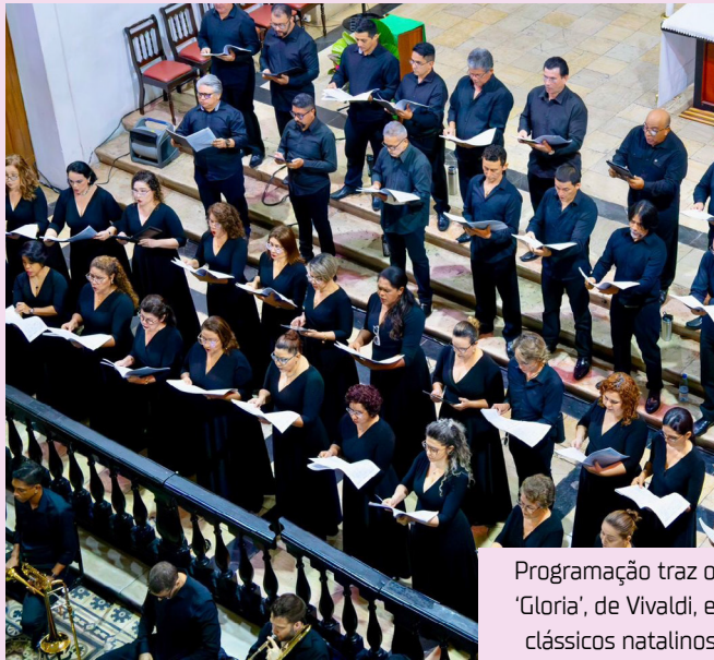
Programação traz o ‘Gloria’, de Vivaldi, e clássicos natalinos

Gratuito e aberto ao público, o concerto integra as ações do Circuito Natalino de 2025, iniciativa que valoriza tradições culturais, fomenta a fruição artística e aproxima a população da música clássica em espaços históricos da capital amazonense.