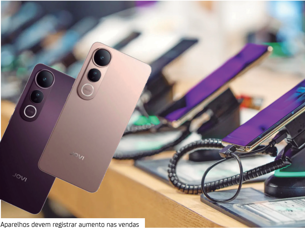
Aparelhos devem registrar aumento nas vendas