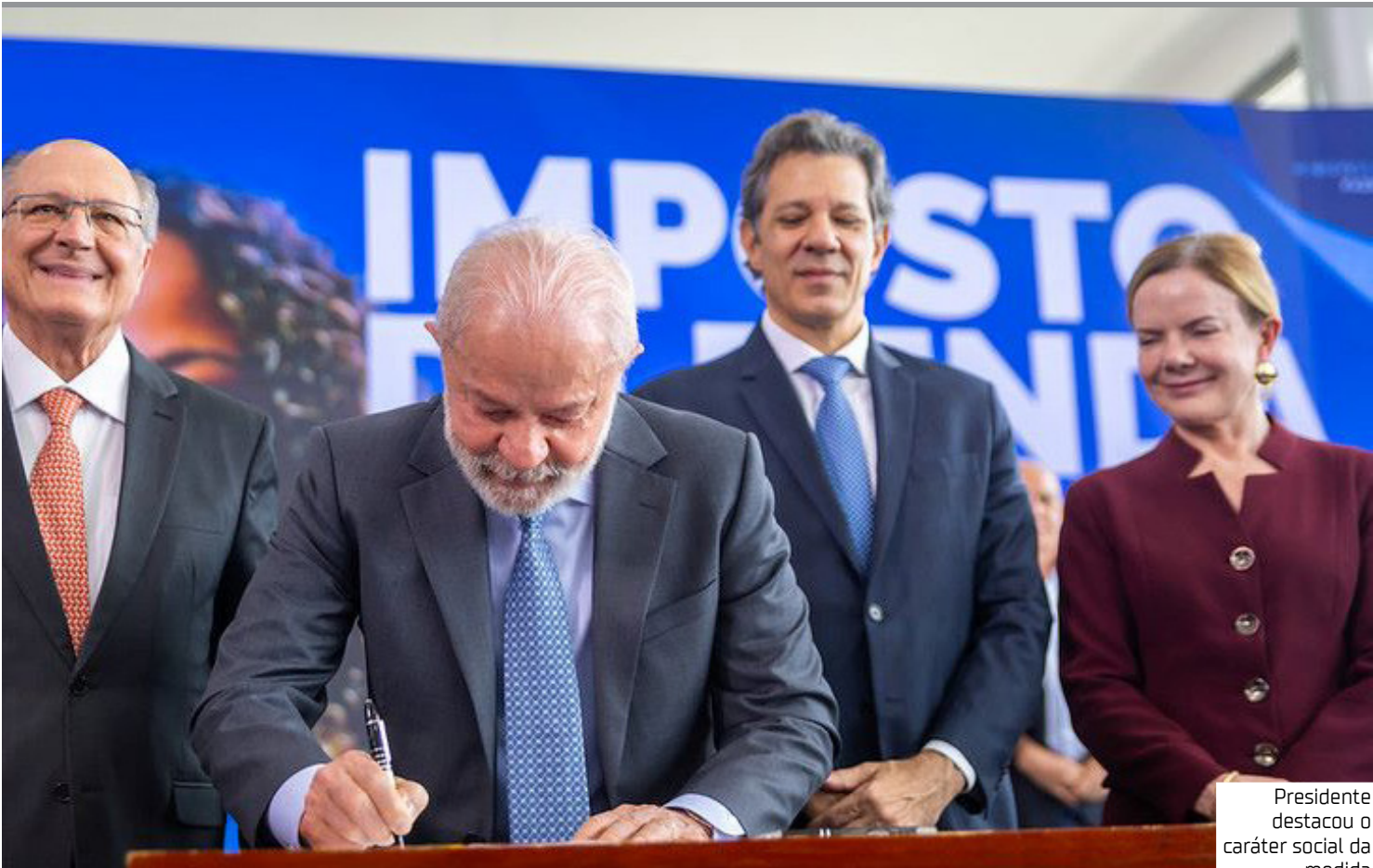
Presidente destacou o caráter social da medida

O ministro da Fazenda, Fernando Haddad, também