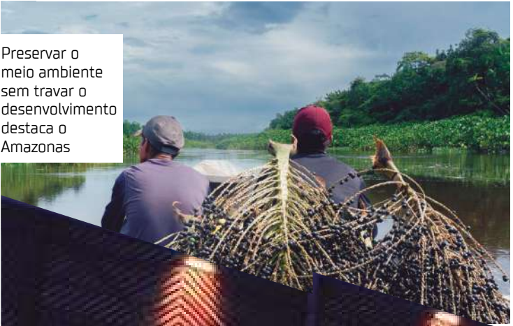
Preservar o meio ambiente sem travar o desenvolvimento destaca o Amazonas