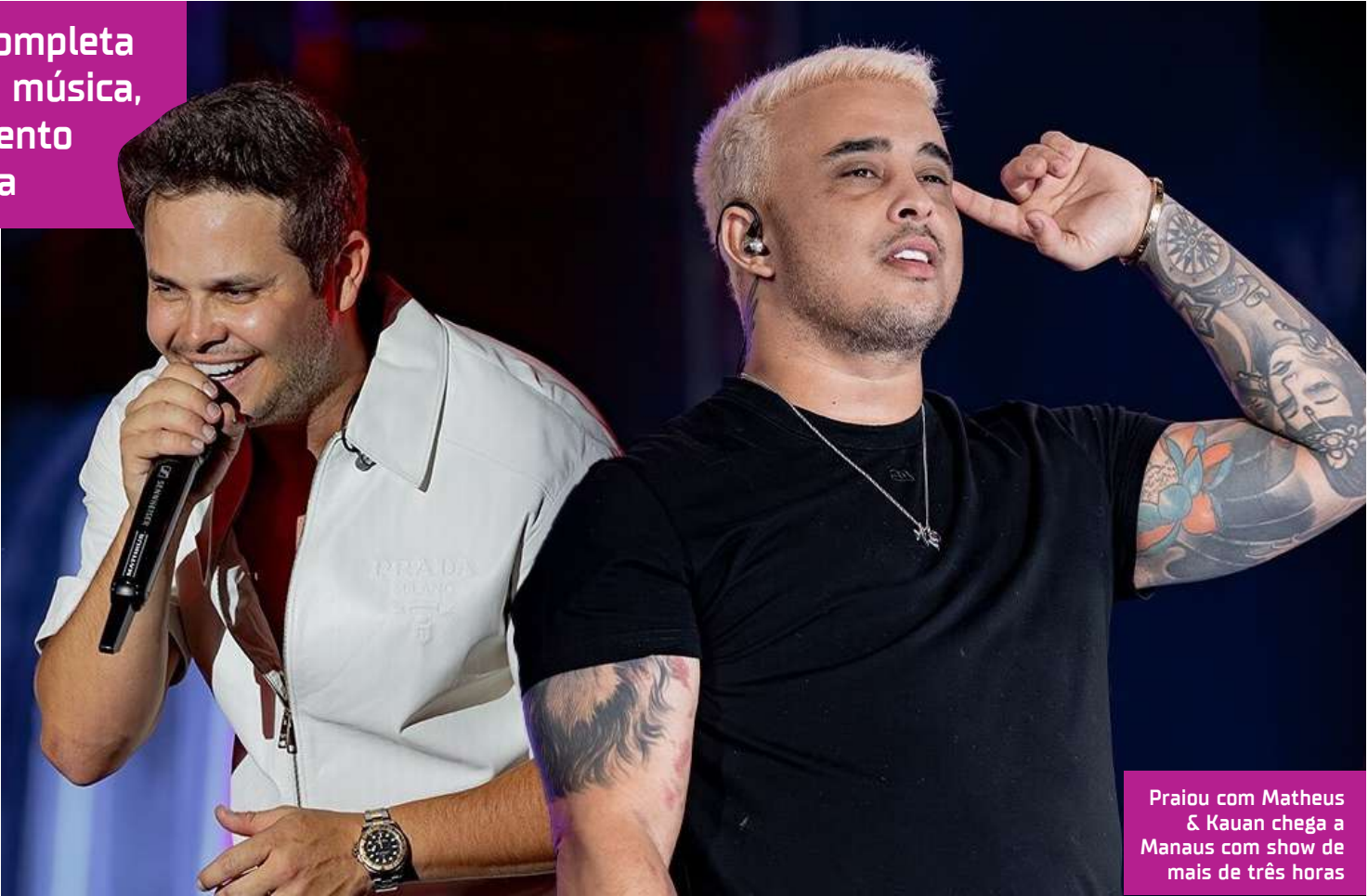
Praiou com Matheus & Kauan chega a Manaus com show de mais de três horas

Já Corações Jovens mostra a história de Elias, 14 anos, que desenvolve uma inesperada paixão pelo novo vizinho, Alexander. "Tímido e confuso sobre seus sentimentos, ele esconde a situação de amigos e familiares enquanto vive a experiência do primeiro amor.