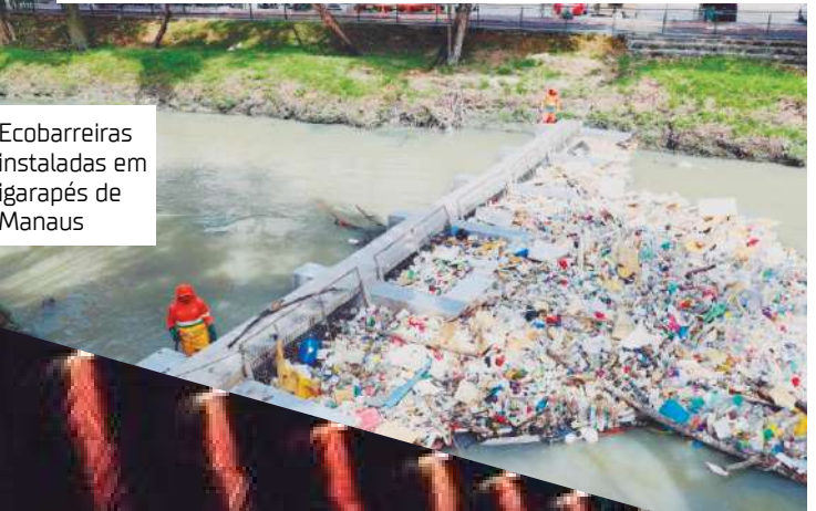
Ecobarreiras instaladas em igarapés de Manaus