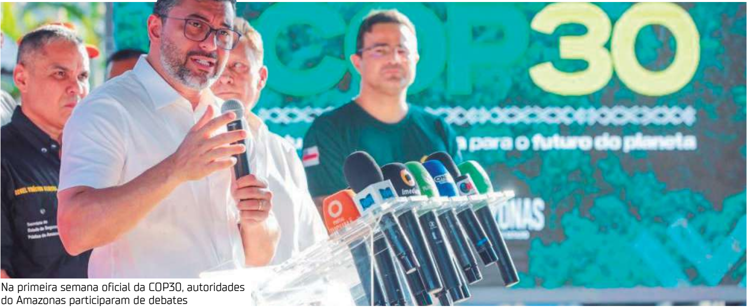
Na primeira semana oficial da COP30, autoridades do Amazonas participaram de debates

Amazonas marca presença com ações que buscam conciliar desenvolvimento e sustentabilidade