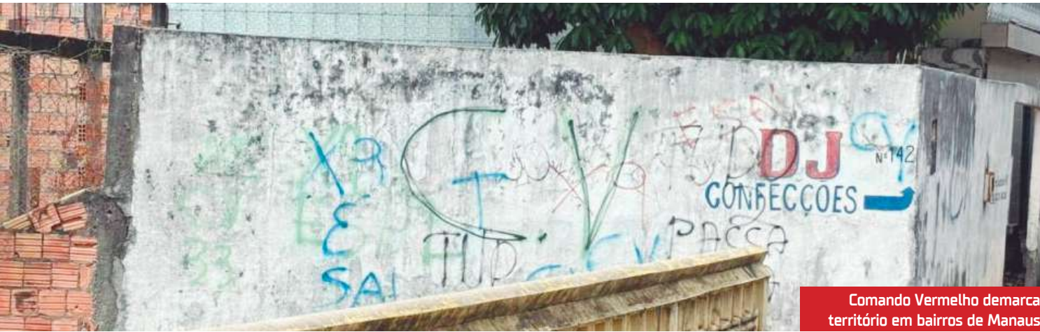
Comando Vermelho demarca território em bairros de Manaus

Facção criminosa transforma rios do estado em corredores ilícitos de drogas