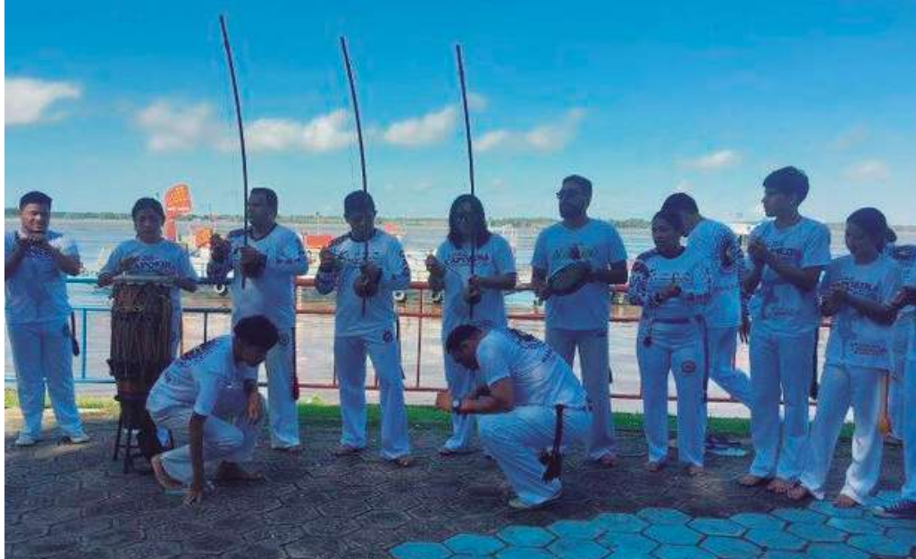
Evento terá palestras, manifestações artísticas, feira de produtos de empreendedores, entre outros

O Tribunal Regional Eleitoral do Amazonas (TRE-AM), por meio da Comissão de Combate ao Assédio Sexual, Moral e à Discriminação (1º e 2º grau), realiza, entre os dias 17 e 19 de novembro, a Semana da Consciência Negra do TRE-AM 2025, em alusão ao Dia da Consciência Negra, celebrado em 20 de novembro. A data, mais do que uma homenagem, é um convite à reflexão sobre a importância de valorizar as raízes africanas e reconhecer o papel histórico das pessoas negras na formação cultural, social e econômica do país. O evento contará com palestras, manifestações artísticas, feira de produtos