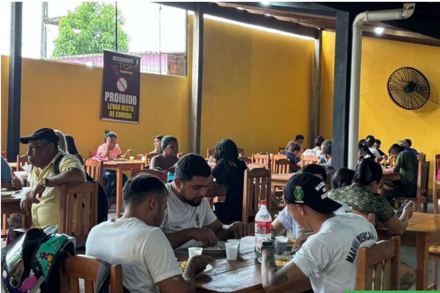
Clientes afirmam que a comida do restaurante é de qualidade