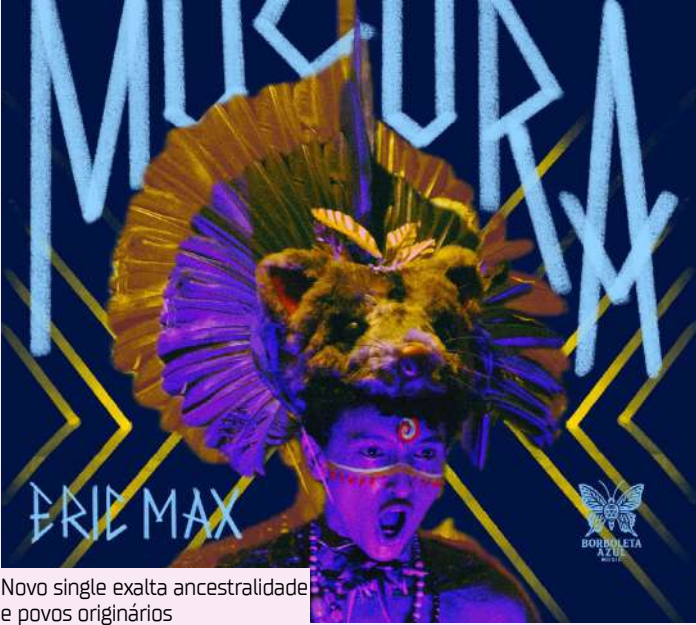
Novo single exalta ancestralidade e povos originários