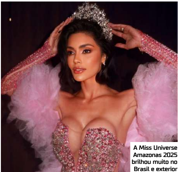
A Miss Universe Amazonas 2025 brilhou muito no Brasil e exterior