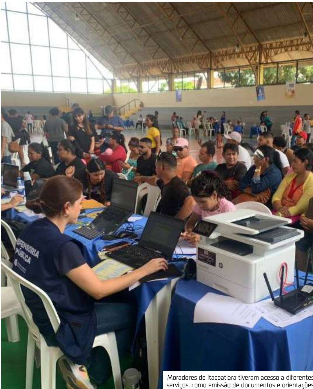
Moradores de Itacoatiara tiveram acesso a diferentes serviços, como emissão de documentos e orientações

Como parte da programação, a Comissão de Esporte,