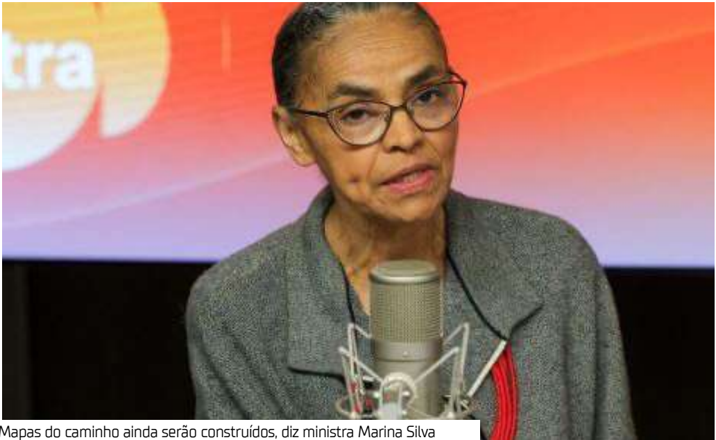
Mapas do caminho ainda serão construídos, diz ministra Marina Silva

Apesar de não terem entrado na decisão final das negociações da 30ª Conferência das Nações Unidas sobre Mudança do Clima (COP30), os mapas do caminho para o fim do desmatamento e da dependência dos combustíveis fósseis ainda serão construídos, afirma a ministra do Meio Ambiente e Mudança do Clima, Marina Silva. Em entrevista após participação no programa Bom Dia Ministra, do Canal Gov, da Empresa Brasil de Comunicação, Marina ela destacou que o Brasil permanece na presidência do processo multilateral que trata da mudança do clima até o final de 2026. Com o apoio de 82 países, da sociedade civil