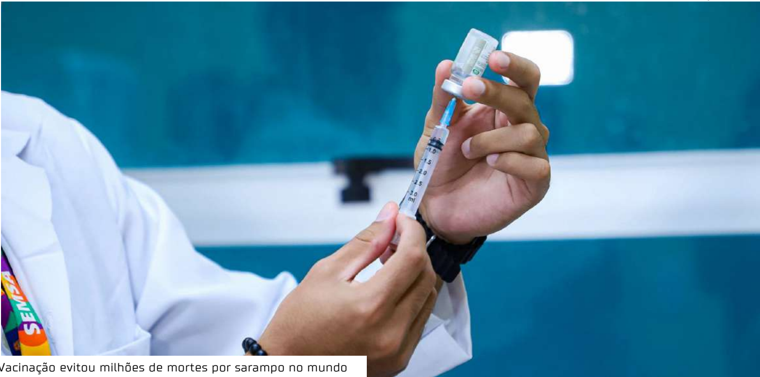
Vacinação evitou milhões de mortes por sarampo no mundo

média, onde a letalidade é menor. Para Tedros Adhanom Ghebreyesus, diretor-geral da OMS, o vírus — altamente contagioso — aproveita qualquer falha nos sistemas de proteção. A entidade alerta que até pequenas quedas na vacinação são suficientes para desencadear surtos significativos. O relatório também mostra que a fragilidade da cobertura vacinal tem favorecido o retorno da doença em diversas partes do mundo. Em 2024, 59 países enfrentaram surtos grandes ou preocupantes, número quase três vezes maior que o registrado em 2021 e o mais alto desde o início da pandemia de covid-19. Mesmo nações de alta renda, antes consideradas livres do sarampo, voltaram a registrar transmissão. O Canadá perdeu neste mês o status de eliminação após não conseguir conter um surto que se prolongou por um ano; Estados Unidos e México somaram milhares de casos e até mortes. A OMS afirma ainda que cortes de financiamento em redes laboratoriais e progra-