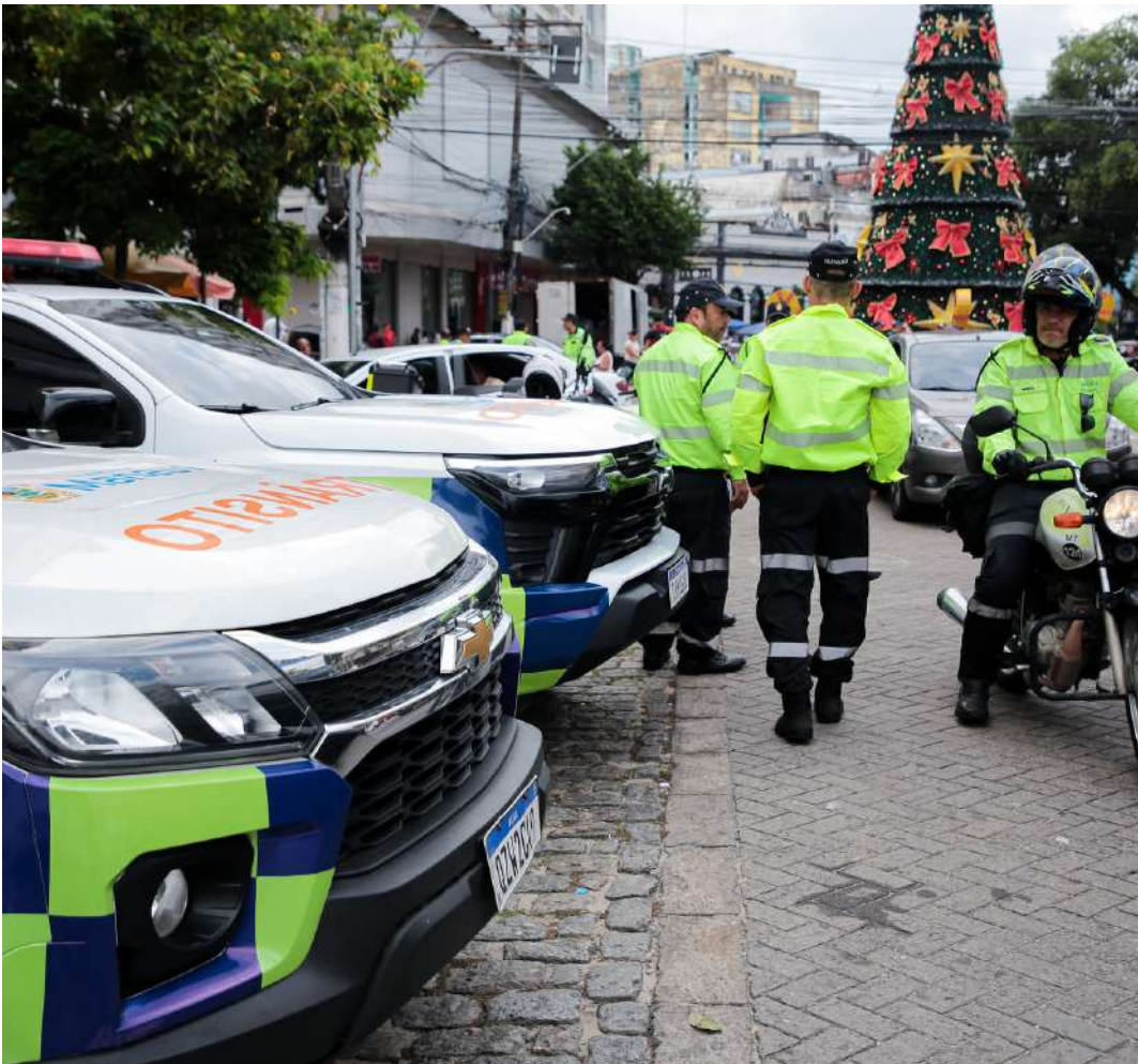
Vias de Manaus têm monitoramento total na operação “Natal”

Segundo o IMMU, estacionar de forma irregular ou bloquear a fluidez das vias compromete a segurança da população, justamente o que a operação “Natal” busca evitar. A ação segue ativa ao longo de todo o mês, garantindo fiscalização ampliada e trânsito mais seguro para todos.