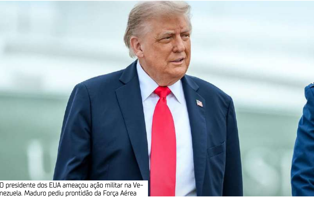
O presidente dos EUA ameaçou ação militar na Venezuela. Maduro pediu prontidão da Força Aérea