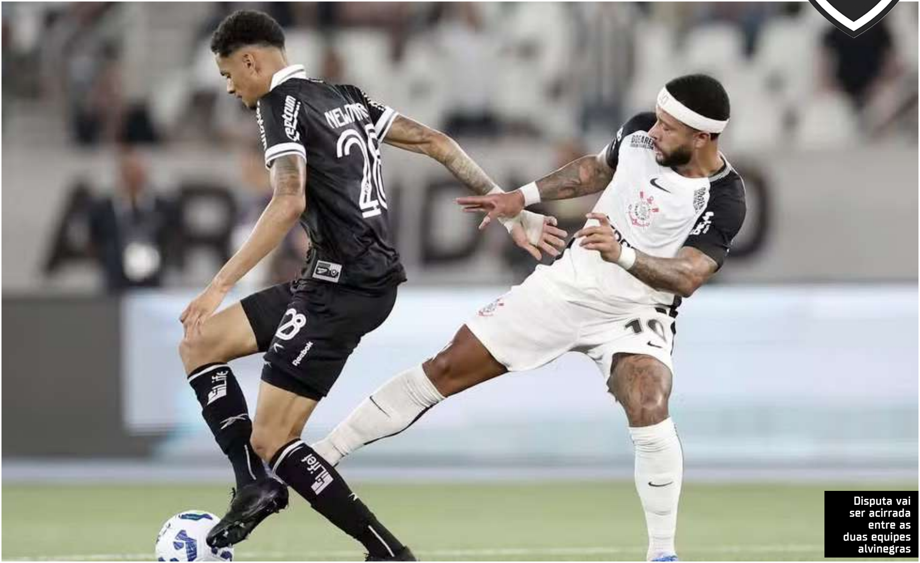
Disputa vai ser acirrada entre as duas equipes alvinegras

O desempenho ofensivo e defensivo também preocupa. O Timão marcou apenas dez gols nesses confrontos, média de 0,7 por jogo, e sofreu 20, resultando em 1,5 por partida. Jogando agora diante de sua torcida, o clube tenta melhorar esses números diante da equipe comandada por Davide Ancelotti.