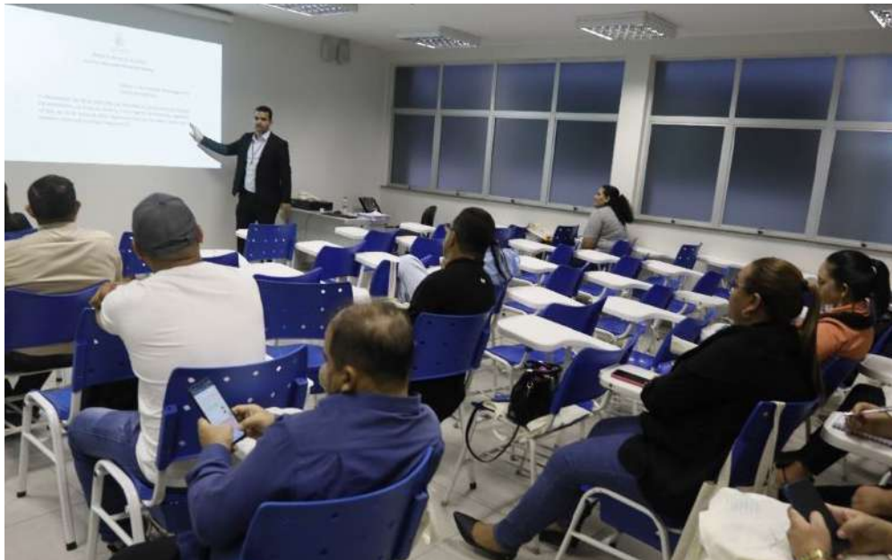
Escola do Legislativo formou, aproximadamente, 400 mil pessoas por meio de cursos gratuitos

A Assembleia Legislativa do Amazonas (Aleam), por meio da Escola do Legislativo Senador José Lindoso, divulgou o cronograma de atividades voltadas à capacitação dos servidores em dezembro, com curso sobre o Estatuto dos Servidores Públicos do Estado do Amazonas (Lei nº 1.762/1986).