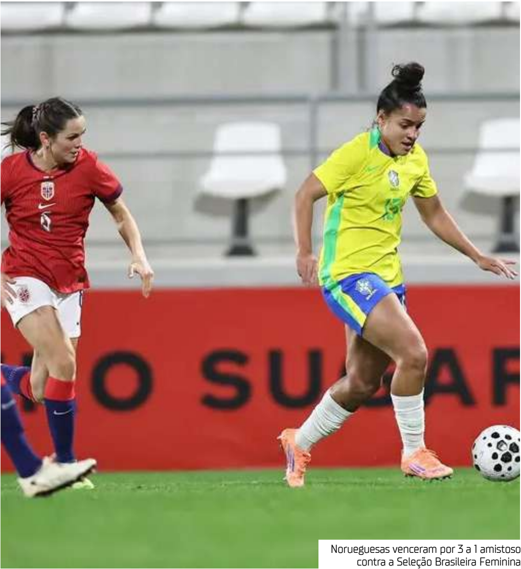
Norueguesas venceram por 3 a 1 amistoso contra a Seleção Brasileira Feminina

O Brasil tentou responder, mas esbarrou em erros de tomada de decisão e na boa atuação da defesa norueguesa. Nos minutos finais, a seleção nórdica ampliou em jogada trabalhada pela esquerda, fechando o placar em 3 a 1.