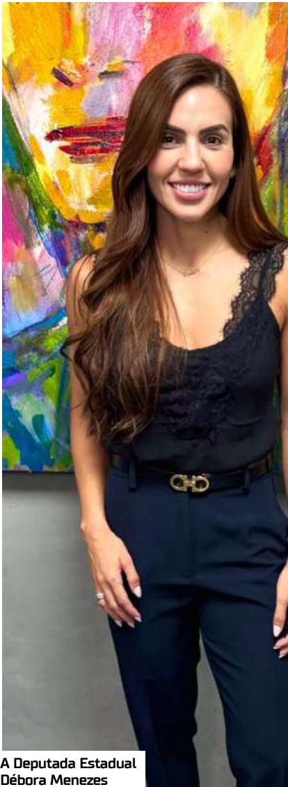
A Deputada Estadual Débora Menezes