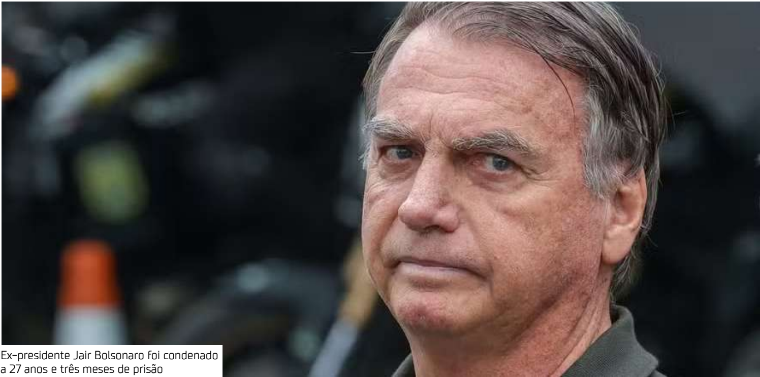
Ex-presidente Jair Bolsonaro foi condenado a 27 anos e três meses de prisão

Para conseguir que o caso fosse julgado novamente pelo pleno, os acusados precisavam obter pelo menos dois votos pela absolvição, ou seja, placar mínimo de 3 votos a 2. Nesse caso, os embargos infringentes poderiam ser protocolados contra a decisão. No dia 11 de setembro, o placar pela condenação foi de 4 votos a 1.