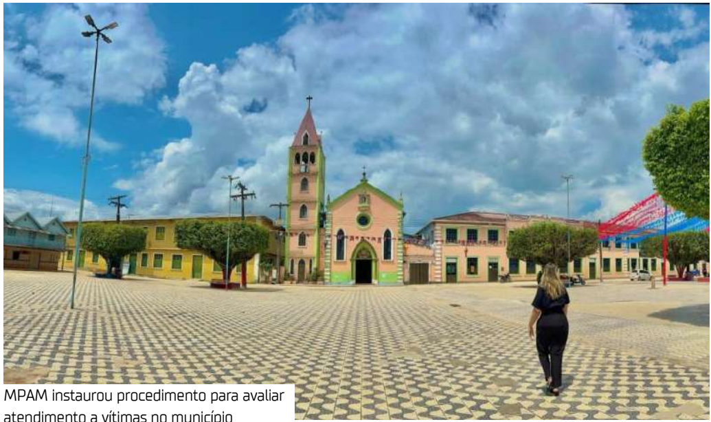
MPAM instaurou procedimento para avaliar atendimento a vítimas no município