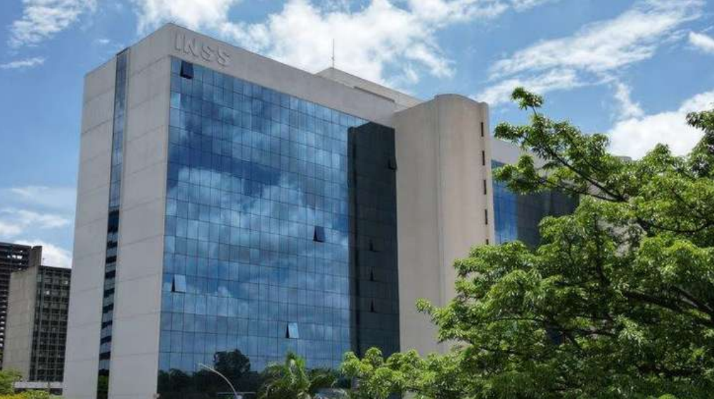
Governo do Brasil já devolveu R$ 2,4 bilhões a mais de 3,6 milhões de aposentados e pensionistas

Aposentados e pensionistas têm até o dia 14 de novembro para contestar descontos indevidos em benefícios previdenciários. Desde a abertura do sistema, em maio, 5,9 milhões de contestações já foram registradas por beneficiários que não reconheceram os descontos feitos pelas entidades associativas. Para garantir a devolução dos valores descontados, o primeiro passo é contestar. O processo é simples e pode ser feito por três canais: Meu INSS (aplicativo ou site); serviço "Consultar Descontos de Entidades Associativas"; Central 135: ligação gratuita, de segunda a sábado, das 7h às 22h; Correios: mais de 5 mil agências oferecem atendimento assistido e gratuito. No aplicativo, ao clicar em