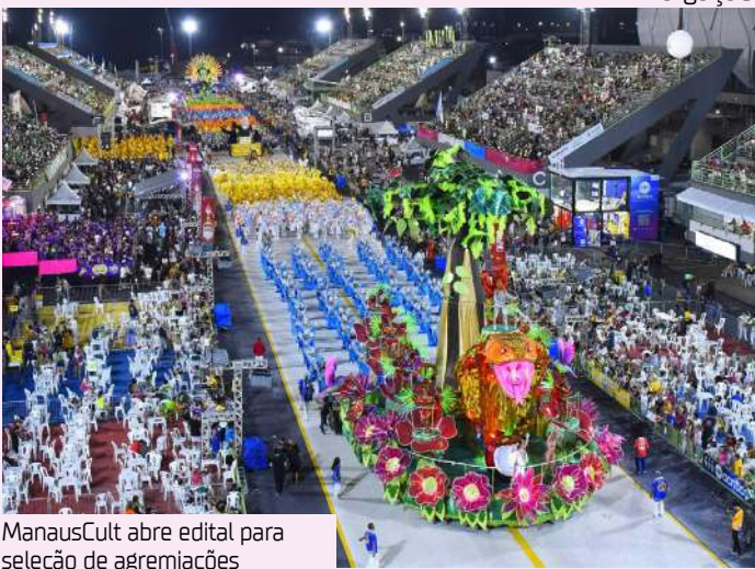
ManausCult abre edital para seleção de agremiações

um Carnaval grandioso e eficiente na aplicação dos recursos públicos", afirmou Lobato. Com valor total previsto de R$ 3.058.275, o edital contempla o repasse de até R$ 181,5 mil para cada escola do grupo "Especial"; até R$ 108,9 mil para o grupo "A" e até R$ 69,5 mil, para o grupo B. Os recursos serão destinados exclusivamente às agremiações que atenderem a todos os requisitos previstos no chamamento.