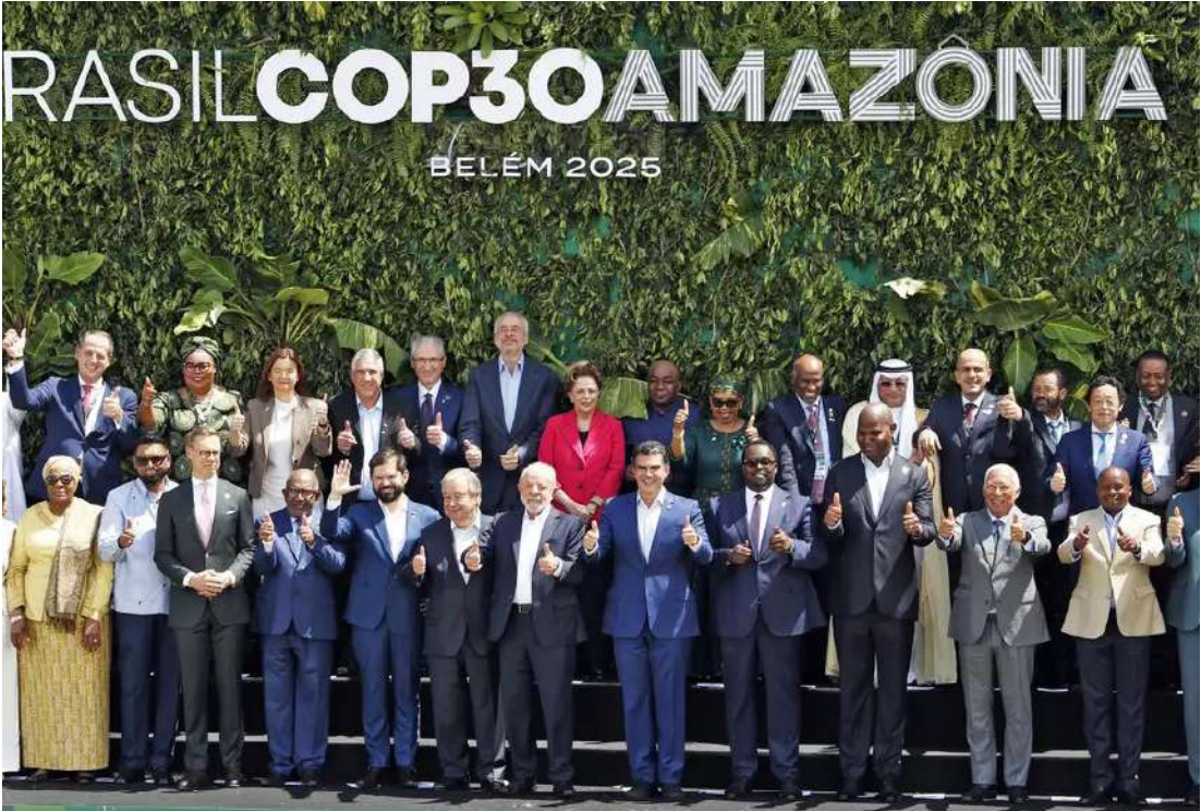
Chefes de Estado, líderes de governos e representantes de alto nível de mais de 70 países passaram por Belém

é: ainda não”, afirma. Lula observou que América Latina, Ásia e África são as regiões que correm o maior risco de se tornarem inabitáveis nas próximas décadas, incluindo um possível desaparecimento de ilhas no Caribe e no Pacífico por conta do aumento do nível dos oceanos pelo derretimento das geleiras. “Omitir-se é sentenciar novamente aqueles que já são os condenados da Terra”, sentenciou. O presidente insistiu na necessidade de revitalizar as metas do Acordo de Paris, por meio das Constituições Nacionalmente Determinadas, as chamadas NDCs (sigla em inglês). “Com países, representando quase 73% das emissões globais, apresentaram suas Contribuições Nacionalmente Determinadas. Em sua maioria, as novas NDCs avançaram ao abranger todos os setores econômicos e todos os gases de efeito estufa. Mas o planeta ainda caminha para um aquecimento de cerca de 2,5° C. No que depender