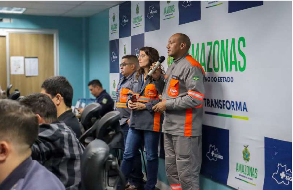
Companhia apresentou os papéis, responsabilidades e recomendações da atividade em reunião no CICC