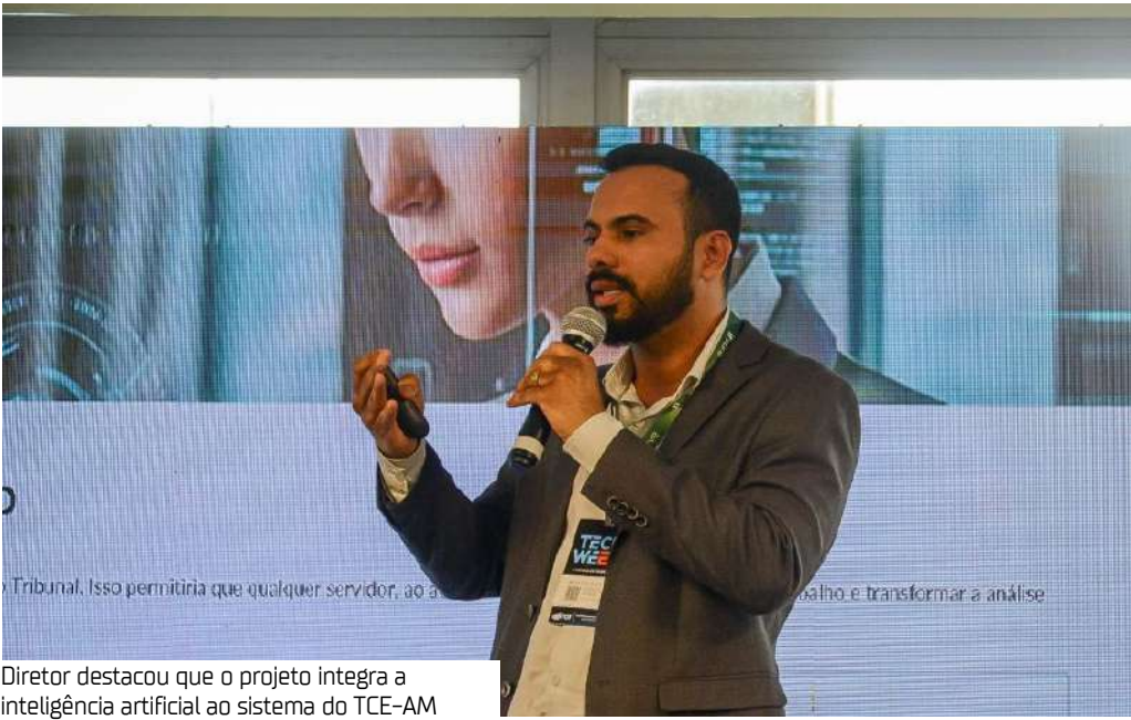
Diretor destacou que o projeto integra a inteligência artificial ao sistema do TCE-AM