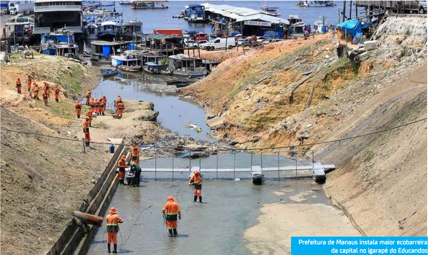
Prefeitura de Manaus instala maior ecobarreira da capital no igarapé do Educandos