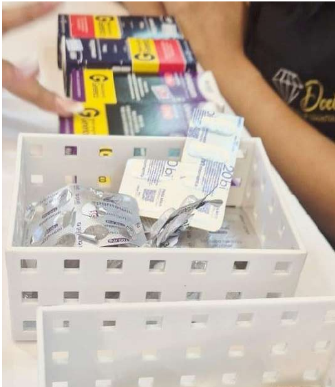
Dentista foi preso após denúncia de quatro pacientes