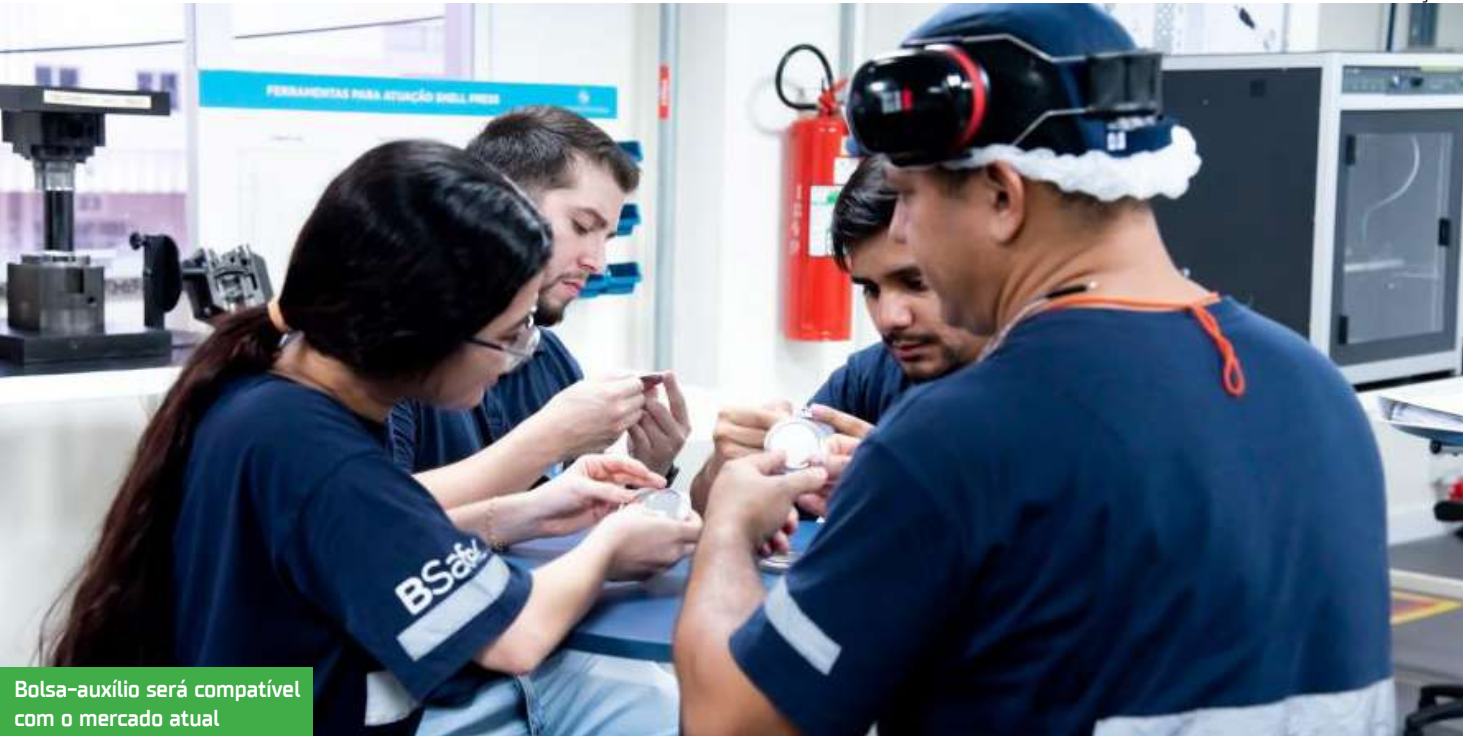
Bolsa-auxílio será compatível com o mercado atual

sivo para pessoas com deficiência (PCD), visando a inclusão e diversidade no ambiente de trabalho. Para os cargos de supervisor e gerente, é necessário ter graduação em Engenharia, vivência em gestão e inglês. Já os estágios técnicos são voltados a estudantes dos cursos de Mecânica, Mecatrônica, Elétrica, Automação e áreas correlatas, com possibilidade de efetivação ao término do contrato. O programa de estágio da Ardagh em Manaus passa atualmente por um processo de aprimoramento, com a implantação de um cronograma de aprendizado técnico que inclui o funcionamento das diferentes máquinas da produção, contribuindo para o desenvolvimento prático e o crescimento profissional dos participantes. Os estagiários recebem bolsa-auxílio compatível com o mercado, além de benefícios como seguro de vida, plano de saúde Bradesco, refeitório no local, transporte fretado, Wel-