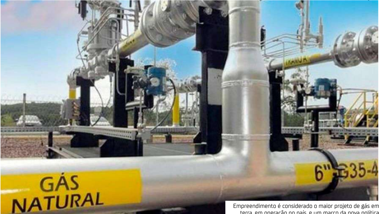
Empreendimento é considerado o maior projeto de gás em terra, em operação no país, e um marco da nova política

que prevê reduzir em 50% o consumo de diesel nos sistemas isolados e eliminar a pobreza energética até 2030, consolidando o Amazonas como referência nacional na construção de uma matriz energética mais limpa e sustentável. A partir de decisões estratégicas, o estado, que antes exportava apenas matéria-prima, passou a exportar energia, tecnologia e conhecimento. A cadeia produtiva do gás natural, liderada pela Eneva, empresa brasileira de geração e comercialização de energia, transformou municípios como Silves e Itapiranga em símbolos de uma era de desenvolvimento sustentável na Amazônia. Descoberto em 1999 e hoje em plena operação, o Campo do Azulão, em Silves (200 quilômetros de Manaus), é responsável pela extração do gás natural que abastece termelétricas, gera empregos locais e movimenta a economia do interior. A produção já beneficia diretamente milhares de famílias e, indiretamente, abastece todo o Norte, incluindo o estado de Roraima, que reduziu em 95% os apagões desde o início do fornecimento. O empreendimento é considerado o maior projeto de gás em terra, em operação no país,