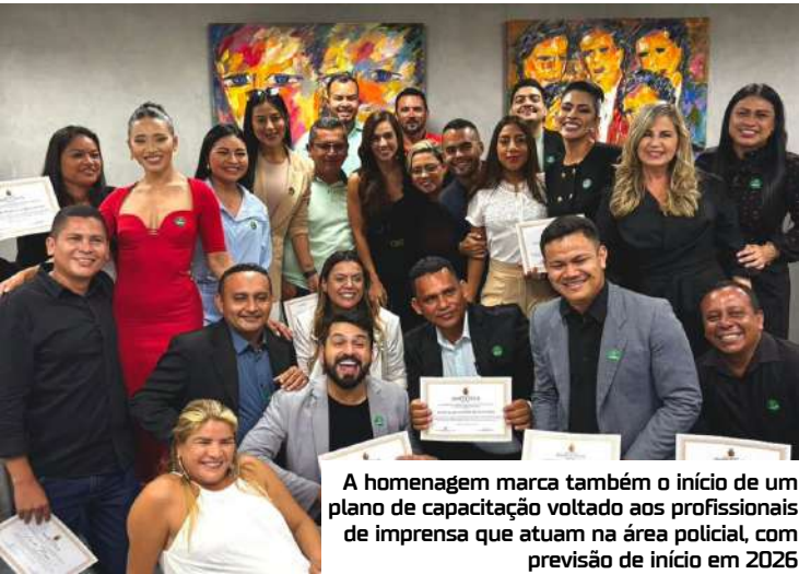
A homenagem marca também o início de um plano de capacitação voltado aos profissionais de imprensa que atuam na área policial, com previsão de início em 2026

A Deputada Estadual Débora Menezes realizou na última segunda-feira(03), uma Cerimônia na Assembleia Legislativa do Estado do Amazonas, para homenagear os profissionais que atuam na cobertura policial e no interior do Estado, reconhecendo o trabalho de repórteres, cinegrafistas, fotógrafos e produtores que fazem da notícia um instrumento de transformação social e valorização da verdade.