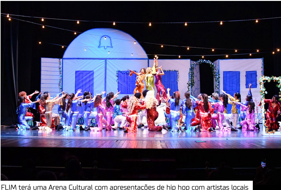
FLIM terá uma Arena Cultural com apresentações de hip hop com artistas locais