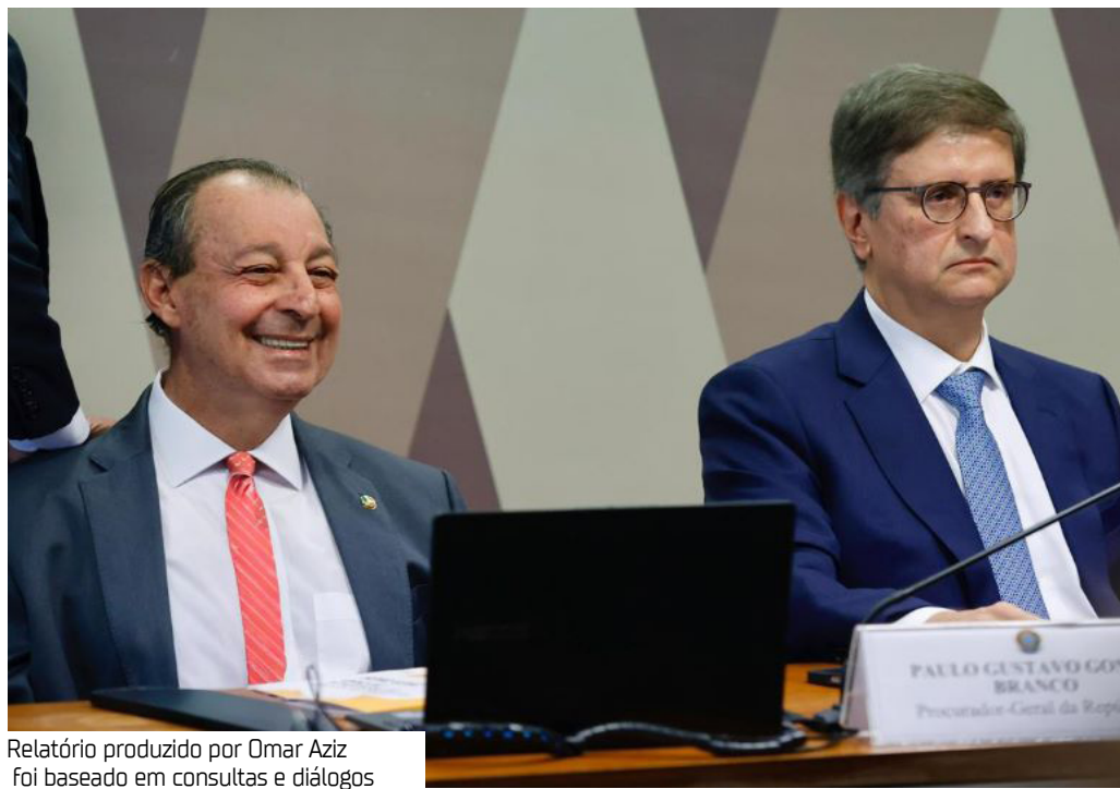
Relatório produzido por Omar Aziz foi baseado em consultas e diálogos