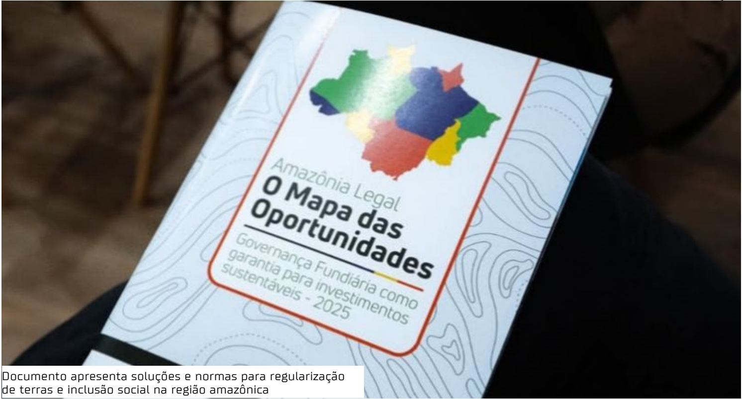
Documento apresenta soluções e normas para regularização de terras e inclusão social na região amazônica

“A Cartilha foi desenvolvida em parceria entre órgãos estaduais e federais, com apoio de especialistas. O material reúne experiências, estudos e legislações da Amazônia Legal e foi elaborado de forma didática e acessível. A finalidade do documento é tornar os processos mais ágeis, seguros e transparentes, garantindo