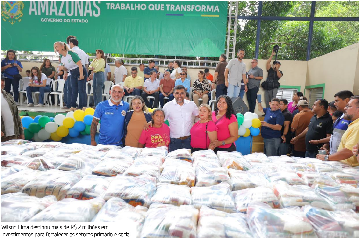
Wilson Lima destinou mais de R$ 2 milhões em investimentos para fortalecer os setores primário e social

Entre os documentos rurais a serem entregues estão 48 Cartões do Produtor Primário (CPP) e 16 Cadastros Nacionais da Agri-