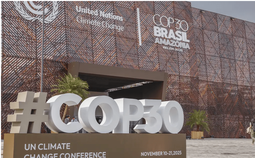
Carta da ONU cobra do governo brasileiro reforço na proteção e correção de problemas como calor

A ONU criticou a organização da COP30, conferência sobre mudança climática realizada em Belém (PA), por falhas de infraestrutura e segurança. A entidade também exigiu providências imediatas para resolver os problemas. Os pedidos foram feitos após manifestantes quase invadirem a área diplomática da conferência, reservada para as negociações oficiais entre países. O secretário-executivo da UNFCCC, Simon Stiell, enviou uma carta na quarta-feira (12) ao ministro Rui Costa, da Casa Civil, e ao embaixador André Corrêa do Lago, presidente da COP30. O documento lista cinco falhas