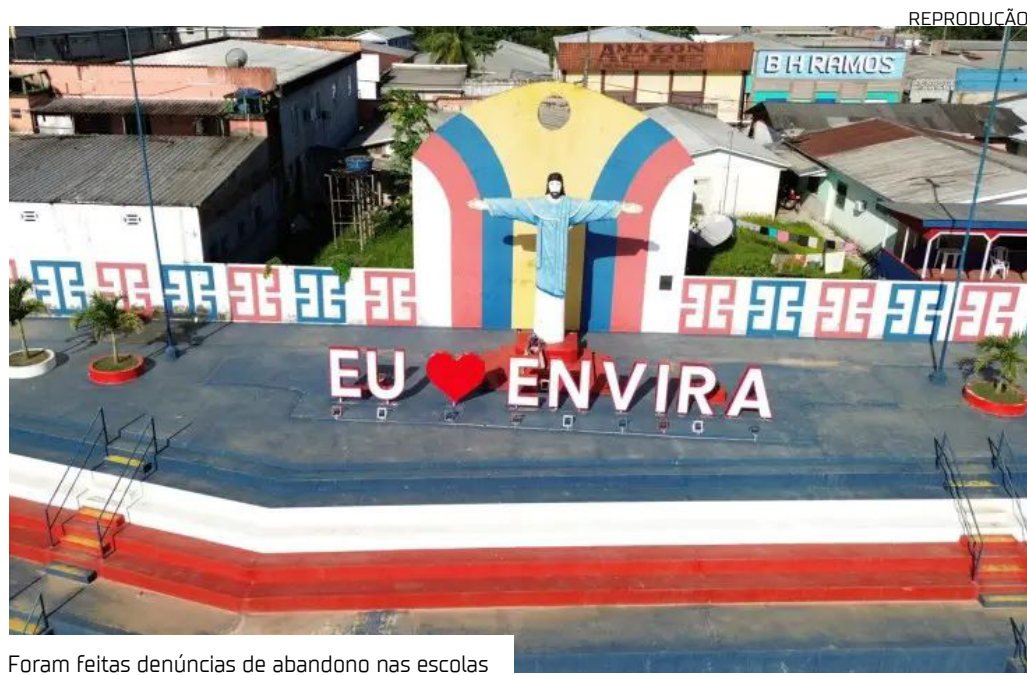
Foram feitas denúncias de abandono nas escolas