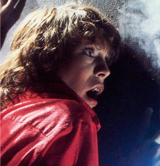
Seis filmes do mestre do horror e do suspense serão exibidos

O Cine Carmen Miranda e Cine Set promovem o Especial John Carpenter, de quinta-feira (13) a sábado (15), a partir das 17h, com acesso gratuito. Na quinta (13), o cinema de rua exibe ‘A bruma assassina’ (1980), às 17h, e em seguida, às 19h, ‘Assalto à 13ª DP’ (1976).