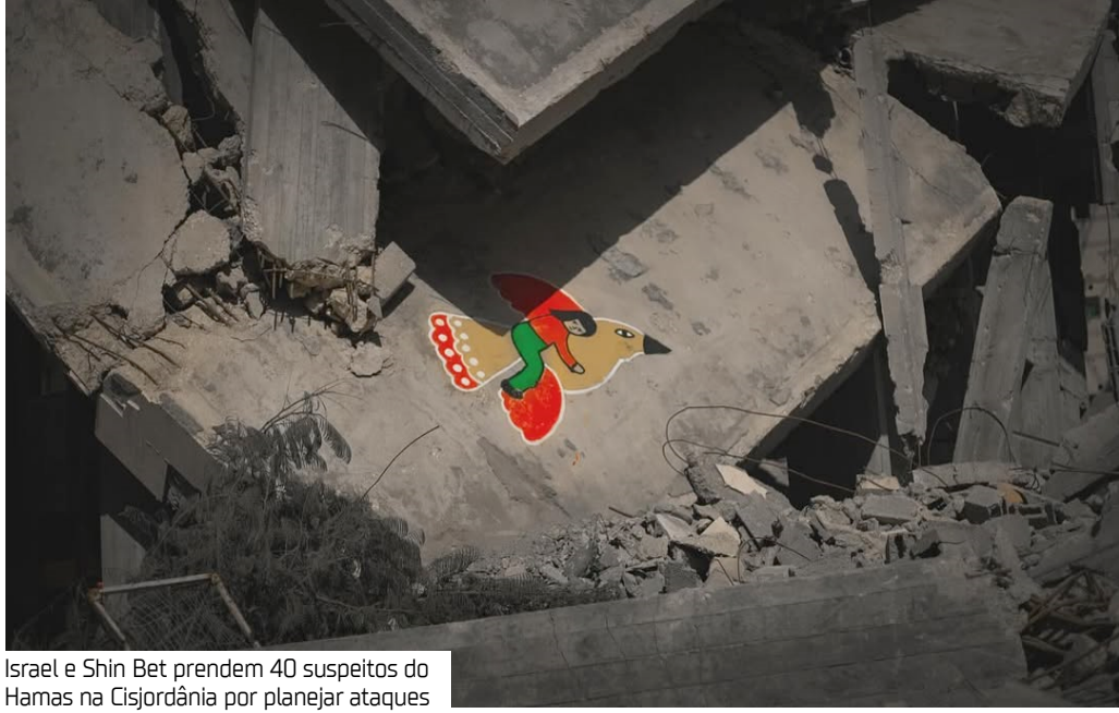
Israel e Shin Bet prendem 40 suspeitos do Hamas na Cisjordânia por planejar ataques