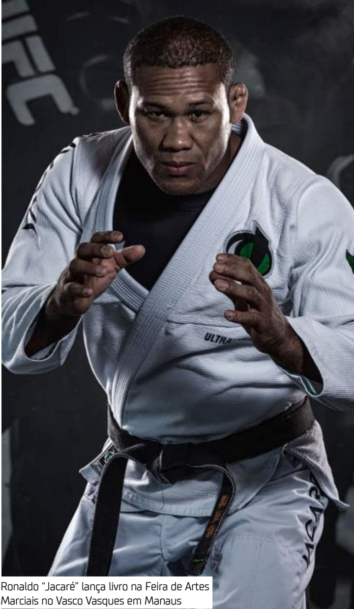
Ronaldo “Jacaré” lança livro na Feira de Artes Marciais no Vasco Vasques em Manaus

O livro traz histórias inspiradoras da carreira de Jacaré — desde os desafios enfrentados na infância até as conquistas que o tornaram um dos nomes mais respeitados das artes marciais brasileiras no cenário internacional. A sessão de autógrafos e o bate-papo com o público ocorrerão