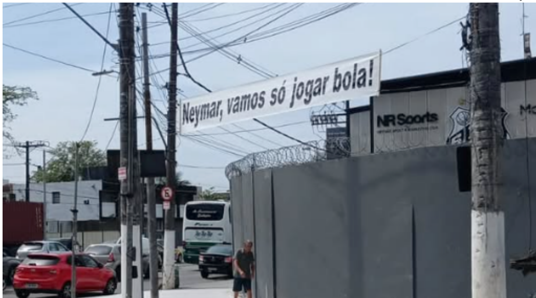
Torcedores colocam faixa de protesto no CT Rei Pelé

Assim, foi substituído aos 40 minutos da segunda etapa por Benjamin Rollheiser e deixou o campo visivelmente irritado. Ao chegar ao banco de reservas, chutou um copo d’água, atingindo alguns companheiros com o líquido. Em seguida, foi direto para o vestiário, sem permanecer com o grupo.