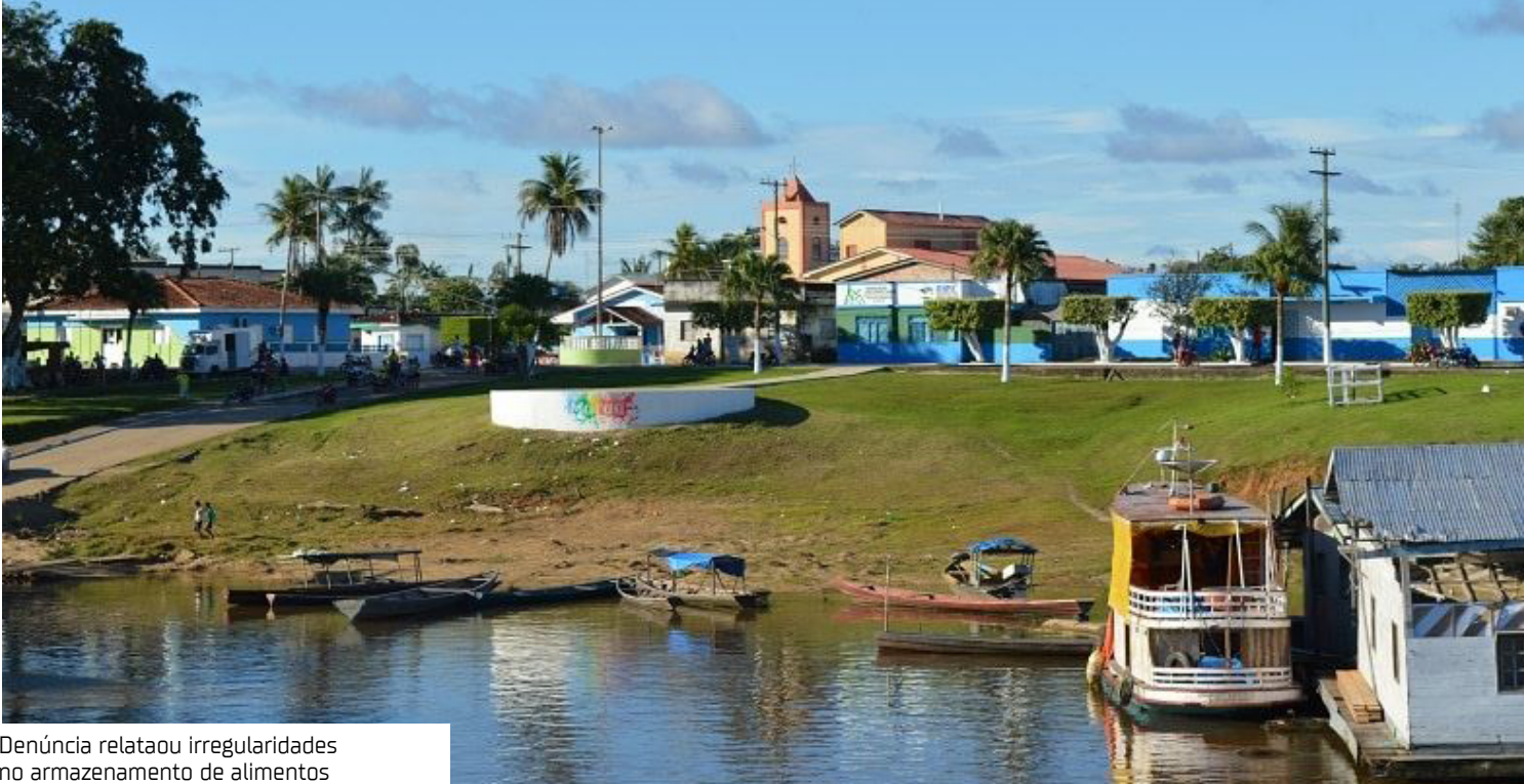
Denúncia relatou irregularidades no armazenamento de alimentos

Os casos configuram diversas violações à Lei nº 8.137/90, que rege os crimes contra as relações de consumo. O ofício enviado à Delegacia de Maraã também destaca a prática de crime contra a saúde públi-