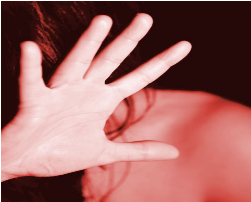
Iniciativa está alinhada às diretrizes da Lei Maria da Penha e ao princípio da dignidade humana