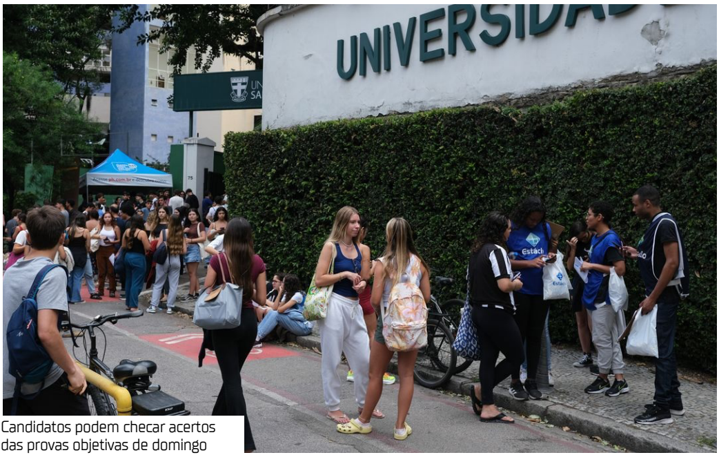
Candidatos podem checar acertos das provas objetivas de domingo