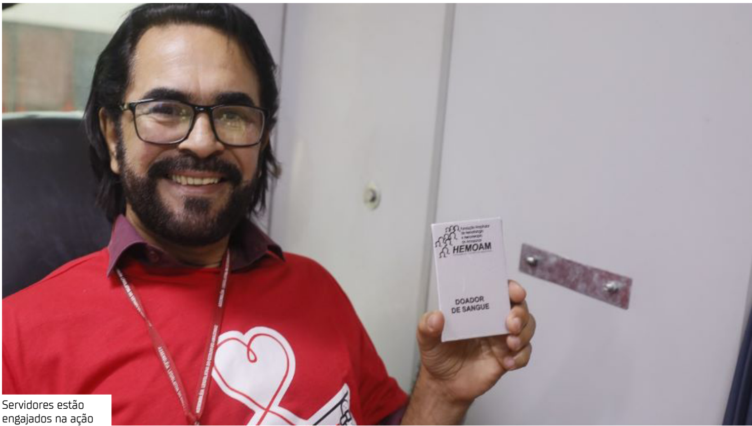
Servidores estão engajados na ação

Com o objetivo de superar a marca das 89 bolsas de sangue coletadas na edição anterior, a campanha contará com a parceria da Fundação Hospitalar de Hematologia e Hemoterapia do Amazonas (FHEmoam), que disponibilizará sua unidade móvel de coleta — o tradicional “Vampirão” — para atender os servidores e demais