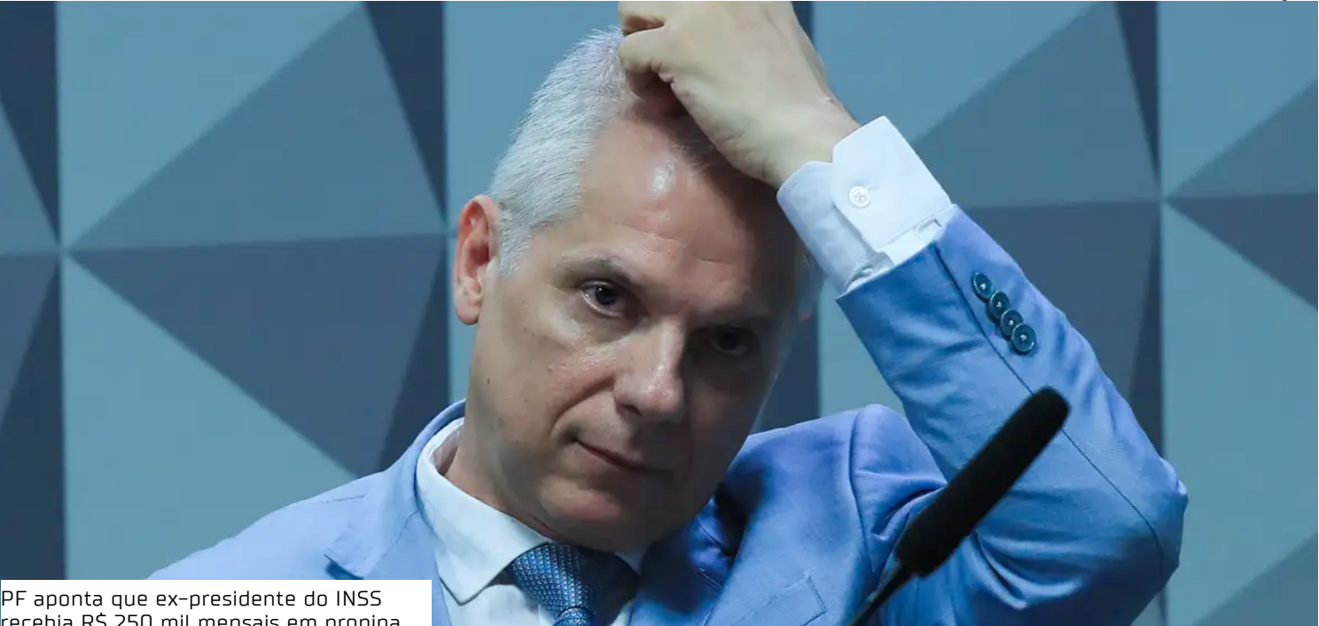
PF aponta que ex-presidente do INSS recebia R$ 250 mil mensais em propina

De acordo com a PF, quase todos os repasses ocorreram entre junho de 2023 e setembro de 2024, com exceção de um pagamento de R$ 250 mil feito em outubro de 2022.