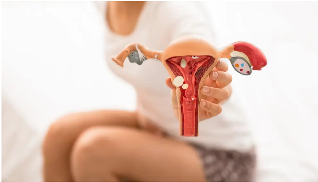
Sintomas podem ser confundidos com outras questões ginecológicas

“Percebo que ainda se normaliza muito a dor e muitas mulheres acham que está tudo bem. A demora na procura médica é um dos fatores para o diagnóstico tardio e, por vezes, alguns profissionais não pedem o exame correto. Atendo muitas mulheres desacreditadas de que irão melhorar da cólica, porque já passaram por médicos que não investigaram de forma precisa ou que não instituíram o devido tratamento. E a consequência disso é que a doença pode agravar a ponto de perfurar órgãos adjacentes, como intestino e bexiga, deixando a mulher incapacitada de tanta dor e com