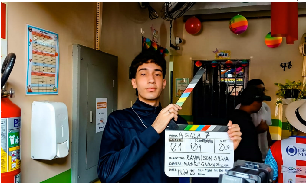
Projeto “Identidade Manauara” leva vivência cinematográfica a estudantes da rede pública

Durante o mês de outubro, alunos do 1º ao 3º ano do Ensino Médio da Escola Estadual São Luiz de Gonzaga, no bairro São Raimundo, zona Oeste de Manaus, tiveram um despertar muito especial. Eles participaram da oficina “Filme de 1 Minuto”, promovida pelo projeto social Identidade Manauara. Aprenderam que a 7ª arte, além ser um universo de imaginação, exerce um papel essencial como ferramenta crítica nos contextos social, cultural e educacional.