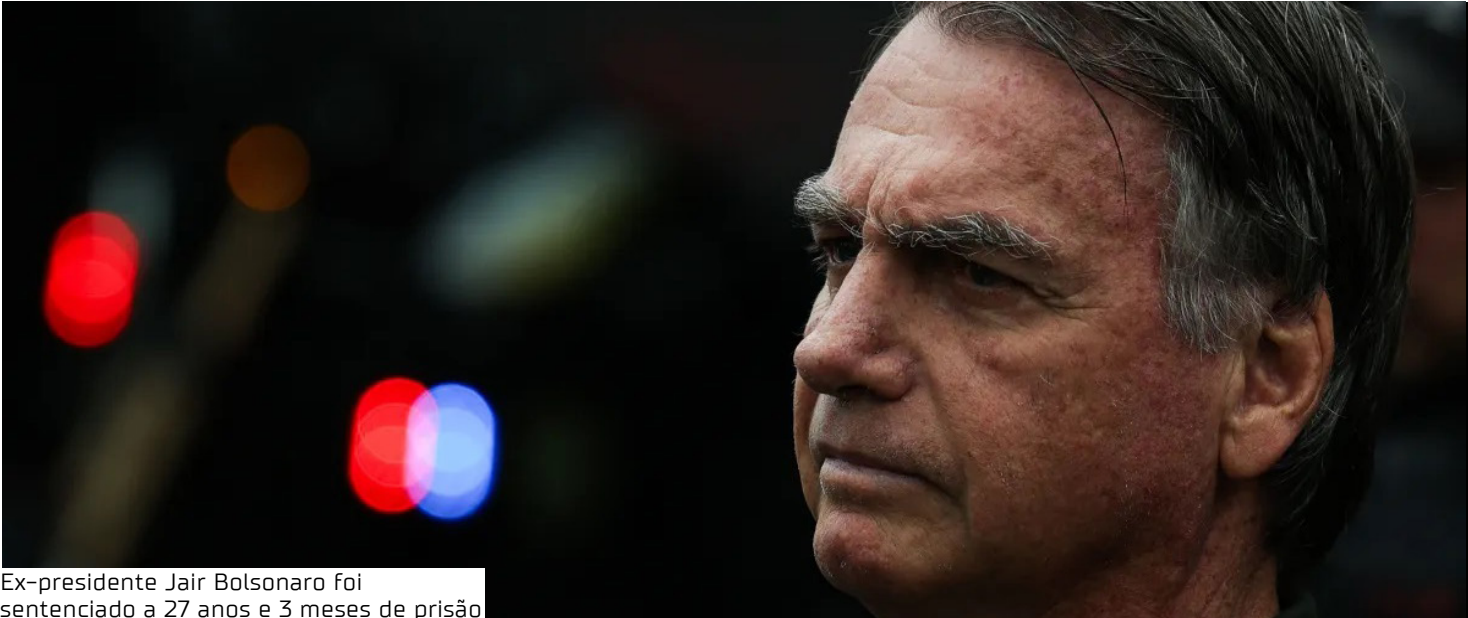
Ex-presidente Jair Bolsonaro foi sentenciado a 27 anos e 3 meses de prisão