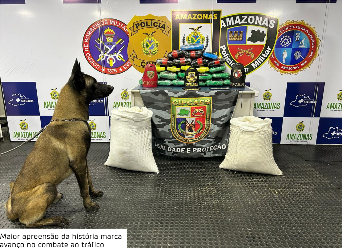
Maior apreensão da história marca avanço no combate ao tráfico

Maior apreensão da história A PMAM foi responsável por uma das operações mais marcantes do ano. Em junho, durante ação da Companhia de Operações Especiais (COE) nas proximidades de Manacapuru, foram apreendidas 6,5 toneladas de drogas, a maior carga já interceptada em território amazonense. O comandante-geral da PMAM, coronel PM Klinger Paiva, ressaltou que a corporação militar apreendeu, desde o início do ano, 24,5 toneladas de entorpecentes em operações na capital amazonense e interior do estado. O número já ultrapassou o total apreendido pela PMAM durante todo o ano de 2024.