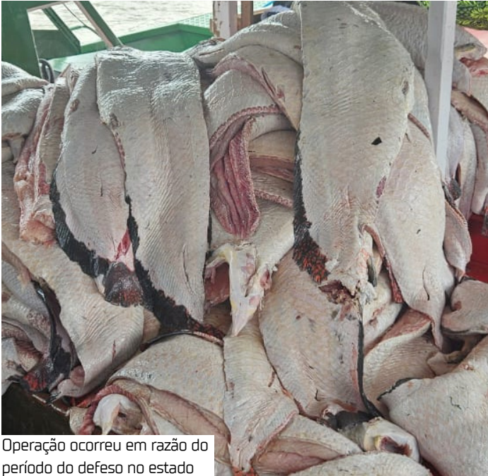
Operação ocorreu em razão do período do defeso no estado

A operação, iniciada no dia 8 de novembro e com foco na região da Boca do Ayapua, reuniu equipes da Secretaria de Estado do Meio Ambiente (Sema), do Instituto Brasileiro do Meio Ambiente e dos Recursos Naturais Renováveis (Ibama) e da Polícia Militar de Beruri. “Quando Ibama, Sema e a Polícia Militar atuam de forma integrada, conseguimos coibir práticas que ameaçam a biodiversidade e o modo de vida das comunidades. A RDS é uma área de uso sustentável que precisa ser protegida, e esse tipo de ação garante que os estoques pesqueiros se mantenham saudáveis e que as famílias que dependem da pesca possam seguir trabalhando de forma legal e sustentável”, destacou o gestor da RDS