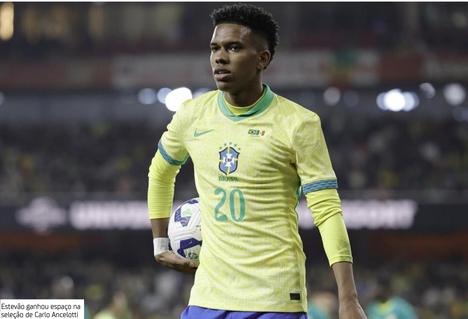
Estêvão ganhou espaço na seleção de Carlo Ancelotti

O lateral-direito Wesley será titular da seleção brasileira diante da Tunísia, em amistoso nesta terça-feira. Ele entrará na vaga do zagueiro Gabriel Magalhães, que se machucou na partida contra Senegal, no sábado. Com isso, Éder Militão será deslocado da lateral para a zaga. O técnico Carlo Ancelotti não descartou fazer outras mudanças na escalação, mas planeja manter a base do último jogo. “Estamos pensando que podemos fazer algumas mudanças no time para o jogo de amanhã, quero avaliar o treino de hoje, ver como jogadores se recuperaram do jogo