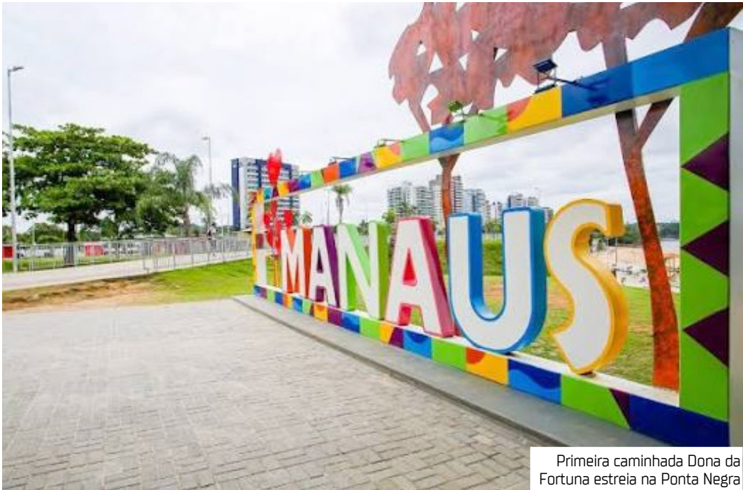
Primeira caminhada Dona da Fortuna estreia na Ponta Negra

A Ponta Negra vai se transformar em palco de um grande encontro de bem-estar no dia 30 de novembro, quando Manaus recebe a primeira edição da Caminhada Dona da Fortuna. Além da atividade física, o evento tem a proposta de inspirar jornadas de prosperidade, conexão e fortalecimento emocional. Inspirada no crescente movimento de autocuidado que tem ganhado adesão em várias faixas etárias no mundo inteiro, a caminhada conta com o apoio da Agility Engenharia e aposta em uma fórmula que combina saúde, desenvolvimento pessoal e networking. A expectativa é reunir centenas de pessoas em busca de propósito, autoestima e novas conexões. A ideia é oferecer uma “imersão leve”, voltada a quem busca prosperidade emocional e profissional sem perder de vista a saúde física. “É um momento para nos conectarmos, e não há melhor ferramenta que o esporte. Estar ao