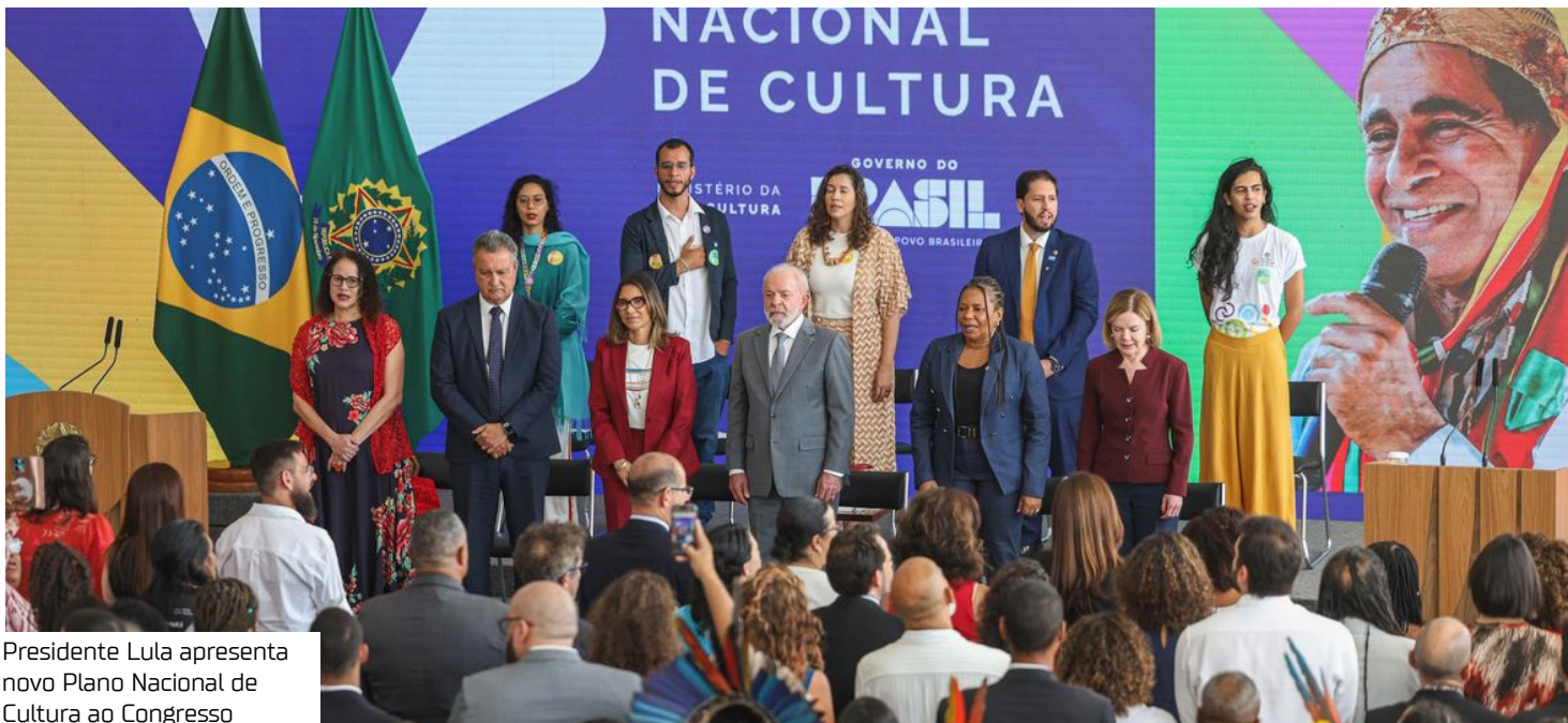
Presidente Lula apresenta novo Plano Nacional de Cultura ao Congresso

Segundo Lula, o plano quer transformar a cultura em movimento efetivamente de base, popular. “Ao invés de ter aquelas coisas muito enalacradas, muito fechadas, aquelas redomas onde tudo funciona certinho, a gente ter uma espécie de guerrilha democrática cultural nesse país, aonde as pessoas precisam ter a liberdade de fazer e de provocar