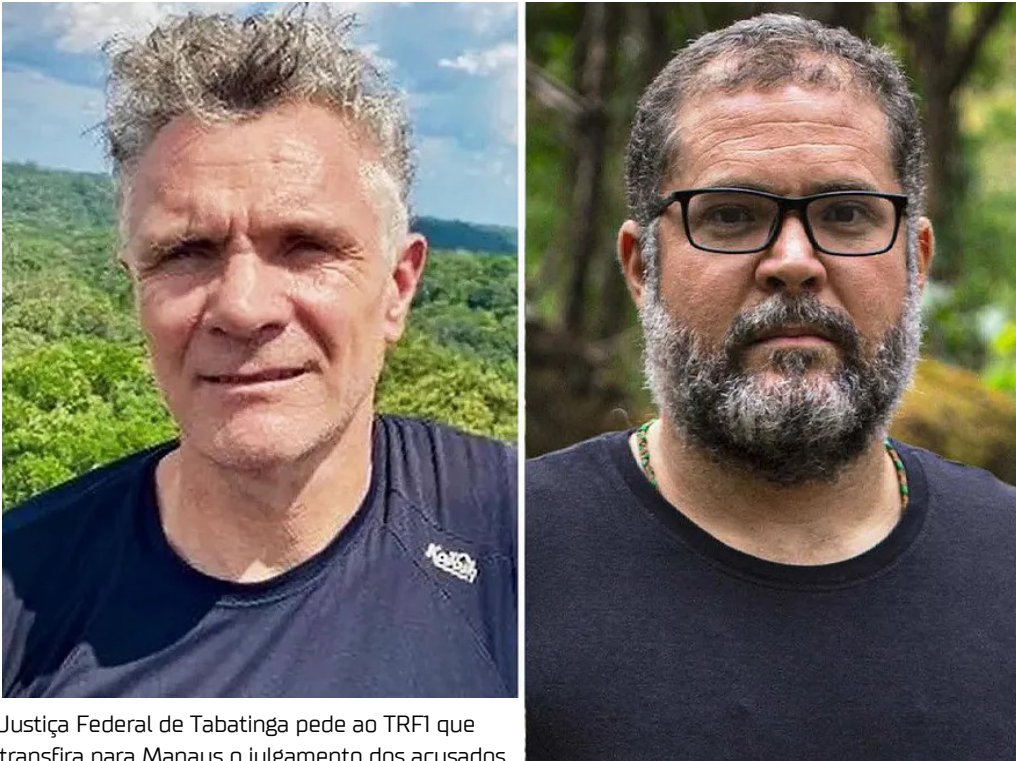
Justiça Federal de Tabatinga pede ao TRF1 que transfira para Manaus o julgamento dos acusados

A Justiça Federal em Tabatinga decidiu ontem (17) enviar ao Tribunal Regional Federal da 1ª Região (TRF1) um pedido para que o julgamento dos acusados pela morte do indigenista Bruno Pereira e do jornalista Dom Phillips seja transferido para Manaus. O processo já está pronto para a fase do Tribunal do Júri. A decisão atende a um pedido do Ministério Público Federal (MPF), que solicitou o desforamento — mudança do local do