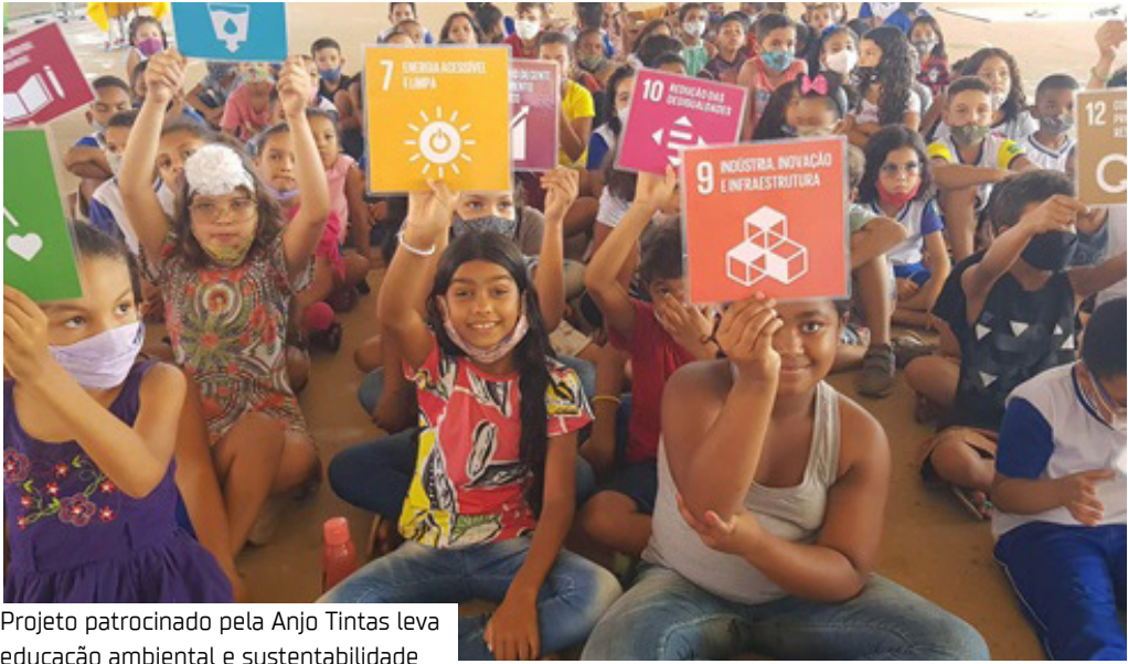
Projeto patrocinado pela Anjo Tintas leva educação ambiental e sustentabilidade

No coração da maior floresta tropical do mundo, um movimento ganha força dentro das escolas públicas.