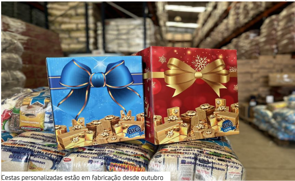
Cestas personalizadas estão em fabricação desde outubro

Com a aproximação das festas de fim de ano, o varejo alimentar no Amazonas começa a aquecer. Supermercados, distribuidoras e empresas especializadas em cestas básicas já sentem o aumento da procura por produtos típicos dessa época, que tradicionalmente movimenta a economia local.