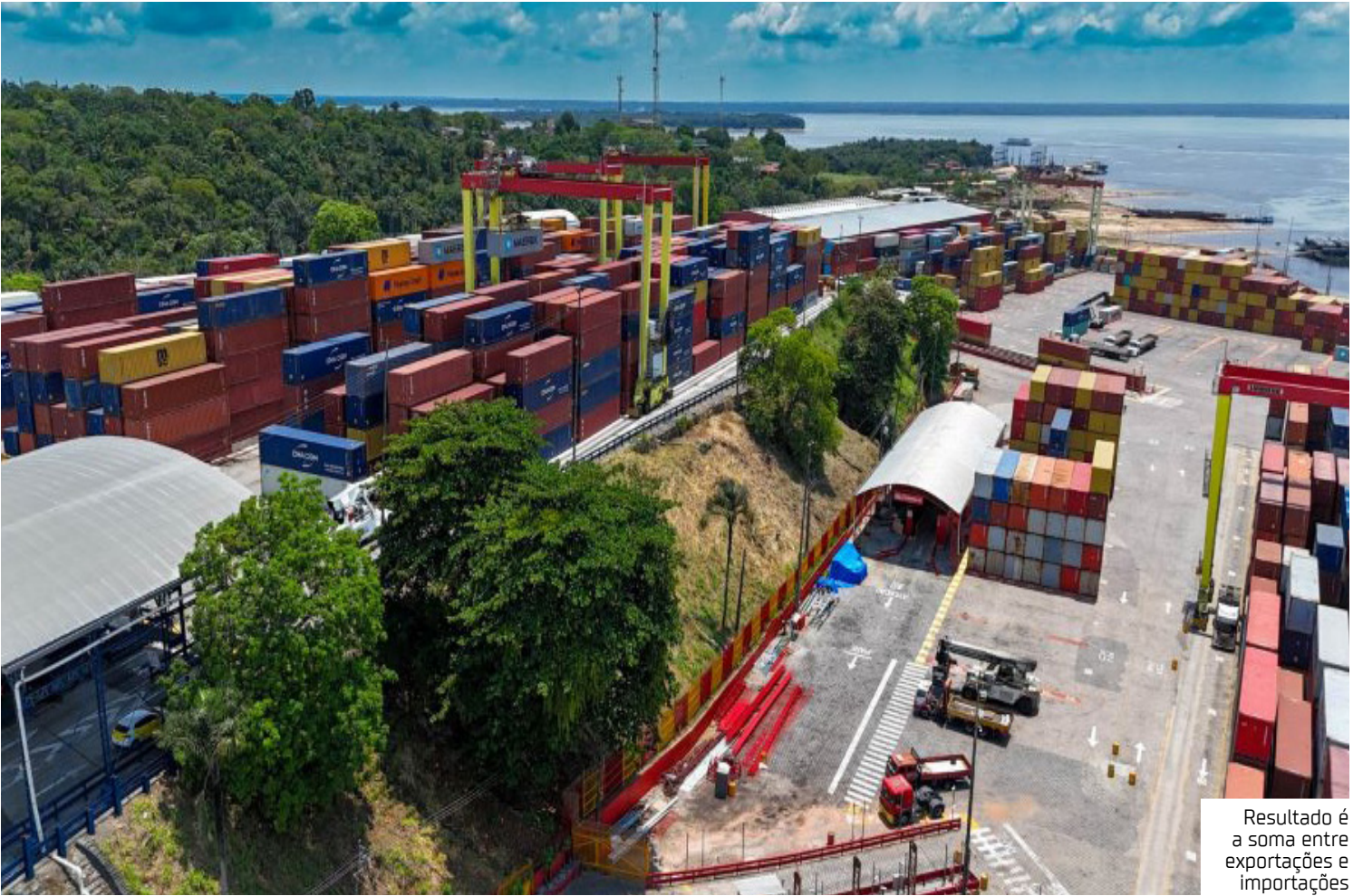
Resultado é a soma entre exportações e importações

Os Estados Unidos figuraram como o segundo maior parceiro de importações do Amazonas. O destaque foi o produto “Copolímeros de etileno e alfa-olefina, de densidade inferior a 0,94”, que atingiu US$ 35,52 milhões, 30,38% do total importado dos EUA