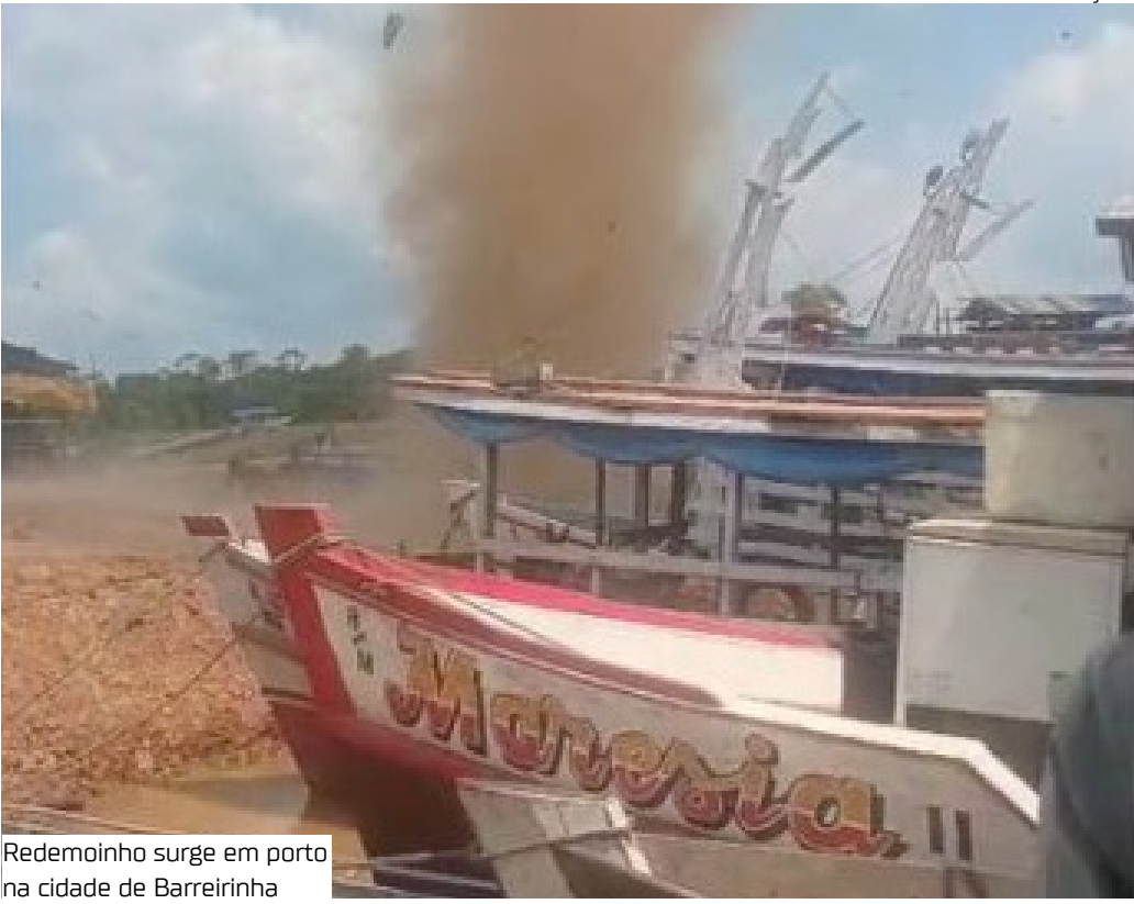
Redemoinho surge em porto na cidade de Barreirinha

rotação. “É um fenômeno de microescala, dura poucos segundos e tem diâmetro pequeno, entre 1 e 10 metros. Não provoca danos estruturais, diferente dos tornados”, afirmou. Veiga destacou ainda que esse tipo de redemoinho pode ocorrer em qualquer cidade, especialmente em áreas de forte calor e solo seco, e sempre com curta duração e baixa intensidade.