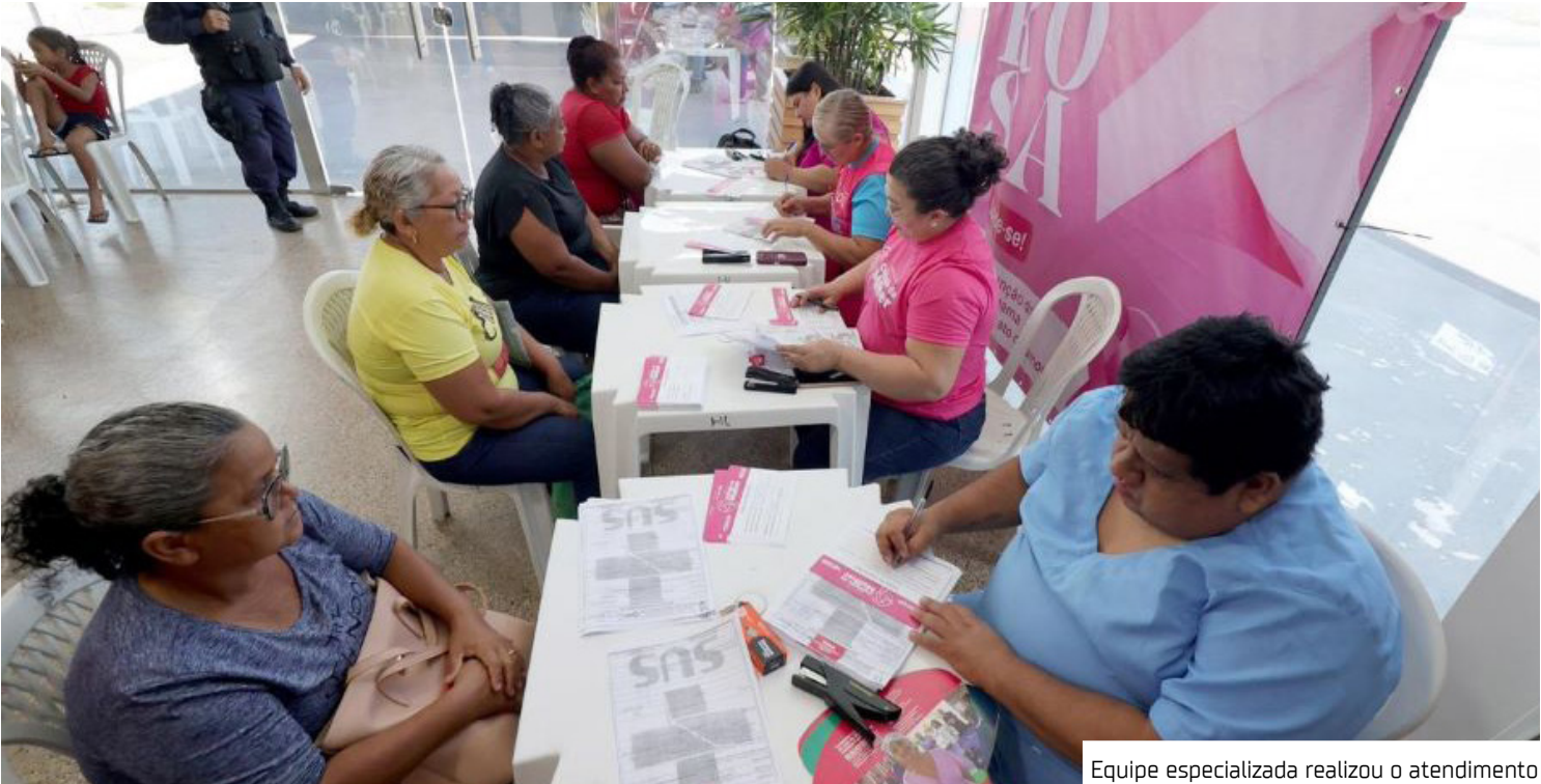
Equipe especializada realizou o atendimento