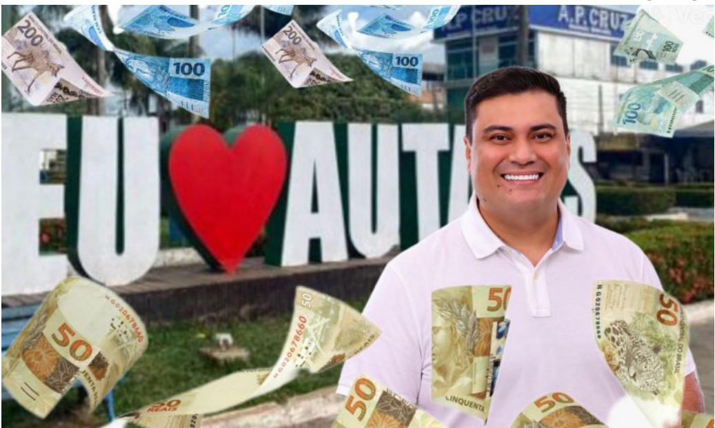
Maior parte desses projetos estava vinculada ao Fundo Nacional de Desenvolvimento da Educação (FNDE)

O cenário se agrava diante da falta de transparência. Nenhum relatório detalhado foi divulgado sobre auditorias internas, análises técnicas ou o destino das verbas empenhadas. Projetos como a Escola Municipal Bela Vista e a Quadra da Escola Raimunda Caldas, ambos financiados com repasses do FNDE, permanecem sem explicações.