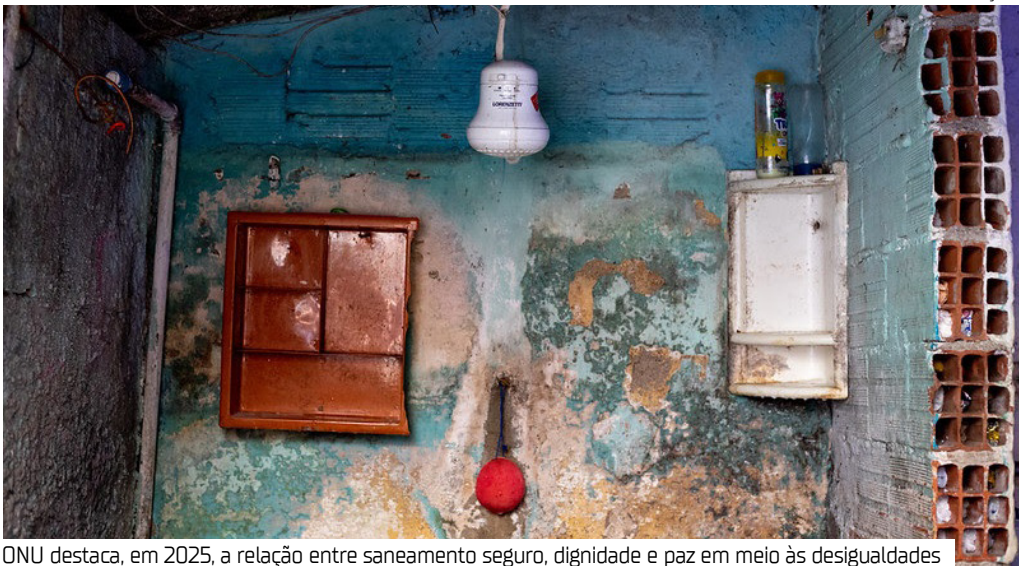
ONU destaca, em 2025, a relação entre saneamento seguro, dignidade e paz em meio às desigualdades