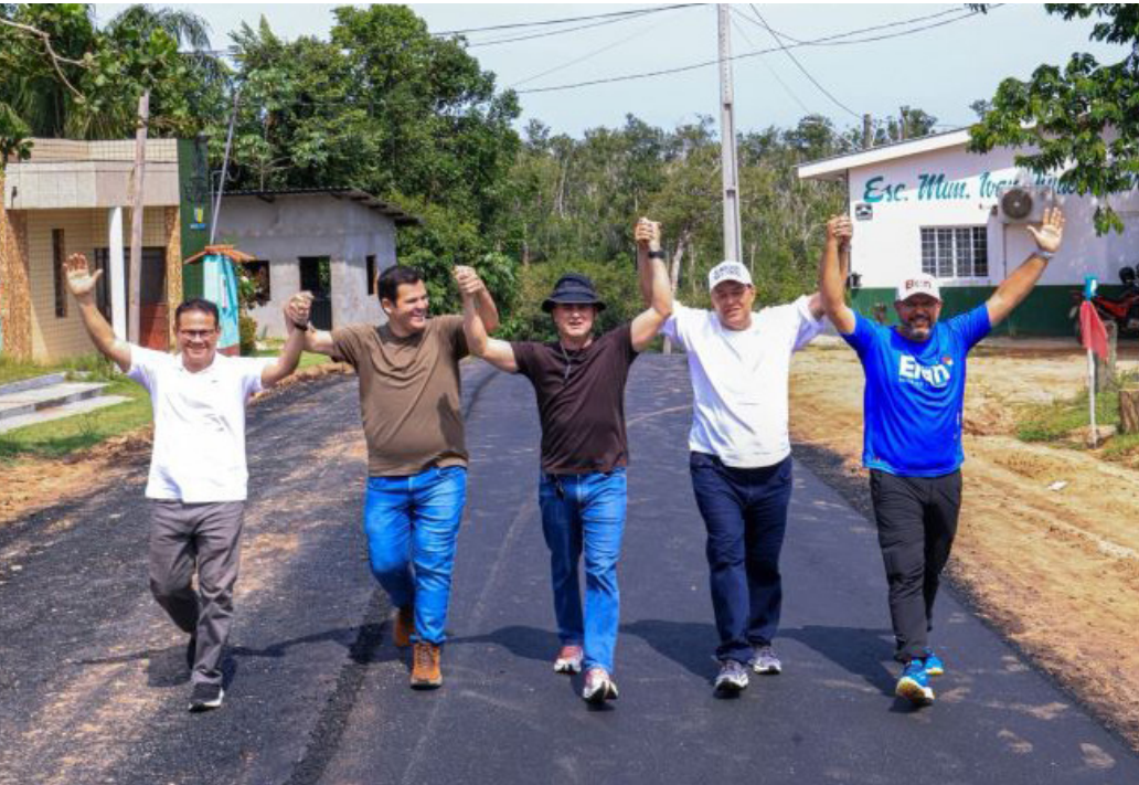
Recuperação de ramais da zona rural é feita por meio de emendas e articulação junto ao governo federal

A zona rural de Manaus segue recebendo obras importantes viabilizadas pelo senador Eduardo Braga (MDB-AM), por meio de emendas e articulação junto ao governo federal. Os 3,2 quilômetros do Ramal do Cueiras já estão em processo de asfaltamento, melhorando o acesso de moradores e agricultores da região.