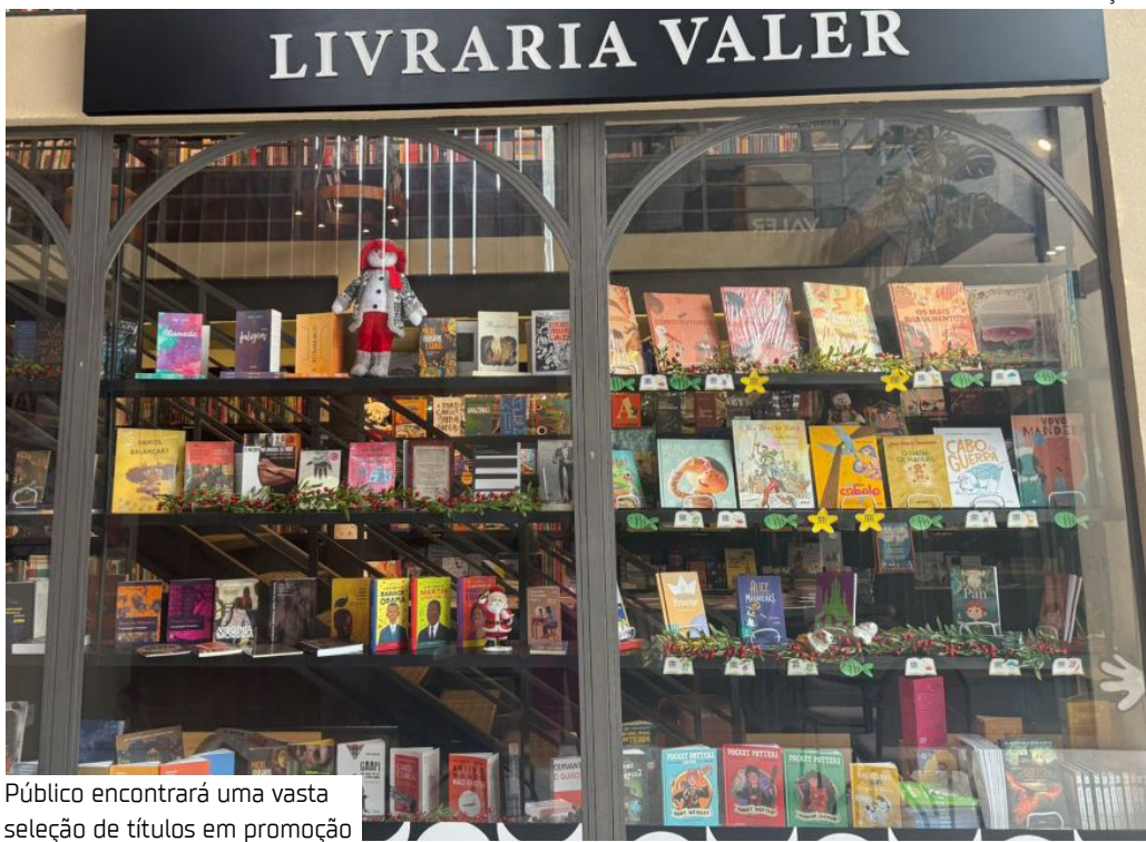
Público encontrará uma vasta seleção de títulos em promoção