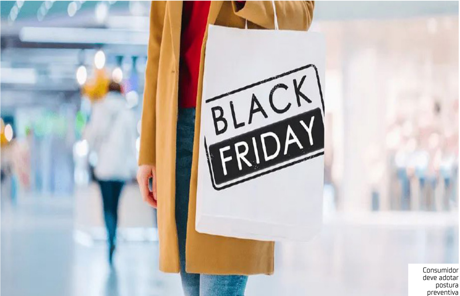
Consumidor deve adotar postura preventiva

Internet No comércio eletrônico — cada vez mais utilizado pelos consumidores de Manaus — o problema mais recorrente é o cancelamento sem justificativa após a finalização da compra. Para evitar prejuízos, especialistas recomendam que o consumidor registre todas as etapas da operação: páginas de oferta, confirmação de pagamento, conversas com atendentes e recibos digitais. Segundo orientações do Procon, manter esse histórico é fundamental para exigir a conclusão da venda ou ressarcimento. Golpes digitais também