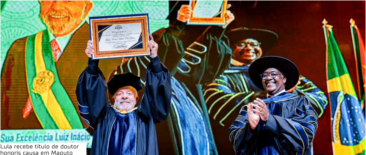
Lula recebe título de doutor honoris causa em Maputo