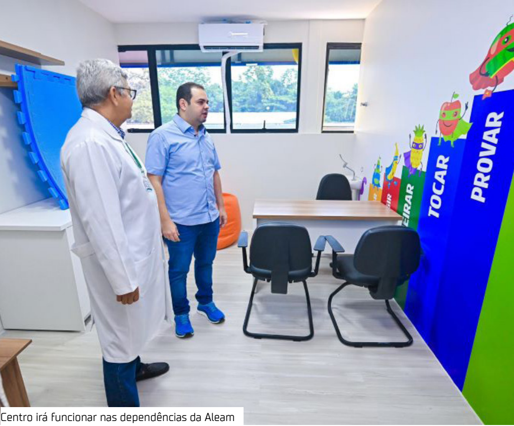
Centro irá funcionar nas dependências da Aleam