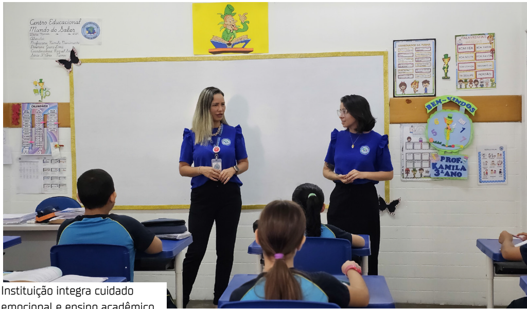
Instituição integra cuidado emocional e ensino acadêmico

Quatro anos após a pandemia, especialistas brasileiros ainda observam impactos significativos no comportamento e na saúde emocional das crianças. Pesquisas da Fundação Maria Cecília Souto Vidigal (2023) apontam que 53% das escolas registram aumento de ansiedade e dificuldade de convivência no retorno às rotinas. Outro levantamento da Fiocruz (2022) identificou mudanças de humor, irritabilidade e desafios de socialização entre crianças pequenas como efeitos prolongados do isolamento. Mesmo mais brandos, esses reflexos permanecem no cotidiano escolar e reforçam a necessidade de práticas permanentes que