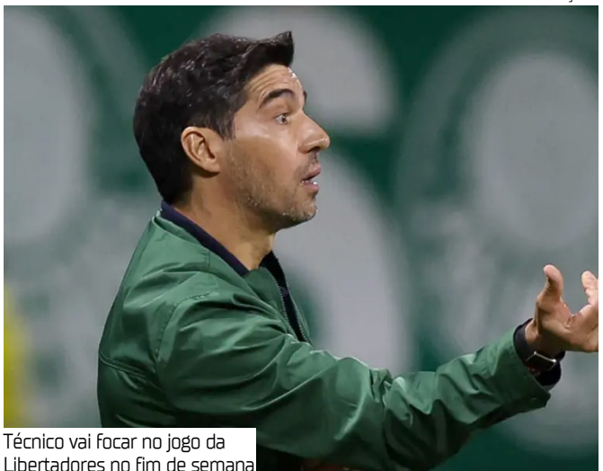
Técnico vai focar no jogo da Libertadores no fim de semana

O grupo que permanece no CT é formado por: Carlos Miguel (goleiro); Gustavo Gómez, Murilo e Bruno Fuchs (zagueiros); Joaquín Piquerez e Khellven (laterais); Andreas Pereira, Raphael Veiga e Allan (meias); Flaco López e Vitor Roque (atacantes).