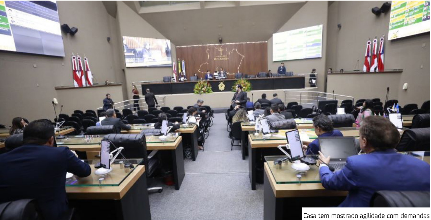
Casa tem mostrado agilidade com demandas

"Espera-se que o programa resulte em uma gestão de ativos mais eficientes, com