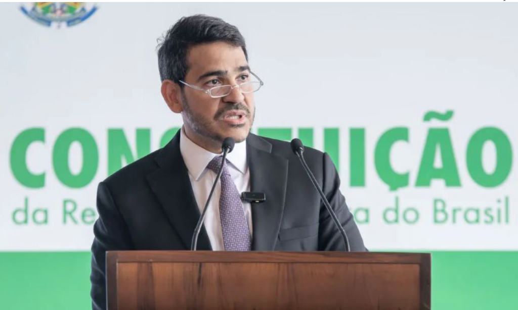
Advogado foi indicado pelo presidente da República a uma vaga no Supremo Tribunal Federal (STF)

Com isso, as posições parlamentares também retornaram às configurações anteriores.