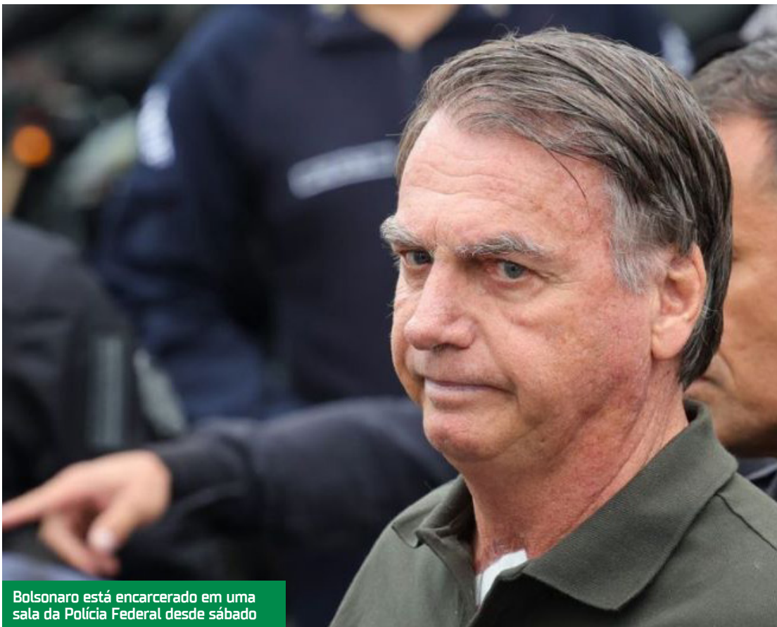
Bolsonaro está encarcerado em uma sala da Polícia Federal desde sábado

Em setembro, Bolsonaro foi condenado pela Primeira Turma do Supremo a 27 anos e três meses de prisão em regime inicial fechado. Por 4 votos a 1, ele foi considerado culpado de liderar uma organização