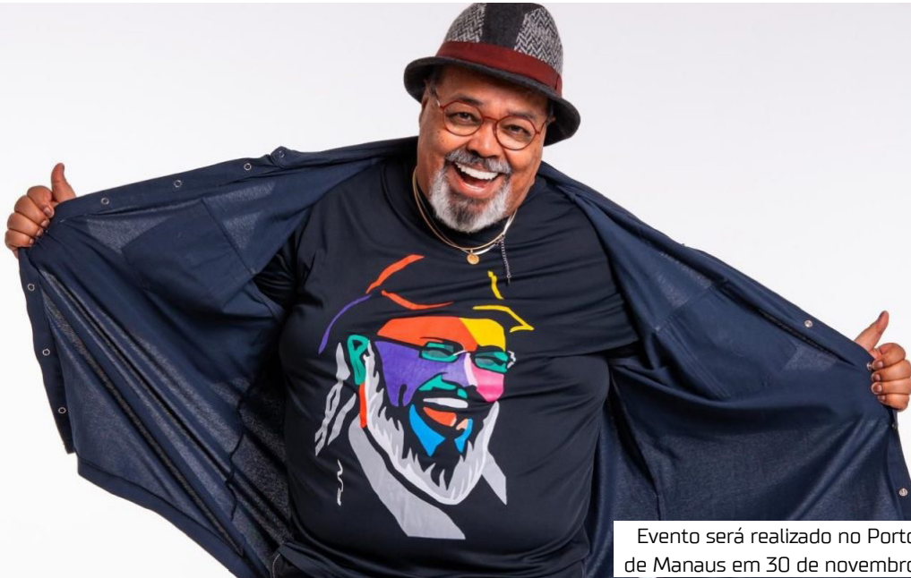
Evento será realizado no Porto de Manaus em 30 de novembro