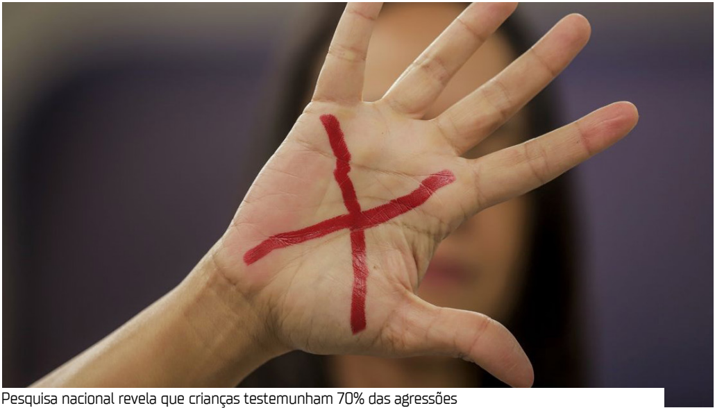
Pesquisa nacional revela que crianças testemunham 70% das agressões