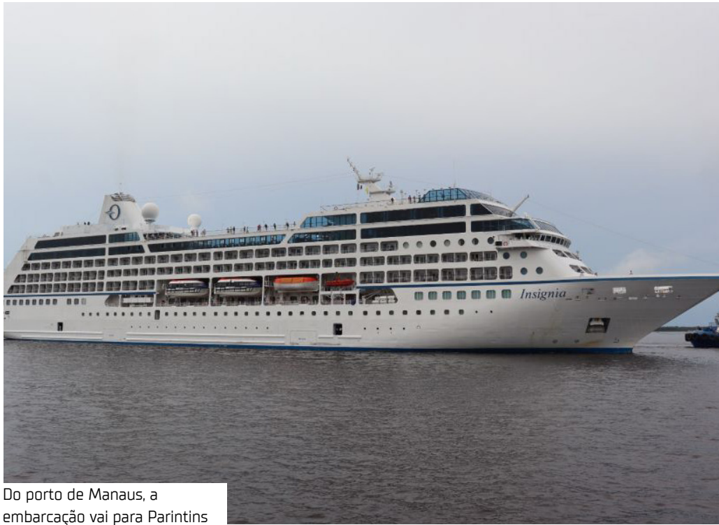
Do porto de Manaus, a embarcação vai para Parintins