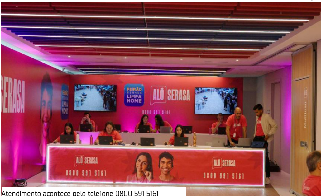
Atendimento acontece pelo telefone 0800 591 5161

O atendimento telefônico gratuito para negociação de dívidas retorna para a 34ª e maior edição do Feirão Serasa Limpa Nome. A ação “Alô Serasa”, acontece a partir desta terça-feira (25) e se estende até o último dia do mês, no sábado (29), pelo telefone 0800 591 5161. O projeto foi criado em novembro de 2024 para englobar todos os brasileiros que buscam por um atendimento humanizado para negociar dívidas. Desde então, nas duas edições realizadas, já foram mais de 77 mil atendimentos, que geraram mais de 30 mil acordos fechados apenas pelo contato telefônico gratuito. “Mesmo com o mundo cada vez mais digitalizado,