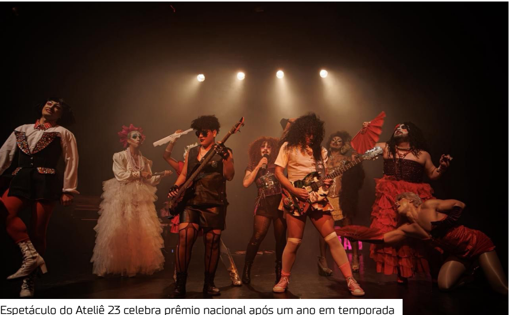
Espectáculo do Ateliê 23 celebra prêmio nacional após um ano em temporada

O espetáculo “Sebastião”, do Ateliê 23, foi eleito como “Melhor Elenco” pelo Prêmio Cenym de Teatro Nacional 2025, honraria da Academia de Artes no Teatro do Brasil (ATEB) que reconhece a excelência do teatro brasileiro. A companhia amazonense também concorria em outras quatro categorias: “Melhor Companhia de Teatro”, “Melhor Qualidade Artística de Produção”, “Melhor Figurino” e “Melhores Adereços e Objetos de Cena”.