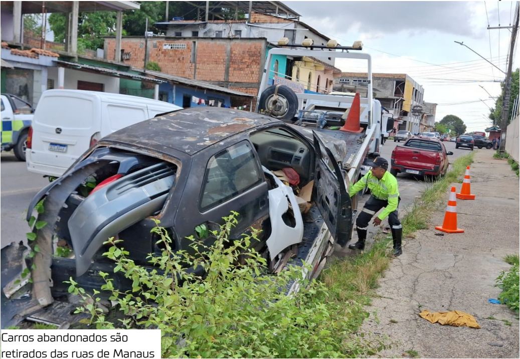
Carros abandonados são retirados das ruas de Manaus