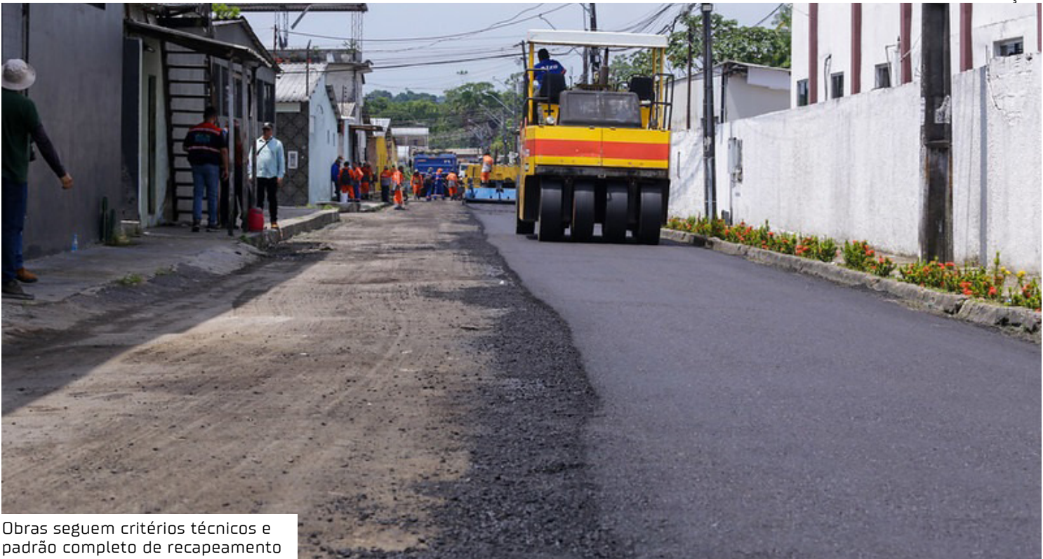
Obras seguem critérios técnicos e padrão completo de recapeamento