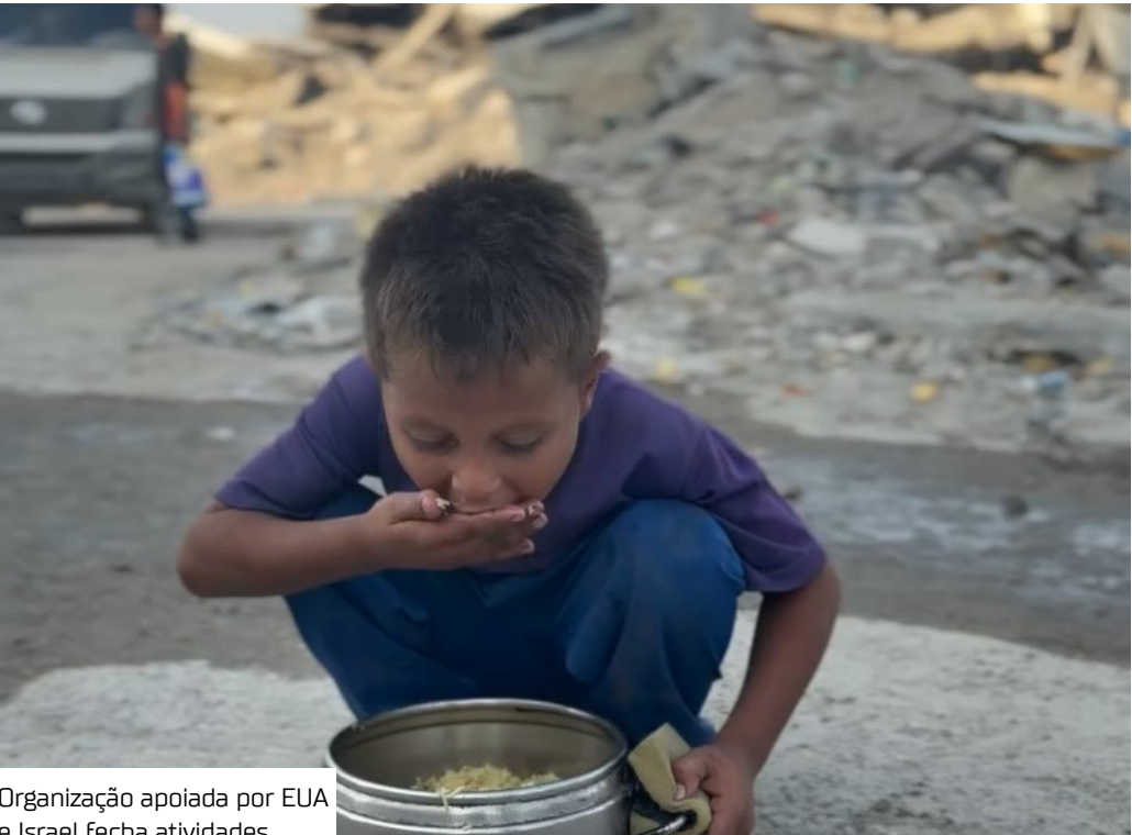
Organização apoiada por EUA e Israel fecha atividades

A Fundação Humanitária de Gaza, organização apoiada pelos Estados Unidos e por Israel para levar ajuda ao território palestino, anunciou ontem (24) o encerramento de suas operações após seis meses de atividade. No período, centenas de palestinos foram mortos enquanto tentavam chegar aos centros de distribuição. Em comunicado, a entidade afirmou ter alcançado o “sucesso de sua missão de emergência em