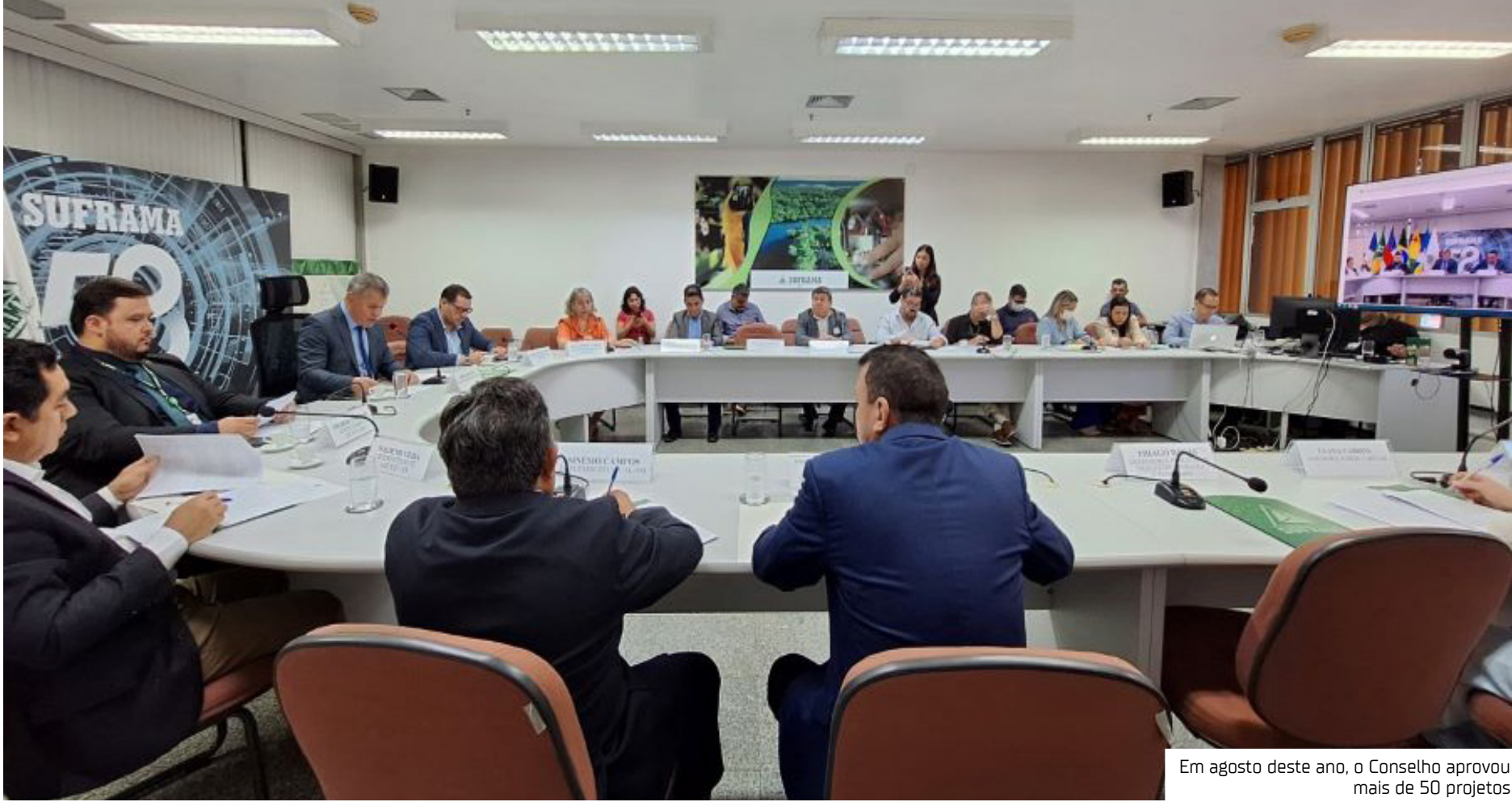
Em agosto deste ano, o Conselho aprovou mais de 50 projetos

Na pauta constam 45 projetos que já foram aprovados pela autarquia por delegação de competência, conforme a Resolução CAS nº 205/2021, e 16 projetos