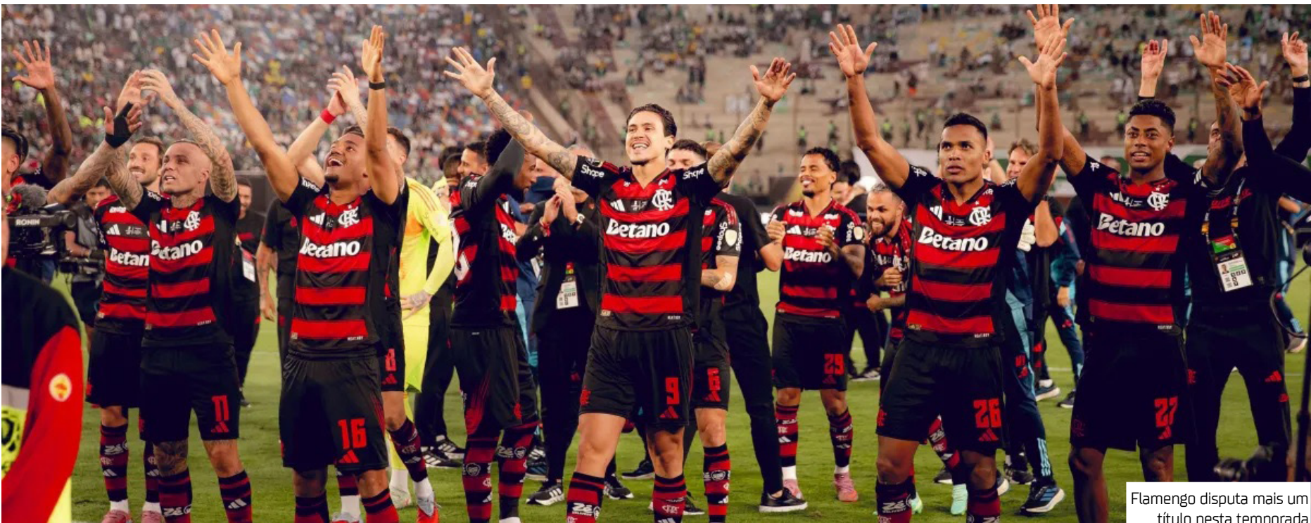
Flamengo disputa mais um título nesta temporada

A equipe de Filipe Luís chega embalada pelos títulos sobre Palmeiras, na final da Libertadores, e pela campanha que selou a conquista do Brasilei-