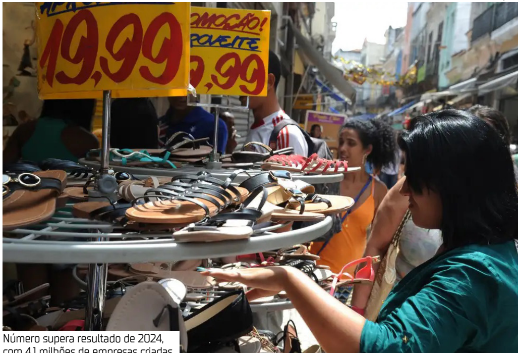
Número supera resultado de 2024, com 4,1 milhões de empresas criadas

O Brasil abriu 4,6 milhões de novos pequenos negócios entre janeiro e novembro de 2025, número que já supera o resultado de 2024, quando foram criadas 4,1 milhões de empresas. Os dados mostram alta de 19% em relação ao mesmo período do ano passado, consolidando o melhor desempenho da série histórica. Os pequenos negócios representaram 97% das empresas abertas no país em 2025. Entre elas, 77% são microempreendedores individuais (MEI), 19% são microempresas e 4% são empresas