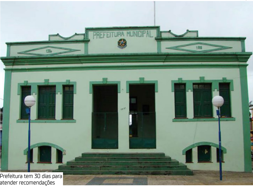
Prefeitura tem 30 dias para atender recomendações