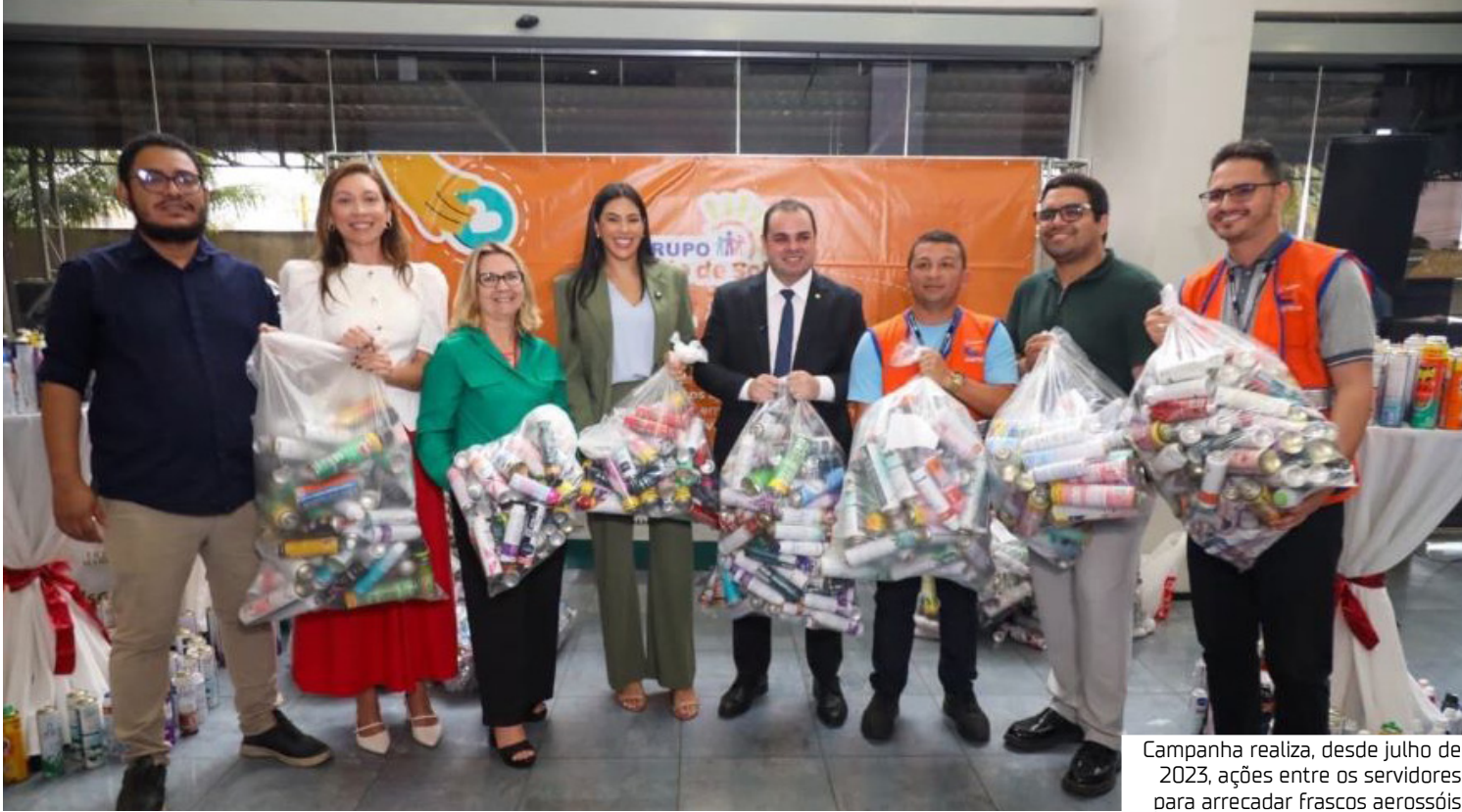
Campanha realiza, desde julho de 2023, ações entre os servidores para arrecadar frascos aerossóis

frascos, revertidos em recursos para cestas básicas, fraldas e materiais de artesanato destinados a crianças com doenças sanguíneas em tratamento no Hemoam.