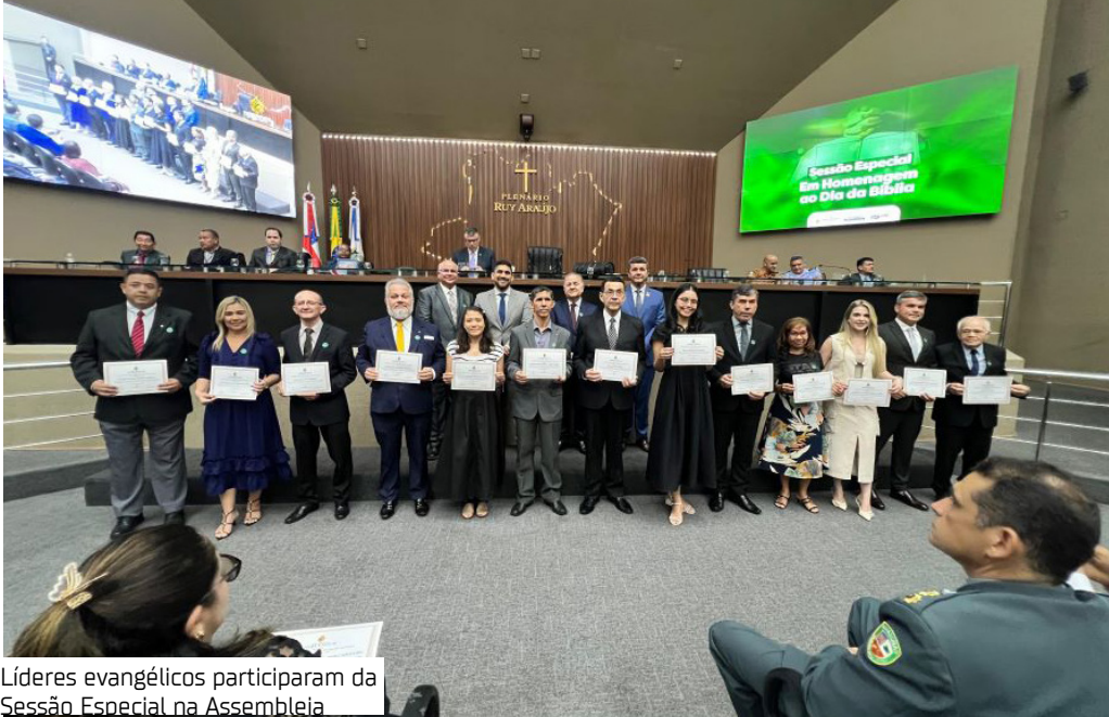
Líderes evangélicos participaram da Sessão Especial na Assembleia