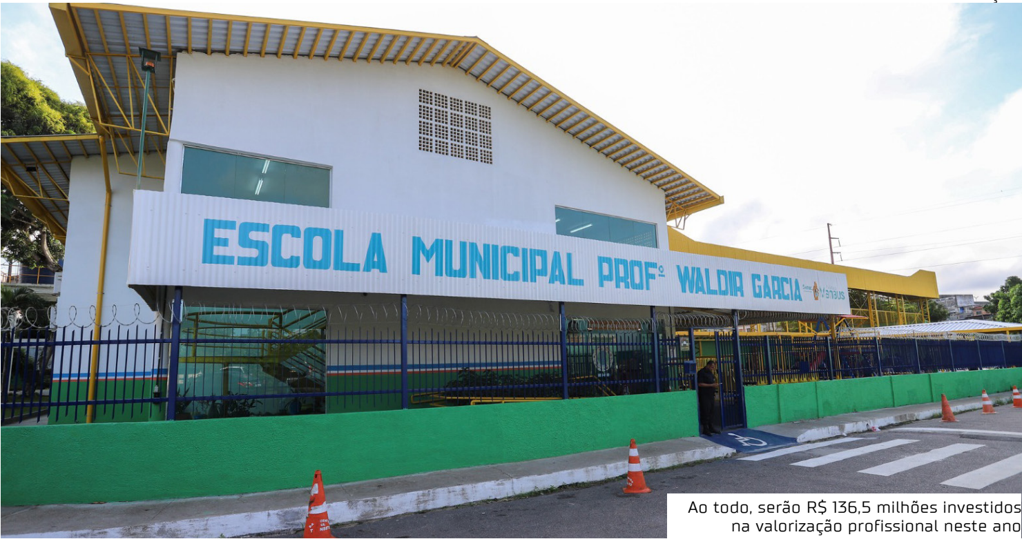
Ao todo, serão R$ 136,5 milhões investidos na valorização profissional neste ano

As progressões por titularidade e tempo de serviço beneficiarão 10.329 matrículas, somando R$ 40 milhões em avanços estruturais na carreira. Já o abono do Fundeb, de R$ 52 milhões, será pago em 30 de janeiro de 2026, contemplando cerca de 17 mil matrículas, com valores de R$ 2 mil para cargas de 20 horas, R$ 4 mil para cargas de 40 horas (incluindo administrativos) e R$ 6 mil para cargas de 60 horas. Ao entregar a nova estrutura da Waldir Garcia, que não passava por reforma há mais de 20 anos, David Almeida destacou que o pacote de valorização e as melhorias físicas caminham lado a lado. "Nada fala mais alto do que o trabalho e os resultados. Manaus vive hoje o melhor momento da sua história na educação, e a escola Waldir Garcia é um símbolo desse avanço. Entre as 10 maiores cidades do Brasil, Manaus tem a melhor educação. Entre todas as capitais, somos a quinta melhor, mesmo recebendo menos recursos por aluno do que 98% dos municípios brasileiros. Fazemos mais com menos porque te-