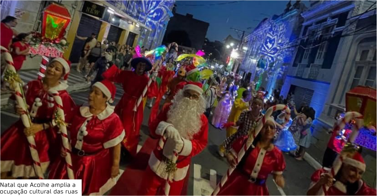
Natal que Acolhe amplia a ocupação cultural das ruas

Para esta edição, a Cantata de Natal terá um papel especial dentro da programação. A apresentação marca também um momento simbólico do futuro Centro Cultural Casarão de Ideias Saldanha, que está passando por reforma e restauro no prédio histórico onde funcionou o Grupo Escolar Saldanha Marinho. “Realizar a cantata este ano, com a motivação do Natal que Acolhe, dá ainda mais força a um evento que já fazíamos na Barroso. Agora ampliamos esse circuito, trazendo