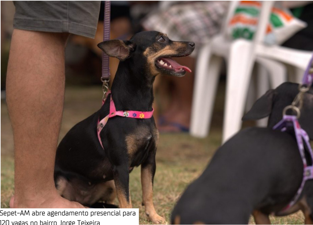
Sepet-AM abre agendamento presencial para 120 vagas no bairro Jorge Teixeira

A Secretaria de Estado de Proteção Animal do Amazonas (Sepet-AM) abre hoje (10), das 9h às 14h, o agendamento presencial para castração gratuita de cães e gatos no bairro Jorge Teixeira, Zona Leste de Manaus. A ação será realizada no Instituto Estrela de Davi, localizado na rua Belford Roxo, nº 1.193, 4ª etapa do bairro. Serão disponibilizadas 120 vagas para a comunidade. As senhas serão distribuídas por ordem de chegada, enquanto houver vagas. O objetivo é controlar a população de