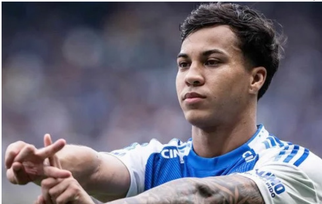
Raposa vai tentar fazer resultado no primeiro jogo das semifinais da competição nacional