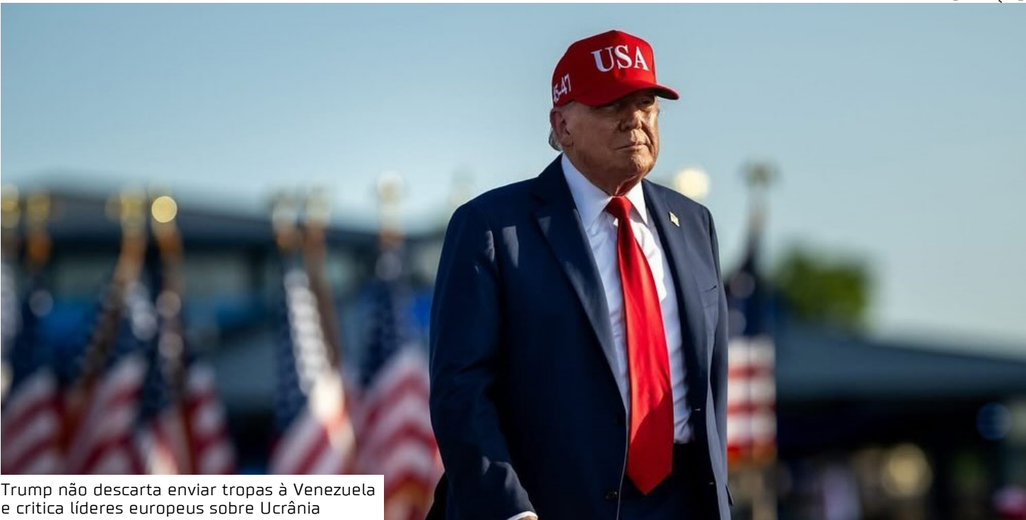
Trump não descarta enviar tropas à Venezuela e critica líderes europeus sobre Ucrânia

Trump também comentou a guerra na Ucrânia, afirmando que a Europa é um grupo de países “em decadência” liderados por pessoas “fracas”. “Acho que eles são fracos”, disse sobre líderes políticos do