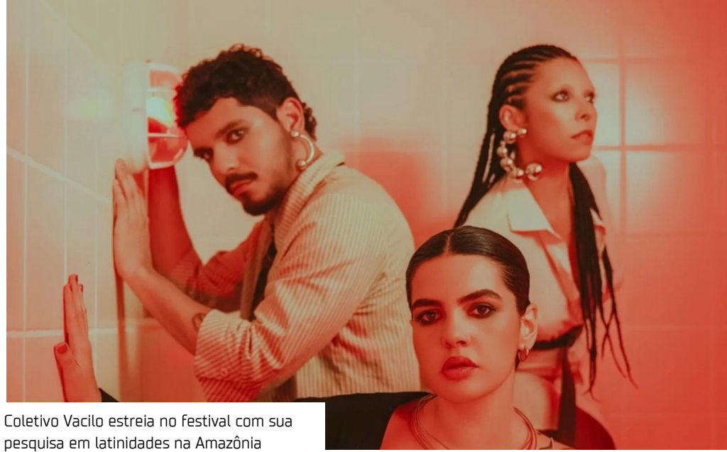
Coletivo Vacilo estreia no festival com sua pesquisa em latinidades na Amazônia

O Festival Psica 2025, que ocorre entre os dias 12 a 14 de dezembro no Estádio do Mangueirão em Belém (PA), é um dos maiores encontros culturais do Norte do Brasil, e abre espaço nesta edição para dois nomes de Manaus que vêm expandindo as fronteiras da música feita na Amazônia: o coletivo Vacilo e o trio D’água Negra. Ambos representam diferentes vertentes da cena local, mas compartilham a mesma urgência em construir pontes entre a região e o restante do país. Criada em 2023, a Vacilo Fiesta é uma experiência musical que celebra as latinidades a partir da Amazônia, reunindo ritmos como reggaeton,