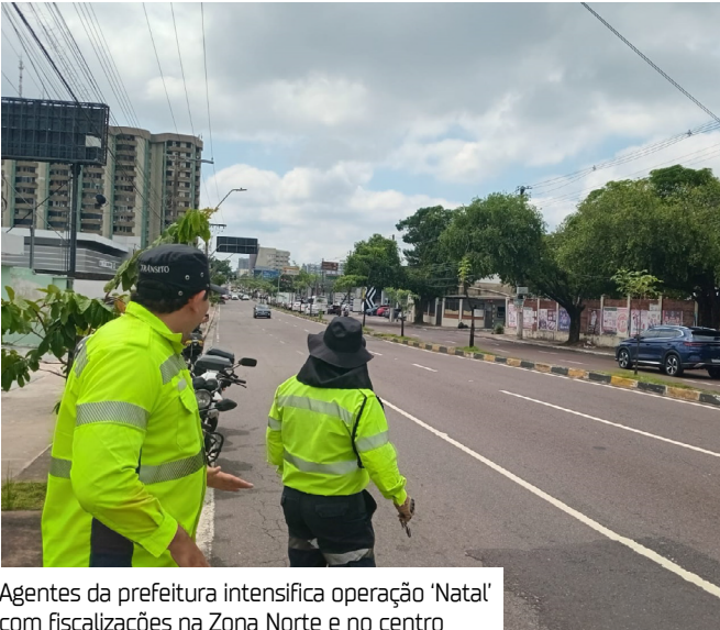
Agentes da prefeitura intensifica operação ‘Natal’ com fiscalizações na Zona Norte e no centro

coamento do tráfego da região. Já no Centro, o foco foi o ordenamento do estacionamento e a prevenção de obstruções nas vias. Foram monitoradas as avenidas 7 de Setembro, Eduardo Ribeiro, Floriano Peixoto, além das ruas Marquês de Santa Cruz, Dr. Moreira, dos Andradas e Barés. A operação “Natal” segue em andamento por toda a cidade, intensificando ações de fiscalização para garantir um trânsito mais seguro e organizado durante o período de maior circulação nas áreas comerciais.