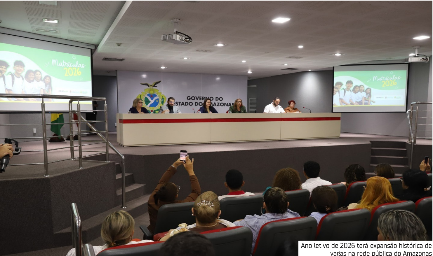
Ano letivo de 2026 terá expansão histórica de vagas na rede pública do Amazonas

cialmente, nas escolas da rede municipal. Vagas Para o ano letivo de 2026, a rede estadual de ensino oferecerá 542.287 mil vagas para a capital e para o interior do Amazonas. A estimativa é de que 346.732 sejam de rematrículas e reordenamentos, e 195.555 de estudantes novatos. Já na rede municipal de Manaus, a Semed rematriculará 236.190 mil discentes e ofertará 87.942 novas vagas, podendo chegar a 295.199 mil vagas de alunos matriculados. O candidato pode solicitar a reserva de vaga para os seguintes níveis de ensino: Educação Infantil, Ensino Fundamental (1º ao 9º ano), Ensino Médio (1ª a 3ª série) e Educação de Jovens e Adultos (EJA). A reserva de vaga tem validade de três dias úteis. Após esse período, perderá a validade e será necessário solicitar uma nova reserva. A matrícula será efetivada somente quando o responsável legal ou o próprio aluno maior de 18 anos comparecer à escola com a documentação necessária. A matrícula é gratuita, sendo proibido o condicionamento à cobrança de taxas ou qualquer exigência