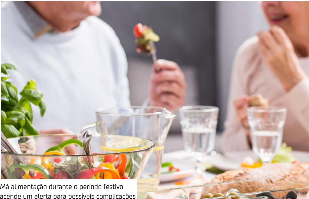
Má alimentação durante o período festivo acende um alerta para possíveis complicações