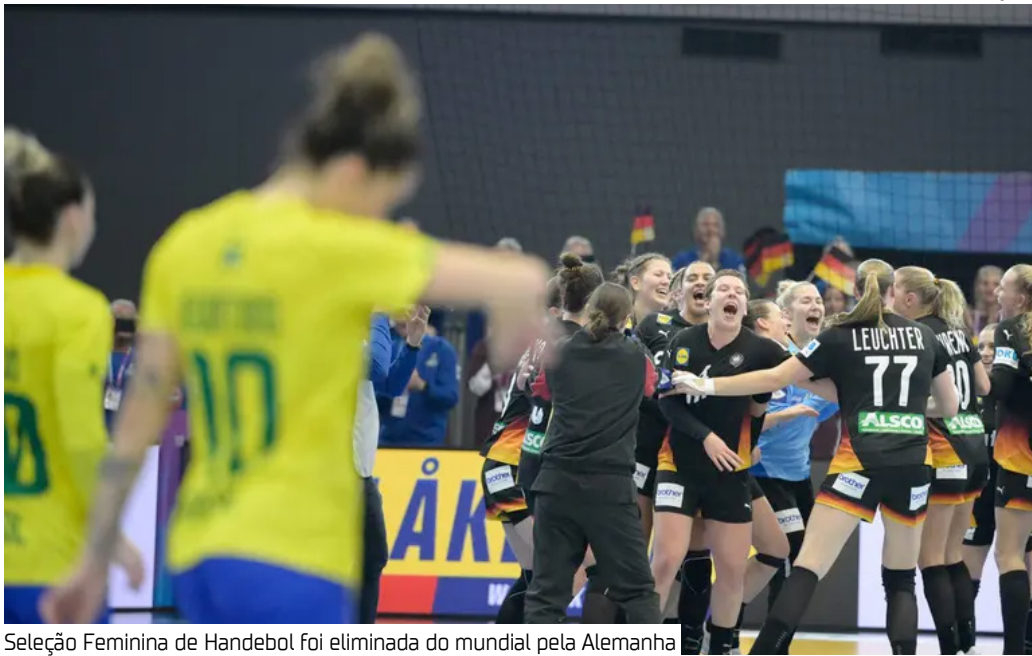
Seleção Feminina de Handebol foi eliminada do mundial pela Alemanha