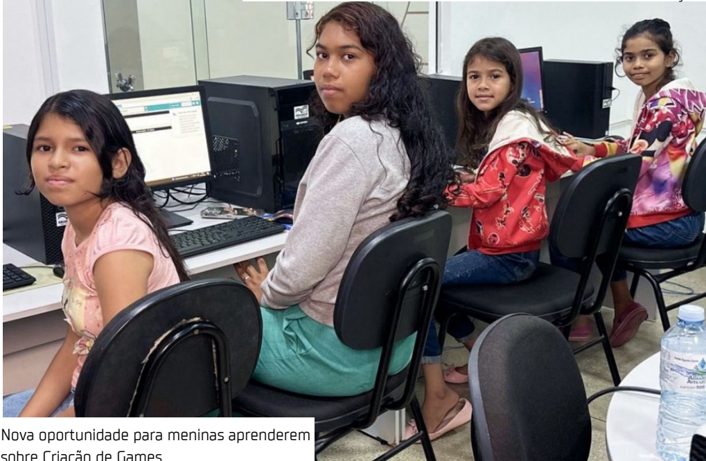
Nova oportunidade para meninas aprenderem sobre Criação de Games