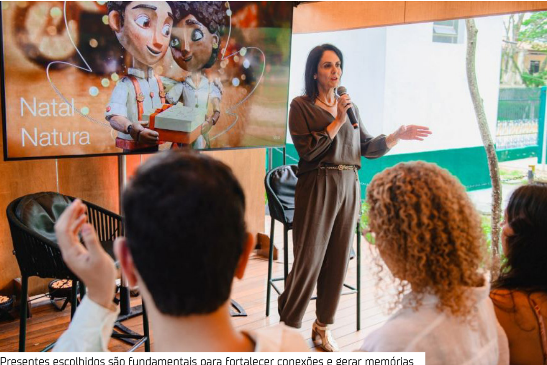
Presentes escolhidos são fundamentais para fortalecer conexões e gerar memórias