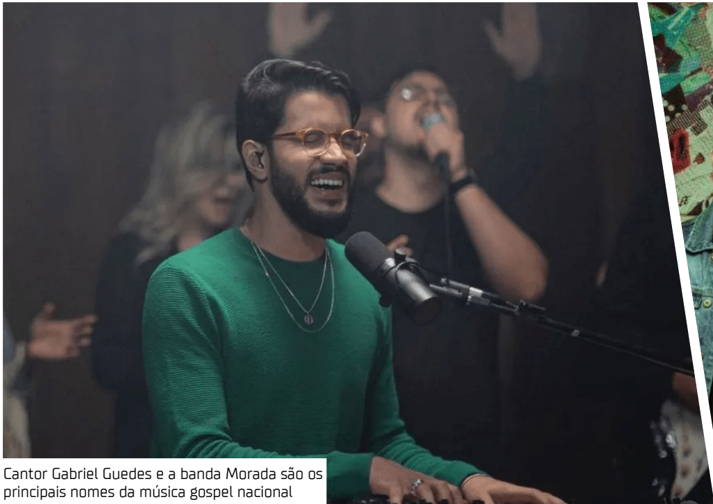
Cantor Gabriel Guedes e a banda Morada são os principais nomes da música gospel nacional

O prefeito de Manaus, David Almeida, confirmou na terça-feira (16) as primeiras atrações do Réveillon Gospel, que será realizado no dia 30 de dezembro, na Ponta Negra, Zona Oeste da capital. O evento contará com o cantor Gabriel Guedes e a banda Morada, dois dos principais nomes da música gospel nacional. “ ATRAÇÕES DO RÉVEILLON GOSPEL EM MANAUS Confirmado @gabrielguedes e @moradaoficial na Ponta Negra, no dia 30 de dezembro. Um momento de muito louvor em Manaus!”, publicou o prefeito de Manaus, David Almeida, nas redes sociais. A confirmação foi feita durante entrevista à RecordTV. O Réveillon Gospel integra