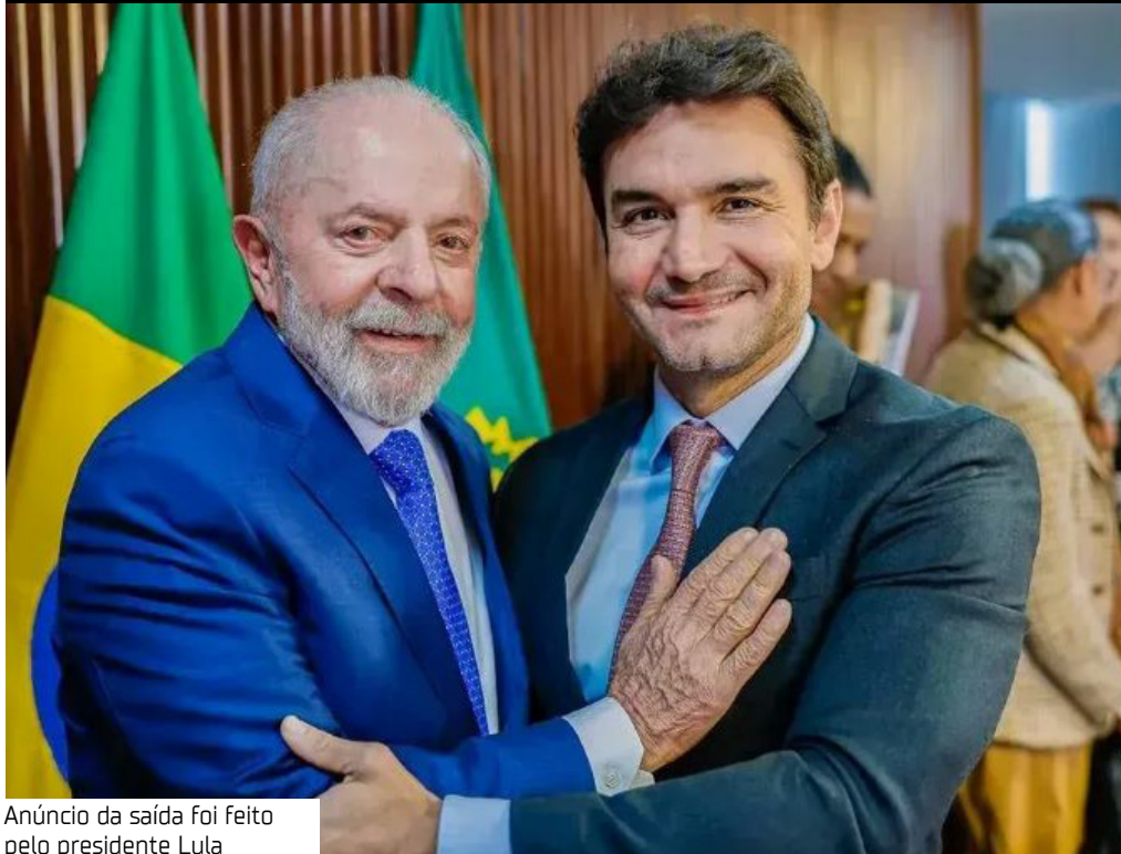
Anúncio da saída foi feito pelo presidente Lula