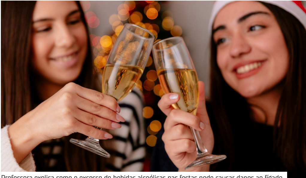
Professora explica como o excesso de bebidas alcoólicas nas festas pode causar danos ao fígado

Dezembro é tradicionalmente um mês de celebrações, por conta do Natal, Réveillon e as confraternizações de fim de ano, que costumam vir acompanhados de um consumo maior de bebidas alcoólicas. O excesso, entretanto, pode sobrecarregar o fígado, órgão responsável por metabolizar o álcool.