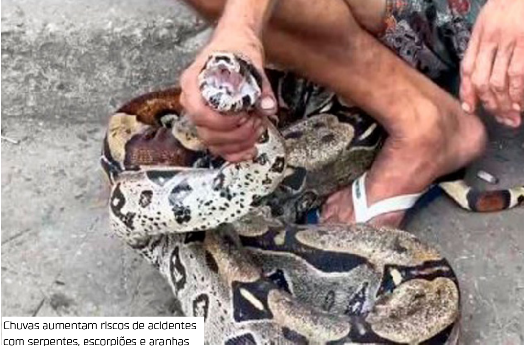
Chuvas aumentam riscos de acidentes com serpentes, escorpiões e aranhas

Elder Figueira, diretor de vigilância ambiental, complementa: "Cada notificação repre-