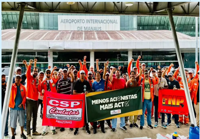
Trabalhadores da Petrobras aderem a greve nacional