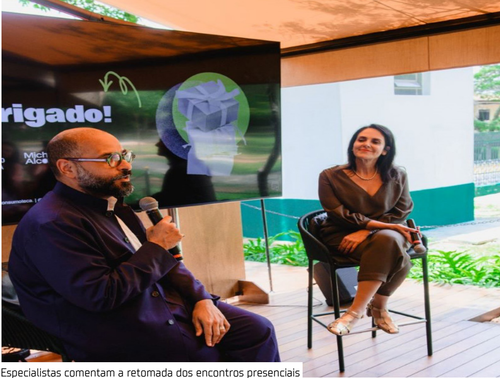
Especialistas comentam a retomada dos encontros presenciais