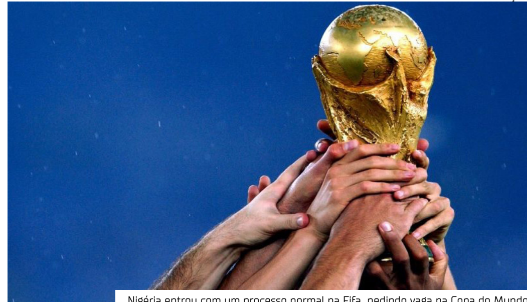
Nigéria entrou com um processo normal na Fifa pedindo vaga na Copa do Mundo