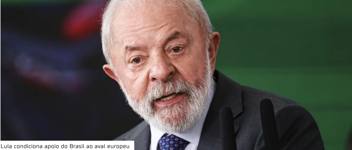
Lula condiciona apoio do Brasil ao aval europeu

França contra o pacto Neste momento, o Conselho Europeu analisa apenas a parte comercial do acordo. O bloco separou esse trecho do restante do documento neste ano para driblar a exigência de aprovação individual nos Parlamen-tos dos 27 países-membros da União Europeia. Giorgia Meloni anunciou ao Parlamento italiano que aderiu ao grupo liderado pela França contra o pacto. Com o apoio da Itália, o movimento francês alcançou os requisitos para formar uma minoria de bloqueio: ao menos quatro países representando 35% da população da UE. Polônia e Hungria já se po-