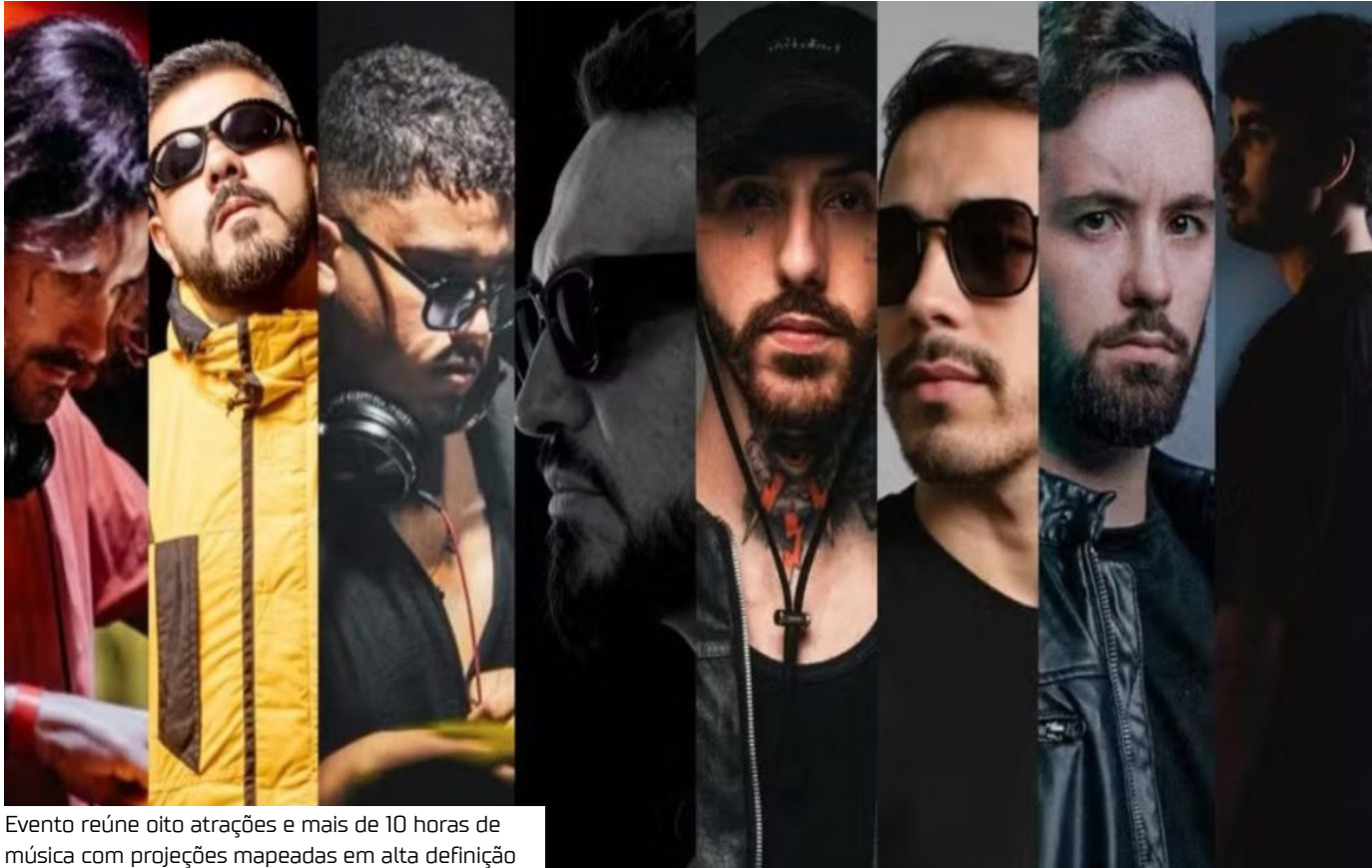
Evento reúne oito atrações e mais de 10 horas de música com projeções mapeadas em alta definição

A Alive Orbe acontece neste sábado (20), em Manaus, a partir das 22h, e promete transformar a cúpula subterrânea do Centro Cultural Povos da Amazônia em uma experiência totalmente imersiva. O evento reúne oito atrações e oferece mais de 10 horas de música, combinando tecnologia, arte visual e projeções mapeadas em alta definição. A produção redesenha a estrutura da chamada “Bola da Suframa” com