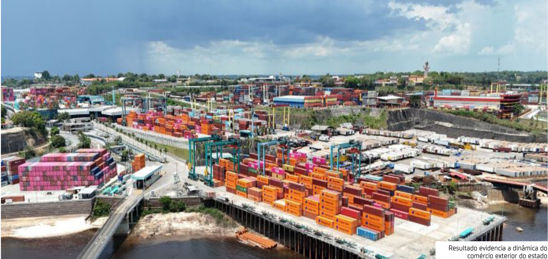
Resultado evidencia a dinâmica do comércio exterior do estado

Em novembro, as exportações amazonenses somaram US$ 98,72 milhões. Entre os principais destaques está a Alemanha, para onde foram destinadas exportações de ouro (incluindo o ouro platinado), em outras formas semimanufaturadas para usos não monetários, que totalizaram US$ 19,00