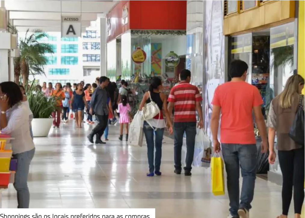
Shoppings são os locais preferidos para as compras

Com a aproximação do Natal, o comércio de Manaus acelera na reta final de um dos períodos mais importantes do varejo. A Pesquisa de Intenção de Compras para o Natal 2025, realizada pela Fecomércio-AM por meio do Instituto Fecomércio de Pesquisas Empresariais do Amazonas (Ifpeam), confirma o otimismo: 94% dos consumidores planejam comprar presentes neste fim de ano.