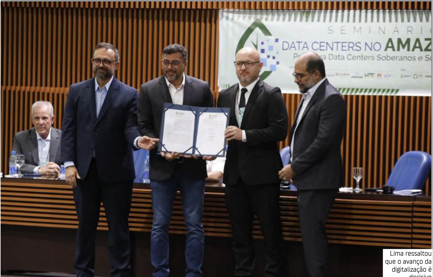
Lima ressaltou que o avanço da digitalização é decisivo

atrair esse tipo de empreendimento, o Amazonas amplia sua autonomia tecnológica, fortalece a segurança da informação e cria bases para um novo ciclo de desenvolvimento econômico. Ao destacar a importância da estrutura, Wilson Lima ressaltou que o avanço da digitalização é decisivo para o futuro do estado. “A soberania digital ganha uma nova dimensão na soberania das nações. Estruturas como os data centers são estratégicas para o Amazonas, considerando nossos desafios logísticos e a necessidade de garantir segurança e continuidade dos serviços. Reunimos todas as condições para avançar nessa política, que será uma grande tendência nos próximos anos”, afirmou o governador. O governador realizou a assinatura de um termo de cooperação técnica com o Instituto Brasileiro de Soberania Digital (IBSD). O acordo tem como objetivo avaliar a infraestrutura digital do estado, o nível de maturidade dos serviços públicos digi-