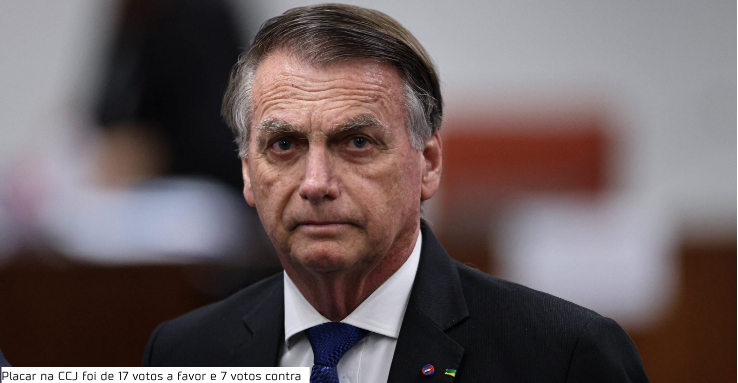
Placar na CCJ foi de 17 votos a favor e 7 votos contra

O relator na CCJ, Esperidião Amin (PP-SC), alterou a redação para limitar benefícios apenas a crimes relacionados a 8 de janeiro, evitando que condenados por outros delitos fossem contempla-