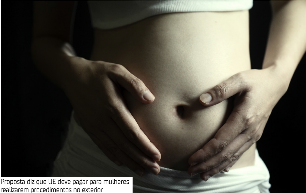
Proposta diz que UE deve pagar para mulheres realizarem procedimentos no exterior