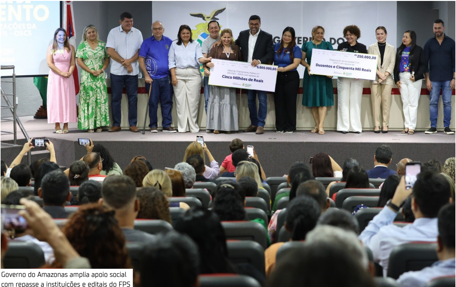
Governo do Amazonas amplia apoio social com repasse a instituições e editais do FPS

As OSCs poderão apresentar propostas que incluam aquisição de equipamentos, materiais e bens móveis, adequação de espaço físico, contratação de equipe essencial e serviços es-