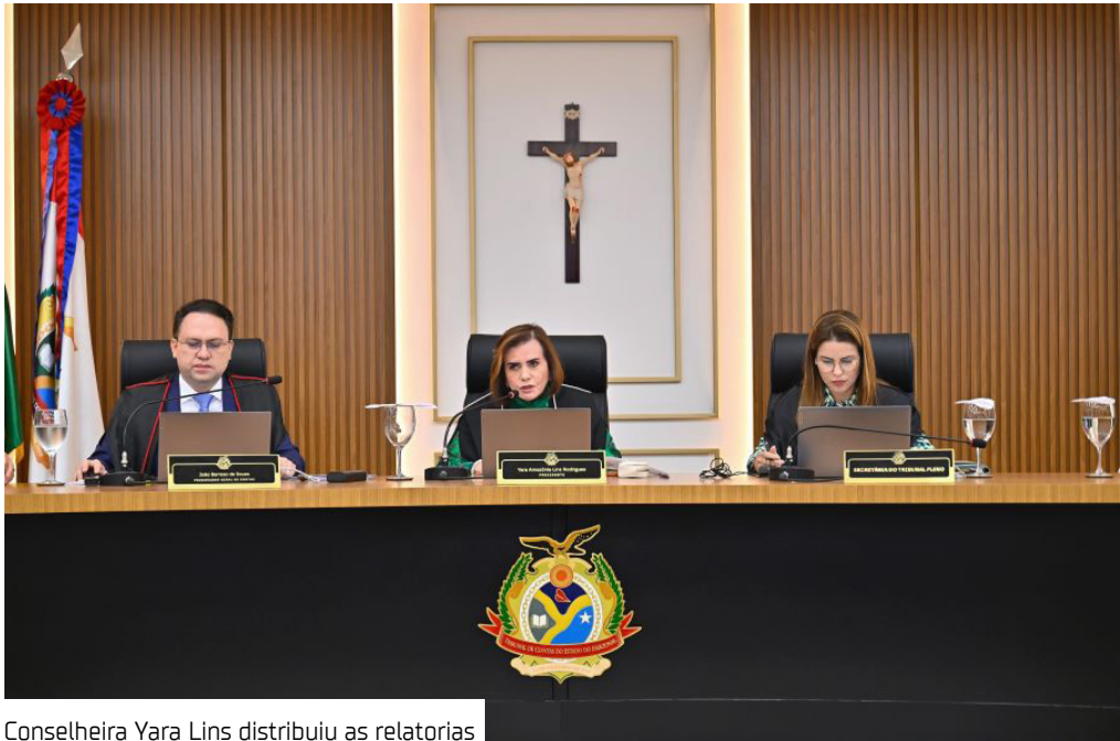
Conselheira Yara Lins distribuiu as relatorias

A presidente do Tribunal de Contas do Amazonas (TCE-AM), conselheira Yara Amazônia Lins, realizou a distribuição das relatorias dos municípios do interior e dos demais jurisdicionados da Corte. Os determinados são para o biênio 2026–2027. A definição ocorreu por meio de sorteio durante a 39ª Sessão do Tribunal Pleno e foi publicada no Diário Oficial Eletrônico do Tribunal. Ao todo, dez calhas, também chamadas de lotes, foram distribuídas entre conselheiros e auditores que compõem o Tribunal Pleno. Cada calha reúne municípios do interior do Ama-