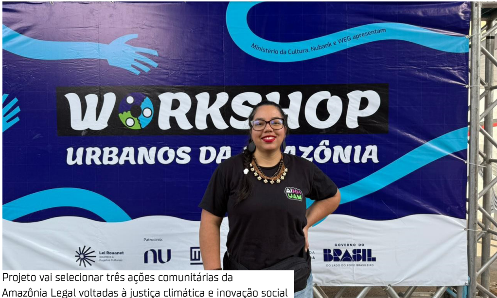
Projeto vai selecionar três ações comunitárias da Amazônia Legal voltadas à justiça climática e inovação social