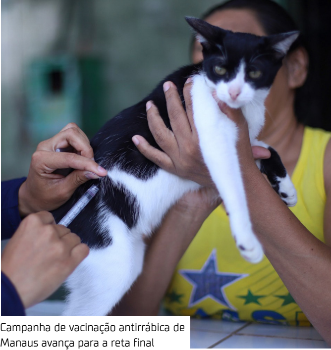
Campanha de vacinação antirrábica de Manaus avança para a reta final