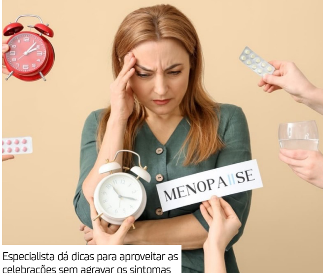
Especialista dá dicas para aproveitar as celebrações sem agravar os sintomas