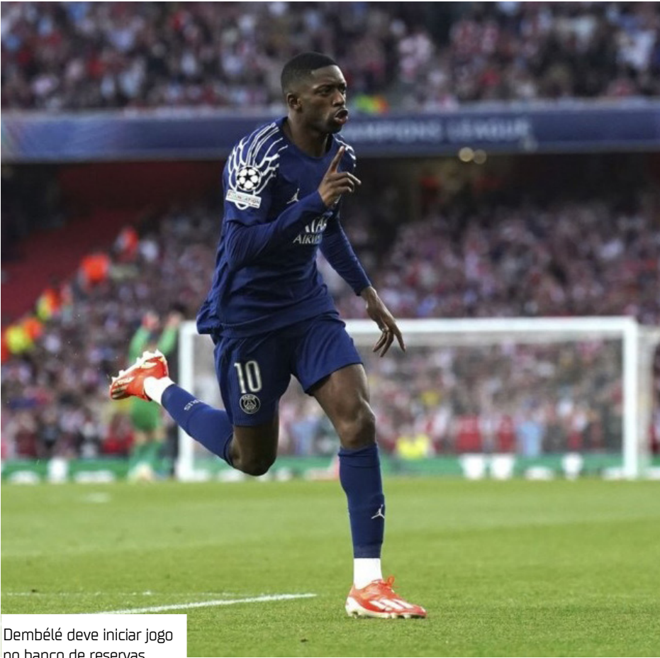
Dembélé deve iniciar jogo no banco de reservas

Destaque do Paris Saint-Germain em 2025, Dembélé é a principal 'arma' do clube francês. No entanto, é impor-