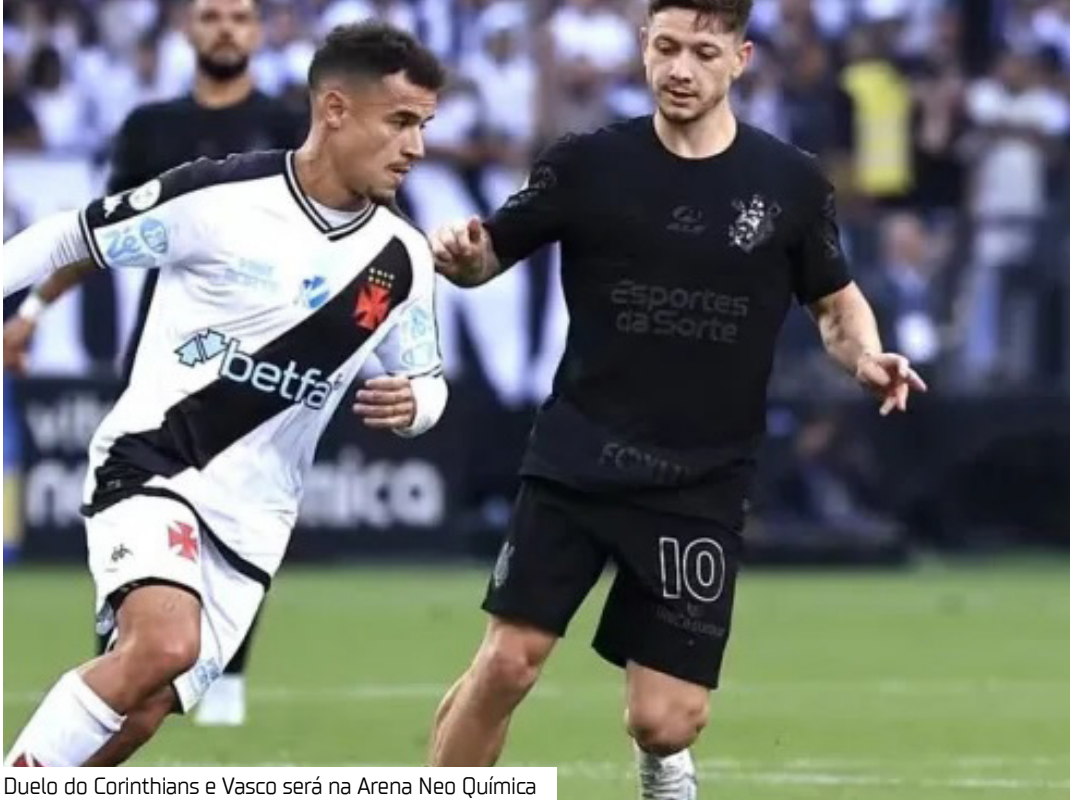
Duelo do Corinthians e Vasco será na Arena Neo Química