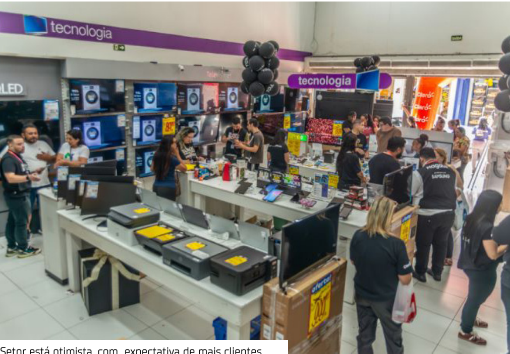
Sector está otimista, com expectativa de mais clientes

A reta final de 2025 traz otimismo para o varejo brasileiro. Segundo projeções da Associação Brasileira de Shopping Centers (Abrasce), o Natal deste ano deve registrar um aumento de 5% nas vendas em comparação a 2024.