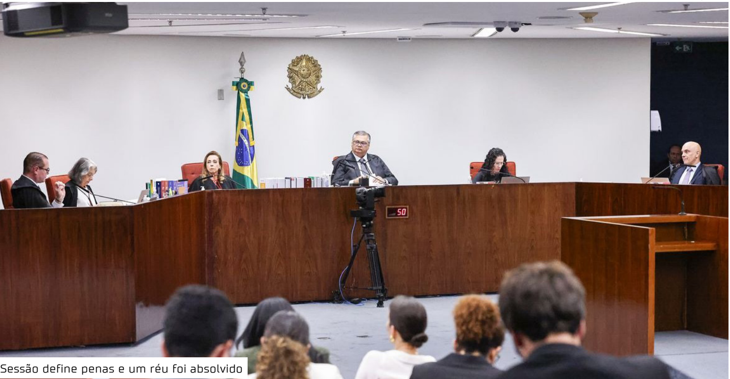
Sessão define penas e um réu foi absolvido

De acordo com mensagens apreendidas no celular de Mauro Cid, delator e ex-ajudante de ordens de Bolsonaro, Câmara informou a Cid que