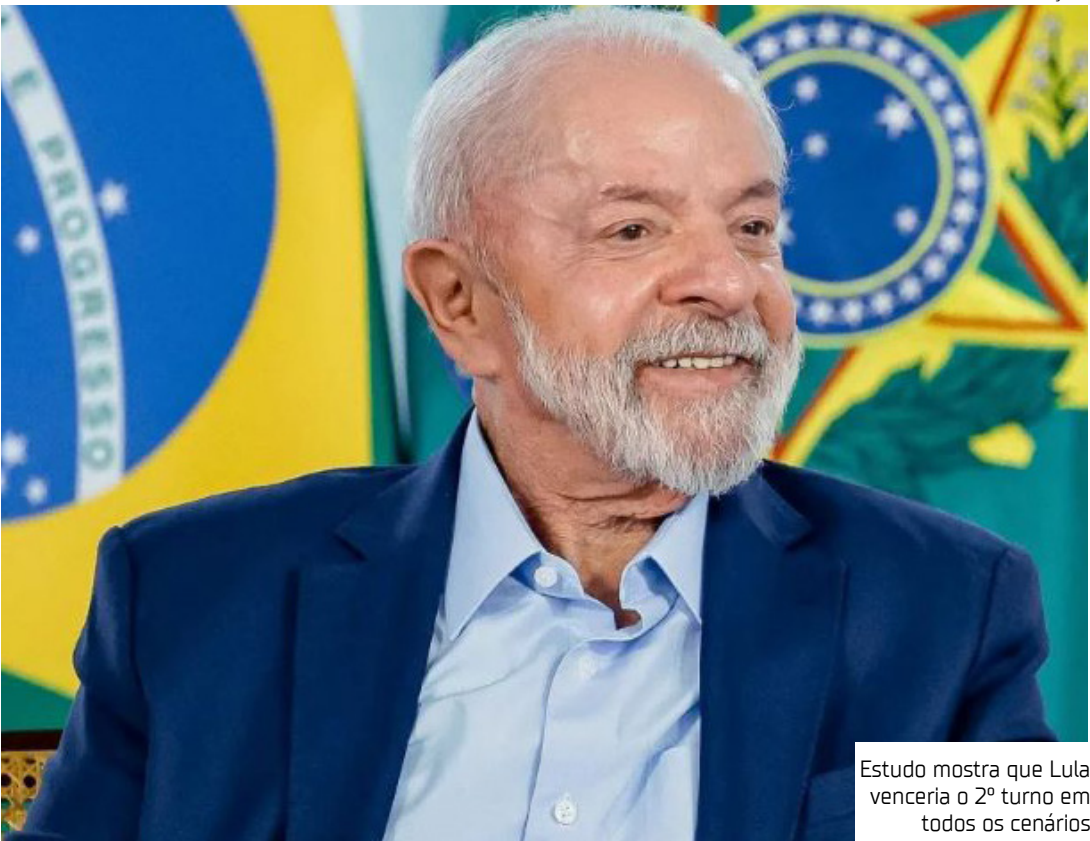
Estudo mostra que Lula venceria o 2º turno em todos os cenários

anterior, divulgado em novembro. Esta é a primeira pesquisa realizada sem o nome de Jair Bolsonaro desde que o ex-presidente indicou o filho senador como candidato à presidência em 2026. O levantamento foi encomendado pela Genial Investimentos e ouviu 2.004 pessoas com 16 anos ou mais entre os dias 11 e 14 de dezembro. A margem de erro é de dois pontos para mais ou para menos e o nível de confiança é de 95%. Cenários No cenário de 2º turno contra governadores de estado, os números indicam que contra Tarcísio de Freitas (Republicanos), governador de São Paulo, Lula oscilou quatro pontos para cima e chega a 45%, enquanto Tarcísio oscilou um ponto para baixo e está com 35%, ampliando a diferença entre os dois. Contra Ratinho Júnior (PSD), governador do Paraná, Lula também aparece com 45%, ante 35% do adversário. Na disputa com Ronaldo Caiado (União), governador de Goiás, Lula marca 44% contra 33%. Em um confronto com Romeu