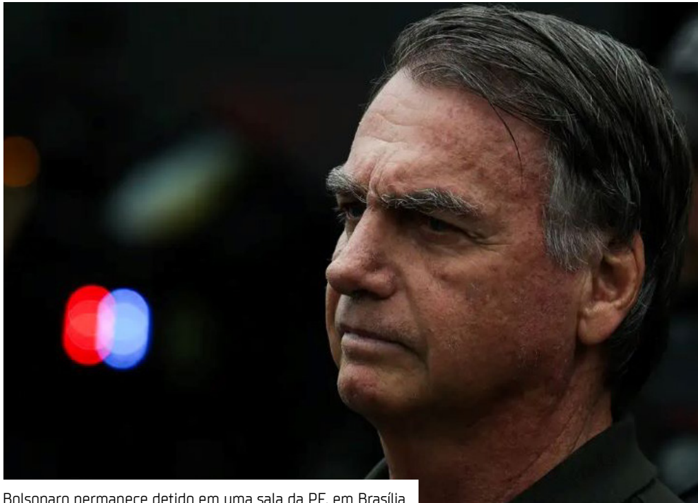
Bolsonaro permanece detido em uma sala da PF, em Brasília

O ex-presidente Jair Bolsonaro passará por uma perícia médica hoje (17), em Brasília, no Distrito Federal. A avaliação foi marcada pela Polícia Federal (PF) após determinação do ministro Alexandre de Moraes, do Supremo Tribunal Federal (STF), responsável por acompanhar o caso. A perícia será conduzida por profissionais da própria Polícia Federal e ocorrerá nas instalações do Instituto Nacional de Criminalística, órgão técnico da PF localizado na capital federal. O procedimento tem como objetivo avaliar o estado de saúde do ex-presidente e