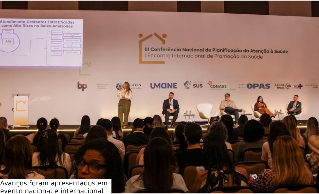
Avanços foram apresentados em evento nacional e internacional

Entre as experiências exitosas desenvolvidas em parceria com os municípios, está a implantação do Ambulatório de Alto Risco, em Parintins, estruturado no modelo de Ponto de Atenção Secundária Ambulatorial (Pasa), que resultou na melhoria do acompanhamento de gestantes e no fortalecimento do cuidado integral à saúde da mulher. Também foram apresenta-