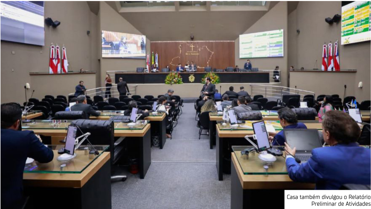
Casa também divulgou o Relatório Preliminar de Atividades

A Lei nº 7.957/2025, originada do Projeto de Lei (PL) nº 789/2024, de autoria do deputado Rozenha (Democrata), estabelece diretrizes para a Política de Inserção e Promoção de Mulheres no Setor Cultural. O objetivo é garantir