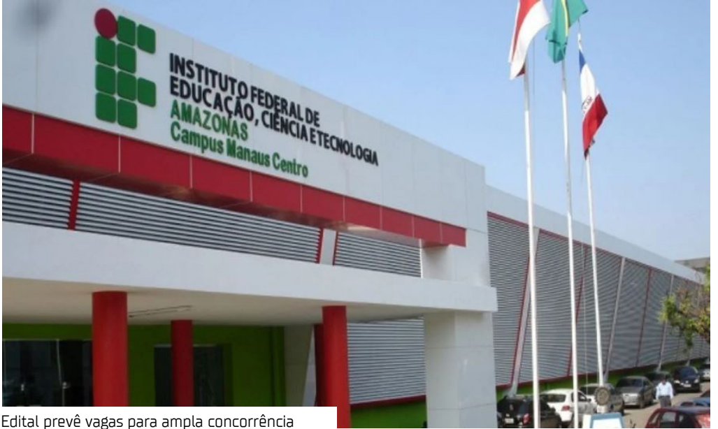
Edital prevê vagas para ampla concorrência