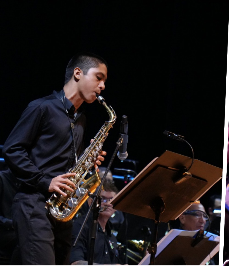
Concerto acontece sempre às 19h, com duração aproximada de 1 hora