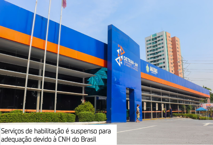
Serviços de habilitação é suspenso para adequação devido à CNH do Brasil

“O Detran Amazonas, nesta terça-feira (16/12), suspendeu os serviços de CNH para implementar a nova resolução do Governo Federal que muda algumas tratativas da Carteira Nacional de Habilitação (CNH). Lembrando que quem fez o pagamento da taxa de renovação, segunda via e outros serviços de habilitação, vão conseguir finalizar. Apenas processos novos estão suspensos no momento. Essa melhoria é para a população,