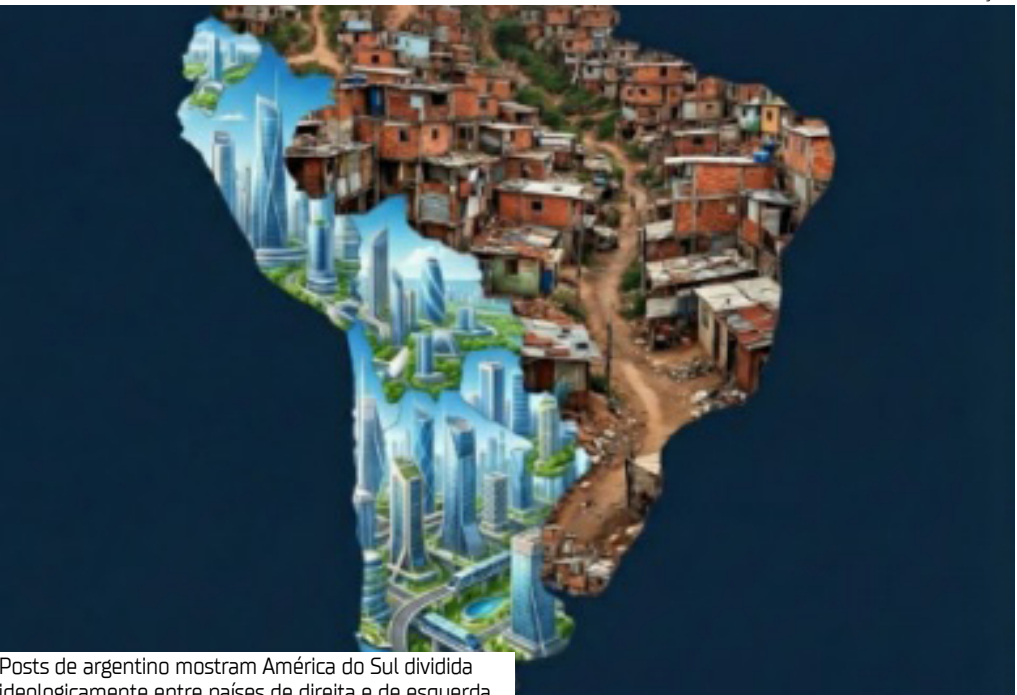
Posts de argentino mostram América do Sul dividida ideologicamente entre países de direita e de esquerda

O presidente da Argentina, Javier Milei, compartilhou ontem (15) uma imagem que representa a América do Sul de forma contrastante, associando países como o Brasil a favelas e outros como cidades futuristas e desenvolvidas.