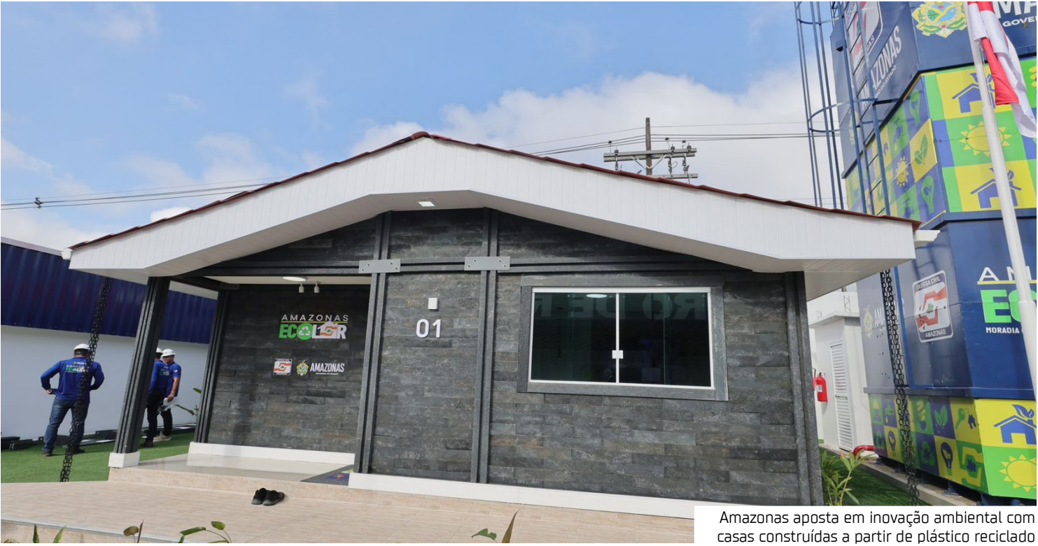
Amazonas aposta em inovação ambiental com casas construídas a partir de plástico reciclado

O Centro de Reciclagem da Defesa Civil do Amazonas terá capacidade inicial para processar mais de 80 toneladas de plástico por mês, volume suficiente para a produção de até dez casas mensais. Todo o material reciclável será adquirido de cooperativas e associações de catadores, fortalecendo a