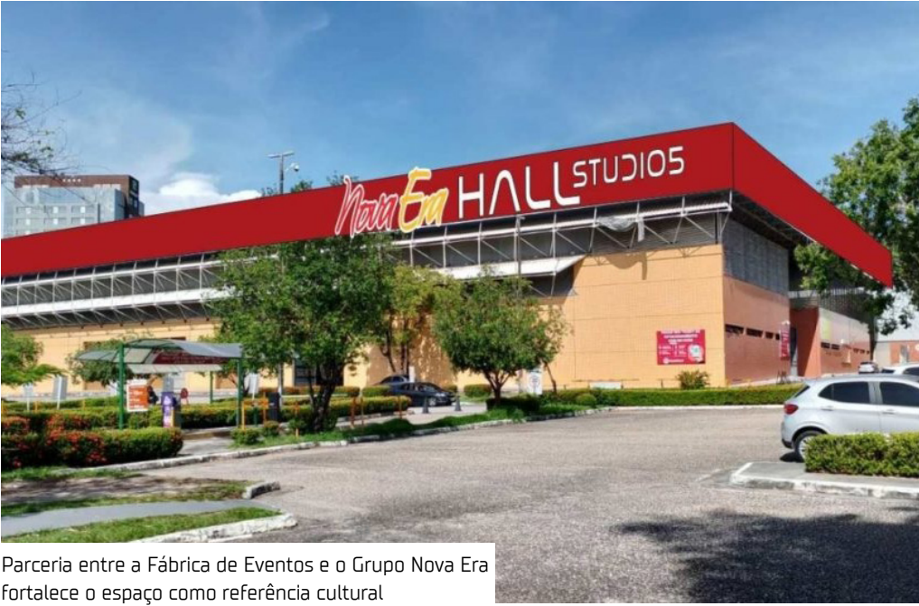
Parceria entre a Fábrica de Eventos e o Grupo Nova Era fortalece o espaço como referência cultural

Um dos espaços mais tradicionais de eventos de Manaus entra oficialmente em uma nova fase. O Centro de Convenções Studio 5 passa a se chamar Nova Era Hall, marcando um reposicionamento do local reforçando o investimento privado na cultura e no entretenimento da capital amazonense. O anúncio foi feito no fim de semana, durante a primeira edição do Festival Nova Era de Música, que reuniu atrações nacionais e regionais e levou milhares de pessoas ao espaço em uma grande celebração da cultura brasileira e nortista. A mudança ocorre após a assinatura de um acordo de naming rights entre a