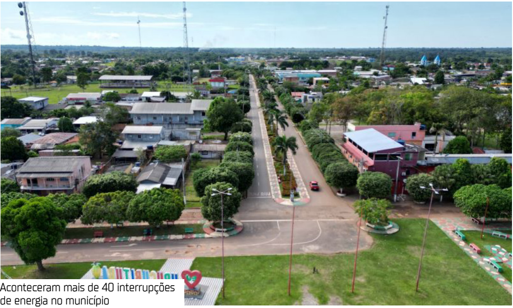
Aconteceram mais de 40 interrupções de energia no município

inerente ao risco da atividade desempenhada pela concessionária. O entendimento, inclusive, já havia sido confirmado em sentença de mérito e mantido pelo Tribunal de Justiça do Amazonas (TJAM). Com base nisso, a Justiça determinou a intimação da Amazonas Energia para que, no prazo de 15 dias, realize o depósito judicial do valor de R$ 4.100.000, correspondente às 41 interrupções apontadas pelo MPAM, ou apresente impugnação específica, contestando o número de ocorrências e detalhando eventuais causas que justifiquem as falhas no serviço. Em caso de descumprimento, foi autorizado o sequestro de valores via Sistema de Busca de Ativos do Poder Judiciário (Sisbajud).