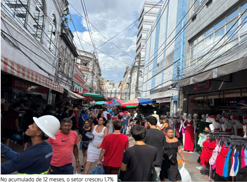
No acumulado de 12 meses, o setor cresceu 1,7%