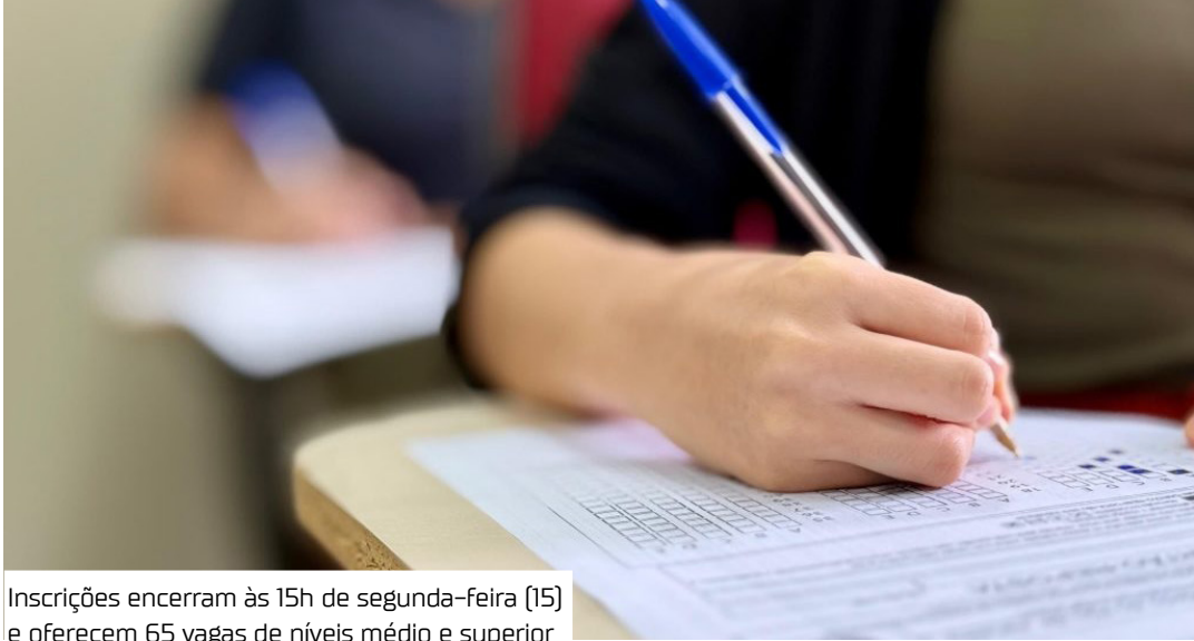
Inscrições encerram às 15h de segunda-feira (15) e oferecem 65 vagas de níveis médio e superior

Pela primeira vez a prefeitura realiza concurso público para cargos na CGM,