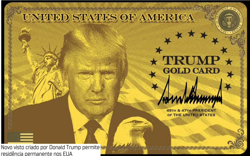
Novo visto criado por Donald Trump permite residência permanente nos EUA

Enquanto o EB-5 busca desenvolver a economia por meio da criação de empresas e empregos, o “Gold Card” funciona como uma arrecadação direta para o governo, sem exigência de contrapartida econômica ou social. Outras modalidades propostas Além do “Gold Card” de US$ 1 milhão, o governo apresentou outras modalidades com valores e benefícios diferentes. O “Corporate Card”, de US$ 2 milhões, é voltado a empresas que desejam garantir a permanência de funcionários estrangeiros, especialmente profissionais altamente qualificados do setor de tecnologia.