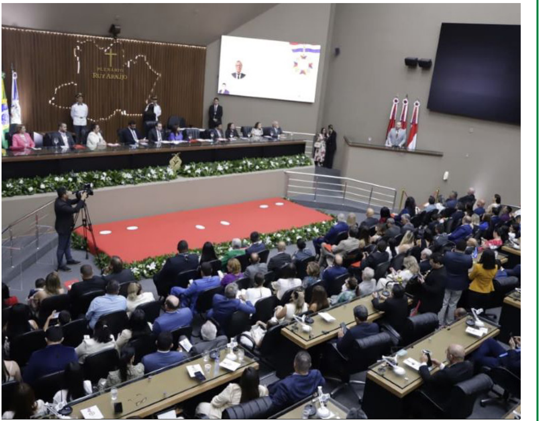
Durante Sessão Ordinária, deputados apresentaram balanço das ações realizadas ao longo deste ano

“Mais uma vez reafirmo meu compromisso com o Amazonas, meu compromisso com os municípios, mas principalmente meu compromisso com as comunidades rurais, com o povo ribeirinho”, disse o deputado.