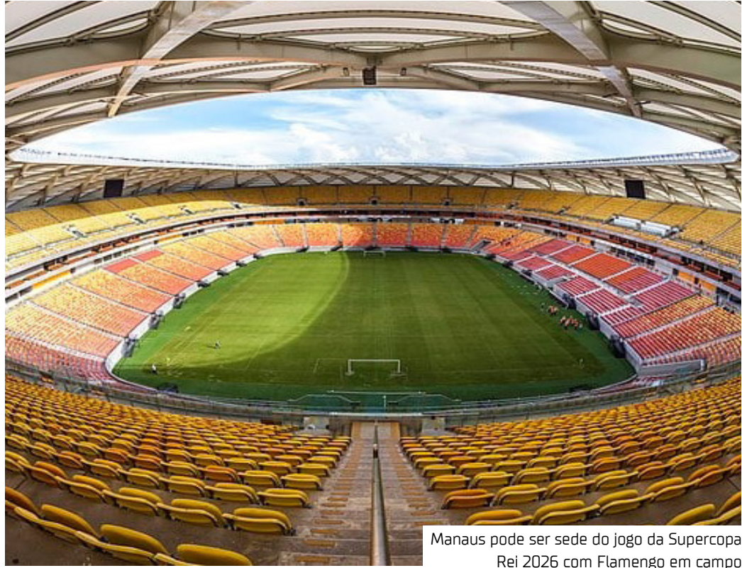
Manaus pode ser sede do jogo da Supercopa Rei 2026 com Flamengo em campo