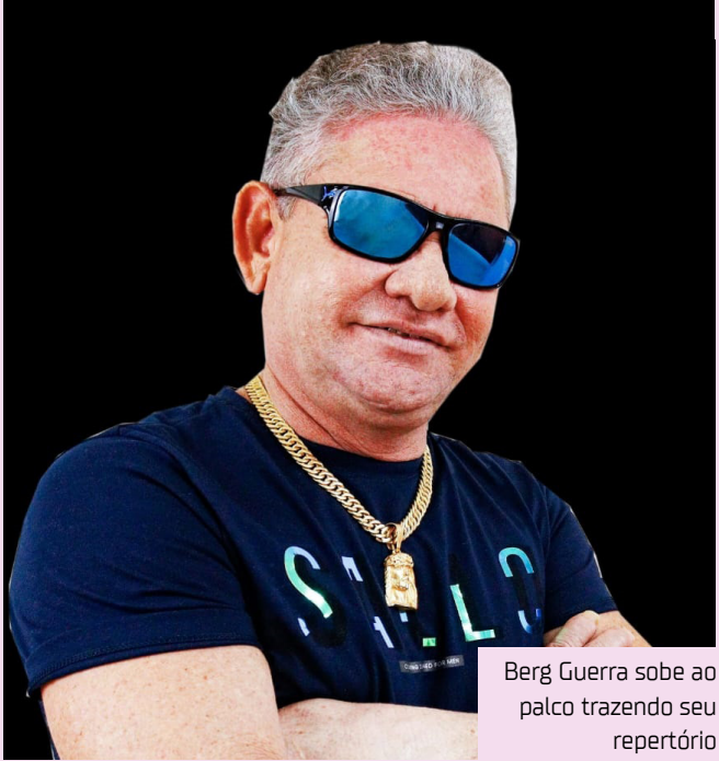
Berg Guerra sobe ao palco trazendo seu repertório

tora”. A artista vai comemorar o aniversário durante o evento, mas garante que o presente será para os fãs, com um show animado e cheio de interação. Encerrando o trio de apresentações, Berg Guerra sobe ao palco trazendo seu repertório já consagrado no arrocha. Entre as músicas esperadas está “Te Quiero”, um dos maiores sucessos da carreira do artista e presença garantida nas playlists dos apaixonados pelo gênero. Ingressos Os ingressos estão à venda no site ingresso.com , com valores de R$ 30 (pista) e R$ 60 (open bar até às 03h). Informações sobre camarotes podem ser solicitadas pelo telefone (92) 99237-8701.