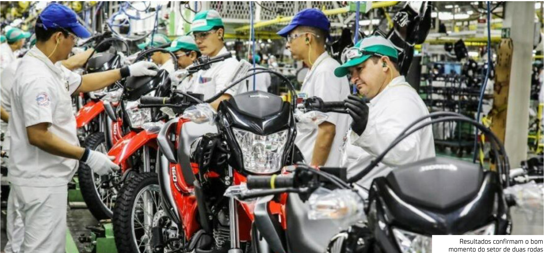
Resultados confirmam o bom momento do setor de duas rodas