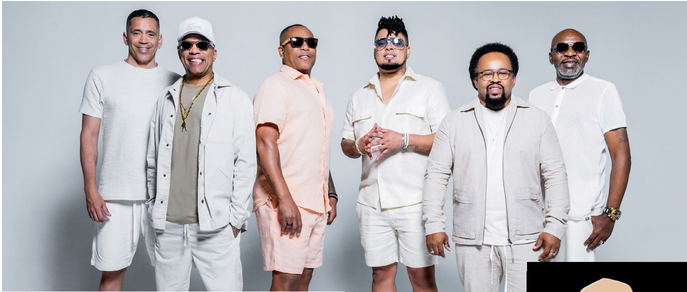
Primeira edição do evento reúne artistas nacionais e amazonenses com experiências culturais nos dias 12 e 13 de dezembro