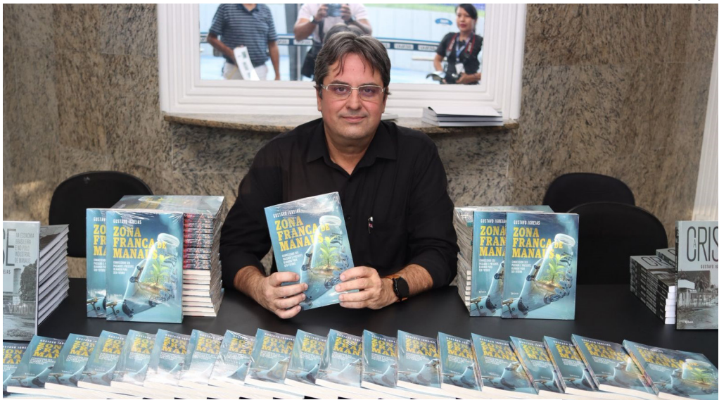
Economista destaca importância histórica e perspectivas da Zona Franca