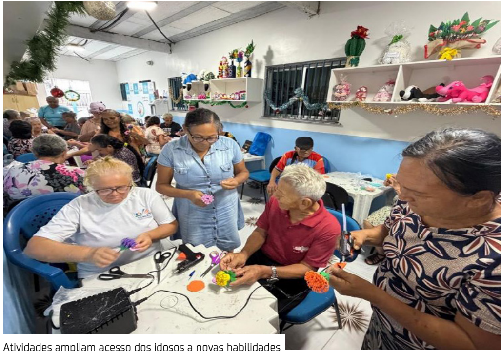
Atividades ampliam acesso dos idosos a novas habilidades

A Prefeitura de Manaus, por meio da Fundação de Apoio ao Idoso Dr. Thomas (FDT), em parceria com o Instituto Cultural de Desporto e Lazer do Estado do Amazonas (Icdlam), promoveu, na quarta-feira, (10), uma oficina gratuita de artesanato voltada ao incentivo do empreendedorismo e da geração de renda entre pessoas idosas do bairro Jorge Teixeira, Zona Leste.