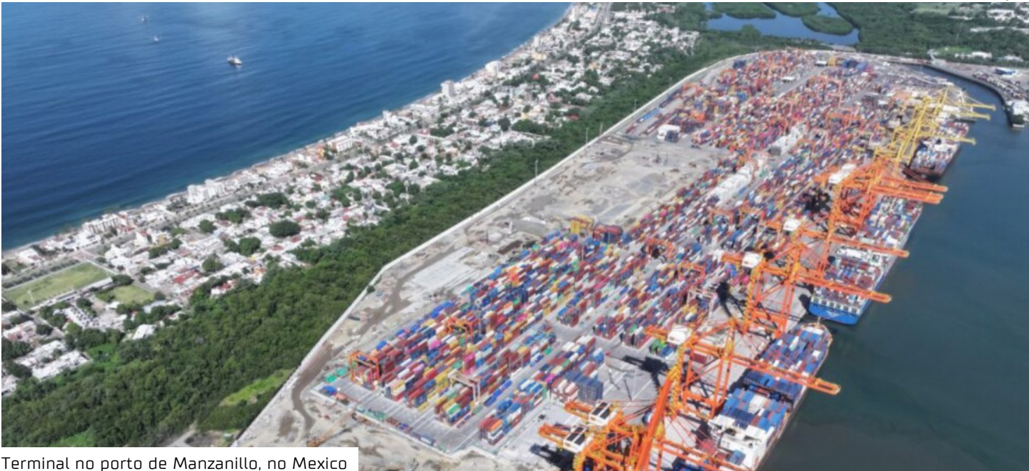
Terminal no porto de Manzanillo, no México

vestuário, siderúrgico, plásticos, eletrodomésticos, móveis e calçados, entre outros — com foco em produtos chineses. Destas, 316 classificações não tinham cobrança de impostos. A proposta inicial previa taxas de até 50%, mas a maioria foi reduzida para cerca de 20% ou 35%. Apenas alguns casos, como o de carros, mantiveram a taxa original de 50%, voltada principalmente ao mercado chinês. Em novembro, veículos chineses representaram 20% das vendas no México, segundo a Associação Mexicana de Distribuidores Automotivos. O México foi o maior comprador global de carros fabricados na China no primeiro semestre deste ano, segundo a consultoria Automobility, de Xangai. Reação chinesa O Ministério do Comércio da China afirmou que a medida traz “prejuízos substanciais” e lamentou a decisão unilateral mexicana. Senadores que se abstiveram da votação argumentaram que o projeto foi elaborado às pressas, sem análise adequada de seu impacto sobre a inflação, e como resposta à pressão do