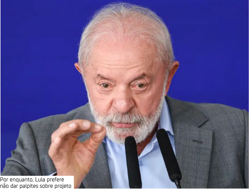
Por enquanto, Lula prefere não dar palpites sobre projeto