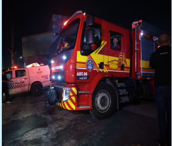
Bombeiros foram acionados para controlar o incêndio