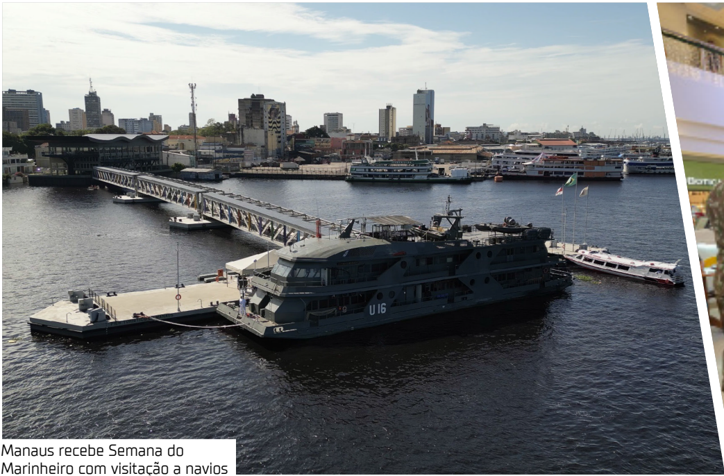
Manaus recebe Semana do Marinheiro com visitação a navios

A Marinha do Brasil, por meio do Comando do 9º Distrito Naval (Com9ºDN), promoverá uma série de atividades em celebração a “Semana do Marinheiro” na cidade de Manaus-AM, entre os dias 12 e 15 de dezembro. Os eventos fazem alusão ao 13 de dezembro, Dia do Marinheiro, data em que é comemorado o nascimento do Patrono da Marinha, Almirante Tamandaré, em todo o País. As atividades terão início hoje (12), no Mirante Lúcia Almeida, onde será realizada uma exposição estática com materiais e equipamentos utilizados pelo Poder Naval na Amazônia Ocidental. Além da exposição, a população poderá conhecer as instalações de um navio da Marinha de forma gratuita no píer turístico.