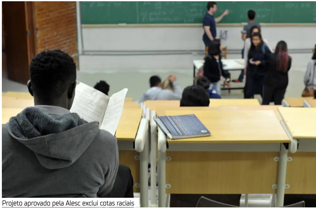
Projeto aprovado pela Alesc exclui cotas raciais