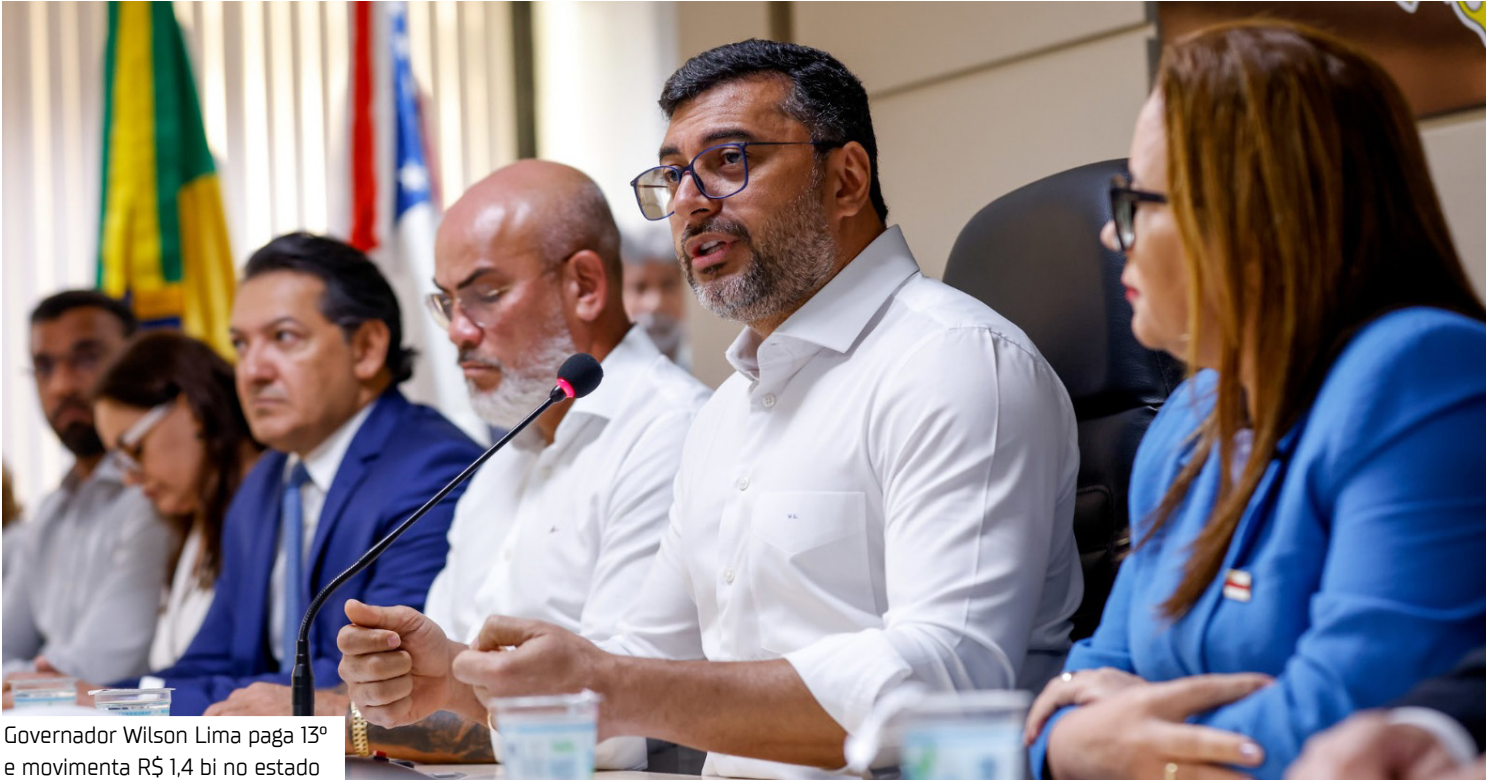
Governador Wilson Lima paga 13º e movimenta R$ 1,4 bi no estado

Paralelamente ao abono Fundeb, também foram anunciadas as progressões horizontais e verticais de novos 23.293 profissionais da rede estadual de ensino, com lançamento em folha já no mês de dezembro, retroativas ao mês de novembro. Em maio, o Governo do Estado já havia concedido o benefício para