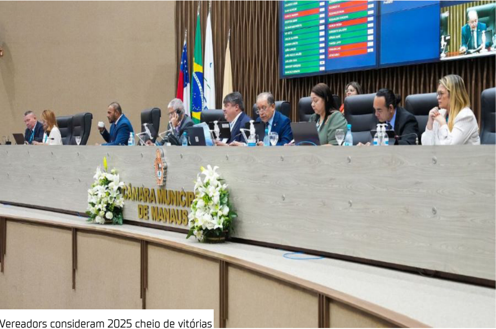
Vereadores consideram 2025 cheio de vitórias