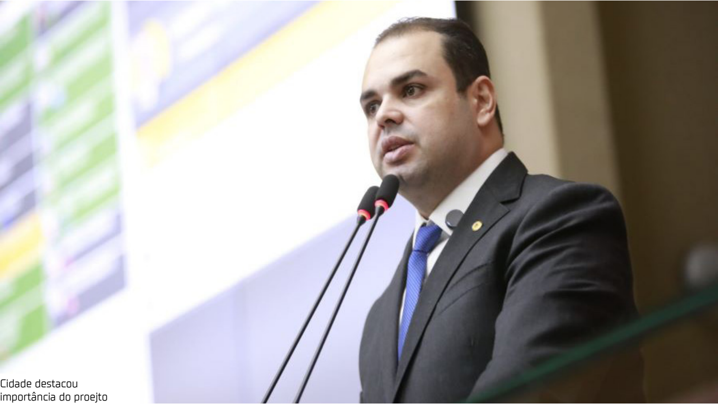
Cidade destacou importância do projeto

Com a aprovação, a saúde do interior passará a receber repasses do Fundo de Fomento ao Turismo, Infraestrutura, Serviço e Interiorização do Desenvolvimento do Estado do Amazonas (FTI) diretamente às áreas de