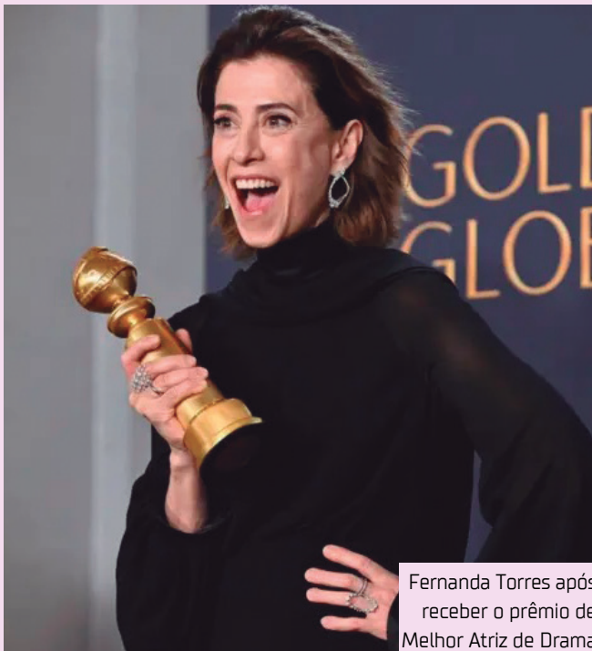
Fernanda Torres após receber o prêmio de Melhor Atriz de Drama