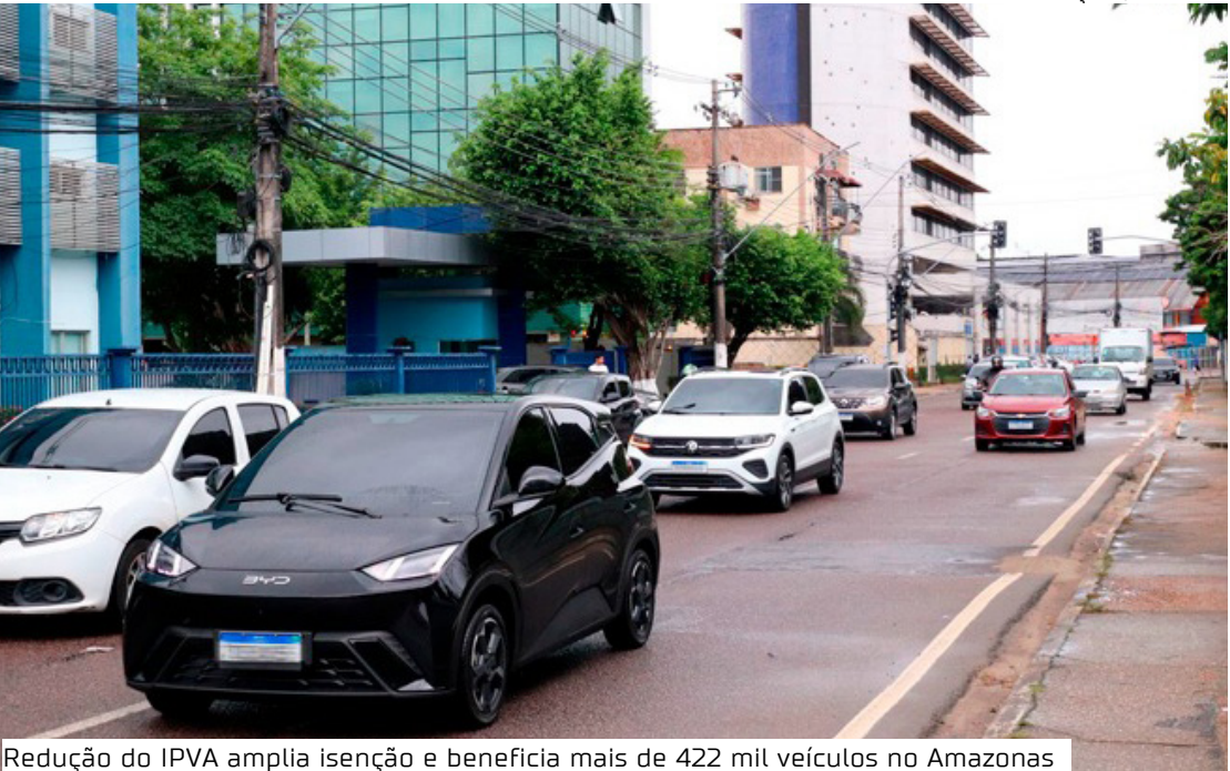
Redução do IPVA amplia isenção e beneficia mais de 422 mil veículos no Amazonas

IPVA mais barato De iniciativa do Governo do Estado, o Projeto de Lei (PL) nº 09/2025 (Lei Complementar nº 280/25) reduziu pela metade o valor das alíquotas de IPVA a partir de 2026, exceto para veículos de locadoras, que já possuíam uma alíquota reduzida de 0,7%. Veículos de até mil cilindradas e veículos elétricos ou híbridos, tiveram alíquota reduzida de 3% para 1,5%. Aqueles com mais de mil cilindradas tiveram redução de 4% para 2%. Já no caso de