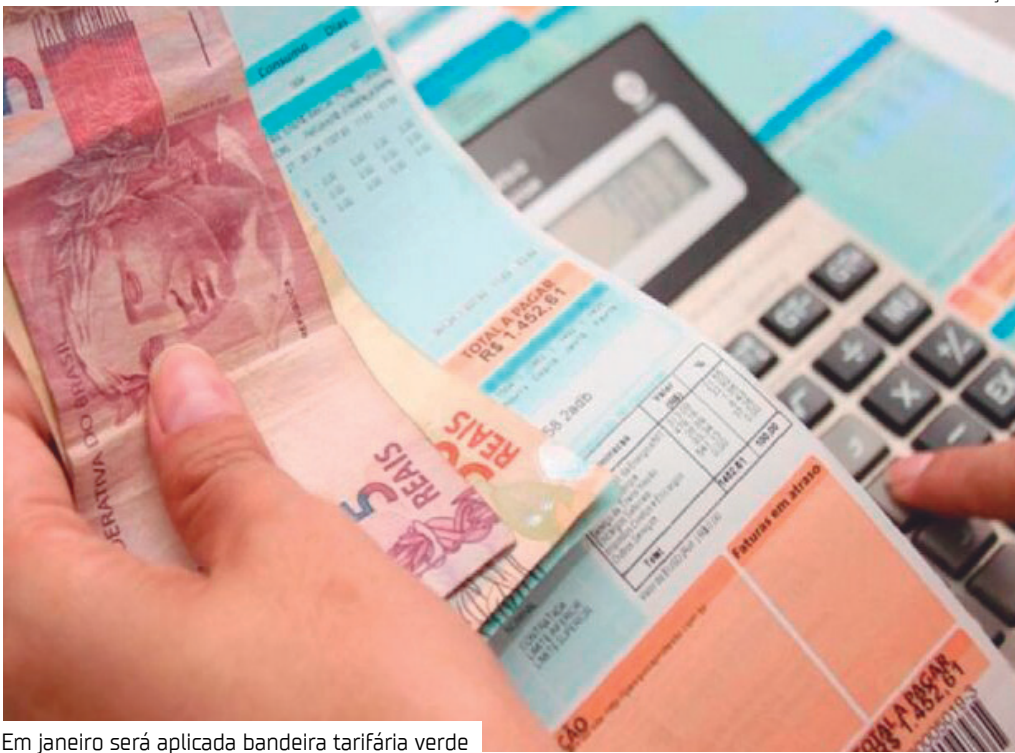
Em janeiro será aplicada bandeira tarifária verde