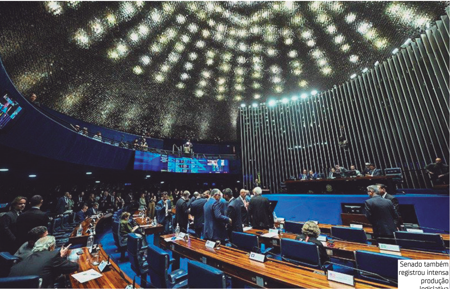
Senado também registrou intensa produção legislativa

Comissões Além das aprovações em Plenário, o Senado também registrou intensa produção legislativa em suas comissões: do total de projetos aprovados pelo Senado neste ano, 403 nem precisaram passar pelo Plenário, pois foram aprovados de forma terminativa nas comissões da Casa. A decisão terminativa em uma comissão dispensa a votação da matéria em Plenário (a não ser que seja apresentado recurso com esse objetivo), permitindo que o projeto siga diretamente para a etapa se-