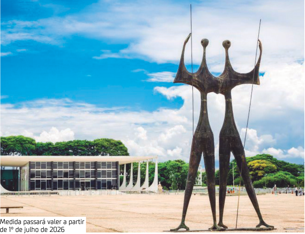
Medida passará valer a partir de 1º de julho de 2026