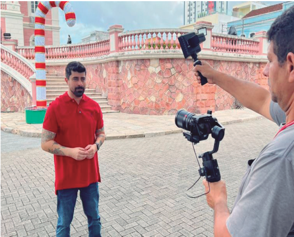
Edição especial do programa Aplausos percorreu alguns dos espaços simbólicos da capital amazonense

O programa tem apresentação de Raonny Oliveira; direção, produção e roteiro de Leandro Leite; imagens de Claudio Andrade; edição e finalização de Mayana Lopes; supervisão geral de Mônica Santaella e apoio de instituições culturais e parceiros locais.