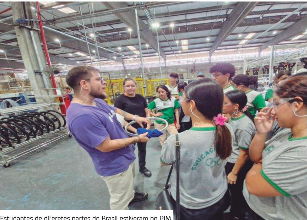
Estudantes de diferentes partes do Brasil estiveram no PIM

Para divulgar o modelo Zona Franca de Manaus e os processos produtivos do Polo Industrial de Manaus, o Programa Zona Franca de Portas Abertas (ZFPA) já atendeu 2.763 pessoas, desde a sua implementação, em 2022. Em 2025, o Programa possibilitou que 1.224 visitantes pudessem conhecer algumas das indústrias, terminais logísticos e institutos de tecnologia instalados no Polo Industrial de Manaus (PIM) e que aderiram ao Programa ZFPA.