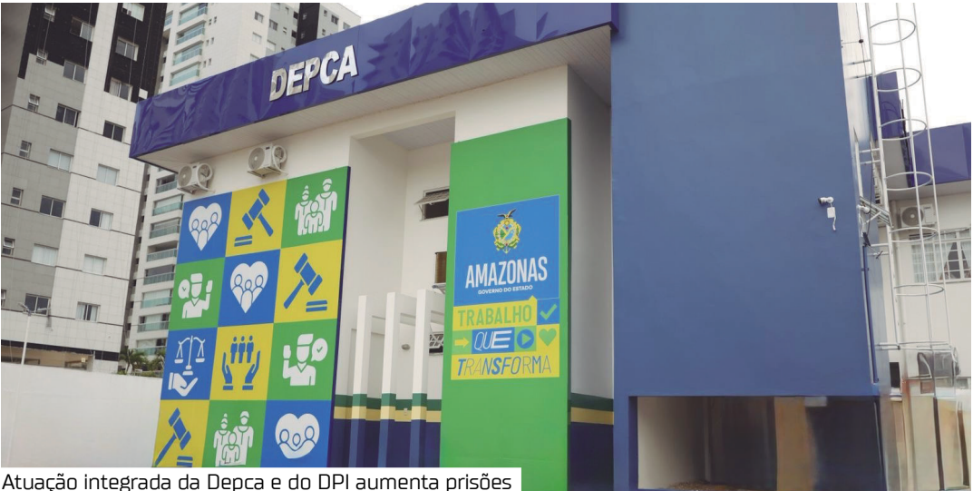
Atuação integrada da Depca e do DPI aumenta prisões

de policial, há também maior encorajamento para que as pessoas levem ao conhecimento das autoridades, por meio de denúncias, os casos de crimes contra vulneráveis.