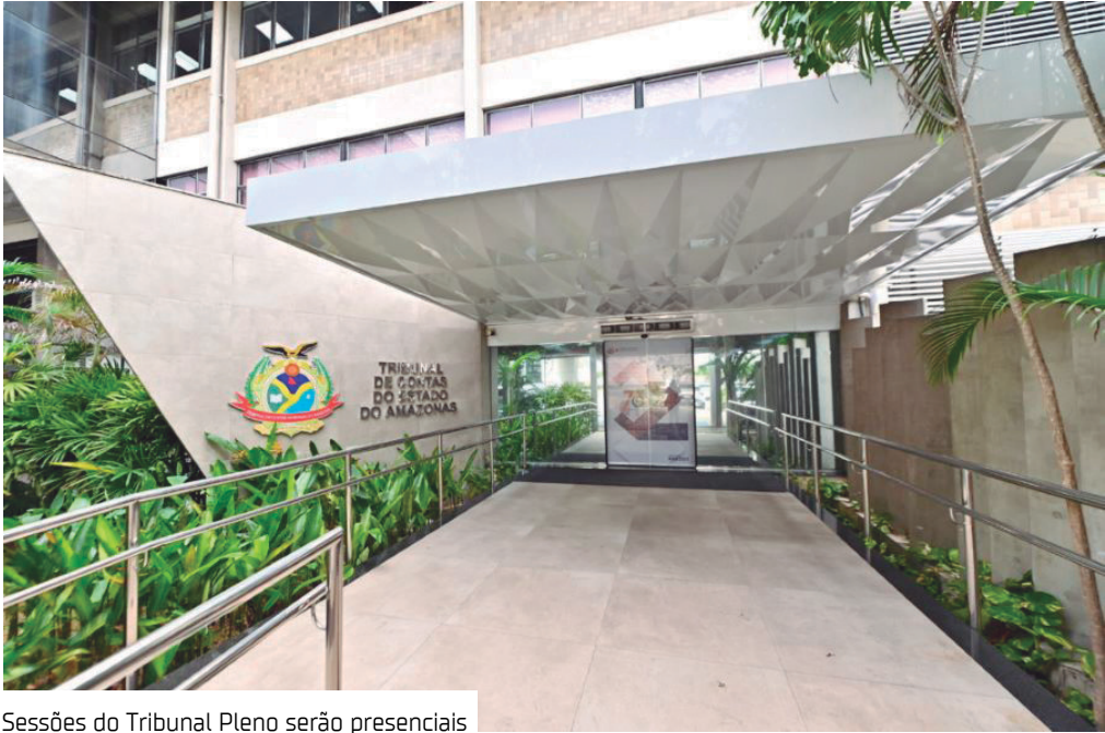
Sessões do Tribunal Pleno serão presenciais

O Tribunal de Contas do Estado do Amazonas (TCE-AM) iniciou o recesso de ano, que segue até o dia 12 de janeiro de 2026, conforme estabelece a Portaria nº 1183/2025, publicada no Diário Oficial Eletrônico. Durante o período, o expediente regular fica suspenso, mas o Tribunal mantém o funcionamento essencial, com setores estratégicos em atividade para assegurar a continuidade dos serviços indispensáveis. Os setores que seguem em funcionamento são Gabinete da Presidência; Secretaria-Geral de Administração (SEGER); Secretaria-Geral de Controle Externo (Secex); Secretaria