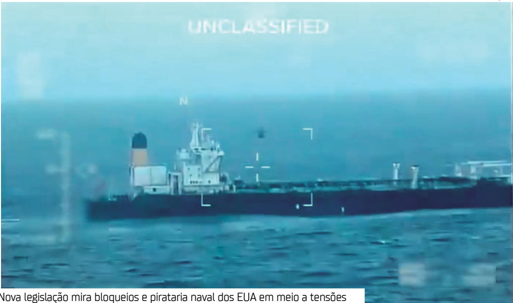
Nova legislação mira bloqueios e pirataria naval dos EUA em meio a tensões

Em meio à escalada das tensões entre os Estados Unidos e a Venezuela, Caracas anunciou uma lei que impõe penas de prisão de 15 a 20 anos para aqueles que apoiarem a “pirataria e o bloqueio” naval dos EUA.