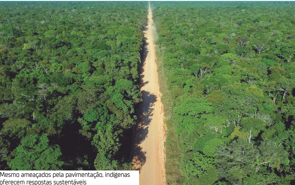
Mesmo ameaçados pela pavimentação, indígenas oferecem respostas sustentáveis