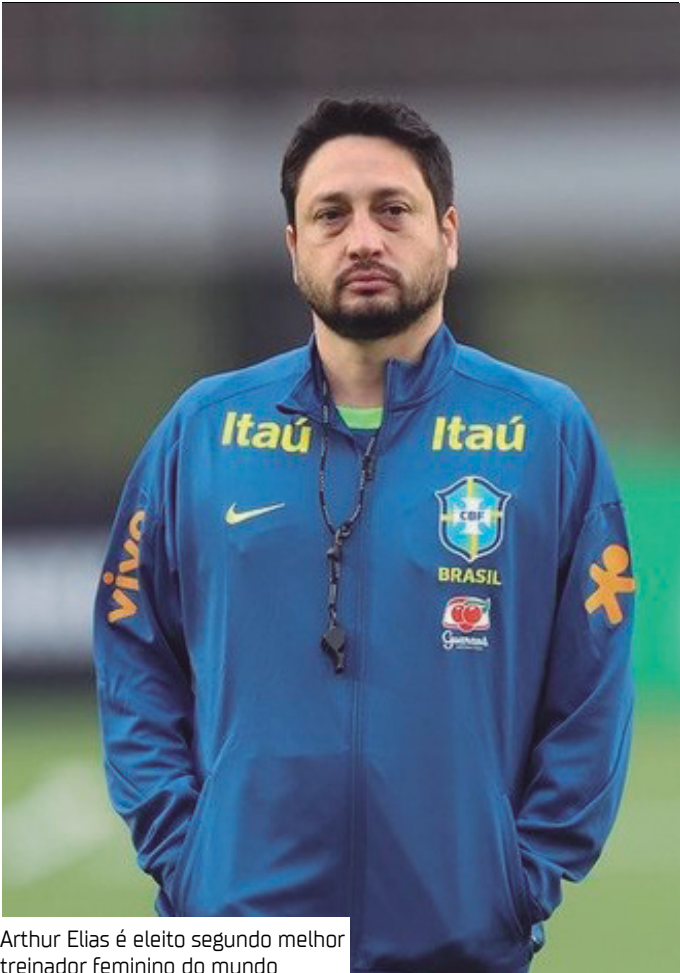
Arthur Elias é eleito segundo melhor treinador feminino do mundo