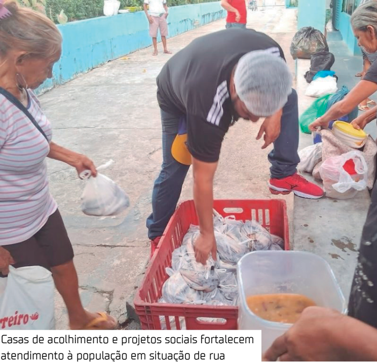
Casas de acolhimento e projetos sociais fortalecem atendimento à população em situação de rua

“Estamos fazendo, além da sopa que é distribuída nas praças, entrega de cestas básicas nas comunidades do Brásileirinho, Cidade das Luzes e Parque