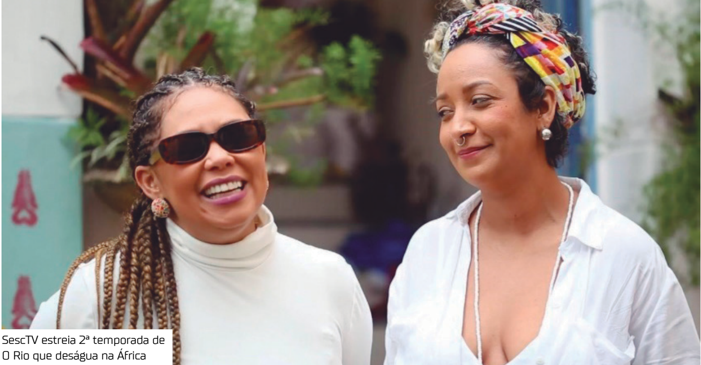
SescTV estreia 2ª temporada de O Rio que deságua na África

Dirigida por Vanessa de A. Souza, a série documental O Rio que deságua na África apresenta novos episódios que aprofundam as conexões entre a capital fluminense e as matrizes africanas que estruturam sua história, cultura e modos de vida. Exibida aos sábados, às 20h30, pelo SescTV, a produção convida o público a percorrer territórios marcados pela presença negra, reunindo memória, arte, religiosidade, música e práticas comunitárias que afirmam identidades e resistem ao tempo.