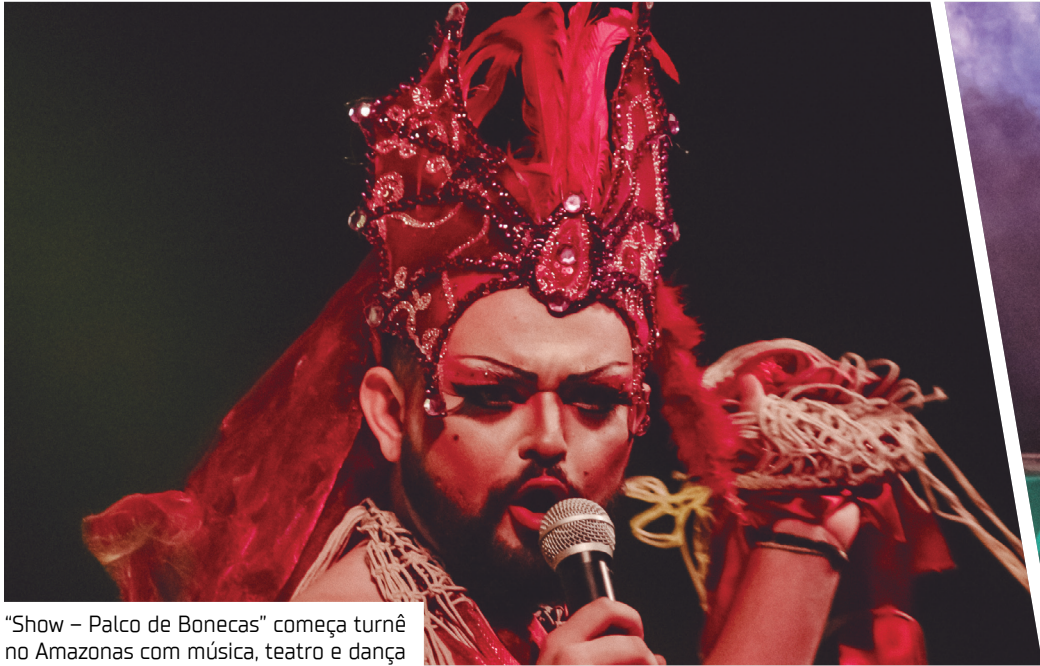
“Show – Palco de Bonecas” começa turnê no Amazonas com música, teatro e dança

Os próximos municípios a receberem a atração serão Presidente Figueiredo, Manacapuru, Iranduba e Codajás. Não há, ainda,