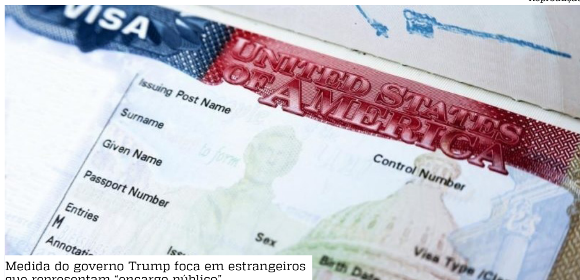
Medida do governo Trump foca em estrangeiros que representam “encargo público”

A nova diretriz pode ampliar os critérios de exclusão para além de questões financeiras. O memorando indica que Washington estuda barrar pessoas mais velhas ou