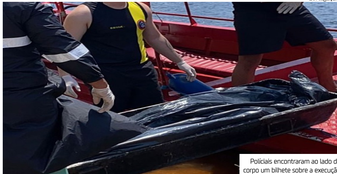
Políciais encontraram ao lado do corpo um bilhete sobre a execução

No local, os criminosos deixaram um bilhete com uma mensagem atribuída à própria vítima. No