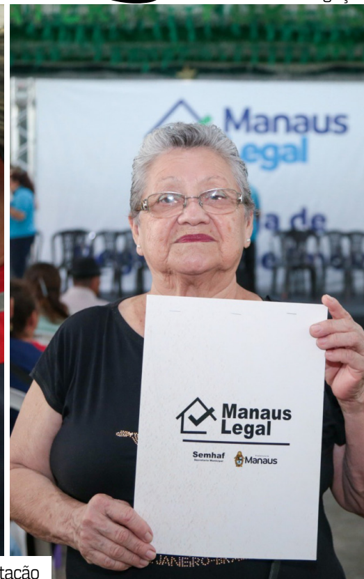
Entrega dos títulos garante segurança jurídica para gerações que viveram sem a documentação

tros definitivos encerra um passivo histórico que atravessou gerações e garante segurança jurídica para famílias que viveram por décadas sem a documentação formal de seus imóveis.