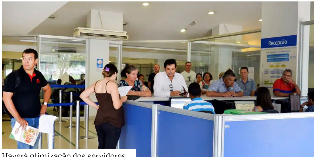
Haverá otimização dos servidores

O Programa de Gerenciamento de Benefícios (PGB) do Instituto Nacional do Seguro Social (INSS) passou por mudanças, com o objetivo de reduzir o tempo de tramitação de processos.