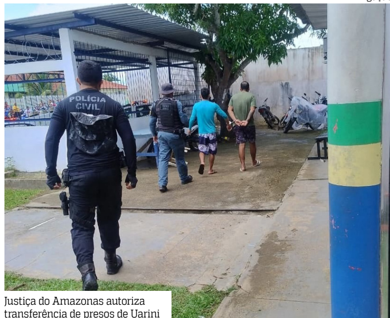
Justiça do Amazonas autoriza transferência de presos de Uarini

A Justiça do Amazonas autorizou a transferência de 11 presos que estavam na carceragem da Delegacia de Uarini (a 595 quilômetros de Manaus) para uma unidade prisional de outro município.