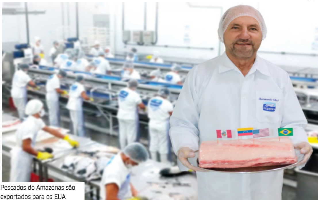
Pescados do Amazonas são exportados para os EUA

A exportação do tambaqui é reflexo da atuação da Concessionária dos Aeroportos da Amazônia que, desde 2022, vem implementando um plano de investimentos robusto, reforçando a infraestrutura e