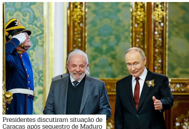
Presidentes discutiram situação de Caracas após sequestro de Maduro

A nota da presidência da Rússia conclui afirmando que também foram discutidas “em detalhes questões relativas ao desenvolvimento da cooperação bilateral em diversas áreas” no contexto das negociações para próxima reunião da Comissão de Alto Nível Rússia-Brasil, que deve ocorrer em fevereiro deste ano.