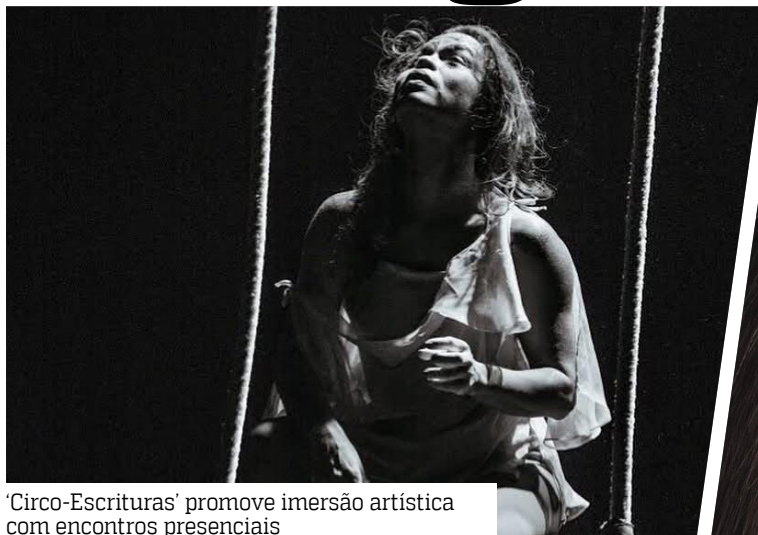
‘Circo-Escrituras’ promove imersão artística com encontros presenciais