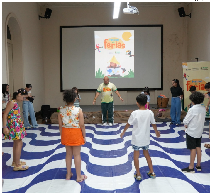
Inscrições abertas no site da Secretaria de Cultura