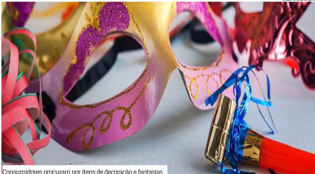
Consumidores procuram por itens de decoração e fantasias

O cenário inclui prateleiras coloridas e vitrines temáticas em diferentes zonas da capital. Lojas de