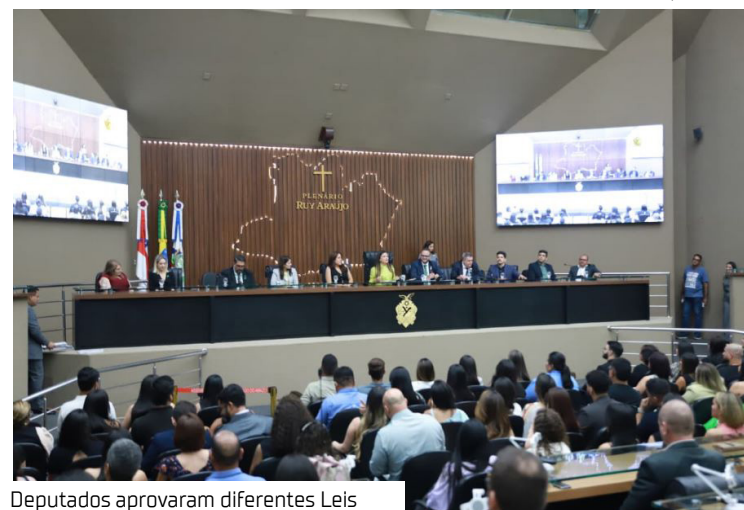
Deputados aprovaram diferentes Leis

A Assembleia Legislativa do Amazonas (Aleam) avançou, em 2025, na consolidação de um arcabouço legal mais rigoroso e eficaz para a proteção dos recursos naturais, ao aprovar iniciativas que ampliam a fiscalização ambiental e coíbem práticas poluentes.