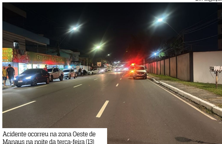
Acidente ocorreu na zona Oeste de Manaus na noite da terça-feira (13)

Um homem com idade estimada entre 55 e 60 anos morreu após ser atropelado por um carro na avenida Ipase, no bairro Compensa, Zona Oeste de Manaus, na noite da terça-feira (13).