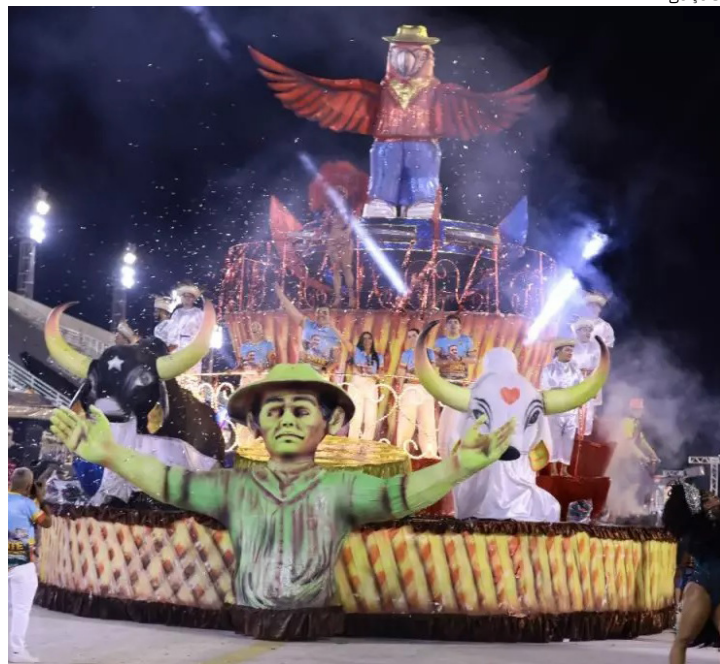
Oito escolas levam enredos regionais, culturais e homenagens