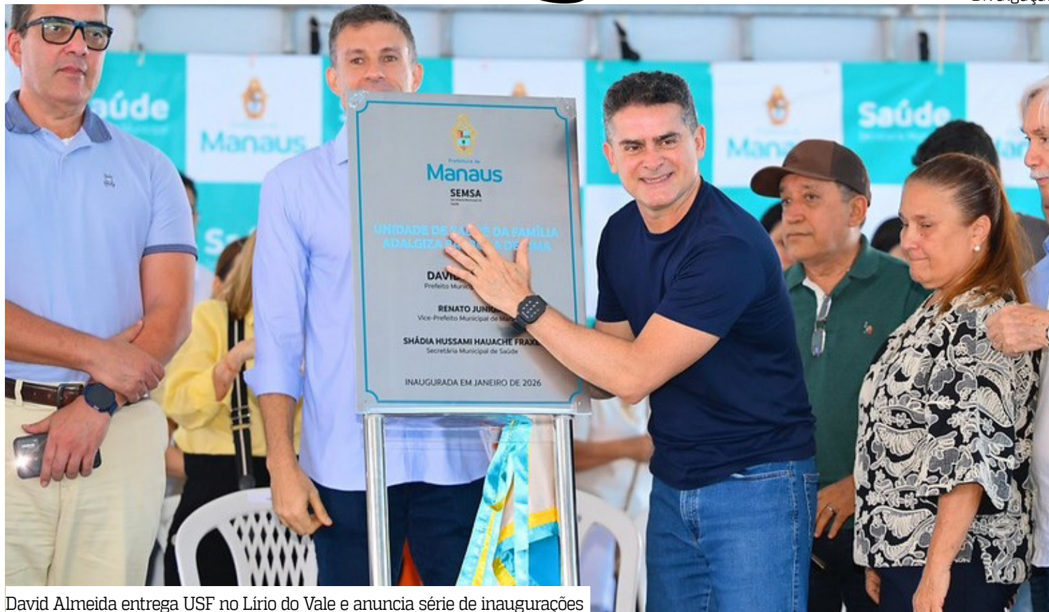
David Almeida entrega USF no Lírio do Vale e anuncia série de inaugurações

“Estamos começando 2026 trabalhando e entregando resultados. Hoje entregamos saúde, amanhã teremos outras inaugurações, como quadra coberta, escolas, títulos