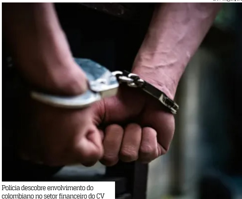
Polícia descobre envolvimento do colombiano no setor financeiro do CV

A Força Integrada de Combate ao Crime Organizado no Amazonas (FICCO/AM) prendeu, no dia 2 de janeiro, um colombiano integrante do núcleo financeiro do Comando Vermelho (CV) que atuava no Amazonas.