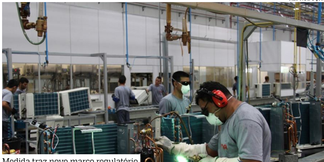
Medida traz novo marco regulatório