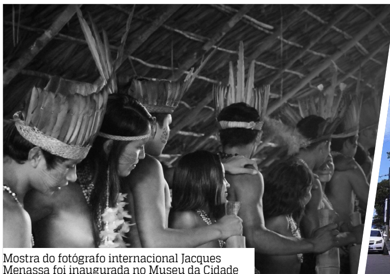
Mostra do fotógrafo internacional Jacques Menassa foi inaugurada no Museu da Cidade

Com domínio refinado da luz e da sombra, Jacques Menassa transforma cenas do cotidiano amazônico em poesia visual. As imagens