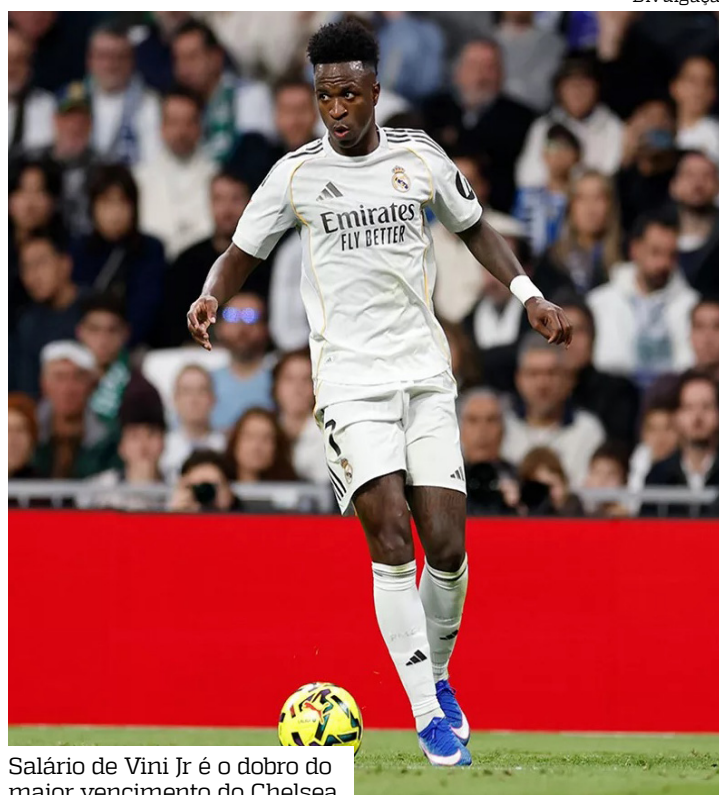
Salário de Vini Jr é o dobro do maior vencimento do Chelsea

Atualmente, o maior salário do clube é de Raheem Sterling, com 325 mil libras semanais,