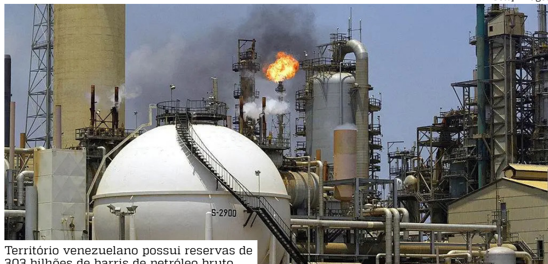
Território venezuelano possui reservas de 303 bilhões de barris de petróleo bruto

“Para o petróleo, isso tem potencial para ser um evento histórico”, disse Phil Flynn, analista sênior de mercado