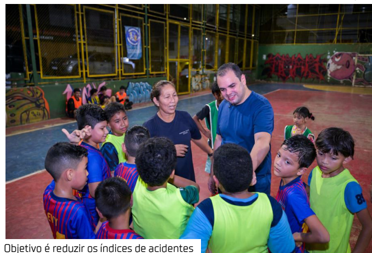
Objetivo é reduzir os índices de acidentes