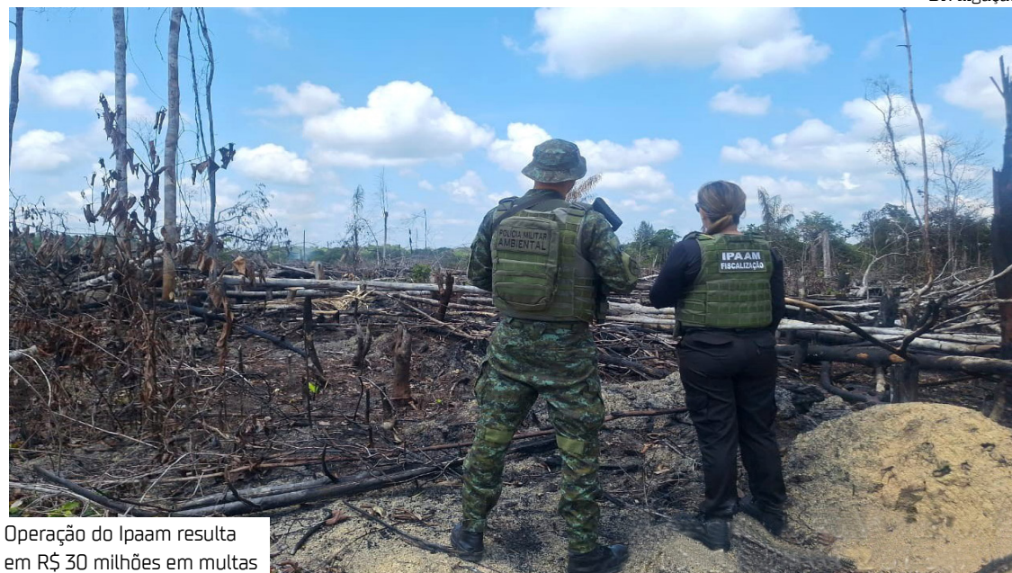
Operação do Ipaam resulta em R$ 30 milhões em multas

Ipaam, os principais crimes constatados foram supressão de vegetação sem licença, uso irregular do fogo, exploração e transporte de madeira sem documentação, abertura de áreas para pastagem e ocupações em áreas protegidas. Em parte das etapas, também foram registrados descumprimentos de embargos