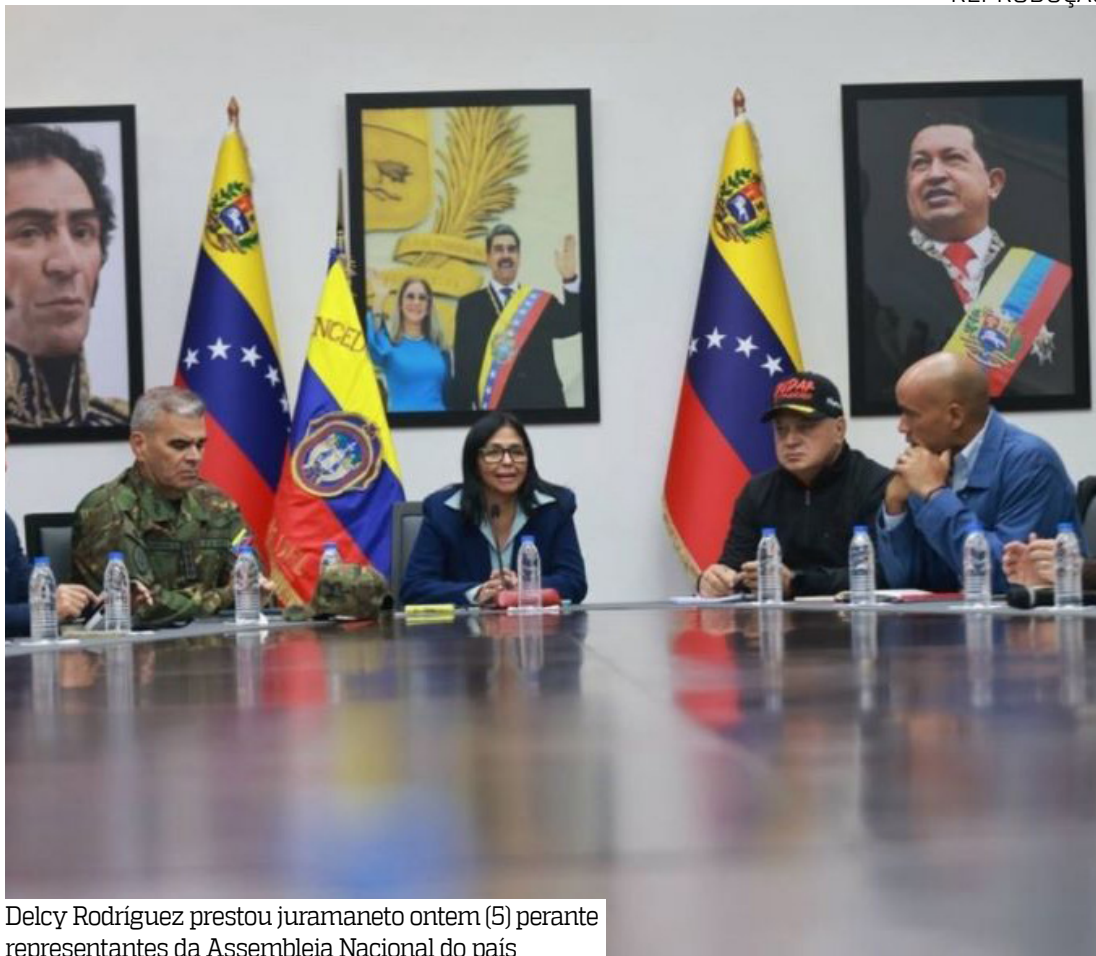
Delcy Rodríguez prestou juramento ontem (5) perante representantes da Assembleia Nacional do país

O presidente Luiz Inácio Lula da Silva falou por telefone, na manhã de sábado (3), com a então vice-presi-