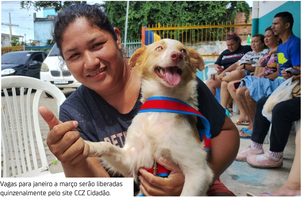
Vagas para janeiro a março serão liberadas quinzenalmente pelo site CCZ Cidadão.