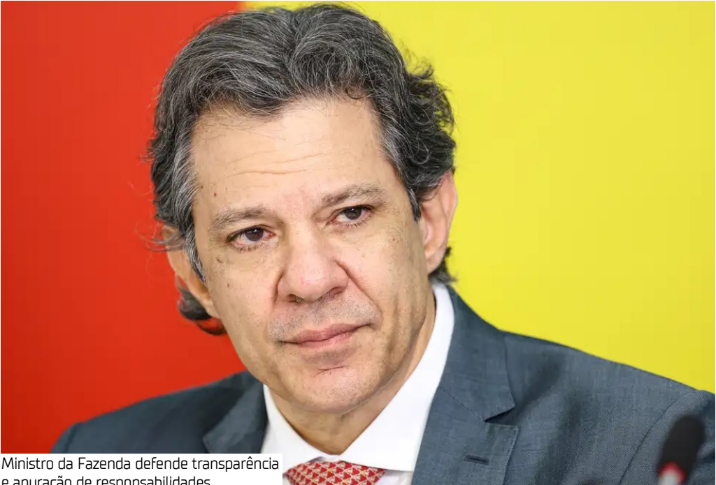
Ministro da Fazenda defende transparência e apuração de responsabilidades

O caso envolvendo o Banco Master pode se configurar como a maior fraude bancária da história do país, disse ontem (13) o ministro da Fazenda, Fernando Haddad. Segundo ele, o governo acompanha de perto a atuação do Banco Central (BC) e mantém diálogo permanente com a autoridade monetária desde a decretação da liquidação da instituição financeira. “O caso [Master] inspira muito cuidado, podemos estar diante da maior fraude bancária da história do país, podemos estar diante disso. Então temos que tomar todas as cautelas devidas, com as formali-