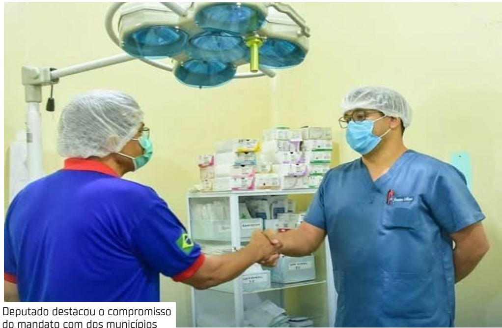
Deputado destacou o compromisso do mandato com dos municípios

Os municípios da região do rio Madeira receberam um reforço financeiro significativo por meio de emendas do deputado estadual João Luiz (Republicanos). Os recursos são destinados ao fortalecimento de serviços essenciais, como saúde, educação, segurança pública, cultura e esporte, beneficiando diversas cidades do interior do Amazonas. O parlamentar destacou o compromisso do mandato com o desenvolvimento dos municípios do interior do estado. “Sabemos da necessidade de cada município e trabalhamos para que todos sejam beneficiados com nossas emendas parlamentares. Essa ajuda é de grande valia, pois permite a oferta de serviços de qualidade à população, que tanto precisa”, afirmou João Luiz. Na área da educação, es-