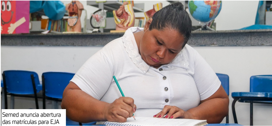
Semed anuncia abertura das matrículas para EJA

A Secretaria Municipal de Educação (Semed), inicia, nesta sexta-feira (16), o período de matrícula para a Educação de Jovens e Adultos (EJA). A modalidade é destinada a pessoas a partir dos 15 anos que não concluíram o ensino fundamental na idade regular e desejam retomar os estudos.