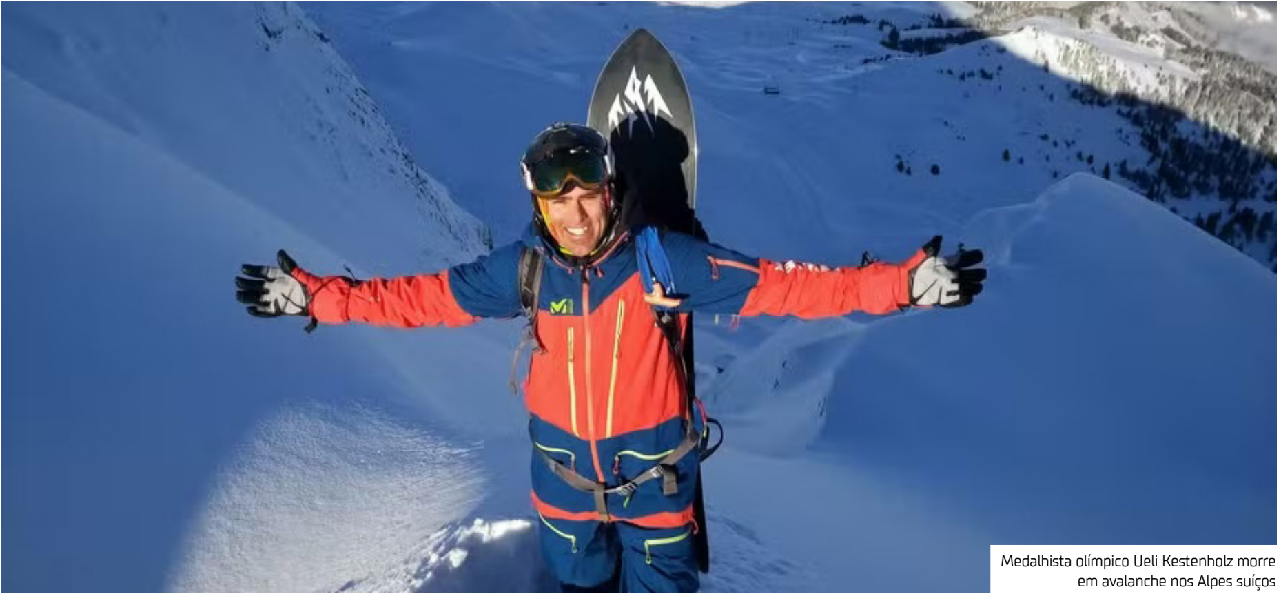
Medalhista olímpico Ueli Kestenholz morre em avalanche nos Alpes suíços

O ex-snowboarder suíço Ueli Kestenholz, medalhista de bronze nos Jogos Olímpicos de Inverno de 1998, morreu após ser atingido por uma avalanche no vale de Lötschental, no sul do país europeu. A informação foi confirmada pela Federação Suíça de Esqui (Swiss-Ski) ontem (13). Ele tinha 50 anos. Segundo a entidade, Kestenholz praticava snowboard com um amigo no último domingo quando foi surpreendido por uma avalanche na encosta leste do vale. “Sua vida foi curta demais”, afirmou a federação em comunicado, acrescentando que a “Swiss-Ski e a comunidade do snowboard estão devastadas”. O presidente da Swiss-Ski, Peter Barandun, disse que a federação “estende nossas mais profundas condolências à família e aos entes queridos de Ueli”, incluindo os dois filhos do atleta. De acordo com a Polícia Cantonal de Valais, o acidente ocorreu pouco depois do meio-dia. O amigo de Kestenholz, que estava esquiando, conseguiu se colocar em segurança. “O esquiador conseguiu se salvar”, informou a polícia em nota. “Quanto ao snowboarder, ele foi soterrado e foi libertado por seu colega e pela Organização de Resgate Cantonal de Valais (OCVS), com o apoio de três helicópteros da Air Zermatt”.