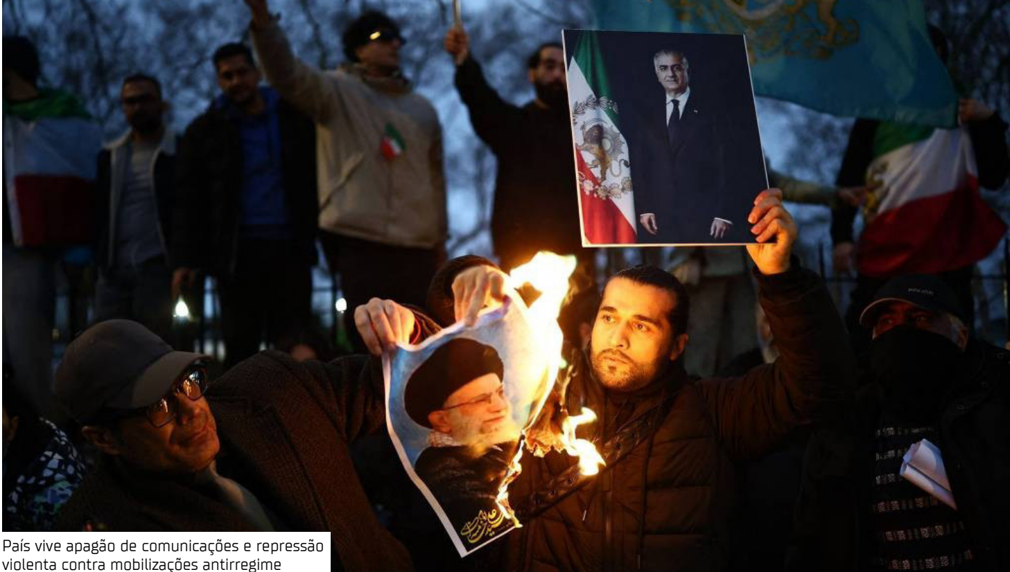
País vive apagão de comunicações e repressão violenta contra mobilizações antirregime

Números de vítimas A ONG Iran Human Rights relatou, na segunda-feira (12), a confirmação de 648 mortes, mas alerta que o número real pode chegar a 6.000 vítimas. De acordo com a organização Netblocks, o bloqueio da internet já superava 108 horas nesta terça-feira (13). Ativistas acusam a República Islâmica