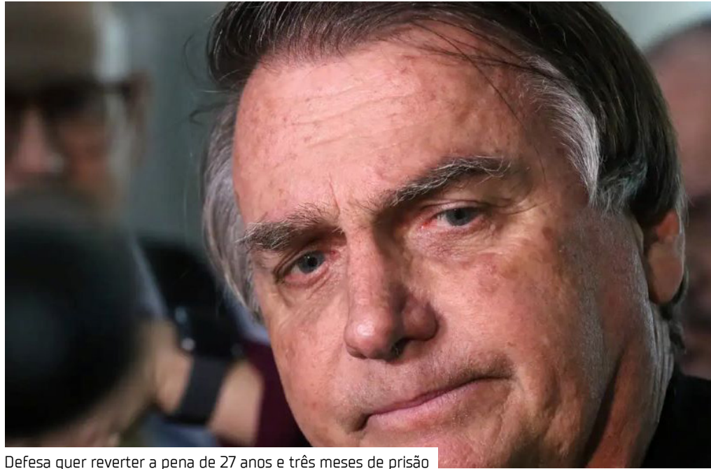
Defesa quer reverter a pena de 27 anos e três meses de prisão

O ministro Alexandre de Moraes, do Supremo Tribunal Federal (STF), negou ontem (13) mais um recurso apresentado pela defesa do ex-presidente Jair Bolsonaro, que buscava novamente reverter a pena de 27 anos e três meses de prisão à qual ele foi condenado por liderar uma tentativa de golpe de Estado. Os advogados protocolaram o novo recurso na segunda (12). No agravo regimental, a defesa pleiteava levar o caso para discussão no plenário do Supremo, alegando que o Regimento Interno do Supremo não prevê quórum mínimo para que o colegiado julgue recursos contra decisões das