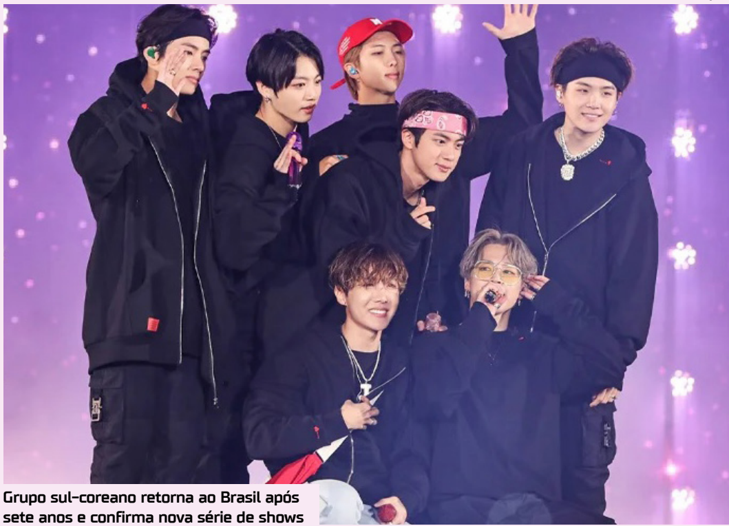
Grupo sul-coreano retorna ao Brasil após sete anos e confirma nova série de shows

mais recente pelo Brasil ocorreu em 2019, quando o grupo se apresentou em dois shows, nos dias 25 e 26 de maio, no Allianz Parque, em São Paulo. Inclusive, essas apresentações foram registradas em DVD.