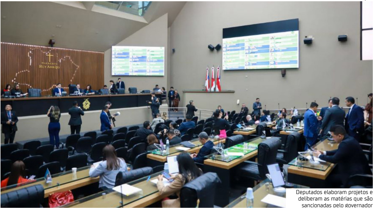
Deputados elaboram projetos e deliberam as matérias que são sancionadas pelo governador

Nos últimos anos, os deputados da Assembleia Legislativa do Estado do Amazonas (Aleam) têm trabalhado em conjunto com o Governo do Estado na defesa dos direitos dos consumidores: os deputados elaboraram projetos de lei e deliberam as matérias que posteriormente são sancionadas pelo governador Wilson Lima. No último ano de 2025 não foi diferente e diversas leis que fortalecem os direitos dos consumidores no Estado foram sancionadas originadas de Projetos de Lei apresentados e aprovados pelos deputados estaduais, refletindo demandas locais por maior proteção, equilíbrio nas relações de consumo e atendimento às necessidades dos cidadãos amazonenses. Exemplo deste compro-