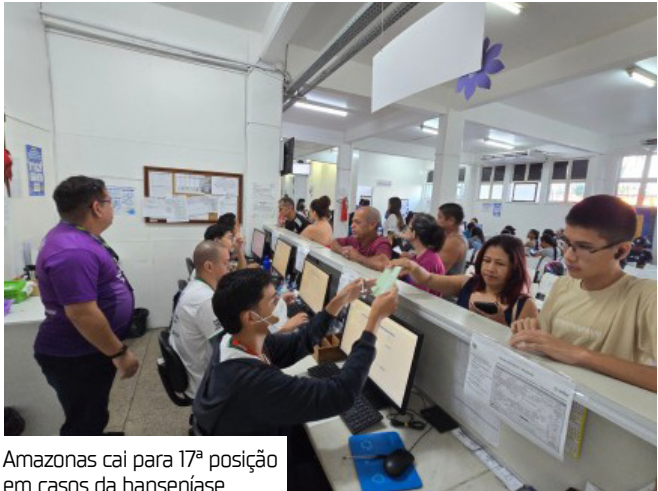
Amazonas cai para 17ª posição em casos da hanseníase

Não serão atendidos casos de outras dermatoses, como o pano branco, coceiras em geral, alergias, entre outras. Pessoas que não apresentarem sinais de hanseníase serão encaminhadas para atendimento na rede básica de saúde.