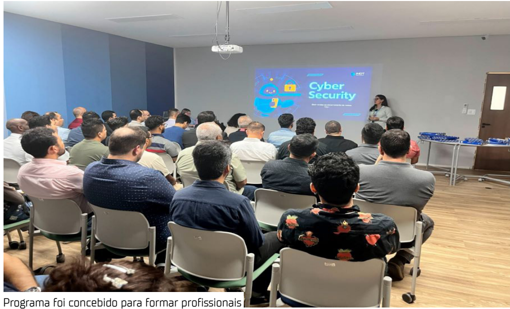
Programa foi concebido para formar profissionais