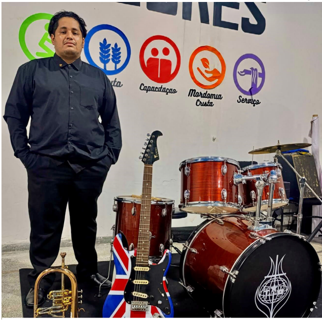
Clube Garagem é um espaço de criação, aprendizado e convivência