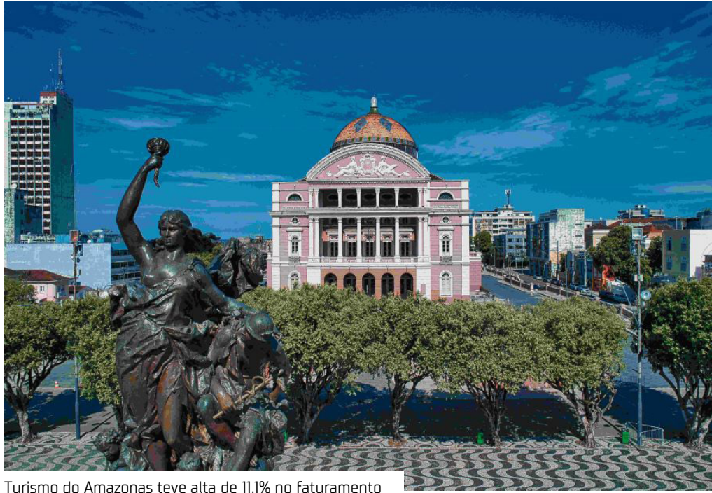
Turismo do Amazonas teve alta de 11,1% no faturamento

O turismo brasileiro faturou R$ 185 bilhões de janeiro a outubro de 2025 e bateu recorde em valores já registrados no setor. No acumulado do ano, os maiores aumentos do faturamento no setor foram registrados no Rio Grande do Sul (13,5%), Amazonas (11,1%) e Bahia (9,6%). Segundo levantamento mais recente da Federação do Comércio, Bens, Serviços e Turismo de São Paulo (FecomercioSP), com base em informações do Instituto Brasileiro de Geogra-