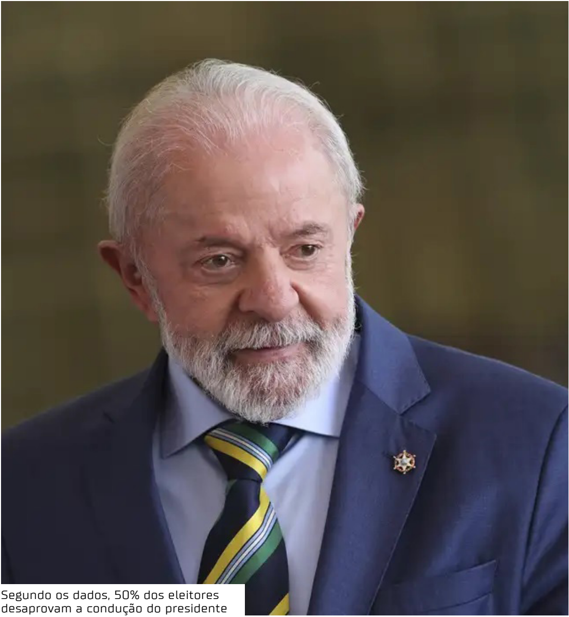
Segundo os dados, 50% dos eleitores desaprovam a condução do presidente

A situação é diferente do início de 2025, quando o governo federal buscava aplacar uma sequência de crises na imagem pública – sendo as principais a divulgação de notícias falsas em torno do Pix. O momento serviu de prato cheio para a oposição, que dominou a narrativa nos temas econômicos.