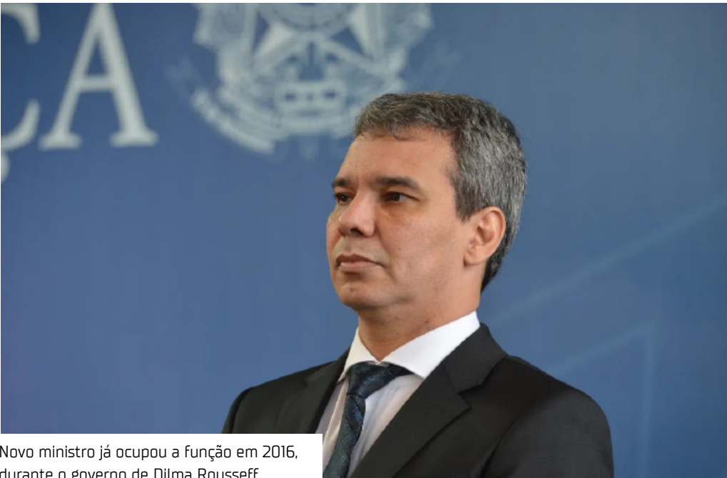
Novo ministro já ocupou a função em 2016, durante o governo de Dilma Rousseff