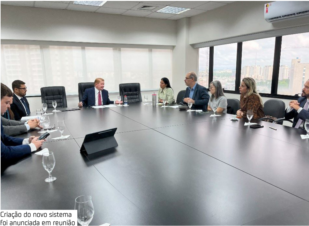
Criação do novo sistema foi anunciada em reunião