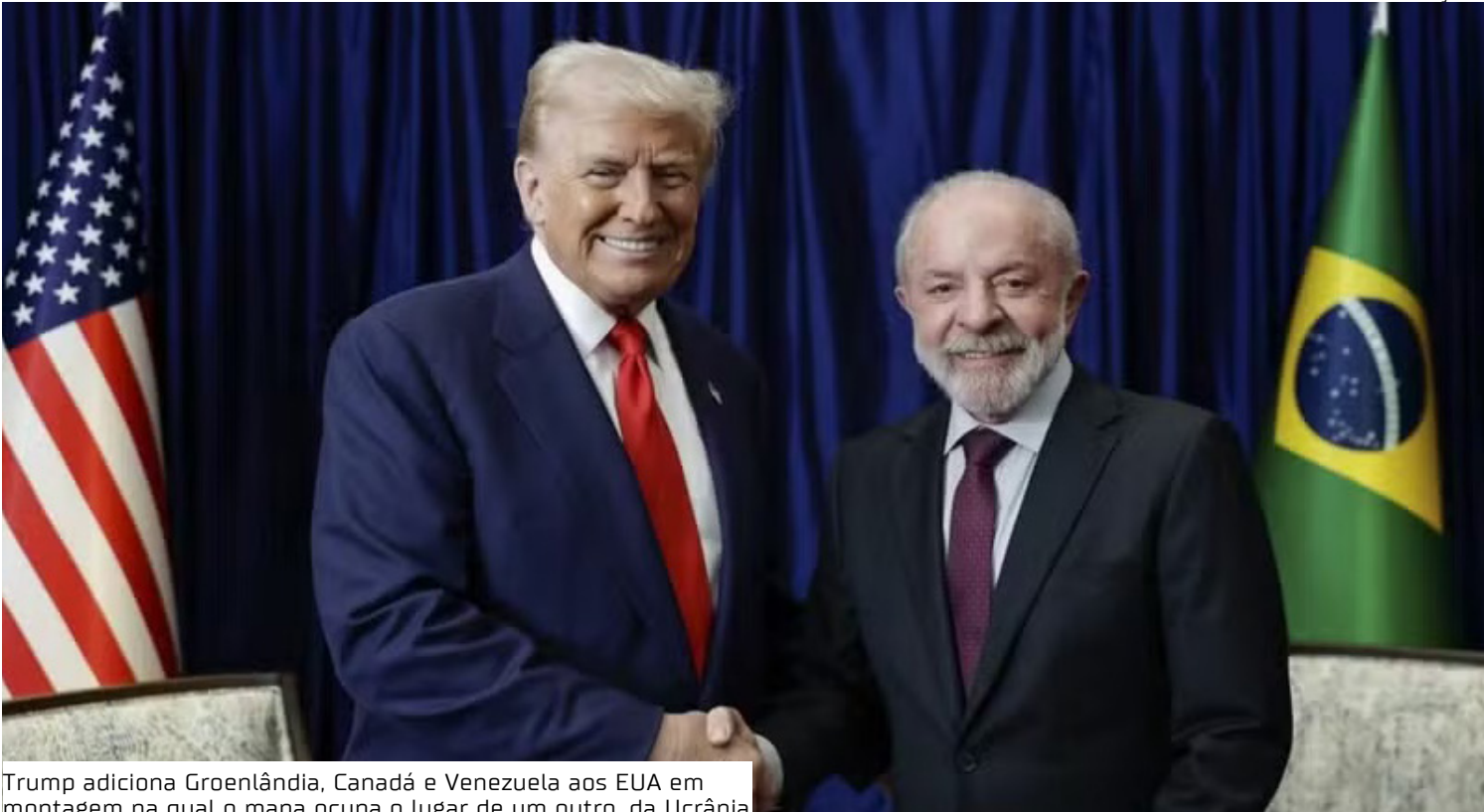
Trump adiciona Groenlândia, Canadá e Venezuela aos EUA em montagem na qual o mapa ocupa o lugar de um outro, da Ucrânia

Além disso, ele ameaçou na noite de segunda (19) o francês com 200% de tarifas de importação sobre o vinho e o champanhe do país europeu caso ele não aceite ingressar no chamado Conselho da Paz para a Faixa de Gaza, iniciativa do americano que visa escanear a ONU na reconstrução do território palestino.