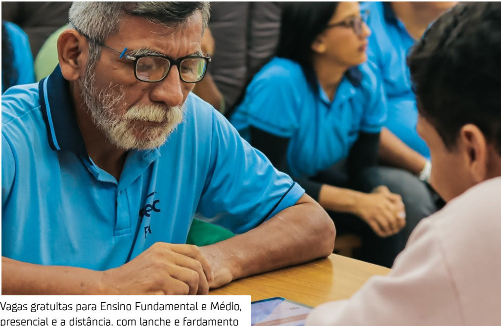
Vagas gratuitas para Ensino Fundamental e Médio, presencial e a distância, com lanche e fardamento

As inscrições para a Educação de Jovens e Adultos (EJA), ofertada pelo Sesc Amazonas, seguem abertas. As vagas são gratuitas e na modalidade presencial (Ensino Fundamental e Médio) e na modalidade a distância (Ensino Médio). Além da gratuidade na matrícula, os estudantes vão receber lanche e fardamento.