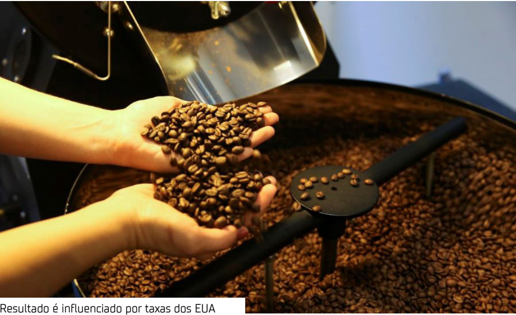
Resultado é influenciado por taxas dos EUA