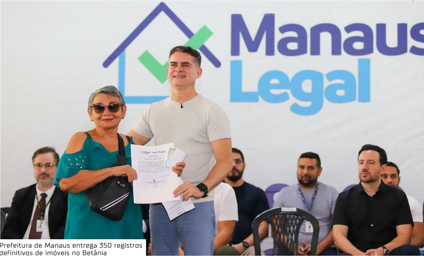
Prefeitura de Manaus entrega 350 registros definitivos de imóveis no Betânia