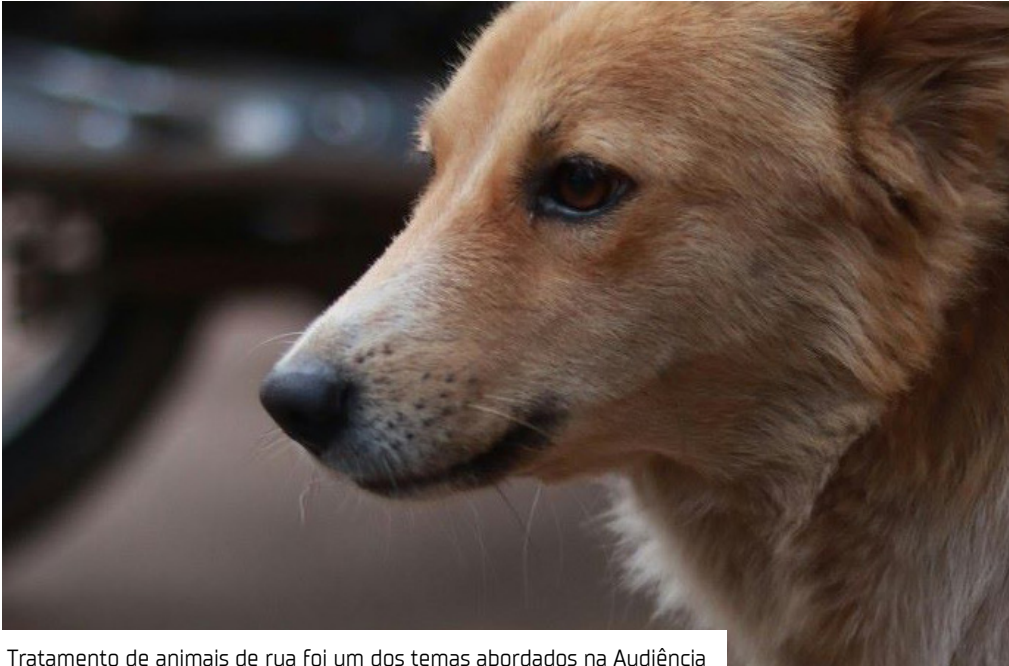
Tratamento de animais de rua foi um dos temas abordados na Audiência

O tratamento e o cuidado direcionados a animais de rua, bem como segurança e políticas públicas para o ano de 2026, foram os principais temas abordados em uma audiência pública realizada pelo Ministério Público do Estado do Amazonas (MPAM), no Auditório da Câmara Municipal de Marãã (a 635 quilômetros de Manaus). A ação foi conduzida pela Promotoria de Justiça local, com o objetivo de debater estratégias integradas. A audiência, que foi aberta ao público em geral e reuniu representantes de órgãos públicos, sociedade civil e entidades privadas, orientou o Ministério Pú-