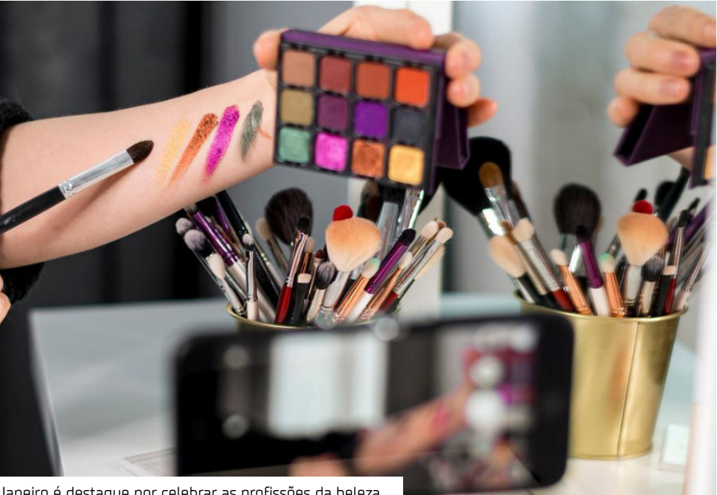
Janeiro é destaque por celebrar as profissões da beleza

Com previsão de movimentar mais de R$ 60 bilhões até o fim do ano, o setor de beleza reafirma sua relevância econômica no Brasil, que ocupa hoje a quarta posição no ranking mundial de consumo, atrás apenas de Estados Unidos, China e Japão. O aumento de clínicas especializadas, o surgimento de novos serviços e a busca crescente por bem-estar têm impulsionado o mercado — e, junto com ele, a exigência por profissionais cada vez mais tecnicamente preparados.