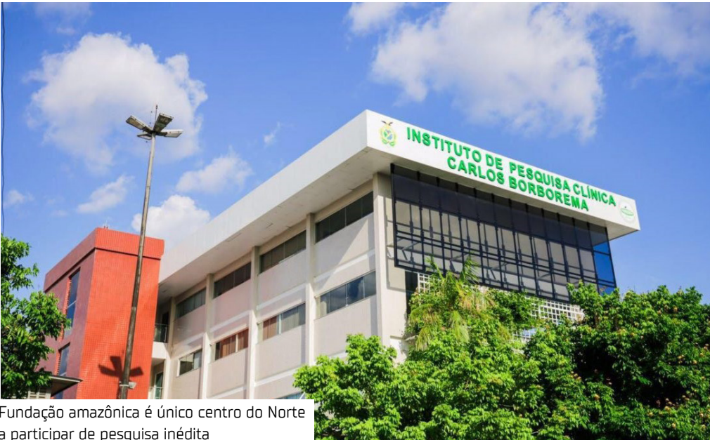
Fundação amazônica é único centro do Norte a participar de pesquisa inédita