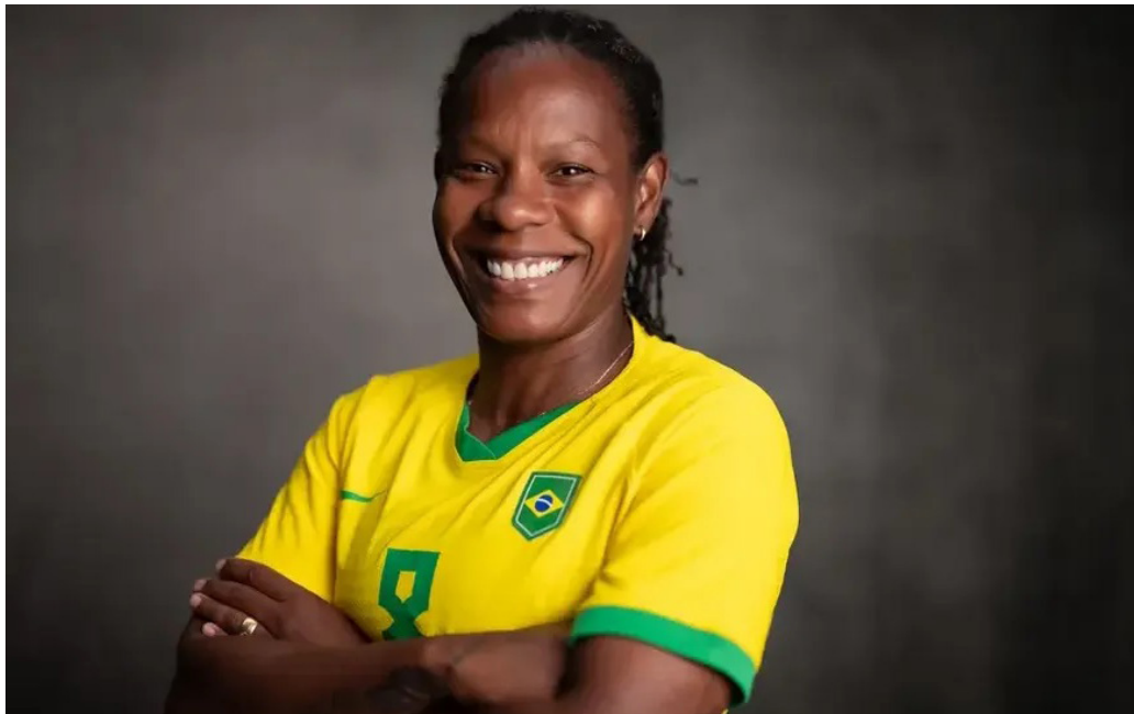
Ex-jogadora da Seleção Brasileira foi nomeada no Ministério do Esporte do Governo Lula