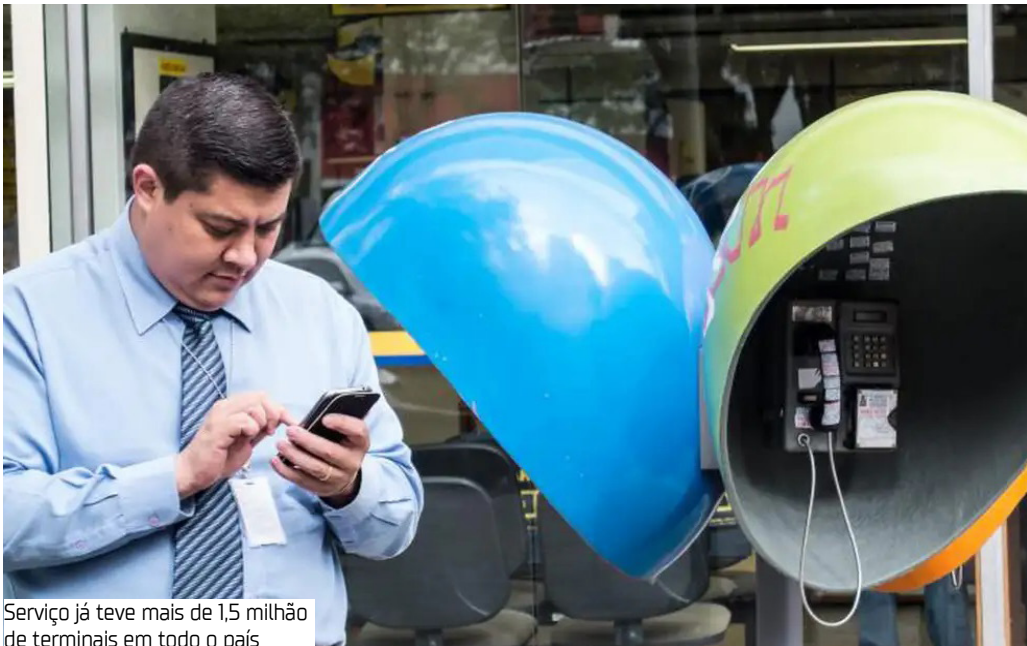
Serviço já teve mais de 1,5 milhão de terminais em todo o país

Os últimos 30 mil telefones de uso público, popularmente conhecidos como orelhões, já têm data marcada para a aposentadoria: o final de 2028.