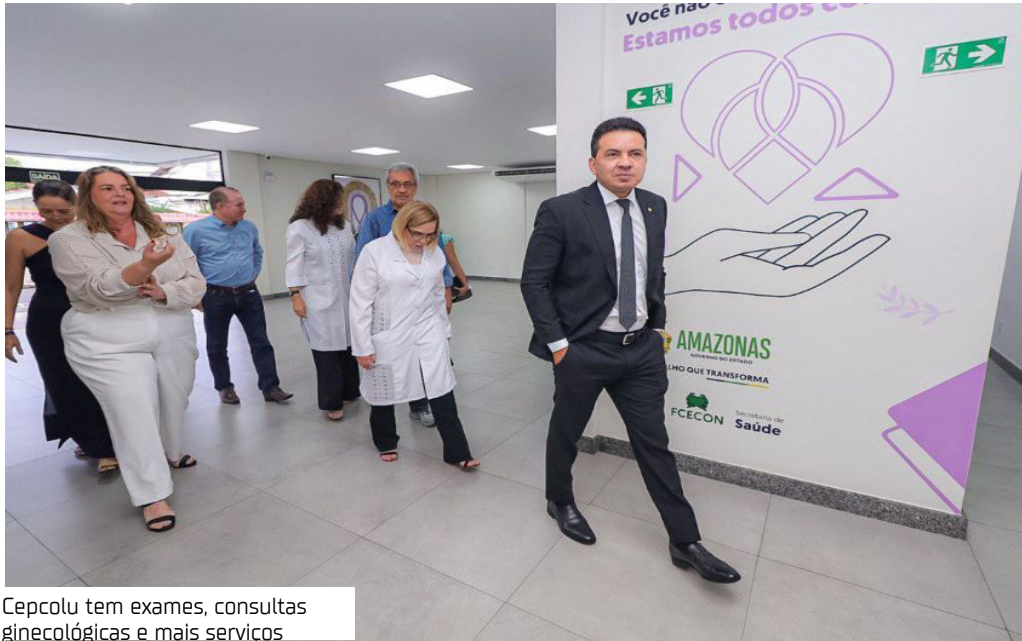
Cepcolu tem exames, consultas ginecológicas e mais serviços

Em apenas dez meses de funcionamento, o Centro de Prevenção ao Câncer do Colo do Útero do Amazonas (Cepcolu) já ultrapassou a marca de 5,8 mil atendimentos, consolidando-se como uma das principais iniciativas de fortalecimento da saúde feminina no Estado.