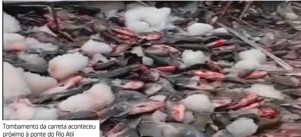
Tombamento da carreta aconteceu próximo à ponte do Rio Atití

Uma carreta carregada de tambaquis tombou ontem (20) no quilômetro 237,8 da BR-319, próximo à ponte do Rio Atití. A Polícia Rodoviária Federal (PRF) confirmou o acidente.