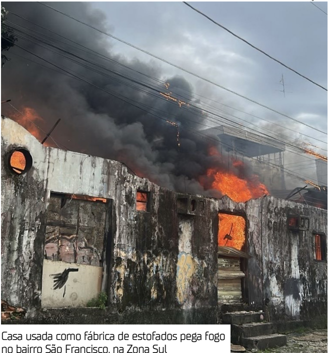
Casa usada como fábrica de estofados pega fogo no bairro São Francisco, na Zona Sul

Vizinhos ainda tentaram conter o fogo, mas as chamas se espalharam rapidamente devido ao material inflamável presente na barraca.