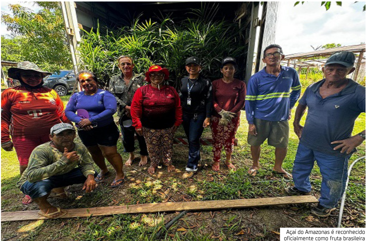
Açaí do Amazonas é reconhecido oficialmente como fruta brasileira

“A presença do Idam nos municípios é o que viabiliza a modernização da cadeia. Com a inclusão recente de Tefé e Anamá (em 2024/2025) no Projeto Prioritário, a tendência é que esses municípios apresentem as maiores taxas de crescimento de produtividade nos