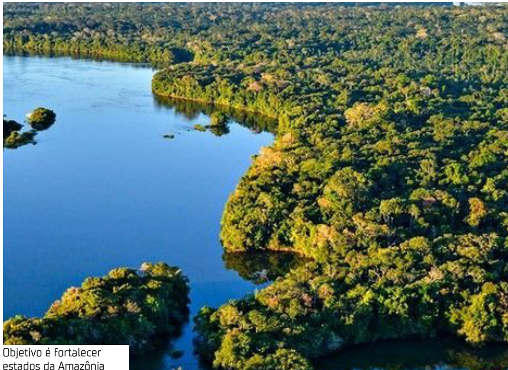
Objetivo é fortalecer estados da Amazônia