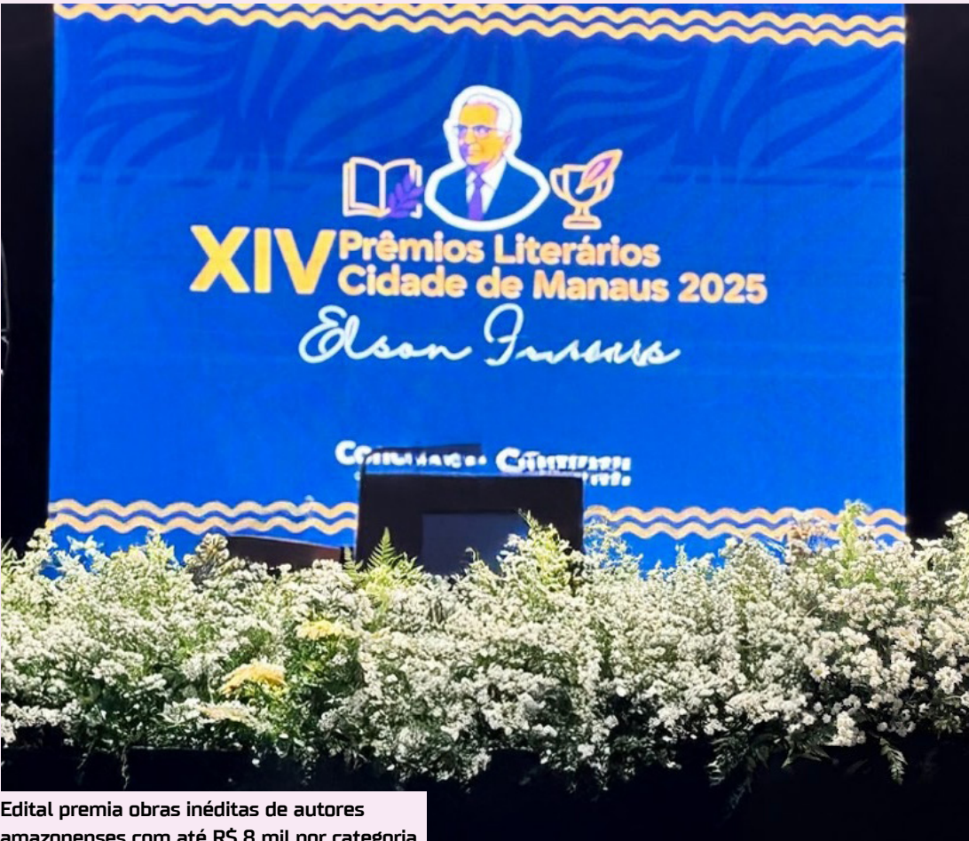
Editais premia obras inéditas de autores amazonenses com até R$ 8 mil por categoria

plativas, onde cada autor(a) poderá se inscrever em apenas uma categoria e apresentar uma única obra. As inscrições em coautoria não serão aceitas, sendo as categorias: Prêmio Álvaro Maia, destinado ao melhor romance ou novela; Prêmio Arthur Enggrácio, para o melhor livro de contos; Prêmio Péricles Moraes, voltado ao melhor livro de crônicas; Prêmio Violeta Branca Menescal, que reconhece o melhor livro de poesia; Prêmio Samuel Benchimol, para o melhor livro de ensaios; Prêmio Áureo Nonato, dedicado ao melhor livro de memória e/ou jornalismo literário; Prêmio Alfredo Fernandes, destinado à melhor obra de literatura infantojuvenil; Prêmio Álvaro Braga, para o melhor livro de teatro; Prêmio Mário Ypiranga Monteiro, que premia o melhor ensaio sobre tradições populares; e Prêmio Djalma Batista, voltado à melhor obra de temática amazônica.