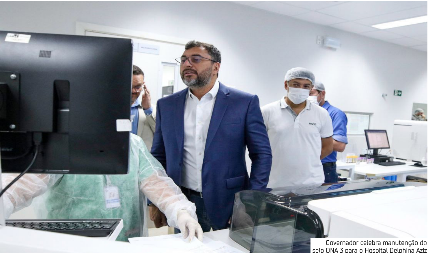
Governador celebra manutenção do selo ONA 3 para o Hospital Delphina Aziz

taria de Estado de Saúde (SES-AM), é pioneiro na obtenção da certificação na rede pública. A unidade integra o Complexo Hospitalar Zona Norte (CHZN). De acordo com a secretária da SES-AM, Nayara Maksoud, a certificação confirma o padrão de excelência que transformou o Delphina Aziz no maior centro de referência em transplantes no Norte do país. “É fruto da determinação do governador Wilson Lima, que decidiu transformar esse hospital em uma potência do SUS no Amazonas, não medindo esforços para que, hoje, o Delphina seja uma referência nacional”, destaca. Segundo o diretor executivo do CHZN/INDSH, Cristian Tassi, as certificações padrão ONA representam um conjunto de requisitos de qualidade envolvendo a parte estrutural, os processos de trabalho e a capacitação no atendimento ao usuário. Ele também ressalta a atuação da equipe multiprofissional altamente qualificada da unidade. “A certificação reforça a excelência dos serviços prestados e reconhece o esforço coletivo de profissionais que atuam diariamente com ética, responsabilidade e compromisso com a vida”, disse. Além da excelência técnica, afirma o diretor, a humanização é um dos pilares que sustentam essa conquista. “O hospital desenvolve ações voltadas ao acolhimento, ao cuidado ao paciente e ao respeito à dignidade humana, integrando assistência segura, eficiente e sensível