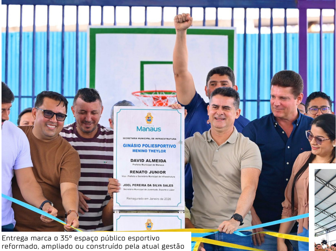
Entrega marca o 35º espaço público esportivo reformado, ampliado ou construído pela atual gestão

O ginásio poliesportivo Menino Theylor passa a funcionar de forma integrada ao Centro de Esporte e Lazer (CEL) do Mauazinho, ampliando significativamente as ações voltadas ao esporte, ao lazer e à convivência comunitária. O espaço foi planejado para atender crianças, jovens, adultos e idosos, com atividades espor-