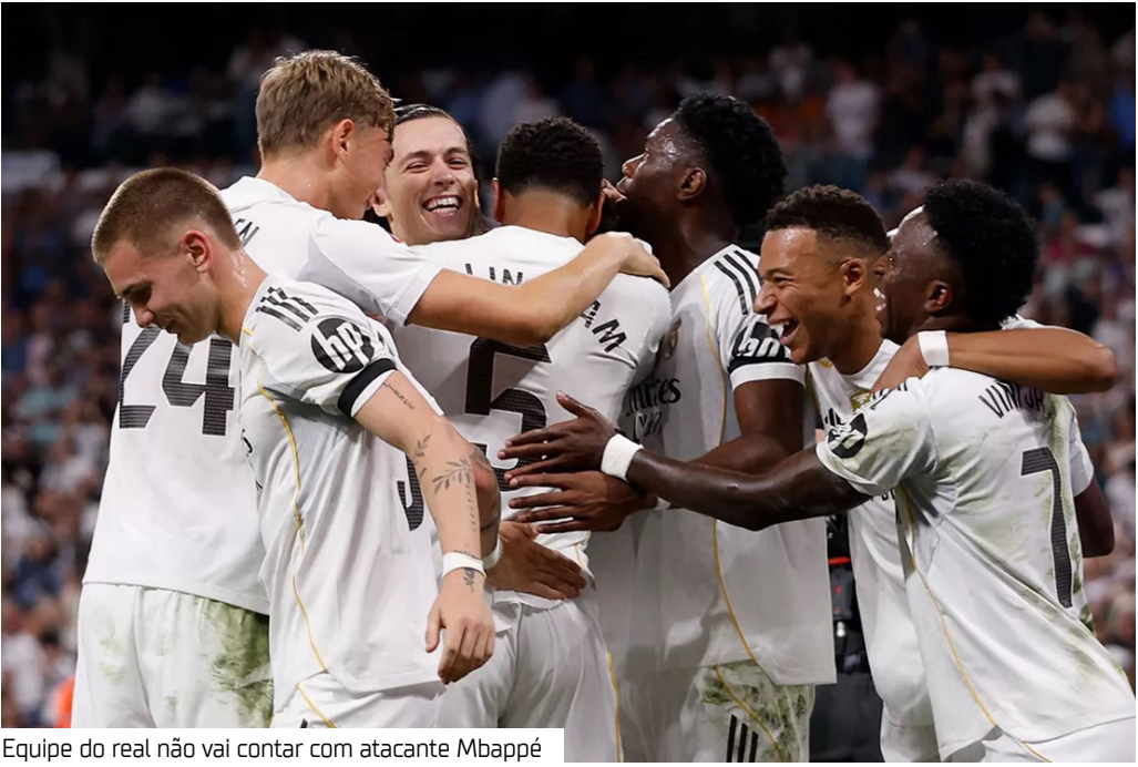
Equipe do real não vai contar com atacante Mbappé