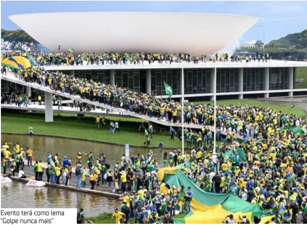
Evento terá como lema “Golpe nunca mais”