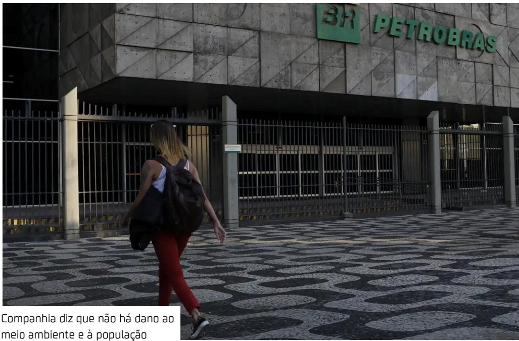
Companhia diz que não há dano ao meio ambiente e à população

Um acidente de vazamento de fluido de perfuração na Foz do Amazonas vai paralisar as atividades no poço por um período entre 10 e 15 dias. Comunicado da Petrobras que detalha o ocorrido.