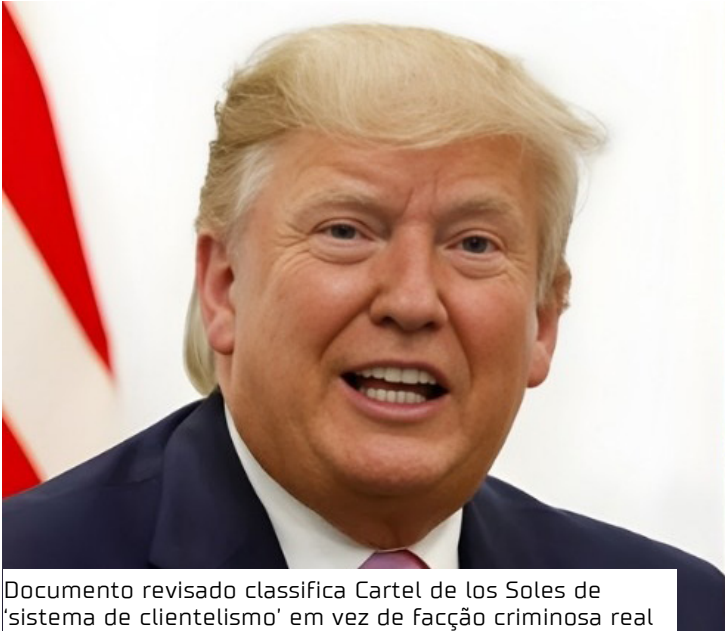
Documento revisado classifica Cartel de los Soles de 'sistema de clientelismo' em vez de facção criminoso real

Segundo a acusação revisada, os lucros do tráfico de drogas “fluem para funcionários civis,