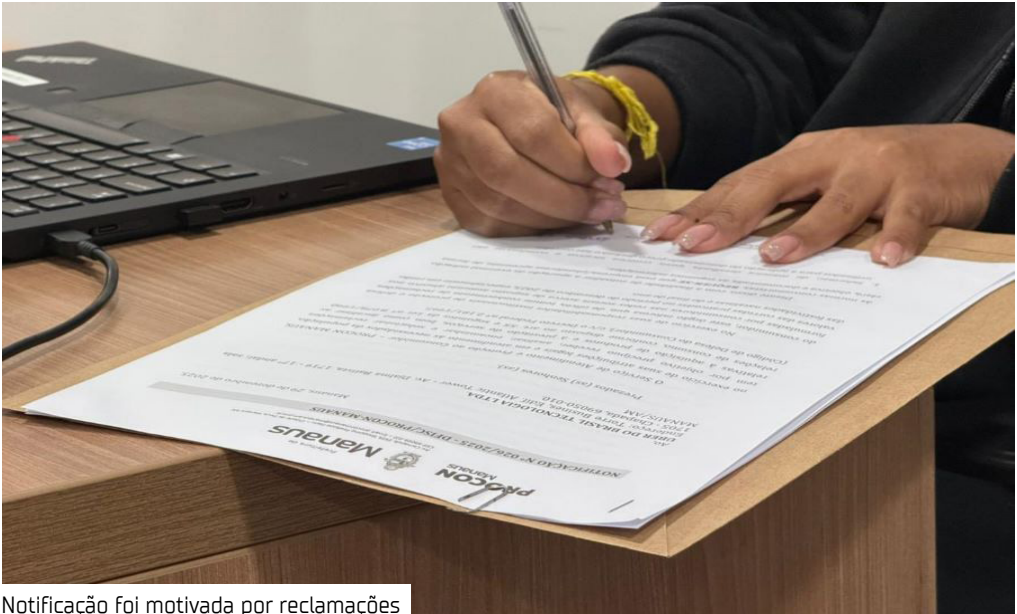
Notificação foi motivada por reclamações

O órgão reforça que a empresa deve colaborar com as solicitações. A Uber não se manifestou sobre o caso, até a publicação desta matéria.