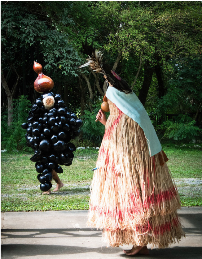
Programação cultural do Amazonas tem alterações no feriado