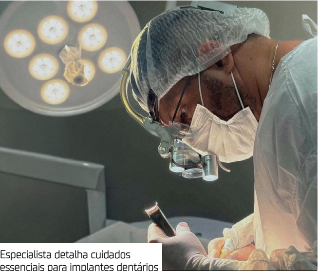
Especialista detalha cuidados essenciais para implantes dentários