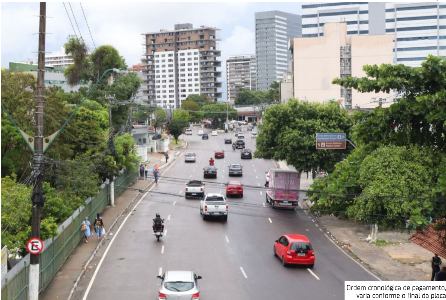
Ordem cronológica de pagamento, varia conforme o final da placa

Têm direito ao desconto os condutores que não tenham multas registradas em sua Carteira Nacional de Habilitação (CNH) no período de um a três anos anteriores, com percentuais definidos conforme o histórico de condução: 10% para quem não cometeu infrações no ano anterior; 15% para quem não cometeu infrações nos últimos dois anos; 20% para quem não come-