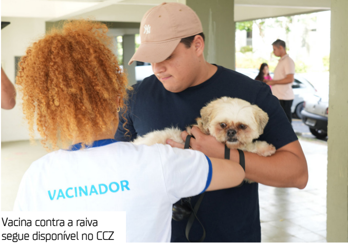
Vacina contra a raiva segue disponível no CCZ