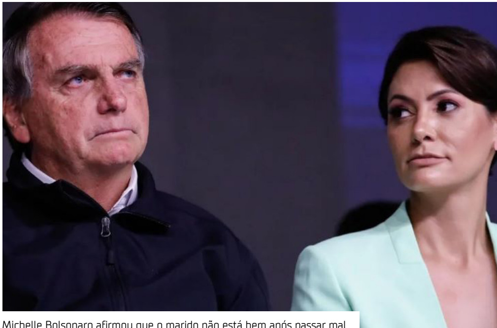
Michelle Bolsonaro afirmou que o marido não está bem após passar mal

A ex-primeira-dama Michelle Bolsonaro afirmou, ontem (6), que o ex-presidente Jair Bolsonaro não está bem após passar mal durante a madrugada na Superintendência da Polícia Federal, em Brasília, onde cumpre pena. Segundo Michelle, Bolsonaro sofreu uma crise enquanto dormia. Em seguida, ele caiu e bateu a cabeça em um móvel. No entanto, ela não detalhou a natureza do episódio.