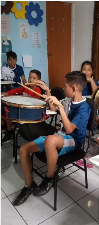
Instituto Sol atende centenas de pessoas da comunidade local

Nº 03/2025 – Pontos de Cultura, com recursos do Fundo Estadual de Cultura, por meio da Política Nacional de Cultura Viva e Aldir Blanc do Ministério da Cultura e Governo Federal, realizado pelo Conselho Estadual de Cultura, Secretaria de Estado de Cultura e Economia Criativa e Governo do Estado do Amazonas, e será desenvolvido durante todo o ano de 2026 com atividades regulares. Programação - Aulas de Violão: Terças e quintas-feiras, das 8h às 10h30 - Oficinas de Percussão e Confecção de Instrumentos Musicais: Quintas-feiras, das 13h às 16h - Capoeira : Turma 1: Segunda-feira, das 8h às 9h15/ Sábado, das 8h às 10h Turma 2: Segunda-feira, das 9h30 às 10h45/ Sábado, das 8h às 10h - Escola de Rock – Clube Garam: Segundas e sextas-feiras de 8h às 10:30h