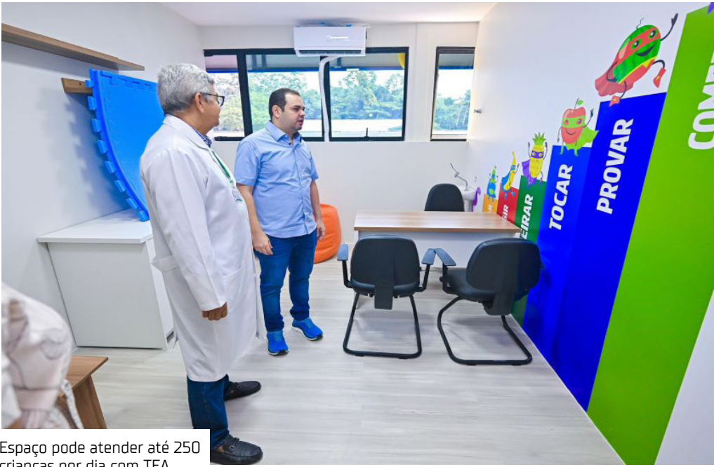
Espaço pode atender até 250 crianças por dia com TEA

O Centro de Inclusão Sensorial Dr. Hamilton Cidade, da Assembleia Legislativa do Amazonas (Aleam), iniciou ontem (6) os atendimentos a crianças de até 14 anos cadastradas no programa. A princípio, as atividades começam com 20 das 50 crianças já cadastradas, que passaram por avaliação multidisciplinar.