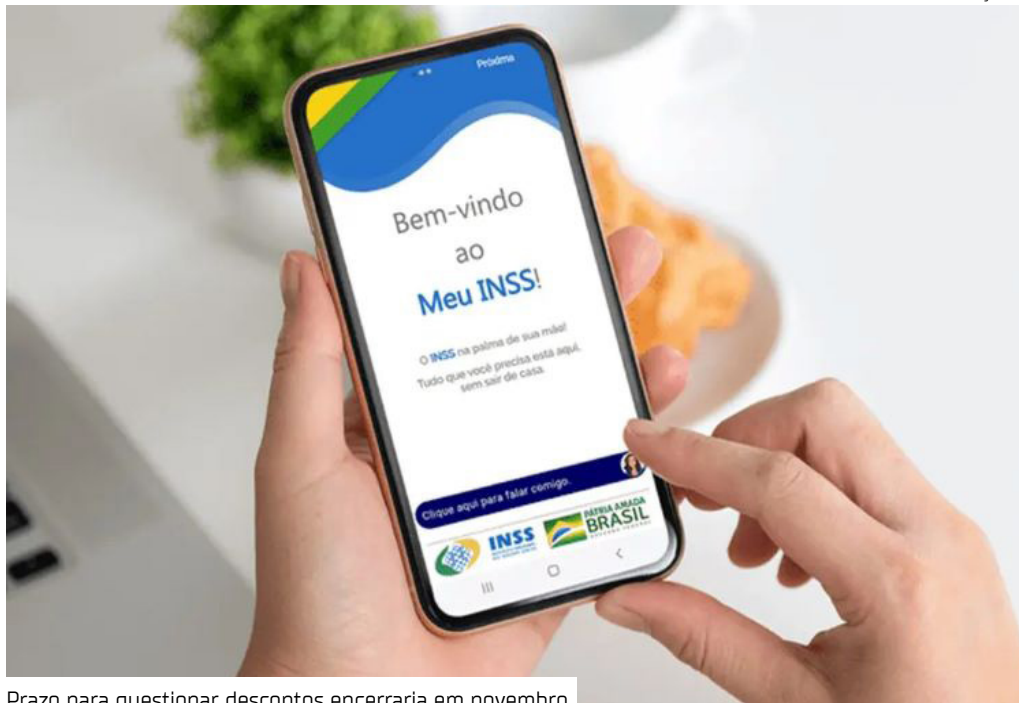
Prazo para questionar descontos encerraria em novembro

Aproximadamente 6,2 milhões de brasileiros contestaram valores descontados indevidamente de seus benefícios do Instituto Nacional do Seguro Social (INSS) e 4,1 milhões já receberam o valor do ressarcimento em conta bancária.