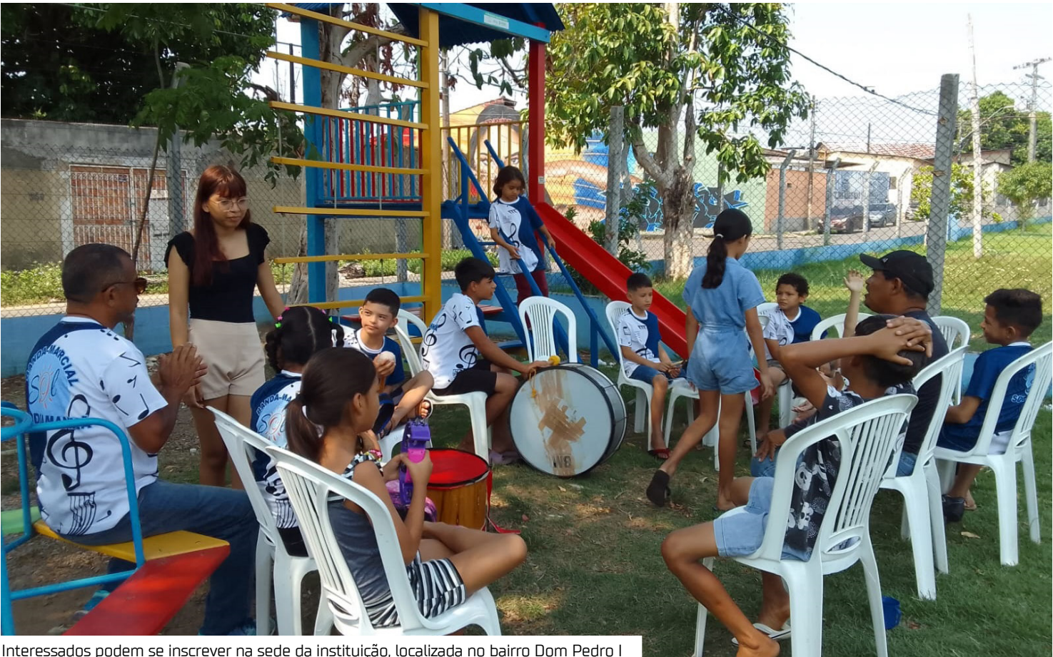
Interessados podem se inscrever na sede da instituição, localizada no bairro Dom Pedro I