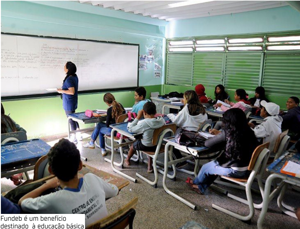
Fundeb é um benefício destinado à educação básica