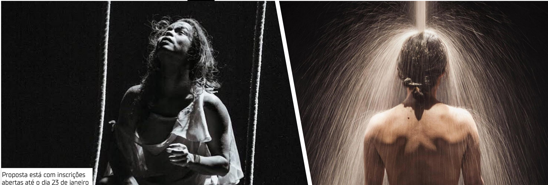
Proposta está com inscrições abertas até o dia 23 de janeiro

Já imaginou participar de uma imersão gratuita em produção, análise de processos e práticas de dramaturgia circense? Esse é o propósito do projeto “Circo-Escrituras”, que está com inscrições abertas até o dia 23 de janeiro para o primeiro curso de formação do Amazonas sobre a cena circense, combinando encontros presenciais e mentorias online ao longo de quatro semanas. “Convergências Divergentes – Circo em Linhas Transversais”, “Dramaturgias em Cheque – Balançando as estruturas das Circo-Escrituras em Processo” e “Circo-tramas compondo um Texto – Proposta de Dramaturgia Circense em Processo” compõem os módulos do projeto, idealizado pelo Núcleo Amazônico de Pesquisa e