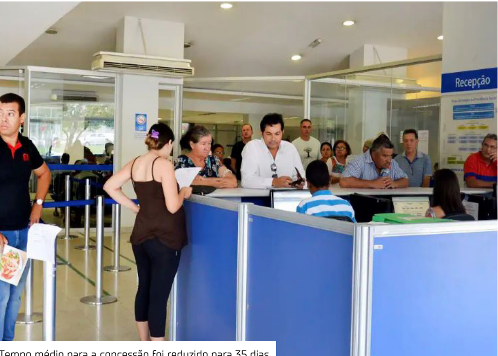
Tempo médio para a concessão foi reduzido para 35 dias

O Programa de Gerenciamento de Benefícios (PGB) do Instituto Nacional do Seguro Social (INSS) passou por mudanças, com o objetivo de reduzir o tempo de tramitação de processos. Entre as principais mudanças está a nacionalização da fila, com a otimização dos servidores para dar andamento às demandas. As novas regras foram publicadas no Diário Oficial da União. "A ideia é que a força de trabalho das regiões