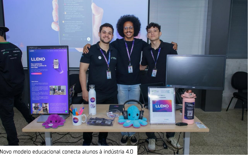
Novo modelo educacional conecta alunos à indústria 4.0