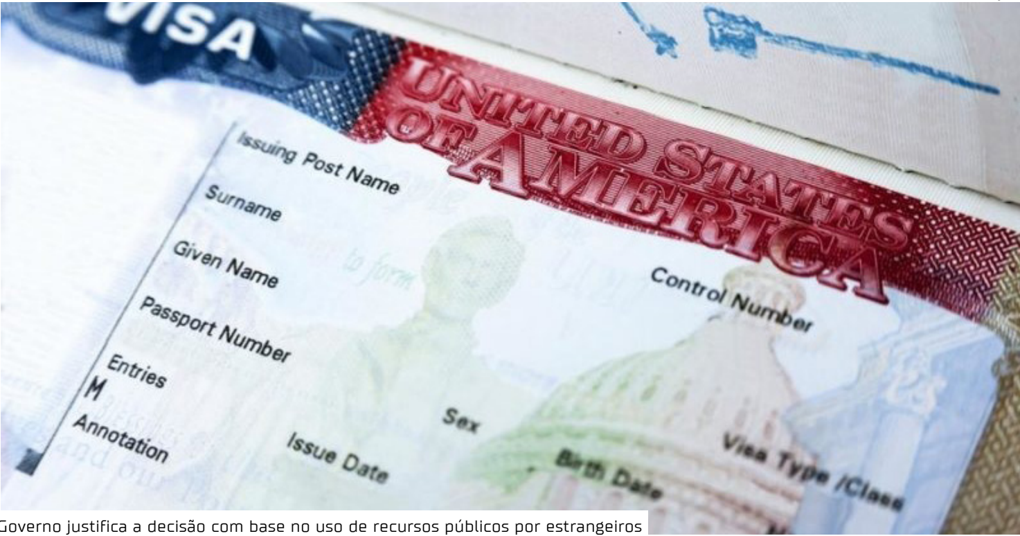
Governo justifica a decisão com base no uso de recursos públicos por estrangeiros

os novos imigrantes não irão extrair riqueza do povo americano”, disse o departamento. A medida foca exclusivamente na categoria de vistos de imigrantes. Até o momento, o texto não menciona alterações ou restrições para vistos de turista. Prazos e países afetados Embora o Departamento de Estado não tenha divulgado a lista completa, o governo de Donald Trump confirmou que a restrição atinge nações “cujos imigrantes frequentemente se tornam um encargo público para os Estados Unidos ao chegarem ao país”. Segundo o memorando da Fox News, a medida entra em vigor em 21 de janeiro e não possui data de término definida. O governo americano utilizará essa pausa temporária para reavaliar os critérios de concessão de vistos. Além de Brasil, Rússia e Irã, a lista inclui Afeganistão, Iraque, Somália e Tailândia. A nova diretriz pode ampliar os critérios de exclu-