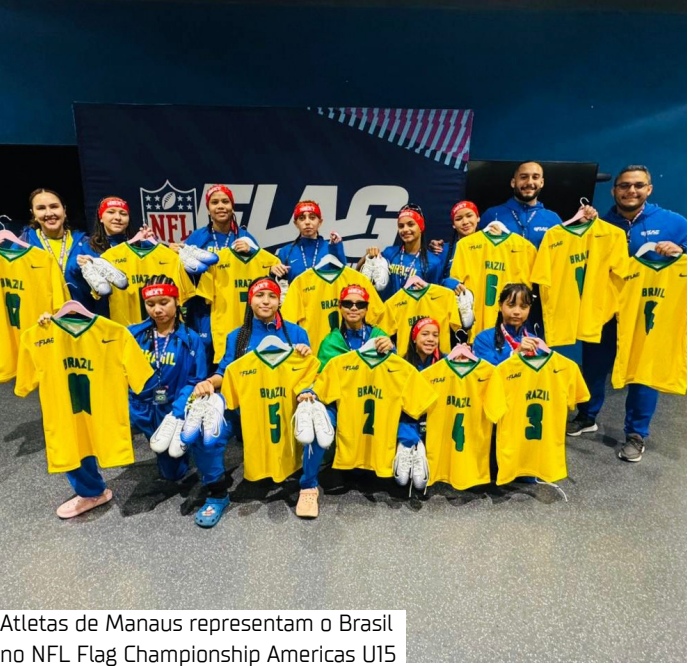
Atletas de Manaus representam o Brasil no NFL Flag Championship Americas U15

Representando a Seleção Brasileira, a AEVA (Associação Educacional Voz Ativa), de Manaus, foi a responsável por levar o Brasil a essa experiência histórica. A participação brasileira simbolizou não apenas a presença em um campeonato internacional, mas o resultado de um trabalho social, educacional e esportivo desenvolvido há anos com crianças e adolescentes da periferia da Amazônia. A experiência vivida em Monterrey foi descrita pela delegação como algo “incrível e fora da realidade”. Desde a chegada ao estádio, com estrutura de padrão internacional, até o convívio com seleções de diferentes culturas, tudo contribuiu para um ambiente de aprendizado intenso, troca de experiências e crescimento pessoal