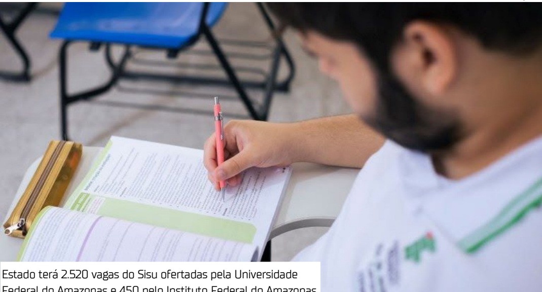
Estado terá 2.520 vagas do Sisu ofertadas pela Universidade Federal do Amazonas e 450 pelo Instituto Federal do Amazonas

A Ufam é a instituição que oferece o maior número de vagas no estado, com 2.520 oportunidades. Os cursos