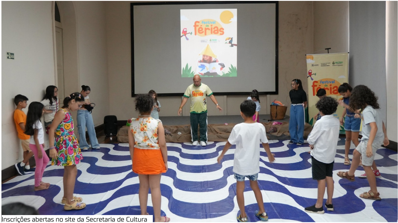
Inscrições abertas no site da Secretaria de Cultura

O Governo do Amazonas, por meio da Secretaria de Estado de Cultura e Economia Criativa, inicia amanhã (16) a edição 2026 do Festival de Férias. A iniciativa percorre dez espaços culturais da capital, oferecendo atividades lúdicas e educativas para crianças de 6 a 14 anos durante o recesso escolar. A programação mescla visitas guiadas, oficinas criativas, contação de histórias e apresentações artísticas em museus, teatros e parques. O objetivo central é aproximar os pequenos da história e da identidade amazonense.