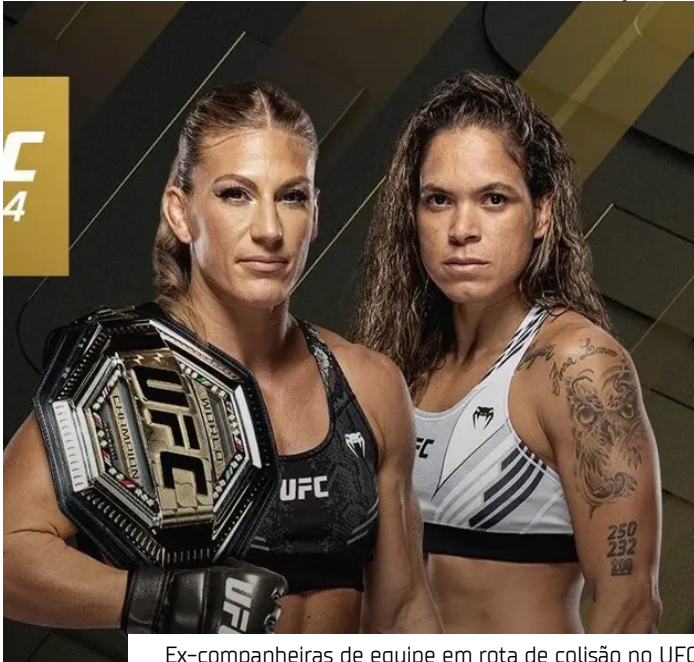
Ex-companheiras de equipe em rota de colisão no UFC

sem treinar no mesmo espaço enquanto uma buscava lutar com a outra. Em 2023, Amanda Nunes resolveu anunciar sua aposentadoria, mas admitiu que estava sentindo falta de lutar um ano depois. Nesta altura, Kayla já havia assinado com o UFC e estava chegando ao título do peso galo. Após vencer Peña e conquistar o cinturão, Harrison desafiou Amanda e as duas se encararam dentro do octógono. O duelo, inicialmente marcado para o dia 24 de janeiro, terá que esperar. Mas a tensão entre os dois lados só tende a crescer.