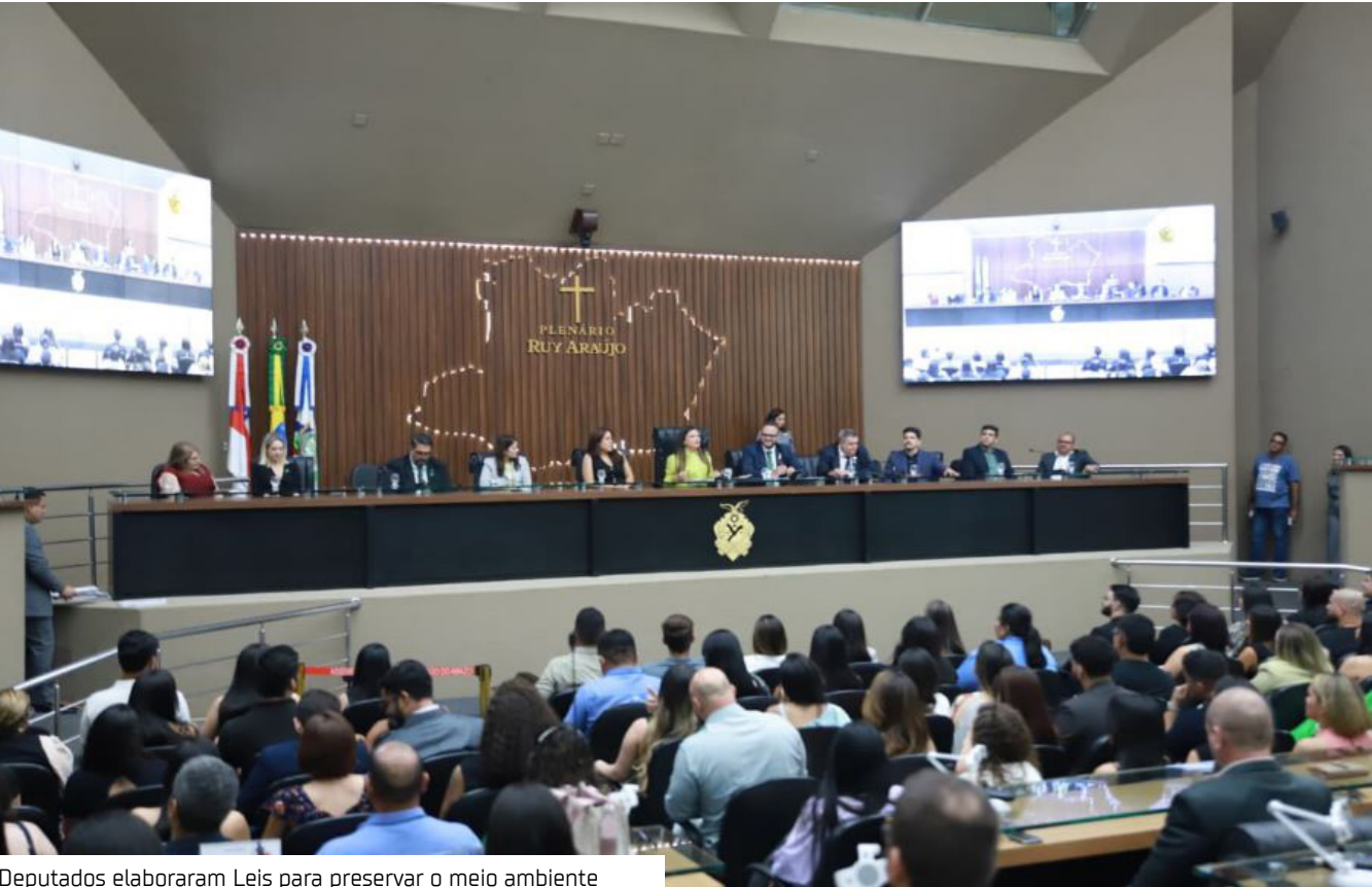
Deputados elaboraram Leis para preservar o meio ambiente

A Assembleia Legislativa do Amazonas (Aleam) avançou, em 2025, na consolidação de um arcabouço legal mais rigoroso e eficaz para a proteção dos recursos naturais, ao aprovar iniciativas que ampliam a fiscalização ambiental e coíbem práticas poluentes.