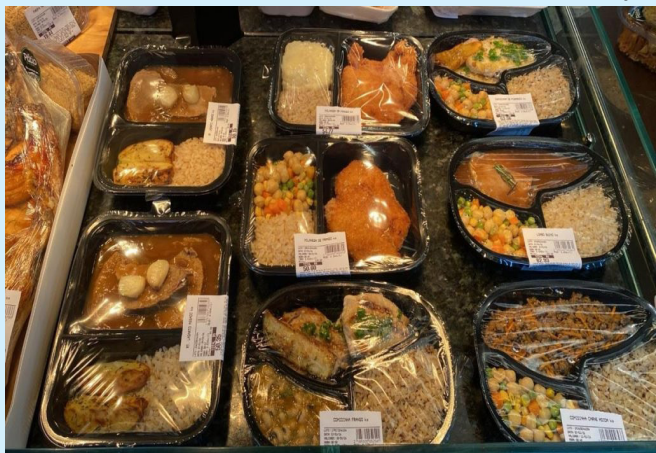
Pratos prontos viram opção saudável em Manaus