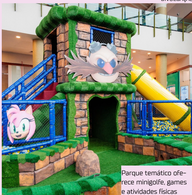
Parque temático oferece minigolfe, games e atividades físicas