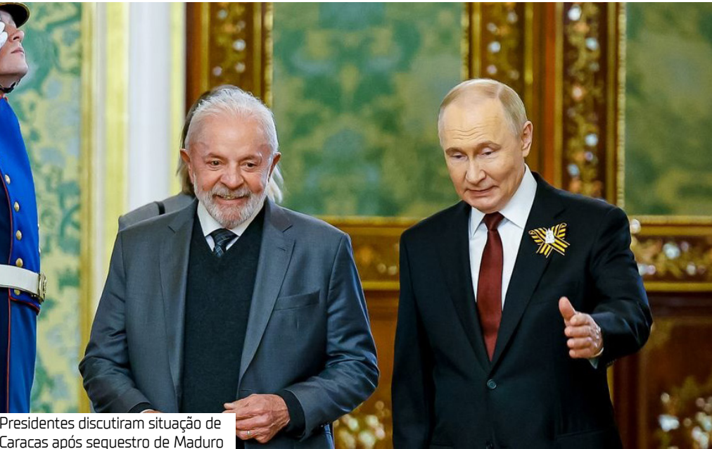
Presidentes discutiram situação de Caracas após sequestro de Maduro