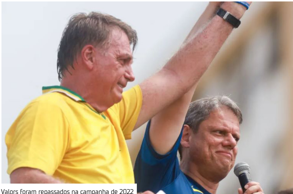
Valores foram repassados na campanha de 2022

Alvo da PF (Polícia Federal) na segunda fase da operação Compliance Zero, que investiga supostas fraudes do Banco Master, o empresário Fabiano Zettel foi o maior doador das campanhas eleitorais de Jair Bolsonaro (PL) e do governador de São Paulo, Tarcísio de Freitas (Republicanos), nas eleições de 2022. No total, ele doou R$ 5 milhões para ambos candidatos, sendo R$ 3 milhões para o ex-presidente e R$ 2 milhões para o atual chefe do Executivo do estado de São Paulo, que foi eleito na ocasião. As informações são do TSE (Tribunal Superior Eleitoral).