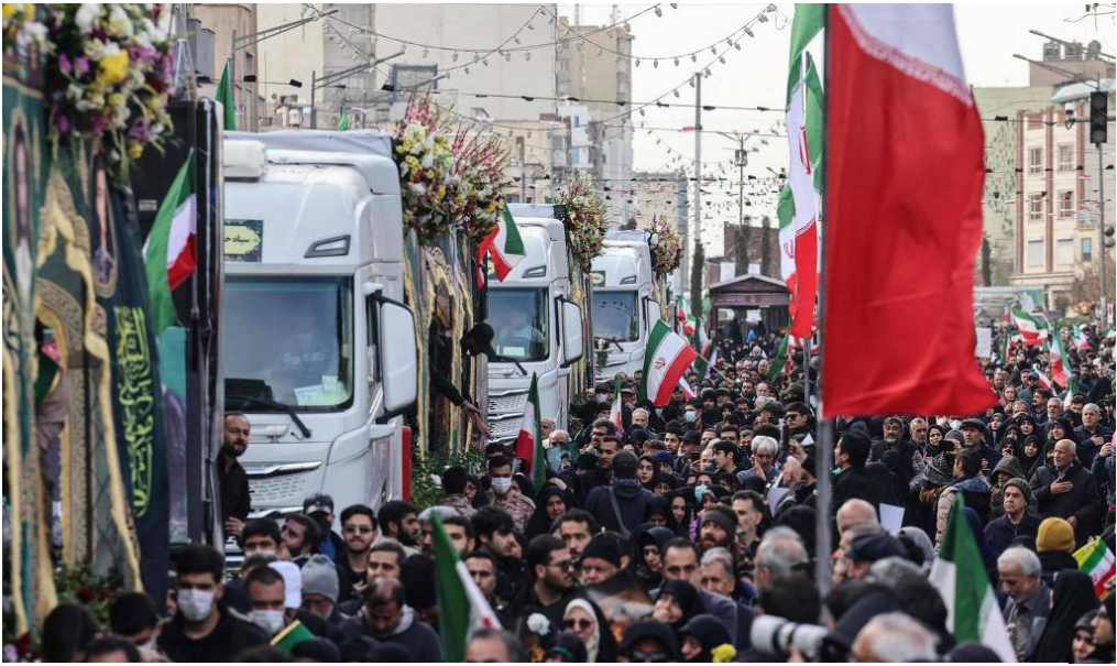
Iranianos participam de funeral em Teerã de policiais que participaram da repressão aos protestos

O governo do Irã intensificou a pressão contra os manifestantes que desafiam o regime teocrático há mais de duas semanas. Soba ameaça direta de um ataque militar dos Estados Unidos, Teerã prepara uma resposta armada e promete retaliação contra bases americanas no Oriente Médio. Os protestos, iniciados contra a crise econômica, tornaram-se a maior ameaça à teocracia desde 1979. Embora a brutal repressão policial tenha reduzido o escopo das manifestações, o movimento segue ativo em diversas regiões. Repressão policial Análises do Instituto