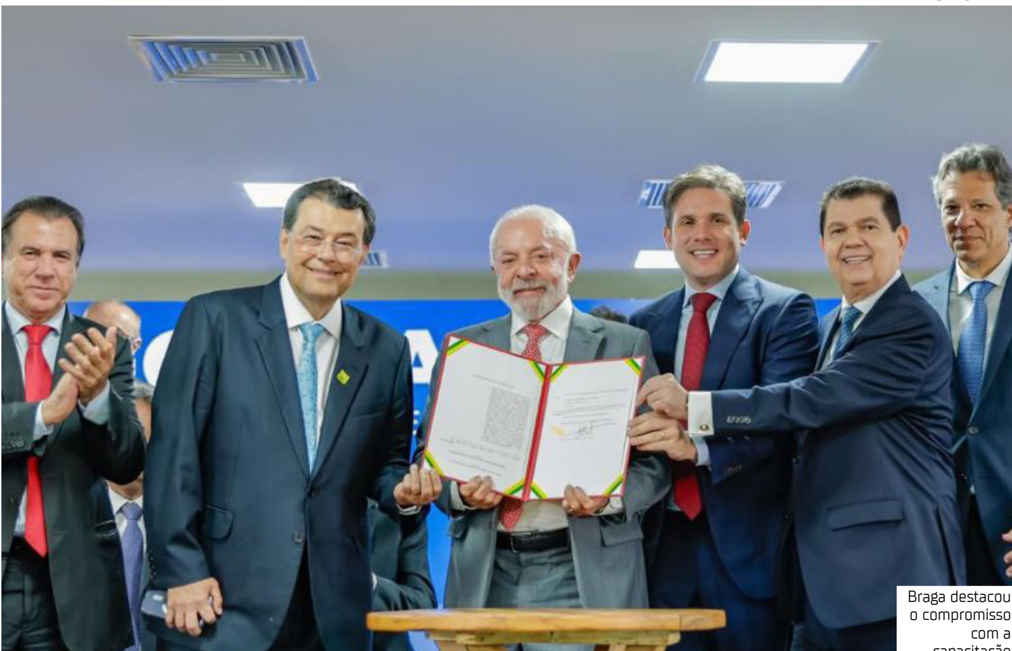
Braga destacou o compromisso com a capacitação

Além da modernização, o PLP 108/2024 busca pôr fim ao que o senador Braga chamou de “manicômio tributário”, simplificando a complexa legislação atual. A reforma