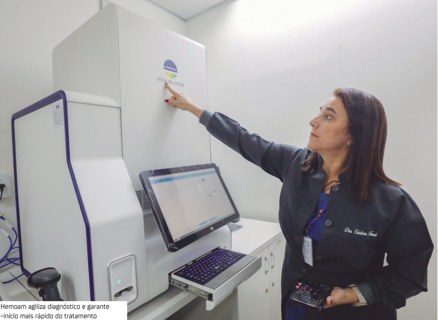
Hemoam agiliza diagnóstico e garante início mais rápido do tratamento

Tecnologia Baseado na tecnologia de ionização e dessorção a laser assistida por matriz