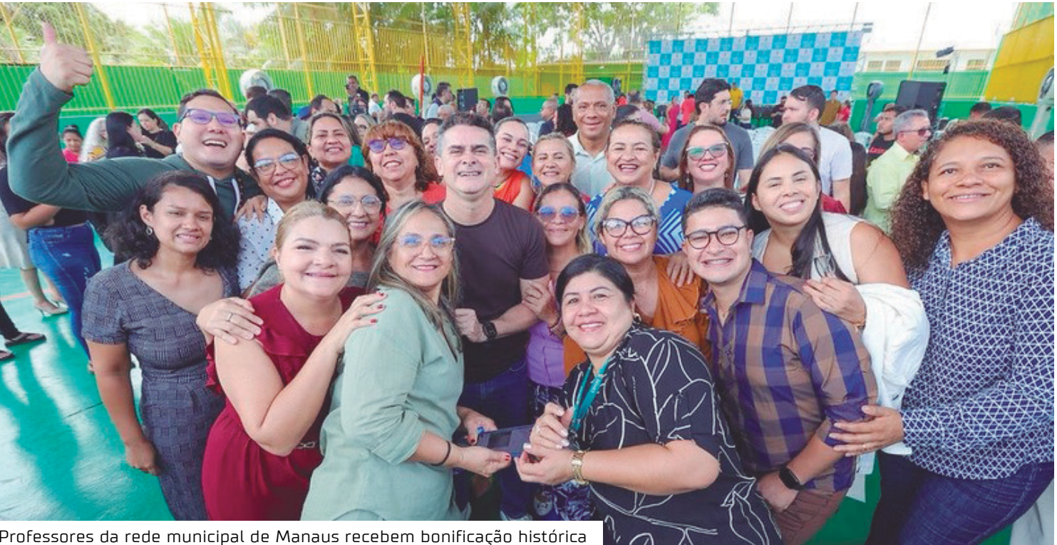
Professores da rede municipal de Manaus recebem bonificação histórica

A política de valorização dos profissionais da educação é conduzida de forma permanente, com diálogo institucional, responsabilidade fiscal e respeito às demandas da categoria, avançando de ma-