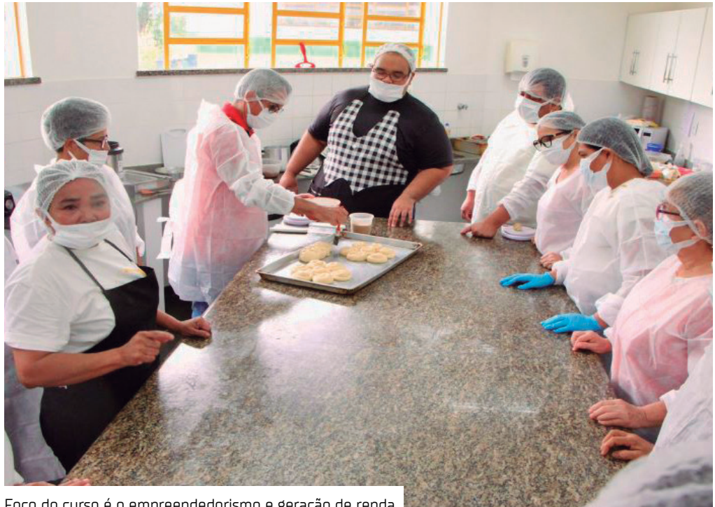
Foco do curso é o empreendedorismo e geração de renda

A Secretaria de Estado da Assistência Social e Combate à Fome (Seas), abriu inscrições para as turmas de 2026 do Projeto Padaria Artesanal.