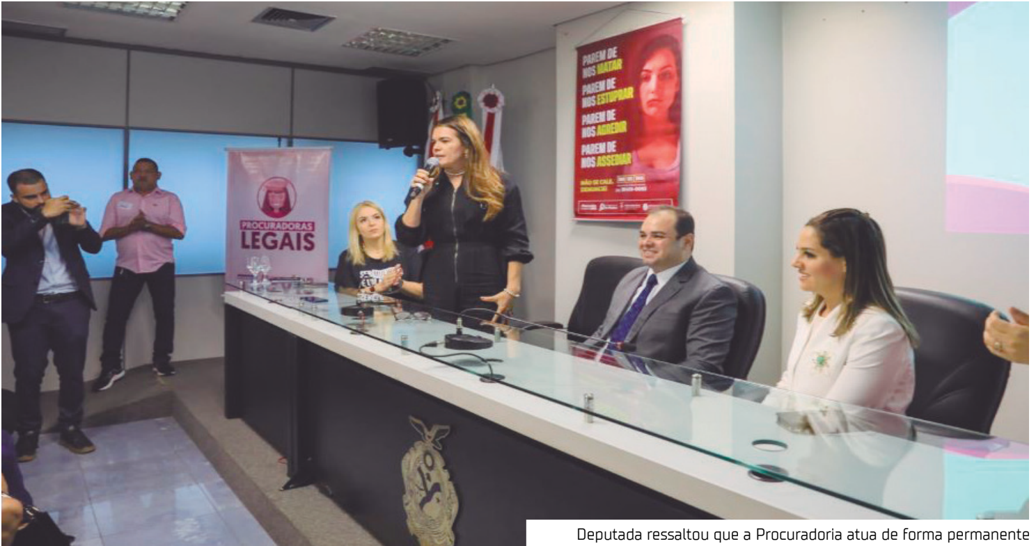
Deputada ressaltou que a Procuradoria atua de forma permanente

“As leis aprovadas pela Assembleia Legislativa do Amazonas e sancionadas em 2025 representam um avanço importante no enfrentamento dessa prática criminoso, porque combatem não apenas o ato em si, mas também a cultura de banalização da violência, da culpabilização da vítima e do silêncio. São normas que fortalecem a prevenção, a responsabilização dos agressores e a proteção das mulheres, além de ampliar a rede de apoio institucional. Como deputada e Procura-