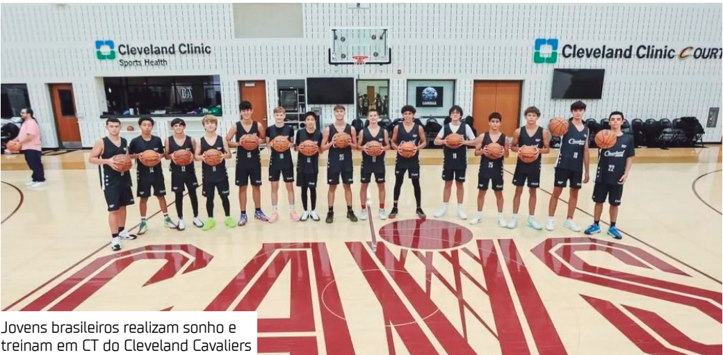
Jovens brasileiros realizam sonho e treinam em CT do Cleveland Cavaliers