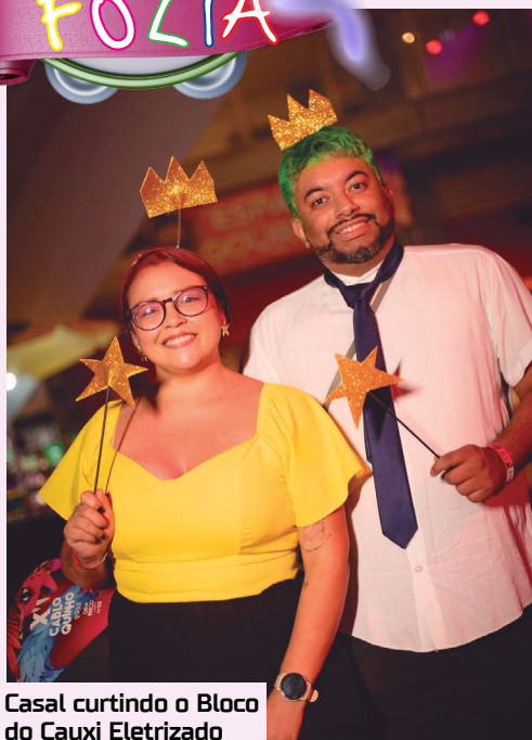
Casal curtindo o Bloco do Cauxi Eletrizado