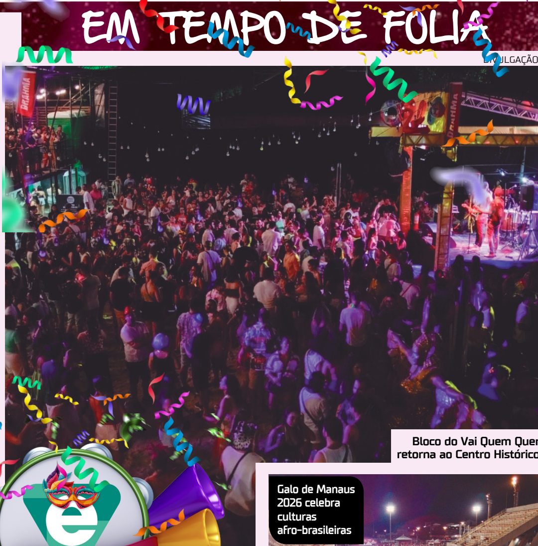
Bloco do Vai Quem Quer retorna ao Centro Histórico