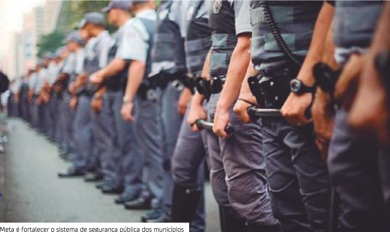
Meta é fortalecer o sistema de segurança pública dos municípios