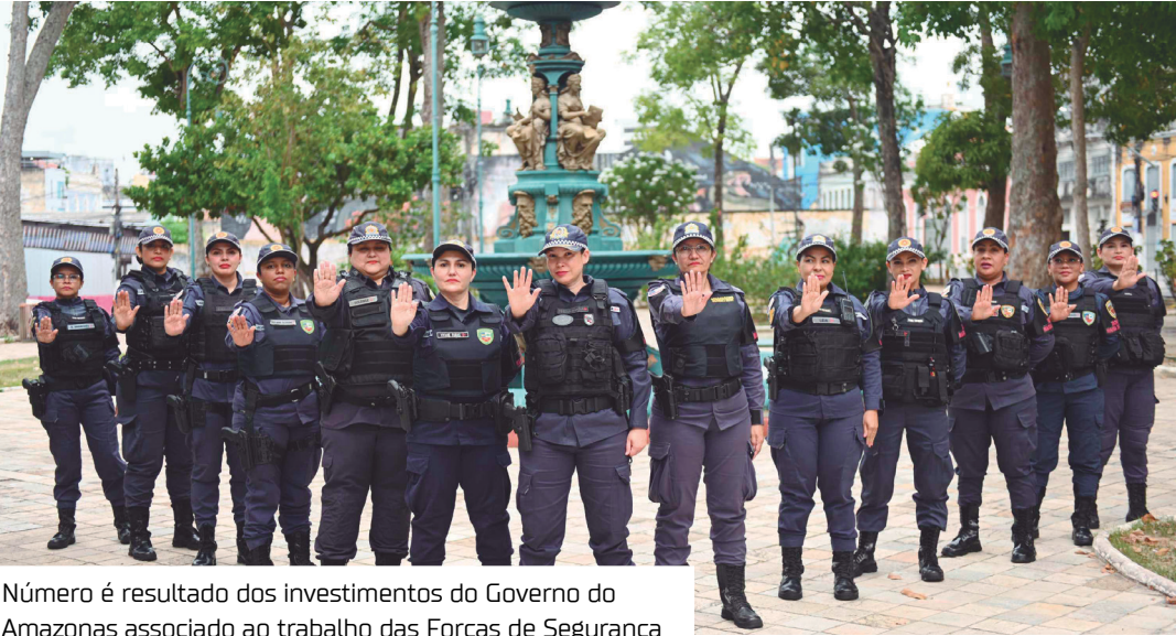
Número é resultado dos investimentos do Governo do Amazonas associado ao trabalho das Forças de Segurança