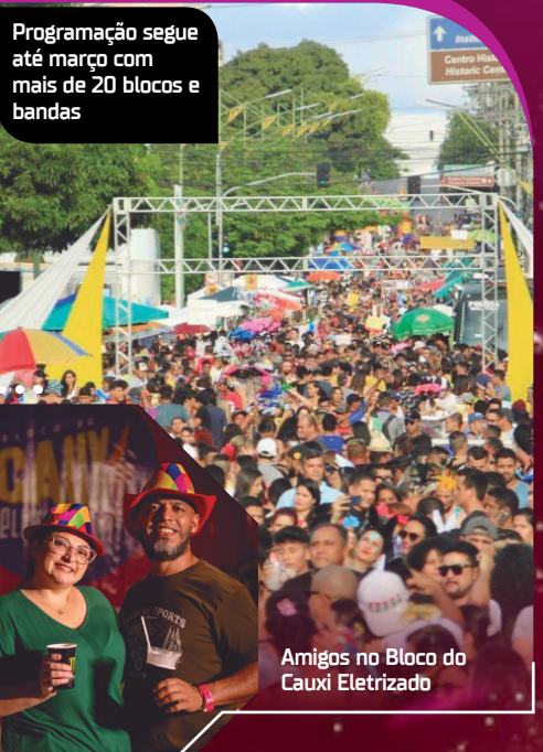
Amigos no Bloco do Cauxi Eletrizado

Programação segue até março com mais de 20 blocos e bandas