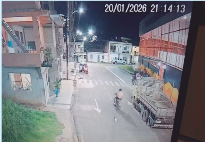
Câmeras registraram atentado em bairro de Coari