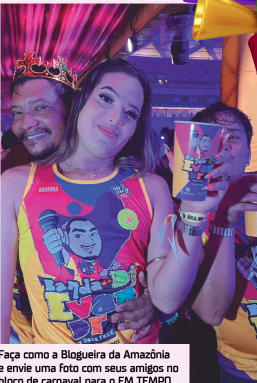
Faça como a Blogueira da Amazônia e envie uma foto com seus amigos no bloco de carnaval para o EM TEMPO