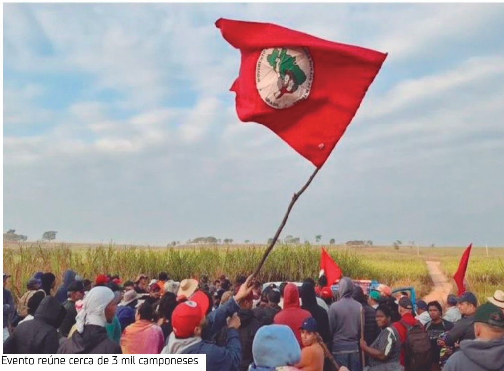
Evento reúne cerca de 3 mil camponeses

O presidente Luiz Inácio Lula da Silva participará da solenidade de encerramento do 14º Encontro Nacional do Movimento dos Trabalhadores Rurais Sem Terra (MST), nesta sexta-feira (23), às 15h, em Salvador.