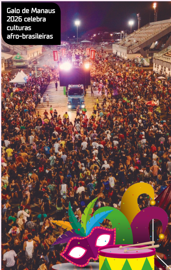
Galo de Manaus 2026 celebra culturas afro-brasileiras