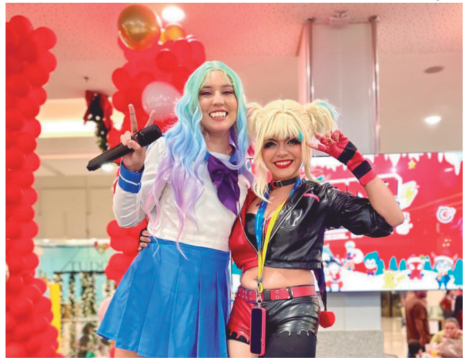
Atividades gratuitas reúnem workshops e apresentações de dança