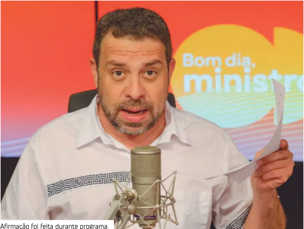
Afirmção foi feita durante programa