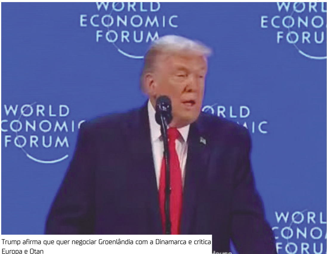
Trump afirma que quer negociar Groenlândia com a Dinamarca e critica Europa e Otan

O chanceler dinamarquês, Lokke Rasmussen, afirmou