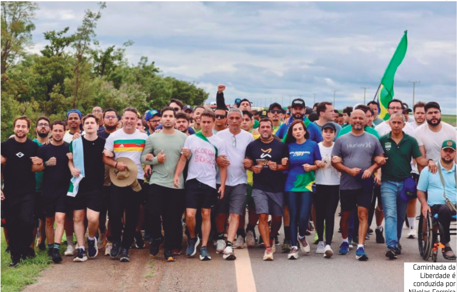
Caminhada da Liberdade é conduzida por Nikolas Ferreira

“Essa não é apenas uma viagem. É um chamado. Todo movimento começa quando alguém decide dar o primeiro passo. O Brasil vive um tempo em que a gente não pode mais ficar calado. Isso já não é uma opção