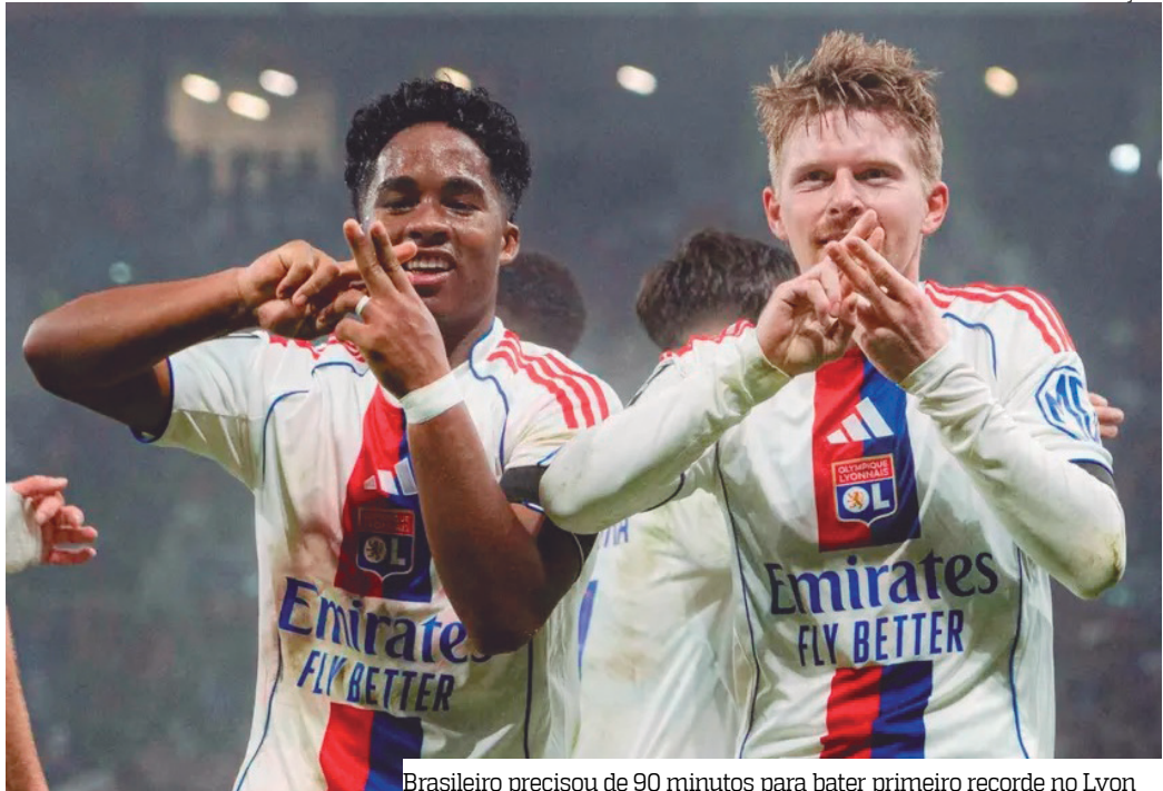
Brasileiro precisou de 90 minutos para bater primeiro recorde no Lyon