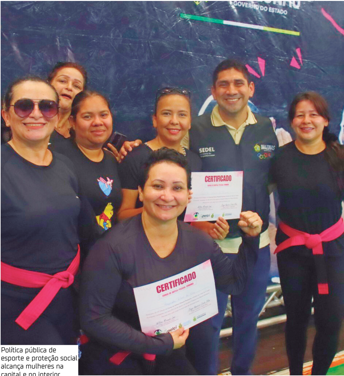
Política pública de esporte e proteção social alcança mulheres na capital e no interior