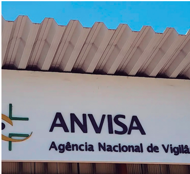
Não há garantia sobre conteúdo ou qualidade dos produtos