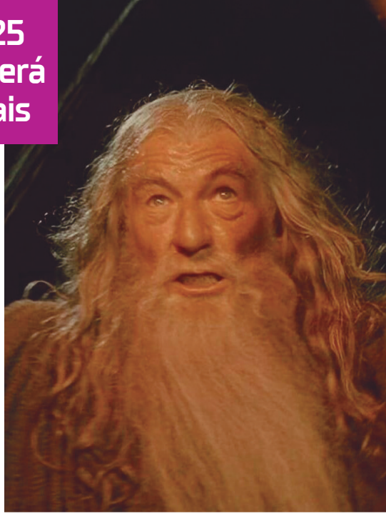
Programação especial no primeiro fim de semana de fevereiro

Inspirada na obra do escritor britânico J. R. R. Tolkien, a saga estreou nos cinemas em 2001 e rapidamente se consolidou como um fenômeno global. Ao longo de mais de duas décadas, o universo da Terra Média se expandiu para além da trilogia original, com novos filmes, séries, animações e jogos, somando bilhões de dólares em