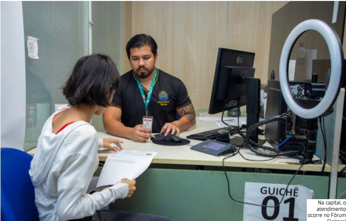
Na capital, o atendimento ocorre no Fórum Eleitoral

sencial, diversos serviços continuam disponíveis de forma online, por meio do sistema de Autoatendimento ao Elei-