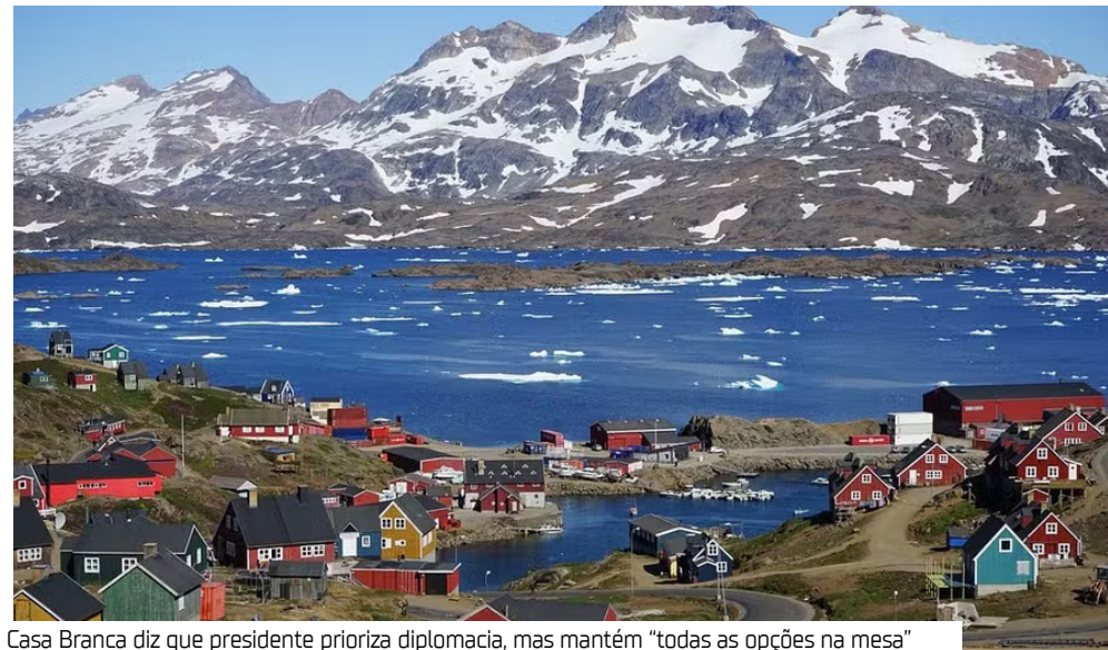
Casa Branca diz que presidente prioriza diplomacia, mas mantém “todas as opções na mesa”

O presidente dos Estados Unidos, Donald Trump, discute ativamente a possibilidade de comprar a Groenlândia com sua equipe de segurança nacional, informou a Casa Branca ontem (7). Segundo o governo americano, o republicano prefere a via diplomática, mas não descarta outras ações. “Isso é algo que está sendo ativamente discutido pelo presidente e sua equipe de segurança nacional”, afirmou a secretária de imprensa Karoline Leavitt ao ser questionada sobre uma possível oferta de Washington para adquirir o território autônomo da Dinamarca. Leavitt reiterou que Trump acredita que a aquisição da Groenlândia, rica em recursos minerais,