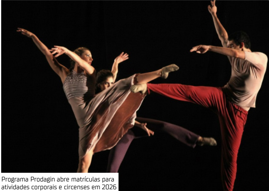
Programa Prodagin abre matrículas para atividades corporais e circenses em 2026

A Universidade Federal do Amazonas (Ufam) abriu o período de matrículas do Programa de Dança, Atividades Circenses e Ginástica (Prodagin), iniciativa gratuita que integra cultura, atividade física e formação corporal. As inscrições seguem até 27 de janeiro de 2026 e são destinadas a pessoas a partir de 16 anos, tanto da comunidade universitária quanto do público externo. Desenvolvido pela Faculdade de Educação Física e Fisioterapia (FEFF), o programa oferece aulas regulares em Manaus e Parintins. As atividades dialogam com práticas artísticas contemporâneas e exercícios de condicionamento físico,