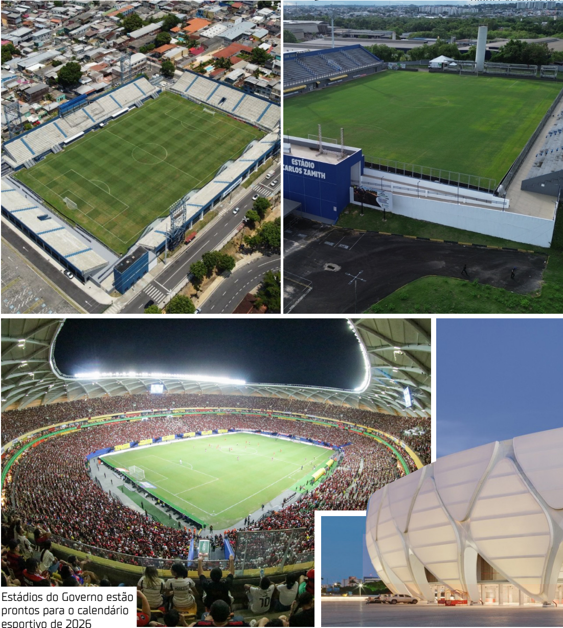
Estádios do Governo estão prontos para o calendário esportivo de 2026