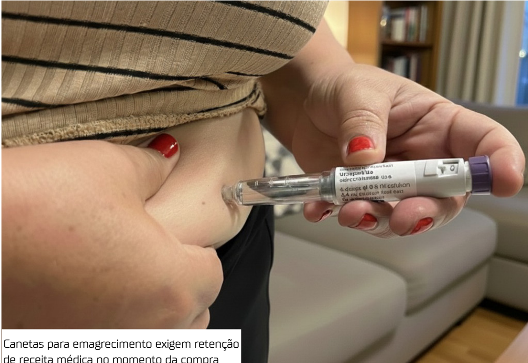
Canetas para emagrecimento exigem retenção de receita médica no momento da compra

Indicadas para o tratamento do diabetes tipo 2 e da obesidade, atuam no metabolismo e no controle do apetite, e o uso sem acompanhamento adequado pode causar efeitos adversos como pancreatite, hipoglicemia, náuseas, vômitos e alterações gastrointestinais graves.