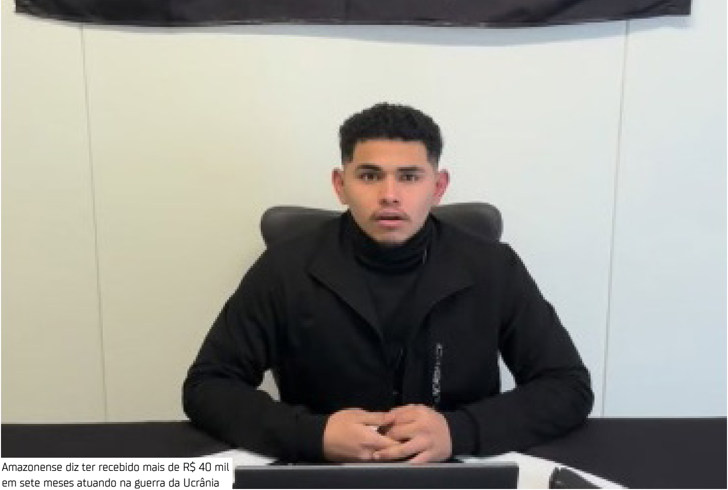
Amazonense diz ter recebido mais de R$ 40 mil em sete meses atuando na guerra da Ucrânia

na Legião Internacional de Defesa Territorial da Ucrânia, criada em 2022 para receber combatentes estrangeiros após a invasão russa.