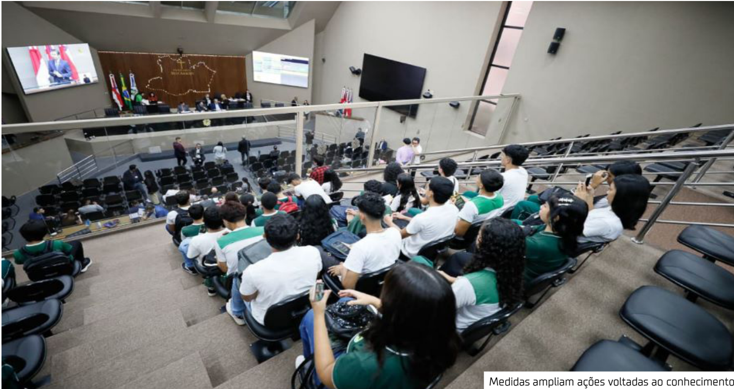
Medidas ampliam ações voltadas ao conhecimento

A iniciativa passa a integrar ações já desenvolvidas pela Escola do Legislativo, como Parlamento Jovem, Educan-