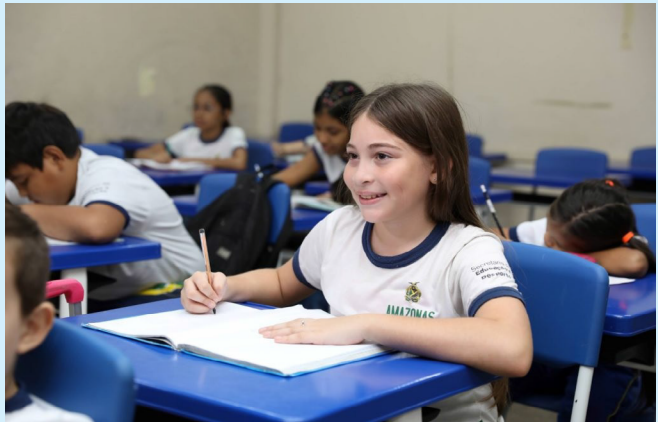
Escolas públicas iniciam transferências de alunos