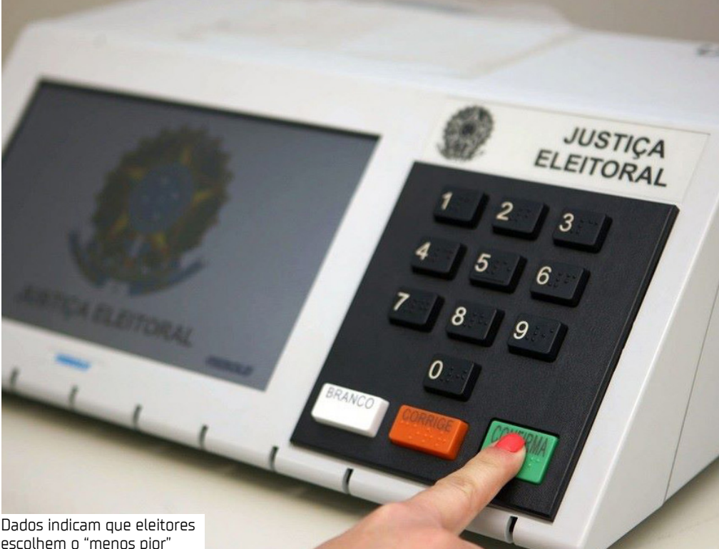
Dados indicam que eleitores escolhem o "menos pior"