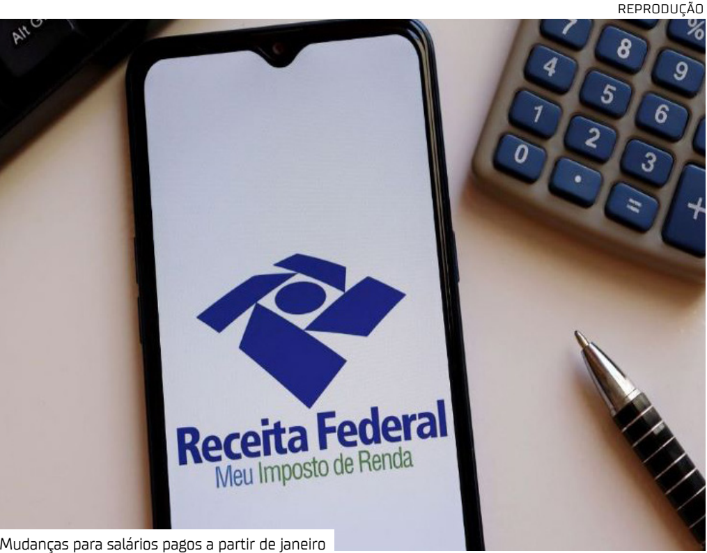
Mudanças para salários pagos a partir de janeiro

Quem tem mais de uma fonte de renda precisa complementar o imposto na declaração anual, mesmo que cada rendimento isolado seja inferior a R$ 5 mil.