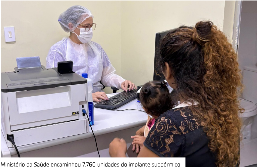
Ministério da Saúde encaminhou 7.760 unidades do implante subdérmico

A Prefeitura de Manaus, por meio da Secretaria Municipal de Saúde (Sems), iniciou a oferta de contraceptivo subdérmico liberador de etonogestrel, estabelecendo nesse primeiro momento o atendimento prioritário de adolescentes (a partir de 14 anos) e mulheres em situação de vulnerabilidade social.