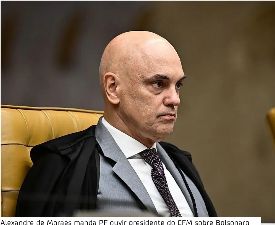
Alexandre de Moraes manda PF ouvir presidente do CFM sobre Bolsonaro

Segundo Moraes, a ação do Conselho é ilegal e a entidade não tem competência de fiscalização neste caso. A PF deve ouvir o presidente