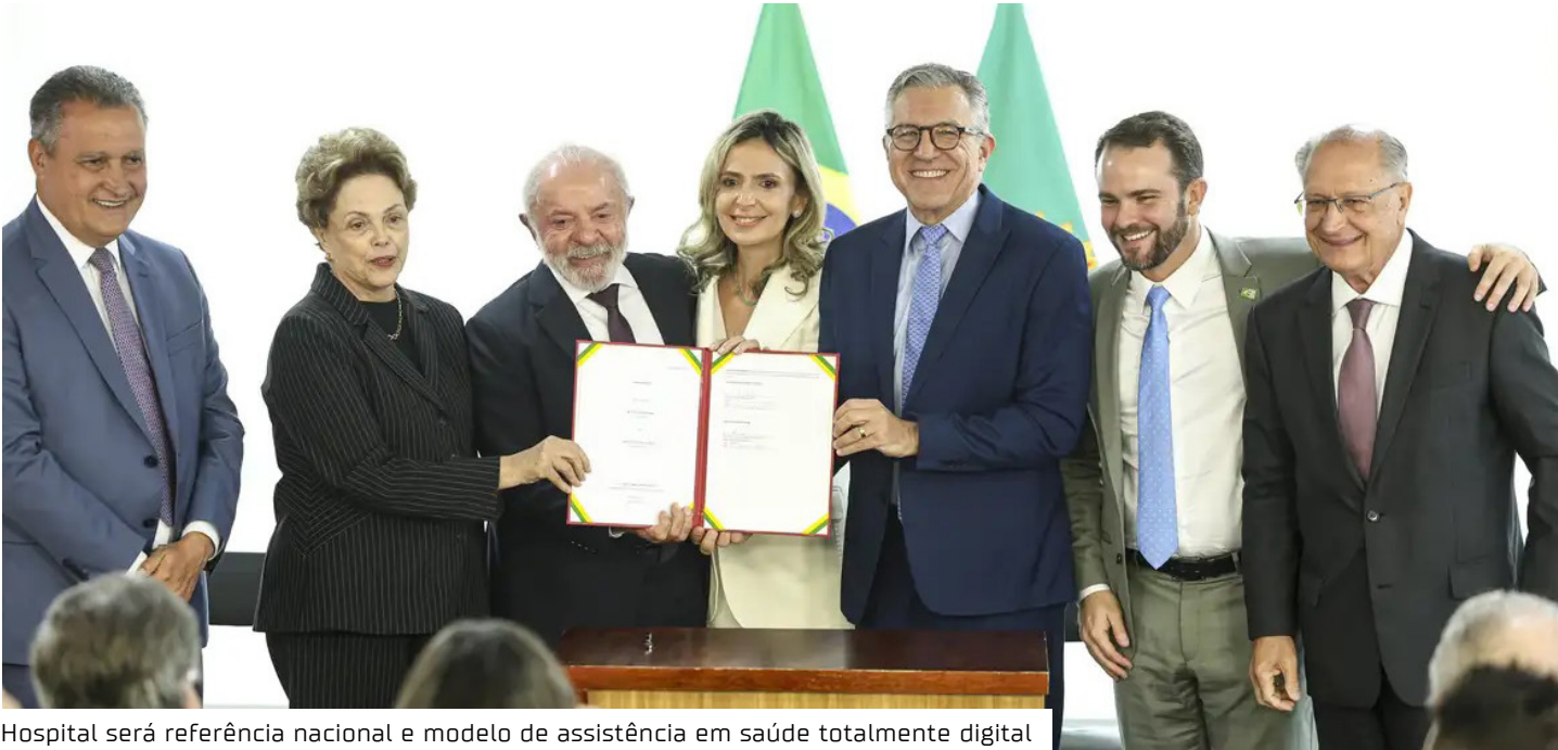
Hospital será referência nacional e modelo de assistência em saúde totalmente digital

serviços inteligentes com 14 unidades de terapia intensiva (UTIs) automatizadas, que funcionarão de forma interligada em diversos estados. A modernização de hospitais de excelência do Sistema Único de Saúde (SUS) também faz parte do projeto. O novo hospital vinculado à Universidade de São Paulo (USP) terá um setor de emergência com 250 leitos e capacidade para atender 200 mil pacientes por ano. A Unidade de Terapia Intensiva (UTI) contará com 350 leitos conectada com as UTIs inteligentes. Haverá 25 salas para cirurgia. A previsão para que a unidade fique pronta é de três a quatro anos. Os serviços inteligentes de saúde usam infraestrutura com tecnologias digitais para otimizar processos e melhorar os resultados para os pacientes. Segundo o ministério, o primeiro hospital inteligente poderá reduzir em mais de cinco vezes o tempo de espera por atendimento especializado em situações de urgência e emergência. Também foi anunciada a modernização de hospitais do SUS da Universidade Federal