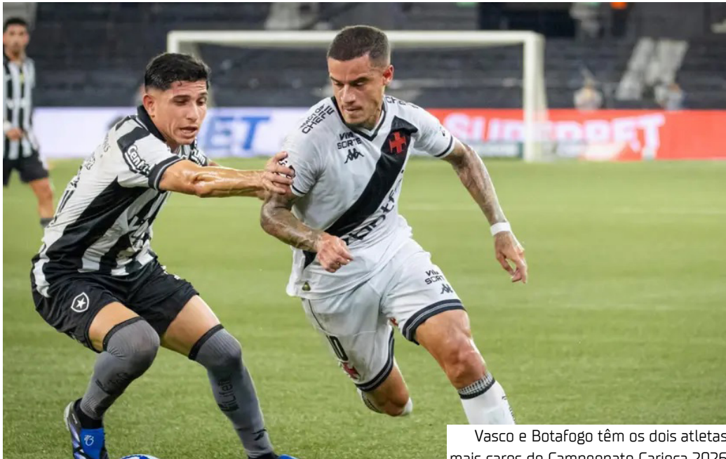
Vasco e Botafogo têm os dois atletas mais caros do Campeonato Carioca 2026