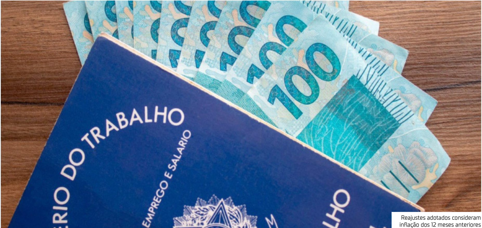
Reajustes adotados consideram inflação dos 12 meses anteriores

Luiz Marinho foi categórico ao frisar que, sem as políticas de valorização do salário mínimo adotadas pelo presidente Luiz Inácio Lula da Silva desde seu primeiro mandato, o valor hoje seria a metade do que vale em 2026. Os reajustes anuais adotados nesta gestão levam em conta a inflação dos 12 meses anteriores, mais a taxa de