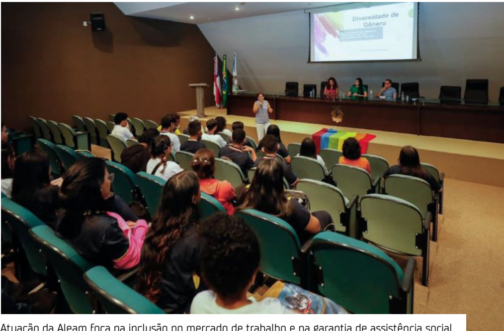
Atuação da Aleam foca na inclusão no mercado de trabalho e na garantia de assistência social

O Brasil celebrou no último dia 29, o Dia da Visibilidade Trans, uma data que marca a luta por dignidade, respeito e garantia de direitos para travestis, mulheres e homens trans. No Amazonas, a Assembleia Legislativa (Aleam) tem sido palco de discussões e da criação de mecanismos legais que buscam tirar essa população da invisibilidade institucional.