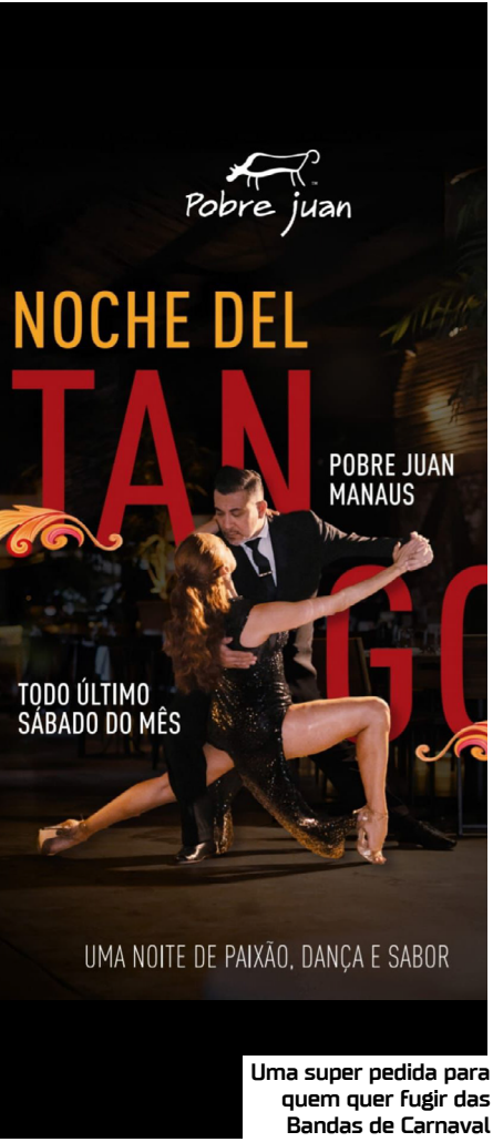
Uma super pedida para quem quer fugir das Bandas de Carnaval

Para quem curte uma programação mais intimista, em um ambiente refinado e paladar delicioso, a opção certa é a Noche Del Tango, que acontece hoje, sábado(31), no Jantar do Restaurante Pobre Juan, no Shopping Ponta Negra. Para quem quer dá uma fugida da programação carnavalesca, essa Noite Argentina é super recomendável.