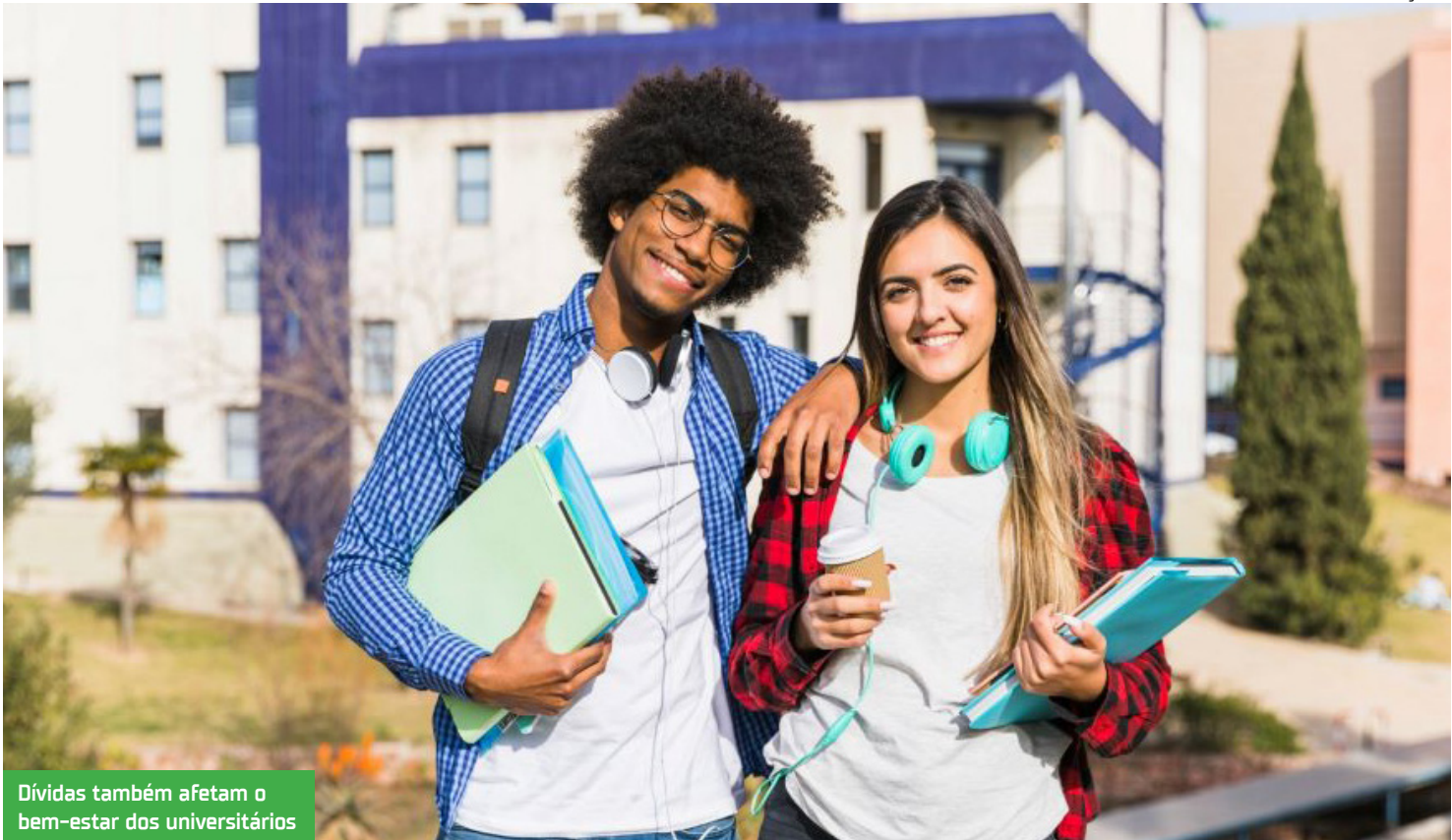
Dívidas também afetam o bem-estar dos universitários

Outro dado preocupante revela que 48% dos que têm dívidas universitárias trancaram o curso por não conseguirem pagar as mensalidades em dia. Além disso, 26% revelam que tiveram problemas de concentração nas aulas por não conseguir pagar as mensa-