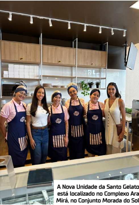
A Nova Unidade da Santo Gelato está localizada no Complexo Ara Mirá, no Conjunto Morada do Sol

Inaugurou na quinta-feira(29), a nova unidade da Santo Gelato. O novo empreendimento fica localizado no Complexo Ara Mirá, no Conjunto Morada do Sol. Um novo endereço, novos encontros e o mesmo cuidado em cada sabor. São mais de 30 sabores, incluindo zero açúcar e zero lactose, e também oferece um cafezinho maravilhoso. Recomendando!!!!