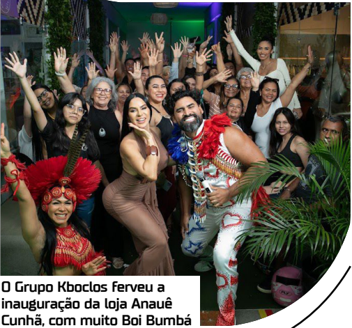
O Grupo Kboclos ferveu a inauguração da loja Anauê Cunha, com muito Boi Bumbá