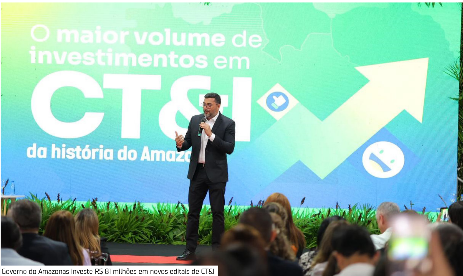
Governo do Amazonas investe R$ 81 milhões em novos editais de CT&I

Os 15 editais contemplam o apoio a pesquisas básicas e aplicadas, formação de recursos humanos, fortalecimento do setor primário, popularização da ciência, manutenção de equipamentos laboratoriais, apoio a coleções bio-