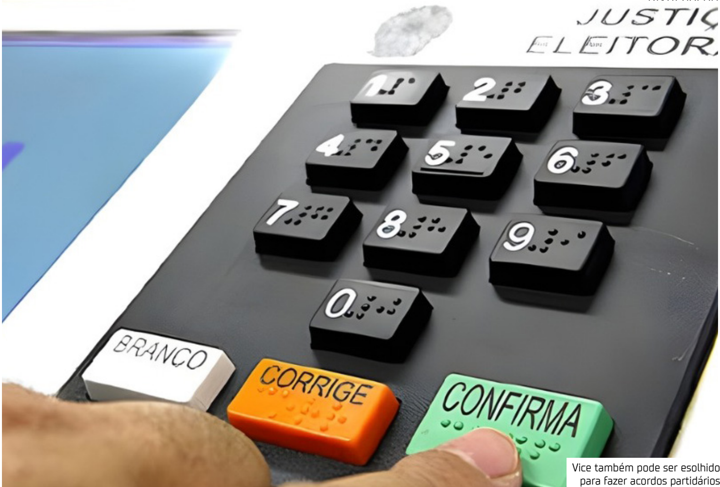
Vice também pode ser escolhido para fazer acordos partidários