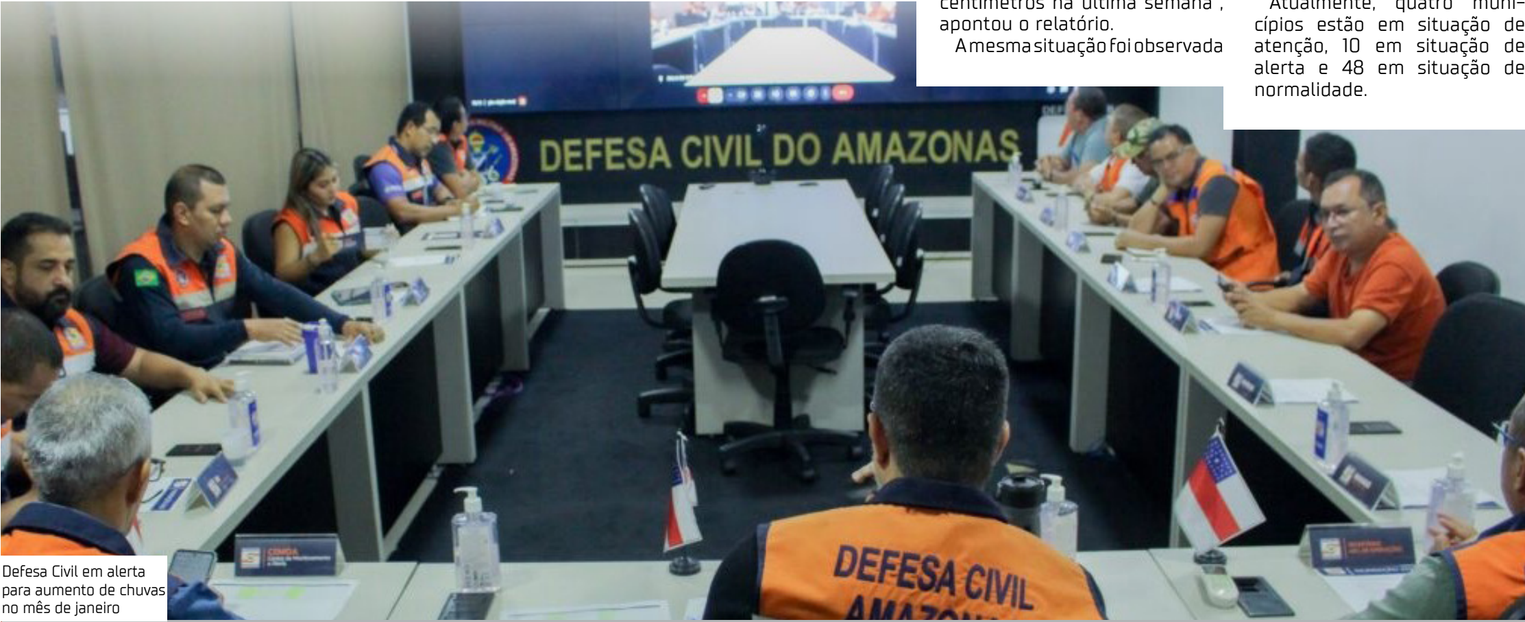
Defesa Civil em alerta para aumento de chuvas no mês de janeiro