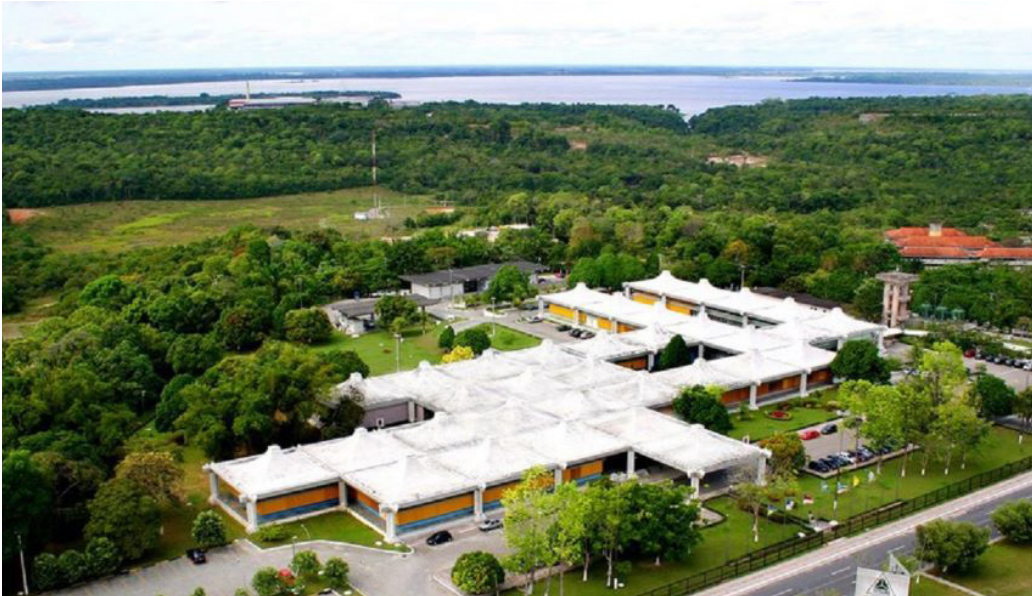
Ainda de acordo com pesquisa, aposentados têm receio de precisar da ajuda de outras pessoas

A Suframa anuncia a abertura das inscrições para a 9ª Reunião do Fórum de Corregedorias da Área Econômica (FOCO.E+). O evento, que ocorrerá entre os dias 10 e 12 de março de 2026, no Auditório Floriano Pacheco (Sede da Autarquia), terá como tema central a “Integridade na Relação Público-Privada”. As inscrições são gratuitas e podem ser feitas por meio do link: https://doity.com.br/ix-reuniao-do-forum-de-corregedorias-da-area-economica . Para o público externo – composto por servidores de outros órgãos, agentes públicos estaduais e municipais e representantes da sociedade civil –, foi disponibilizado um lote específico de 150 vagas.