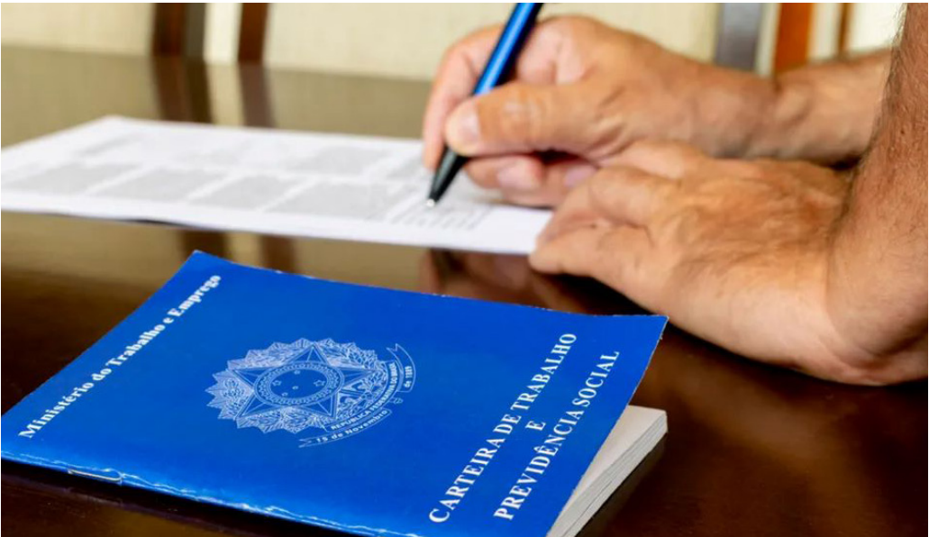
Amazonas apresentou desempenho positivo, no ano passado, em todos os cinco grupamentos de atividades