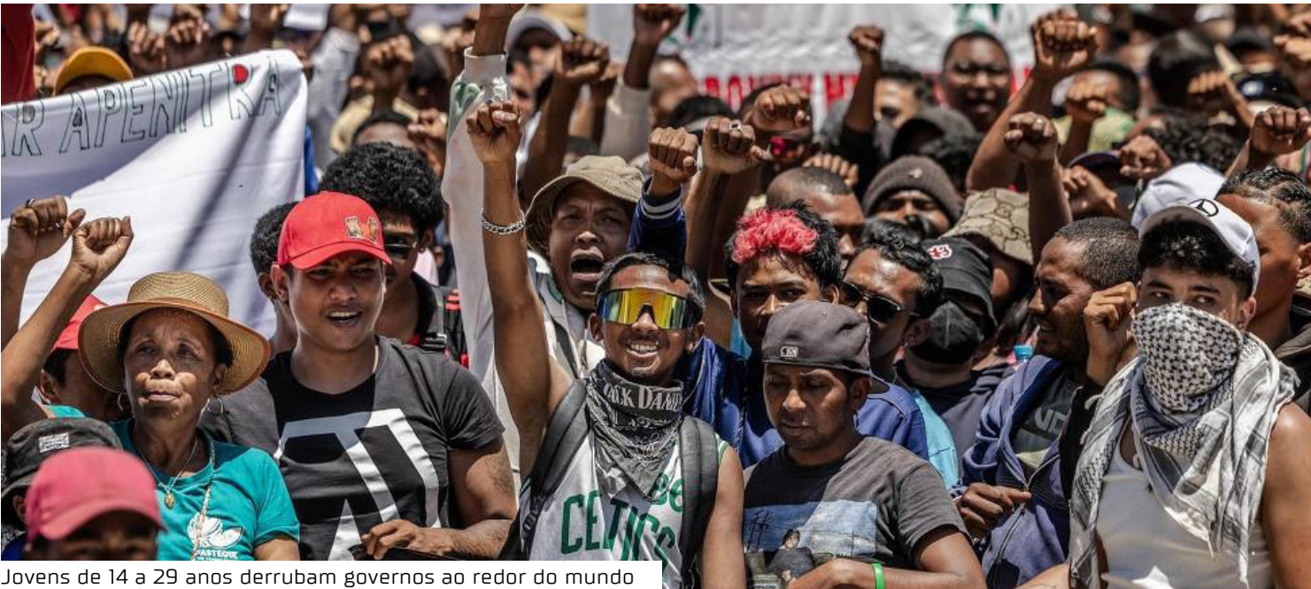
Jovens de 14 a 29 anos derrubam governos ao redor do mundo

Pesquisas acadêmicas apontam uma relação direta entre populações jovens e volatilidade política, sobretudo em contextos de instituições frágeis e alto desemprego. Em um estudo amplamente