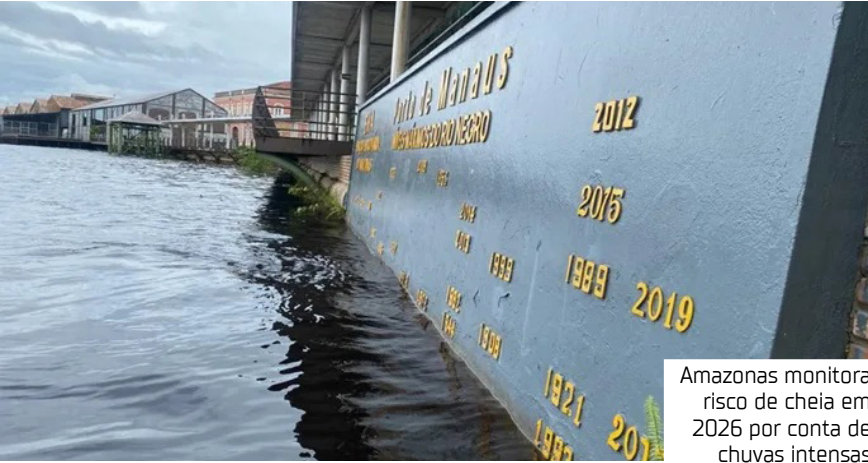
Amazonas monitora risco de cheia em 2026 por conta de chuvas intensas

"A La Niña, por mais que ela esteja de fraca intensidade e uma rápida frequência, ela mexe também com o Amazonas, porque ela também traz chuva, ela aumenta as chuvas na região norte, não em toda a região, mas em partes da região norte, e diminui as chuvas na região sul, esse é o sinal da La Niña", apontou a meteorologista.