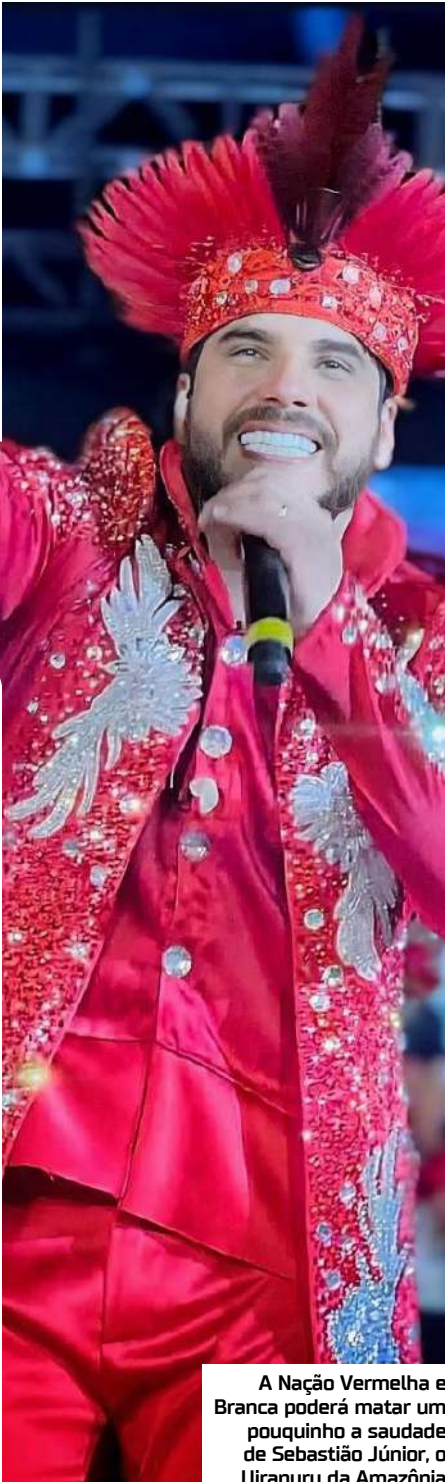
A Nação Vermelha e Branca poderá matar um pouquinho a saudade de Sebastião Júnior, o Uirapuru da Amazônia