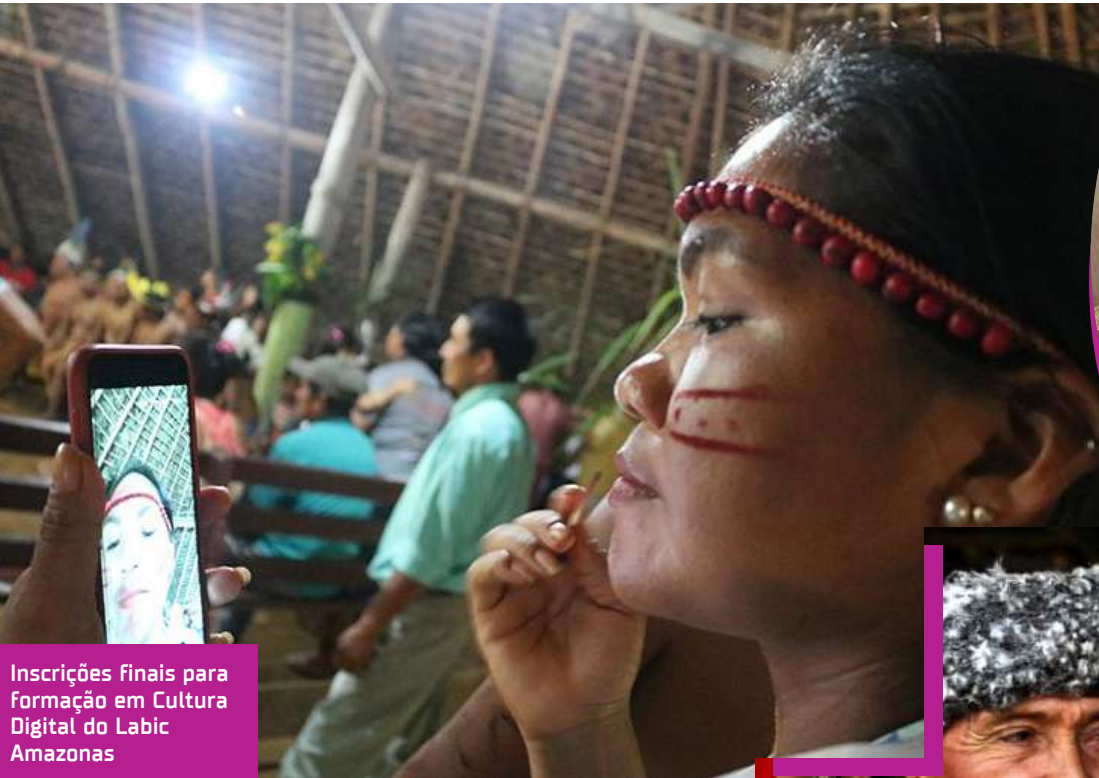
Inscrições finais para Formação em Cultura Digital do Labic Amazonas

A programação inclui oficinas de cultura digital, vivências em aldeias da região e encontros formativos voltados a iniciativas de São Gabriel da Cachoeira e do Rio Negro.