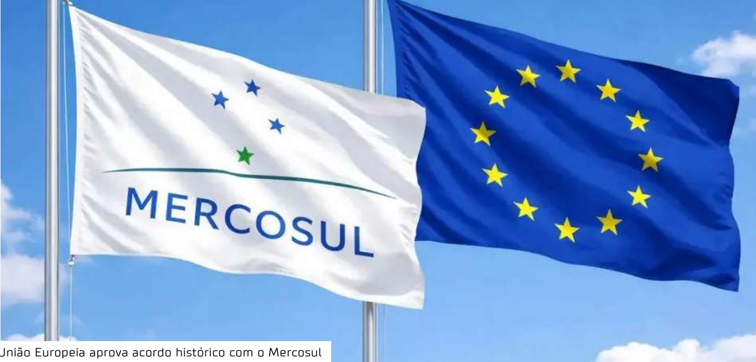
União Europeia aprova acordo histórico com o Mercosul

no momento atual”. “Em um cenário internacional de crescente protecionismo e unilateralismo, o acordo é uma sinalização em favor do comércio internacional como fator para o crescimento econômico”, escreveu o presidente Luiz Inácio Lula da Silva nas redes sociais. Segundo relatos da imprensa europeia, França, Polônia, Hungria, Irlanda e Áustria votaram contra. A Bélgica se absteve. A Itália, como esperado, se uniu à maioria favorável ao pacto. “Nunca me opus ideologicamente ao Mercosul”, declarou a primeira-ministra italiana, Giorgia Meloni, ao criticar a União Europeia por regulamentar o comércio interno enquanto se abre para mercados externos. “Sou a favor de acordos de livre comércio, mas também de regulamentação”, destacou. Impacto econômico O acordo prevê a eliminação de tarifas de importação sobre 91% das mercadorias comercializadas entre os dois blocos. Segundo estimativas europeias, as exportações da UE para o Mercosul poderão crescer até 39%, com a criação