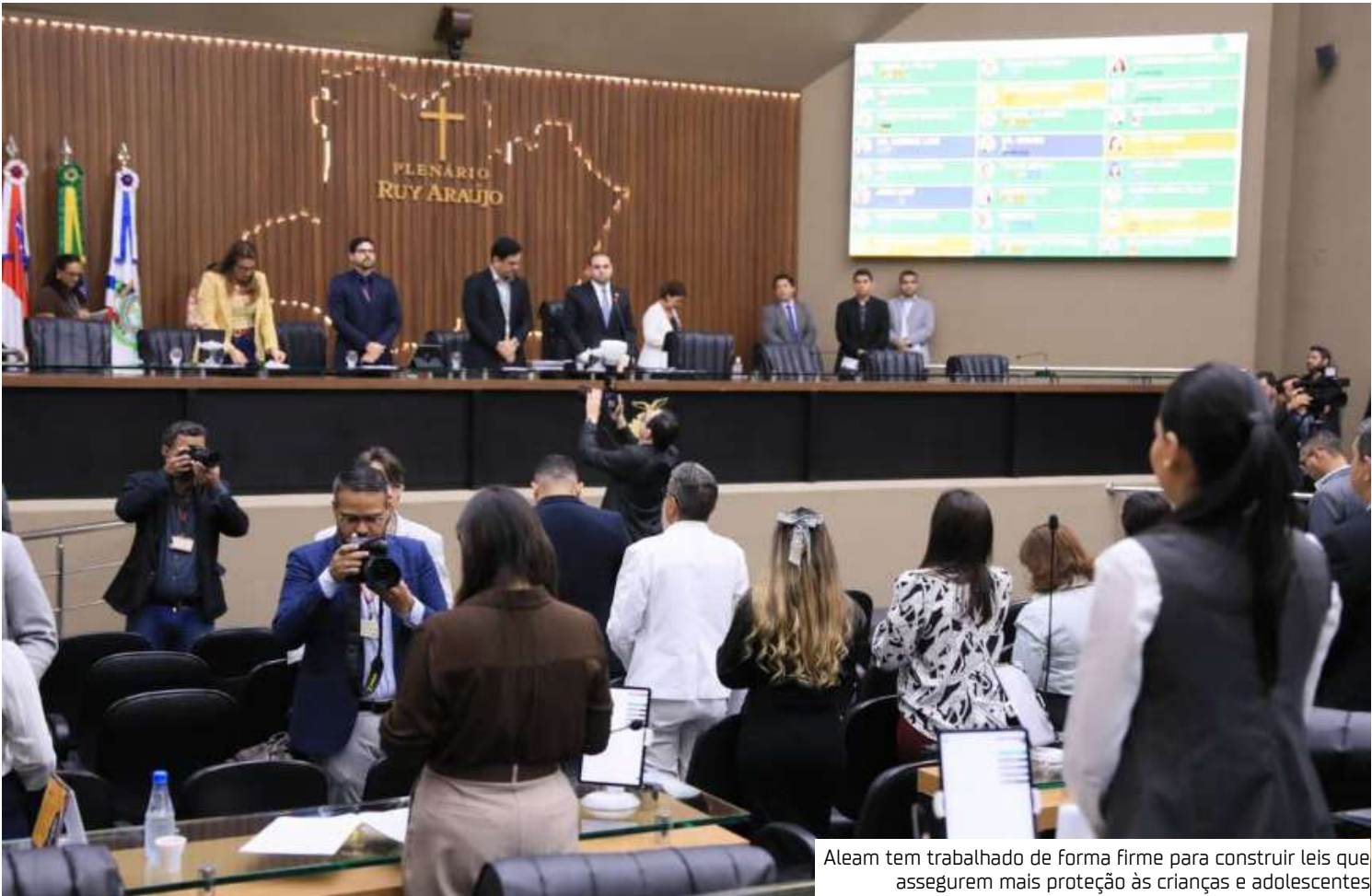
Aleam tem trabalho de forma firme para construir leis que assegurem mais proteção às crianças e adolescentes

A Lei estabelece que todas as unidades de saúde públicas e privadas do Amazonas devem notificar, de forma compulsória, o Sistema Estadual de Vigilância em Saúde sobre casos de acidentes domésticos ou de lazer que resultem em morte, hospitalização ou atendimento de emergência envolvendo crianças e adolescentes de 0 a 14 anos.