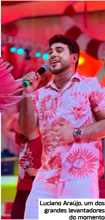
Luciano Araújo, um dos grandes levantadores do momento