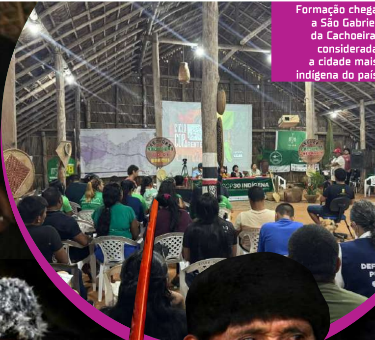
Rony Santos Formação chega a São Gabriel da Cachoeira, considerada a cidade mais indígena do país

As inscrições foram prorrogadas até 11 de janeiro de 2025 e devem ser feitas exclusivamente por formulário online. O preenchimento é a principal etapa de seleção das propostas.