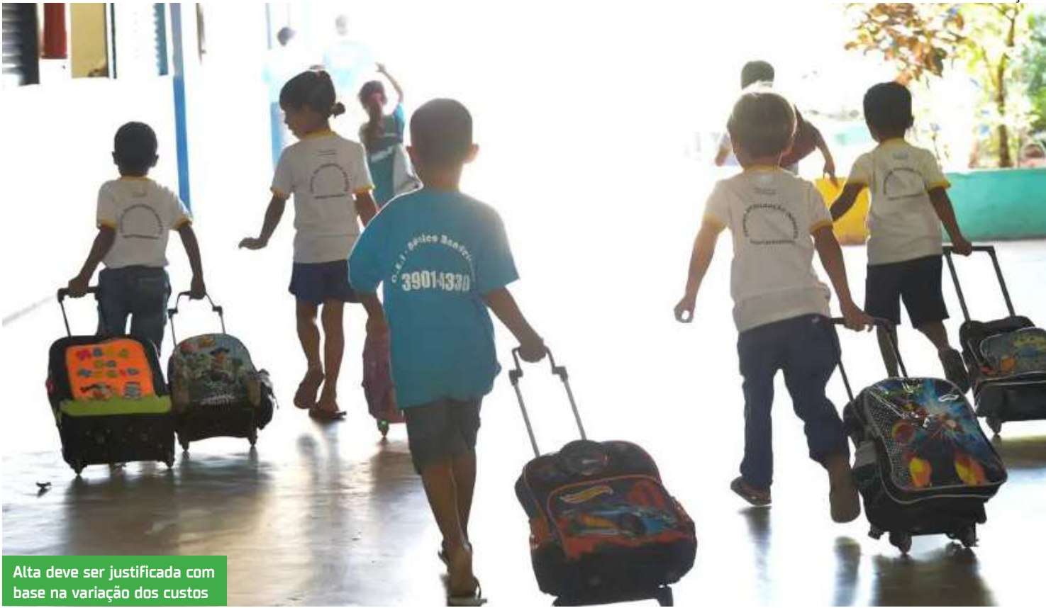
Alta deve ser justificada com base na variação dos custos

A maioria das instituições aplicou aumentos seguindo a prática anual prevista em lei e com base na variação dos custos operacionais. Levantamentos indicam que o percentual médio de reajuste ficou entre 7% e 12%,