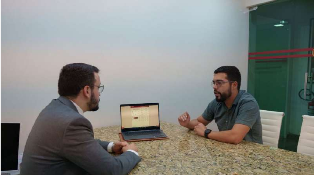
Especialistas apontam que, ao longo de dois anos, haverá mais opções e competitividade ao setor

A Lei nº 15.269/2025 instituiu o novo marco regulatório do setor elétrico brasileiro e marca um passo importante na modernização das regras que orientam o mercado de energia no país. Sancionada em 24 de novembro de 2025, a norma é resultado da Medida Provisória nº 1.304/2025 e foi publicada com vetos pelo Poder Executivo.