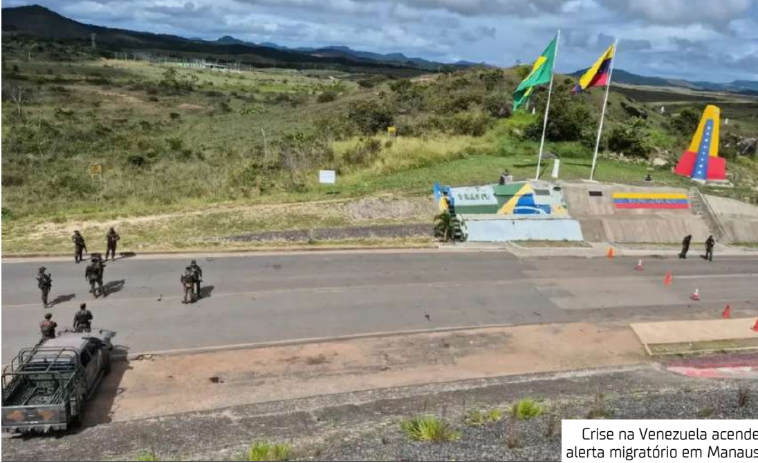
Crise na Venezuela acende alerta migratório em Manaus