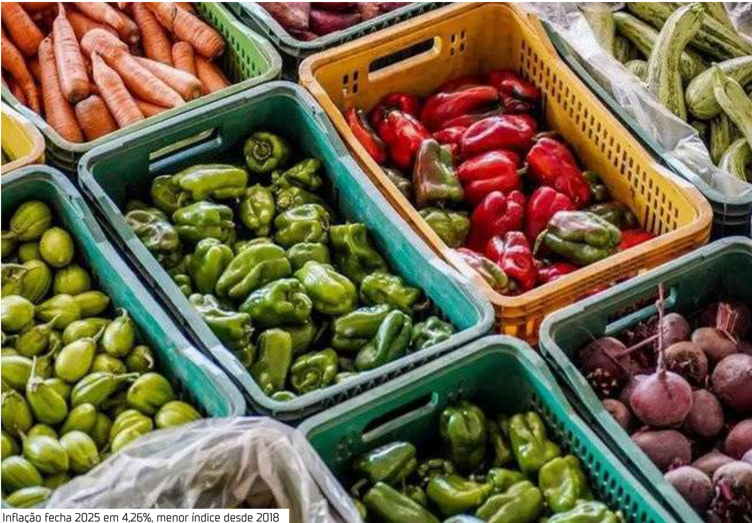
Inflação fecha 2025 em 4,26%, menor índice desde 2018

A energia elétrica exerceu o maior impacto individual sobre a inflação de 2025. Entre os 377 subitens que têm seus preços considerados no cálculo do IPCA, a energia elétrica residencial