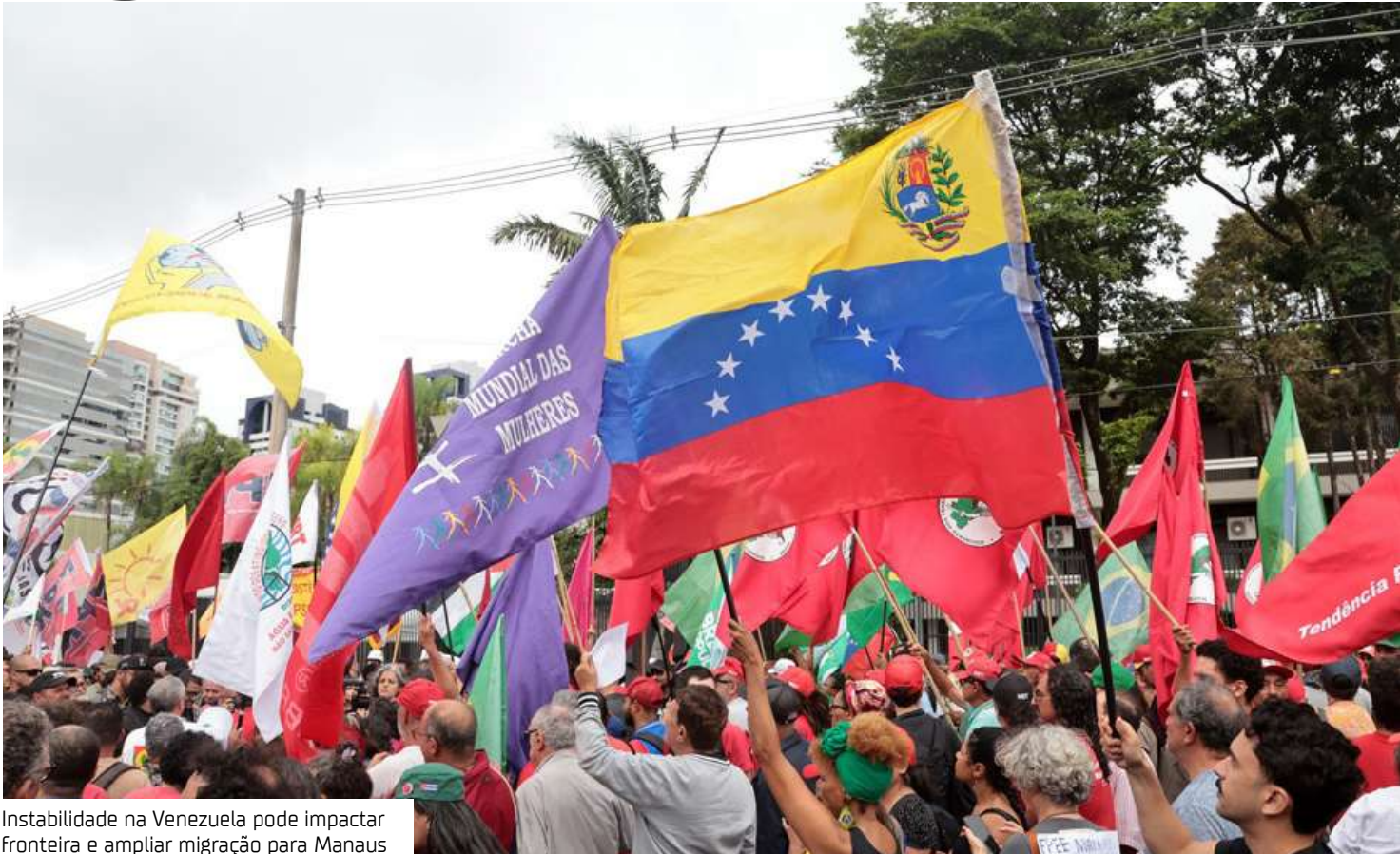
Instabilidade na Venezuela pode impactar fronteira e ampliar migração para Manaus

“No início, trouxe medo, porque ninguém quer mais violência. Mas, com o passar