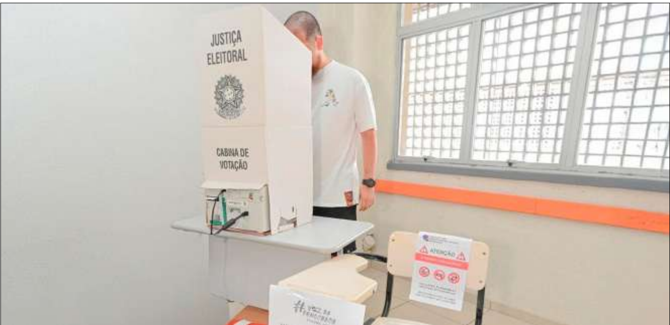
JÚNIOR SOUZA/ TRE-AM

Projeção para 2026 Antes mesmo da largada oficial do calendário eleitoral, o Partido dos Trabalhadores (PT) no Amazonas já se movi-