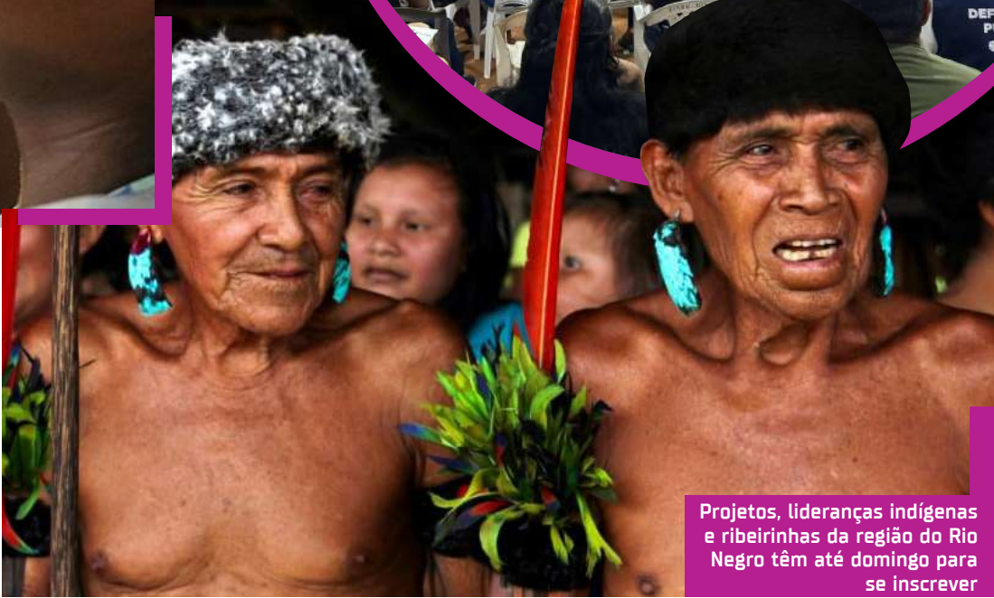
Projetos, lideranças indígenas e ribeirinhas da região do Rio Negro têm até domingo para se inscrever

Antes de enviar, é essencial ler a Chamada Pública disponível junto ao formulário.