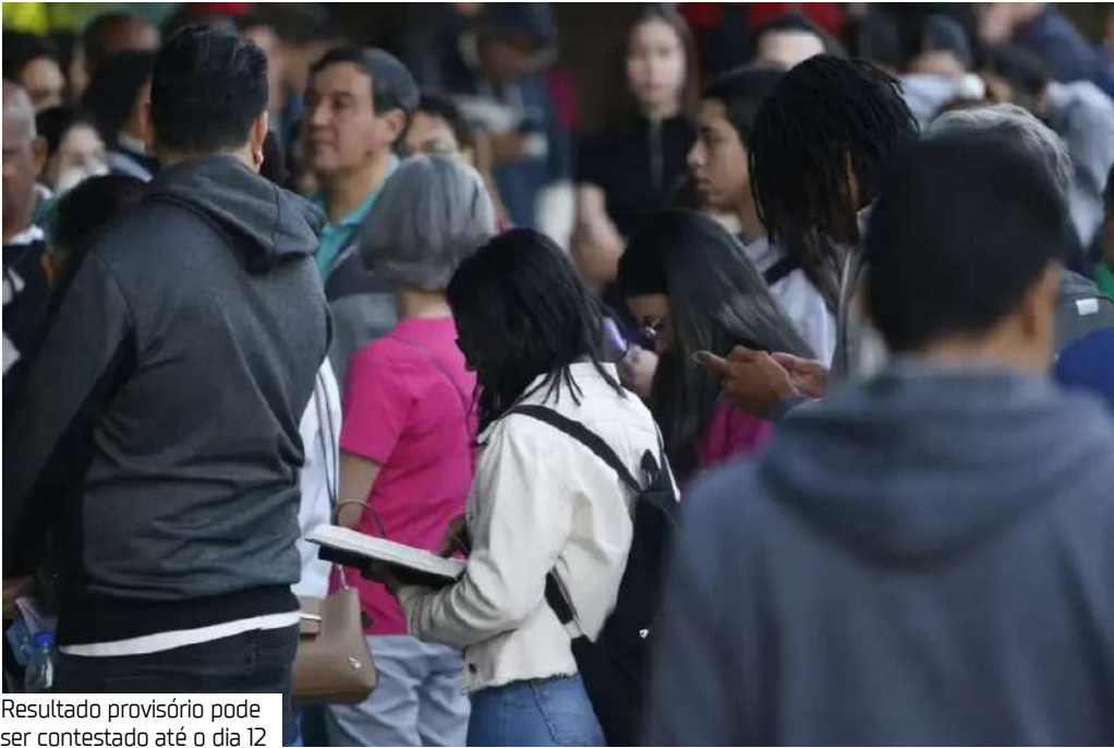
Resultado provisório pode ser contestado até o dia 12