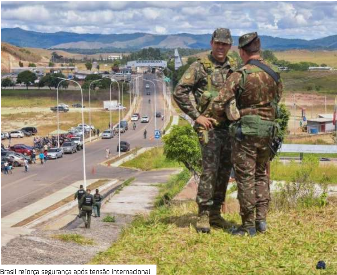
Brasil reforça segurança após tensão internacional