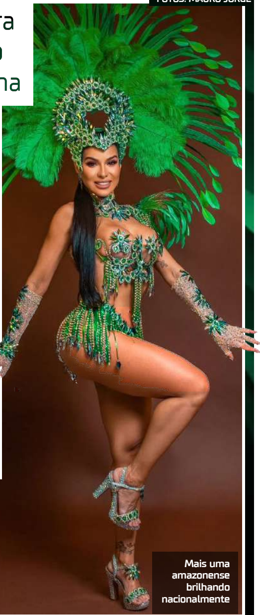
Mais uma amazonense brilhando nacionalmente