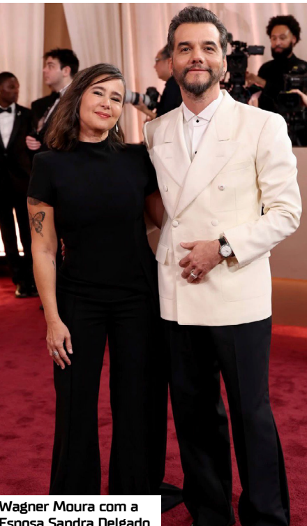
Wagner Moura com a Esposa Sandra Delgado

Nas 3 indicações, o filme O Agente Secreto vence 2 categorias: Melhor Filme em Língua Não-Inglesa e Melhor Ator em Filme Drama para Wagner Moura. A produção é o primeiro filme brasileiro a vencer desde Central do Brasil, em 1999. O longa desbancou grandes produções e atores. Foi realmente histórico. Alô, Brasil!!!!