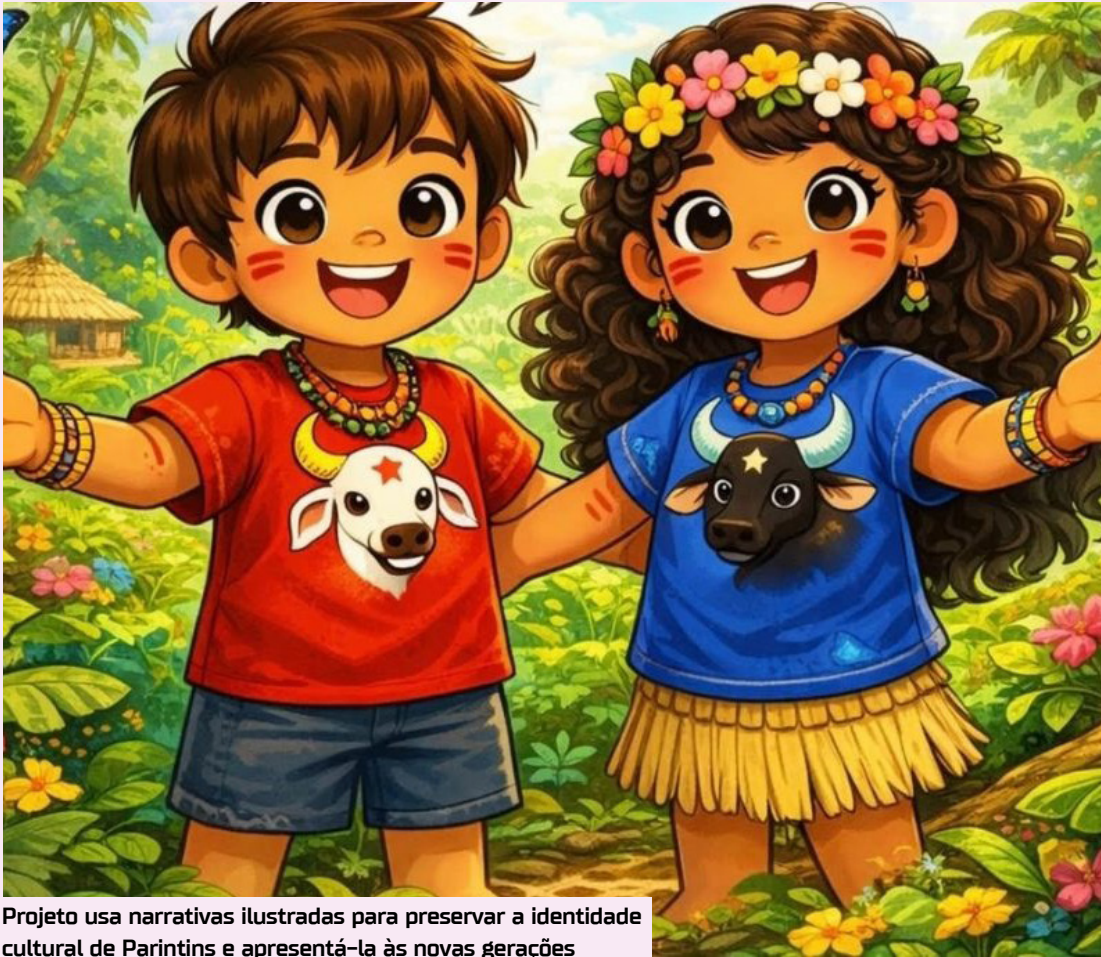
Projeto usa narrativas ilustradas para preservar a identidade cultural de Parintins e apresentá-la às novas gerações