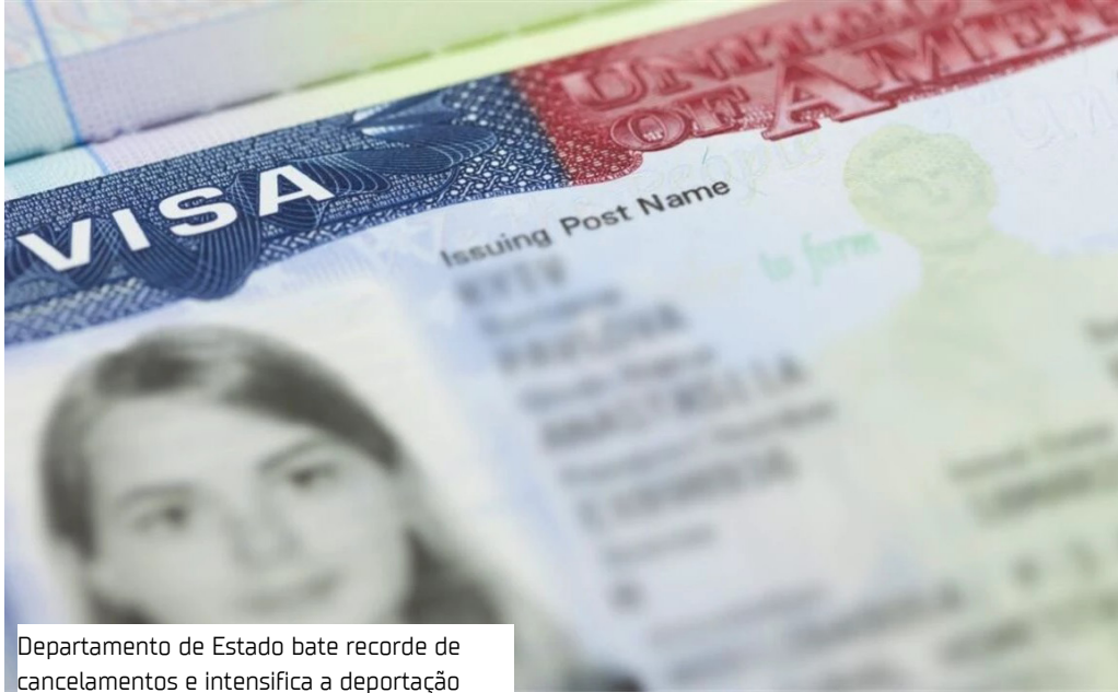
Departamento de Estado bate recorde de cancelamentos e intensifica a deportação

O Departamento de Estado dos Estados Unidos anunciou, ontem (12), a revogação de mais de 100 mil vistos desde o retorno de Donald Trump à Casa Branca, em janeiro de 2025. O órgão classificou o volume como um “novo recorde”, impulsionado por uma política de deportações agressiva.