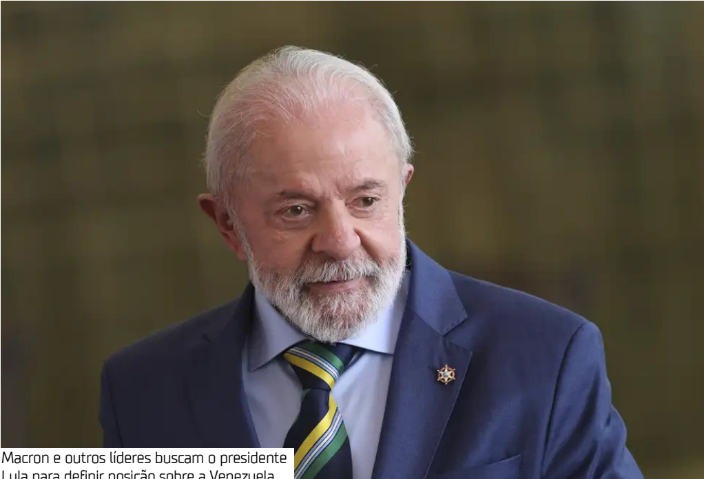
Macron e outros líderes buscam o presidente Lula para definir posição sobre a Venezuela

Líderes europeus e latino-americanos solicitaram chamadas telefônicas com o presidente Luiz Inácio Lula da Silva (PT) para consultar a posição do Brasil sobre a crise na Venezuela. A movimentação diplomática ocorre após a captura de Nicolás Maduro, fato que alterou o cenário político do país vizinho. Auxiliares do presidente informaram que Emmanuel Macron, da França, e Marcelo Rebelo de Sousa, de Portugal, devem ligar para Lula ainda nesta semana. A série de telefonemas dá sequência a intensos contatos inter-