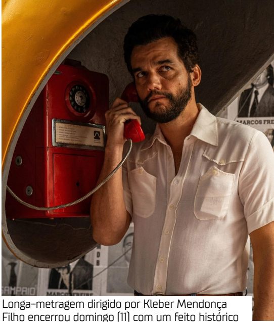
Longa-metragem dirigido por Kleber Mendonça Filho encerrou domingo (11) com um feito histórico