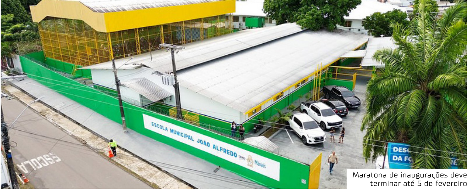
Maratona de inaugurações deve terminar até 5 de fevereiro