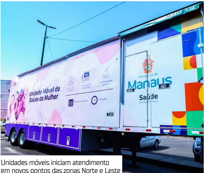
Unidades móveis iniciam atendimento em novos pontos das zonas Norte e Leste

Entre os serviços disponíveis estão consultas médicas e de enfermagem, pré-natal inicial, mamografia, ultrassonografia e planejamento familiar. Além disso, o serviço oferece exames preventivos, vacinação, testes rápidos e dispensação de medicamentos.