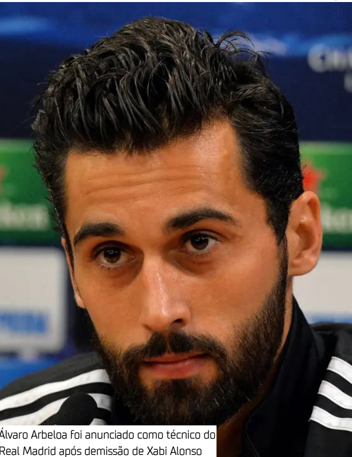
Álvaro Arbeloa foi anunciado como técnico do Real Madrid após demissão de Xabi Alonso

No dia 25 de maio de 2025, Xabi foi anunciado como treinador do Madrid. O ex-jogador chegava ao cargo após um trabalho histórico no Bayer Leverkusen, na Alemanha, legitimado pelas conquistas da Bundesliga e a Copa da Alemanha na temporada 2023/24. Inicialmente, havia assinado contrato por três temporadas e substituiu Carlo Ancelotti, que deixou o comando do time para assumir a Seleção Brasileira.