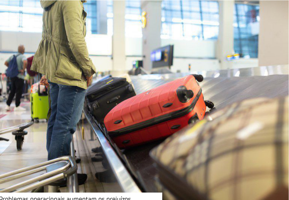
Problemas operacionais aumentam os prejuízos

Atrasos de voos, falhas no embarque e longos períodos de espera sem informações claras seguem afetando passageiros que utilizam o transporte aéreo no Amazonas. Em um contexto de grandes distâncias e oferta limitada de rotas, problemas operacionais ampliam os prejuízos ao consumidor, que encontra amparo no Código de Defesa do Consumidor (CDC) e nas normas da Agência Nacional de Aviação Civil (ANAC). A relação entre passageiro e companhia aérea é regida