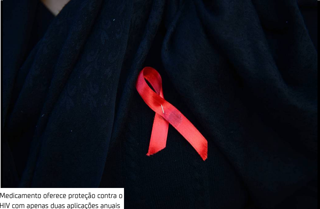
Medicamento oferece proteção contra o HIV com apenas duas aplicações anuais

A Anvisa (Agência Nacional de Vigilância Sanitária) aprovou, nesta segunda-feira (12), o registro do medicamento lenacapavir para profilaxia pré-exposição (PrEP). O fármaco reduz o risco de infecção pelo HIV-1 por via sexual e representa um avanço tecnológico na prevenção da Aids no Brasil.