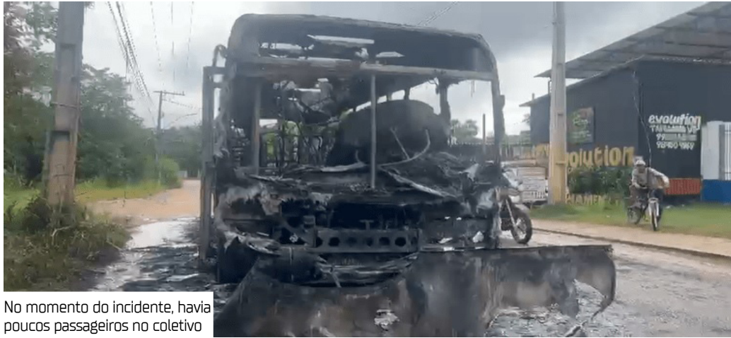
No momento do incidente, havia poucos passageiros no coletivo

Um ônibus da linha 126 foi destruído por um incêndio na manhã desta segunda-feira (12), após apresentar uma pane mecânica, no Parque Riachuelo, bairro Tarumã, Zona Oeste de Manaus. Em menos de dez minutos, as chamas consumiram completamente o veículo.