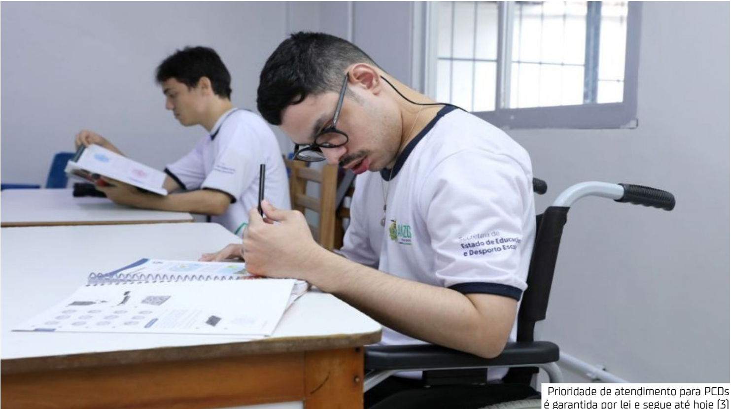
Prioridade de atendimento para PCDs é garantida por lei e segue até hoje (3)

A programação do Calendário de Matrículas de 2026 pode ser acompanhada pelo site matriculas.am.gov.br . De 14 a 15 de janeiro, será o período de transferência entre os alunos da rede que integram o público geral. O processo de matrícula para novos alunos acontece de 16 a