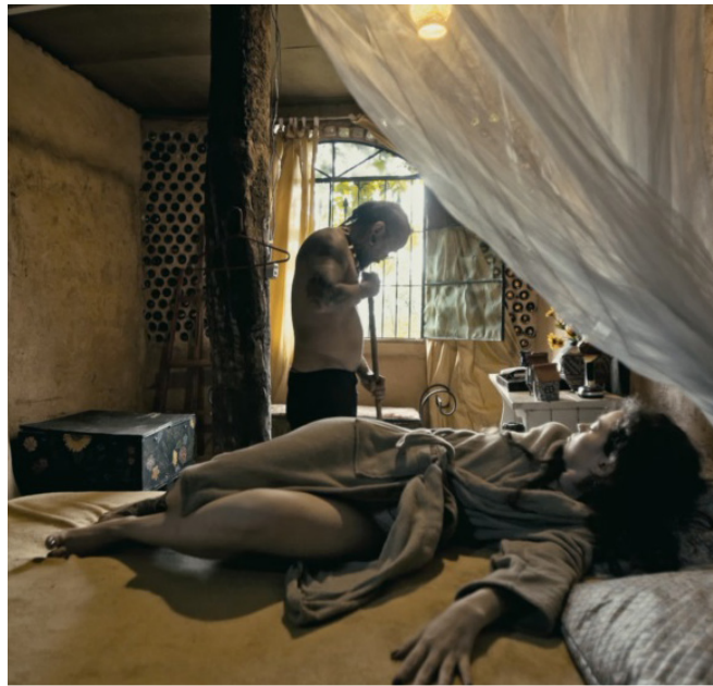
Sessão gratuita terá debate com diretor, elenco e equipe