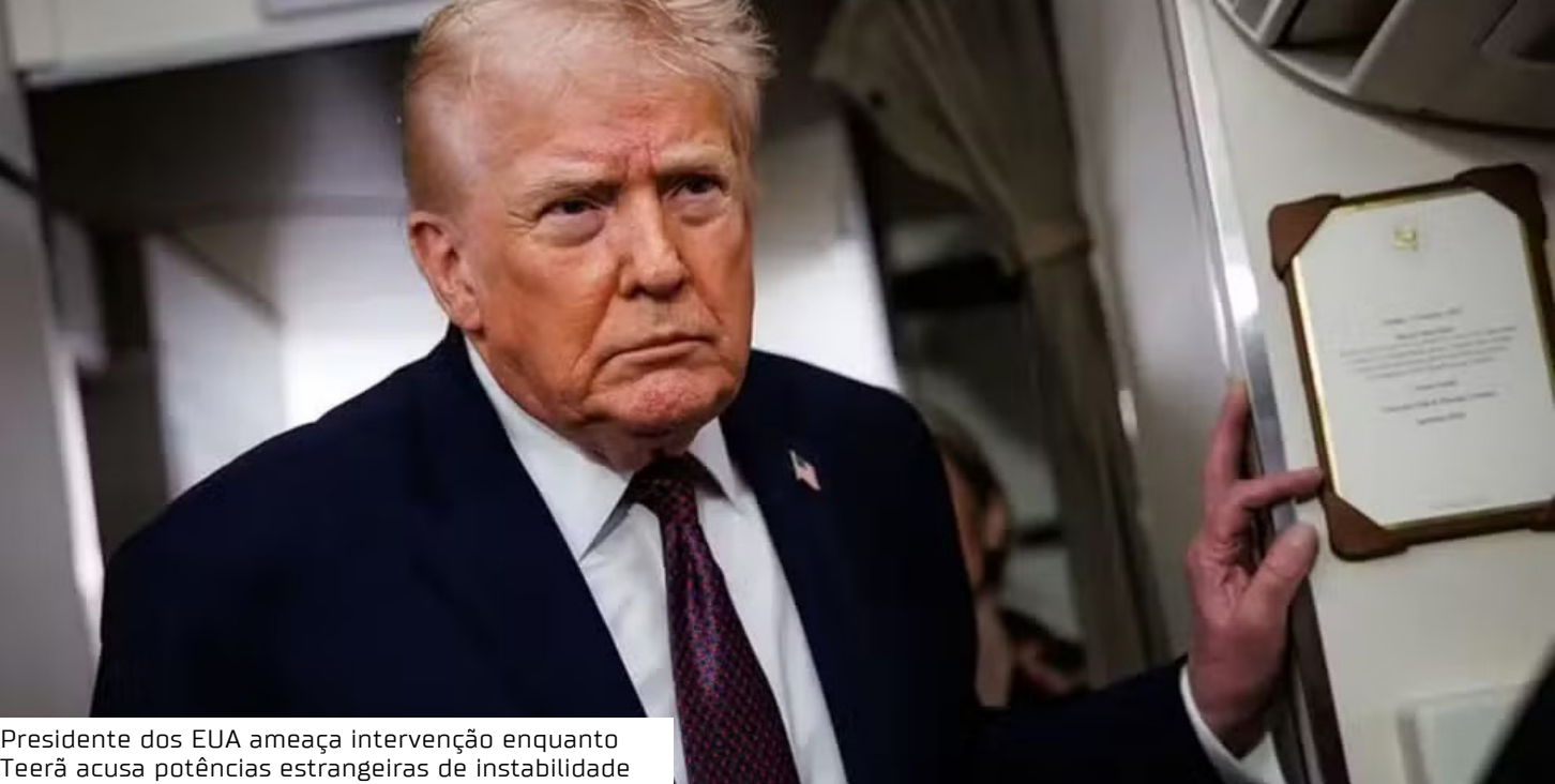
Presidente dos EUA ameaça intervenção enquanto Teerã acusa potências estrangeiras de instabilidade

Crise de legitimidade A revolta começou em dezembro, motivada pela desvalorização da moeda iraniana, mas evoluiu para uma crise de legitimidade do líder supremo, o aiatolá Ali Khamenei. Segundo a HRANA, as autoridades já detiveram pelo menos 10.600 pessoas. Relatos dramáticos descrevem a situação nas ruas de Teerã como “cheias de sangue”. Imagens de um necrotério próximo à capital mostraram cerca de 180 corpos envoltos em mortalhas. Fontes afirmam que o governo realiza enterros apressados antes do amanhecer para dificultar a identificação das vítimas.