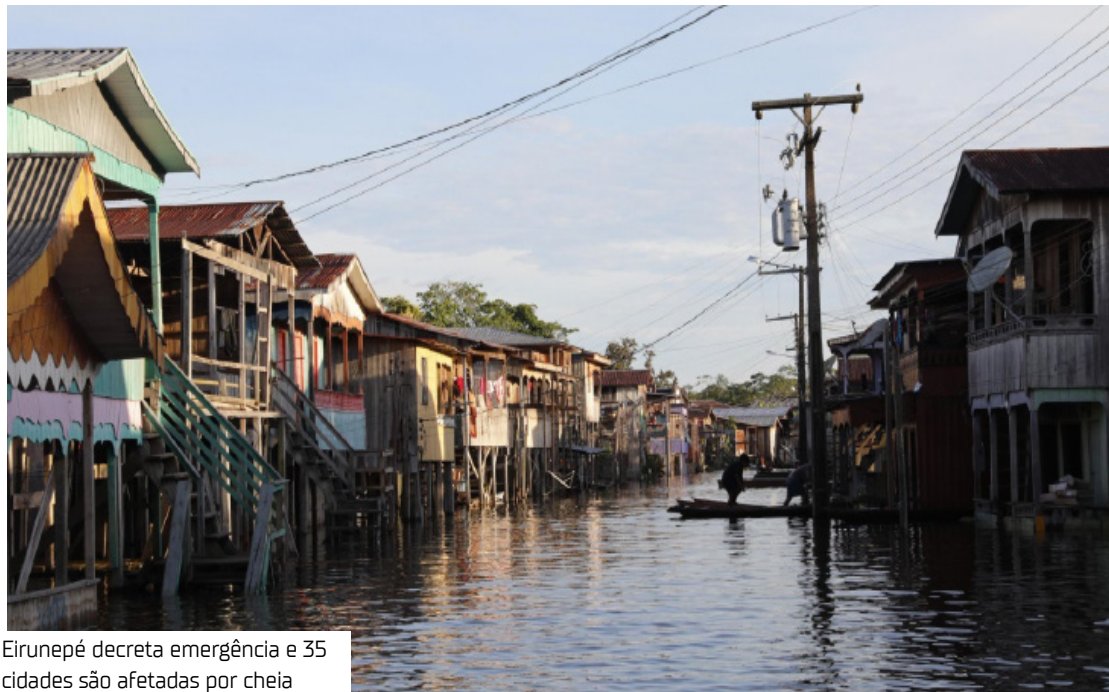
Eirunepé decreta emergência e 35 cidades são afetadas por cheia

lógico aponta 35 cidades diretamente impactadas pelas cheias nos rios da Amazônia, atingindo 173 mil famílias.