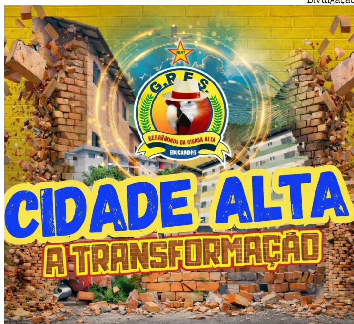
Escola destaca obras e inclusão social no desfile pelo Grupo de Acesso A