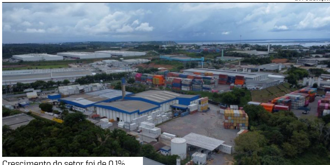
Crescimento do setor foi de 0,1%

Em dezembro, a indústria amazonense apresentou retração de 5,2% em relação ao mês de novembro. Em relação ao mesmo mês do ano anterior, a variação foi de -6,5%. Com o resultado de dezembro, o estado encerra 2025 com crescimento de apenas 0,1% comparado a 2024. Os dados são da Pesquisa Industrial Mensal - Produção Física (PIM-PF), divulgada pelo Instituto Brasileiro de Geografia e Estatística (IBGE).