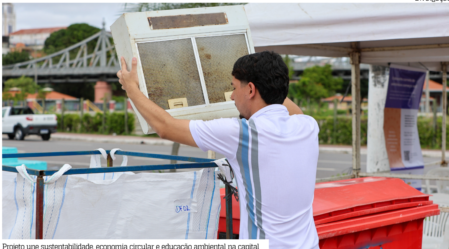
Projeto une sustentabilidade, economia circular e educação ambiental na capital

Coordenado pela Prefeitura de Manaus, por meio da Secretaria Municipal de Limpeza Urbana (Semulsp), o projeto prevê a implantação de 62 Pontos de Entrega Voluntária (PEVs) em todas as zonas da capital, criando uma rede permanente para o descarte ambientalmente correto de equipamentos eletrônicos fora de uso.