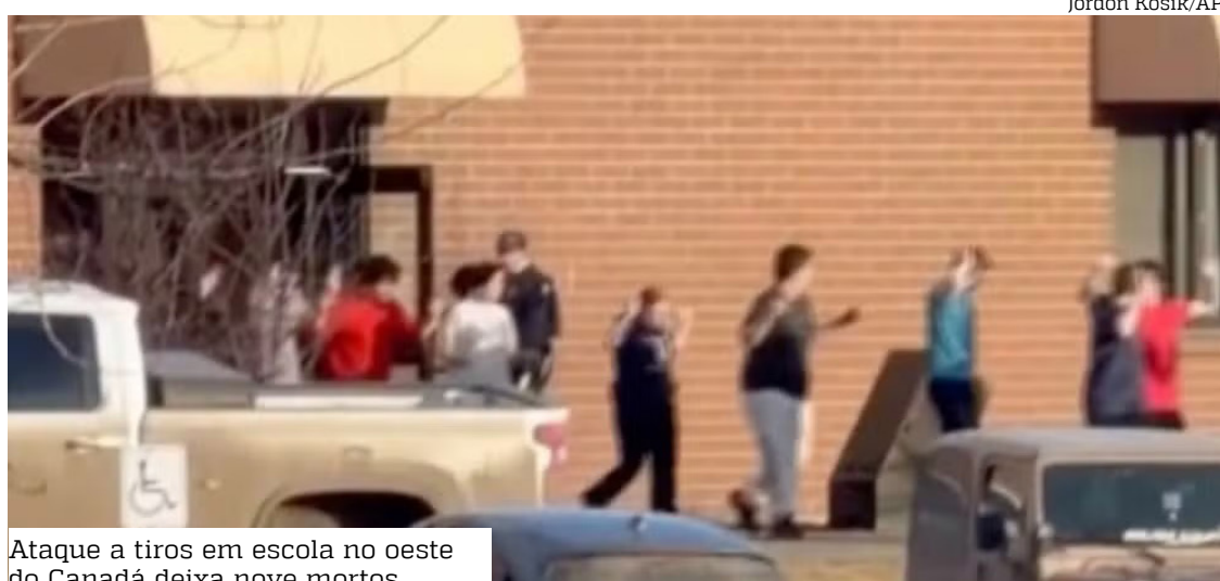
Ataque a tiros em escola no oeste do Canadá deixa nove mortos

Tumbler Ridge é um município remoto com cerca de 2.400 habitantes. A cidade fica no sopé das Montanhas