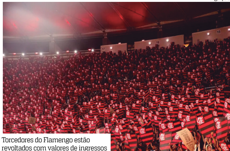
Torcedores do Flamengo estão revoltados com valores de ingressos

O Flamengo divulgou nesta quarta-feira (11) os valores dos ingressos para a final da Recopa Sul-Americana. A equipe Rubro-Negra enfrenta o Lanús, no dia 26 de fevereiro, às 20h30 (de Manaus), no Maracanã, pela segunda partida da decisão do torneio. Para a ocasião, o ingresso mais barato custa R$ 300 (inteira). A entrada é para o Setor Norte, que normalmente é o primeiro a ter os bilhetes esgotados.