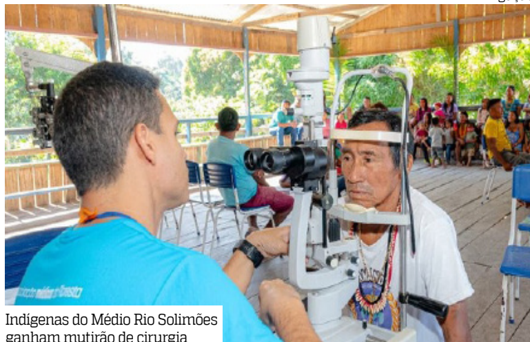
Indígenas do Médio Rio Solimões ganham mutirão de cirurgia

Indígenas da região do Médio Rio Solimões, no Amazonas, começam a recuperar a visão e a qualidade de vida com a etapa cirúrgica do mutirão do programa Agora Tem Especialistas - iniciativa voltada à redução do tempo de espera por consultas, exames e cirurgias especializadas no Sistema Único de Saúde (SUS). A ação ocorre entre os dias 11 e 22 de fevereiro, no município de Itamarati, e atende comunidades acompanhadas pelo Distri-