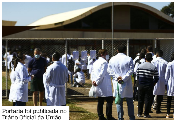
Portaria foi publicada no Diário Oficial da União

A pasta cita a recente expansão de vagas de medicina, notadamente provocada pela judicialização dos pedidos de autorização de novos cursos, pela expansão da oferta de cursos dos sistemas estaduais e distrital de ensino e pela conclusão de processos administrativos relativos a aumento de vagas em cursos já existentes.