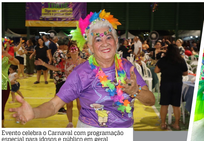
Evento celebra o Carnaval com programação especial para idosos e público em geral

Na sexta-feira (13), a partir das 14h, o "CarnalIdoso" acontecerá no Parque Municipal do Idoso (PMI), localizado na rua Rio Mar, nº 1.324, bairro Nossa Senhora das Graças. Com en-