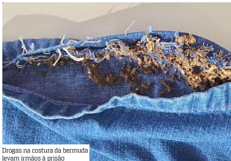
Drogas na costura da bermuda levam irmãos à prisão

Dois irmãos, uma mulher de 30 anos e um homem de 27 anos, foram presos na terça-feira (10), suspeitos de tentar levar drogas durante visita a detentos, no município de Novo Airão (a 116 quilômetros de Manaus, no interior do Amazonas).