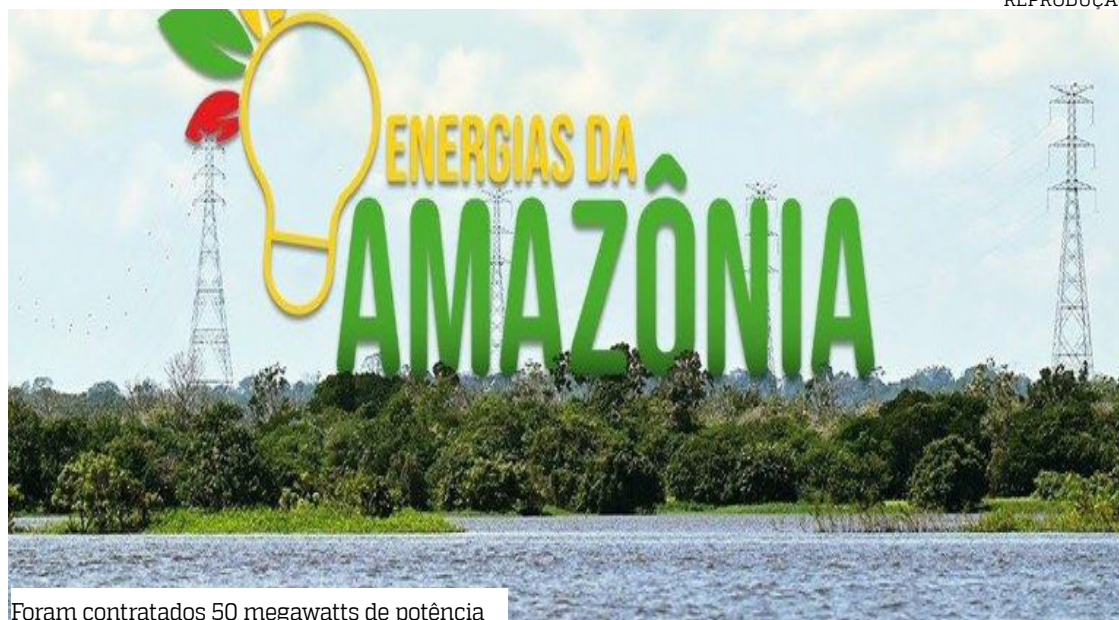
Foram contratados 50 megawatts de potência