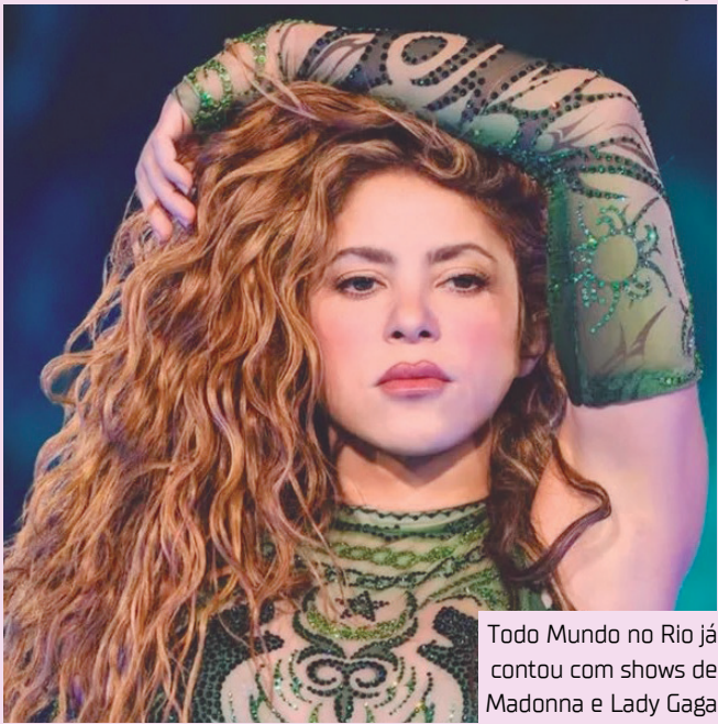
Todo Mundo no Rio já contou com shows de Madonna e Lady Gaga

Madonna reuniu 1,6 milhão de pessoas na orla de Copacabana. Já Lady Gaga atraiu um público de 2,1 milhões de fãs.