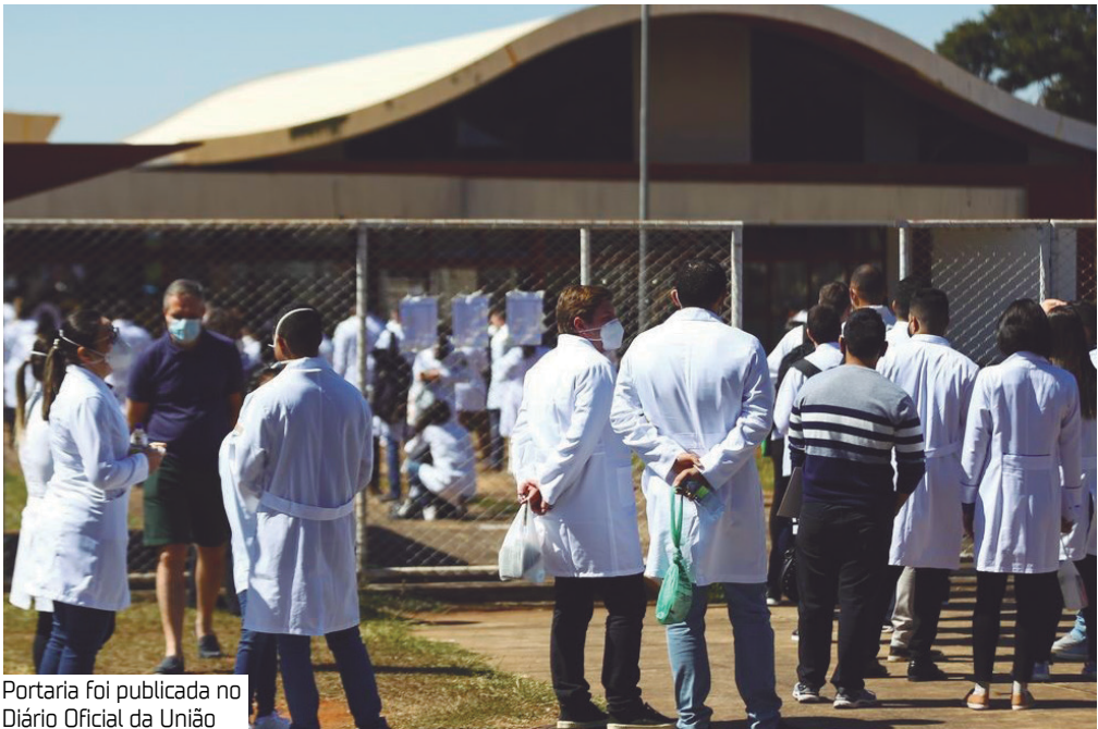
Portaria foi publicada no Diário Oficial da União

dos novos cursos. A pasta cita a recente expansão de vagas de medicina, notadamente provocada pela judicialização dos pedidos de autorização de novos cursos, pela expansão da oferta de cursos dos sistemas estaduais e distrital de ensino e pela conclusão de processos administrativos relativos a aumento de vagas em cursos já existentes. “Diante desse quadro, a manutenção do edital deixaria de atender aos objetivos de ordenação da oferta, redução das desigualdades regionais e garantia de padrão de qualidade que orientam o Programa Mais Médicos”, diz o MEC.