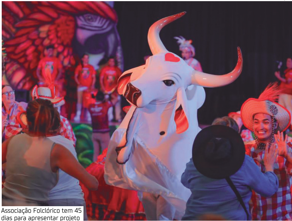
Associação Folclórica tem 45 dias para apresentar projeto