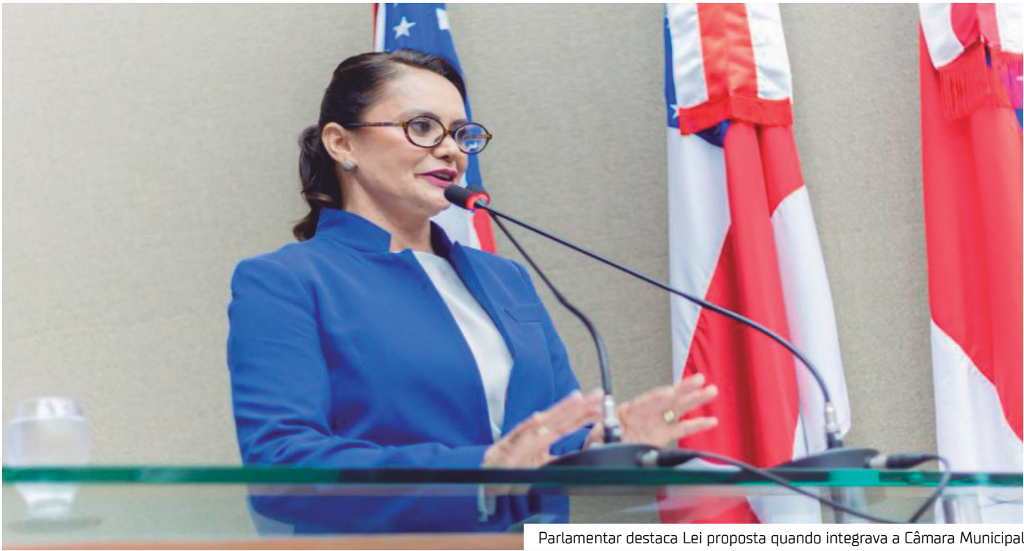
Parlamentar destaca Lei proposta quando integrava a Câmara Municipal

mulheres não começou agora e não termina em um mandato específico. Quando apresentei essa lei, eu pensava na mulher que precisa pedir ajuda sem chamar atenção do agressor. Hoje, na Assembleia, sigo trabalhando para ampliar iniciativas que salvem vidas e levem informação e amparo a todas