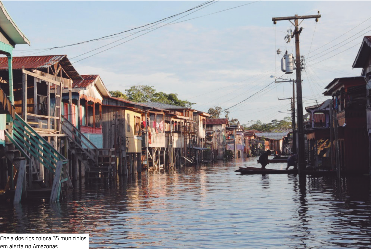
Cheia dos rios coloca 35 municípios em alerta no Amazonas

Até junho, 133.711 famílias foram impactadas, somando aproximadamente 534.829 pessoas. Das nove calhas de rios do Amazonas, três iniciaram o processo de