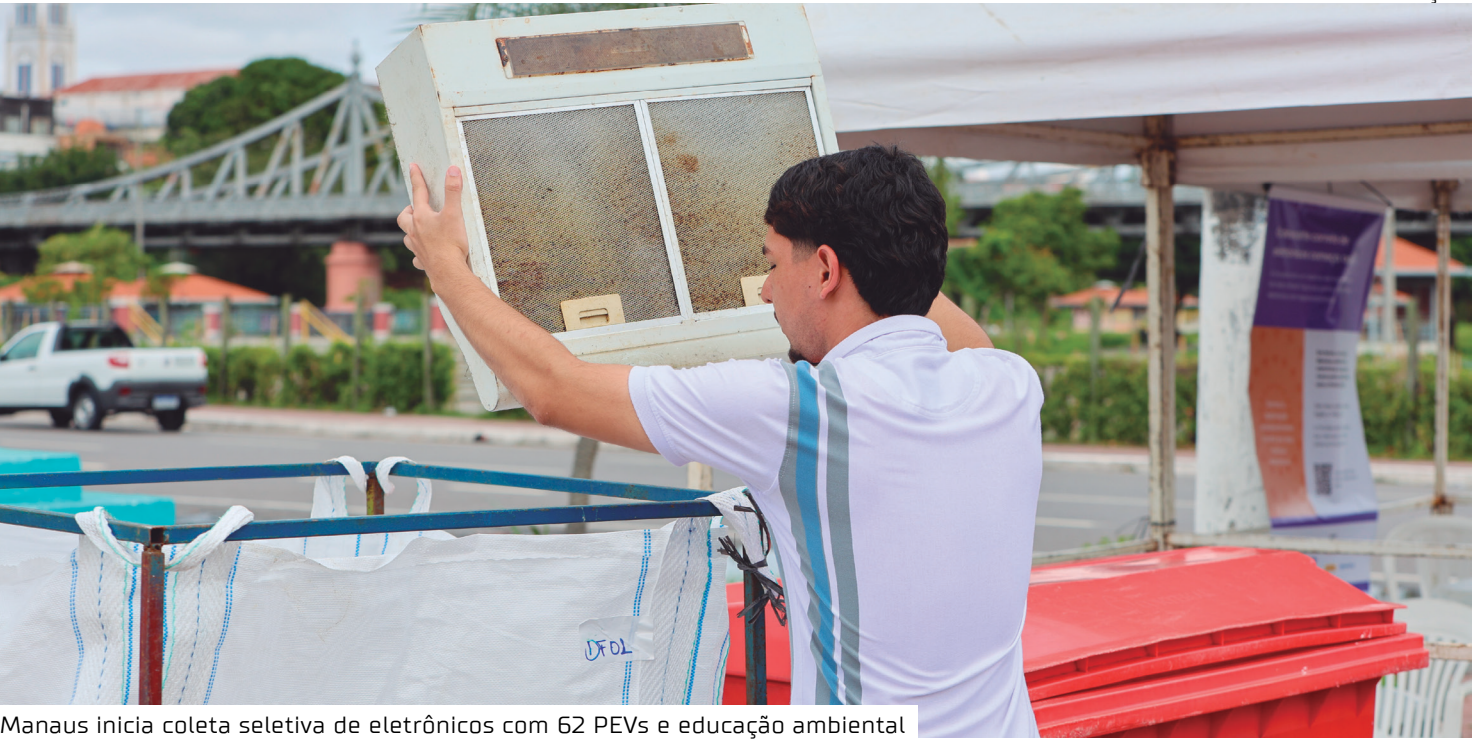
Manaus inicia coleta seletiva de eletrônicos com 62 PEVs e educação ambiental