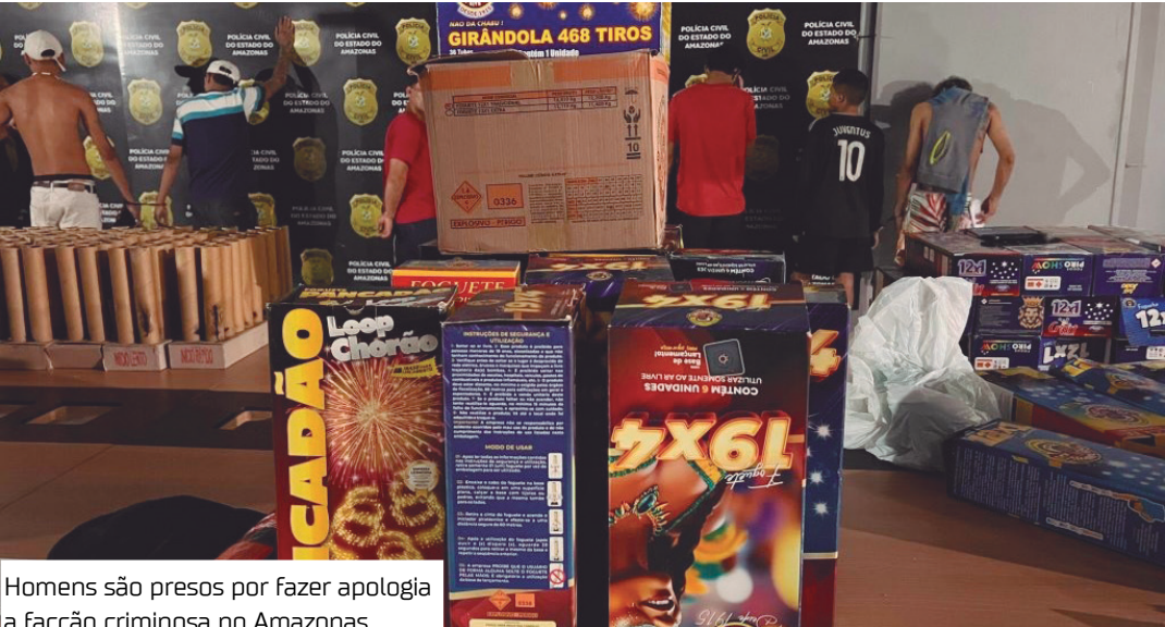
Homens são presos por fazer apologia à facção criminosa no Amazonas

Durante a tarde de terça-feira (10) e a madrugada de ontem (11), as Forças de Segurança deflagraram uma operação policial que resultou na prisão de 37 pessoas por apologia ao crime e na apreensão de cinco adolescentes por ato infracional análogo ao mesmo crime após foguetório da facção criminosa Comando Vermelho (CV), em todas as zonas de Manaus e no interior do estado.