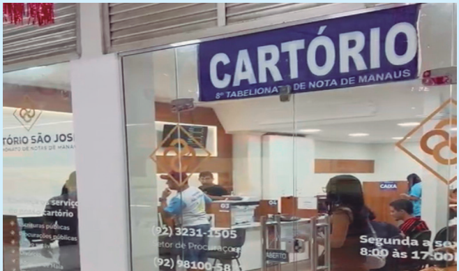
Primeiro cartório de notas amplia acesso a serviços essenciais