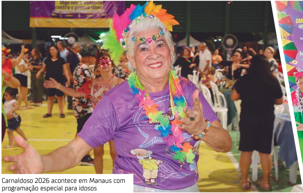
Carnaldoso 2026 acontece em Manaus com programação especial para idosos