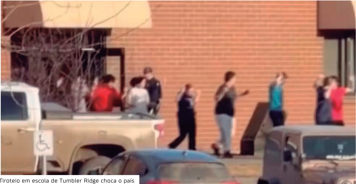
Tiroteio em escola de Tumbler Ridge choca o país

Autoridades lamentam “É difícil saber o que dizer em uma noite como esta. É o tipo de coisa que parece acontecer em outros lugares, não perto de casa”, disse a jornalista o premiê da Colúmbia Britânica, David Eby. Tumbler Ridge é um município remoto com cerca de 2.400 habitantes. A cidade fica no sopé das Montanhas Rochosas, a aproximadamente 1.155 quilômetros de