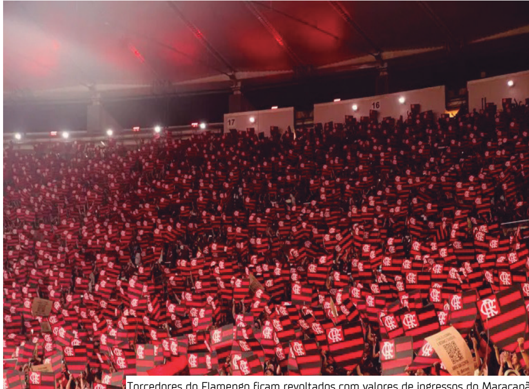
Torcedores do Flamengo ficam revoltados com valores de ingressos do Maracanã