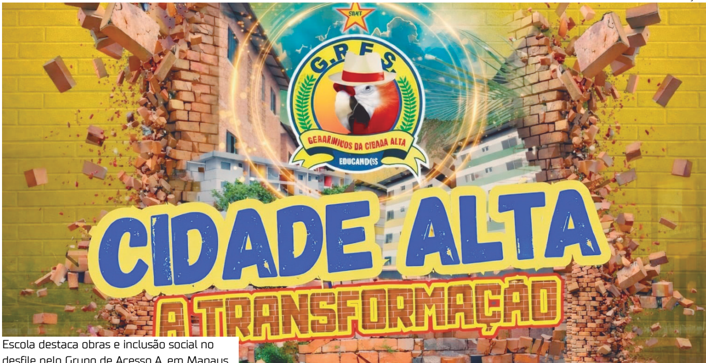
Escola destaca obras e inclusão social no desfile pelo Grupo de Acesso A, em Manaus

Alegorias que recriam conjuntos habitacionais, áreas de lazer revitalizadas e símbolos de transformação urbana vão marcar o desfile do Grêmio Recreativo Escola de Samba Acadêmicos da Cidade Alta no Sambódromo de Manaus, nesta sexta-feira (13).