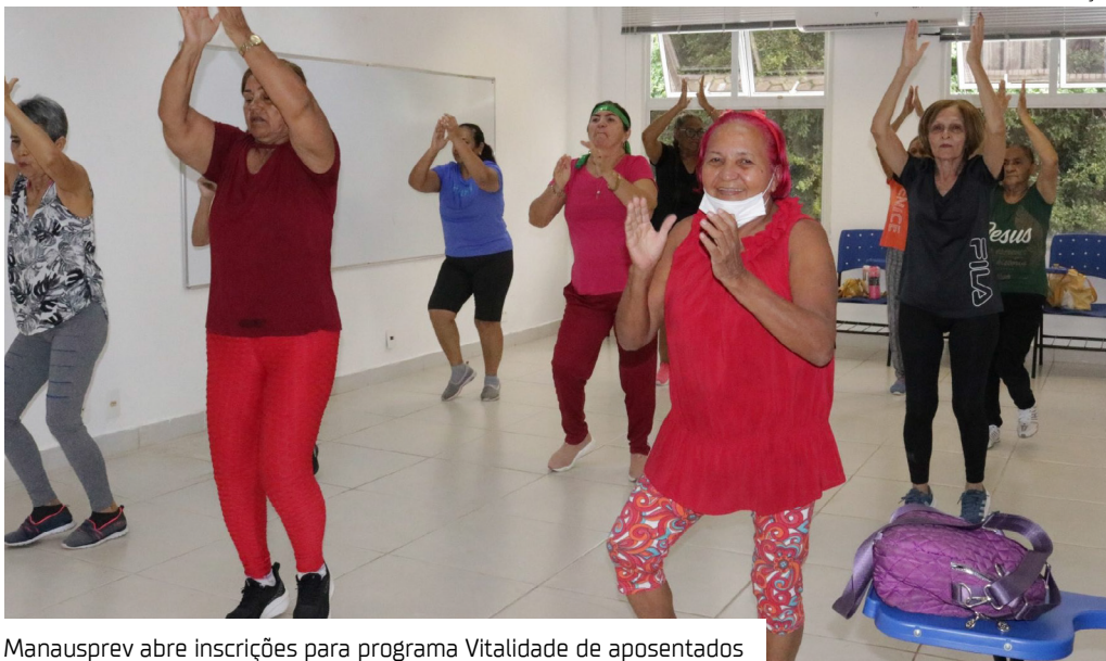
Manausprev abre inscrições para programa Vitalidade de aposentados

“As atividades que vamos desenvolver ao longo dos próximos quatro meses fazem parte da agenda da nossa Política da Qualidade, que prioriza não apenas a gestão eficiente, mas também a promoção da qualidade de vida dos nossos aposentados. Esse cuidado é um compromisso da Manausprev”, destacou.