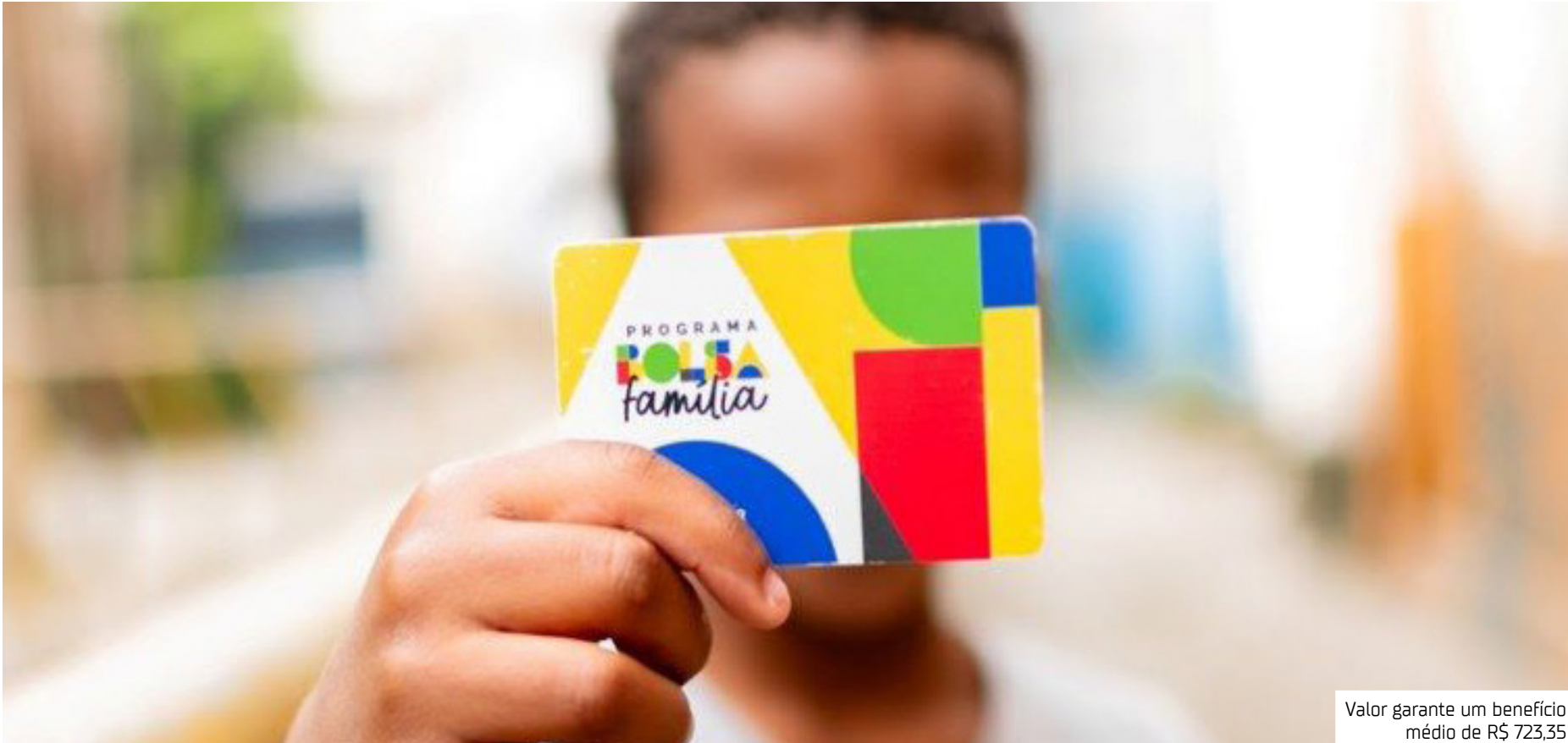
Valor garante um benefício médio de R$ 723,35

No pacote de benefícios incluídos na retomada do programa desde 2023, 325,6 mil