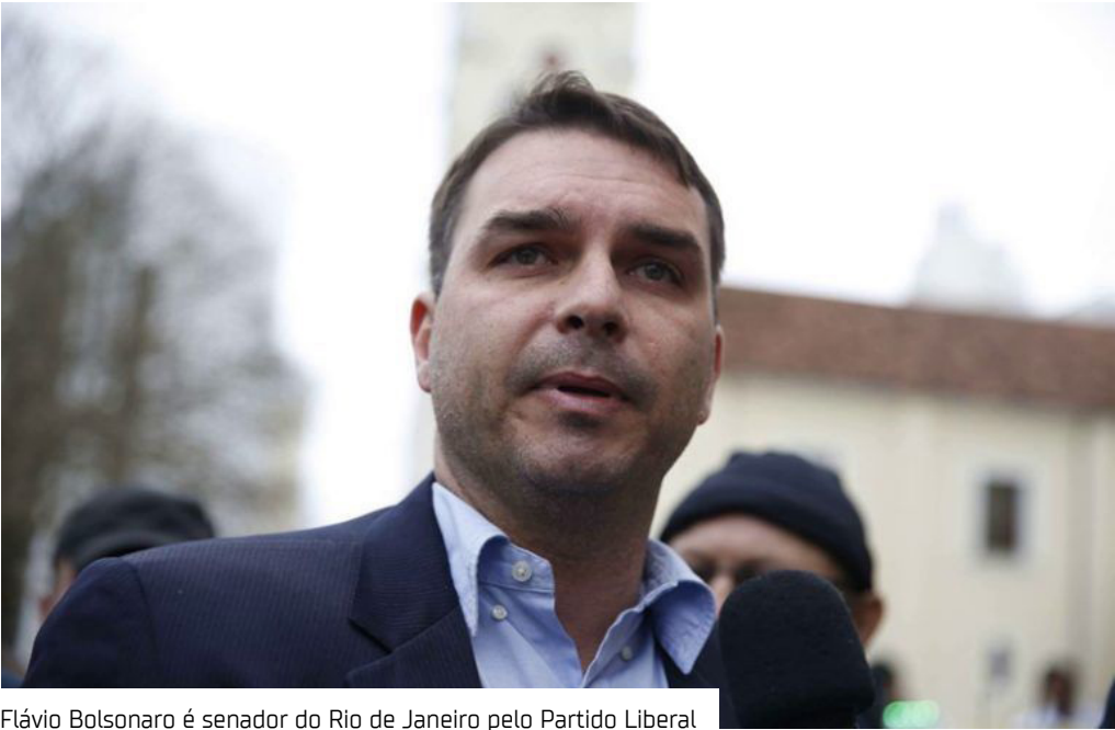
Flávio Bolsonaro é senador do Rio de Janeiro pelo Partido Liberal

O Partido Comunista do Brasil (PCdoB) ingressou com uma ação ordinária contra o Projeto de Lei que concede ao senador Flávio Bolsonaro (PL-RJ) o Título de Cidadão do Amazonas. A proposta, de autoria da deputada estadual Débora Menezes, tramita na Assembleia Legislativa do Estado do Amazonas (Aleam).