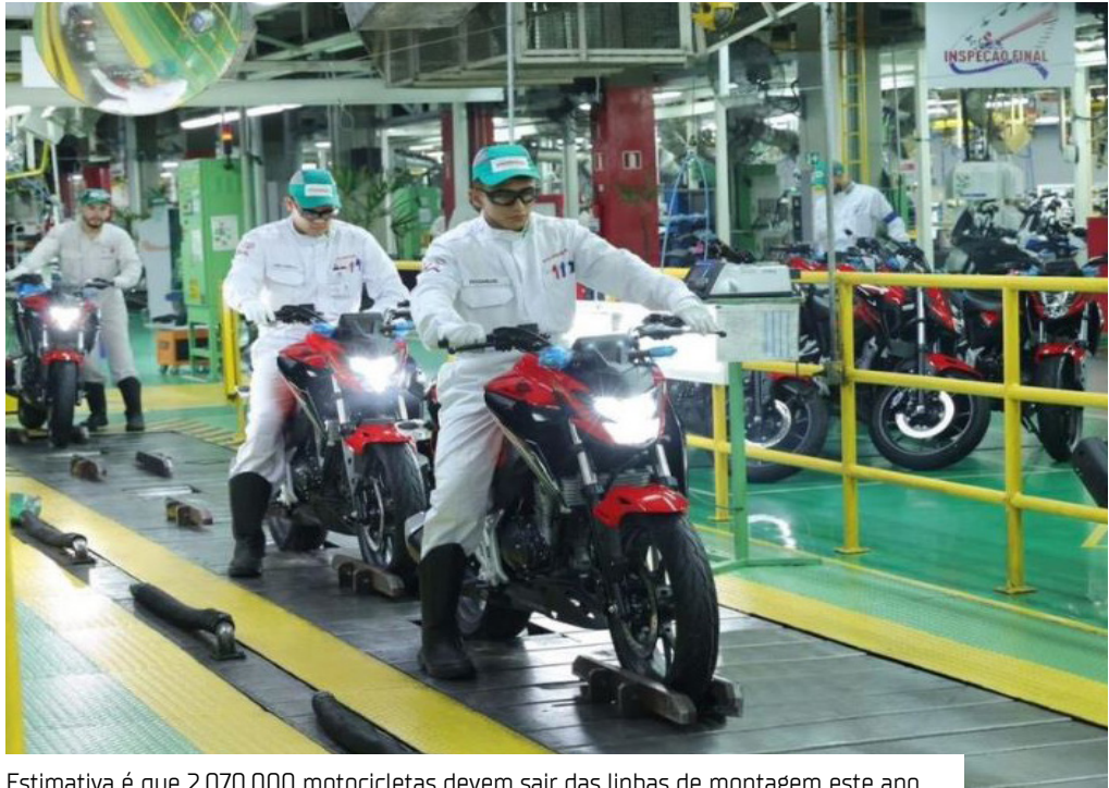
Estimativa é que 2.070.000 motocicletas devem sair das linhas de montagem este ano

As fabricantes de motocicletas instaladas no Polo Industrial de Manaus (PIM) iniciaram o ano em ritmo acelerado nas linhas de montagem. Segundo dados da Associação Brasileira dos Fabricantes de Motocicletas, Ciclomotores, Motonetas, Bicicletas e Similares (Abraciclo), em janeiro foram produzidas 184.443 unidades – o maior volume registrado para o mês desde 2008.