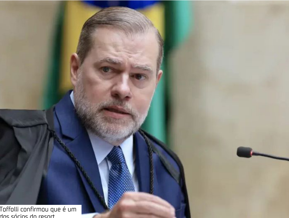
Toffoli confirmou que é um dos sócios do resort