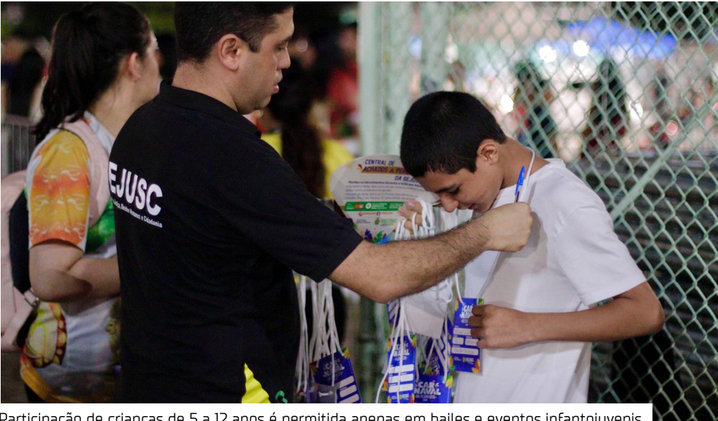
Participação de crianças de 5 a 12 anos é permitida apenas em bailes e eventos infantojuvenis

A Secretaria de Estado de Justiça, Direitos Humanos e Cidadania (Sejusc) vai atuar na fiscalização de crianças e adolescentes durante o período carnavalesco com base na determinação da Portaria 003/2023, da Justiça do Estado do Amazonas (TJAM), que proíbe crianças menores de 12 anos em blocos e bandas carnavalescas, mesmo que acompanhadas dos responsáveis. Os menores de 12 anos só poderão participar de bailes e eventos infantojuvenis, com espaço exclusivo e convenientemente separado do local dos adultos.