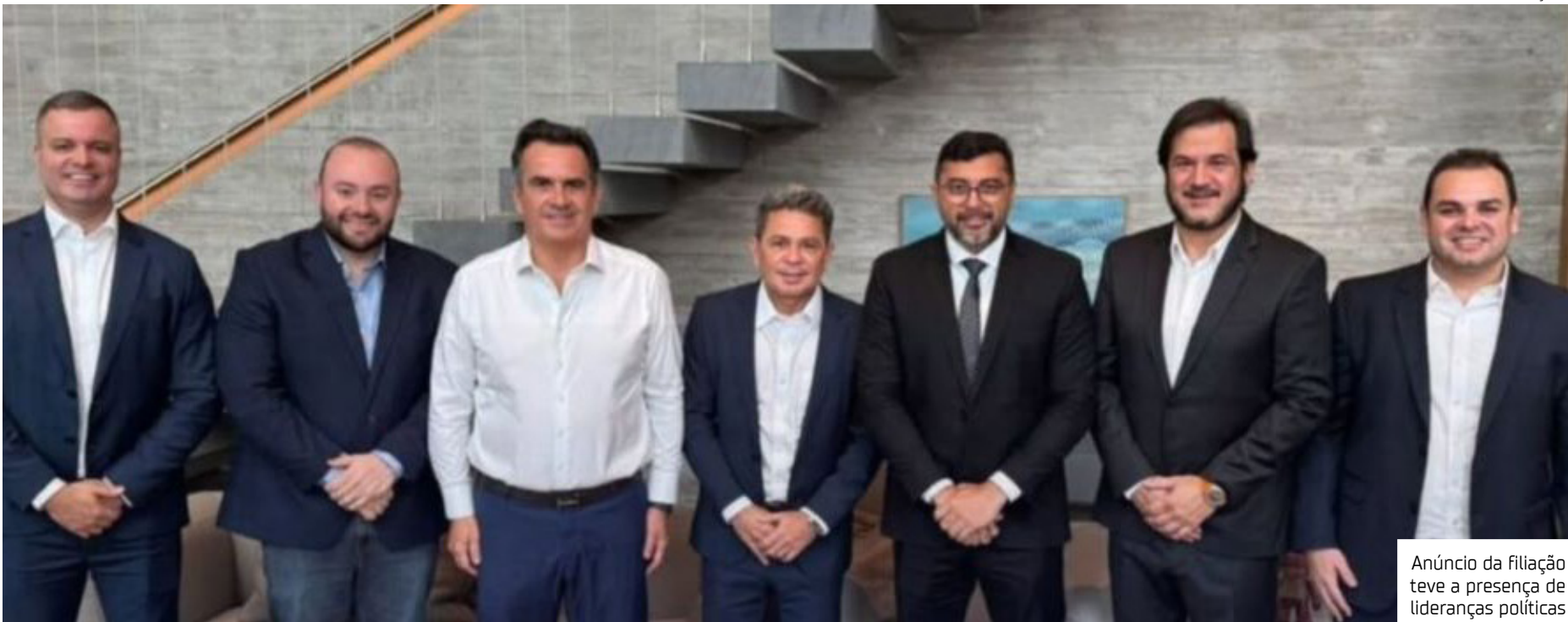
Anúncio da filiação teve a presença de lideranças políticas

A filiação integra a estratégia política para a disputa