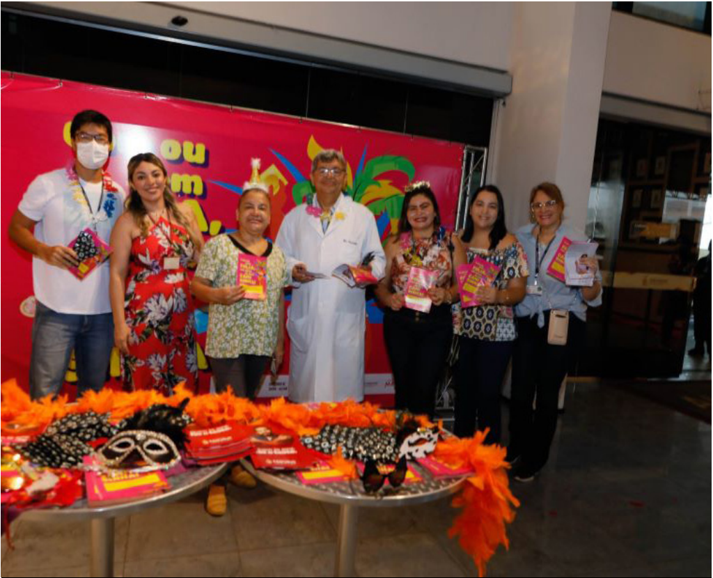
Hoje (13), será realizada a primeira distribuição de preservativos aos servidores do Poder Legislativo