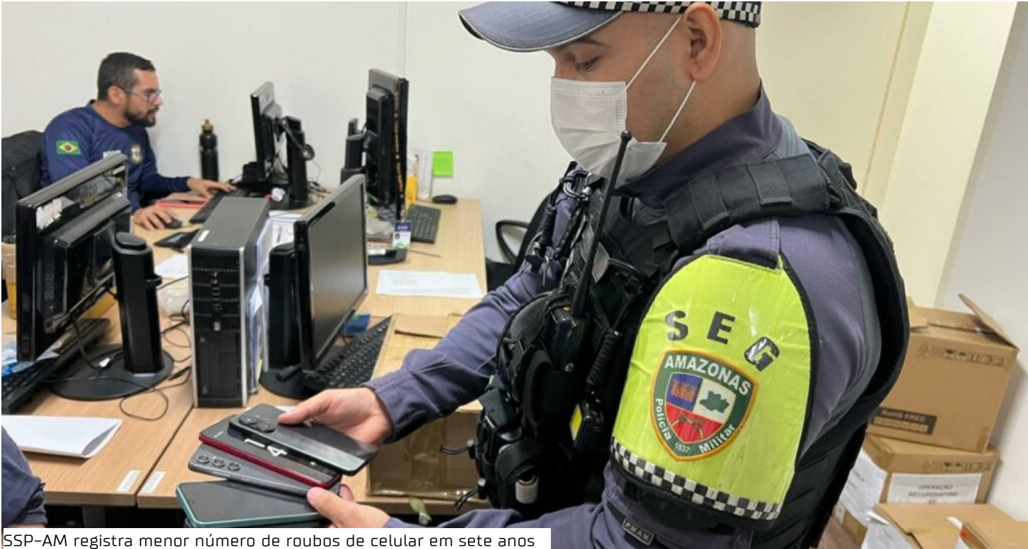
SSP-AM registra menor número de roubos de celular em sete anos