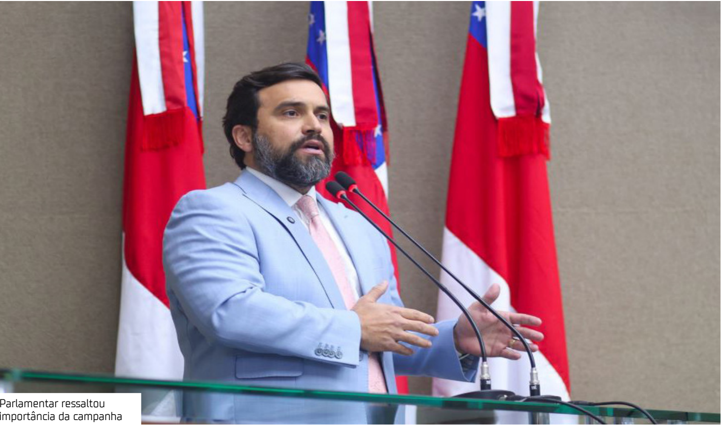
Parlamentar ressaltou importância da campanha