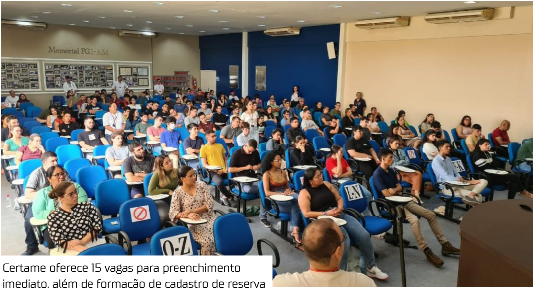
Certame oferece 15 vagas para preenchimento imediato, além de formação de cadastro de reserva

O edital completo e o link para inscrição estão disponíveis no site da PGE-AM, no endereço pge.am.gov.br . Os candidatos podem se inscrever até o dia 10 de março de 2026. A prova será realizada no dia 22 de março de 2026, com início às 8h30, em local a ser informado aos candidatos. Para validar a inscrição, os candidatos deverão entregar uma lata de leite em pó de 380 gramas ou pacote equivalente, no período de 12 de fevereiro a 10 de março, das 9h às 14h, em dias úteis, na sede da PGE-AM, localizada na rua Emílio Moreira, 1308, Praça 14 de Janeiro, no Cejur. As doações serão destinadas a instituições sociais. O estágio terá carga horária de quatro horas diárias, totalizando 20 horas semanais, nos turnos da manhã ou da tarde. A bolsa é de R$1.280,00,