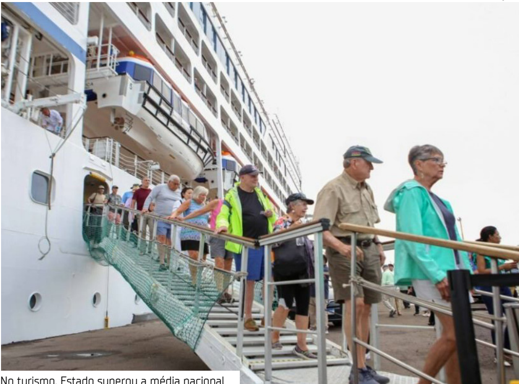
No turismo, Estado superou a média nacional