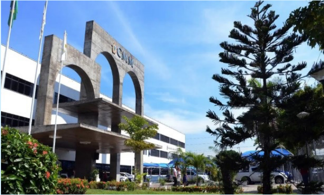
TJAM concluiu que as irregularidades apontadas podem ser resolvidas