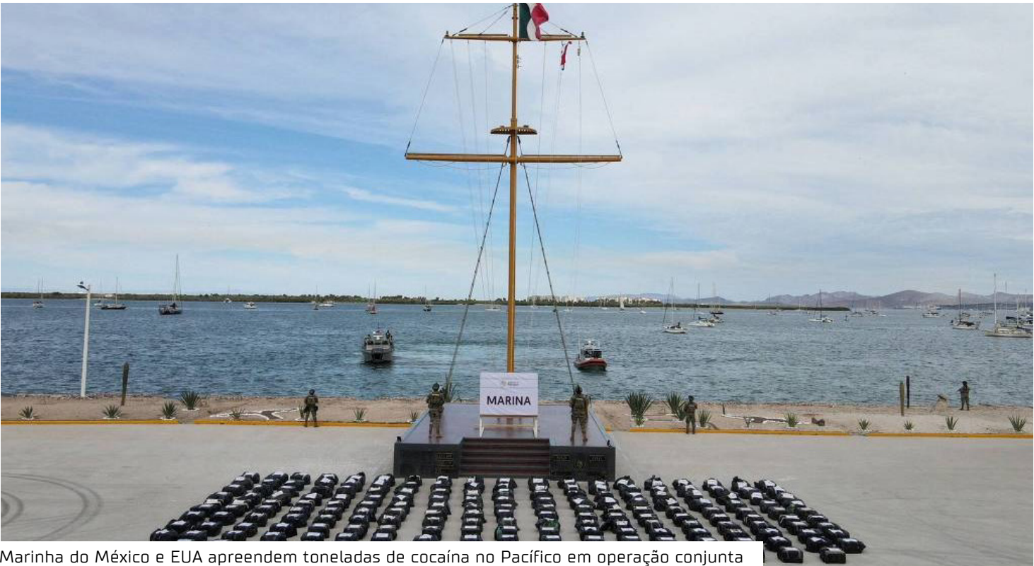
Marinha do México e EUA apreendem toneladas de cocaína no Pacífico em operação conjunta

A Marinha do México informou, em nota, que a ação ocorreu “sob o marco de co-operação bilateral” e fora das águas territoriais do país. A droga foi localizada em um barco a oeste da Ilha Clarión, aproximadamente mil quilômetros do porto de Manzanillo, em Colima. O México também confirmou a detenção de várias pessoas, sem especificar o número exato. Donald Trump ameaçou impor tarifas ao México para pressionar o país a intensificar prisões e apreensões de drogas. Além disso, o presidente avalia a saída do tratado comercial com Canadá e México, aumentando a tensão diplomática. Donald Trump, está avaliando abandonar o acordo comercial USMCA, com Canadá e México, de acordo com pessoas familiarizadas com o assunto. O republicano perguntou a assessores por que não deveria se retirar do acordo, que assinou durante seu primeiro mandato, embora não tenha sinalizado claramente que o