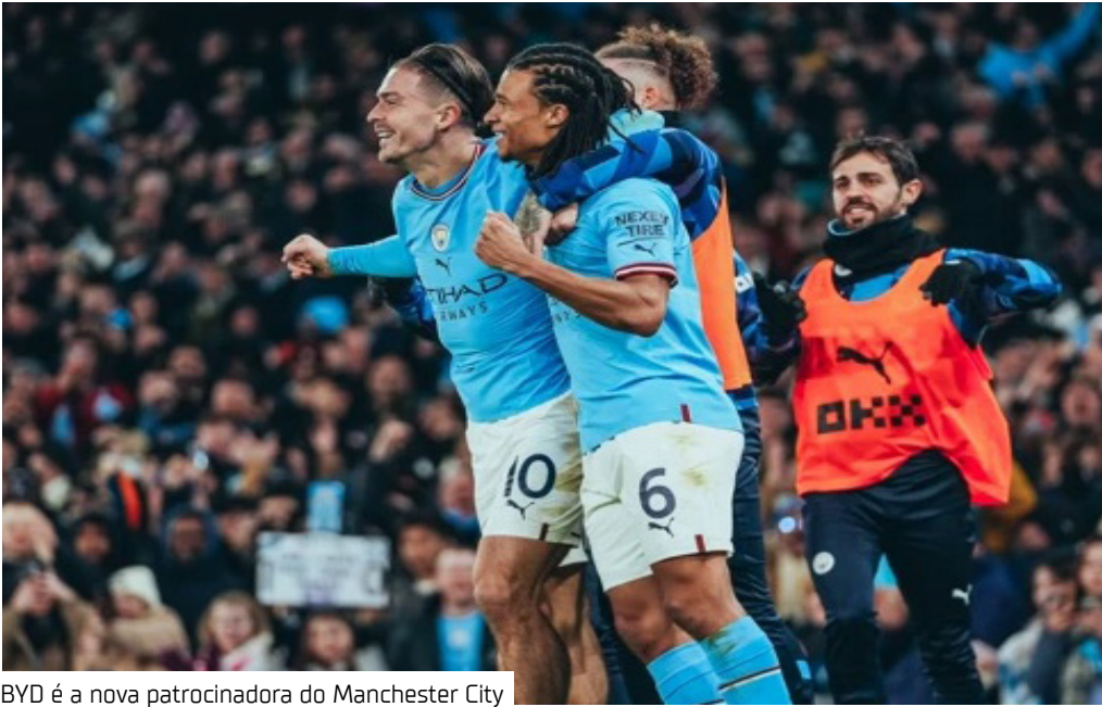
BYD é a nova patrocinadora do Manchester City