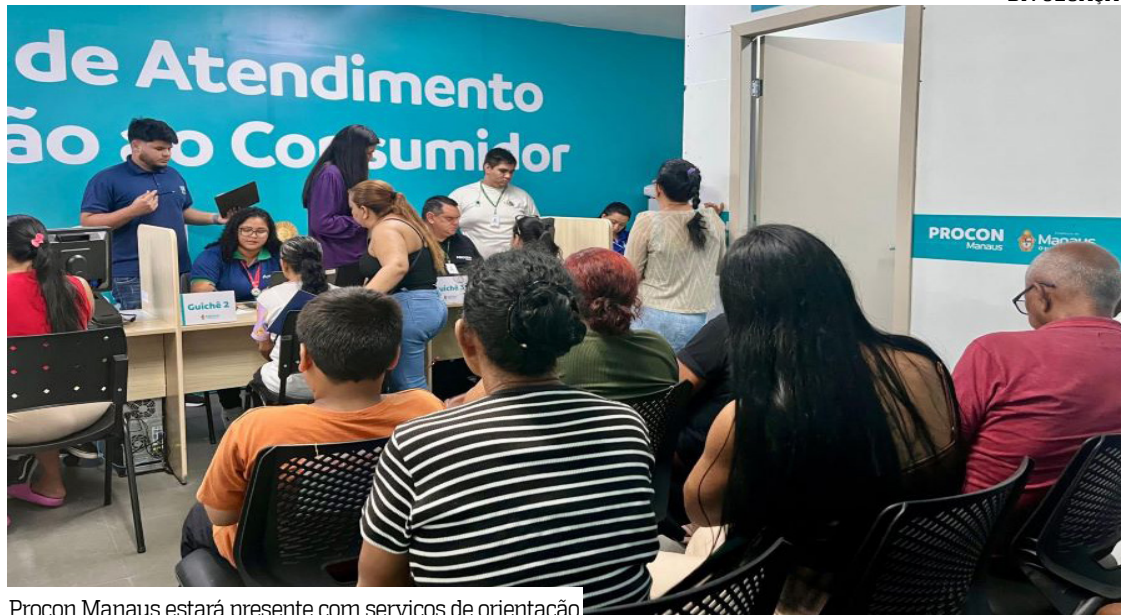
Procon Manaus estará presente com serviços de orientação

Nesta edição, o feirão conta com a presença do Procon Manaus e de algumas