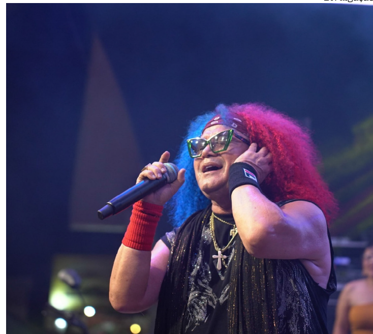
‘Rei do Brega’ inicia programação musical do festival no Amazonas Shopping

Além da programação musical, o evento reúne restaurantes locais com diferentes propostas gastronômicas, oferecendo ao público opções que vão da culinária regional a lanches.