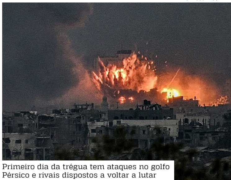
Primeiro dia da trégua tem ataques no golfo Pérsico e rivais dispostos a voltar a lutar