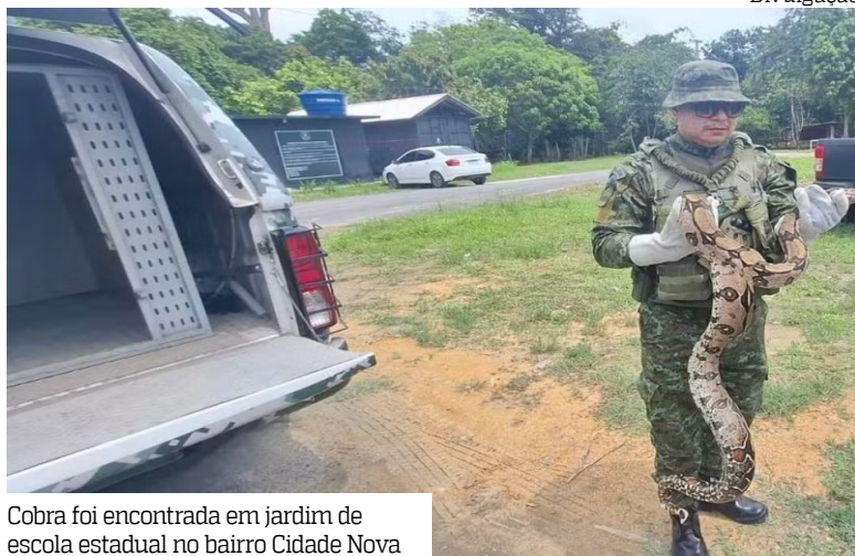
Cobra foi encontrada em jardim de escola estadual no bairro Cidade Nova

Uma cobra tipo jiboia foi resgatada após aparecer no jardim de uma escola estadual na manhã da terça-feira (7), na avenida Timbiras, bairro Cidade Nova, Zona Norte da capital amazonense. O animal surgiu na área externa da unidade e assustou alunos e funcionários.