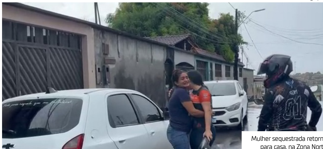
Mulher sequestrada retorna para casa, na Zona Norte

De acordo com o marido da vítima, o casal chegava