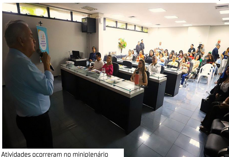
Atividades ocorreram no miniplenário

Com o tema "Conviver para aprender", a Assembleia Legislativa do Amazonas (Aleam), por meio das diretorias de Saúde e de Assistência Social, promoveu uma programação especial em alusão ao Abril Azul, mês dedicado à conscientização sobre o Transtorno do Espectro Autista (TEA).