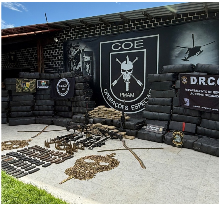
Forças de Segurança do Amazonas registram crescimento expressivo nos primeiros três meses do ano

Paiva ressaltou que dentre os equipamentos das Forças de Segurança do Amazonas estão as lanchas blindadas, as Bases Fluviais Arpão, metralhadoras Negev, equipamentos de visão noturna e de inteligência. Além disso, lembrou, ainda, da convocação de novos policiais, que fortaleceram tanto a