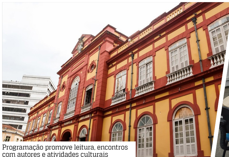
Programação promove leitura, encontros com autores e atividades culturais

A iniciativa ganha ainda mais relevância por acontecer em um período marcado por importantes datas do calendário literário, como o Dia da Biblioteca (9 de abril), o Dia Nacional do Livro Infantil (18 de abril) e o Dia Mundial do Livro e do Direito do Autor (23 de abril). A proposta é incentivar o hábito da leitura, ampliar o acesso à informação e fortalecer as bibliotecas como espaços vivos de cultura.