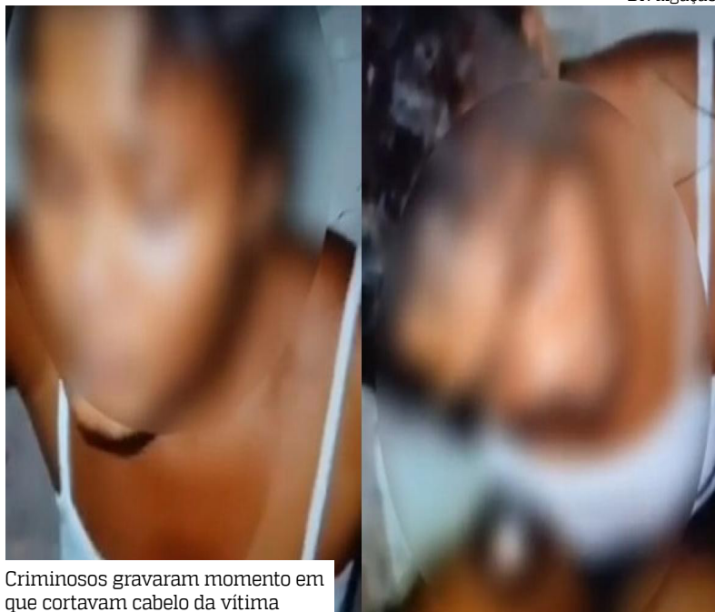
Criminosos gravaram momento em que cortavam cabelo da vítima

Uma moradora do Complexo da Pedreira teve o cabelo raspado por traficantes após visitar familiares na comunidade do Jacaré, na zona Norte do Rio de Janeiro. O crime foi registrado em vídeo e viralizou nas redes sociais, ontem (8), no entanto, não há detalhes de quando o crime teria ocorrido.