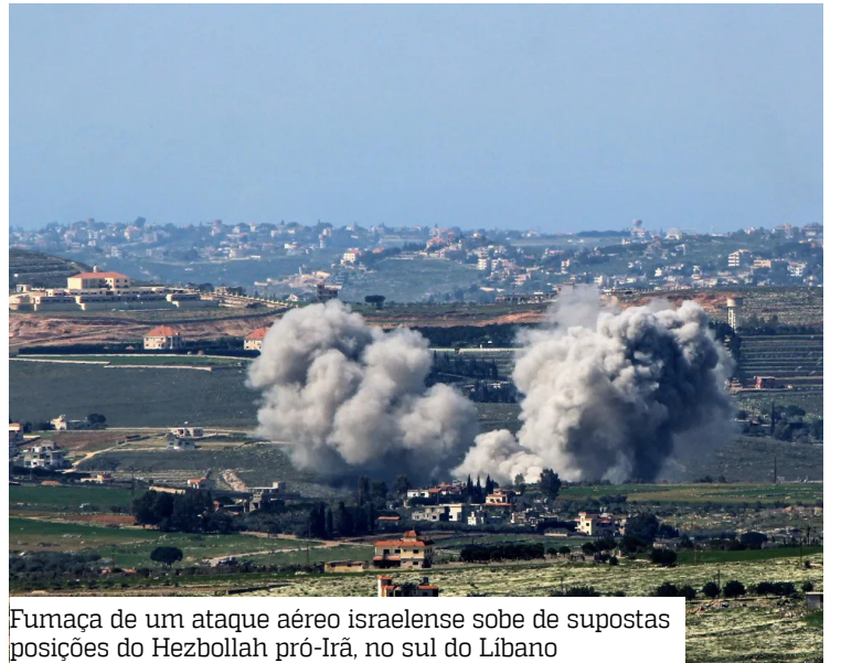
Fumaça de um ataque aéreo israelense sobe de supostas posições do Hezbollah pró-Irã, no sul do Líbano

Ainda assim, o líder americano informou que convidou os dois chefes de Estado para um encontro na Casa Branca. “Ambos os lados querem ver a paz, e acredito que isso acontecerá rapidamente!”, declarou. Segundo ele, a reunião pode ocorrer em uma ou duas semanas.