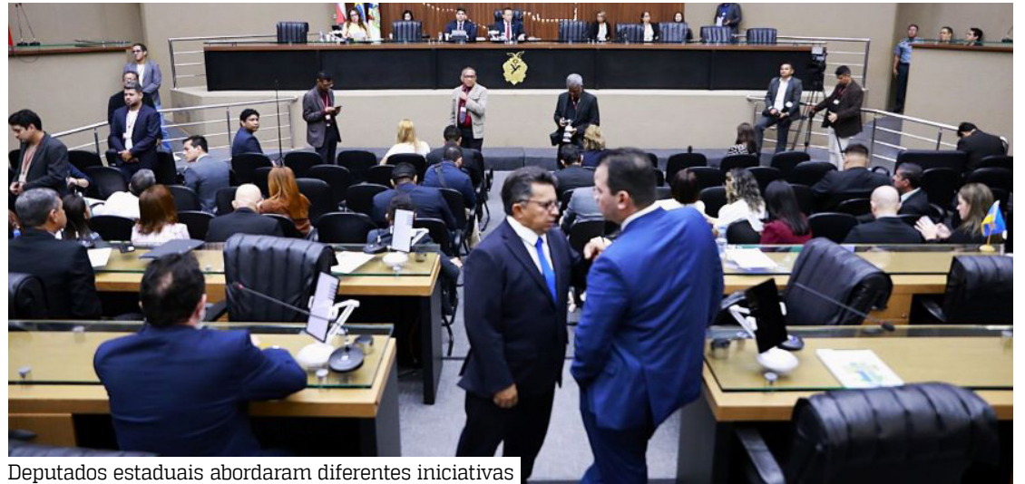
Deputados estaduais abordaram diferentes iniciativas

ainda que, no sábado (18/4), será realizado na Aleam o Circuito de Palestras voltado à campanha Abril Laranja, a partir das 8h30, no auditório Senador João Bosco, na Escola do Legislativo.