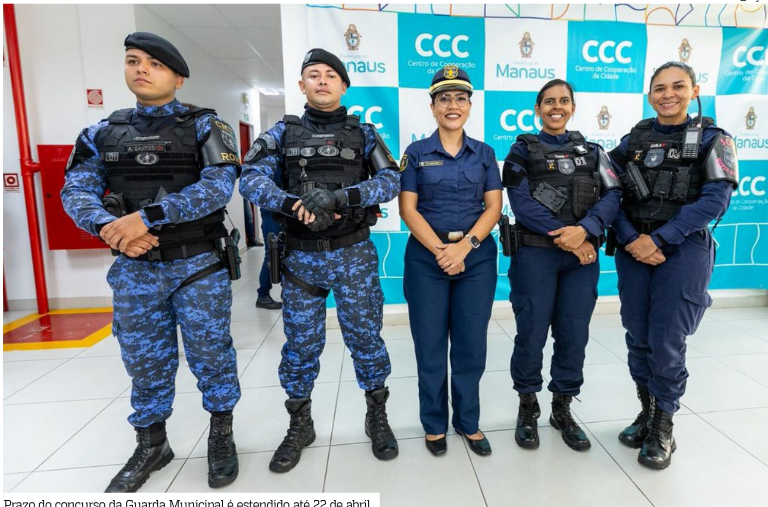
Prazo do concurso da Guarda Municipal é estendido até 22 de abril