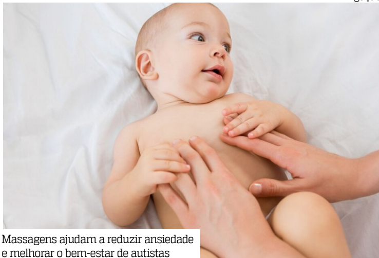
Massagens ajudam a reduzir ansiedade e melhorar o bem-estar de autistas

O Brasil tem cerca de 2,4 milhões de pessoas diagnosticadas com transtorno do espectro autista (TEA), segundo o Censo 2022 do Instituto Brasileiro de Geografia e Estatística (IBGE).