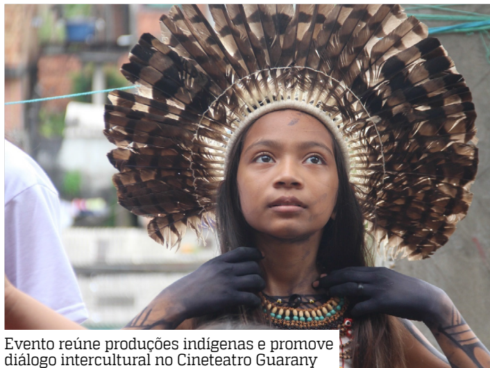
Evento reúne produções indígenas e promove diálogo intercultural no Cine Teatro Guarany

Organizada pelo cineasta Diogo Ferreira, a mostra é resultado de um projeto contemplado em duas edições do programa Manaus Faz Cultura. A iniciativa tem como principal proposta levar a produção cinematográfica para dentro das comunidades, capacitando moradores para que contêm suas próprias his-