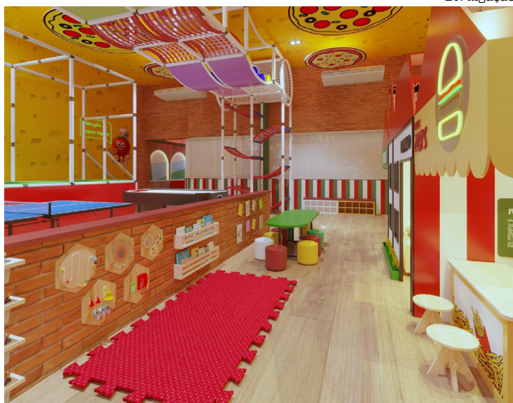
Novo espaço infantil homenageia a história da família e reforça foco no público

Referência de tradição e sabor na capital amazonense, a Loppiano Pizza completa 32 anos de história neste mês de abril. Para celebrar o marco, a casa presenteia seus clientes com a inauguração da Vila Tomatinho, um novo playground que promete ser o maior e mais moderno espaço kids em pizzarias da cidade.