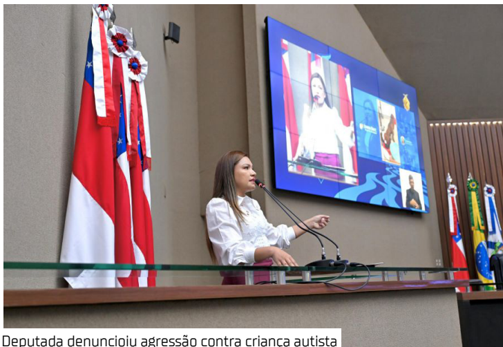
Deputada denunciou agressão contra criança autista

A deputada estadual Joana Darc (UB) denunciou, na tribuna da Assembleia Legislativa do Amazonas (Aleam), um caso grave de agressão envolvendo uma criança autista dentro de uma escola em Manaus, que teve a boca tapada com fita adesiva por uma professora. A parlamentar classificou a situação como inaceitável e cobrou providências imediatas da escola e dos órgãos competentes.