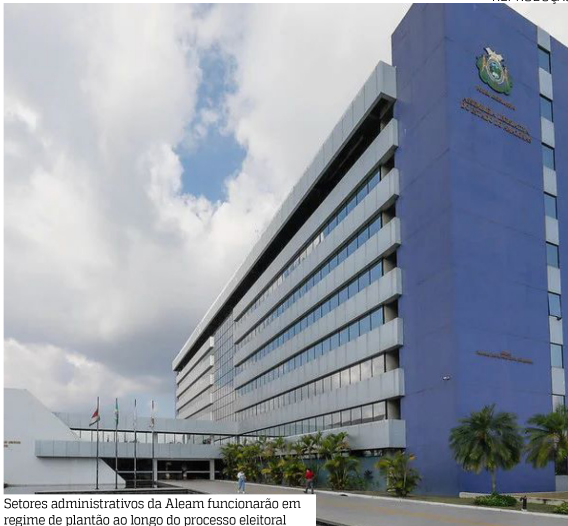
Setores administrativos da Aleam funcionarão em regime de plantão ao longo do processo eleitoral

Caso haja pendências, os candidatos serão notificados e terão pra-