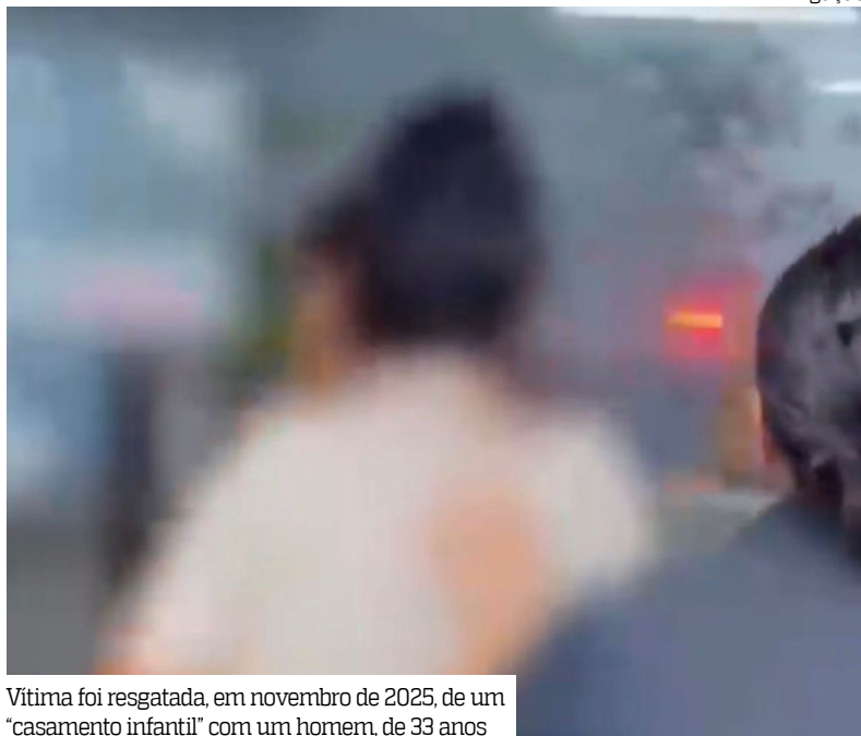
Vítima foi resgatada, em novembro de 2025, de um "casamento infantil" com um homem, de 33 anos

Uma mulher de 21 anos foi presa, na quarta-feira (15), por explorar sexualmente a própria irmã de apenas 11 anos. Ela chegava a "vender" a criança por litros de açaí e R$ 20. O crime e a prisão aconteceram no município de Manacapuru. O abusador, de 65 anos, também foi preso.