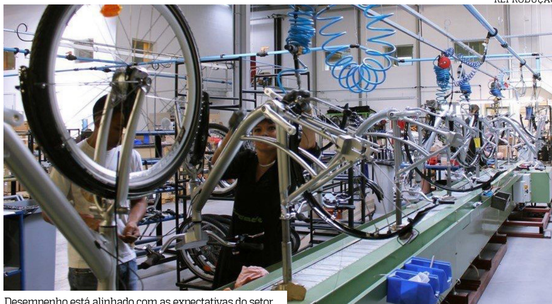
Desempenho está alinhado com as expectativas do setor

Segundo Rocha, o movimento reflete também as mudanças no comportamento do consumidor. "As fabricantes seguem investindo na ampliação de seus portfólios, acompanhando