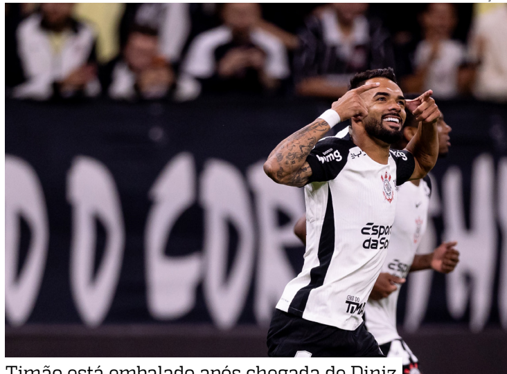
Timão está embalado após chegada de Diniz

O técnico Fernando Diniz mostrou bom humor durante a coletiva pós-vitória por 2 a 0 diante do Santa Fe, que aconteceu nesta quarta-feira (15), em casa, pela Libertadores. Além da partida, o treinador comentou o momento da carreira e a evolução do time após uma semana no comando do clube.