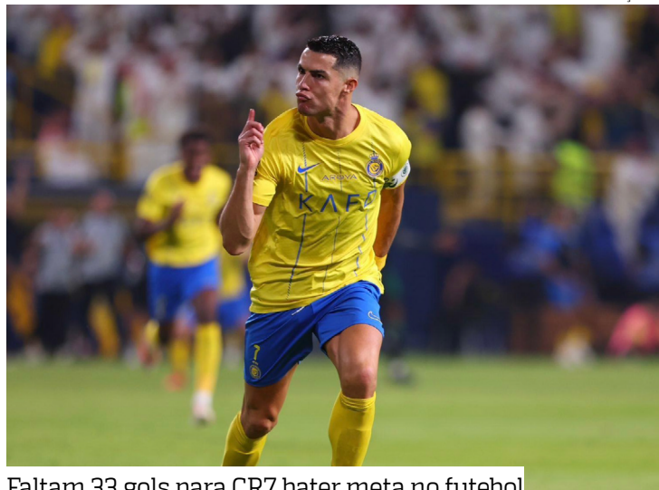
Faltam 33 gols para CR7 bater meta no futebol

Cristiano Ronaldo mostrou mais uma vez que idade é só um detalhe. Depois de mais de um mês afastado por lesão muscular, o craque português voltou com tudo e comandou a vitória do Al-Nassr com mais uma atuação decisiva. Resultado? Dois gols, mais três pontos na conta e um passo importante rumo a uma marca histórica.