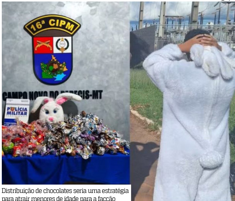
Distribuição de chocolates seria uma estratégia para atrair menores de idade para a facção

Um adolescente fantasiado de “Coelhinho da Páscoa” foi apreendido no domingo (05/04) em Campo Novo do Parecis, em Cuiabá, em Mato Grosso. Segundo a polícia, a distribuição de chocolates era uma estratégia para atrair menores de idade e fortalecer a presença da facção Comando Vermelho (CV) na região.