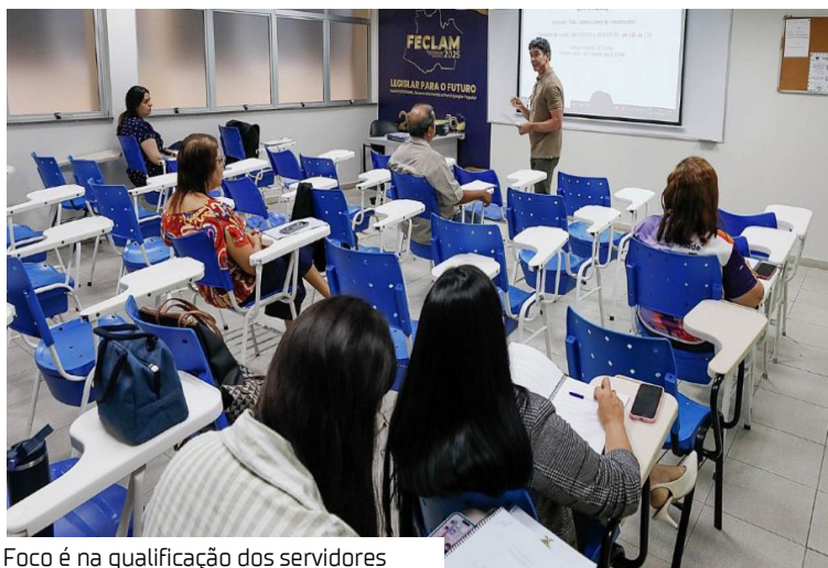
Foco é na qualificação dos servidores

A Assembleia Legislativa do Amazonas (Aleam), por meio da Escola do Legislativo Senador José Lindoso divulgou a programação de cursos e oficinas para o mês de abril, com foco na qualificação de servidores públicos e no fortalecimento de práticas inclusivas no ambiente institucional. Os cursos são ministrados nas dependências da Escola do Legislativo, das 14h às 17h.