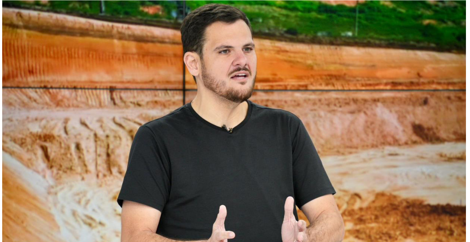
Prefeito Renato Junior anuncia novo secretário da Semed e prioridades estratégicas para mobilidade, infraestrutura e educação

Durante entrevista, o chefe do Executivo municipal destacou que a gestão municipal atuará de forma integrada em todas as áreas, com atenção prioritária em infraestrutura urbana, mobilidade e limpeza pública, sobretudo após o período chuvoso