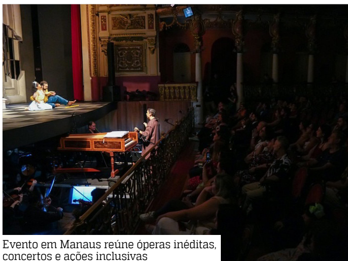
Evento em Manaus reúne óperas inéditas, concertos e ações inclusivas

Os ingressos estão à venda na bilheteria do Teatro Amazonas e pelo site https://shoppinggressos.com.br . Os valores variam de R$ 10 a R$ 100, de-