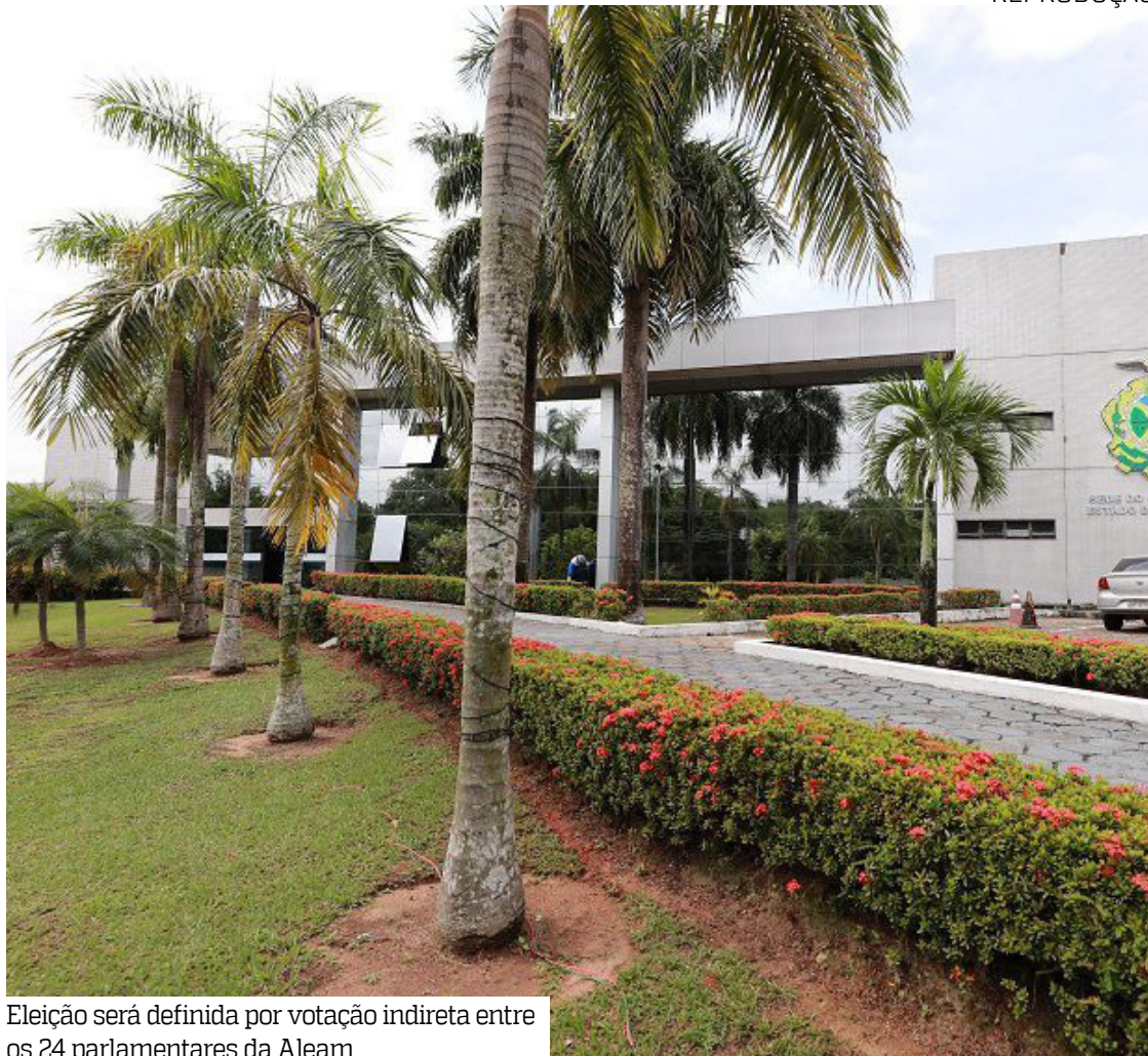
Eleição será definida por votação indireta entre os 24 parlamentares da Aleam