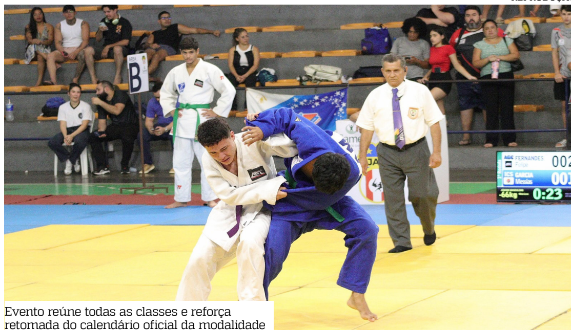
Evento reúne todas as classes e reforça retomada do calendário oficial da modalidade

A competição contará com estrutura oficial de arbitra-