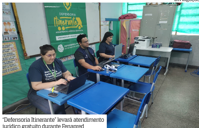
“Defensoria Itinerante” levará atendimento jurídico gratuito durante Fenapred

A Defensoria Pública do Estado do Amazonas (DPE-AM) irá participar, nesta sexta-feira (10), da 11ª edição do projeto Fenapred + Cidadania da Assembleia Legislativa do Estado do Amazonas (Aleam). A iniciativa da Frente Parlamentar de Cuidados e Prevenção à Depressão, Suicídio e Drogas (Fenapred) tem o objetivo de reunir serviços de orientação, cidadania e assistência social e, nesta edição, aconte-