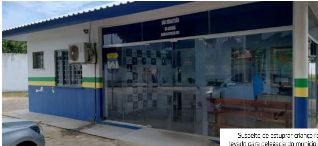
Suspeito de estuprar criança foi levado para delegacia do município

ciel, antes de relatar o ocorrido ao professor, a criança já havia contado os fatos para a avó materna, que não acreditou, e também para a própria mãe. A mãe chegou a confrontar o suspeito, que negou os abusos.