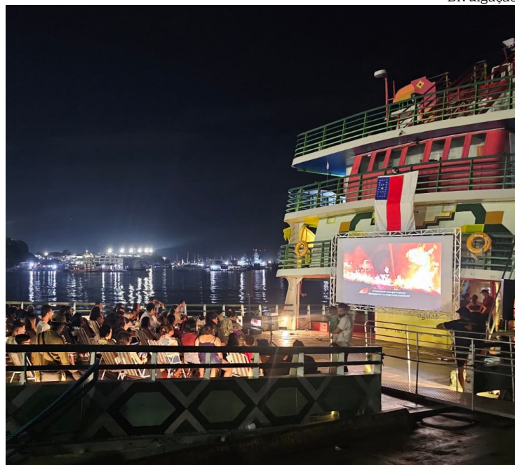
Evento gratuito foi idealizado pela produtora audiovisual duplofilme