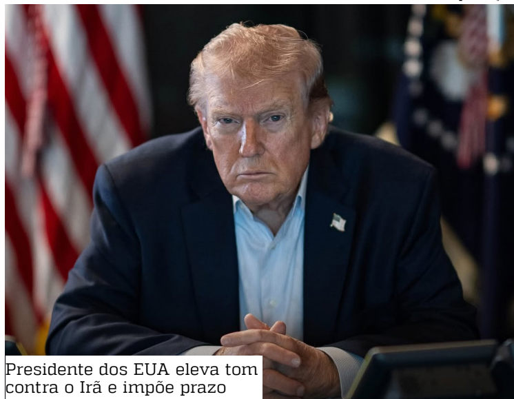
Presidente dos EUA eleva tom contra o Irã e impõe prazo

Além disso, o presidente indicou que o entendimento envolve a abertura do estreito para o “livre trânsito do petróleo”, sem apresentar detalhes adicionais.