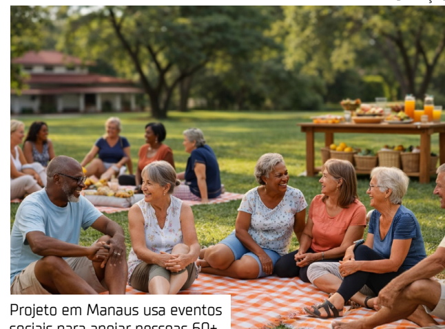
Projeto em Manaus usa eventos sociais para apoiar pessoas 60+

Nos últimos meses, a iniciativa tem estruturado uma agenda que combina encontros presenciais e momentos online. Entre as experiências já realizadas estão uma visita ao Museu da Cidade, em fevereiro, e o "Café Delas", encontro especial promovido em março, em comemoração ao mês das mulheres. As atividades têm reunido participantes interessados em ampliar sua rede de convivência e ressignificar a forma como enxergam essa fase da vida.