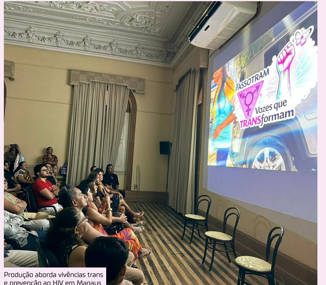
Produção aborda vivências trans e prevenção ao HIV em Manaus

O documentário será disponibilizado ainda este mês no YouTube, no canal @souauroraboreal, e também contará com conteúdos complementares no Instagram oficial @vozesquetransformam.doc, ampliando o alcance das histórias apresentadas.