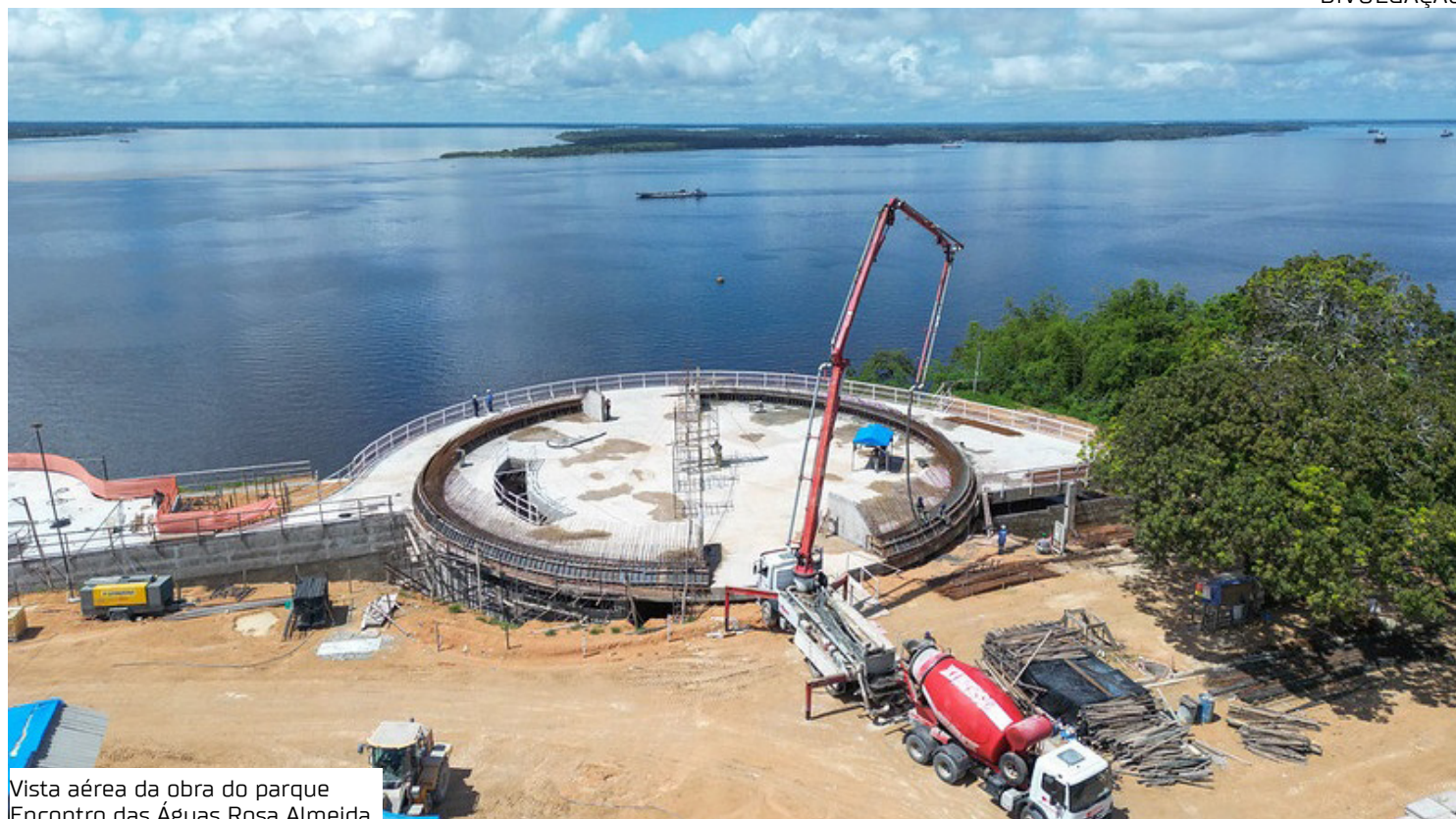
Vista aérea da obra do parque Encontro das Águas Rosa Almeida

"A etapa de jet grouting, que é fundamental para a contenção do talude, foi concluída e, agora, permite o avanço para as fases finais da estrutura. Na sequência, a contenção vai se encontrar com o nível da água, onde será aplicada a solução em estaca-prancha,