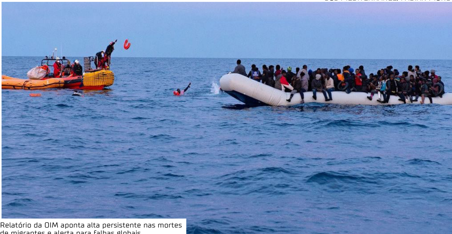
Relatório da OIM aponta alta persistente nas mortes de migrantes e alerta para falhas globais

As 7.904 mortes documentadas em 2025 são descritas pela OIM como o reflexo de uma