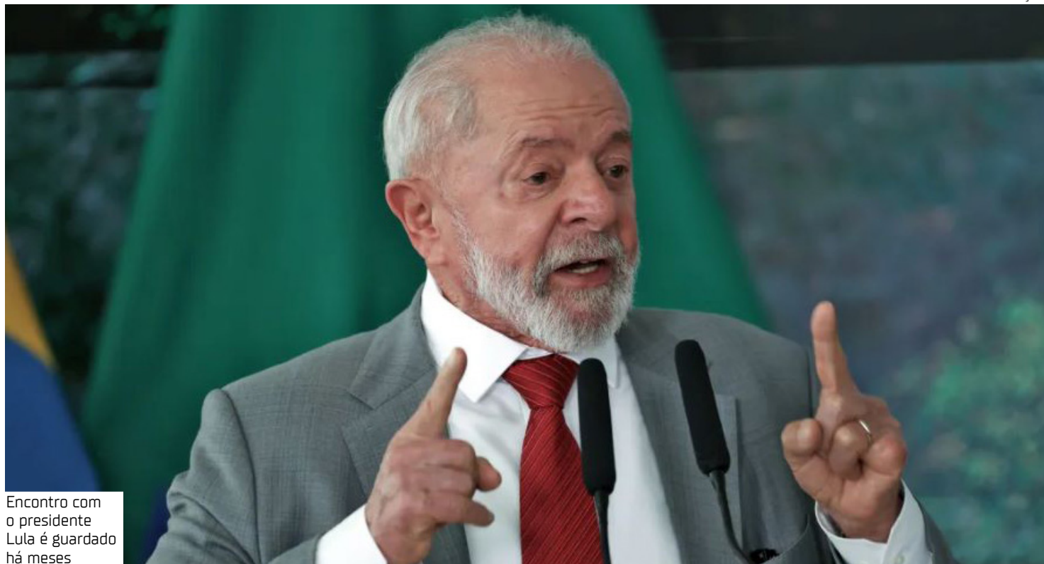
Encontro com o presidente Lula é guardado há meses

favor de Messias reconhecem que ele ainda não têm o apoio suficiente, mas que o cenário é melhor do que o do final do ano passado, quando a sabatina chegou a ser marcada. No entorno do presidente do Senado, Davi Alcolumbre (União-AP), o quadro é visto como "inalterado".