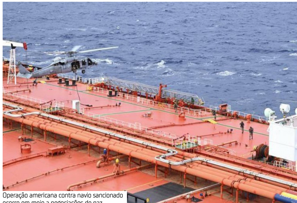
Operação americana contra navio sancionado ocorre em meio a negociações de paz

Forças americanas abordaram um petroleiro sancionado na região do Indo-Pacífico, como parte de seus esforços para barrar embarcações que fornecem apoio ao Irã, informou o Pentágono em uma publicação no Facebook ontem (21).