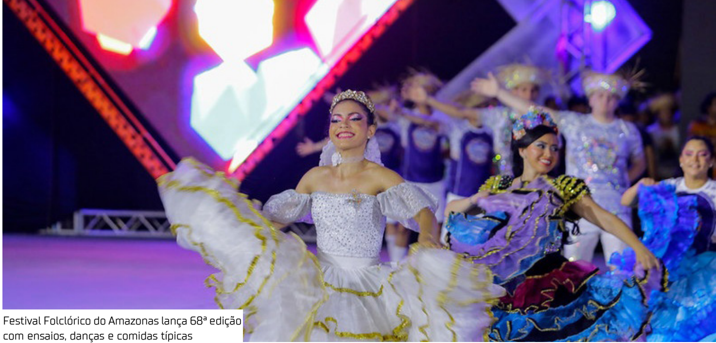
Festival Folclórico do Amazonas lança 68ª edição com ensaios, danças e comidas típicas