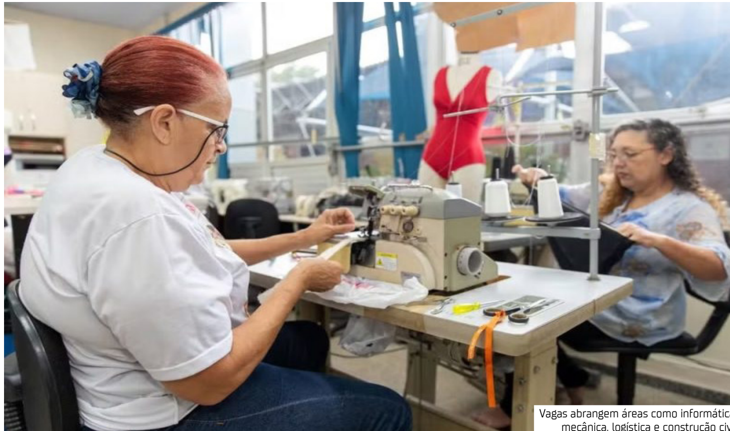
Vagas abrangem áreas como informática, mecânica, logística e construção civil

Os cursos técnicos ofertados pelo Senar e-Tec são gratuitos, possuem dois anos de duração e têm como público-alvo produtores e trabalhadores rurais, associando teoria e prática em formato