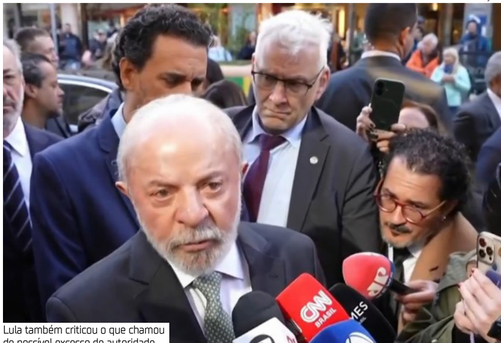
Lula também criticou o que chamou de possível excesso de autoridade