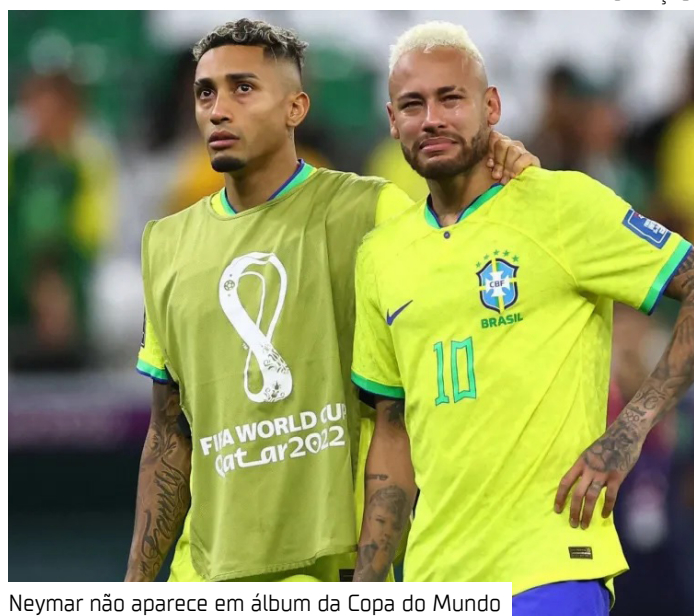
Neymar não aparece em álbum da Copa do Mundo

Assim, a presença do jogador reforça que a lista do álbum não garante convocação oficial.