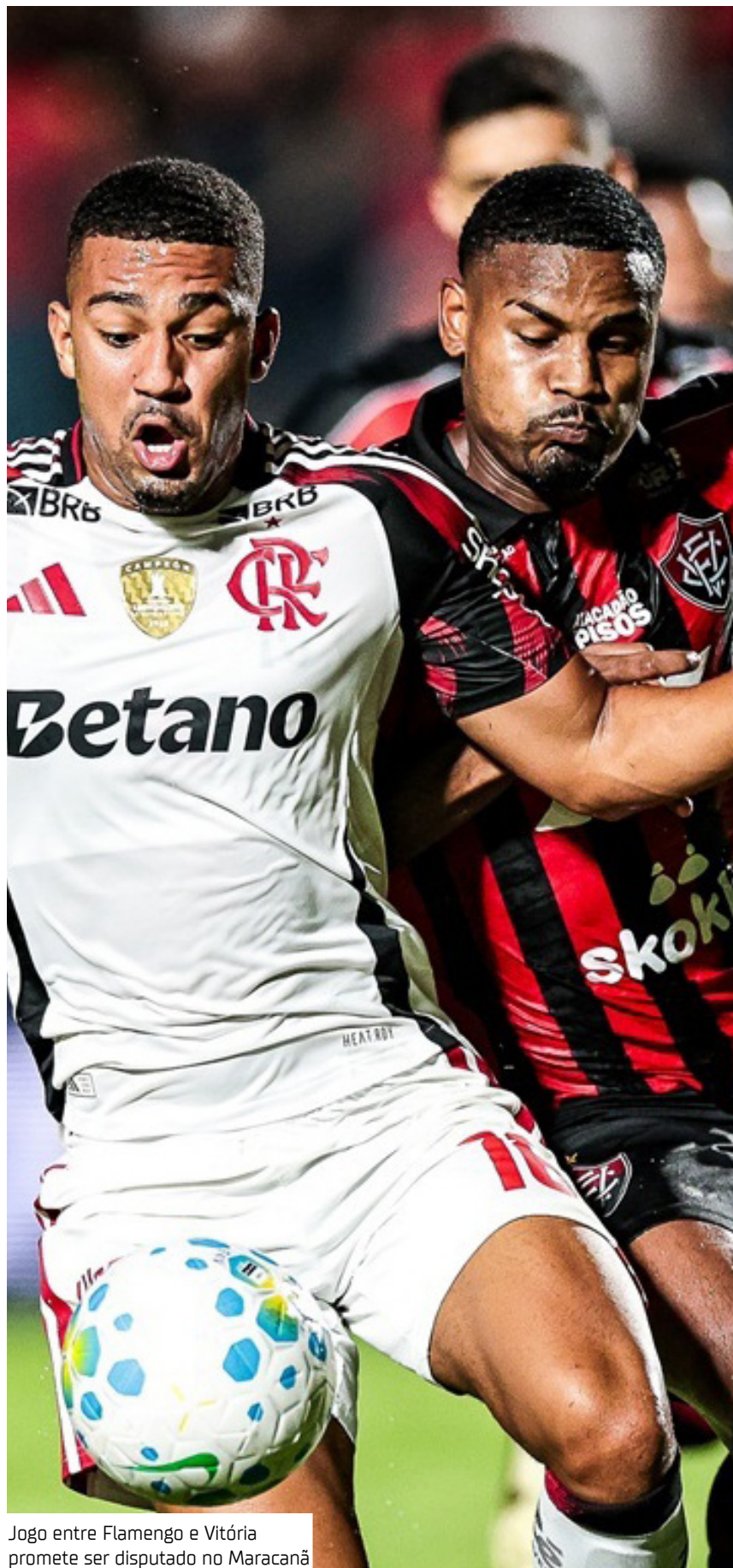
Jogo entre Flamengo e Vitória promete ser disputado no Maracanã