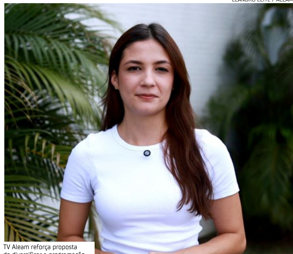
TV Aleam reforça proposta de diversificar a programação

A TV Assembleia do Amazonas lançou dois novos quadros que passam a integrar a programação dos telejornais "Aleam em Foco", ampliando o conteúdo com temas voltados à cultura, entretenimento e comportamento. As estreias aconteceram na última sexta-feira (17).