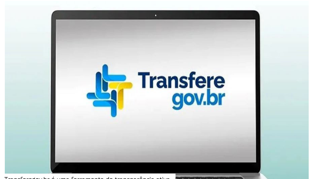
Transferegov.br é uma ferramenta de transparência ativa