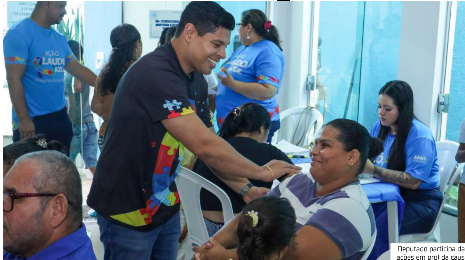
Deputado participa das ações em prol da causa

"Estamos aqui para fazer o nosso melhor: criar leis, apresentar requerimentos, propor melhorias e contribuir de forma efetiva com a causa autista."