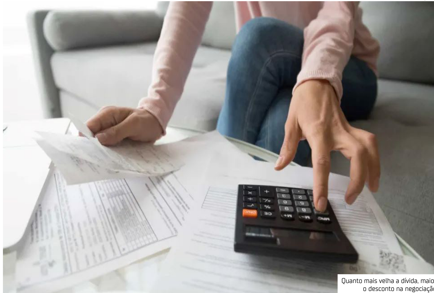
Quanto mais velha a dívida, maior o desconto na negociação

A equipe econômica quer colocar a iniciativa de pé antes do período eleitoral, e o programa deve durar três meses, segundo integrantes do governo.