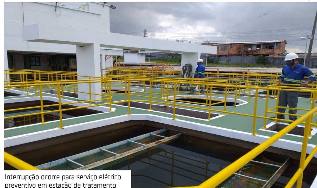
Interrupção ocorre para serviço elétrico preventivo em estação de tratamento

A falta de água afetará 10 bairros da Zona Leste de Manaus a partir de amanhã (23), durante uma manutenção programada na Estação de Tratamento de Água Mauzinho.