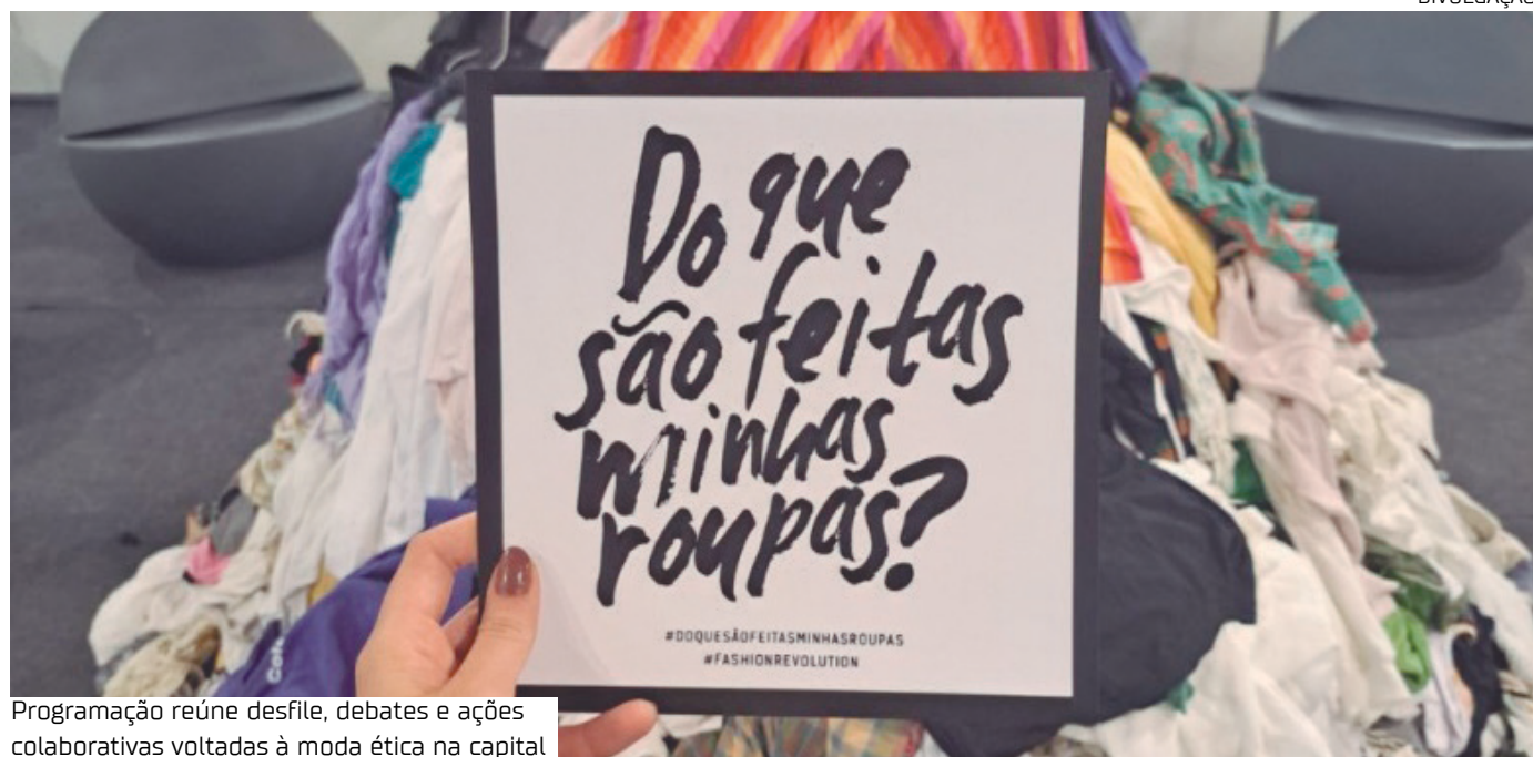
Programação reúne desfile, debates e ações colaborativas voltadas à moda ética na capital

A Semana Fashion Revolution Manaus será realizada até o dia 28 de abril, com uma programação voltada à moda responsável e à valorização da produção local. A mobilização integra a agenda nacional do movimento global que discute práticas mais éticas e sustentáveis na cadeia produtiva do setor.