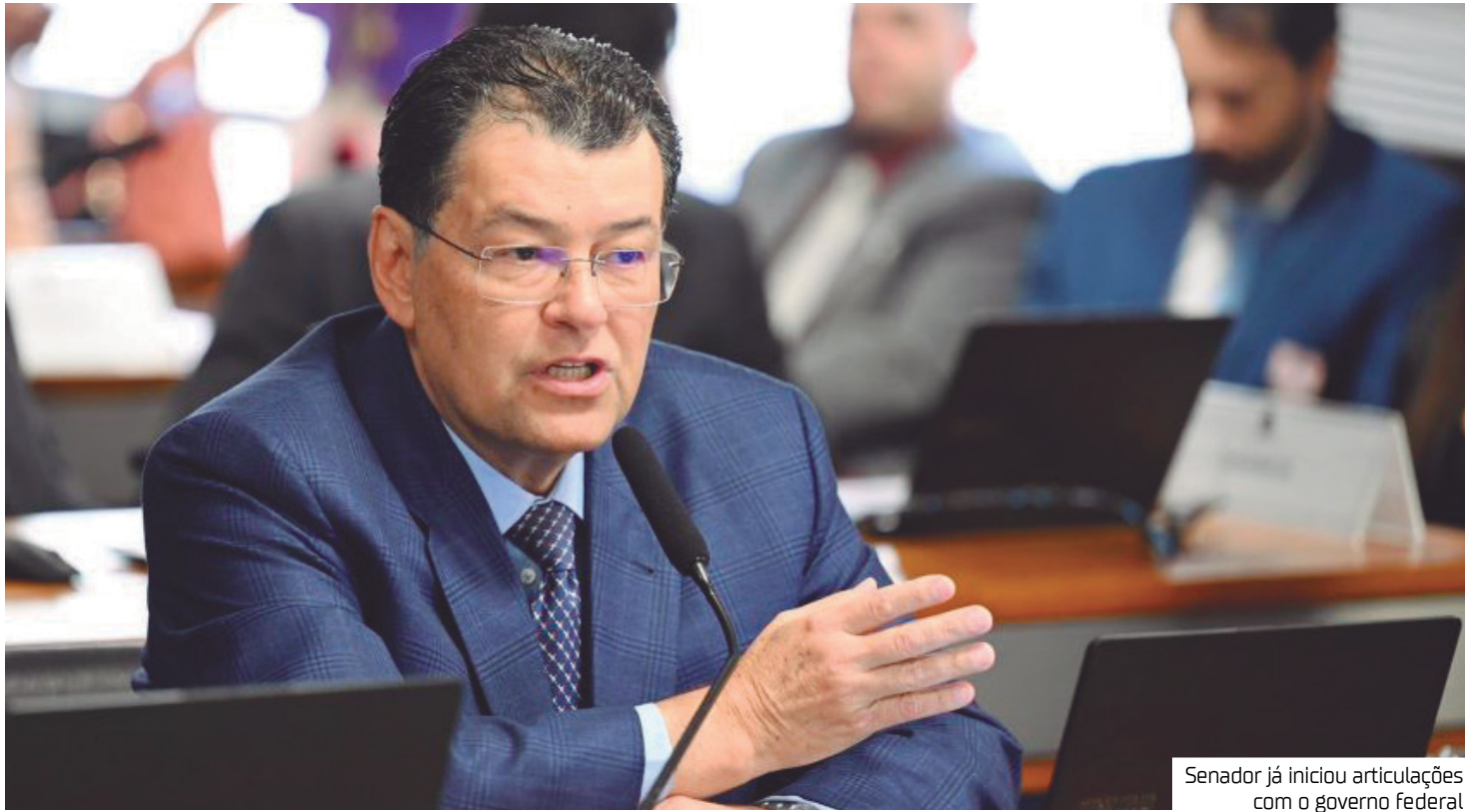
Senador já iniciou articulações com o governo federal

Braga informou que já iniciou articulações junto ao governo federal para tratar do problema. Segundo ele, houve contato com a Secre-