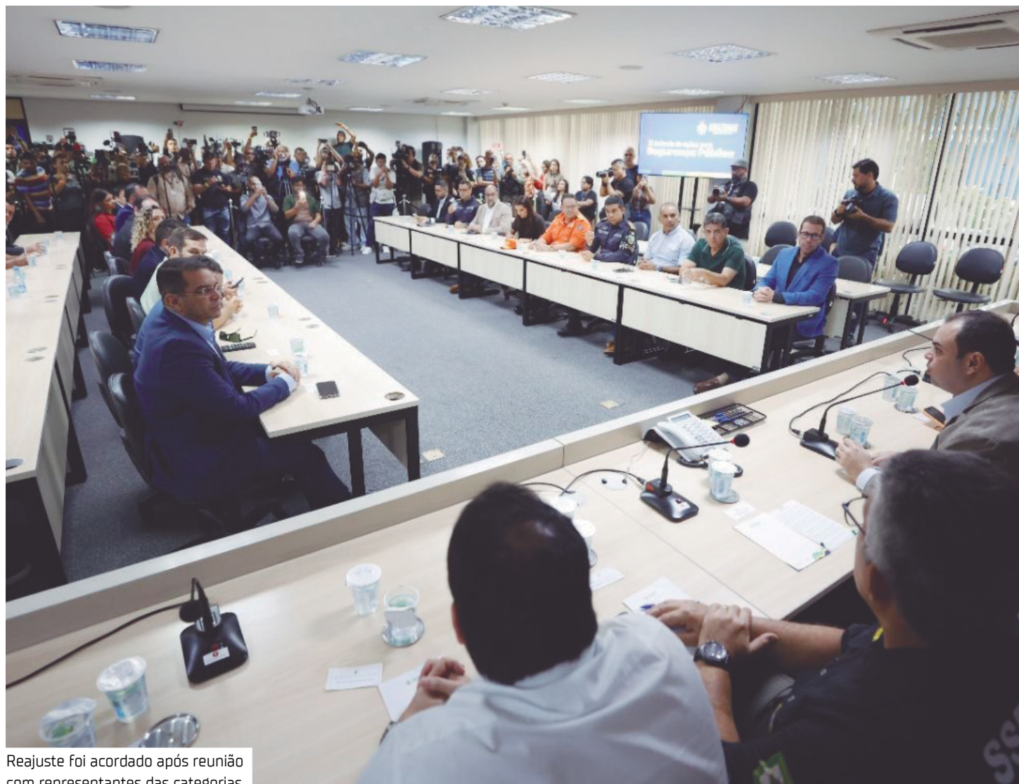
Reajuste foi acordado após reunião com representantes das categorias

"A gente recebe de maneira positiva, porque o governador interino acena positivamente com as entidades, mantendo o canal de comunicação aberto