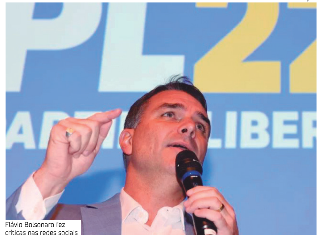
Flávio Bolsonaro fez críticas nas redes sociais

Na época da Cop30, a Gazeta do Povo noticiou que o presidente Lula se hospedou com a primeira-dama Janja da Silva em um barco capaz de abrigar até 30 pessoas em Belém. O uso de navios para a hospedagem foi justificado pela baixa capacidade hoteleira da capital paraense.