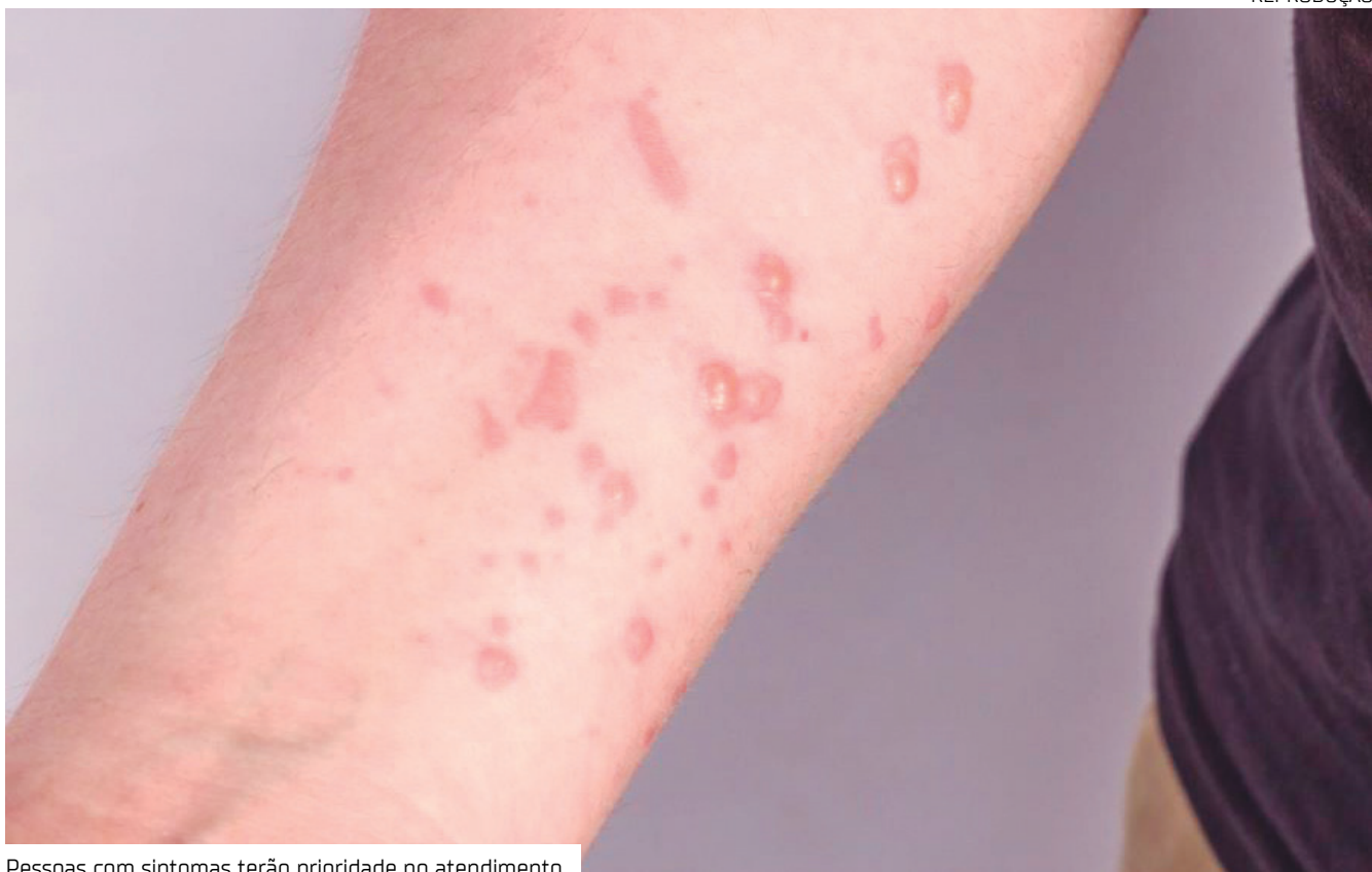
Pessoas com sintomas terão prioridade no atendimento

Tramita na Assembleia Legislativa do Amazonas (Aleam), o Projeto de Lei nº 123/2026, que pretende garantir atendimento prioritário a pacientes com suspeita de Mpox, conhecida como varíola dos macacos, em unidades de saúde públicas e privadas de todo o estado.