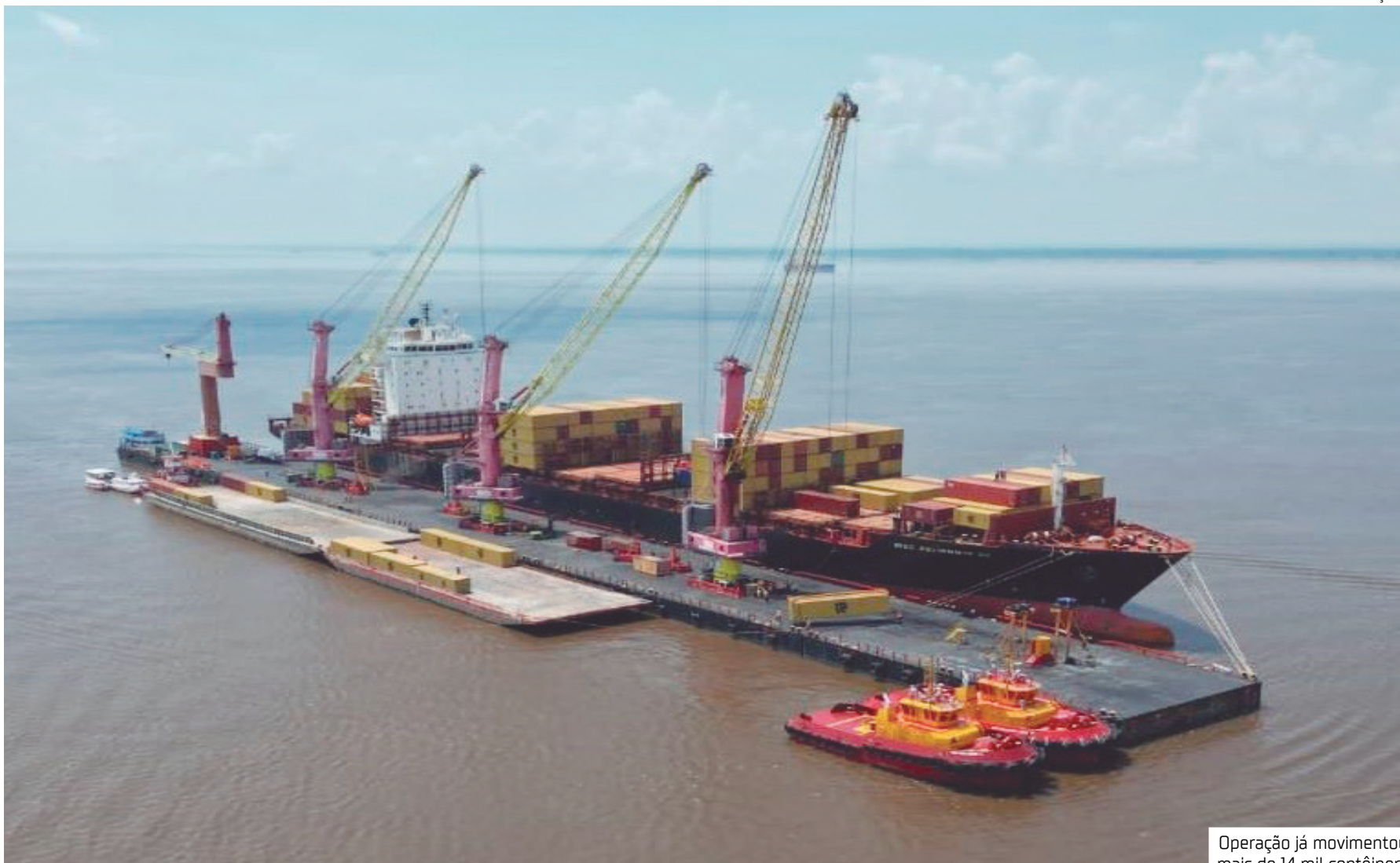
Operação já movimentou mais de 14 mil contêineres

"Nosso compromisso é manter a logística do Amazonas funcionando com responsabilidade, planejamento e capacidade de resposta. A experiência de Itacoatiara mostrou que o Grupo Chibatão tem preparo, estrutura e