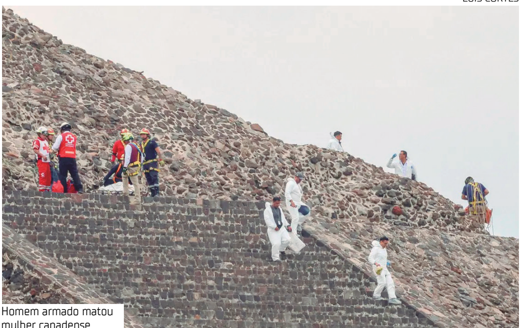
Homem armado matou mulher canadense