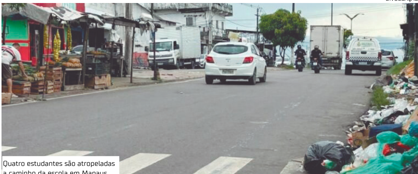
Quatro estudantes são atropeladas a caminho da escola em Manaus

Quatro estudantes foram atropeladas enquanto seguiam para a escola na manhã desta quarta-feira (22), no bairro Santa Etelvina, zona Norte de Manaus. O motorista responsável fugiu do local sem prestar socorro às vítimas.