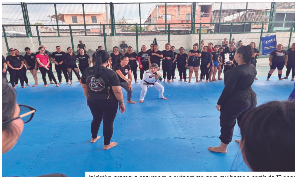
Iniciativa promove segurança e autoestima para mulheres a partir de 12 anos