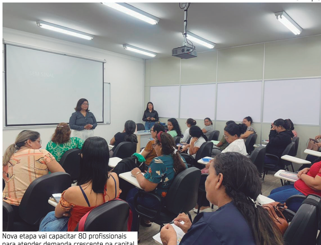
Nova etapa vai capacitar 80 profissionais para atender demanda crescente na capital