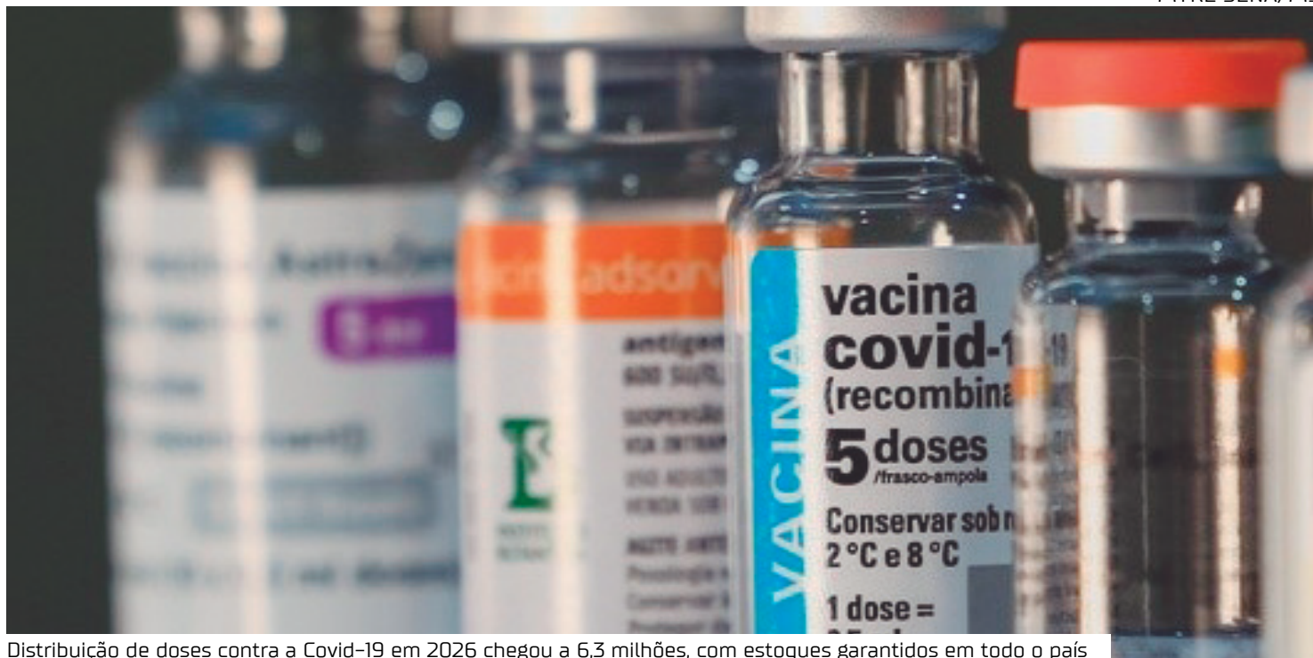
Distribuição de doses contra a Covid-19 em 2026 chegou a 6,3 milhões, com estoques garantidos em todo o país

Entre janeiro e março de 2026, o Ministério da Saúde enviou 4,1 milhões de doses aos estados, com 2 milhões já aplicadas. Na oportuni-