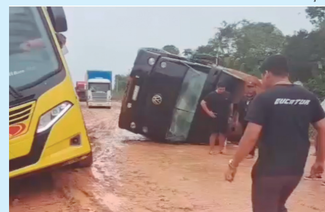
Caminhão tomba na BR-319 e causa congestionamento na rodovia