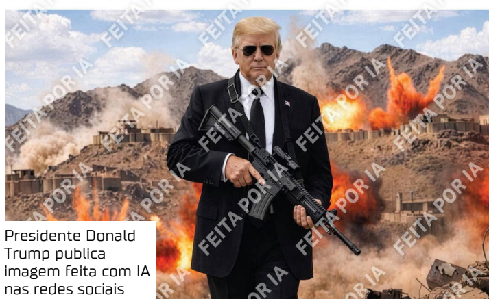
Presidente Donald Trump publica imagem feita com IA nas redes sociais