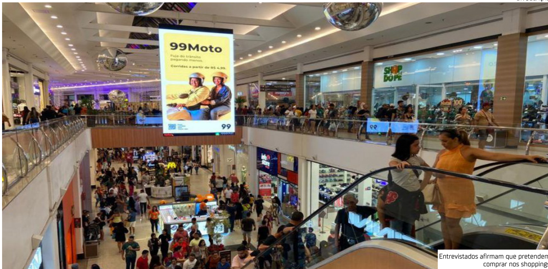
Entrevistados afirmam que pretendem comprar nos shoppings

De acordo com os entrevistados, o principal produto escolhido para presentear é