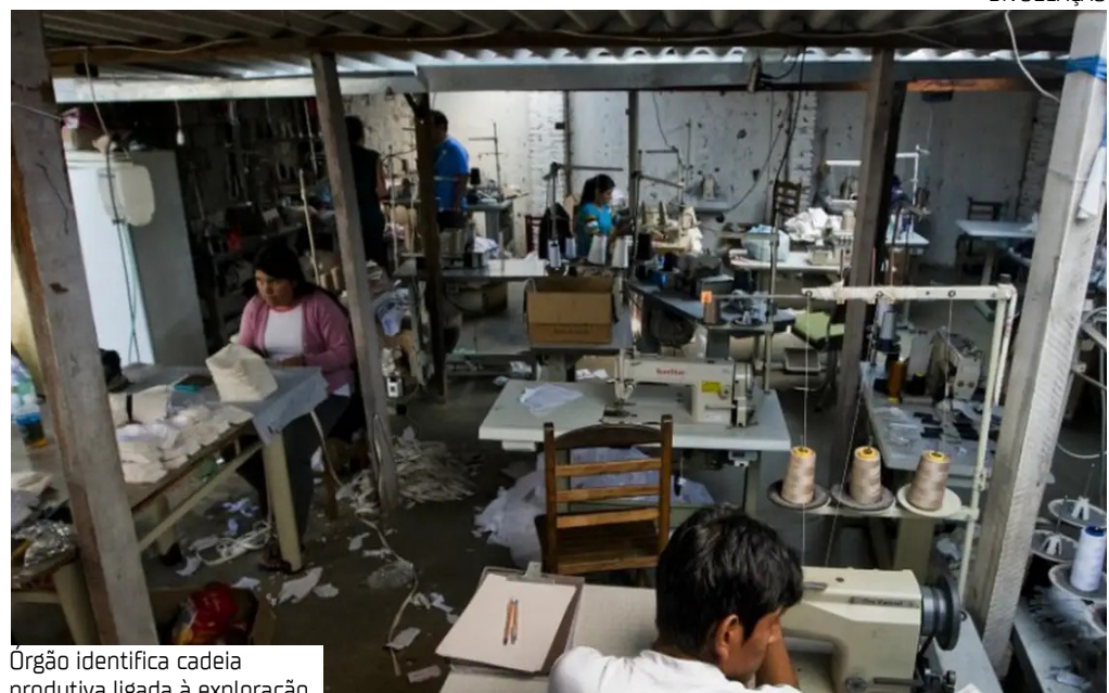
Órgão identifica cadeia produtiva ligada à exploração