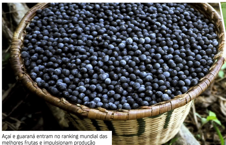
Açaí e guaraná entram no ranking mundial das melhores frutas e impulsionam produção

Além dos municípios atendidos pelo PP do Açaí, foram distribuídas, por meio de uma