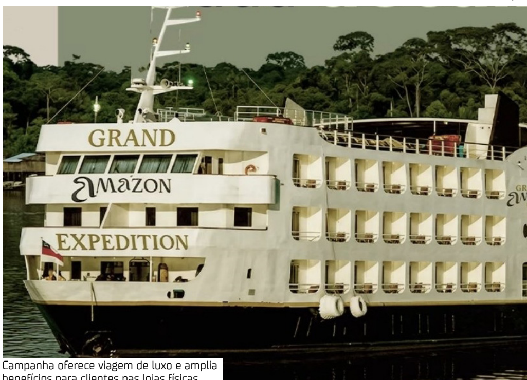
Campanha oferece viagem de luxo e amplia benefícios para clientes nas lojas físicas