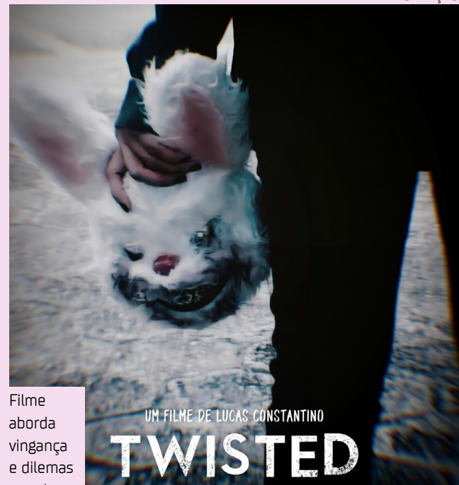
Filme aborda vingança e dilemas morais