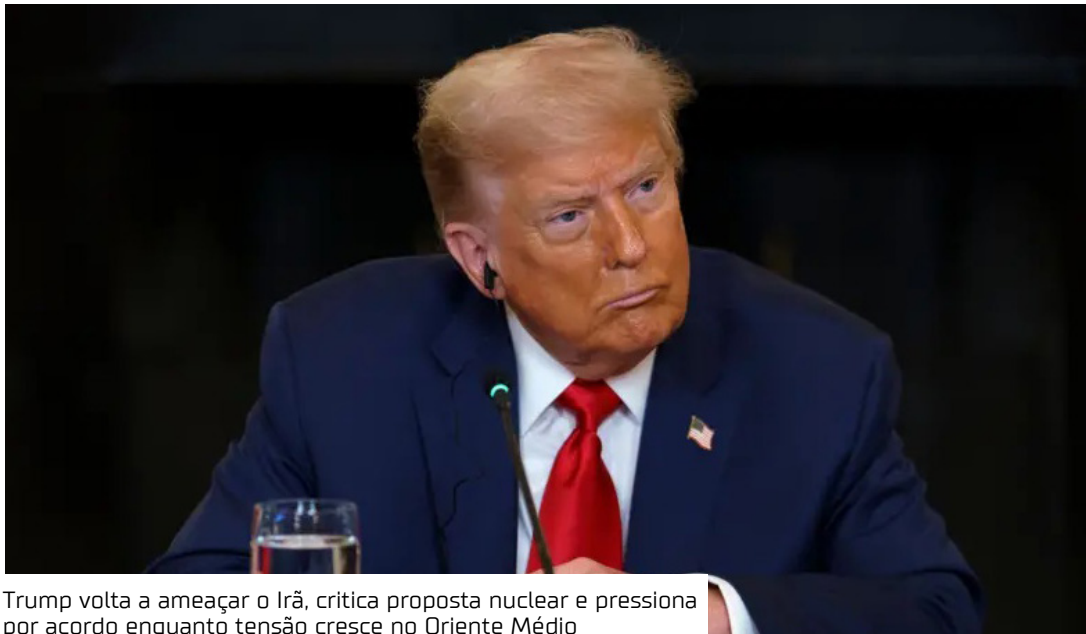
Trump volta a ameaçar o Irã, critica proposta nuclear e pressiona por acordo enquanto tensão cresce no Oriente Médio

O principal entrave permanece na questão nuclear. O Irã busca o reconhecimento do direito de enriquecer urânio, enquanto Trump defende que esse tema seja tratado desde o