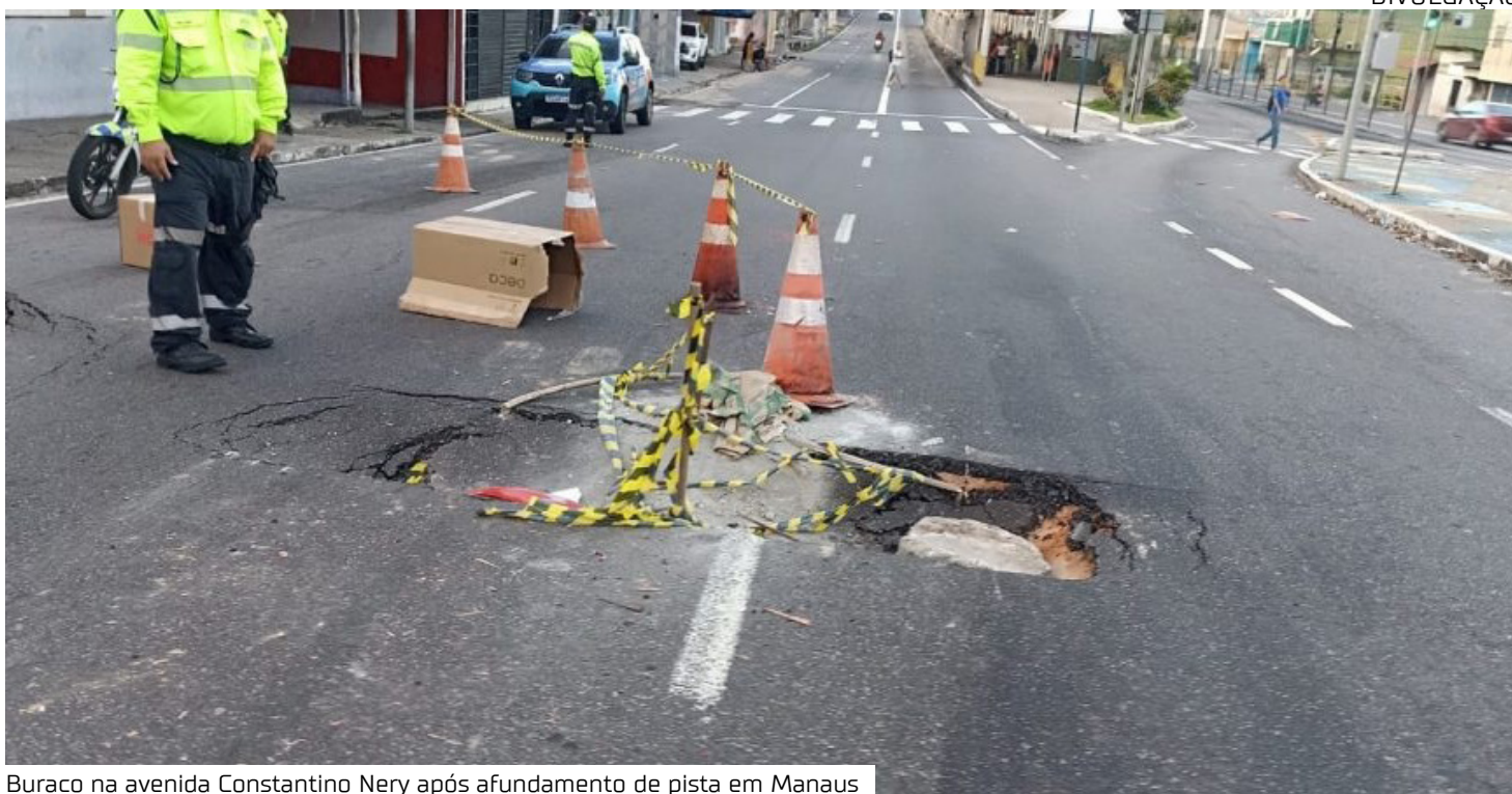
Buraco na avenida Constantino Nery após afundamento de pista em Manaus

Portanto, enquanto a investigação técnica avança, a Ageman cobra explicações