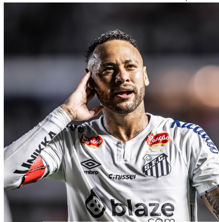
Neymar tem se esforçado para ir a Copa do Mundo 2026