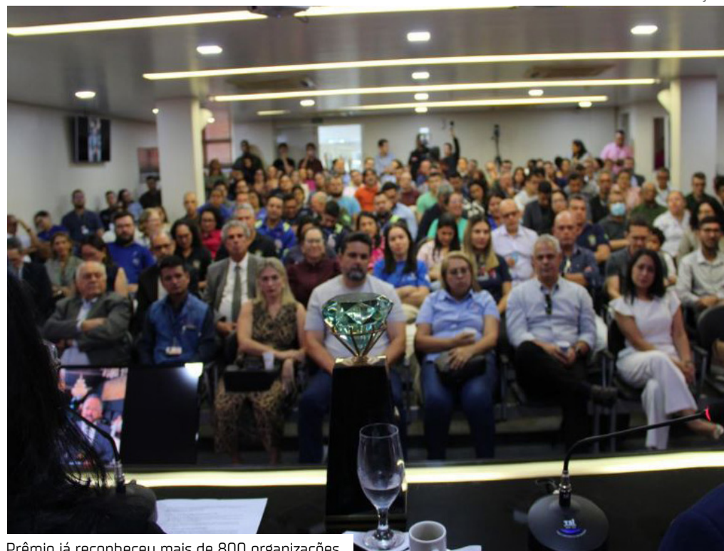
Prêmio já reconheceu mais de 800 organizações