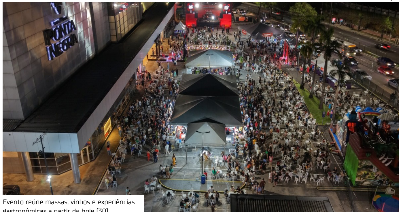
Evento reúne massas, vinhos e experiências gastronômicas a partir de hoje (30)

Massas bem preparadas, vinhos e um ambiente com clima italiano são os destaques do “Vino & Pasta”, que chega a Manaus a partir desta semana. Entre os dias 30 de abril e 3 de maio, o público poderá participar de mais uma edição do “Festival Gastronômico Volta ao Mundo”, que promete reunir o melhor da culinária italiana no Shopping Ponta Negra, na zona Oeste da capital.