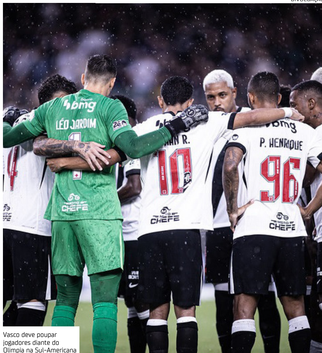
Vasco deve poupar jogadores diante do Olimpia na Sul-Americana

A equipe alvinegra também lidera o Torneio Apertura (primeira divisão do campeonato paraguaio), com quatro pontos de vantagem para o vice-