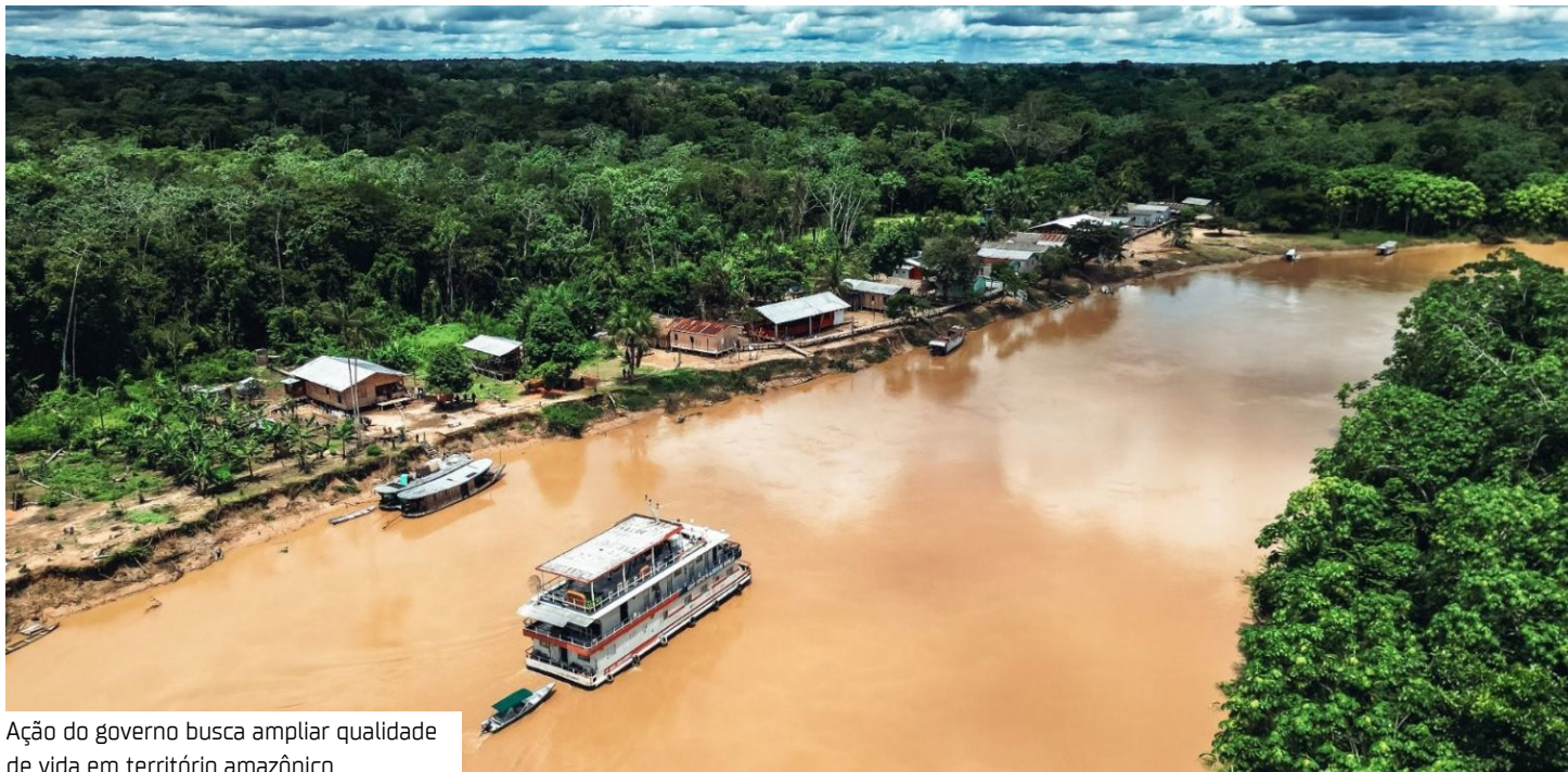
Ação do governo busca ampliar qualidade de vida em território amazônico

Diante disso, a FAS identificou três principais desafios por meio do Acompanhamento Familiar Multidimensional.