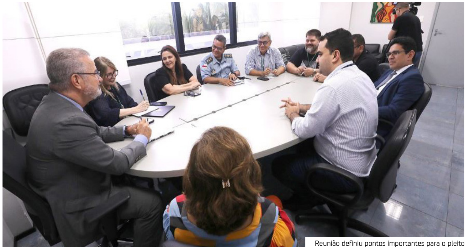
Reunião definiu pontos importantes para o pleito