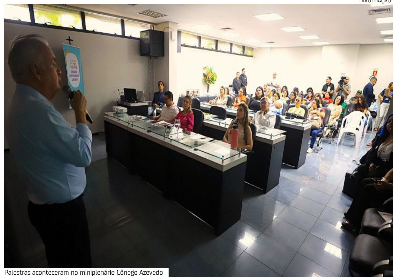
Palestras aconteceram no miniplenário Cônego Azevedo

Com o tema "Conviver para aprender", a Assembleia Legislativa do Amazonas (Aleam), por meio das diretorias de Saúde e de Assistência Social, promove uma programação especial em alusão ao Abril Azul, mês dedicado à conscientização sobre o Transtorno do Espectro Autista (TEA). As atividades, incluindo palestras, ocorreram na terça-feira (7), no miniplenário Cônego Azevedo.