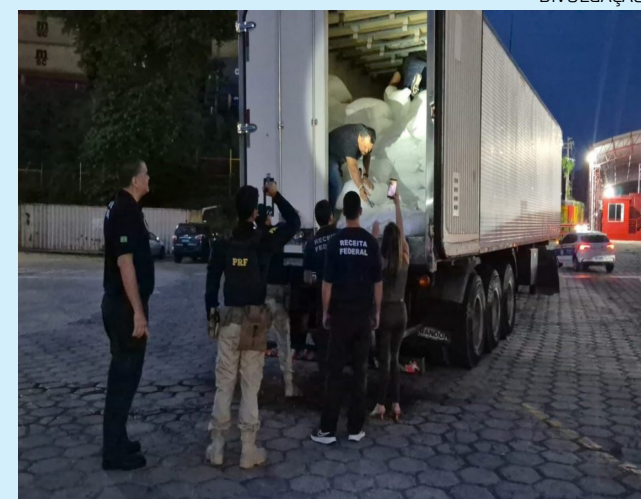
Alerta do Pará leva polícia a apreender 150 kg de skunk