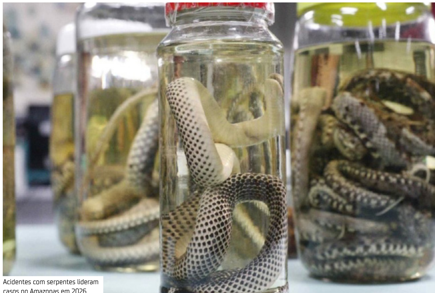
Acidentes com serpentes lideram casos no Amazonas em 2026

- Inspeção periódica em residências e áreas de convívio: Realizar vistorias frequentes em quintais, jardins e ambientes domésticos para identificar e remover possíveis abrigos de animais peçonhentos.