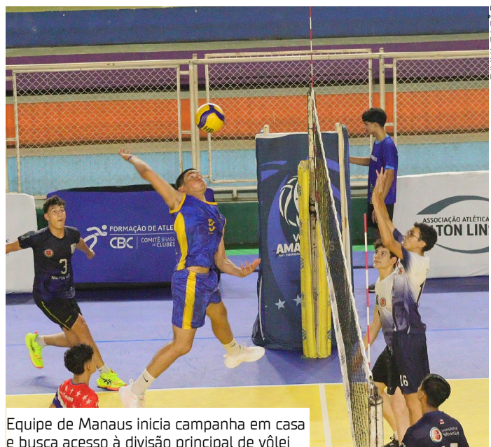
Equipe de Manaus inicia campanha em casa e busca acesso à divisão principal de vôlei

"A gente está bastante preparado, pois já estamos alguns meses treinando para essa competição. A base é a mesma da equipe que disputou no CBI Sub-16 em 2025, em Sergipe. É um grupo com boa base e que