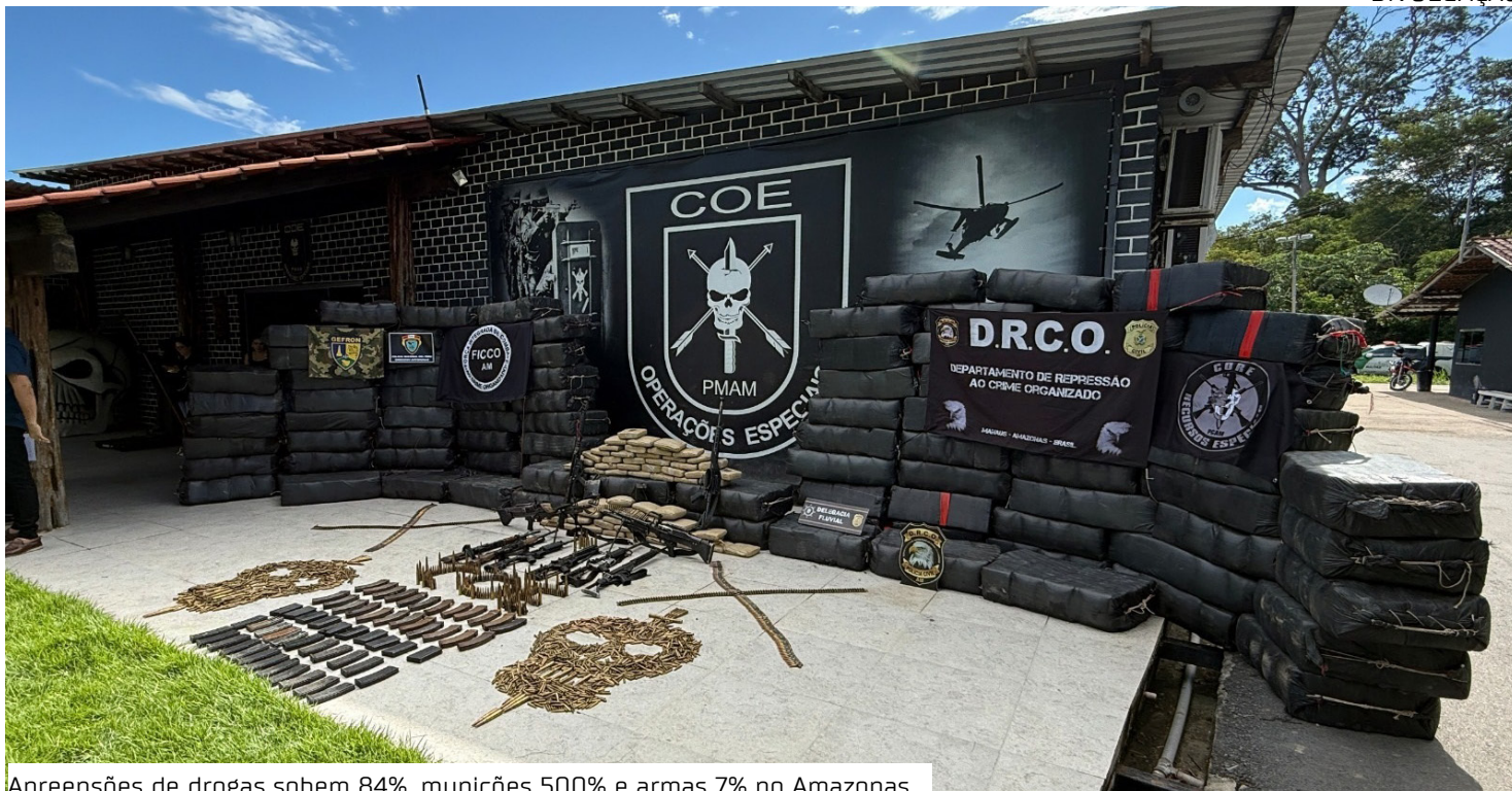
Aprensões de drogas sobem 84%, munições 500% e armas 7% no Amazonas

O comandante-geral da Polícia Militar, coronel Klingner Paiva, destacou que a corporação também tem