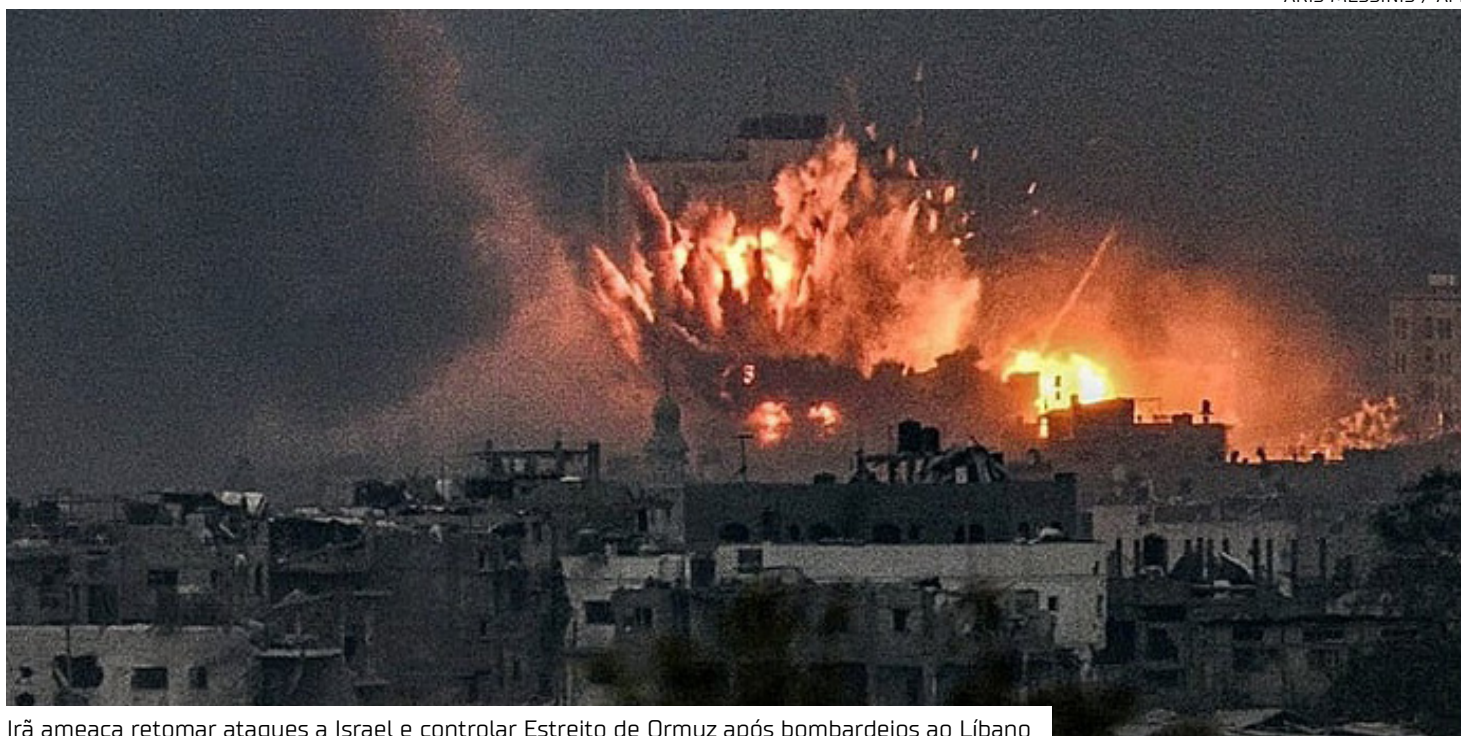
Irã ameaça retomar ataques a Israel e controlar Estreito de Ormuz após bombardeios ao Líbano

O primeiro-ministro Benjamin Netanyahu disse apoiar o acordo entre EUA e Irã, mas destacou que o Líbano ficaria fora do cessar-fogo.