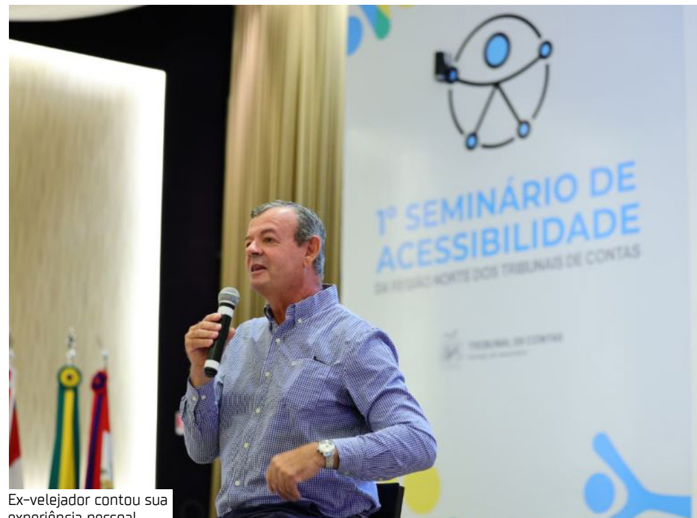
Ex-velejadador contou sua experiência pessoal