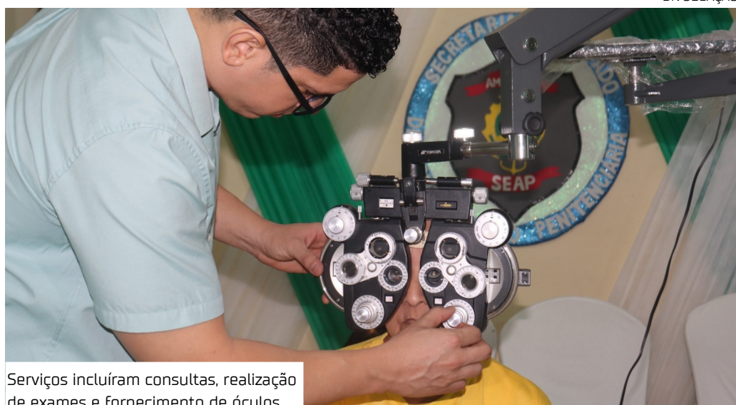
Serviços incluíram consultas, realização de exames e fornecimento de óculos

Durante o mutirão, pessoas privadas de liberdade com demandas oftalmológicas receberam atendimento com consultas especializadas, realização de exames e fornecimento de