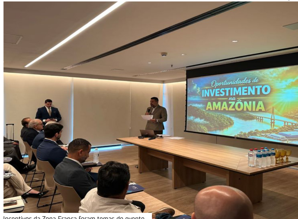
Incentivos da Zona Franca foram temas do evento