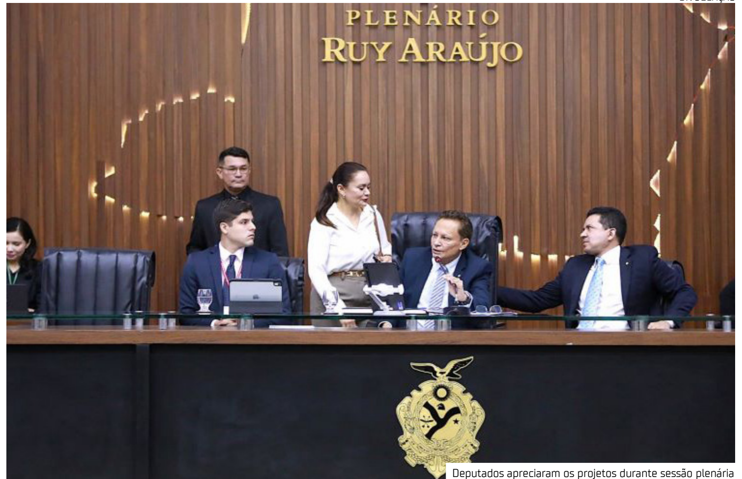
Deputados apreciaram os projetos durante sessão plenária

Também de autoria da parlamentar, o PL nº