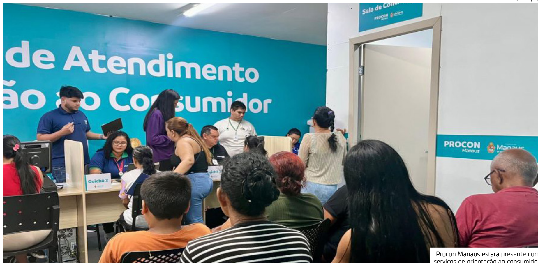
Procon Manaus estará presente com serviços de orientação ao consumidor

Nesta edição, o feirão conta com a presença do Procon Manaus e de algumas empresas adicionais, como Nova Era, APA Móveis, Casas Bahia e Claro.