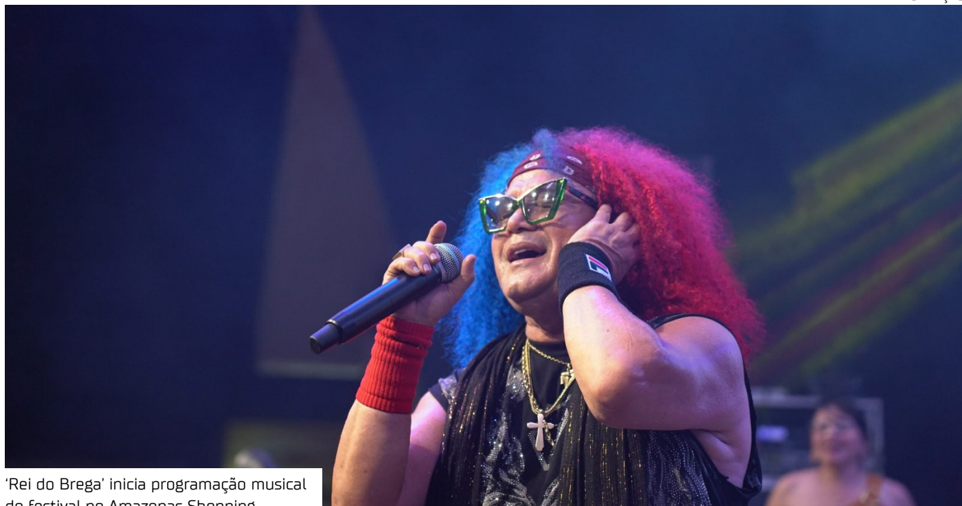
'Rei do Brega' inicia programação musical do festival no Amazonas Shopping

O cantor paraense Wanderley Andrade, conhecido como o "Rei do Brega", abre hoje (9) a programação musical da 5ª edição do Amazonas Food Festival, no Amazonas Shopping. Com mais de 30 anos de carreira e sucessos como "Traficante do Amor" e "Detento Apaixonado", o artista é a primeira atração do evento, que segue até o dia 19 de abril, reunindo shows e opções gastronômicas.