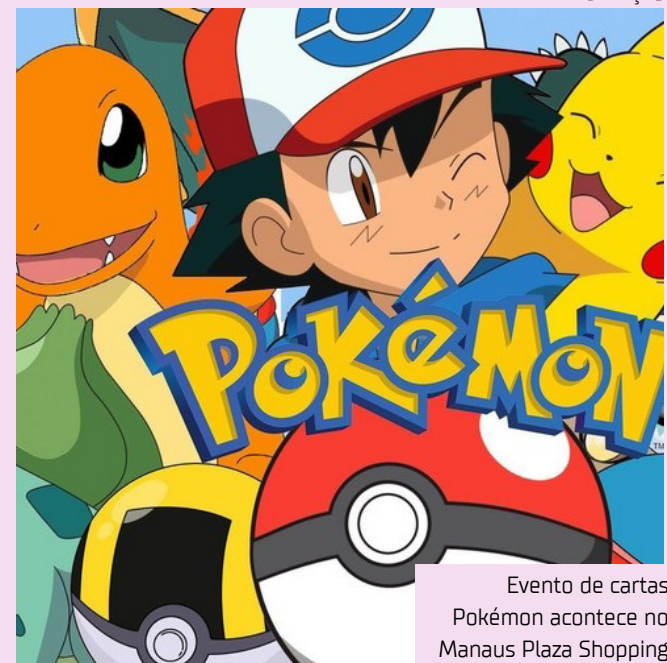
Evento de cartas Pokémon acontece no Manaus Plaza Shopping