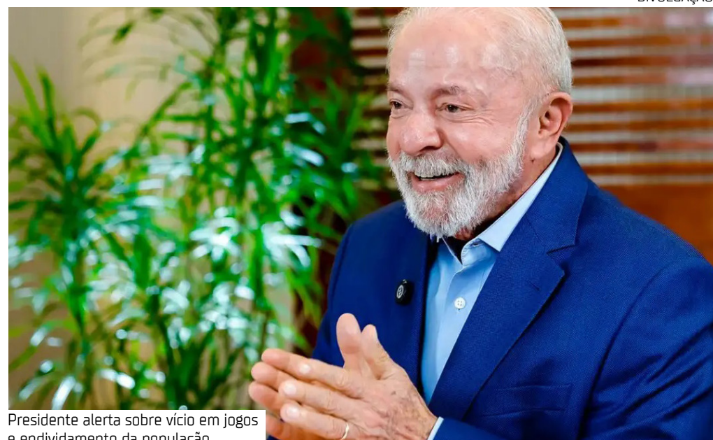
Presidente alerta sobre vício em jogos e endividamento da população